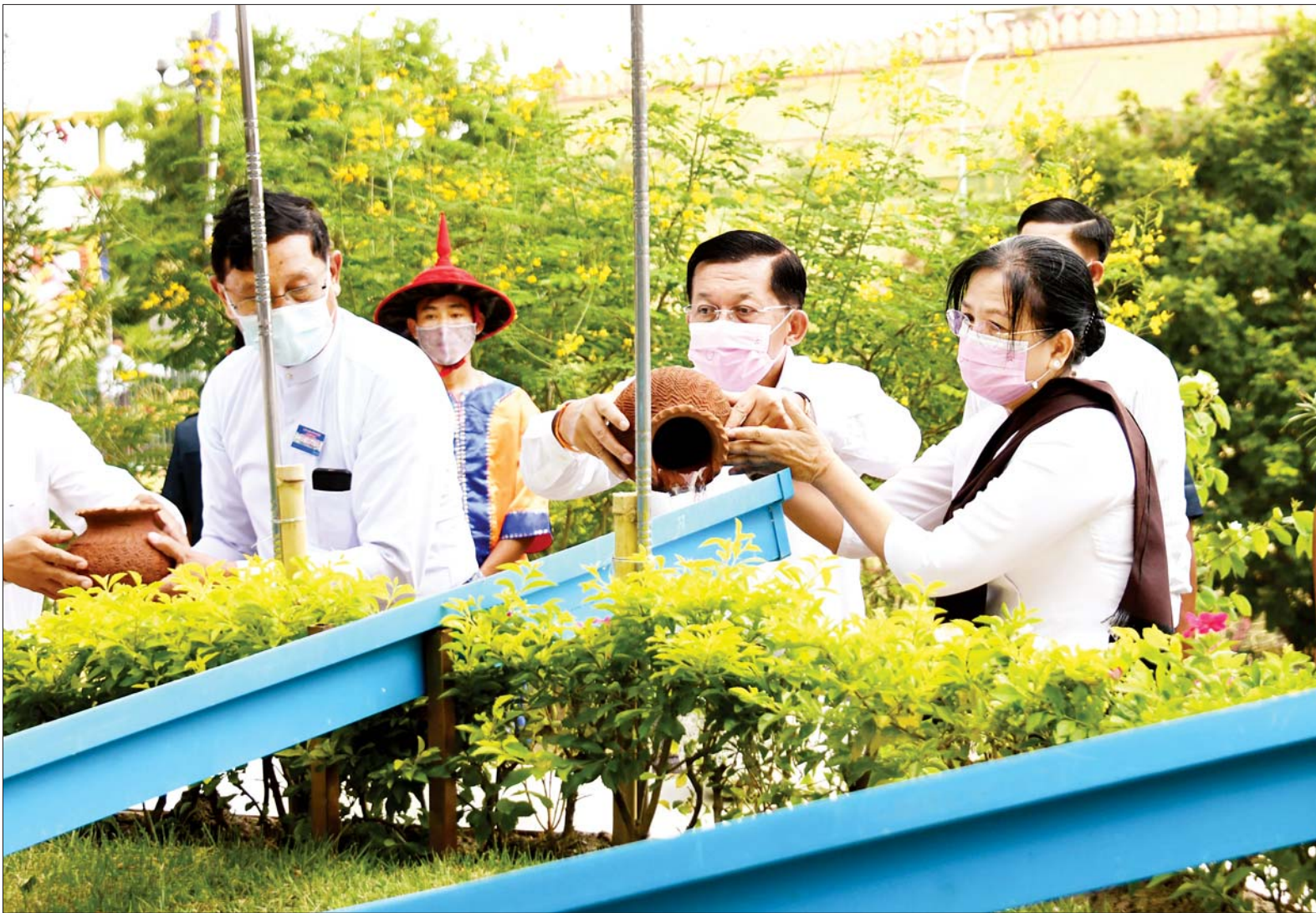
နိုင်ငံတော်စီမံအုပ်ချုပ်ရေးကောင်စီဥက္ကဋ္ဌ၊ တပ်မတော်ကာကွယ်ရေးဦးစီးချုပ် ဗိုလ်ချုပ်မှူးကြီး မင်းအောင်လှိုင်နှင့် ဇနီးဒေါ်ကြူကြူလှ မဟာဗောဓိညောင်ပင်အား ညောင်ရေ သွန်းလောင်းပူဇော်စဉ်။

နေပြည်တော် မေ ၂၅ ဗုဒ္ဓဘာသာ မြန်မာလူမျိုးတို့၏ ၁၂ လရာသီပွဲတော်တွင် တစ်ခု အပါအဝင်ဖြစ်သည့် မြန်မာ သက္ကရာဇ် ၁၃၈၃ ခုနှစ် ကဆုန် လပြည့်(ဗုဒ္ဓနေ့)ဖြစ်သော ယနေ့ တွင်ကျရောက်သည့် ကဆုန် ညောင်ရေသွန်း ပွဲတော်တွင် နေပြည်တော် ဥပဒေရေးရာဌာန တော်မြတ်ကြီး ပရိဝုဇ်တော် မြောက်ဘက်အရပ်ရှိ မဟာဗောဓိ ညောင်ပင်တော်များအား (၁၃) ကြိမ်မြောက် ကဆုန်ညောင်ရေ သွန်းလောင်းပူဇော်ခြင်း မဟာ မင်္ဂလာအခမ်းအနားကို ယနေ့ ညနေပိုင်းတွင် ကျင်းပရာ နိုင်ငံတော် စီမံအုပ်ချုပ်ရေးကောင်စီ ဥက္ကဋ္ဌ၊ တပ်မတော်ကာကွယ်ရေးဦးစီးချုပ် ဗိုလ်ချုပ်မှူးကြီး မင်းအောင်လှိုင် နှင့်ဇနီး ဒေါ်ကြူကြူလှတို့က မဟာဗောဓိ ညောင်ပင်များကို ညောင်ရေသွန်းလောင်း ပူဇော်ကြ သည်။ အခမ်းအနားသို့ နိုင်ငံတော်စီမံ အုပ်ချုပ်ရေးကောင်စီ ဒုတိယ ဥက္ကဋ္ဌ ဒုတိယတပ်မတော် ကာကွယ်ရေးဦးစီးချုပ် ကာကွယ် ရေးဦးစီးချုပ်(ကြည်း) ဒုတိယ ဗိုလ်ချုပ်မှူးကြီး စိုးဝင်းနှင့်ဇနီး ဒေါ်သန်းသန်းနွယ်၊ ကောင်စီအဖွဲ့ဝင် များနှင့်ဇနီးများ၊ အတွင်းရေးမှူးနှင့် ဇနီး၊ စာမျက်နှာ ၃ ကော်လံ ၁ သို့ ။