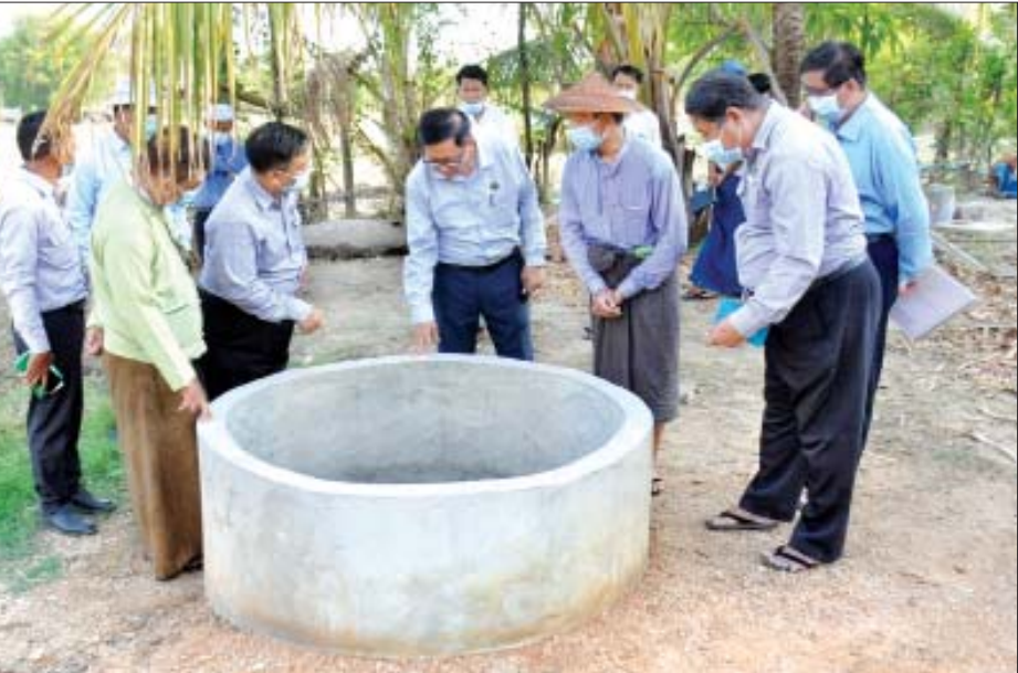
မြိုင်မြို့နယ် လယ်စုညောင်ပင်ကျေးရွာရှိ တူးဖော်ထားသော ရေတွင်းကို ကြည့်ရှုစစ်ဆေးစဉ်။

ဒီရေပေးမြောင်းကြောင့် ကျွန်တော်တို့စိုက်တဲ့သီးနှံတွေ အောင်ရေရတယ်။ ဒီကုန်ထုတ်လမ်းကြောင့် ကျွန်တော်တို့ ရွာသားတွေ သွားရေးလာရေး လွယ်ကူတယ်။ ကျွန်တော်တို့ကလေးတွေ ကျောင်းသွားရတာ အဆင်ပြေတယ်။ အန္တရာယ်ကင်း တယ်။ ဒါကြောင့် စောစောက ဒီကဆရာကြီးပြောသလို နိုင်ငံတော်က ဒီလောက် အကုန်အကျခံပြီး ဖောက်လုပ်ပေးခဲ့တဲ့လမ်းကို ကျွန်တော်တို့ ရွာသားတွေက ပိုင်းပြီးထိန်းကြမှာပါ။ လမ်းမပျက်ဖို့၊ ရေရှည်ခံဖို့က ကျွန်တော်တို့တာဝန်ပါ။