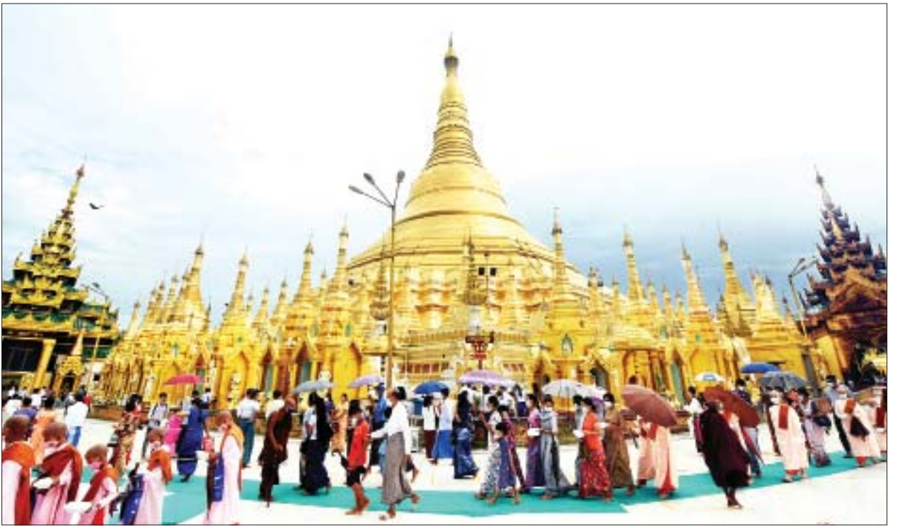
ကဆုန်လပြည့်(ဗုဒ္ဓနေ့)၌ ရွှေတိဂုံစေတီတော်မြတ်ကြီးတွင် ဘုရားဖူးလာပြည်သူများဖြင့် စည်ကားလျက်ရှိသည်ကို တွေ့ရစဉ်။

ယင်းနောက် ရွှေတိဂုံစေတီတော် ဘဏ္ဍာတော်ထိန်းဂေါပကအဖွဲ့၏ ဩဝါဒါစရိယ ဆရာတော်ကြီးများကိုယ်စား ဗဟန်းမြို့နယ် ညောင်တုန်း