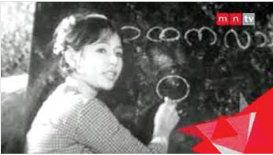
ဘယ်သူပြိုင်လို့လှပါတော့နိုင် ဇာတ်ကားမှ ဇာတ်ဝင်ခန်း။

ကျော်ဟိန်းအပါအဝင် ထိုခေတ်အနုပညာရှင်များသည် ကျွန်တော်တို့ကို ထိုစဉ်က နိုင်ငံတော်၏ တစ်ခုတည်းသော ဦးဆောင်ပါတီဖြစ်သည့် မြန်မာ့ဆိုရှယ်လစ်လမ်းစဉ်ပါတီအပေါ် မည်သို့သဘောထားကြရမည်ဟု သူတို့၏ ကိုယ်ပိုင်သဘောထားခံယူချက်များကို တစ်ခါမျှ ပြောသံမကြားခဲ့ရပါ။