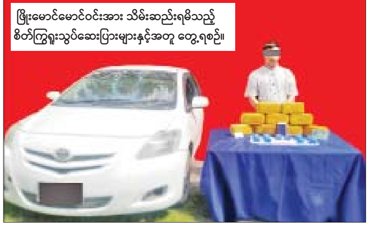
ဖြိုးမောင်မောင်ဝင်းအား သိမ်းဆည်းရမိသည့် စိတ်ကြွေးသွပ်ဆေးပြားများနှင့်အတူ တွေ့ရစဉ်။