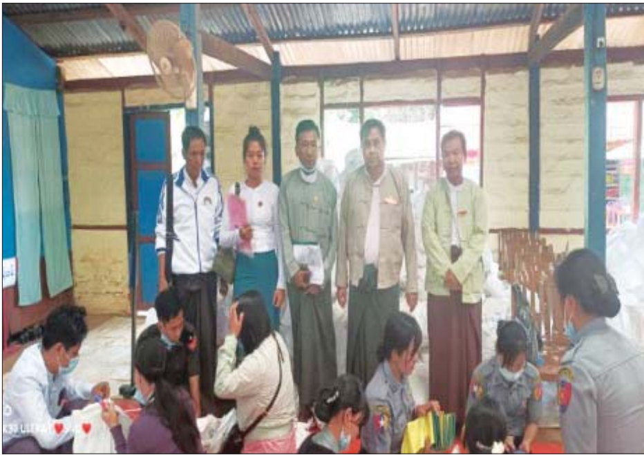
မိုင်းရယ်မြို့နယ် ဆန္ဒမဲလက်မှတ် မြေပြင်စစ်ဆေးမှု မှတ်တမ်းဓာတ်ပုံ။

❖ မဲဆန္ဒရှင်စာရင်းစစ်ဆေးချက်များအရ ရှမ်းပြည်နယ်အတွင်းရှိ အဆိုပါ မြို့နယ် ၇ မြို့နယ်တွင် ယခင် ရွေးကောက်ပွဲကော်မရှင်က ထုတ်ပြန်ခဲ့သည့် မဲဆန္ဒရှင်စာရင်းမှာ ၅၉၁၈၇၀ ဦး၊ အလုပ်သမား၊ လူဝင်မှုကြီးကြပ်ရေးနှင့် ပြည်သူ့အင်အားဝန်ကြီးဌာန၏ ၂၀၂၀ ပြည့်နှစ်၊ နိုဝင်ဘာလစာရင်းအရ အသက် ၁၈ နှစ်ပြည့်ပြီး ဆန္ဒမဲပေးပိုင်ခွင့်ရှိသူများမှာ ၄၈၈၀၅၇ ဦး ဖြစ်သည်။ မဲဆန္ဒရှင်စာရင်းများတွင် နိုင်ငံသား၊ ဧည့်နိုင်ငံသား၊ နိုင်ငံသားပြုခွင့်ရသူ၊ လက်မှတ်မရှိသူများမှာ ၁၃၀၅၃၀ ဦး၊ နိုင်ငံသား စိစစ်ရေးကတ်ပြားအမှတ် တစ်ခုတည်းဖြင့် မဲစာရင်းတွင် ၃ ကြိမ်နှင့်အထက် ပါဝင်နေသူများမှာ ၄၈၉၆ ဦး၊ ၂ ကြိမ် ပါဝင်နေသူများမှာ ၅၃၉၁၄ ဦး ဖြစ်