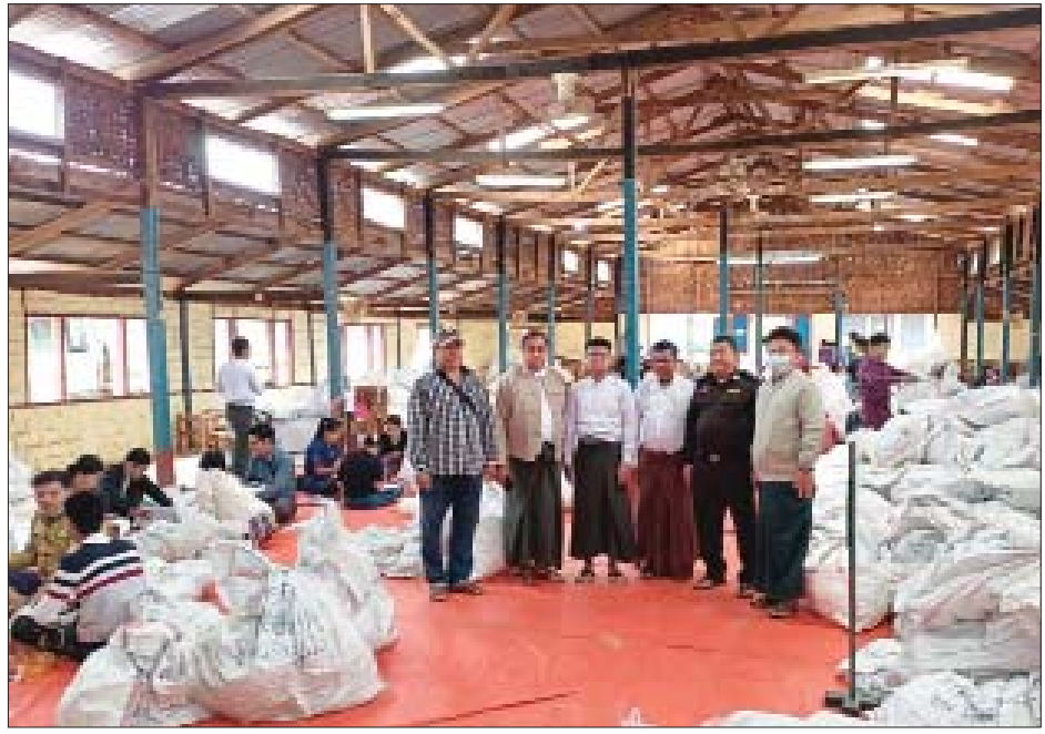
မူဆယ်မြို့နယ် ဆန္ဒမဲလက်မှတ် မြေပြင်စစ်ဆေးမှု မှတ်တမ်းဓာတ်ပုံ။