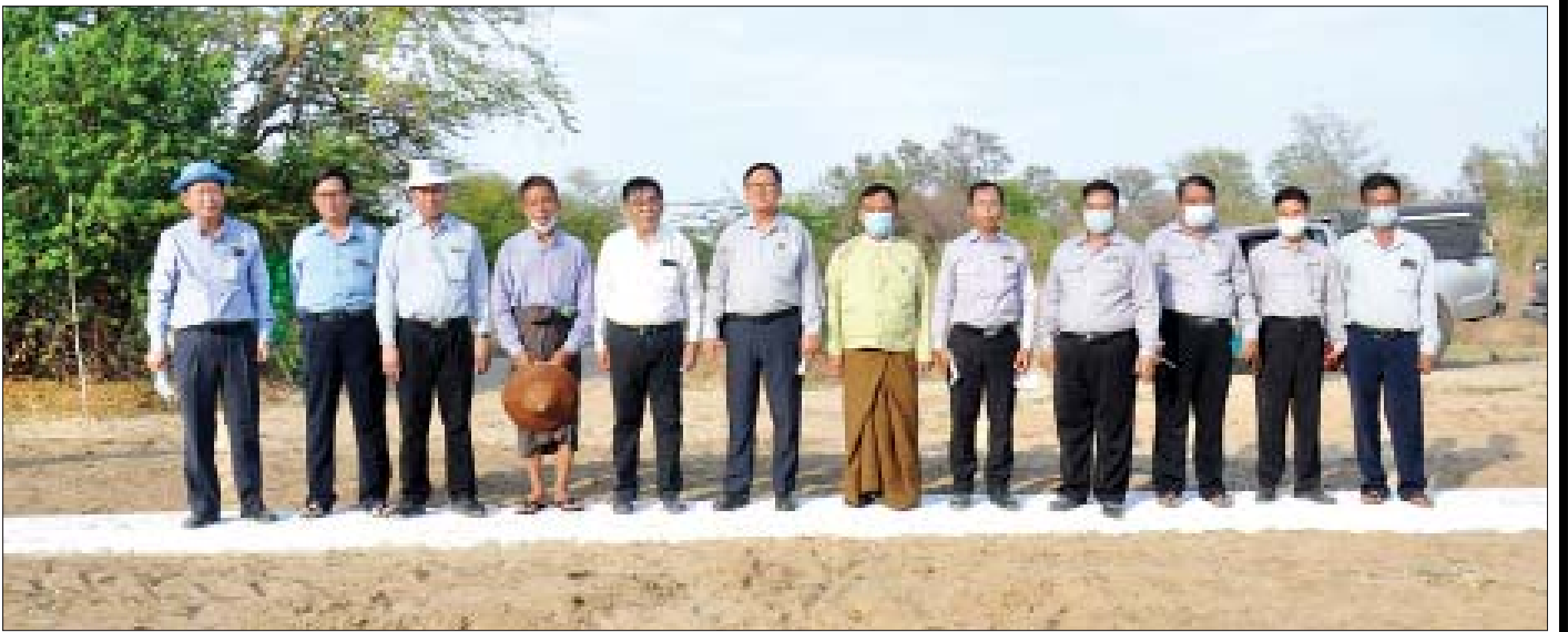
စိုက်ပျိုးရေး၊ မွေးမြူရေးနှင့် ဆည်မြောင်းဝန်ကြီးဌာန ဒုတိယဝန်ကြီး ဒေါက်တာအောင်ကြီး (စာရေးသူ) နှင့်အဖွဲ့ မြိုင်မြို့နယ် လယ်စုညောင်ပင်ကျေးရွာရှိ ကျေးလက်ဒေသဖွံ့ဖြိုးတိုးတက်ရေးဦးစီးဌာနမှ တာဝန်ယူတည်ဆောက်ထားသော မြေအောက်တံခေါင်းပေါ်၌ မှတ်တမ်းတင်ဓာတ်ပုံရိုက်စဉ်။

ညောင်ဦးမြို့နယ် လက်ပံခြေပေါ် မြစ်ရေတင် လုပ်ငန်းကို ကြည့်ရှုခဲ့သည်။ ညောင်ဦးမြို့နယ်၌ လွန်ခဲ့သည့် ၁၀ နှစ်က ပျမ်းမျှမိုးရေချိန် ၂၆ လက်မ ရွာသွန်းခဲ့သည်။ ပြီးခဲ့သည့် နှစ်နှစ်၊ သုံးနှစ်ခန့်မှစ၍ မိုးရေချိန် သိသိသာသာ လျော့နည်းလာသည်။ ရာသီဥတုပြောင်းလဲမှုကြောင့် စိုက်ပျိုးသီးနှံများ အောင်ရေရရှိရေးအတွက် ရေလိုအပ်ချက် များပြား လာသည်။