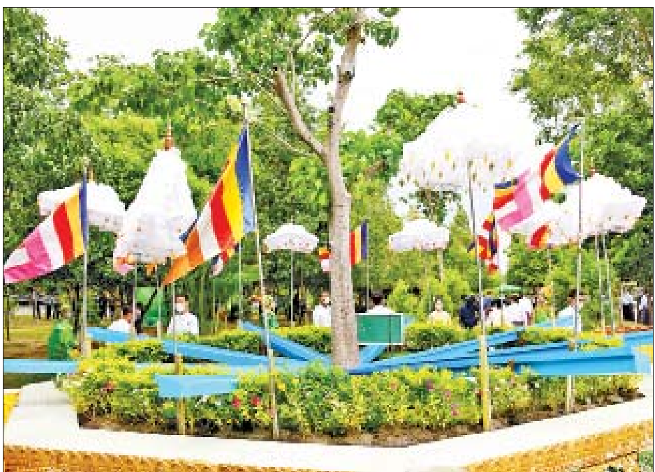
ဥပ္ပါတသန္တိစေတီတော်မြတ်ကြီး ပရိဝုဏ်တော် မြောက်ဘက်အရပ်ရှိ မဟာဗောဓိညောင်ပင်တော်များအား (၁၃)ကြိမ်မြောက် ကဆုန်ညောင်ရေသွန်းလောင်းပူဇော်ခြင်း မဟာမင်္ဂလာအခမ်းအနား ကျင်းပစဉ်။