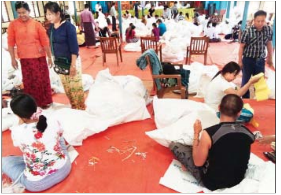
ကွတ်ခိုင်မြို့နယ် ဆန္ဒမဲလက်မှတ် မြေပြင်စစ်ဆေးမှု မှတ်တမ်းဓာတ်ပုံ။