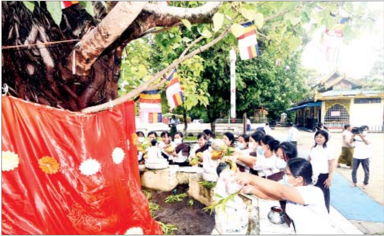
လောကချမ်းသာ အဘယလာဘမုနိ(ကျောက်တော်ကြီးဘုရား)၏ မဟာဗောဓိညောင်ပင်၌ ရန်ကုန်မြောက်ပိုင်းခရိုင် အထွေထွေအုပ်ချုပ်ရေး ဦးစီးဌာန ဝန်ထမ်းမိသားစုများက ကဆုန်ညောင်ရေ သွန်းလောင်းပူဇော်ကြစဉ်။

သတင်း-ကိုကိုဇော်၊ ကျော်စိုးဝင်း၊ ဓာတ်ပုံ-ဇော်ဇော်လတ်