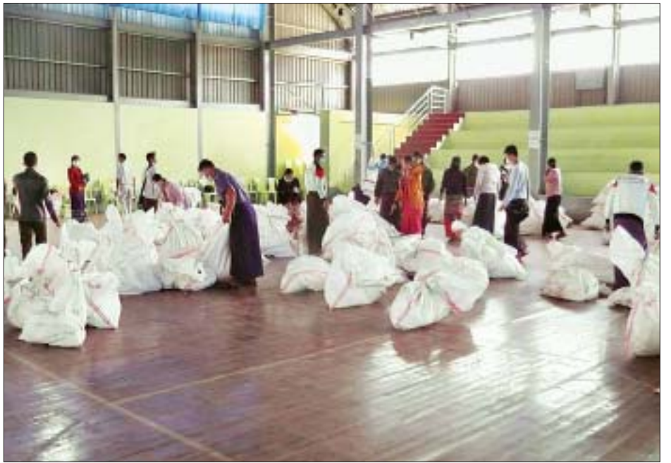
ဆီဆိုင်မြို့နယ် ဆန္ဒမဲလက်မှတ် မြေပြင်စစ်ဆေးမှု မှတ်တမ်းဓာတ်ပုံ။