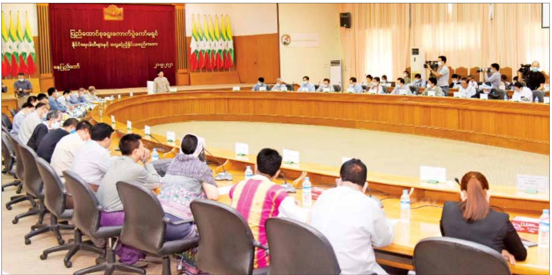
ပြည်ထောင်စုရွေးကောက်ပွဲကော်မရှင်နှင့် နိုင်ငံရေးပါတီများ တွေ့ဆုံညှိနှိုင်းအစည်းအဝေး ကျင်းပစဉ်။

ရွေးကောက်ပွဲမသမာမှုများ၊ ဥပဒေမဲ့ဆောင်ရွက်ခဲ့မှုများ၊ အထောက်အထားများကို မိမိတို့ကော်မရှင်ထံသို့ ရေးသားပေးပို့ကြစေလို