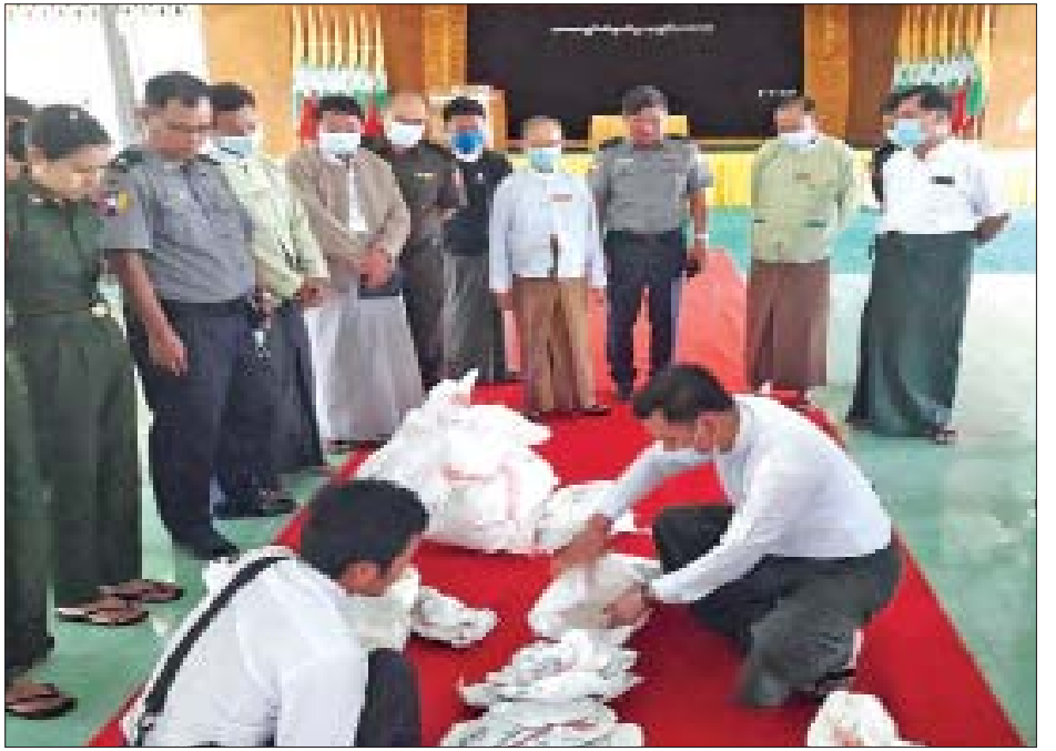
ကလေးဝမြို့နယ် ဆန္ဒမဲလက်မှတ် မြေပြင်စစ်ဆေးမှု မှတ်တမ်းဓာတ်ပုံ။