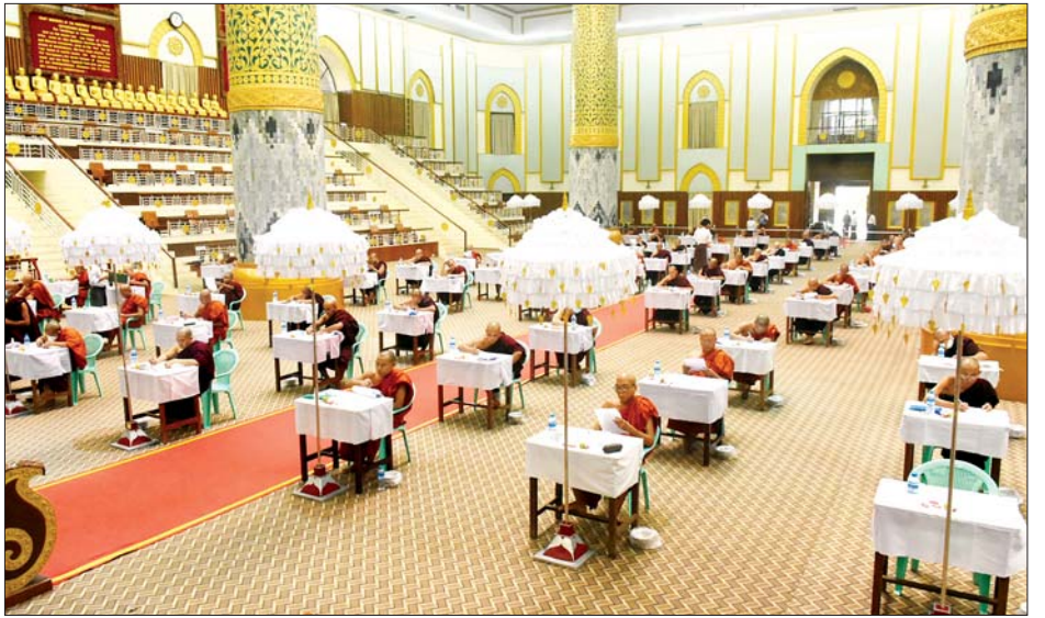
တိပိဋက ကောဝိဒရွေးချယ်ရေး(သဘောရေးဖြေ) စာမေးပွဲကြီးကို ရန်ကုန်မြို့ သီရိမင်္ဂလာ ကမ္ဘာအေး ကုန်းမြေ မဟာပါသာဏလိုဏ်ဂူသိမ်တော်ကြီး၌ မေ ၁၇ ရက်မှ ၂၁ ရက်အထိ ငါးရက်တိုင်တိုင် ကျင်းပ ခဲ့ရာ ယနေ့သည် စာမေးပွဲနောက်ဆုံးရက် ဖြစ်ကြောင်း သိရသည်။ သတင်းစဉ်