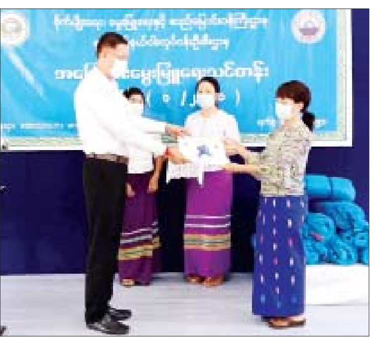
စခန်းမှသင်တန်းနည်းပြ ဆရာ ဆရာမ သင်တန်းသူ စုစုပေါင်း ၅၀ တက်ရောက် များ၊ ရှမ်းပြည်နယ် ငါးလုပ်ငန်းဦးစီး ခဲ့ပြီး သင်တန်းကာလမှာ နှစ်ရက် ဌာနမှ ဝန်ထမ်းများ၊ သင်တန်းသား ဖြစ်ကြောင်း သိရသည်။ သတင်းစဉ်

တောင်ကြီး မေ ၂၀ ရှမ်းပြည်နယ် ငါးလုပ်ငန်းဦးစီးဌာန၏ ကြီးကြပ်မှုဖြင့် တောင်ကြီးမြို့၊ ပြည်နယ် ငါးလုပ်ငန်းဦးစီးဌာနမှူးရုံး၌ အခြေခံ ငါးမွေးမြူရေးသင်တန်း အမှတ်စဉ် (၁/၂၀၂၁)ဆင်းပွဲ အခမ်းအနားကို ယနေ့ တွင် ကျင်းပသည်။ အဆိုပါ အခမ်းအနားသို့ ရှမ်းပြည်နယ် စီမံအုပ်ချုပ်ရေးကောင်စီအဖွဲ့ဝင် (၃) ဦးစိုင်းလိတ် တက်ရောက်၍ သင်တန်း ဆင်း အမှာစကားပြောကြားသည်။ ထို့နောက် ဦးစိုင်းလိတ်နှင့် ပြည်နယ် ငါးလုပ်ငန်းဦးစီးမှူး ဦးလွမ်းမိုးဇော်တို့က သင်တန်းဆင်း လက်မှတ်များနှင့် တစ်ပိုင်တစ်နိုင် ငါးမွေးမြူရေးလုပ်ငန်း များ ဖွံ့ဖြိုးတိုးတက်စေရန်အတွက် သင်တန်းသူ သင်တန်းသားများအား ဇာပြာလှောင်အိမ်များ ပေးအပ်သည်။ သင်တန်းဆင်းပွဲသို့ ပြည်နယ်အဆင့် ဌာနဆိုင်ရာများ၊ ညောင်ရွှေငါးလုပ်ငန်း