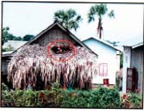
လူစုကုသရန်နှင့် အဆောက်အဦများအား အစွန့်ခွာရောက်အမျိုးမျိုးမှ ဝှံ့ပွဲမျက်ဆီးခြင်း