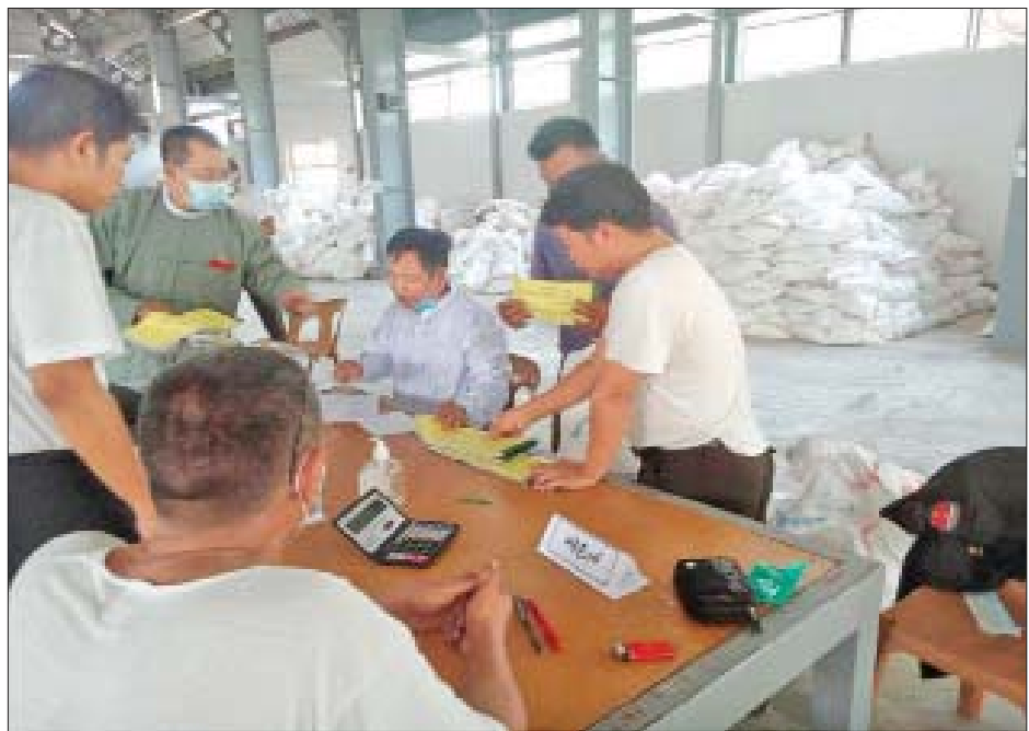
ခင်ဦးမြို့နယ် ဆန္ဒမဲလက်မှတ် မြေပြင်စစ်ဆေးမှု မှတ်တမ်းဓာတ်ပုံ။

၉။ ဒီပဲယင်းမြို့နယ် ညောင်လှကျေးရွာအုပ်စု မဲရုံအမှတ်(၁)တွင် ကြိုတင်မဲအတွက် ဆန္ဒမဲလက်မှတ်များ အား သီးသန့် အသုံးပြုထားခြင်းမရှိဘဲ ကျန်သည့်မဲရုံများအတွက်ပါ ရောနှောအသုံးပြုထားသည့် မဲလက်မှတ် စာအုပ် ၁၈ အုပ် (စောင်ရေ ၉၀၀)အား စိစစ်တွေ့ရှိရပါသည်။ မဲရုံမှူးများ လိုက်နာရမည့် သက်ဆိုင်ရာ လွှတ်တော်ရွေးကောက်ပွဲနည်းဥပဒေ ၆၆(ဇ)ကို လိုက်နာခြင်းမရှိဘဲ အေးသာယာ၊ ဆယ်တော၊ မင်းဆွေနှစ်နှင့် သပိတ်လဲကျေးရွာအုပ်စုတို့မှ ရွေးကောက်ပွဲကျင်းပပြီး နောက်ပိုင်း ပြန်လည်အပ်နှံထားသော မဲလက်မှတ် စာအုပ် ၉ အုပ်(စောင်ရေ ၄၅၀) အား စိစစ်တွေ့ရှိရပါသည်။