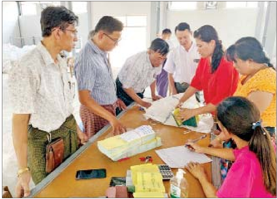
ဒီပဲယင်းမြို့နယ် ဆန္ဒမဲလက်မှတ် မြေပြင်စစ်ဆေးမှု မှတ်တမ်းဓာတ်ပုံ။