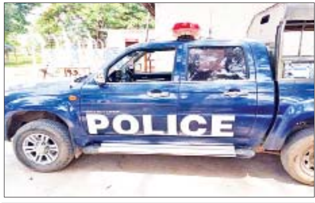
ဒီးမော့ဆိုမြို့နယ်၌ လုံခြုံရေးတပ်ဖွဲ့ဝင်များနှင့် လက်နက်ကိုင် အကြမ်းဖက်သူများ (စိစစ်ဆဲ)အဖွဲ့တို့ ထိတွေ့မှုဖြစ်ပွား၍ မော်တော်ယာဉ်များပျက်စီးမှု မှတ်တမ်းဓာတ်ပုံ။

ထိုသို့ ဆောင်ရွက်လျက်ရှိရာ ယနေ့နံနက် ၉ နာရီ ၁၀ မိနစ်ခန့်တွင် ကယားပြည်နယ် ဒီးမော့ဆိုမြို့နယ်အတွင်း၌ လုံခြုံရေးတပ်ဖွဲ့ဝင်များ ပါဝင်သော ပူးပေါင်းအဖွဲ့သည် ရပ်ရွာအေးချမ်းသာယာရေးနှင့် တရားဥပဒေ စိုးမိုးရေးအတွက် လှည့်ကင်း ဆောင်ရွက်နေစဉ် ဒီးမော့ဆိုမြို့နယ် ဒီးမော့ဆိုကျေးရွာအုပ်စု မားနာပလော့ကျေးရွာအတွက်သို့ အရောက်၌ လမ်း၏ ဝဲ/ယာတိုမှ လက်နက်ကိုင်အကြမ်းဖက်သူအင်အား ၂၀ ခန့်က လက်နက်ငယ်များ၊ တူးမီးသေနတ်များ၊ လက်လုပ်ဗုံး၊ လက်ပစ်ဗုံးများဖြင့် ဝိုင်းဝန်းပိတ်ဆို့ အကြမ်းဖက်တိုက်ခိုက်ခဲ့သဖြင့် ထိတွေ့မှုဖြစ်ပွားခဲ့ပြီး လုံခြုံရေးတပ်ဖွဲ့ဝင်များက ပြန်လည်ခုခံပစ်ခတ်ခဲ့ရာ နာရီခွဲခန့်တွင် လက်နက်ကိုင်အကြမ်းဖက်သူများမှာ ပြန်လည်ဆုတ်ခွာထွက်ပြေး သွားခဲ့သည်။ အထက်ပါ ထိတွေ့မှုဖြစ်စဉ်အတွင်း လုံခြုံရေးတပ်ဖွဲ့ဝင်