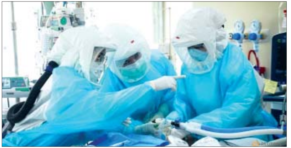
စစ်ဆေးတွေ့ရှိပြီး အဆိုပါရောဂါကြောင့် ၃၂ ဦး ထပ်မံ သေဆုံးခဲ့သည်။ လက်ရှိအချိန်အထိ ထိုင်းရပ်စ်ကူးစက် ခံရသူပေါင်း ၂၁၇၀၆၆ ဦးရှိပြီး သေဆုံးသူပေါင်း ၇၃၅ ဦးရှိသည်။

ထိုင်းနိုင်ငံ၌ လွန်ခဲ့သော ၂၄ နာရီအတွင်း ကိုဗစ်-၁၉ ရောဂါကူးစက်ခံရသူ ၃၄၈၁ ဦးထပ်မံ