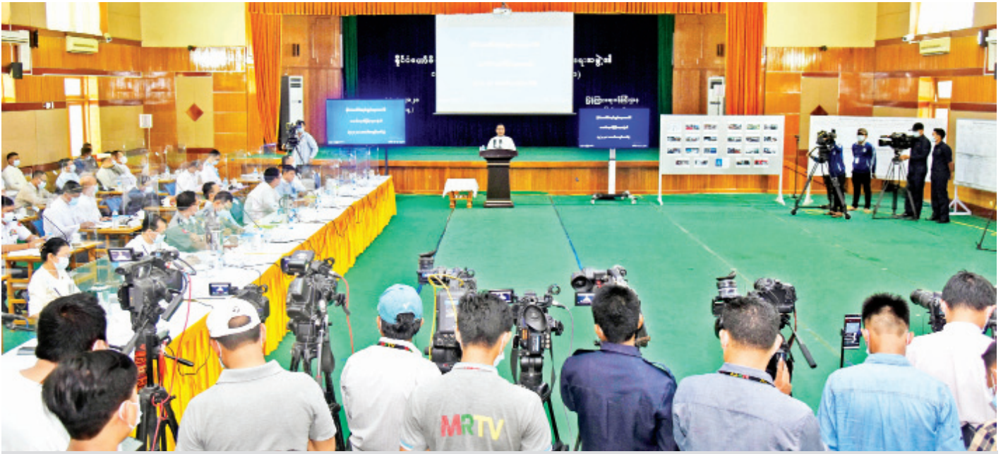
နိုင်ငံတော်စီမံအုပ်ချုပ်ရေးကောင်စီ သတင်းထုတ်ပြန်ရေးအဖွဲ့က သတင်းမီဒီယာများနှင့်တွေ့ဆုံ၍ (၅/၂၀၂၁) ကြိမ်မြောက် သတင်းစာရှင်းလင်းပွဲပြုလုပ်စဉ်။

အကြောင်းအမျိုးမျိုးကြောင့် နေရာဒေသအသီးသီးကို ရောက်ရှိနေကြသည့် နိုင်ငံသားများကို ပြန်လည်ဖိတ်ခေါ်သည့် သတင်းထုတ်ပြန်ချက်ကို ဧပြီ ၁ ရက်တွင် ထုတ်ပြန်ခဲ့ပါကြောင်း၊ ပြည်တွင်း