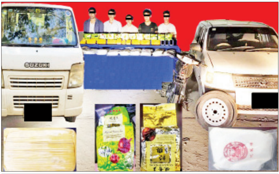
ပြစ်မှုကျူးလွန်သူများအား သိမ်းဆည်းရမိသည့် မူးယစ်ဆေးဝါးများနှင့်အတူ တွေ့ရစဉ်။ ခြင်းဖြစ်ကြောင်း သိရှိရသဖြင့် ၎င်းတို့အား မူးယစ် ဆေးဝါးနှင့်စိတ်ကိုပြောင်းလဲစေသော ဆေးဝါးများ ဆိုင်ရာဥပဒေအရ အရေးယူထားရှိပြီး ကွင်းဆက် သတင်းစဉ်

အဆိုပါစစ်ဆေးရေးစခန်းများက တင်သွင်း/ တင်ပို့သော ကုန်ပစ္စည်းများကို စစ်ဆေးမှုများ ပြုလုပ်ဆောင်ရွက်လျက်ရှိရာ မေ ၁၆ ရက်တွင် မရမ်းချောင့်အမြဲတမ်းစစ်ဆေးရေးစခန်းက တားဆီးမှု သုံးခု ခန့်မှန်းတန်ဖိုးငွေကျပ် သူညီ ဒသမ ၈၅၄ သန်း တန်ဖိုးရှိ တရားဝင်စာရွက်စာတမ်းအထောက်အထား တစ်စုံတစ်ရာ တင်ပြနိုင်ခြင်းမရှိသော ဘေထုပ် 45 Kg 2 Pkgs Budweiser Beer (355ml x 24) 14P kgs နှင့် Spy Wine (275ml x 24Bottle) 13 Pkgs အား စစ်ဆေးတွေ့ရှိ၍ ဖမ်းဆီးရမိခဲ့ကြောင်း သတင်း ရရှိသည်။