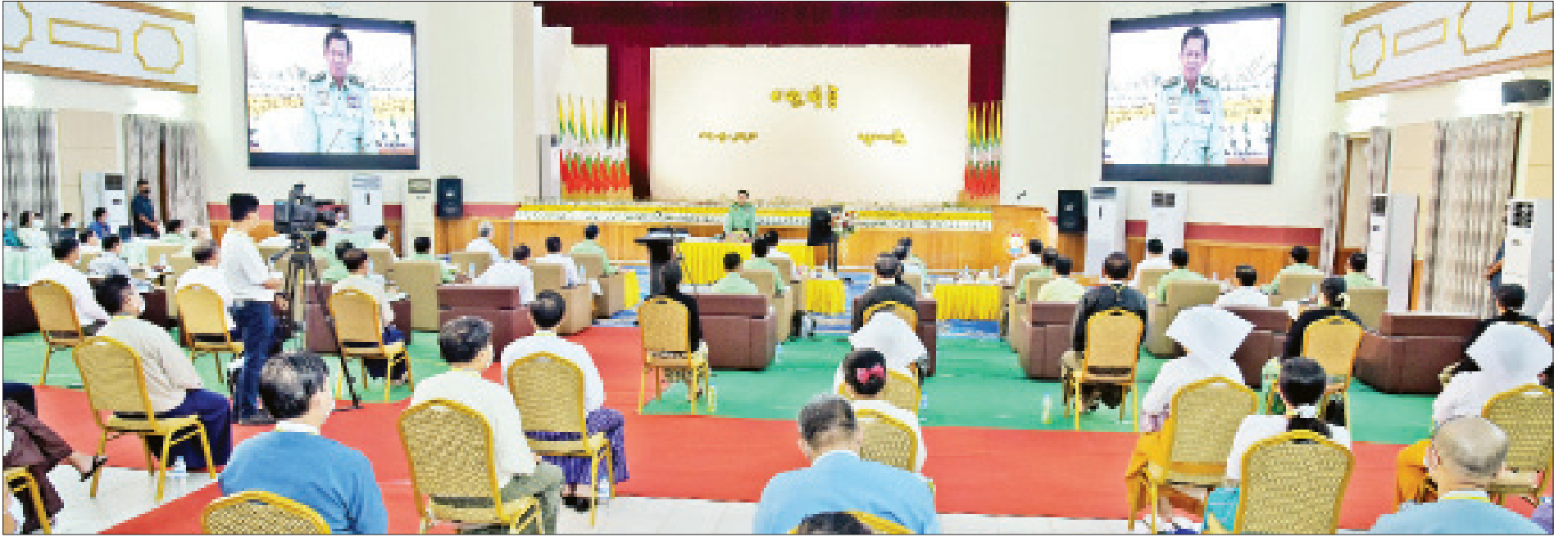
နိုင်ငံတော်စီမံအုပ်ချုပ်ရေးကောင်စီဥက္ကဋ္ဌ တပ်မတော်ကာကွယ်ရေးဦးစီးချုပ် ဗိုလ်ချုပ်မှူးကြီးမင်းအောင်လှိုင် မန္တလေးတိုင်းဒေသကြီး စီမံအုပ်ချုပ်ရေးကောင်စီအဖွဲ့ဝင်များနှင့် ဌာနဆိုင်ရာဝန်ထမ်းများအား တွေ့ဆုံအမှာစကား ပြောကြားစဉ်။

နေပြည်တော် မေ ၁၇ နိုင်ငံတော်စီမံအုပ်ချုပ်ရေးကောင်စီဥက္ကဋ္ဌ တပ်မတော်ကာကွယ်ရေးဦးစီးချုပ် ဗိုလ်ချုပ်မှူးကြီးမင်းအောင်လှိုင်သည် ယနေ့မွန်းလွဲပိုင်းတွင် မန္တလေးတိုင်းဒေသကြီး စီမံအုပ်ချုပ်ရေးကောင်စီအဖွဲ့ဝင်များနှင့် ဌာနဆိုင်ရာဝန်ထမ်းများအား တိုင်းဒေသကြီးစီမံအုပ်ချုပ်ရေးကောင်စီရုံး၌ သွားရောက်တွေ့ဆုံအမှာစကား ပြောကြားသည်။