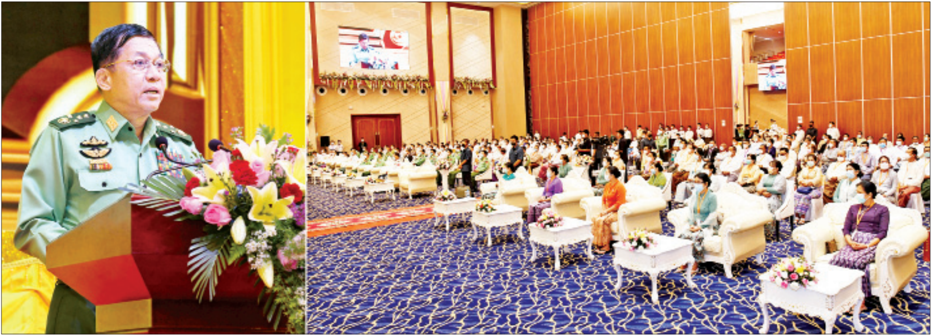
နိုင်ငံတော်စီမံအုပ်ချုပ်ရေးကောင်စီဥက္ကဋ္ဌ တပ်မတော်ကာကွယ်ရေးဦးစီးချုပ် ဗိုလ်ချုပ်မှူးကြီးမင်းအောင်လှိုင် မန္တလေးရတနာပုံခန်းမဖွင့်ပွဲအခမ်းအနားတွင် အမှာစကားပြောကြားစဉ်။

* ရှေးဦးမှ ဦးစွာ ရတနာပုံခန်းမအား နိုင်ငံတော်စီမံအုပ်ချုပ်ရေးကောင်စီဝင်၊ ပို့ဆောင်ရေးနှင့် ဆက်သွယ်ရေးဝန်ကြီးဌာန ပြည်ထောင်စုဝန်ကြီး ဗိုလ်ချုပ်ကြီးတင်အောင်စန်း၊ မန္တလေးတိုင်းဒေသကြီး စီမံအုပ်ချုပ်ရေးကောင်စီဥက္ကဋ္ဌ ဦးမောင်ကို၊ မြန်မာစီးပွားရေးကော်ပိုရေးရှင်း ဥက္ကဋ္ဌ ဒုတိယဗိုလ်ချုပ်ကြီးညိုစောနှင့် မန္တလေးမြို့တော် စည်ပင်သာယာရေးကော်မတီဥက္ကဋ္ဌ မြို့တော်ဝန် ဦးကျော်ဆန်းတို့က ဖဲကြီးမြတ်ဖွင့်လှစ်ကြသည်။