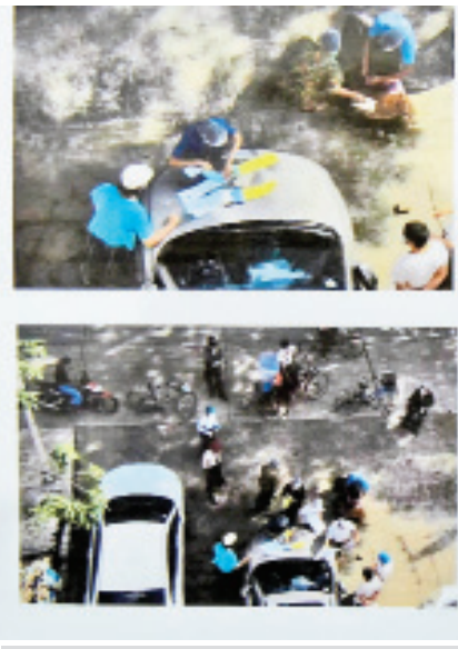
ရန်ကုန်တိုင်းဒေသကြီးအတွင်း ဥပဒေနှင့်အညီဆောင်ရွက်ခြင်းမရှိသည့် ကြိုတင်ဆန္ဒမဲများ ကောက်ယူနေသည့် မှတ်တမ်းဓာတ်ပုံများကို တွေ့ရစဉ်။

စကားပြောစက်များ၊ ဒီတိုနေတာများကို ဖော်ထုတ် ရရှိခဲ့ပါကြောင်း၊ ဖမ်းဆီးရမိသူများသည် အသက် ၂၀ နှင့် ၃၀ ကြား ဖြစ်ကြောင်း၊ ယခုလို အခြေအနေမျိုးမှာ ထိုလူမျိုးများရှိနေခြင်းကို မိဘပြည်သူများ သတိရှိစေလိုပါကြောင်း၊ နံပါတ် (နှစ်) အချက်အနေဖြင့် အမျိုးသမီးများအပေါ် လိင်ပိုင်းဆိုင်ရာ အကြမ်းဖက်မှု ရှိသည်ဟု စွပ်စွဲချက်များဖြစ်ပါကြောင်း၊ အဓိပ္ပာယ်မရှိသည့်စွပ်စွဲချက်ပင် ဖြစ်ပါကြောင်း၊ မိမိတို့ မတ်လအတွင်းကပြုလုပ်ခဲ့သည့် သတင်းစာရှင်းလင်းပွဲတွင် မိဘပြည်သူများအပေါ် အသိပေးပြောကြားခဲ့ဖူးကြောင်း၊ ယခင် ၈၈ အရေးအခင်းတုန်းက ဖမ်းဆီးခံရသူများကို မုဒိမ်းကျင့်ခြင်း၊ မတော်မတရား လုပ်ခြင်း စသည့်စွပ်စွဲချက်များ လာလိမ့်မည်ဟု ကြိုပြောခဲ့ပါကြောင်း၊ ဒီကိစ္စကို အဲဒီတုန်းက နာမည်ကြီးသတင်းဌာနတစ်ခုက ဝေဝေဆာဆာ လွှင့်ခဲ့ပါကြောင်း၊ အချိန်တန်တော့လည်း ကာယကံရှင်ကိုယ်တိုင်ဝန်ခံသည့် ဝန်ခံချက် ပေါ်ပေါက်လာခဲ့ရ