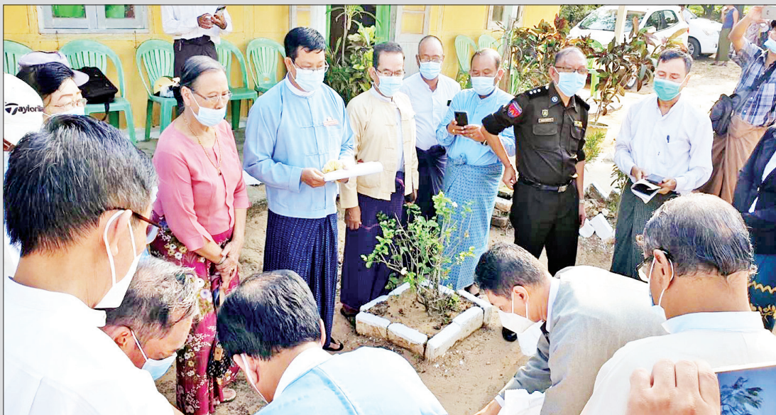
လပွတ္တာမြို့နယ် ဆန္ဒမဲလက်မှတ် မြေပြင်စစ်ဆေးမှု မှတ်တမ်းဓာတ်ပုံ။

နိုင်ငံသားစိစစ်ရေးကတ် မရှိသူများ မဲစာရင်းတွင် ပါဝင်ပြီး မဲဆန္ဒရှင် သက်သေခံ လက်မှတ်များဖြင့်သာ နိုင်ငံသားစိစစ်ရေးကတ် မပါရှိဘဲ မဲပေးမှုကို လက်ခံဆောင်ရွက်ခဲ့