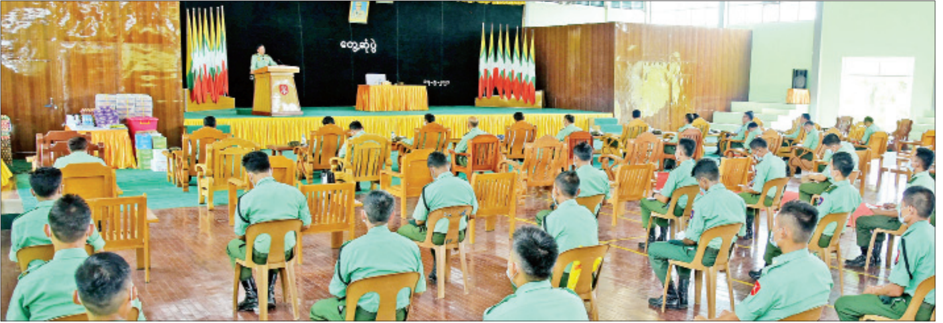
နိုင်ငံတော်စီမံအုပ်ချုပ်ရေးကောင်စီဥက္ကဋ္ဌ တပ်မတော်ကာကွယ်ရေးဦးစီးချုပ် ဗိုလ်ချုပ်မှူးကြီးမင်းအောင်လှိုင် သပိတ်ကျင်းတပ်နယ်မှ အရာရှိ၊ စစ်သည်များနှင့် နယ်မြေခံတပ်မတော်တန်းမြင့်သင်တန်းကျောင်းမှ သင်တန်းသားများအား တွေ့ဆုံအမှာစကား ပြောကြားစဉ်။

နေပြည်တော် မေ ၁၇ တပ်မတော်၏ အဓိကတာဝန်မှာ နိုင်ငံတော်ကာကွယ်ရန်ဖြစ်ပြီး တပ်မတော်သားတိုင်း၏ စွမ်းရည်တိုးတက်မြှင့်တင်ရေးအတွက် အတန်းပညာ၊ အတတ်ပညာများနှင့် ရာထူးအဆင့်နှင့်လျော်ညီသည့် လေ့ကျင့်မှုများကို သင်တန်းကျောင်းအသီးသီးတွင် လေ့ကျင့်သင်ကြားပေးလျက်ရှိကြောင်းနှင့် မိမိတို့တစ်ဦးချင်း၏ တာဝန်များကို ထမ်းဆောင်ရာတွင် စစ်သားကောင်းပီသစွာဖြင့် တာဝန်ကိုကျေပွန်စွာ ထမ်းဆောင်ကြရန် လိုအပ်ကြောင်း နိုင်ငံတော်စီမံအုပ်ချုပ်ရေးကောင်စီဥက္ကဋ္ဌ တပ်မတော်ကာကွယ်ရေးဦးစီးချုပ် ဗိုလ်ချုပ်မှူးကြီးမင်းအောင်လှိုင်က ယနေ့မွန်းလွဲပိုင်းတွင် သပိတ်ကျင်းတပ်နယ်မှ အရာရှိ၊ စစ်သည်များနှင့် နယ်မြေခံတပ်မတော် တန်းမြင့်သင်တန်းကျောင်းမှ သင်တန်းသားများအား တွေ့ဆုံအမှာစကား ပြောကြားစဉ် ထည့်သွင်းပြောကြားသည်။