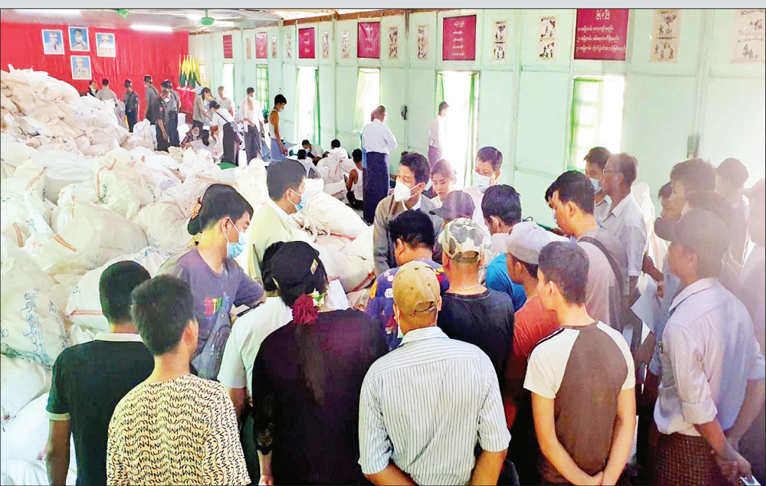
မြောင်းမြမြို့နယ် ဆန္ဒမဲလက်မှတ် မြေပြင်စစ်ဆေးမှု မှတ်တမ်းဓာတ်ပုံ။

ကြိုတင်မဲများ ကောက်ခံရာတွင် လည်း ဥပဒေနှင့် ညီညွတ်မှုမရှိသော ဆန္ဒမဲပေးခြင်းတို့ကို ဆောင်ရွက်ခဲ့