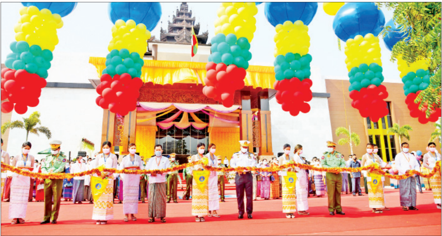
နိုင်ငံတော်စီမံအုပ်ချုပ်ရေးကောင်စီဝင်၊ ပို့ဆောင်ရေးနှင့် ဆက်သွယ်ရေးဝန်ကြီးဌာန ပြည်ထောင်စုဝန်ကြီး ဗိုလ်ချုပ်ကြီးတင်အောင်စန်း၊ မန္တလေးတိုင်း ဒေသကြီး စီမံအုပ်ချုပ်ရေးကောင်စီဥက္ကဋ္ဌ ဦးမောင်ကို၊ မြန်မာစီးပွားရေးကော်ပိုရေးရှင်းဥက္ကဋ္ဌ ဒုတိယဗိုလ်ချုပ်ကြီးညိုစောနှင့် မန္တလေးမြို့တော် စည်ပင် သာယာရေးကော်မတီဥက္ကဋ္ဌ မြို့တော်ဝန် ဦးကျော်ဆန်းတို့က မန္တလေးရတနာပုံခန်းမအား ဖြဲကြီးဖြတ်ဖွင့်လှစ်ပေးကြစဉ်။

မြန်မာနိုင်ငံ၏ ကုန်းဘောင်မင်းဆက်မြို့တည် နန်းတည်ရာဖြစ်ခဲ့သည့် မန္တလေးမြို့သည် သမိုင်း အစဉ်အလာရှိမှုနှင့် ယဉ်ကျေးမှုအစဉ်အလာကြီးမား မှုများဖြင့်ထင်ရှားသည့်မြို့တစ်မြို့လည်းဖြစ်ကြောင်း၊ ထို့ပြင် မန္တလေးမြို့နှင့် အနီးတစ်ဝိုက်ဒေသများ သည် နိုင်ငံခြားခရီးသွားဧည့်သည်များ ဝင်ထွက် သွားလာမှုများပြားသောဒေသ ဖြစ်သည့်အတွက် မြို့တော်အင်္ဂါရပ်နှင့် လိုက်လျောညီထွေဖြစ်စေမည့်