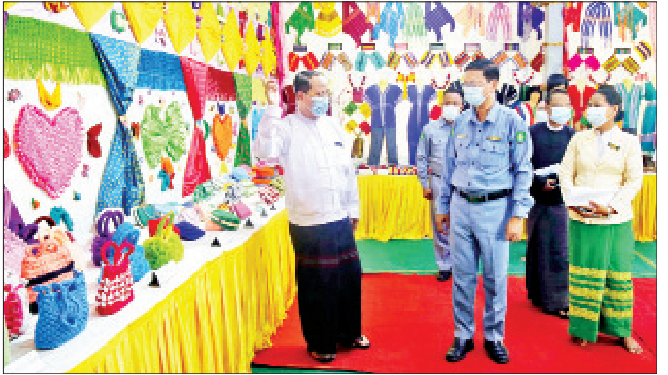
ယနေ့နံနက်ပိုင်းက အဆင့်မြင့်အိမ်တွင်းမှုစက်ချုပ် သင်တန်းဖွင့်ပွဲကျင်းပပြီး သင်တန်းသူ ၂၄ ဦး သင်တန်း တက်ရောက်လျက်ရှိကြောင်း သတင်းရရှိသည်။ စောမျိုးမင်းသိန်း(ပြန်/ဆက်)

အလားတူ ဘားအံခရိုင် လှိုင်းဘွဲ့မြို့နယ် မြိုင်ကြီးငူအထူးဒေသရှိ အမျိုးသမီးအိမ်တွင်းမှု သက်မွေးလုပ်ငန်းပညာ သင်တန်းကျောင်းတွင်လည်း