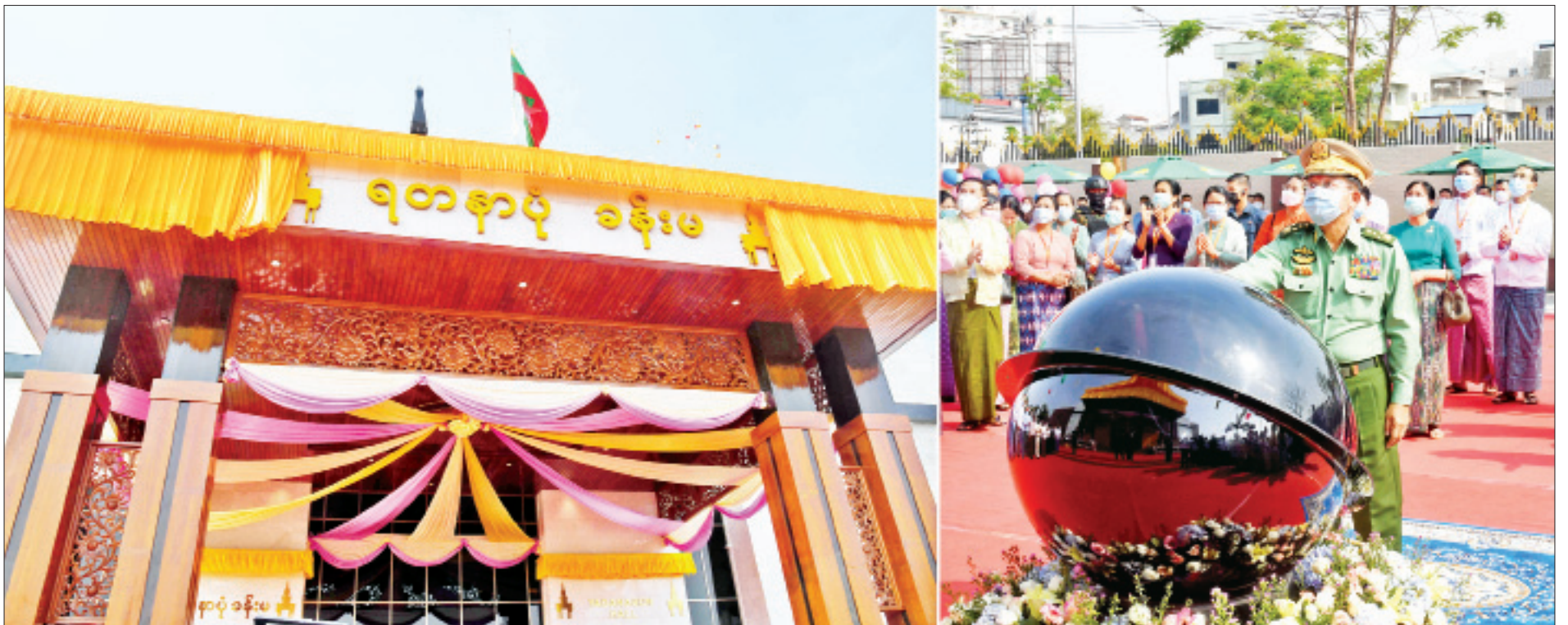
နိုင်ငံတော်စီမံအုပ်ချုပ်ရေးကောင်စီဥက္ကဋ္ဌ တပ်မတော်ကာကွယ်ရေးဦးစီးချုပ် ဗိုလ်ချုပ်မှူးကြီးမင်းအောင်လှိုင် မန္တလေးရတနာပုံခန်းမဆိုင်ခတ်အား စက်ခလုတ်နှိပ်ဖွင့်လှစ်ပေးစဉ်။