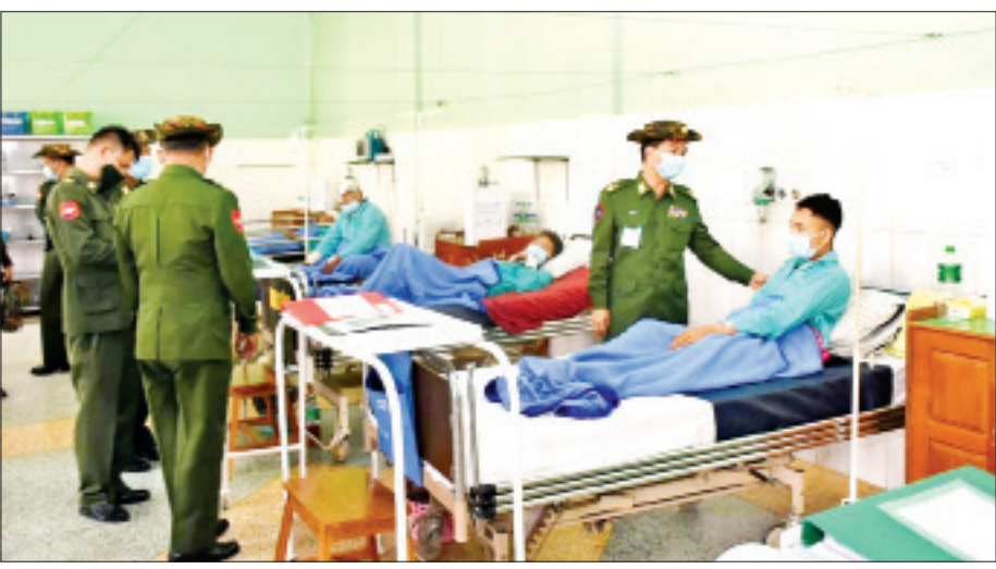
ပြင်ဦးလွင်မြို့ တပ်မတော်ဆေးရုံ၌ ဒေသခံပြည်သူများအား ကျန်းမာရေးစောင့်ရှောက်မှုပေးစဉ်။

အတွက် မိမိ၏တစ်ကိုယ်ရေ တစ်ကာယကိုလည်း အလေးထားရန် လိုအပ်သကဲ့သို့ ကျန်းမာရေးနှင့် ညီညွတ်သော ပတ်ဝန်းကျင်ကောင်းဖြစ်ထွန်းရေး ကိုလည်း အလေးထားရန်လိုအပ်ပါသည်။ ထို့အတူ မိမိ၏ကျန်းမာရေးအား မစောင့်ရှောက်နိုင်ဘဲ ရောဂါ ဖြစ်ပွားပါက ကုသပေးနိုင်သည့် ဆရာဝန်၊ သူနာပြု စသည့် လူသားတို့၏ကျန်းမာရေးကို စောင့်ရှောက် မှုပေးသော ကျန်းမာရေးဝန်ထမ်းအဖွဲ့အစည်းသည် လည်း လိုအပ်မည်ဖြစ်ပါသည်။ အစိုးရအဖွဲ့အစည်း များကလည်း ပြည်သူတစ်ဦးချင်းစီ၏ ကျန်းမာရေး အပါအဝင် လိုအပ်သော ပြည်သူ့ကျန်းမာရေးစောင့် ရှောက်မှုများအတွက် ပြည့်စုံထိရောက်သော မဟာ ဗျူဟာ၊ နည်းဗျူဟာများ ရေးဆွဲဆောင်ရွက်လျက်ရှိ ကြပါသည်။ ပြည်သူ့အကျိုးကို ရည်ရွယ်စွာ စည်း ထားသော အစိုးရမဟုတ်သောအဖွဲ့အစည်းများ ကလည်း လိုအပ်ချက်များအပေါ်မူတည်၍ စေတနာ ဖြင့် လှူဒါန်းထောက်ပံ့ခြင်း၊ စည်းရုံးလမ်းပြခြင်း၊ ကူညီဖြေရှင်းခြင်းများ ပြုလုပ်ဆောင်ရွက်သွားရပါ မည်။ အလားတူပင် ပြည်သူ့လူထုအနေဖြင့်လည်း ကျန်းမာရေးအသိနှင့် ဗဟုသုတပြည့်စုံအောင် လေ့လာဆည်းပူးကာ မိမိကိုယ်တိုင်မှအစပြု၍ လူ့အဖွဲ့အစည်းသို့တိုင် တာဝန်သိသိပူးပေါင်းမှသာ ကမ္ဘာကြီးသည် ကျန်းမာကောင်းမွန်သော လောက သစ်ကြီးအဖြစ် ရပ်တည်နိုင်မည်ဖြစ်ပါသည်။ ပြည်သူ့ကျန်းမာရေးကို မိမိကိုယ်တိုင်၏အတွက် ပယ်သတ်၍ ပရစ်တိအပြည့်မှူးမြူကာ စောင့်ရှောက် ခဲ့သည့် ကျန်းမာရေးသူရဲကောင်းများသည် ရှည်လျား လှသော သမိုင်းစဉ်တစ်လျှောက်အတွင်း ကမ္ဘာ့နိုင်ငံ များတွင်သာမက မြန်မာနိုင်ငံတွင်ပါရှိခဲ့ကြပါသည်။ အနီးစပ်ဆုံးသက်သေအနေဖြင့် ကိုဗစ်-၁၉ ကပ် ရောဂါကာလအတွင်း ကျန်းမာရေးဝန်ထမ်းများသည်