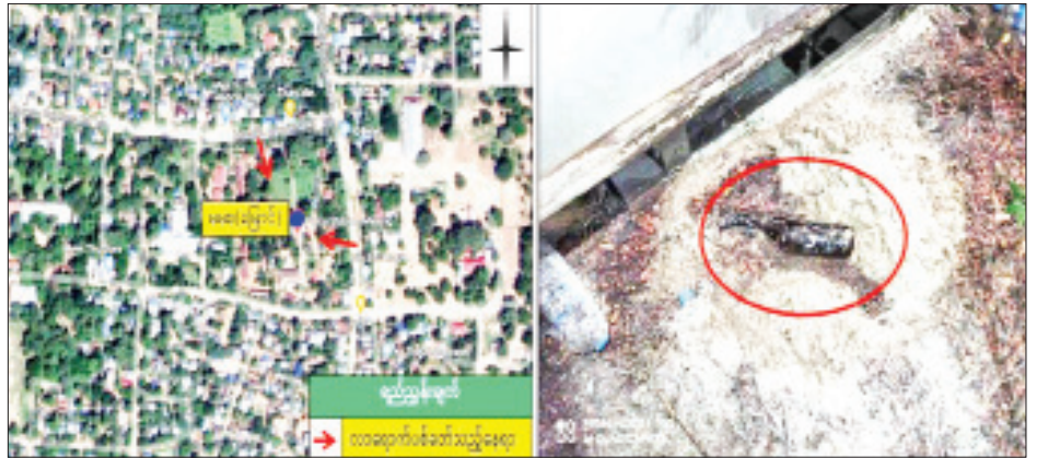
မြောင်မြို့နယ်ရှိ မြို့မရဲစခန်းအား အကြမ်းဖက်သူများက လာရောက်ပစ်ခတ်တိုက်ခိုက်မှုကို တွေ့ရစဉ်။

အလားတူ ည ၉ နာရီ ၂၅ မိနစ်တွင် ချင်းပြည်နယ် ကန်ပက်လက်မြို့ မြို့မ(၂)ရပ်ကွက်ရှိ မြန်မာ့စီးပွားရေးဘဏ်အား လက်နက်ကိုင် အကြမ်းဖက်သောင်းကျန်းသူများက လက်လုပ်ပုံးသုံးလုံး ပစ်ခတ်ခဲ့ရာ ဘဏ်ရှေ့ခြံစည်းရိုးအစပ်တွင် လက်လုပ်ပုံး တစ်လုံး၊ ဘဏ်နှင့် ရှစ်ခန်းတွဲ နှစ်ထပ်မြို့မဈေးအစပ်တွင် လက်လုပ်ပုံးတစ်လုံး ကျရောက်ပေါက်ကွဲခဲ့ကာ ပေါက်ကွဲခြင်းမရှိသည့် လက်လုပ်ပုံးတစ်လုံးအား သက်မဲ့ပြုလုပ်သိမ်းဆည်းခဲ့သည်။ ထပ်မံ၍ ည ၁၂ နာရီ ၁၀ မိနစ်တွင် လက်လုပ်ပုံးတစ်လုံး၊ တူမီးသေနတ် ၁၀ ချက်ခန့်ဖြင့်လည်းကောင်း၊