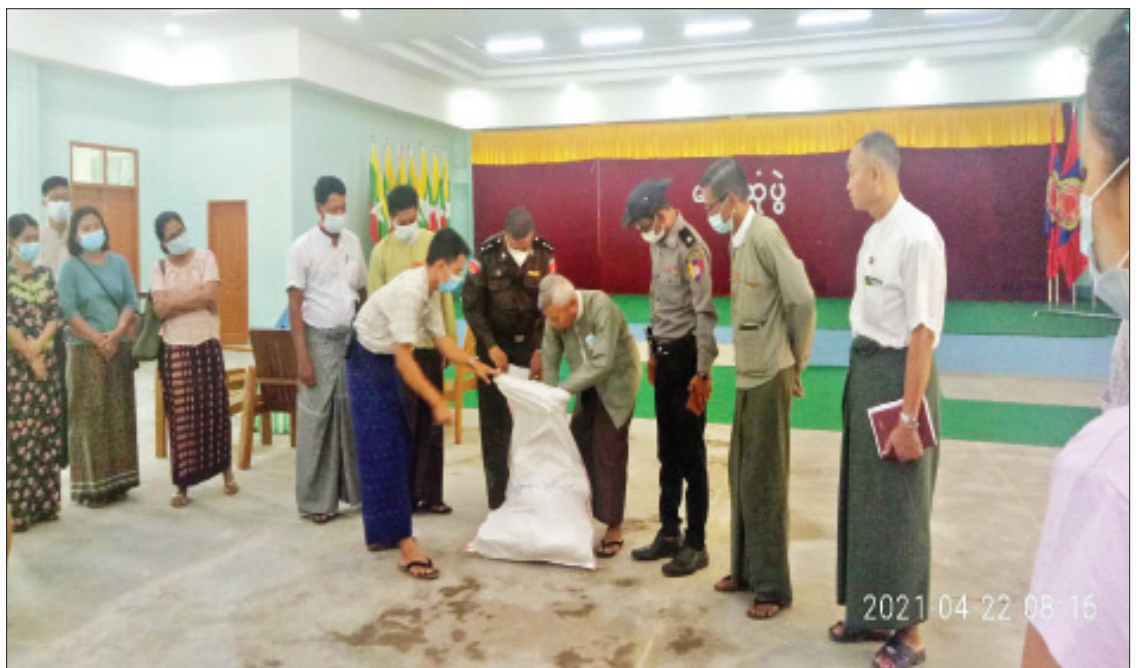
သထုံမြို့နယ်နှင့် ကျိုက်ထိုမြို့နယ်တို့၏ ဆန္ဒမဲလက်မှတ် မြေပြင်စစ်ဆေးမှု မှတ်တမ်းဓာတ်ပုံ။

သက်ဆိုင်ရာ လွှတ်တော်ရွေးကောက်ပွဲ ဥပဒေပုဒ်မ ၁၉(ခ)အရ မဲစာရင်းတွင် ပါဝင်ခွင့်မရှိဘဲ ပါဝင်ကြောင်းတွေ့ရှိလျှင် ထိုအမည်များကို မဲစာရင်းမှ ပယ်ဖျက်ရ မည်ဟု ပြဋ္ဌာန်းထားသော်လည်း ပယ်ဖျက် ခြင်းမရှိဘဲ ထည့်သွင်းမဲပေးခဲ့ကြောင်း စိစစ်တွေ့ရှိရ