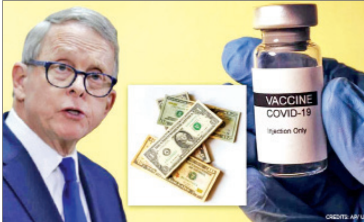
အပတ်စဉ် မဲစနစ်ဖြင့် ရွေးချယ်သွားမည့် ငွေများ ပေးအပ်သွားမည်ဖြစ်ကြောင်း ဖြစ်ပြီး မဲပေါက်သူများအား ဆုကြေး ပြောကြားခဲ့သည်။

ဝါရှင်တန် မေ ၁၄ အမေရိကန်နိုင်ငံ အိုဟိုင်းအိုးပြည်နယ်၌ ကိုဗစ်-၁၉ ရောဂါကာကွယ်ဆေးအနည်းဆုံး တစ်ကြိမ်ထိုးနှံမှုခံယူပြီးသူများအား အမေရိကန်ဒေါ်လာ ငါးသန်း (သို့မဟုတ်) ကောလိပ်ပညာသင်ဆုများကို ရွေးချယ်ချီးမြှင့်ပေးအပ် သွားမည်ဖြစ်ကြောင်း သိရသည်။