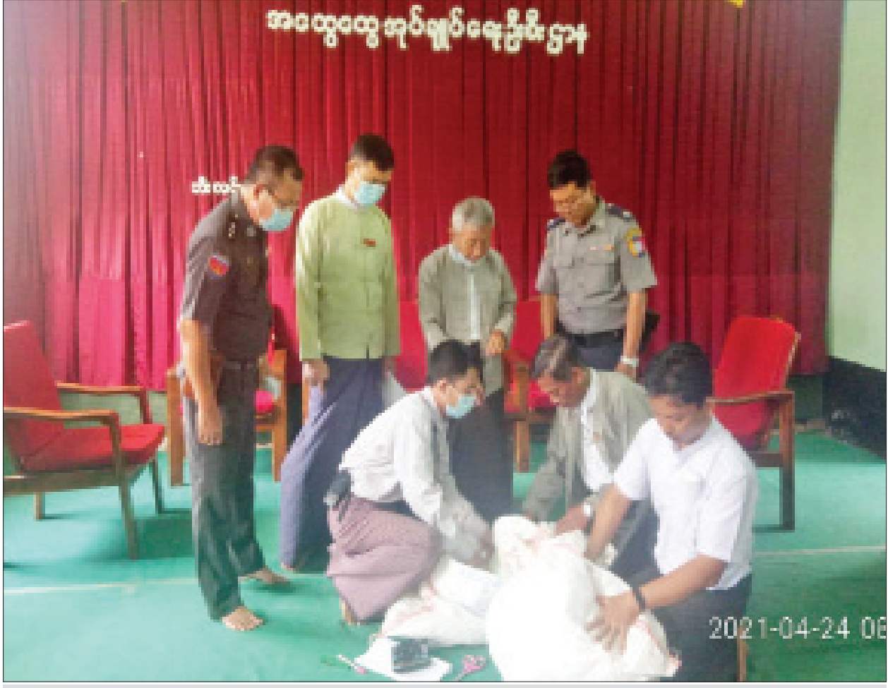
ဘီးလင်းမြို့နယ်၌ ဆန္ဒမဲလက်မှတ် မြေပြင်စစ်ဆေးမှု မှတ်တမ်းဓာတ်ပုံ။

သက်ဆိုင်ရာ လွှတ်တော်ရွေးကောက်ပွဲ ဥပဒေ “အခန်း(၆) မဲစာရင်းပြုစုခြင်း”ပါ ပုဒ်မ ၁၅ (ဂ) တွင် “မဲဆန္ဒနယ်များရှိ ဆန္ဒမဲပေးပိုင်ခွင့်ရှိသူ မည်သူမဆို သက်ဆိုင်ရာ မဲဆန္ဒနယ်၏ မဲစာရင်းတစ်ခုမှအပ အခြားမဲဆန္ဒနယ်၏ မဲစာရင်းများ၌ တစ်ချိန်တည်းတွင် အမည်စာရင်းပါဝင်ခြင်းမရှိစေရ”ဟု ပြဋ္ဌာန်းထားသော်လည်း မွန်ပြည်နယ်အတွင်းရှိ မြို့နယ်များ၏ မဲစာရင်းများတွင် ၃ ကြိမ်နှင့်အထက် ပါဝင်နေသူ ၁၃၀၀၂ ဦး၊ ၂ ကြိမ် ပါဝင်နေသူ ၁၇၄၂၆၈ ဦးတို့ရှိနေကြောင်း စိစစ်တွေ့ရှိရသဖြင့် မဲစာရင်းများကောက်ယူရာ၌ ဥပဒေနှင့်ညီညွတ်ခြင်းမရှိသော မှားယွင်းမှုများကို တွေ့ရှိရ