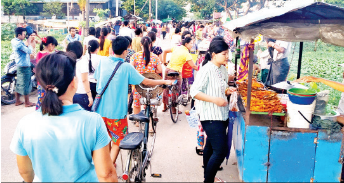
ရွှေလင်ပန်းစက်မှုဇုန်မှ လုပ်သားများ ညနေပိုင်း အလုပ်ဆင်းလာသည်ကို တွေ့ရစဉ်။

ကြီးမားသောအကျိုးကိုရနိုင် အကြောင်းတစ်ခုခုကြောင့် ငယ်စဉ်က ကုသိုလ်ကောင်းမှုပြုရန် မေ့လျော့နေခဲ့သော်လည်း နောင်ကြီးပြင်းလာသောအခါ သူတော်ကောင်းပညာရှိတို့၏ အဆုံးအမကိုရ၍ မေ့မလျော့ဘဲ ကောင်းမှုကုသိုလ်ပြုခြင်းဖြင့် ကြီးမားသော မင်္ဂလာအကျိုးကို ရနိုင်၏။ ထိုသို့ ပြုနိုင်ခြင်းကို မြတ်စွာဘုရားသည် ချီးမွမ်းတော်မူ၏။ လောကဝင်(ဓမ္မပဒ-၁၇၂)