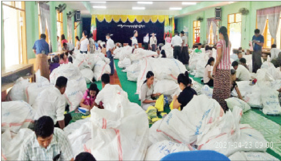
ပေါင်မြို့နယ်၌ ဆန္ဒမဲလက်မှတ် မြေပြင်စစ်ဆေးမှု မှတ်တမ်းဓာတ်ပုံ။

သက်ဆိုင်ရာ လွှတ်တော်ရွေးကောက်ပွဲ ဥပဒေအရ မဲပေးပိုင်ခွင့်ရှိသူ ဟုတ်/မဟုတ် စိစစ်နိုင်ခြင်းမရှိခဲ့သည့်အတွက် မဲစာရင်းတွင် နိုင်ငံသားစိစစ်ရေးကတ်မရှိသူများ အစုလိုက် အပြုံလိုက်ပါဝင်ခြင်း၊ နိုင်ငံသားစိစစ်ရေး ကတ်အမှတ်တစ်ခုတည်းဖြင့် မဲစာရင်း ၂ ကြိမ်၊ ၃ ကြိမ်နှင့်အထက် ပါဝင်နေခြင်းတို့ကို စိစစ်တွေ့ရှိရ