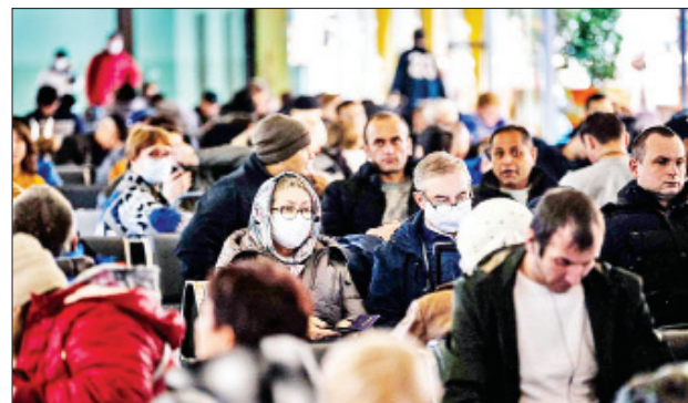
မော်စကို မေ ၁၄ ရုရှားနိုင်ငံ၌ လွန်ခဲ့သော တစ်ရက်အတွင်း ကိုဗစ်-၁၉ရောဂါ ကူးစက်ခံရသူ ၉၄၆၂ ဦးထပ်မံတွေ့ရှိသဖြင့် နိုင်ငံအတွင်း ကိုဗစ်-၁၉

ရောဂါ ကူးစက်ခံရသူပေါင်း ၄၉၂၂၉၀ ဦးရှိလာကြောင်း ရုရှားနိုင်ငံ ကိုဗစ်-၁၉ရောဂါဆိုင်ရာ တုံ့ပြန်ဆောင်ရွက်ရေးစင်တာမှ ယနေ့ ပြောကြားသည်။