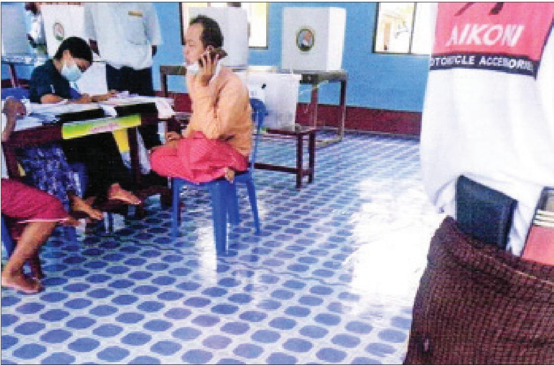
လွှတ်တော်ကိုယ်စားလှယ်လောင်းတစ်ဦး၏ တရားမဲ့လုပ်ဆောင်ခဲ့သော ဓာတ်ပုံမှတ်တမ်း။ (မုတ္တမကျေးရွာ ရွေးကောက်ပွဲကော်မရှင်အဖွဲ့ခွဲ)