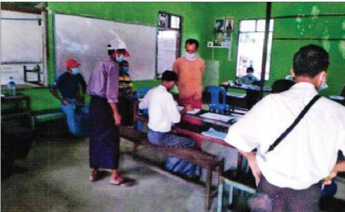
လွှတ်တော်ကိုယ်စားလှယ်လောင်းတစ်ဦး၏ တရားမဲ့လုပ်ဆောင်ခဲ့သော ဓာတ်ပုံမှတ်တမ်း။ (ကျခတ်ငူကျေးရွာ ရွေးကောက်ပွဲကော်မရှင်အဖွဲ့ခွဲ)

မဲဆန္ဒရှင်များ ဆန္ဒမဲပေးသည့်အခါတွင် နိုင်ငံသားစိစစ်ရေးကတ် မရှိသူ မဲဆန္ဒရှင်များ မဲပေးခွင့်ရရှိရေးအတွက် ယခင်ပြည်ထောင်စု ရွေးကောက်ပွဲကော်မရှင်က ၁၉-၈-၂၀၂၀ ရက်နေ့တွင် ညွှန်ကြား ချက်ထုတ်ပြန်၍ ဆောင်ရွက်ခဲ့သဖြင့် မဲရုံများတွင် နိုင်ငံသားစိစစ် ရေးကတ် စိစစ်မှုမပြုနိုင်သော မဲဆန္ဒရှင်သက်သေခံလက်မှတ်များ ဖြင့် မဲပေးခဲ့ခြင်းကြောင့် သက်ဆိုင်ရာ လွှတ်တော်ရွေးကောက်ပွဲ ဥပဒေများနှင့် ညီညွတ်မှုမရှိသော နိုင်ငံသားစိစစ်ရေးကတ်မရှိသူများ မဲပေးခွင့်ပြုခဲ့ခြင်း၊ နိုင်ငံသားစိစစ်ရေးကတ်အမှတ် တစ်ခုတည်းဖြင့် ၂ ကြိမ်၊ ၃ ကြိမ်နှင့်အထက် မဲစာရင်းတွင် ပါဝင်သူများ မဲပေးခွင့်ရရှိ ခဲ့ကြသဖြင့် သက်ဆိုင်ရာ လွှတ်တော်ရွေးကောက်ပွဲဥပဒေပုဒ်မ ၅၉ ပါ ပြဋ္ဌာန်းချက်များကို ကျူးလွန်ဖောက်ဖျက်မှုများရှိခဲ့ကြောင်း စိစစ်တွေ့ရှိရ