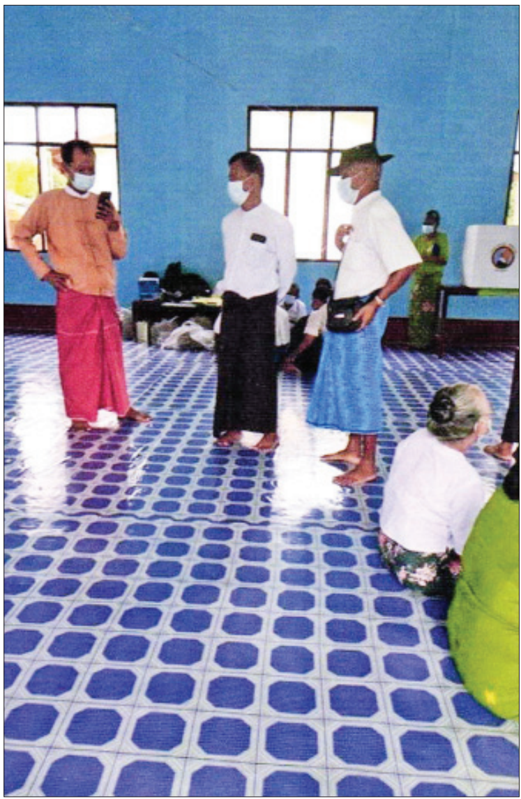
လွှတ်တော်ကိုယ်စားလှယ်လောင်းတစ်ဦး၏ တရားမဲ့လုပ်ဆောင်ခဲ့သော ဓာတ်ပုံမှတ်တမ်း။ (မုတ္တမကျေးရွာ ရွေးကောက်ပွဲကော်မရှင်အဖွဲ့ခွဲ)

အသက် ၆၀ နှင့်အထက် မဲဆန္ဒရှင်များ ကြိုတင်မဲပေးရန်အတွက် ရွေးကောက်ပွဲ နေ့မတိုင်မီ ၂၉-၁၀-၂၀၂၀ ရက်နေ့မှ စတင်၍ ဆောင်ရွက်နိုင်ကြောင်း ယခင် ပြည်ထောင်စု ရွေးကောက်ပွဲကော်မရှင်က ညွှန်ကြားချက် ထုတ်ပြန်ဆောင်ရွက် ခဲ့သည့်အတွက် ကြိုတင်ဆန္ဒမဲများ ကောက်ခံရာတွင် အချို့နေရာများ၌ NLD ပါတီအောင်နိုင်ရေး အဖွဲ့များပါဝင်၍ နေအိမ်များသို့ သွားရောက်ကာ ဆောင်ရွက်ခဲ့ကြသဖြင့် ဥပဒေနှင့်မညီ သော မဲပေးမှုဖြစ်စဉ်များ ပေါ်ပေါက်ခဲ့