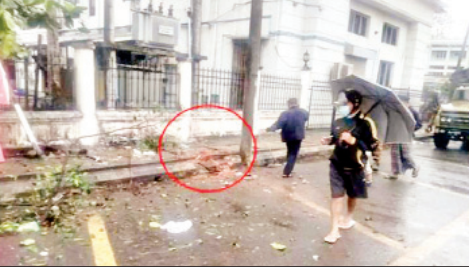
မြစ်ကြီးနားမြို့၌ လက်လုပ်ချိန်ကိုကိုင်ခိုင်းတစ်လုံး ပေါက်ကွဲမှုကို တွေ့ရစဉ်။