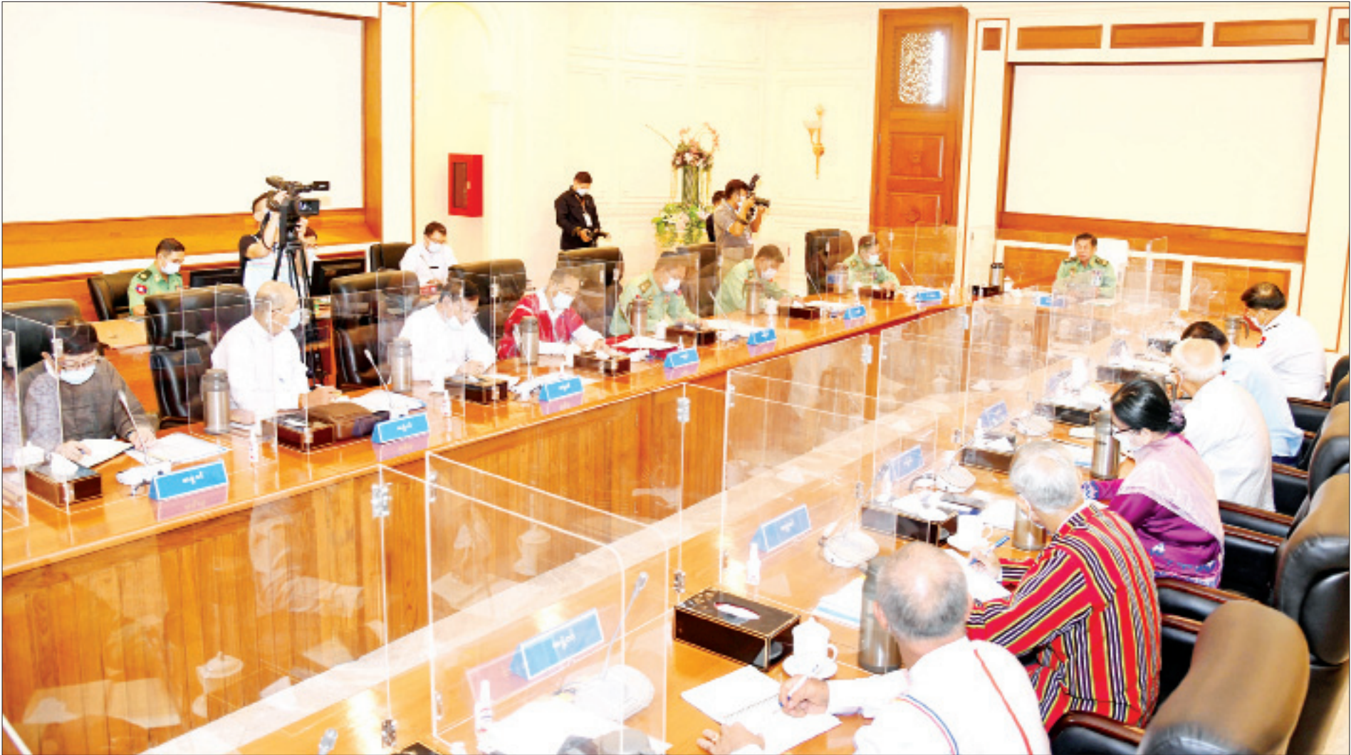
နိုင်ငံတော်စီမံအုပ်ချုပ်ရေးကောင်စီဥက္ကဋ္ဌ၊ တပ်မတော်ကာကွယ်ရေးဦးစီးချုပ် ဗိုလ်ချုပ်မှူးကြီးမင်းအောင်လှိုင် နိုင်ငံတော်စီမံအုပ်ချုပ်ရေးကောင်စီ အစည်းအဝေး(၁၀/၂၀၂၁)တွင် အမှာစကားပြောကြားစဉ်။

နေပြည်တော် မေ ၁၀ နိုင်ငံတော်စီမံအုပ်ချုပ်ရေးကောင်စီအစည်းအဝေး(၁၀/၂၀၂၁)ကို ယနေ့ နံနက်ပိုင်းတွင် နေပြည်တော်ရှိ နိုင်ငံတော်စီမံအုပ်ချုပ်ရေးကောင်စီ ဥက္ကဋ္ဌရုံး အစည်းအဝေးခန်းမ၌ ကျင်းပရာ နိုင်ငံတော်စီမံအုပ်ချုပ်ရေး ကောင်စီဥက္ကဋ္ဌ၊ တပ်မတော်ကာကွယ်ရေးဦးစီးချုပ် ဗိုလ်ချုပ်မှူးကြီး မင်းအောင်လှိုင် တက်ရောက်အမှာစကားပြောကြားသည်။ အစည်းအဝေးသို့ နိုင်ငံတော်စီမံအုပ်ချုပ်ရေးကောင်စီ ဒုတိယ