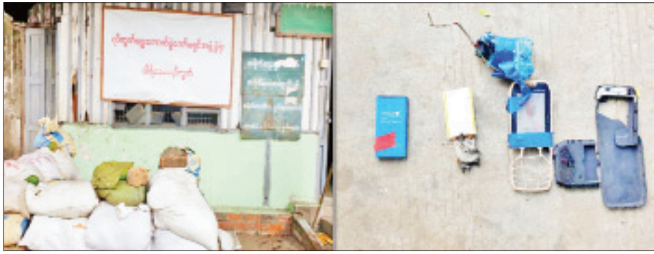
စမ်းချောင်းမြို့နယ် သီရိခေမာရပ်ကွက် ရပ်ကွက်စီမံအုပ်ချုပ်ရေးအဖွဲ့ရုံးအား လက်လုပ်မိုင်း တစ်လုံး ပစ်ပေါက်မှုကို တွေ့ရစဉ်။

နေပြည်တော် မေ ၁၀ နိုင်ငံတော်အတွင်း ဆူပူအကြမ်းဖက်သူလူအုပ်စုများ အနေဖြင့် နိုင်ငံတော်ပိုင်အဆောက်အအုံများ၊ အေးချမ်းစွာ နေထိုင်လိုသော ပြည်သူလူထုအချို့၏ နေအိမ်များ၊ အများပြည်သူသွားလာလှုပ်ရှားနေသော လမ်းမကြီးများပေါ်တွင် လက်လုပ်ဗုံးများ ပစ်ဖောက်ခြင်း၊ ထောင်ထားခြင်းများအား လုပ်ဆောင်လျက်ရှိသည်။