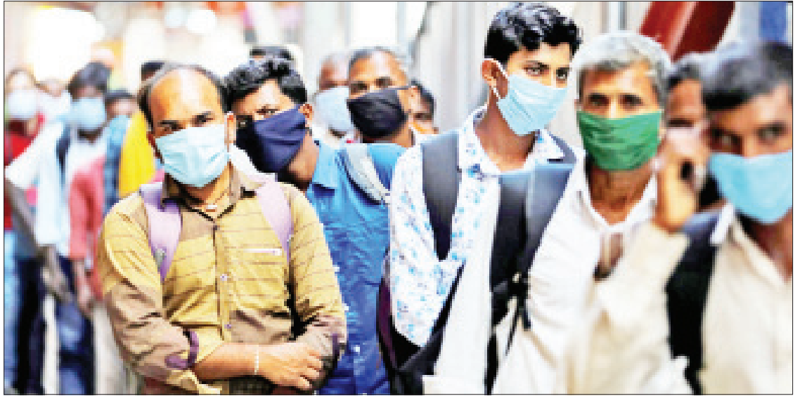
၁၆ ရက်မှ စတင်ဆောင်ရွက်ခဲ့ပြီး ကာကွယ် ဆေးအလုံးရေ သန်း ၁၇၀ ကျော်ကို နိုင်ငံသားများအား ထိုးနှံပေးခဲ့ကြောင်း သိရသည်။ နိုင်ငံအတွင်း ကိုဗစ်-၁၉ ရောဂါ ရှိ မရှိ စစ်ဆေးသောနေရာများကို သန်းကျော် တိုးချဲ့ဖွင့်လှစ်ခဲ့ပြီး ၃၀၃ သန်းကျော် အား စစ်ဆေးဆောင်ရွက်ခဲ့ကြောင်း သိရ သည်။ ကိုးကား-ဆင်ပွား ဘာသာပြန်-စိုးသူရ

နယူးဒေလီမြို့၌ မေ ၁၇ ရက်အထိ အကျုံးဝင်သော တတိယအကြိမ်မြောက် အသွားအလာကန့်သတ်မှုကို ချမှတ်ထား ပြီး ကိုဗစ်-၁၉ ရောဂါ ကူးစက်ပျံ့နှံ့မှုများ မြင့်တက်နေသောကြောင့် စာမေးပွဲများ ကို အချိန်ရွှေ့ဆိုင်းခြင်းနှင့် ဖျက်သိမ်း ခြင်းတို့ကို ဆောင်ရွက်ခဲ့သည်။ ပြီးခဲ့သည့် သီတင်းပတ်များမှစတင်ပြီး နေ့စဉ် ကိုဗစ်-၁၉ ရောဂါအတည်ပြုကူးစက် ခံရသူအရေအတွက် မြင့်တက်လာခဲ့သည်။ အိန္ဒိယနိုင်ငံ၌ ကိုဗစ်-၁၉ ရောဂါ ကာကွယ်ဆေးထိုးလုပ်ငန်းကို ဇန်နဝါရီ