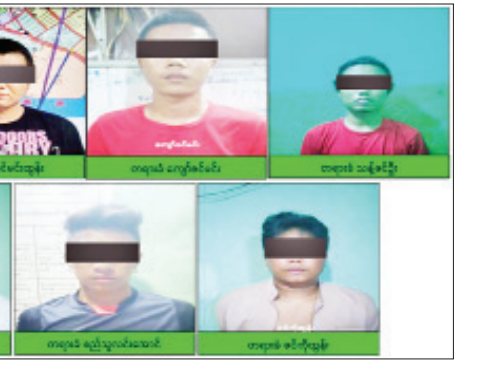
အလုံမြို့နယ်၌ ဆူပူအကြမ်းဖက်ရာတွင် အသုံးပြုသည့် ပစ္စည်းများနှင့်အတူ အမျိုးသား ခုနစ်ဦးအား ဖမ်းဆီးရမိစဉ်။

ပြုလုပ်ထားသော လက်လုပ်မိုင်း ၃၅ လုံး၊ အရှည် နှစ်လက်မ၊ အချင်း နှစ်လက်မခန့်ရှိ သံပိုက်ဖြင့် ပြုလုပ်ထားသော လက်လုပ်မိုင်း ၅၅ လုံး၊ Win Wheel စာတန်းပါ တစ်ထပ်လျှင် သံဘောစေ့ ၁၄၅ လုံးပါ အထုပ် လေးထုပ်၊ သံဘောစေ့အလုံး ၁၀၀ ပါ အထုပ် တစ်ထုပ်၊ ဗြောက်အိုး ၁၀ လုံးပါ အထုပ် တစ်ထုပ်၊ လေးခွ နှစ်လက်၊ ဂျင်ကလီ ၂၄ ချောင်း၊ ကျောက်မီးသွေး နှစ်ပိဿာခန့်၊ ယမ်းမှုန့် ၄၀ ကျပ်သားခန့်၊ လက်လုပ်မိုင်းများပြုလုပ်ရန်အတွက် ပိုင်းဖြတ်ထားသော ကော်ပိုက် အပိုင်း အခု ၅၀၊ သံပိုက်အပိုင်း ၁၄ ခု၊ ပိုက်ခေါင်းမျိုးစုံ ၉၇ ခု၊ တစ်လက်မ ခန့်ရှိ သံချောင်းဖြတ်စ တစ်ပိဿာခွဲ၊ မူလီ ဆိုဒ်စုံ ၆၅ ခု၊ ခဲသီး နှစ်ပိဿာခန့်၊ ဆိုင်ကယ်ချိန်းကြိုး ဖြတ်တောက်ထားသည့် အဆစ် အခု ၇၀၊ ဓာတ်မြေဩဇာ ၂၀ ကျပ်သား၊ ဓာတ်ခဲ လေးလုံး၊ ယမ်းကြိုး အချောင်း ၃၀၊ အဝါရောင် Cutter တစ်ခု၊ သတ္တုဖျူစံ ၁၅ ခု၊ အနီရောင်နှင့် အနက် ရောင် နှစ်ပင်လိမ်မီးကြိုးခွေ နှစ်ခွေ၊ သံပိုက်နှင့် ကော်ပိုက်များအား ပြုပြင်ရန်