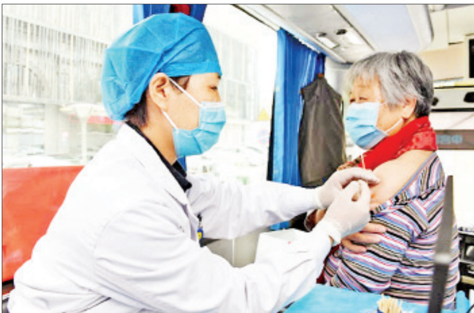
ကာကွယ်ဆေး၏ အရည်အသွေးများကို ဆန်းစစ် လေ့လာခဲ့ပြီး သတ်မှတ်ချက်အဆင့်ပြည့်မီမှသာ ကာကွယ်ဆေးများကို အရေးပေါ်အသုံးပြုရန် ကိုးကား - ဆင်ဟွာ ဘာသာပြန် - ဂျေတီ

ကမ္ဘာ့ကျန်းမာရေးအဖွဲ့သည် ကိုဗစ်-၁၉ ရောဂါ ကာကွယ်ဆေးများအား အရေးပေါ်အသုံးပြုရန် အတည်ပြုရာတွင် ကာကွယ်ဆေး၏ ဘေးကင်းလုံခြုံမှု၊ ကာကွယ်ဆေး၏ အစွမ်းထက်မှုနှင့်