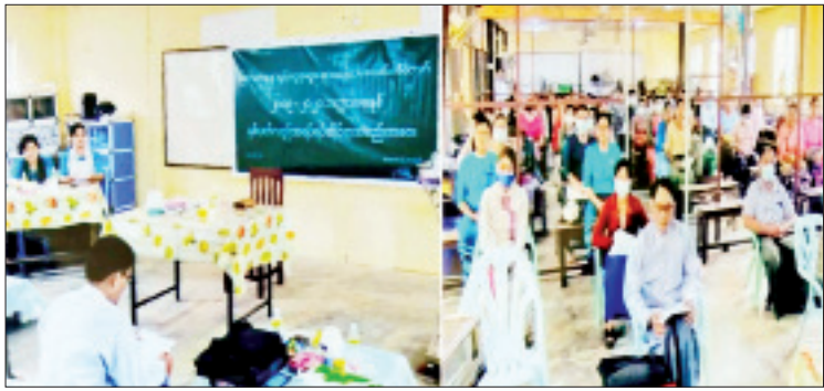
ပြည်ထောင်စုရွေးကောက်ပွဲကော်မရှင်