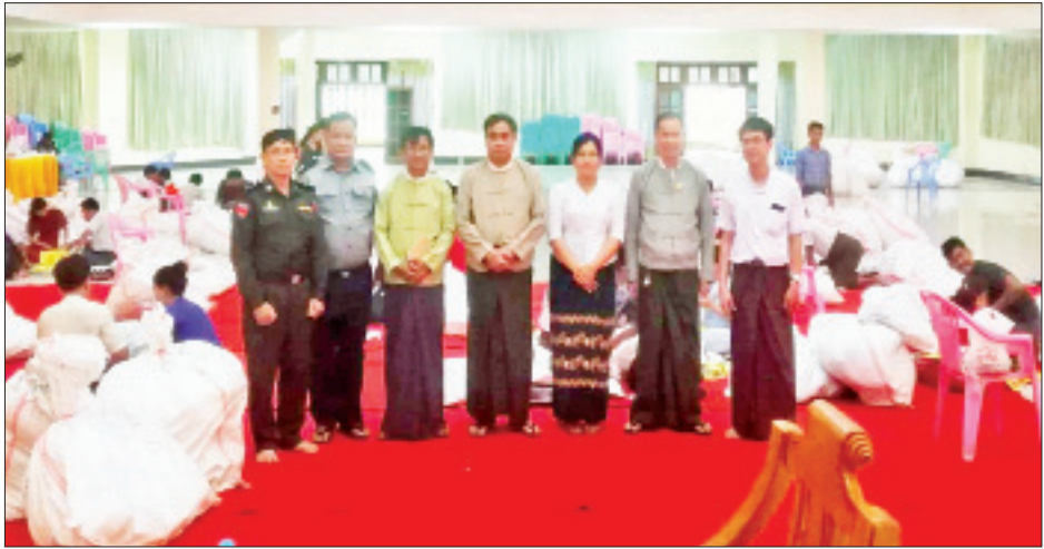
ချောင်းဆုံမြို့နယ် ဆန္ဒမဲလက်မှတ် မြေပြင်စစ်ဆေးမှု မှတ်တမ်းဓာတ်ပုံ။