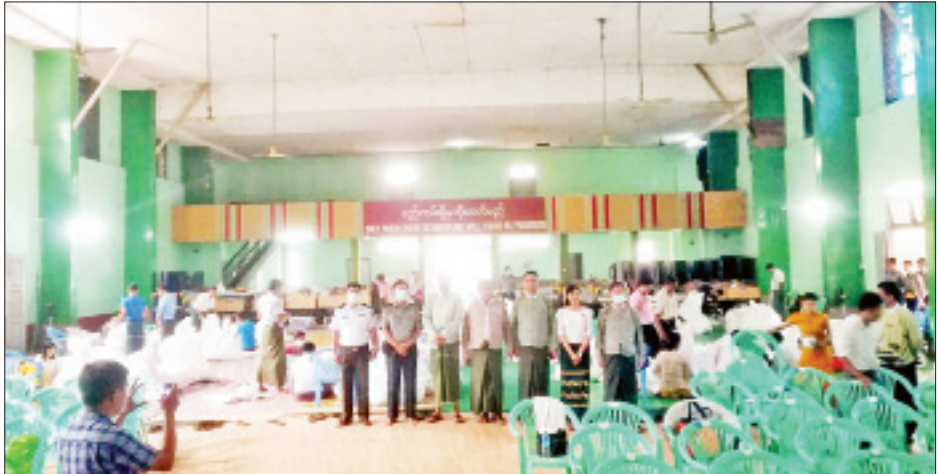
သံဖြူဇရပ်မြို့နယ် ဆန္ဒမဲလက်မှတ် မြေပြင်စစ်ဆေးမှု မှတ်တမ်းဓာတ်ပုံ။