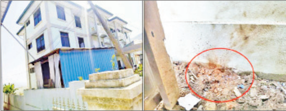
ဟားခါးမြို့၌ လက်လုပ်မိုင်းပေါက်ကွဲမှုကို တွေ့ရစဉ်။

အလားတူ ည ၈ နာရီခန့်တွင် မန္တလေးတိုင်း ဒေသကြီး ပြည်ကြီးတံခွန်မြို့နယ် (ဆ)ရပ်ကွက် ၆၂ လမ်းနှင့် ၆၃ လမ်းကြား၊ ၁၂၈ လမ်းနှင့် ၁၂၉ လမ်း ကြားရှိ အလုပ်သမား၊ လူဝင်မှုကြီးကြပ်ရေးနှင့်