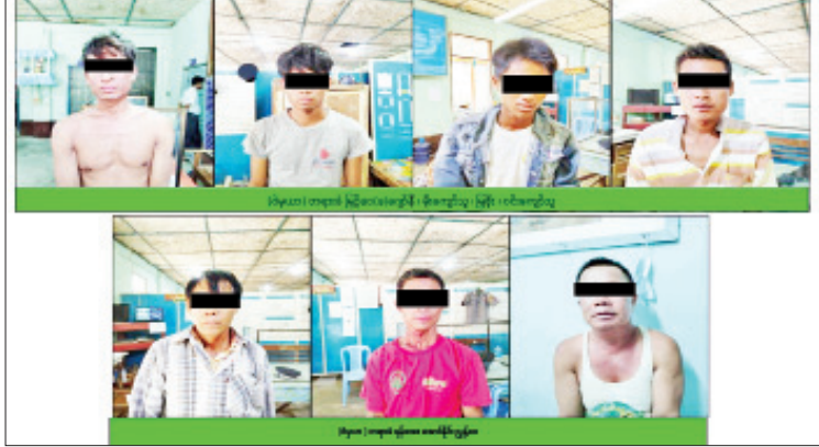
နတ်မောက်မြို့နယ်၌ ဆူပူအကြမ်းဖက်မှုဖြစ်စဉ်တွင် ဖမ်းဆီးရမိခဲ့သော အမျိုးသား ခုနစ်ဦးအား တွေ့ရစဉ်။

ရောင်းချနေကြသည်ကို စိစစ်တွေ့ရှိရသည်။ သို့ဖြစ်ပါ၍ တရားမဝင်အကောက်ခွန်မဲ့တင်သွင်းလာသော အရောင်းဆိုင်/အရောင်းပြခန်းများတွင် ရောင်းချလျက်ရှိသည့် တရားမဝင် မော်တော်ဆိုင်ကယ်များကို အဓိကဦးတည်ပြီး ဖမ်းဆီးနိုင်ရေး ဆောင်ရွက်ခဲ့ရာ မေ ၈ ရက်အထိ အရောင်း ဆိုင်/အရောင်းပြခန်းများနှင့် နယ်စပ်ဒေသလမ်းကြောင်းများမှ တရားမဝင် ဝင်ရောက်လာသည့် မော်တော်ဆိုင်ကယ် စုစုပေါင်း ၈၂၆ စီး သိမ်းဆည်းရမိခဲ့ပြီး တရားမဝင်တင်သွင်းလာမှုများ မရှိစေရေး ဖမ်းဆီးအရေးယူမှုများအား ဆက်လက်ဆောင်ရွက် သွားမည်ဖြစ်ကြောင်း သိရသည်။ သတင်းစဉ်