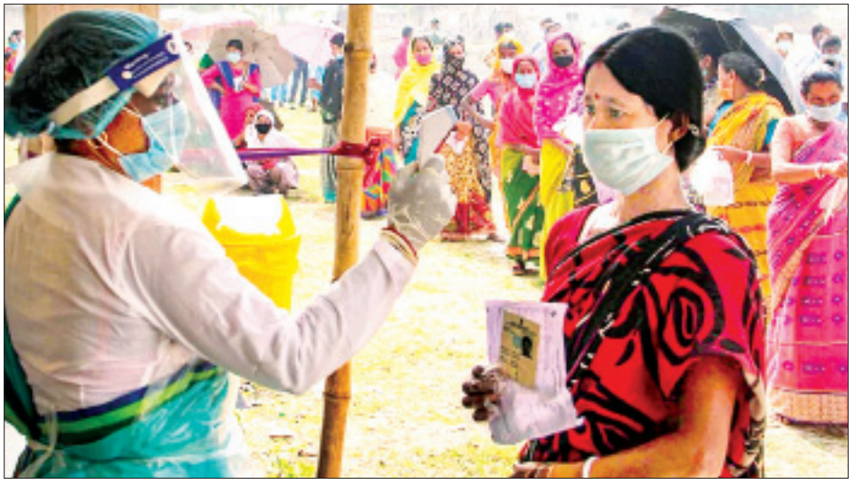
လျက်ရှိသည်။ လက်ရှိအချိန်အထိ ဗိုင်းရပ်စ်ကူးစက်ခံရသူပေါင်း ၂၁၄၉၁၅၉၈ ဦးရှိပြီး အဆိုပါ ရောဂါကြောင့် သေဆုံးသူပေါင်း ၂၃၄၀၈၃ ဦးရှိကြောင်း သိရသည်။ ကိုးကား-အင်န်အိတ်ချီကောဘာသာပြန်-အောင်ကျော်ကျော်

နိုင်ငံအတွင်း ဗိုင်းရပ်စ်ကူးစက်မှုနှုန်းများ မြင့်တက်လျက်ရှိသော်လည်း အစိုးရအနေဖြင့် နိုင်ငံ၏ စီးပွားရေးဖွံ့ဖြိုးတိုးတက်မှုအခြေအနေ ထိခိုက်မည်ကိုစိုးရိမ်သည့်အတွက် ခရီးသွားလာခွင့်ပိတ်ဆို့မှုများကို ပြန်လည်ချမှတ်ခြင်းမရှိသေးပေ။ သို့သော် ဗိုင်းရပ်စ်ကူးစက်မှုကို ထိန်းချုပ်နိုင်ရန် ရောဂါကာကွယ်ရေးစည်းမျဉ်းများ တင်းကျပ်စွာ ပြန်လည်ချမှတ်သင့်ပါကြောင်း တောင်းဆိုမှုများ မြင့်တက်