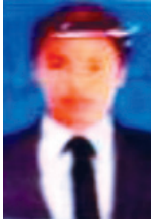
ဒေါက်တာ သန်းစော်