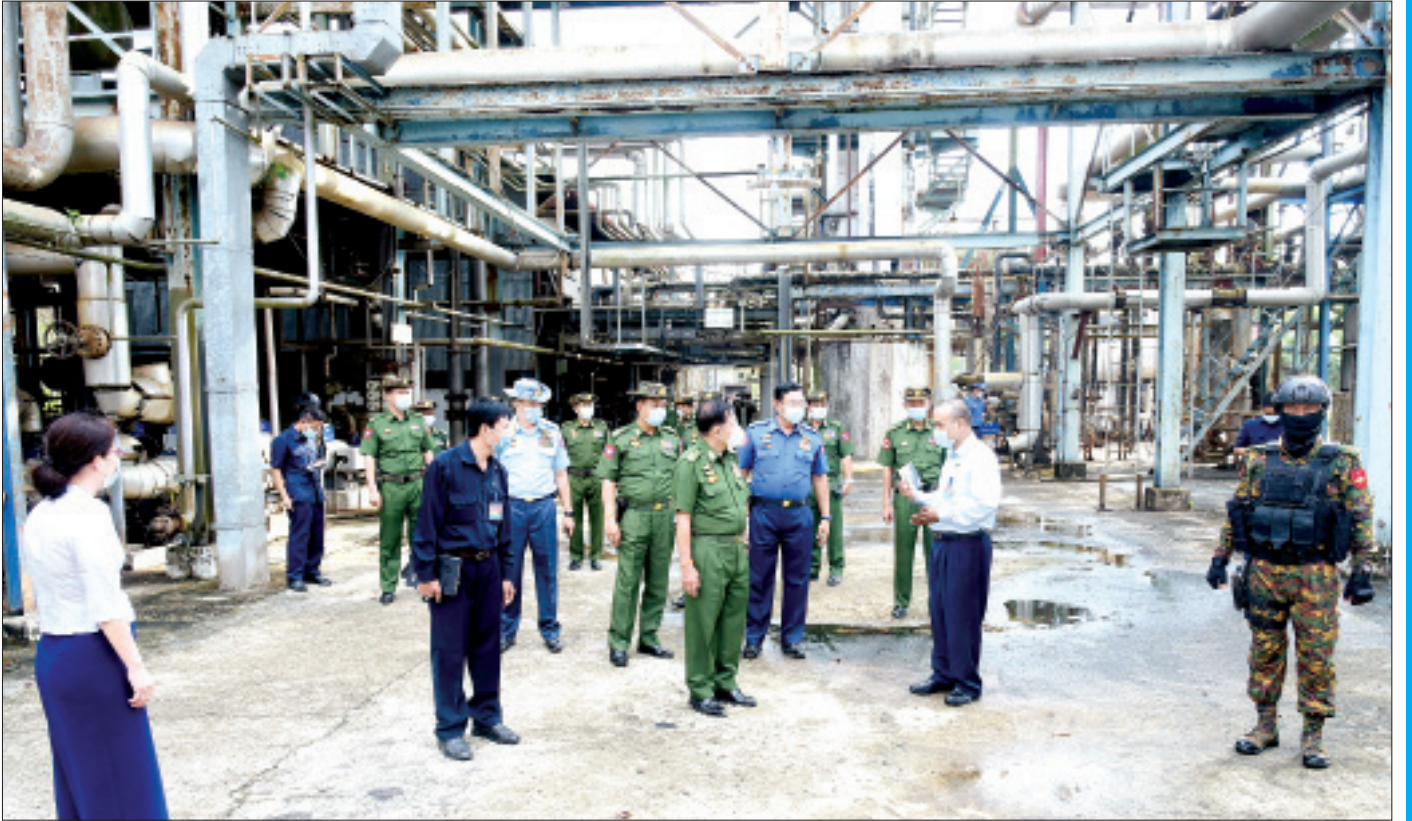
နိုင်ငံတော်စီမံအုပ်ချုပ်ရေးကောင်စီဥက္ကဋ္ဌ၊ တပ်မတော်ကာကွယ်ရေးဦးစီးချုပ် ဗိုလ်ချုပ်မှူးကြီးမင်းအောင်လှိုင် အမှတ်(၁) ရေနံချက်စက်ရုံ(သန်လျင်) တွင် ကြည့်ရှုစစ်ဆေးစဉ်။

မြန်မာနိုင်ငံရဲ့ လက်ရှိဖြစ်ပေါ်ပြောင်းလဲတိုးတက်မှုအခြေအနေတွေနဲ့ပတ်သက်ပြီး ရန်ကုန်မြို့မှာ ရှိတဲ့ သံတမန်တွေနဲ့ ကုလသမဂ္ဂလက်အောက်ခံအဖွဲ့အစည်းများက အကြီးအကဲများကို ရှင်းလင်းပြောကြားခြင်းကိုလည်း ဧပြီ ၈ ရက်မှာ ပြုလုပ်ခဲ့ပါတယ်။ အပြည်ပြည်ဆိုင်ရာ ပူးပေါင်းဆောင်ရွက်ရေးဝန်ကြီးဌာန ပြည်ထောင်စုဝန်ကြီးနဲ့ တာဝန်ရှိသူများက နိုင်ငံတကာသံတမန်များနဲ့ ကုလအဖွဲ့အစည်းအကြီးအကဲများကို လက်ရှိနိုင်ငံရေးအခြေအနေ၊ ဖွဲ့စည်းပုံအခြေခံဥပဒေ (၂၀၀၈ ခုနှစ်) နှင့်အညီ တာဝန်ယူဆောင်ရွက်ခဲ့တဲ့ အခြေအနေနဲ့ လွတ်လပ်ပြီးတရားမျှတတဲ့ ပါတီစုံဒီမိုကရေစီအထွေထွေရွေးကောက်ပွဲကို ပြန်လည်ကျင်းပပြီး ဒီမိုကရေစီစံချိန်စံနှုန်းများနဲ့အညီ နိုင်ငံတော်တာဝန်ယူဆောင်ရွက်ရေးတို့ကိုလည်း ပွင့်လင်းမြင်သာစွာ ဆွေးနွေးခဲ့ကြပါတယ်။