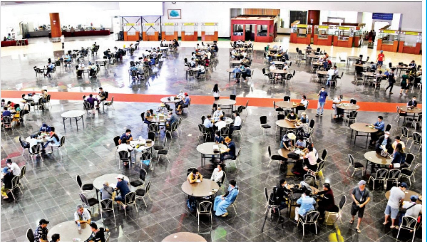
၂၀၂၁ ခုနှစ် ဧပြီလ ပုလဲအတွဲများနှင့် ကျောက်မျက်ရတနာများ မြန်မာကျပ်ငွေဖြင့် ရောင်းချပွဲဒသမနေ့သို့ လာရောက်ကြည့်ရှု ရတနာကုန်သည်များကို တွေ့ရစဉ်။

စက်မှုဇုန်တွေမှာ လာရောက်ရင်းနှီးမြုပ်နှံ လုပ်ကိုင်နေတဲ့ လုပ်ငန်းရှင်တွေ၊ ကုန်သည်အသင်း အဖွဲ့တွေ လိုအပ်နေတဲ့ သတင်းအချက်အလက်၊ တွေ့ကြုံနေတဲ့အခက်အခဲတွေကို မြန်မြန်ဆန်ဆန် ဖြေရှင်းဆောင်ရွက်နိုင်ဖို့ ကုန်သွယ်မှုနှင့် ကုန်စည် စီးဆင်းမှု မှန်ကန်မြန်ဆန်စေရေး လုပ်ငန်း ကော်မတီက ဆောင်ရွက်ပေးနေတာကိုလည်း မြင်တွေ့ရပါတယ်။ ကုန်သွယ်မှုနဲ့ ကုန်စည်စီးဆင်း မှုအခက်အခဲတွေ၊ ဘဏ်လုပ်ငန်းဆိုင်ရာ၊ ဆိပ်ကမ်း ပိုင်းဆိုင်ရာ၊ ပြည်တွင်းကုန်သွယ်မှုဆိုင်ရာစတဲ့ စီးပွားရေးလုပ်ငန်းရှင်တွေ တွေ့ကြုံနေရတဲ့ အခက် အခဲတွေကို ရန်ကုန်တိုင်းဒေသကြီး စီမံအုပ်ချုပ် ရေးကောင်စီမှာ ၂၄ နာရီ ရုံးဖွင့်ပြီး ဆောင်ရွက်ပေး နေပြီဖြစ်တယ်လို့လည်း စီးပွားရေးနှင့် ကူးသန်း ရောင်းဝယ်ရေးဝန်ကြီးဌာန ဒုတိယဝန်ကြီးက လုပ်ငန်းရှင်များနဲ့ ဧပြီ ၂ ရက် တွေ့ဆုံစဉ်မှာ