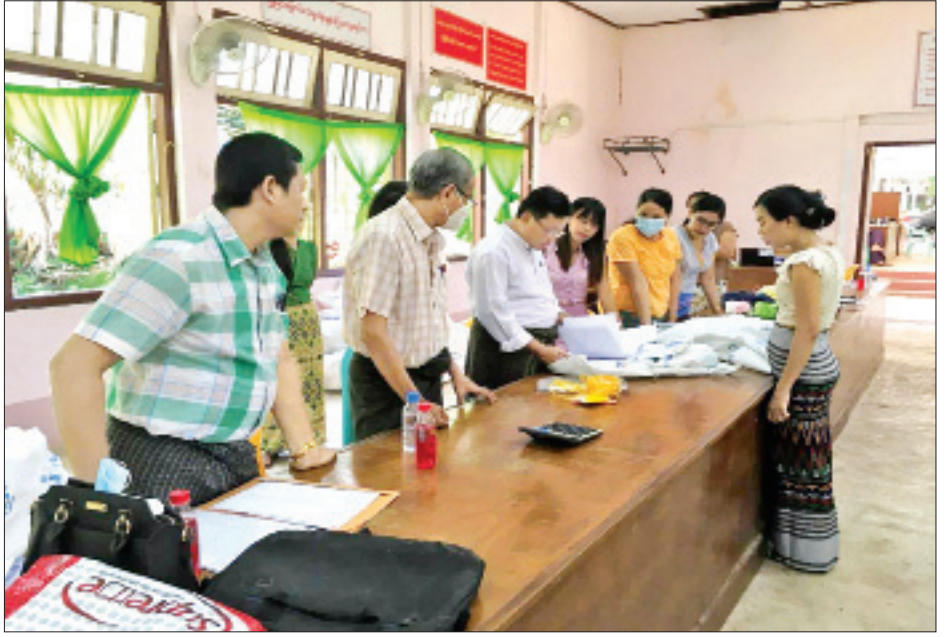
ဘုတ်ပြင်းမြို့နယ် ဆန္ဒမဲလက်မှတ် မြေပြင်စစ်ဆေးမှု မှတ်တမ်းဇယားပုံ။