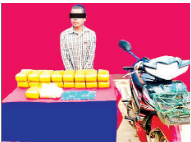
နန်ကျောက်အား သိမ်းဆည်းရမိသည့် စိတ်ကြွရူးသွပ်ဆေးပြားများနှင့်အတူ တွေ့ရစဉ်။