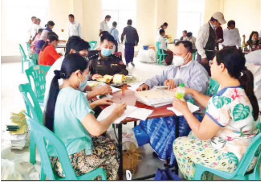
ဗန်းမော်မြို့နယ်၌ ဆန္ဒမဲလက်မှတ်များ မြေပြင်စစ်ဆေးမှု မှတ်တမ်းဓာတ်ပုံ။

ရန်ကုန်မြို့မှာ နှစ်စဉ်ကြုံတွေ့နေရတဲ့ ရေကြီးရေလျှံမှုဖြစ်စဉ်တွေ လျော့နည်းပပျောက်ဖို့အတွက်လည်း ဗိုလ်တထောင်မြို့နယ်မှာရှိတဲ့ မြစ်ထွက်ပေါက်ရေမြောင်း၊ ကျောက်တံတားမြို့နယ်အတွင်းက အမှတ်(၁၀) ရေတံခါးနဲ့ လမ်းမတော်မြို့နယ် ရွာသစ်ချောင်း မြစ်ထွက်ပေါက်နေရာတွေကို ကိုယ်တိုင်သွားရောက်ကြည့်ရှုစစ်ဆေးခဲ့တာကလည်း ပြည်သူနဲ့တစ်သား တည်းရှိနေတဲ့ အစိုးရသစ်ရဲ့ ဖော်ဆောင်မှုတွေပဲဖြစ်။