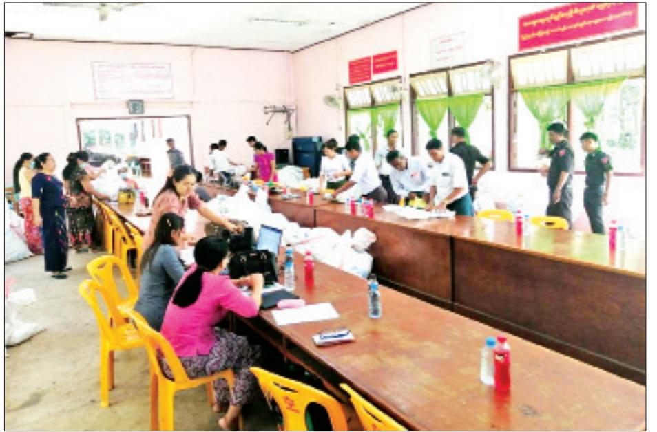
ကော့သောင်းမြို့နယ် ဆန္ဒမဲလက်မှတ် မြေပြင်စစ်ဆေးမှု မှတ်တမ်းဓာတ်ပုံ။

၇။ ကော့သောင်းမြို့နယ် ပြည်သူ့လွှတ်တော်ဆန္ဒမဲလက်မှတ် ရပ်ကွက်/ကျေးရွာအုပ်စုအလိုက် မြေပြင်စစ်ဆေးတွေ့ရှိချက်မှာ အောက်ပါအတိုင်းဖြစ်ပါသည်-