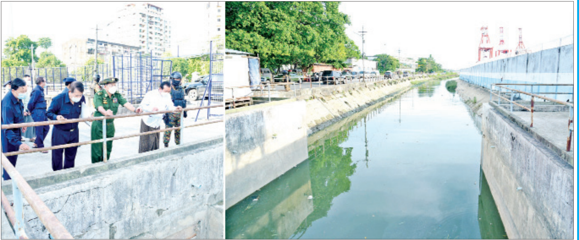
နိုင်ငံတော်စီမံအုပ်ချုပ်ရေးကောင်စီဥက္ကဋ္ဌ၊ တပ်မတော်ကာကွယ်ရေးဦးစီးချုပ် ဗိုလ်ချုပ်မှူးကြီး မင်းအောင်လှိုင် လမ်းမတော်မြို့နယ်ရှိ ရွာသစ်ချောင်း မြစ်ထွက်ပေါက်ကို ကြည့်ရှုစစ်ဆေးစဉ်။