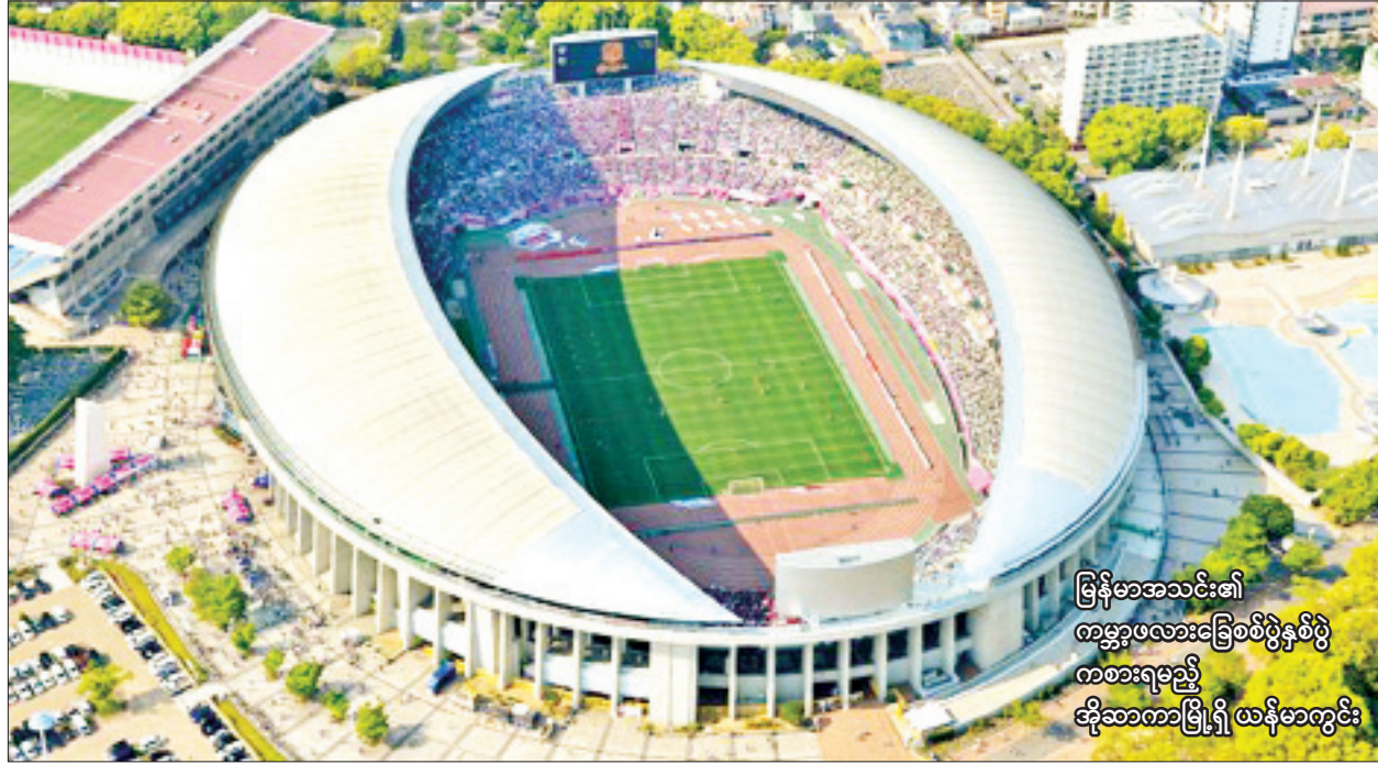
မြန်မာအသင်း၏ ကမ္ဘာ့ဖလားခြေစစ်ပွဲနှစ်ပွဲ ကစားရမည့် ဆိုဘကာမြို့ရှိ ယန်မာကွင်း

မြန်မာနိုင်ငံ ရင်းနှီးမြှုပ်နှံမှုကော်မရှင်၏ (၃/၂၀၂၁)ကြိမ်မြောက်အစည်းအဝေးကို ယနေ့နံနက်ပိုင်းတွင် နေပြည်တော်ရုံးအမှတ် (၁၈) နိုင်ငံတော်စီမံအုပ်ချုပ်ရေးကောင်စီအုပ်ချုပ်မှုရုံး၌ ကျင်းပသည်။ အစည်းအဝေးသို့ နိုင်ငံတော်စီမံအုပ်ချုပ်ရေးကောင်စီအဖွဲ့ဝင်၊ မြန်မာနိုင်ငံရင်းနှီးမြှုပ်နှံမှုကော်မရှင်ဥက္ကဋ္ဌ ဒုတိယဗိုလ်ချုပ်ကြီးမိုးမြင့်ထွန်းနှင့် ကော်မရှင်အဖွဲ့ဝင်များ တက်ရောက်ကြသည်။ စာမျက်နှာ ၃ ကော်လံ ၁ သို့ ☆