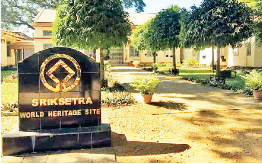
သရေခေတ္တရာ ကမ္ဘာ့အမွေအနှစ်ဒေသ။

ဇုန်အမျိုးအစားသတ်မှတ်ရာတွင် ရှေးဟောင်းအမွေအနှစ်ဇုန် အမျိုးသားအဆင့်အနေဖြင့်