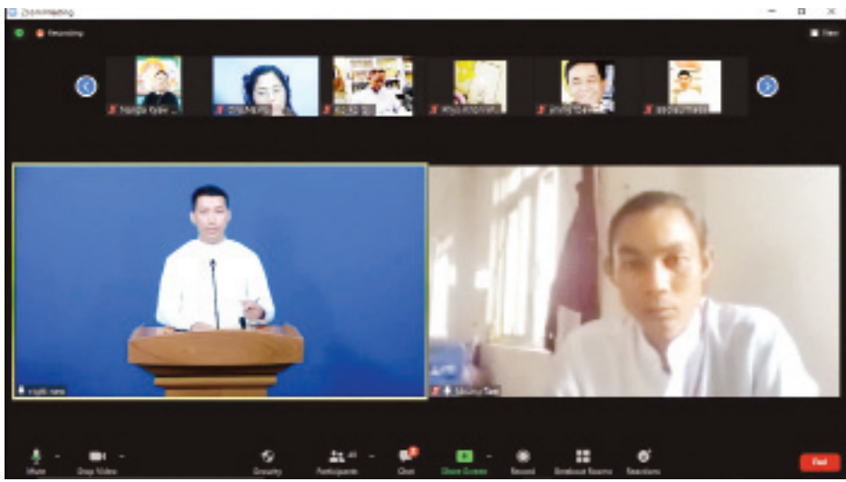
သတင်းထုတ်ပြန်ရေးအဖွဲ့မှ ဗိုလ်မှူး ကောင်းထက်ကိုင်ကိုင်နိုင်ငံတော်စီမံအုပ်ချုပ်ရေးအဖွဲ့ ရှင်းလင်းပြောကြားစဉ်။

နိုင်ငံတော်အစိုးရအနေဖြင့် COVID ကာလအတွင်း COVID ကာကွယ်ရေး စည်းမျဉ်းစည်းကမ်း