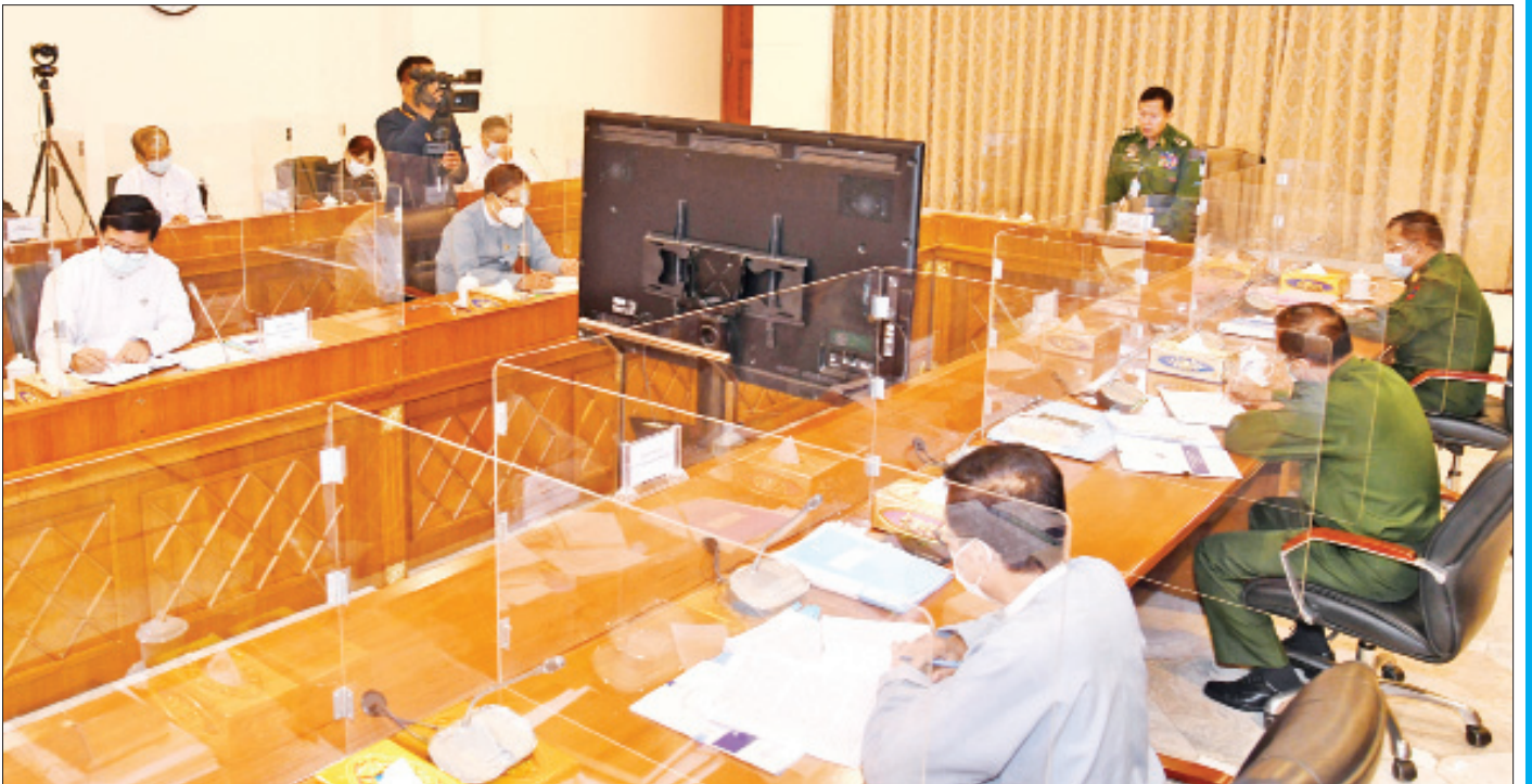
နိုင်ငံတော်စီမံအုပ်ချုပ်ရေးကောင်စီ ဒုတိယဥက္ကဋ္ဌ၊ ဒုတိယတပ်မတော်ကာကွယ်ရေးဦးစီးချုပ် ကာကွယ်ရေးဦးစီးချုပ်(ကြည်း) ဒုတိယဗိုလ်ချုပ်မှူးကြီးစိုးဝင်း ဧပြီ ၂၁ ရက်က ကျင်းပသည့် မြန်မာနိုင်ငံ ကလေးအလုပ်သမားပျောက်ရေးဆိုင်ရာ အမျိုးသားကော်မတီ စတုတ္ထအကြိမ် လုပ်ငန်းညှိနှိုင်းအစည်းအဝေးတွင် အမှာစကားပြောကြားစဉ်။

နိုင်ငံတကာ ကူညီထောက်ပံ့မှုတွေထဲက ဥရောပသမဂ္ဂကဲ့သို့သော အဖွဲ့အစည်းတွေက မြန်မာနိုင်ငံရဲ့ ဖွံ့ဖြိုးတိုးတက်မှုတွေအတွက် ကူညီထောက်ပံ့ပေးနေတဲ့ စီမံကိန်းတွေရှိပါတယ်။ နိုင်ငံတော်စီမံအုပ်ချုပ်ရေး ကောင်စီအနေနဲ့ အကြောင်းအမျိုးမျိုးကြောင့် တွေ့ကြုံနေရတဲ့