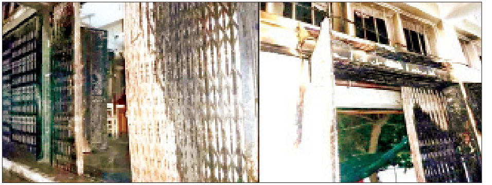
မုံရွာမြို့ရှိ မြန်မာ့စီးပွားရေးဘဏ်အား အကြမ်းဖက်သူများက တာယာကွင်းများဖြင့် မီးရှို့ဖျက်ဆီးခဲ့သည်ကို တွေ့ရစဉ်။

ထိုအတူ ယနေ့ နံနက် ၂ နာရီ ၁၅ မိနစ်တွင် စစ်ကိုင်းတိုင်းဒေသကြီး မုံရွာမြို့ မုံရွာတောင်ရပ်ကွက်ရှိ မြန်မာ့စီးပွားရေးဘဏ်ကို အကြမ်းဖက်သူလူအုပ်စု(စစ်စစ်ဆဲ)က ဘဏ်၏အရှေ့ဝင်ပေါက်နှင့် အနောက်