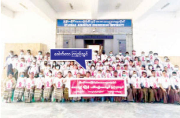
ဒေါက်တာကြည်သွင်(ပါမောက္ခချုပ်)၊ မြန်မာနိုင်ငံလေကြောင်းနှင့် အာကာသပညာတက္ကသိုလ်၊ မိတ္ထီလာမြို့မှ ဦးဆောင်၍ ဆန္ဒ ဖော်ထုတ်နေစဉ်။