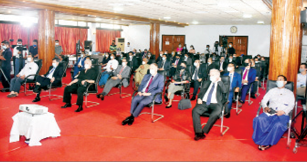
အပြည်ပြည်ဆိုင်ရာ ပူးပေါင်းဆောင်ရွက်ရေးဝန်ကြီးဌာန ပြည်ထောင်စုဝန်ကြီး ဦးကိုကိုလှိုင် မြန်မာနိုင်ငံ၏ လက်ရှိဖြစ်ပေါ်ပြောင်းလဲတိုးတက်မှု အခြေအနေများနှင့်ပတ်သက်၍ ရန်ကုန်မြို့ရှိ သံတမန်များနှင့် ကုလသမဂ္ဂလက်အောက်ခံအဖွဲ့အစည်းများမှ အကြီးအကဲများအား ရှင်းလင်းပြောကြားစဉ်။