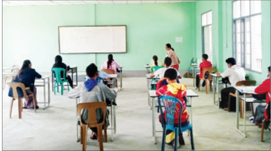
အေးသာယာမြို့နည်းပညာတက္ကသိုလ်တွင် ကျောင်းသား ကျောင်းသူများ ပညာသင်ကြားနေမှုကိုတွေ့ရစဉ်။

တန်ဖိုးရှိလှတဲ့ လူငယ် ဘဝဆိုတာ လှပတဲ့ အနာဂတ်ကို တည် ဆောက်ကြဖို့ပါ။ နိုင်ငံနဲ့ လူမျိုးရဲ့ ကောင်းကျိုး ကိုသာ ရေးရပြန်လုပ် ဆောင်ရွက်ကြရမှာ။