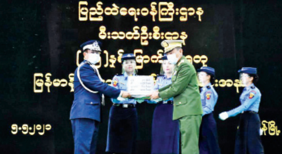
ချီးမြှင့်ခြင်းအစီအစဉ်များ ကျင်းပခဲ့ပြီး ဒုတိယပိုင်း ဆက်က မီးသတ်သမားများ အသုံးပြုခဲ့သည့် ရှေးဟောင်း မီးသတ်ယာဉ်/စက်များ၊ ခေတ်မီ မီးသတ်အစီအစဉ်အဖြစ် စစ်ရေးပြကွင်းတွင် ခေတ်အဆက် ရှေးဟောင်း မီးသတ်ယာဉ်/စက်များ၊ ခေတ်မီ မီးသတ်

နေပြည်တော် မေ ၅ (၇၅)နှစ်မြောက်စိန်ရတု မြန်မာနိုင်ငံမီးသတ်တပ်ဖွဲ့နေ့အခမ်းအနားကို ယနေ့ နံနက်ပိုင်းတွင် ရန်ကုန်တိုင်းဒေသကြီး မရမ်းကုန်းမြို့နယ် အမှတ်(၅)ရပ်ကွက် အုတ်ပုံဆိပ်လမ်း စွယ်တော် မြတ်စေတီအနီးရှိ မြန်မာနိုင်ငံမီးသတ်တပ်ဖွဲ့ဌာနချုပ်ဝင်းအတွင်း၌ ကျင်းပပြုလုပ်ရာ နိုင်ငံတော်စီမံအုပ်ချုပ်ရေးကောင်စီအဖွဲ့ဝင်၊ ပြည်ထဲရေးဝန်ကြီးဌာနနှင့် ပြည်ထောင်စုအစိုးရအဖွဲ့ရုံးဝန်ကြီးဌာန ပြည်ထောင်စုဝန်ကြီး ဒုတိယဗိုလ်ချုပ်ကြီးစိုးထွဋ် တက်ရောက်မိန့်ခွန်း ပြောကြားသည်။ ဂုဏ်ပြုဆုများပေးအပ် အခမ်းအနား ပထမပိုင်းအစီအစဉ်အဖြစ် မြန်မာနိုင်ငံမီးသတ်တပ်ဖွဲ့ဌာနချုပ် သီတာခန်းမ၌ မိန့်ခွန်းပြောကြားခြင်းနှင့် ဂုဏ်ပြုဆုများပေးအပ်