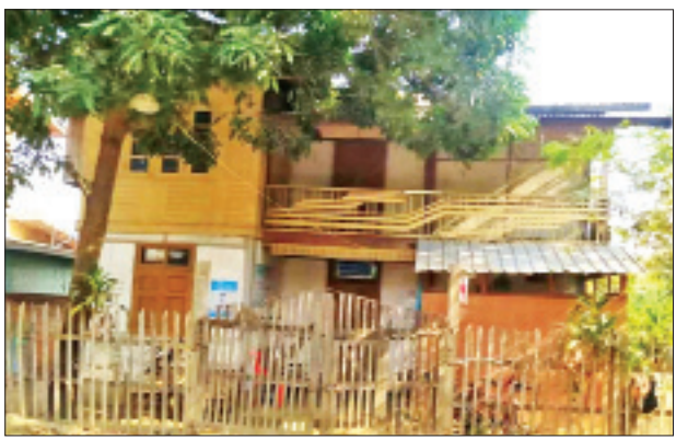
ဒေါက်တာ သက်သက်အောင် (လ/ထ ဆရာဝန်၊ စဉ့်ကူးပြည်သူ့ဆေးရုံ) ဆေးကုသနေသည့် ဆေးခန်းအား တွေ့ရစဉ်။