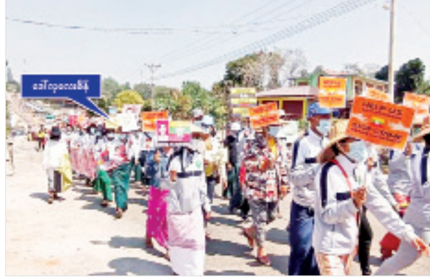
ဒေါ်လှလေးစိန်(အလယ်တန်းပြ၊ အလက(အလယ်ချောင်း)၊ ရွာငံမြို့နယ်)မှ ဦးဆောင်၍ ဆန္ဒဖော်ထုတ်နေစဉ်။