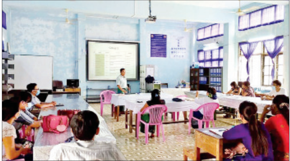
မော်လမြိုင်မြို့နည်းပညာတက္ကသိုလ် ပြန်လည်ဖွင့်လှစ်သင်ကြားနေမှုကို တွေ့ရစဉ်။

□ ပညာရေးဝန်ကြီးဌာနမှ နည်းပညာတက္ကသိုလ်နှင့် ကွန်ပျူတာတက္ကသိုလ် ကျောင်း ၆၀၊ ပညာရေးဒီဂရီကောလိပ် ၂၅ ကျောင်း စုစုပေါင်း ၁၃၄ ကျောင်းတွင် ပါရဂူဘွဲ့ကြိုသင်တန်းများ၊ မဟာဘွဲ့ (ရေးဖြေ)သင်တန်းများ၊ မဟာအရည်အချင်းစစ်သင်တန်းများ၊ ဂုဏ်ထူးတန်း ဒုတိယနှစ်၊ တတိယနှစ် သင်တန်းများ၊ နောက်ဆုံးနှစ် ဘွဲ့ကြိုသင်တန်းများ၊ ဒုတိယနှစ် ပညာရေး ဒီပလိုမာသင်တန်းများ၊ လူ့စွမ်းအားအရင်းအမြစ်ဖွံ့ဖြိုးမှု