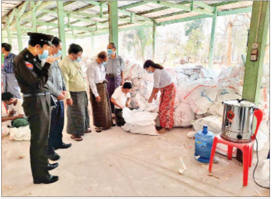
မြို့သစ်မြို့နယ် ဆန္ဒမဲလက်မှတ် မြေပြင်စစ်ဆေးမှု မှတ်တမ်းဓာတ်ပုံ။

၃။ ပြည်ထောင်စုရွေးကောက်ပွဲကော်မရှင်သည် လွှတ်တော်ရွေးကောက်ပွဲဥပဒေပုဒ်မ ၅၃ အရ မကွေးတိုင်းဒေသကြီး၊ မြို့သစ်မြို့နယ်နှင့် မြိုင်မြို့နယ်တို့၏ ပြည်သူ့လွှတ်တော်ရွေးကောက်ပွဲတွင် အသုံးပြုခဲ့သည့် ဆန္ဒမဲလက်မှတ်များ ထုတ်ယူ/ ရရှိ/ သုံးစွဲ/ လက်ကျန်အခြေအနေများကို သက်ဆိုင်ရာမြို့နယ်အလိုက် ယခင် မြို့နယ်ရွေးကောက်ပွဲကော်မရှင်အဖွဲ့ ခွဲဝေပေးခဲ့သည့် အဖွဲ့ဝင်များ၊ မြို့နယ်ရဲတပ်ဖွဲ့မှူး၊ မြို့နယ်လူဝင်မှုကြီးကြပ်ရေးနှင့် ပြည်သူ့အင်အားဦးစီးဌာနဦးစီးမှူး၊ မြို့နယ်အုပ်ချုပ်ရေးမှူးတို့နှင့်အတူ သက်ဆိုင်ရာ မြို့နယ်များရှိ နိုင်ငံရေးပါတီများမှ ကိုယ်စားလှယ်များ၏ ရှေ့မှောက်တွင် မြေပြင်ဖွင့်ဖောက်စစ်ဆေးမှုများ ဆောင်ရွက်ခဲ့ပါသည်။