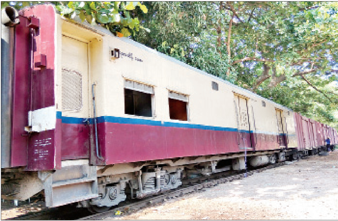
ရန်ကုန်-မန္တလေး အမှတ်(၁)အဆန် စာပို့ရထားအား ရန်ကုန်ဘူတာကြီး၌ တွေ့ရစဉ်။