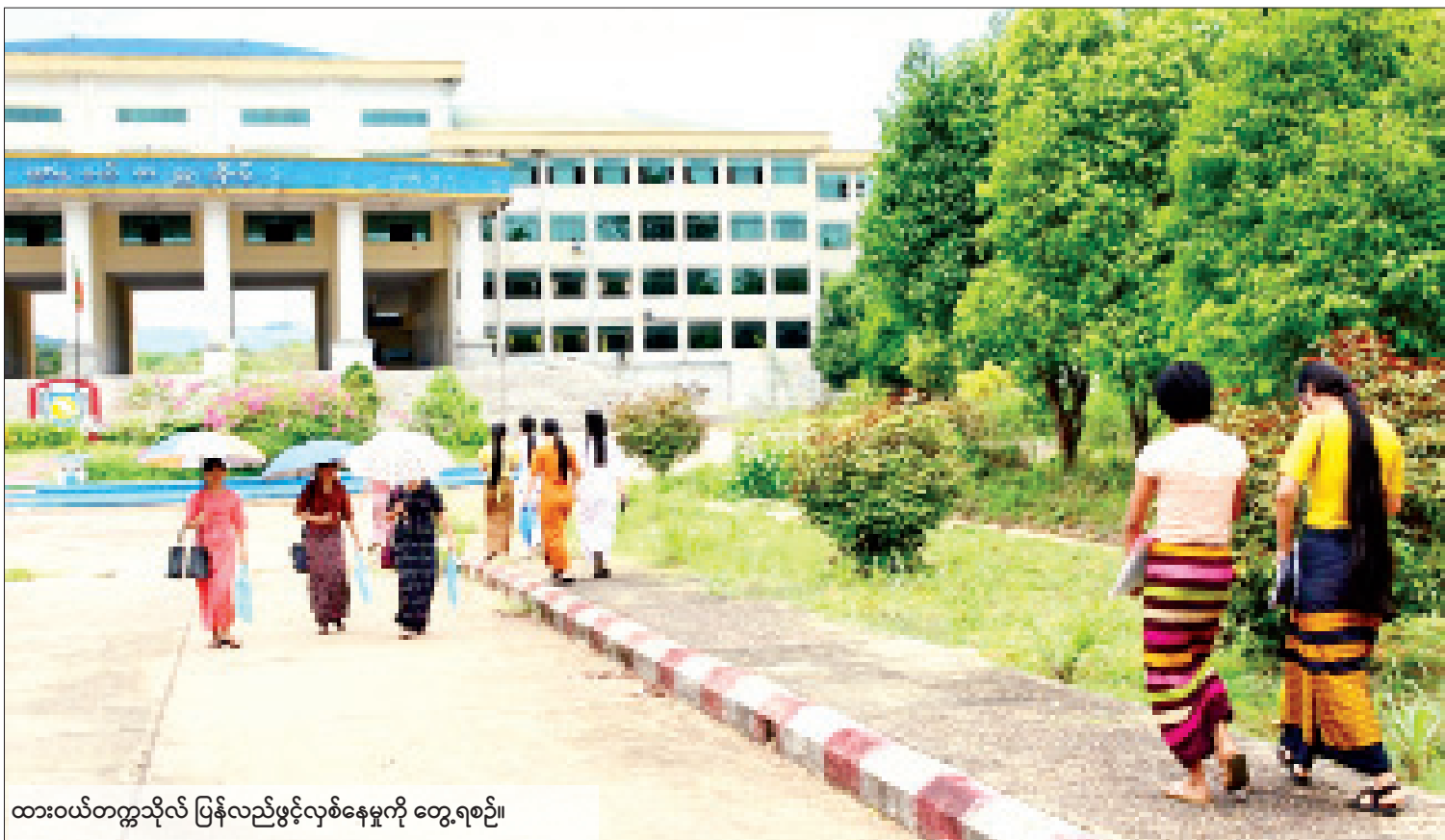
ထားဝယ်တက္ကသိုလ် ပြန်လည်ဖွင့်လှစ်နေမှုကို တွေ့ရစဉ်။

ယင်းသို့ ဖွင့်လှစ်ရာတွင် ပညာရေးဝန်ကြီးဌာန အဆင့်မြင့်ပညာဦးစီးဌာန အောက်ရှိ ဝိဇ္ဇာသိပ္ပံ တက္ကသိုလ်၊ ဒီဂရီကောလိပ်၊ ကောလိပ်(၄၉)ကျောင်း၊ စာမျက်နှာ ၅ ကော်လံ ၁ သို့