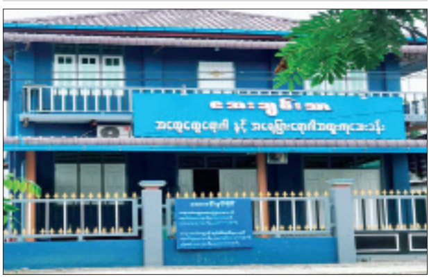
ဒေါက်တာ စိုးမိုးထွေး (ကလေးဗေဒကျန်းမာရေးမှူး) ဆေးကုသနေသည့် “အေးချမ်းသာ”ဆေးခန်းအား တွေ့ရစဉ်။