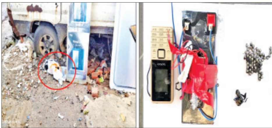
လသာမြို့နယ်၌ လက်လုပ်ပိုင်တစ်လုံး ပေါက်ကွဲမှု

နေပြည်တော် မေ ၄ နိုင်ငံတော်အတွင်း နိုင်ငံတော်ပိုင်အဆောက်အအုံများ၊ အေးချမ်းစွာနေထိုင်လိုသော ပြည်သူလူထုအချို့၏ နေအိမ်များ၊ အများပြည်သူ သွားလာလှုပ်ရှားနေသော လမ်းမကြီးများပေါ်တွင် လက်လုပ်ပုံများ ပစ်ဖောက်ခြင်း၊ ထောင်ထားခြင်းများအား လုပ်ဆောင်လျက်ရှိသည်။