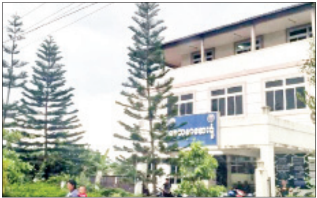
ဒေါက်တာစိုင်းဝန်းလတ်မုန် (လ/ထ ဆရာဝန်၊ ကျိုင်းတုံပြည်သူ့ဆေးရုံ) ကို ဆေးကုသခွင့်ပေးထားသည့် “စေတနာ”ဆေးရုံအား တွေ့ရစဉ်။