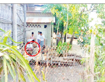
လယ်ဝေးမြို့နယ်၌ ဒုတိယပညာရေးမှူး နေအိမ်အား မီးပုလင်းဖြင့် ပစ်ပေါက်ထားသည်ကို တွေ့ရစဉ်။

မီးပုလင်းများဖြင့်ပစ်ပေါက် ထိုသို့လုပ်ဆောင်လျက်ရှိရာ မေ ၃ ရက် နံနက် ၂ နာရီခွဲတွင် ဧရာဝတီတိုင်းဒေသကြီး မော်လမြိုင် ကျွန်းမြို့နယ် ကျုံလမုကျေးရွာ အခြေခံပညာအထက်တန်းကျောင်းဝင်းအတွင်းရှိ လူနေထိုင်ခြင်းမရှိသည့် နေအိမ်လိုင်းခန်းကို လည်းကောင်း၊ ည ၇ နာရီ ၅၅ မိနစ်တွင် ပဲခူးတိုင်းဒေသကြီး အုတ်တိုင်းမြို့နယ် ပဲခူးလမ်းရပ်ကွက် ရပ်ကွက်စီမံအုပ်ချုပ်ရေးအဖွဲ့ရုံး