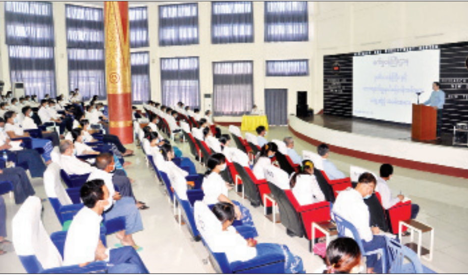
စက်ရုံ၊ အလုပ်ရုံများအား ပုဂ္ဂလိကနှင့် ပူးပေါင်းဆောင်ရွက်ရန် EoI ခေါ်ယူခဲ့သော်လည်း လျှောက်ထားတင်ပြလာသည့် ပုဂ္ဂလိကလုပ်ငန်းရှင်များ မရှိခဲ့ပါကြောင်း၊ အချို့နိုင်ငံပိုင်စက်ရုံ၊ အလုပ်ရုံများကို နိုင်ငံတော်အတွက် အကျိုးရှိအောင် အသုံးချနိုင်မည့် အခြားသင့်လျော်သည့် ဝန်ကြီးဌာနတစ်ခုခုက တောင်းခံလာပါက လွှဲပြောင်းပေးရမည်ဖြစ်ကြောင်း။ ပူးပေါင်းဆောင်ရွက် ထိုသို့ ဆောင်ရွက်ခြင်းဖြင့် ဝန်ထမ်းများအတွက် Management နှင့် Operation System သာ

နေပြည်တော် မေ ၄ စက်မှုဝန်ကြီးဌာန ဒုတိယဝန်ကြီး ဦးကိုကိုလွင်သည် ယနေ့တွင် ပဲခူးတိုင်းဒေသကြီး ရေတာရှည်မြို့နယ် သာဂရစက်မှုနယ်မြေရှိ အမှတ်(၃) စက်မှုသင်တန်းကျောင်း(သာဂရ) အစည်းအဝေးခန်းမ၌ အမှတ်(၁၄) အကြီးစားစက်ရုံ၊ အမှတ်(၁၅)အကြီးစားစက်ရုံနှင့် အမှတ်(၂၆) အကြီးစားစက်ရုံတို့မှ ဝန်ထမ်းများနှင့် တွေ့ဆုံသည်။ စက်မှုကဏ္ဍဖွံ့ဖြိုးတိုးတက်ရေး တွေ့ဆုံစဉ် စက်မှုဝန်ကြီးဌာနအနေဖြင့် စက်မှုကဏ္ဍဖွံ့ဖြိုးတိုးတက်ရေးအတွက် သုတေသနများ ပြုလုပ်ခြင်း၊ စံချိန်စံညွှန်းများရေးဆွဲခြင်း၊ ဓာတ်ခွဲခန်းများ ထူထောင်ခြင်း၊ စက်မှုဇုန်များဖွံ့ဖြိုးရေးနှင့် စက်မှုလုပ်ငန်းများ ကြီးကြပ်စစ်ဆေး ဆောင်ရွက်ခြင်းဖြင့် Regulatory Body အဖြစ် ရပ်တည်နိုင်ရေး စီမံဆောင်ရွက်လျက်ရှိကြောင်း၊ နိုင်ငံပိုင် စီးပွားရေးလုပ်ငန်းများကို တဖြည်းဖြည်း လျှော့ချ၍ ပုဂ္ဂလိကကဏ္ဍဖွံ့ဖြိုးတိုးတက်ရေးအတွက် Private Public Partnership-PPP အဖြစ် အသွင်ကူးပြောင်းဆောင်ရွက်လျက်ရှိကြောင်း၊ သာဂရစက်မှုနယ်မြေရှိ