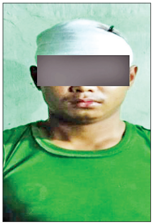
တရားခံ စွမ်းခန့်သူ

ရန်ကုန်တိုင်းဒေသကြီး လှိုင်သာယာမြို့နယ်၊ ရွှေပြည်သာမြို့နယ်၊ ဒဂုံမြို့သစ် (မြောက်ပိုင်း)မြို့နယ်၊ ဒဂုံမြို့သစ်(တောင်ပိုင်း)မြို့နယ်၊ ဒဂုံမြို့သစ်(ဆိပ်ကမ်း)မြို့နယ်နှင့် မြောက်ဥက္ကလာပမြို့နယ်တို့တွင် အထည်ချုပ်စက်ရုံများ၊ အခြေခံပညာအထက်တန်းကျောင်းများနှင့် ရပ်ကွက်အုပ်ချုပ်ရေးမှူးရုံးများအား မီးရှို့ဖျက်ဆီးခြင်း၊ မီးငြိမ်းသတ်မှု မဆောင်ရွက်နိုင်ရန် တားဆီးနေသည့်ယှက်မှုများ ဆောင်ရွက်သည့်အပြင် အကြမ်းဖက်မှုများကိုပါ ဆောင်ရွက်လာသဖြင့် စစ်အုပ်ချုပ်ရေးအမိန့် ( Martial Law) အား မတ် ၁၄ ရက်နှင့် ၁၅ ရက်တို့တွင် ထုတ်ပြန်ကြေညာခဲ့သည်။ စစ်အုပ်ချုပ်ရေးအမိန့်ထုတ်ပြန်ကြေညာထားသည့်