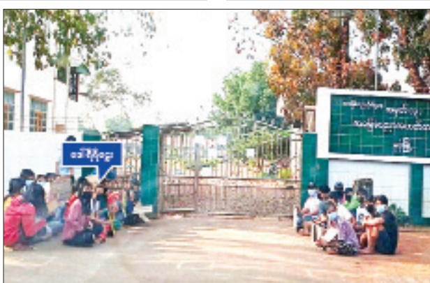
ဒေါ်ရီရီဌေး (အလယ်တန်းပြ၊ အထက-၃၊ မုဒုံမြို့)မှ ဦးဆောင်၍ ဆန္ဒဖော်ထုတ်နေစဉ်။