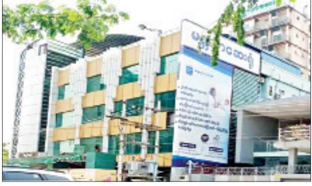
ဒေါက်တာအိမ်မွန်ကိုကို (အထူးကု၊ ပုသိမ်ကြီးပြည်သူ့ဆေးရုံ)ကို ဆေးကုသခွင့်ပေးထားသည့် “မန္တလာ”ဆေးရုံအား တွေ့ရစဉ်။