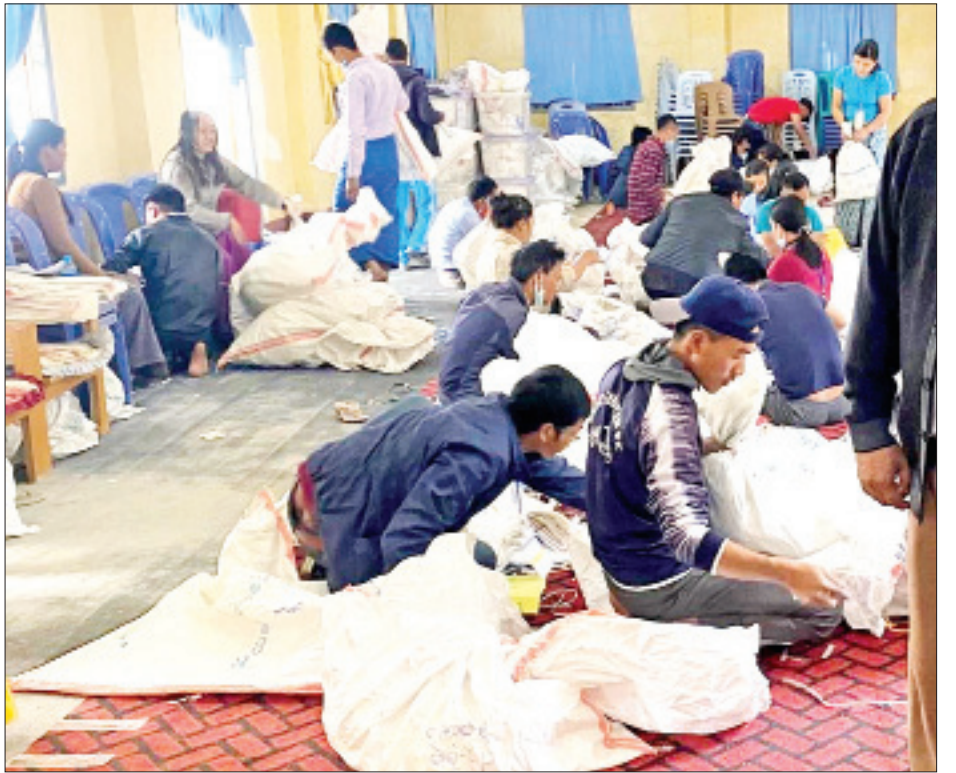
တီးတိန်မြို့နယ် ဆန္ဒမဲလက်မှတ် မြေပြင်စစ်ဆေးမှု မှတ်တမ်းဓာတ်ပုံ။

၆။ မဲရုံများအလိုက် မဲလက်မှတ်အပိုများနှင့် ပျောက်ဆုံးနေမှုများတွေ့ရှိရပြီး ရပ်ကွက်/ ကျေးရွာအုပ်စုအလိုက် မဲလက်မှတ်အရေအတွက် ၂၇၄၈ ပျောက်ဆုံးနေပြီး ၁၅၆ စောင် ပိုသုံးထားကြောင်း တွေ့ရှိရသည်။ မြို့နယ် ကြိုတင်မဲလက်မှတ်တွင် ထုတ်ယူရရှိခဲ့သော ဆန္ဒမဲလက်မှတ်အရေအတွက် ၁၇၁၊ မဲပေးအသုံးပြုခဲ့သော လက်မှတ်ဖြတ်ပိုင်းများမှာ ၁၀၇ ဖြစ်ပြီး မြေပြင်လက်ကျန်တွင် ၆၀ တွေ့ရှိရသောကြောင့် ၄ စောင် ပျောက်ဆုံးနေကြောင်း တွေ့ရှိရသည်။ မြို့နယ်ရွေးကောက်ပွဲကော်မရှင်အဖွဲ့ခွဲတွင် ကျန်ရှိရမည့်လက်ကျန်အရေအတွက် ၄၇၀၀ ဖြစ်ပြီး မြေပြင်စစ်ဆေးချက်တွင် ၄၇၀၀ ကျန်ရှိနေသောကြောင့် ကိုက်ညီမှုရှိကြောင်း