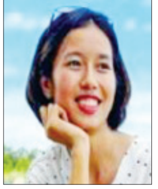
ဒေါက်တာအိမ်မွန်ကိုကို