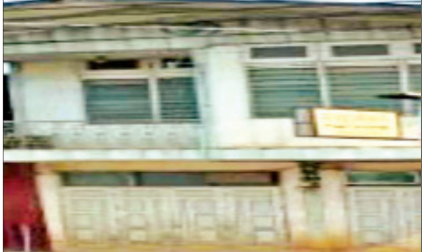
ဒေါက်တာစင်မာလတ် (လ/ထဆရာဝန်၊ မိုးကုတ်ပြည်သူ့ဆေးရုံ) ဆေးကုသနေသည့် ဆေးခန်းအား တွေ့ရစဉ်။