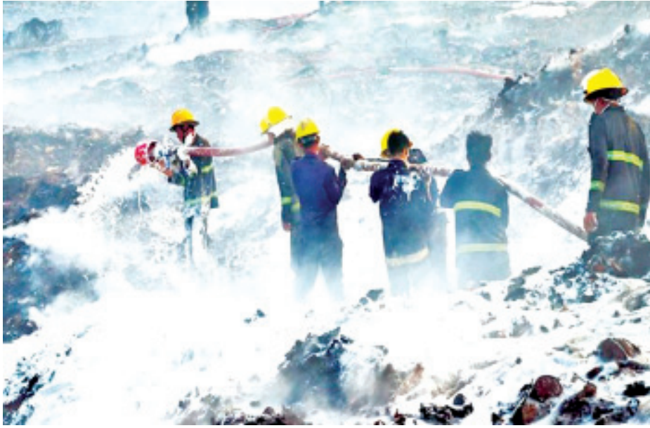
၂၁-၄-၂၀၁၈ ရက်နေ့ ရန်ကုန်တိုင်းဒေသကြီး လှိုင်သာယာမြို့နယ် ထိန်ပင်အမှိုက်ပုံ မီးလောင်မှုအား မီးသတ်တပ်ဖွဲ့က ငြိမ်းသတ်နေမှုမြင်ကွင်း။