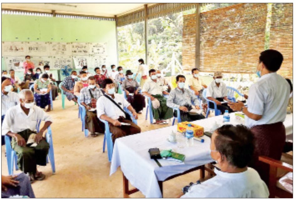
ခေတ်မီနည်းပညာများ အသုံးပြုနိုင်ရေး၊ လယ်ယာသုံးစက်ကိရိယာများ အသုံးပြုမှု ပိုမိုဖွံ့ဖြိုးလာရေး၊ ကျေးရွာကုန်ထုတ်လမ်းများ ဖောက်လုပ်ရေးနှင့် လျှပ်စစ်ဓါတ်ရရှိရေးလုပ်ငန်းများ ထည့်သွင်းဆောင်ရွက်သွားမည်ဖြစ်ကြောင်း၊ ဆည်၏ အထက်ဘက်ရေအဝင်လမ်းတစ်လျှောက်ရှိ ပေပင်ကျေးရွာနှင့် သရက်ချောင်းကျေးရွာများတွင် မြေဆီလွှာပြုန်းတီးမှုသက်သာစေရန် နှစ်ရှည်ပင်များ စိုက်ပျိုးထူထောင်ပေးခြင်း၊ စနစ်တကျ စိုက်ပျိုးသော အလေ့အကျင့်ကောင်းများ ပညာပေးခြင်းကို သက်ဆိုင်ရာဌာနများနှင့် ပူးပေါင်းဆောင်ရွက်သွားမည်ဖြစ်ကြောင်း သိရသည်။ ညီညီသန်း(နေပြည်တော်)

သတ်မှတ်ရေး၊ သတ်မှတ်ထားသည့် သီးနှံအမျိုးအစားများမှ မိမိနှစ်သက်ရာ ရွေးချယ်စိုက်ပျိုးရေး၊ မျိုးစေ့ပျိုးပင်များ အသုံးပြုနိုင်ရေး၊ ရာသီအလိုက် စိုက်ပျိုးမည့် အစီအစဉ်များနှင့် ရာသီအလိုက် ဆောင်ရွက်သွားမည့် အစီအစဉ်များကို ရှင်းလင်းဆွေးနွေးကြသည်။ ချောင်းမငယ် ရေလျှော်တံဆံ့နှင့် ရုံးပင်သစ်တောကြီးပိုင်း ဧရိယာဝန်းကျင်တွင် သီးနှံသစ်တော ရောနှောစိုက်ခင်းထူထောင်သွားမည်ဖြစ်ရာ အဆိုပါဒေသရှိ ကျေးရွာများမှ တောင်သူများအား စိုက်ပျိုးနည်းပညာ သင်တန်းငါးကြိမ်နှင့် ဆွေးနွေးပွဲငါးကြိမ် ဆောင်ရွက်ပေးသွားမည်ဖြစ်ကြောင်း၊ ယနေ့ကျင်းပသည့် ပထမအကြိမ် သင်တန်းနှင့် ဆွေးနွေးပွဲတွင် သက်ဆိုင်ရာ ပညာရှင်များက ပို့ချဆွေးနွေးကြမည်ဖြစ်ကြောင်း၊ နှစ်ရှည်ပင် သီးနှံများအဖြစ် ကော်ဖီ၊ ငှက်ပျော၊ သရက်၊ ပိန္နဲများထည့်သွင်းဆောင်ရွက်သွားမည်ဖြစ်ပြီး လိုအပ်သော မျိုးစေ့ပျိုးပင်နှင့် နည်းပညာများကို အနီးကပ်ဆောင်ရွက်ပေးသွားမည်ဖြစ်ကြောင်း သိရသည်။ အဆိုပါစီမံကိန်းတွင် ချောင်းမငယ်ရေလျှော်တံဆံ့ဧရိယာရှိ ကျေးလက်နေပြည်သူများ လူမှုအဆင့်အတန်းမြင့်မားရေး၊ ဒေသနေ တောင်သူလယ်သမားများ၏ စိုက်ပျိုးထုတ်လုပ်မှု လုပ်ငန်းများတွင်