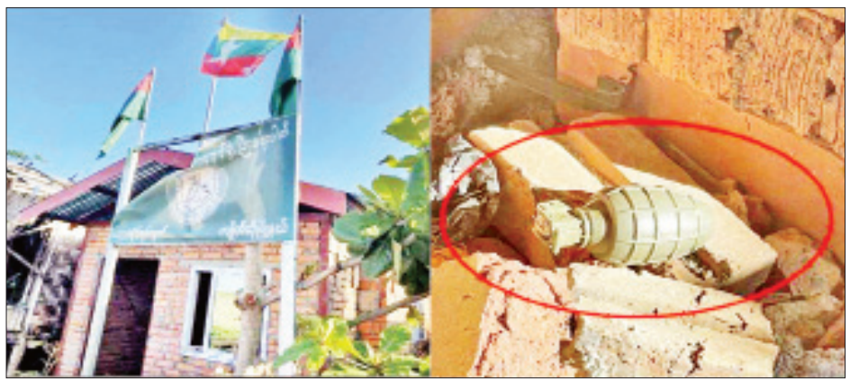
ကျိုက်ထိုမြို့၌ လက်ပစ်မိုင်း တစ်လုံးတွေ့ရှိမှု မှတ်တမ်းဓာတ်ပုံ။

အထက်ပါဖြစ်စဉ်များမှ အကြမ်းဖက်မှုလုပ်ရပ်များကို ကျူးလွန်သူများအား ဥပဒေနှင့်အညီ ထိရောက်စွာအရေးယူနိုင်ရေး လုံခြုံရေးတပ်ဖွဲ့ဝင်များက စုံစမ်းဖော်ထုတ်လျက်ရှိကြောင်း သိရသည်။ သတင်းစဉ်