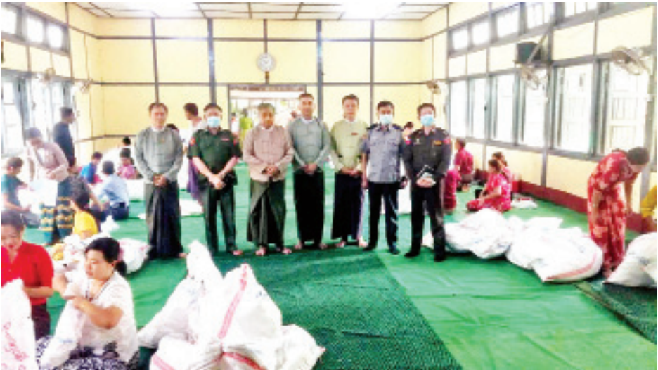
ရေးမြို့နယ် ဆန္ဒမဲလက်မှတ် မြေပြင်စစ်ဆေးမှုမှတ်တမ်းဓာတ်ပုံ။