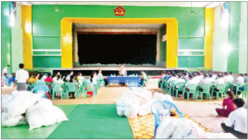
မုဒုံမြို့နယ် ဆန္ဒမဲလက်မှတ် မြေပြင်စစ်ဆေးမှုမှတ်တမ်းဓာတ်ပုံ။

၆။ မုဒုံမြို့နယ်၊ ရပ်ကွက်/ကျေးရွာအုပ်စု ၁၂ အုပ်စုရှိ မဲရုံးများတွင် မဲလက်မှတ်အရေအတွက် ၁၆၃၅ ပျောက်ဆုံးနေပြီး ရပ်ကွက်/ကျေးရွာအုပ်စု ၅ အုပ်စုရှိ မဲရုံးများတွင် မဲလက်မှတ်အရေအတွက် ၄၄၀ ပိုမိုနေ သည်ကို စစ်ဆေးတွေ့ရှိရပါသည်။ မြို့နယ်ရွေးကောက်ပွဲကော်မရှင်အဖွဲ့ခွဲတွင် ကျန်ရှိရမည့် မဲလက်မှတ် အရေအတွက် ၁၁၈၆၅ ဖြစ်သော်လည်း မြေပြင်တွင် ၁၂၀၆၈ ကျန်ရှိနေသဖြင့် မဲလက်မှတ် ၂၀၃ စောင် ပိုနေသည်ကို စစ်ဆေးတွေ့ရှိရပါသည်။