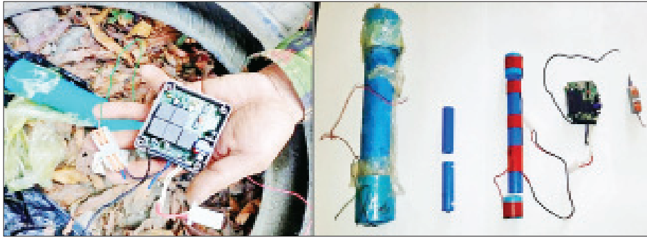
ကလေးမြို့၌ မပေါက်ကွဲသေးသည့် လက်လုပ်မိုင်း တစ်လုံးတွေ့ရှိမှု မှတ်တမ်းဓာတ်ပုံ။

နေပြည်တော် မေ ၃ နိုင်ငံတော်အတွင်း ဆူပူအကြမ်းဖက်သူလူအုပ်စုများ အနေဖြင့် နိုင်ငံတော်ပိုင်အဆောက်အအုံများ၊ အေးချမ်းစွာနေထိုင်လိုသော ပြည်သူ့လူထုအချို့၏ နေအိမ်များ၊ အများပြည်သူ သွားလာလှုပ်ရှားနေသော လမ်းမကြီးများနှင့် နိုင်ငံတော်ပိုင် အဆောက်အအုံများကို လက်လုပ်ပျက်စီးမှုများ ပစ်ဖောက်ခြင်း၊ ထောင်ထားခြင်း၊ မီးကွင်း၊ မီးပုလင်းများဖြင့် ပစ်ပေါက်ခြင်း၊ မီးရှို့ဖျက်ဆီးခြင်းများ လုပ်ဆောင်လျက်ရှိသည်။