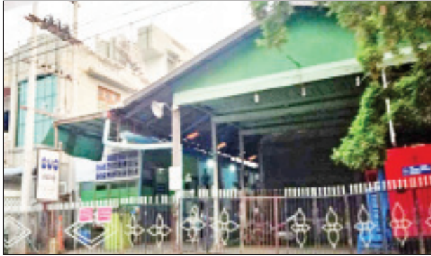
ဒေါက်တာသဲတုဇေ (အထူးကျ၊ ရွှေဘိုပြည်သူ့ဆေးရုံ) ကို ဆေးကုသခွင့်ပေးထားသည့် “မေခ” ဆေးရုံအား တွေ့ရစဉ်။