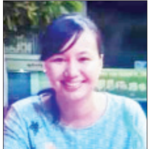
ဒေါက်တာသဲတုဇေ