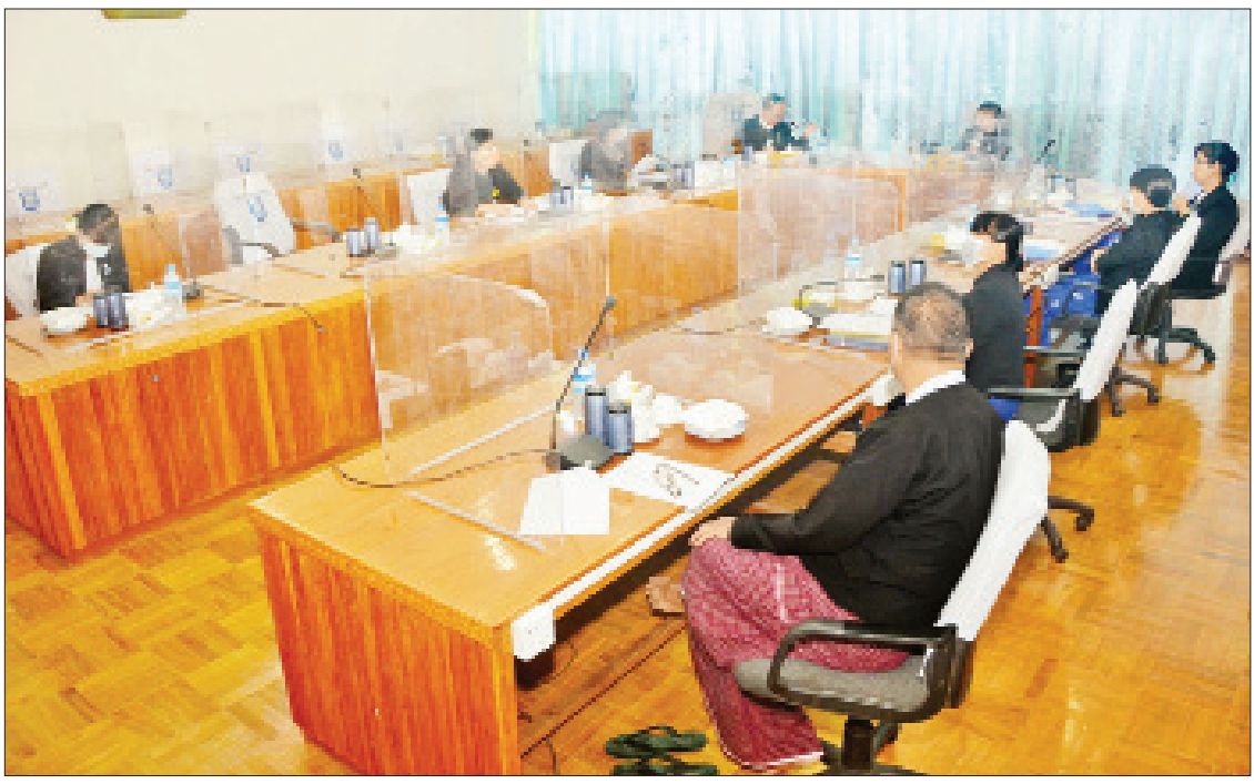
များနှင့် ဆန့်ကျင်မှုမရှိသည့်အပြင် လတ်တလော ပြဋ္ဌာန်းရန်လိုအပ်သည့် ဥပဒေဖြစ်ကြောင်း၊ လတ်တလော ပြဋ္ဌာန်းရန်သင့်သည့် အခြားဥပဒေများနှင့် စပ်လျဉ်း၍လည်း ယခုကဲ့သို့ အစည်း အဝေးများကို ဆက်လက်ပြုလုပ် သွားမည်ဖြစ်ကြောင်း ပြောကြားသည်။ ညှိနှိုင်းဆွေးနွေး ထို့နောက် အစည်းအဝေးသို့ တက်ရောက်လာကြသည့် ပြည်ထောင်စု ရှေ့နေချုပ်ရုံးမှ တာဝန်ရှိသူများနှင့် ပြည်ထောင်စုတရားလွှတ်တော်ချုပ်ရုံးမှ သတင်းစဉ် တာဝန်ရှိသူများက တရားမကျင့်ထုံး ဥပဒေကို ပြင်ဆင်သည့်ဥပဒေပုဒ်မ ၈၉-က (မူကြမ်း)နှင့်စပ်လျဉ်း၍ အသေး စိတ် ညှိနှိုင်းဆွေးနွေးကြကြောင်း သိရသည်။

တာဝန်ထမ်းဆောင်နေသည့် ဆရာ ဆရာမ များကို ထုတ်နုတ်ပြီး ပြည်ထောင်စုရှေ့နေ ချုပ်ရုံးသို့ ပူးပေါင်း၍ ဥပဒေများ အမြန်ဆုံး ပြဋ္ဌာန်းနိုင်ရေး ဆောင်ရွက်ရန်” ဟု လမ်းညွှန်ချက်အရ သက်ဆိုင်ရာ ပြည်ထောင်စုအဆင့်ဌာန၊ အဖွဲ့အစည်း များမှ တာဝန်ရှိသူများနှင့် မတ် ၉ ရက် တွင် ပြည်ထောင်စုရှေ့နေချုပ်ရုံး အစည်း အဝေးခန်းမ၌ တွေ့ဆုံဆွေးနွေးခဲ့ပြီး လတ်တလော ပြဋ္ဌာန်းသင့်သည့် ဥပဒေ ကြမ်းများစာရင်းကို နိုင်ငံတော်စီမံအုပ် ချုပ်ရေးကောင်စီအုပ်ချုပ်မှုရုံးသို့ တင်ပြ ခဲ့ကြောင်း။ တရားမကျင့်ထုံးဥပဒေကို ပြင်ဆင် သည့်ဥပဒေ(မူကြမ်း)မှာ တရားမကျင့်ထုံး ဥပဒေပုဒ်မ ၈၉-က ကို ဖြည့်စွက်ခြင်းဖြစ် ပြီး ပြည်ထောင်စုတရားလွှတ်တော်ချုပ် ရုံး၊ တရားစီရင်ရေးလုပ်ငန်းစဉ်၏ သီးခြား ဖြစ်သော အငြင်းပွားမှုများအကြား ချစ်ကြည်ရင်းနှီးစွာဖြင့် အငြင်းပွားမှု ဖြေရှင်းခြင်း နည်းလမ်းတစ်ရပ်အဖြစ် Mediation လုပ်ငန်းစဉ် ထူထောင်ရန် အတွက် လိုအပ်ချက်ဖြစ်ပြီး နိုင်ငံတော်က ချမှတ်ထားသော မူဝါဒများ၊ ဦးတည်ချက်