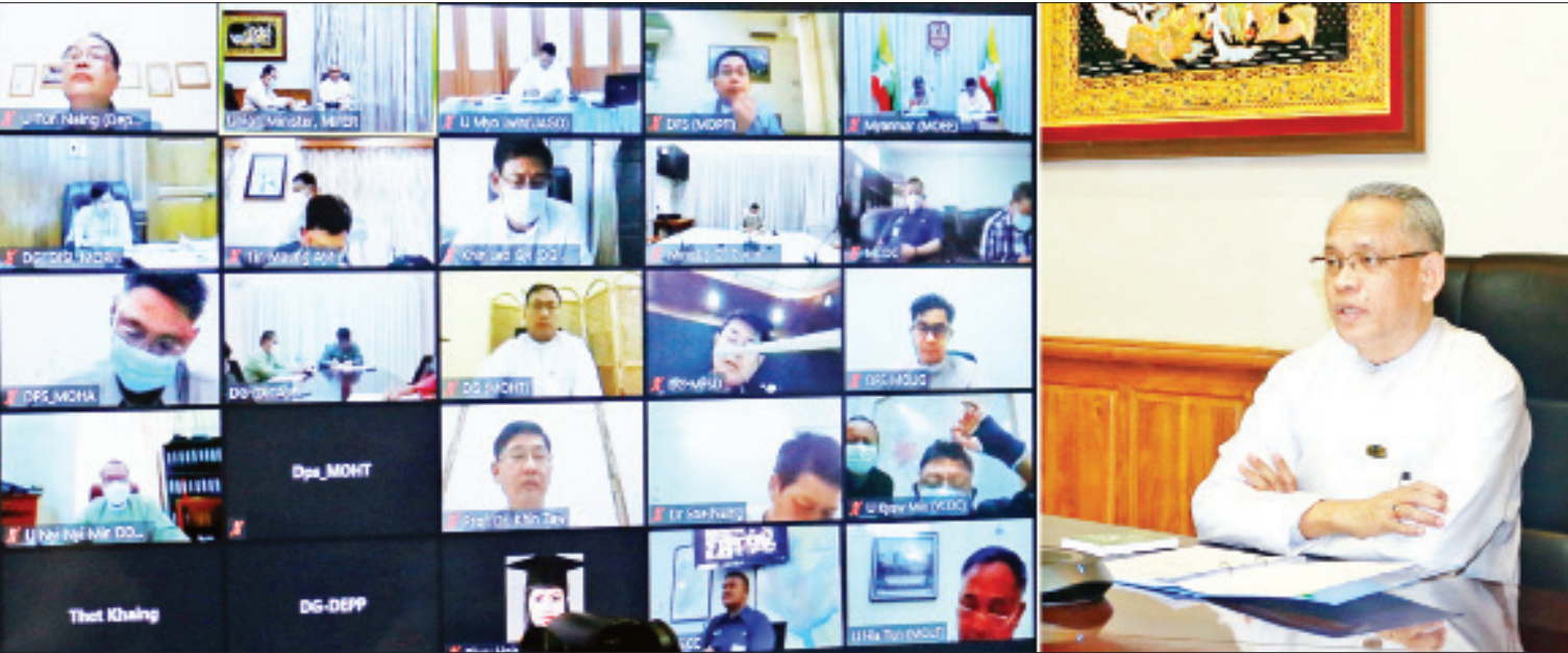
ပြည်ထောင်စုဝန်ကြီး ဦးအောင်နိုင်ဦး ရင်းနှီးမြှုပ်နှံမှုနှင့်သက်ဆိုင်သည့် စီးပွားရေးဆိုင်ရာလိုင်စင်၊ ပါမစ်၊ ထောက်ခံချက်များ ပြန်လည်သုံးသပ်ခြင်း အစည်းအဝေးတွင် အမှာစကားပြောကြားစဉ်။

မြောက် ယနေ့ ဖတ်စရာ အားလုံးပါဝင်ပြီး ရေရှည်တည်တံ့သော ကျေးလက်ဒေသဖွံ့ဖြိုးရေး လုပ်ငန်းများဖြစ်စေရန် ကျေးရွာလူငယ်များကိုယ်တိုင် ထိန်းသိမ်းစီမံနိုင်ရေး ကြိုးပမ်းရန် လိုအပ် စာမျက်နှာ » ၄