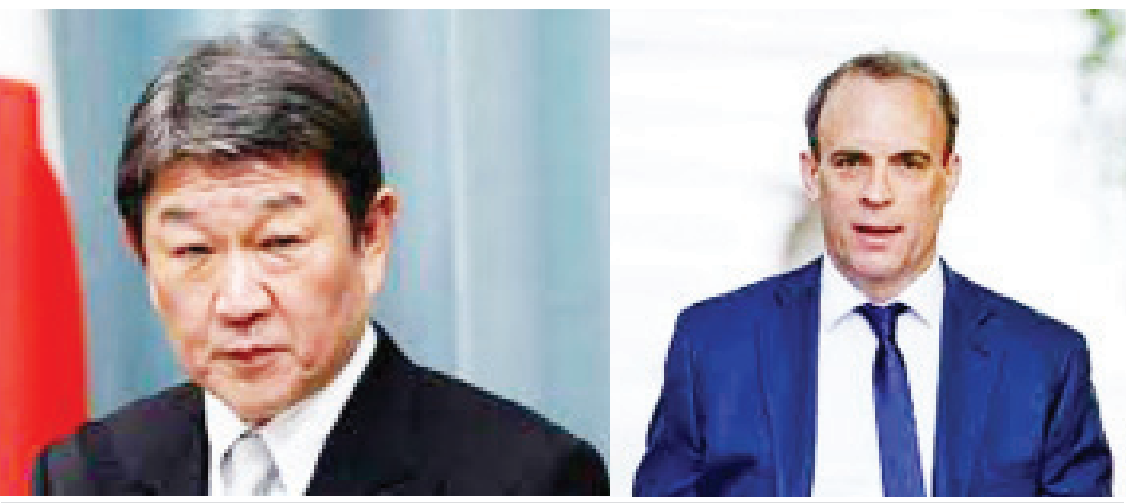
ဂျပန်နိုင်ငံခြားရေးဝန်ကြီး မိုတိုဂီနှင့် ဗြိတိန်နိုင်ငံခြားရေးဝန်ကြီး ဒိုမိနစ်ခရော့တ်

ဆက်ဆံရေးတိုးမြှင့်ရန် ကြိုးပမ်းလုပ် ဆောင်နေစဉ် မိုတိုဂီနှင့် ဒိုမိနစ်ခရော့တ်တို့ ယခုကဲ့သို့ တွေ့ဆုံဆွေးနွေးခဲ့ကြခြင်း ဖြစ်သည်။ နှစ်နိုင်ငံ နိုင်ငံခြားရေး ဝန်ကြီးတို့၏ ယနေ့ မျက်နှာချင်းဆိုင် တွေ့ဆုံဆွေးနွေးမှုသည် ၂၀၂၀ ပြည့်နှစ် ဩဂုတ်လနောက်ပိုင်း ပထမအကြိမ် မြောက် တွေ့ဆုံမှုဖြစ်သည်။ ဗြိတိန်နိုင်ငံသည် အင်ဒို-ပစိဖိတ် ဒေသတွင် တက်တက်ကြွကြွ ပါဝင် မည်ဟု ဗြိတိန်အစိုးရက ၎င်း၏ နိုင်ငံခြား ရေးနှင့် ကာကွယ်ရေးမူဝါဒသုံးသပ်ချက် ထဲတွင် ပြီးခဲ့သည့်မတ်လက ဖော်ပြထား သည်။ ဗြိတိန်အစိုးရသည် အင်ဒို-ပစိဖိတ် ဒေသရှိ ၎င်း၏ ရေတပ်ဖြန့်ဖြူးမှုကို အင်အားတိုးမြှင့်ရန်အလို့ငှာ Queen Elizabeth အမည်ရှိ လေယာဉ်တင် သင်္ဘောဦးဆောင်သော တိုက်ခိုက်ရေး လေယာဉ်တင်သင်္ဘောအုပ်စု တစ်စုကို