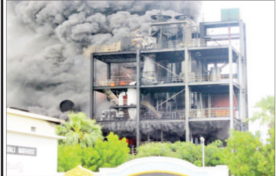
၂-၈-၂၀၁၂ ရက်နေ့ မကွေးတိုင်းဒေသကြီး ချောက်မြို့ ဟိုက်ဒရိုဂျင်ပါအောက်ဆိုက်စက်ရုံ မီးလောင်မှုအားတွေ့ရစဉ်။

မီးသည် ၂၈ နာရီ၊ ၉ နာရီအထိ ဆက်လောင် နေခဲ့ပြီး “ဘူတာရုံကမီး ထူပါရုံမှာပြီး လူတကာ ကုန်အောင်တီး”ဟု အဆိုရှိခဲ့၏။ မြို့အနောက်ဘက် ဘူတာနားမှ မီးစတင်လောင်မှုသည် မြို့အရှေ့ဘက် ထောင့်ရှိ ထူပါရုံဘုရားရောက်မှသာ ငြိမ်းသွားခဲ့ သည်။ အကြောင်းမှာ လောင်စရာအိမ်မရှိသော ကြောင့် ဖြစ်သည်။ စာမျက်နှာ ၂၅ သို့ ❁