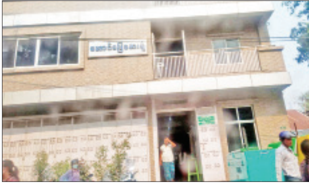
ဒေါက်တာလင်းအောင်ထက် (အထူးကျ၊ ရွှေဘိုပြည်သူ့ဆေးရုံ) ကို ဆေးကုသခွင့်ပေးထားသည့် “အောင်မြေ” ဆေးရုံအား တွေ့ရစဉ်။