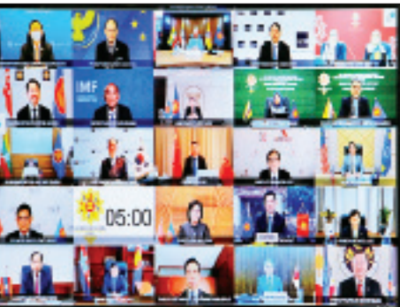
လာကြသည့် အာဆီယံ+၃ ဘဏ္ဍာရေးဝန်ကြီးများနှင့် ဗဟိုဘဏ်ဥက္ကဋ္ဌများက မိမိတို့နိုင်ငံများအလိုက် ကိုဗစ်-၁၉ ကြောင့်ဖြစ်ပေါ်လာသည့် လတ်တလော စီးပွားရေးအခြေအနေနှင့် စီးပွားရေးအပေါ် သက်ရောက်မှုများကို အနည်းဆုံးဖြစ်စေရန်နှင့် စီးပွားရေးပြန်လည် ဦးမော့မှုရရှိရေးအတွက် မဟာဗျူဟာမြောက် တုံ့ပြန်ဆောင်ရွက်ချက်များနှင့် စပ်လျဉ်း၍ အမြင်ချင်းဖလှယ်ဆွေးနွေးကြသည်။ ဆက်လက်၍ အာဆီယံ+၃ ငွေကြေးရေး ပူးပေါင်းဆောင်ရွက်မှုဆိုင်ရာ ကိစ္စရပ်များဖြစ်သည့် ချင်းမိုင်အစီအစဉ်တွင် နိုင်ငံများပါဝင်ခြင်း သဘောတူစာချုပ် (Chiang Mai Initiative Multilateralization -CMIM Agreement) အကောင်

အထည်ဖော်မှု၊ အာဆီယံ+၃ မေခရိုစီးပွားရေး သုတေသနရုံး (ASEAN+3 Macroeconomic Research Office-AMRO)၏ လုပ်ငန်းတိုးတက်မှု၊ အာရှငွေချေးစာချုပ်ဈေးကွက်အစီအစဉ် (Asian Bond Markets Initiatives-ABMI) အကောင် အထည်ဖော်ဆောင်ရွက်မှု၊ အာဆီယံ+၃ ငွေကြေး ကြေးပူးပေါင်းဆောင်ရွက်မှု (ASEAN+3 Finance Process) အကောင်အထည်ဖော် ဆောင်ရွက်မှု တို့နှင့်စပ်လျဉ်း၍ ဆွေးနွေးခဲ့ကြပြီး ရှေ့ဆက်လက် ဆောင်ရွက်ရမည့် လုပ်ငန်းစဉ်များအပေါ် လမ်းညွှန် မှုများ ပေးခဲ့ကြသည်။ သဘောတူညီခဲ့ကြ ယင်းနောက် (၂၄) ကြိမ်မြောက် အာဆီယံ+၃ ဘဏ္ဍာရေးဝန်ကြီးများနှင့် ဗဟိုဘဏ်ဥက္ကဋ္ဌများ အစည်းအဝေး (24 th AFMGM+3)၏ ပူးတွဲ ကြေညာချက် (Joint Statement) ကို အပြီးသတ် ဆွေးနွေးခဲ့ကြသည်။ ထို့နောက် ၂၀၂၂ ခုနှစ် အာဆီယံ+၃ ဘဏ္ဍာရေးဝန်ကြီးများနှင့် ဗဟိုဘဏ် ဥက္ကဋ္ဌများအစည်းအဝေးကို သီရိလင်္ကာနိုင်ငံ ကိုလံဘိုမြို့တွင် ကျင်းပရန် သဘောတူညီခဲ့ကြ ကြောင်း သိရသည်။ သတင်းစဉ်