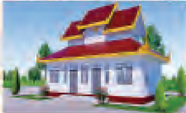
ဆင်းတုခန်း (ဘေရန်)၊ ဘေရန်၊ ဘီရူး