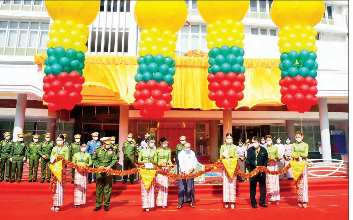
ပြည်ထောင်စုဝန်ကြီး ဦးချစ်နိုင်၊ ရန်ကုန်မြို့တော် စည်ပင်သာယာရေးကော်မတီဥက္ကဋ္ဌ မြို့တော်ဝန် ဦးဗိုလ်ဌေး၊ မြန်မာစီးပွားရေးကော်ပိုရေးရှင်းဥက္ကဋ္ဌ ဒုတိယဗိုလ်ချုပ်ကြီးညိုစောတို့က မြဝတီမီဒီယာစင်တာအား ဖဲကြိုးဖြတ်ဖွင့်လှစ်ပေးကြစဉ်။

ကလေးဆေးရုံကြီးကို တည်ဆောက်ဖွင့်လှစ်ခဲ့ခြင်း ဖြစ်ကြောင်း။ စက်ပစ္စည်းများကိုလည်း Brand ကောင်းသည့် စက်ပစ္စည်းကိရိယာများနှင့် အနည်းဆုံး(၁၀)နှစ်ခန့် အထိ ခေတ်မီနေနိုင်မည့် Technology မြင့်သည့် စက်ပစ္စည်းကြီးများကို တပ်ဆင်အသုံးပြုနိုင်ရန်စီစဉ် ဆောင်ရွက်ပေးနိုင်ခဲ့ကြောင်း၊ ထို့အပြင် လူနာများ အတွက် ဘေးကင်းလုံခြုံစိတ်ချရမှု (Patient Safety) ပိုင်းနှင့် အရည်အသွေးကောင်းမွန်မှု (Hospital Quality) ပိုင်းများတွင် ယုံကြည်စိတ်ချရသည့် နိုင်ငံတကာအသိအမှတ်ပြု ဆေးရုံတစ်ခုအဖြစ် ရပ်တည်ဆောင်ရွက်နိုင်ရေးအတွက် International Patient Safety Goals (IPS Goals) (၆)ချက်ကို အခြေခံကာ ကမ္ဘာ့အသိအမှတ်ပြုဆေးရုံလက်မှတ် Joint Commission International (JCI) လက်မှတ်ရရှိနိုင်ရေးကိုလည်း ဆောင်ရွက်သွားမည် ဖြစ်ကြောင်း၊ မိမိအနေဖြင့် ဆေးရုံစတင်အကောင် အထည်ဖော်ချိန်မှစ၍ ဆေးရုံသုံးစက်ပစ္စည်းကိရိယာ များ တပ်ဆင်ဆောင်ရွက်စဉ်ကာလတွင်လည်း အကြိမ်ကြိမ် လာရောက်စစ်ဆေးခဲ့ပြီး မှာကြားမှုများ ပေးခဲ့ကြောင်း။ စာမျက်နှာ ၅ သို့ ❖