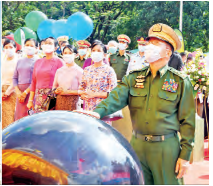
နိုင်ငံတော်စီမံအုပ်ချုပ်ရေးကောင်စီဥက္ကဋ္ဌ တပ်မတော်ကာကွယ်ရေးဦးစီးချုပ် ဗိုလ်ချုပ်မှူးကြီးမင်းအောင်လှိုင် မြဝတီမီဒီယာစင်တာအား စက်ခလုတ်နှိပ်ဖွင့်လှစ်ပေးစဉ်။