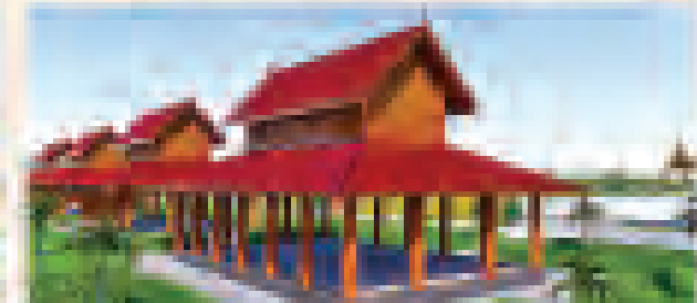
ဆင်းတုခန်း(ဘေရန်)၊ ဘေရန်၊ ဘီရူး

ထိုင်းနိုင်ငံတွင် ဆင်းတုဆက်ပွားခန်းရုံများ တည်ဆောက်ပူဇော်ခြင်းအတွက် အထောက်အကူပြုရန်အတွက် အဖွဲ့အစည်းများအား အားပေးခြင်းအဖြစ် ဆောင်ရွက်ခဲ့ပါသည်။ ထိုအဖွဲ့အစည်းများမှာ အောက်ဖော်ပြပါအတိုင်းဖြစ်ပြီး အဖွဲ့အစည်းများ၏ အဖွဲ့အစည်းများကို အားပေးခြင်းအဖြစ် ဆောင်ရွက်ခဲ့ပါသည်။