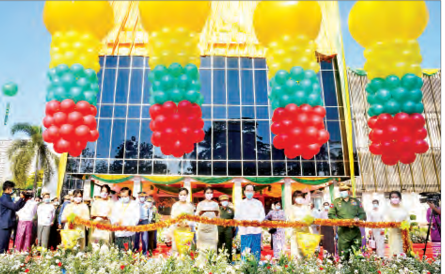
ပြည်ထောင်စုဝန်ကြီး ဒေါက်တာသက်ခိုင်ဝင်း၊ ရန်ကုန်တိုင်းဒေသကြီး စီမံအုပ်ချုပ်ရေးကောင်စီဥက္ကဋ္ဌ ဦးလှစိုး၊ မြန်မာစီးပွားရေးကော်ပိုရေးရှင်းဥက္ကဋ္ဌ ဒုတိယဗိုလ်ချုပ်ကြီးညိုစောတို့က မိုးကောင်းရတနာ မိခင်နှင့် ကလေးဆေးရုံအား ဖဲကြိုးဖြတ် ဖွင့်လှစ်ပေးကြစဉ်။