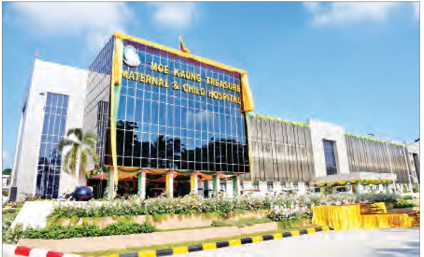
မိုးကောင်းရတနာ မိခင်နှင့်ကလေးဆေးရုံအဆောက်အအုံကို တွေ့ရစဉ်။

မိုးကောင်းရတနာ မိခင်နှင့် ကလေးဆေးရုံ ဖွင့်ပွဲ အခမ်းအနား ပုံရိပ်များ