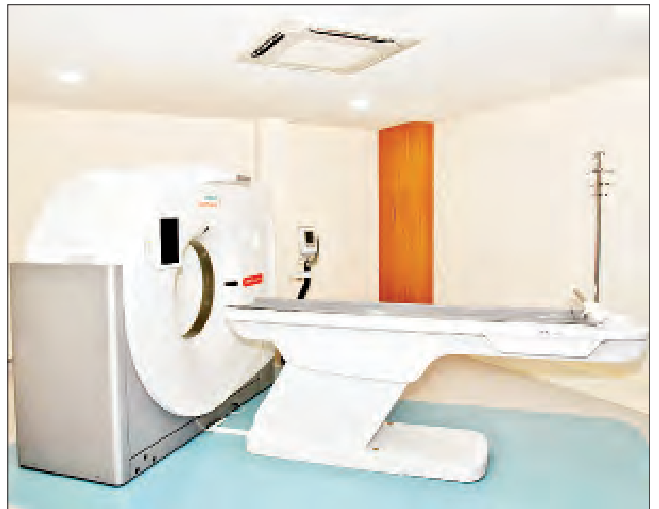
ကွန်ပျူတာဓာတ်မှန်စက်ကို တွေ့ရစဉ်။