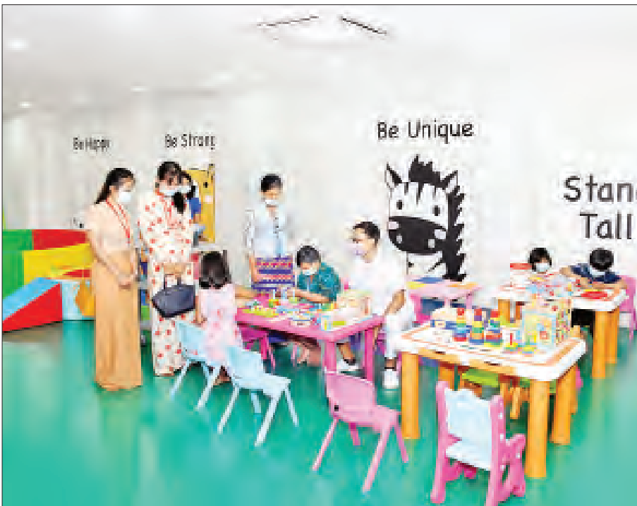
ကလေးငယ်များအတွက် ကစားကွင်းကို တွေ့ရစဉ်။