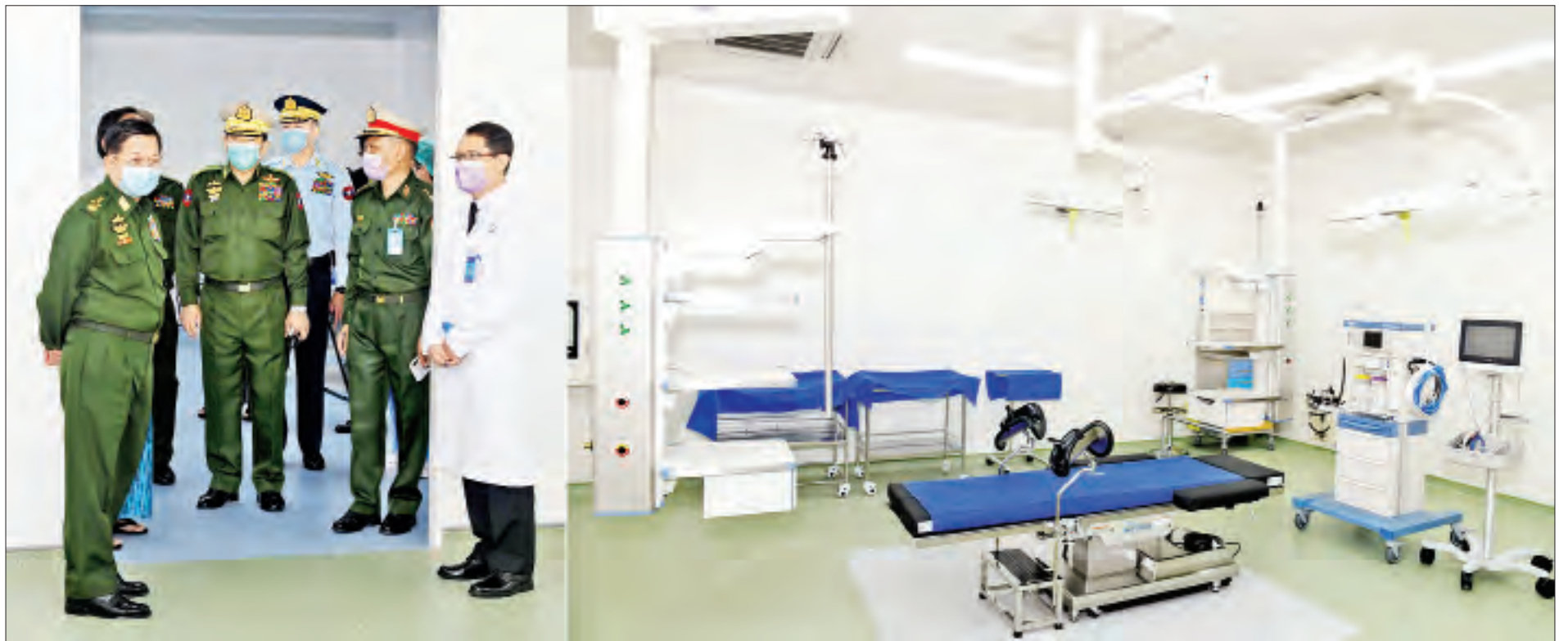
နိုင်ငံတော်စီမံအုပ်ချုပ်ရေးကောင်စီဥက္ကဋ္ဌ တပ်မတော်ကာကွယ်ရေးဦးစီးချုပ် ဗိုလ်ချုပ်မှူးကြီးမင်းအောင်လှိုင် မိုးကောင်းရတနာ မိခင်နှင့် ကလေးဆေးရုံအတွင်း လှည့်လည်ကြည့်ရှုစဉ်။

★ ရှေ့ဖုံးမှ တပ်မတော်အရာရှိကြီးများ၊ ရန်ကုန်တိုင်းစစ်ဌာနချုပ် တိုင်းမှူး ဗိုလ်ချုပ်ညွှန်ဝင်းဆွေ၊ ဖိတ်ကြားထားသည့် ဧည့်သည်တော်များနှင့် တာဝန်ရှိသူများ တက်ရောက်ကြသည်။