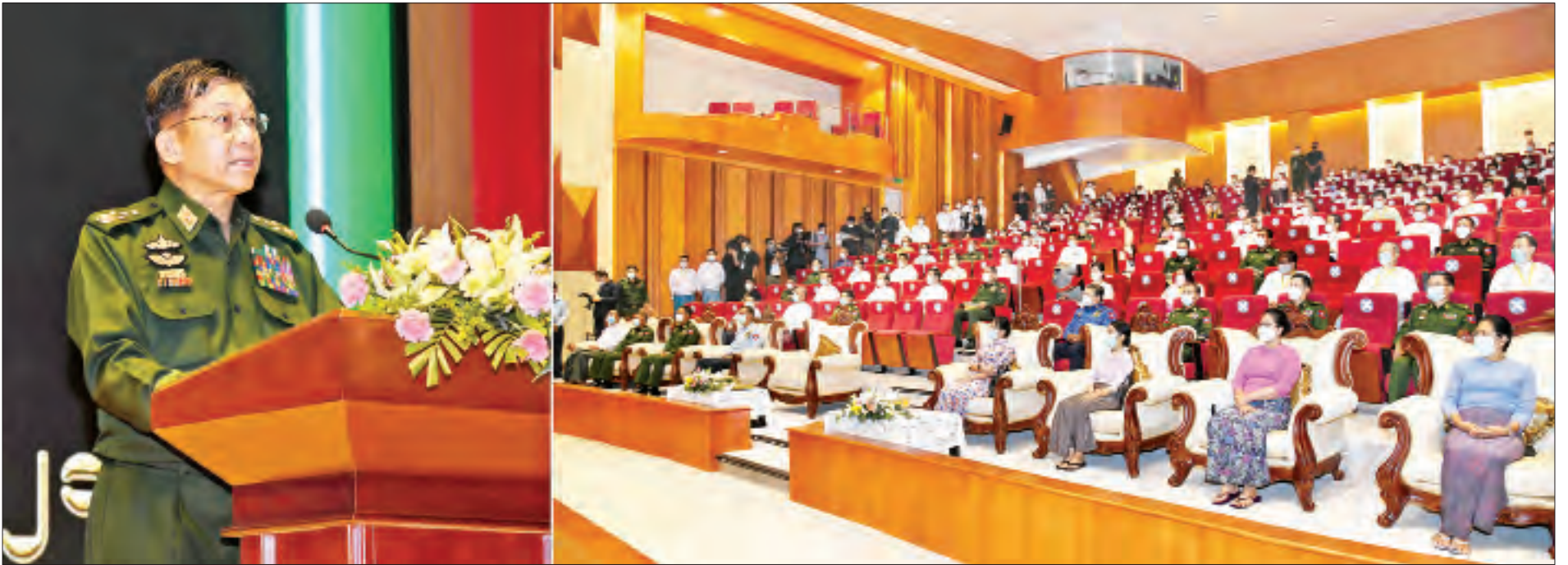
နိုင်ငံတော်စီမံအုပ်ချုပ်ရေးကောင်စီဥက္ကဋ္ဌ တပ်မတော်ကာကွယ်ရေးဦးစီးချုပ် ဗိုလ်ချုပ်မှူးကြီးမင်းအောင်လှိုင် မိုးကောင်းရတနာ မိခင်နှင့်ကလေးဆေးရုံနှင့် မြဝတီမီဒီယာစင်တာဖွင့်ပွဲတွင် အမှာစကား ပြောကြားစဉ်။