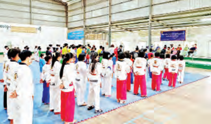
ခရိုင် (ပြန်/ ဆက်)

ထို့နောက် ၂၀၂၁ ခုနှစ် ပြင်ဦးလွင် မြို့နယ်အတွင်း မေ ၂ ရက်မှ ၃၀ ရက် အထိ ဖွင့်လှစ်သည့် နွေရာသီအခြေခံ အားကစားနည်းများဖြစ်သည့် ကရာတေး၊ GYM၊ ရိုးရာလက်ဝှေ့၊ ဘော်လီဘော၊ စားပွဲတင်တင်းနစ်၊ တိုက်ကွမ်ဒို၊ ဘောလုံး၊ ဖူဆယ်၊ Myanmar Fitness Dance တင်းနစ်၊ ကြက်တောင်၊ မြန်မာသိုင်း စသည့် အားကစားနည်း ၁၂ မျိုးကို တတ်ကျွမ်းသည့် ပညာရှင်များဖြင့် ကျန်းမာရေးညွှန်ကြားချက်များနှင့်အညီ စနစ်တကျ သင်ကြားပို့ချသွားမည်ဖြစ် ကြောင်း သိရသည်။