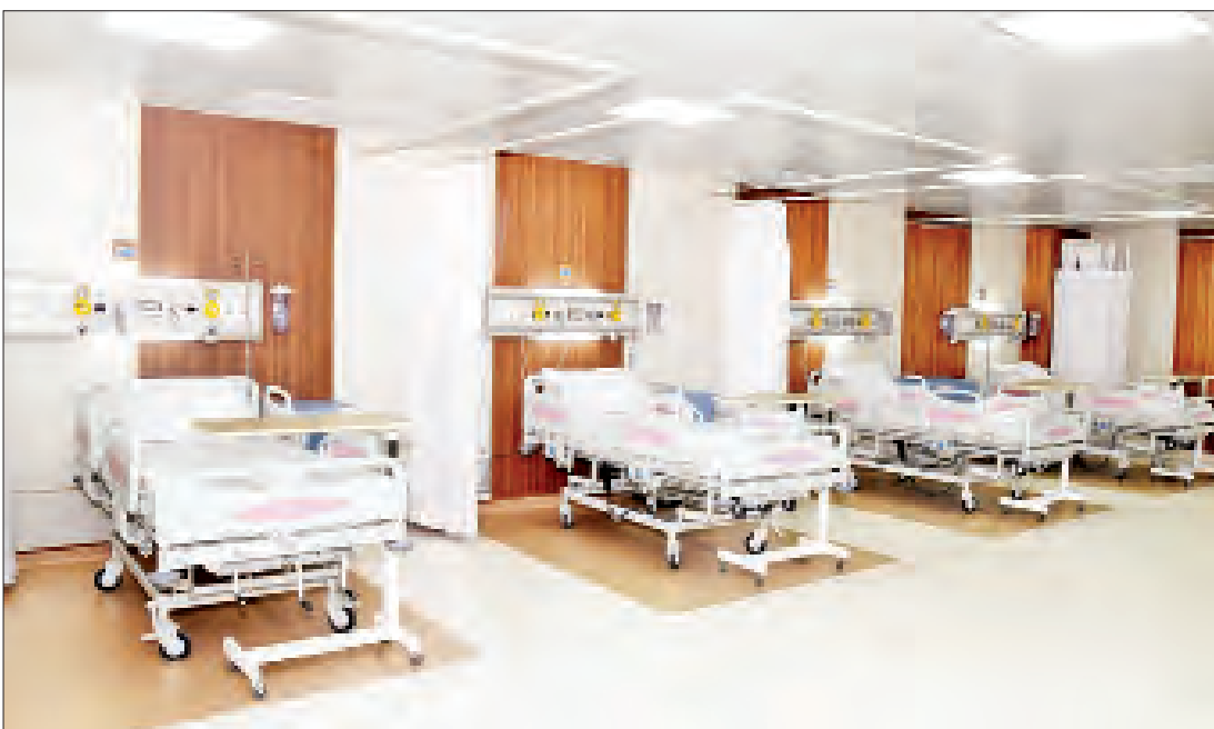
လူနာခုတင်များကို တွေ့ရစဉ်။