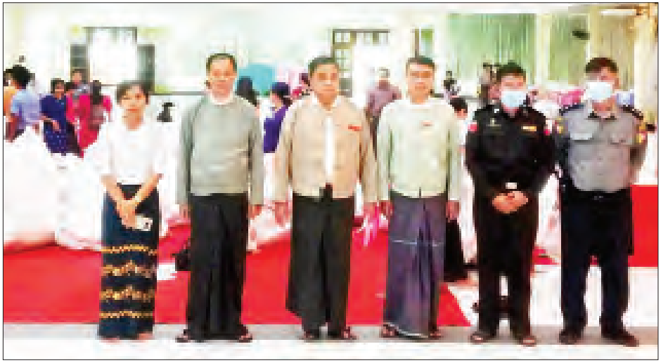
မော်လမြိုင်မြို့နယ် ဆန္ဒမဲလက်မှတ် မြေပြင်စစ်ဆေးမှု မှတ်တမ်းဓာတ်ပုံ။