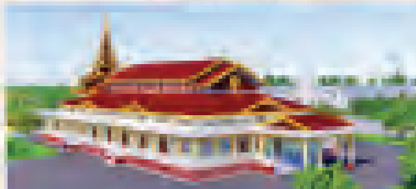
ဆင်းတုခန်း(ဘေရန်)၊ ဘေရန်၊ ဘီရူး