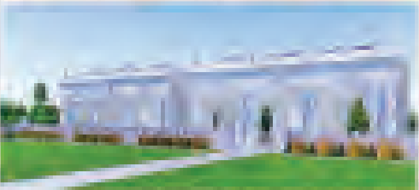
မြန်မာ့အလင်းစာပေအိမ်၊ ဘေရန်၊ ဘီရူး၊ ဘီရူး၊ ဘီရူး