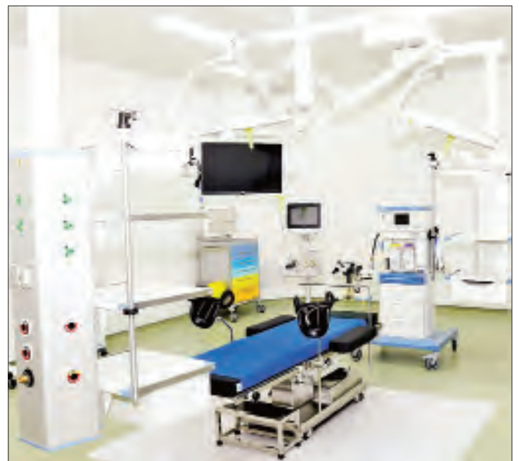
ခွဲစိတ်ခန်းကို တွေ့ရစဉ်။