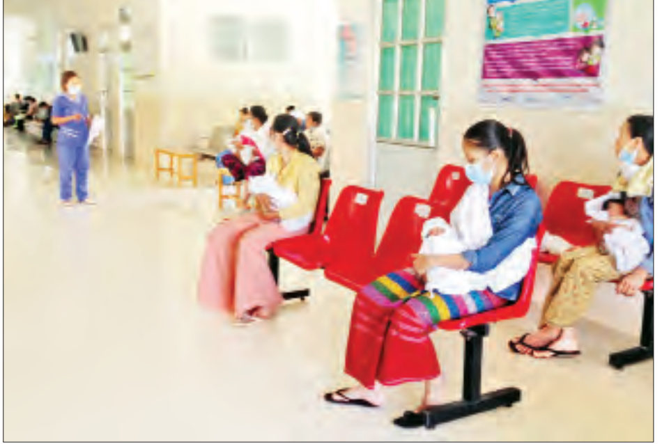
ဆောင်စောင့်ရှောက်မှု (အဟောင်း) များအား ကြည့်ရှု ပေးရာ၌ တစ်ရက်လျှင် ၇၅ ဦးမှ ၈၀ ခန့်အထိ လည်းကောင်း၊ သောကြာနေ့တိုင်းတွင် မွေးပြီးမိခင် များနှင့်မီးယပ်ရောဂါဝေဒနာရှင်များအား စောင့်ရှောက် ခြင်း ဆောင်ရွက်ပေးရာ၌ တစ်ရက်လျှင် ၄၀ ခန့် လည်းကောင်း လာရောက်ကုသဆောင်ရွက်လျက် ရှိပြီး အရေးပေါ်လူနာများအတွက် ပိတ်ရက်မရှိ ၂၄ နာရီ ကျန်းမာရေးစောင့်ရှောက်မှုပေးခြင်း များ ဆောင်ရွက်လျက်ရှိကြောင်း သိရသည်။ ခရိုင်(ပြန်/ဆက်)

အဆိုပါ သားဖွားမီးယပ်ရောဂါအထူးကု ဆေးရုံကြီး(နေပြည်တော်)သို့ နေပြည်တော်အတွင်းရှိ ပြည်သူများသာမက နေပြည်တော်နှင့် ဆက်စပ်နေ သည့် တိုင်းဒေသကြီး/ပြည်နယ်များမှ ဆေးဝါးကုသ လိုသူများကလည်း လာရောက်၍ ဆေးဝါးကုသမှုခံယူ လျက်ရှိကြောင်းနှင့် အပတ်စဉ်တနင်္လာနေ့တိုင်း ကိုယ်ဝန်ဆောင်စောင့်ရှောက်မှု (အသစ်)အား ကြည့်ရှုကုသပေးလျက်ရှိရာ တစ်ရက်လျှင် ၇၅ ဦး ခန့်လည်းကောင်း၊ ဗုဒ္ဓဟူးနေ့တိုင်းတွင် ကိုယ်ဝန်