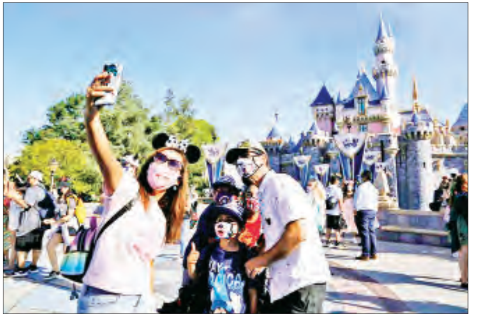
ကာကွယ်ဆေးအလုံးရေ ၁၂၇ သန်း၊ Moderna အလုံးရေ ၈ ဒသမ ၂ သန်းတို့ကို ထိုးနှံပေးပြီး ကိုဗစ်-၁၉ ရောဂါ ကာကွယ်ဆေးအလုံးရေ ၁၀၄ သန်းနှင့် Janssen ကိုဗစ်-၁၉ ရောဂါ ကာကွယ်ဆေး အလုံးရေ ၈ ဒသမ ၂ သန်းတို့ကို ထိုးနှံပေးပြီး ဖြစ်ကြောင်း သိရသည်။ ကိုးကား- ဆင်ဟွာ ဘာသာပြန်- အောင်ကျော်ကျော်

လက်ရှိအချိန်အထိ နိုင်ငံအတွင်း၌ အရေးပေါ် သုံးစွဲခွင့်ပြုထားသော ကာကွယ်ဆေးသုံးမျိုးဖြစ်သည့် အမေရိကန်ဆေးဝါးကုမ္ပဏီနှင့် ၇၂၀ နီဆေးဝါး ကုမ္ပဏီတို့ ပူးပေါင်းထုတ်လုပ်သည့် Pfizer ကိုဗစ်-၁၉ ရောဂါကာကွယ်ဆေး၊ အမေရိကန်ဆေးဝါး ကုမ္ပဏီမှထုတ်လုပ်သည့် Moderna ကိုဗစ်-၁၉ ရောဂါ ကာကွယ်ဆေးနှင့် Johnson & Johnson ဆေးဝါးကုမ္ပဏီမှ ထုတ်လုပ်သည့် ကိုဗစ်-၁၉ ရောဂါ ကာကွယ်ဆေး Janssen တို့ကို အသုံးပြုလျက်ရှိသည်။ အမေရိကန်နိုင်ငံ၌ Pfizer ကိုဗစ်-၁၉ ရောဂါ