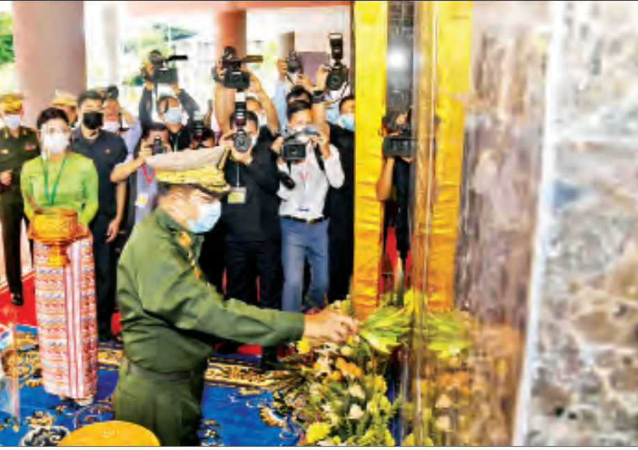
နိုင်ငံတော်စီမံအုပ်ချုပ်ရေးကောင်စီဥက္ကဋ္ဌ တပ်မတော်ကာကွယ်ရေးဦးစီးချုပ် ဗိုလ်ချုပ်မှူးကြီး မင်းအောင်လှိုင် မြဝတီမီဒီယာစင်တာ ကမ္ဘာ့မော်ကွန်းအား အမွှေးနံ့သာရည်ပက်ဖျန်းပေးစဉ်။

အနေဖြင့် အရေးကြီးသည့် အခန်းကဏ္ဍကို ရောက်ရှိ လာကြောင်း၊ မြဝတီမီဒီယာစင်တာတွင် ရုပ်ရှင်၊ သဘင်၊ ဂီတအနုပညာရှင်များ၊ ပုဂ္ဂလိက မီဒီယာ ကုမ္ပဏီများသည် နိုင်ငံတော်အကျိုးပြုနိုင်ရေး အတွက် အဆင့်မြင့်တင်ကွန်ရက်ပေါင်းစည်း ဆောင်ရွက်နိုင်ရန်ဖြစ်ကြောင်း။