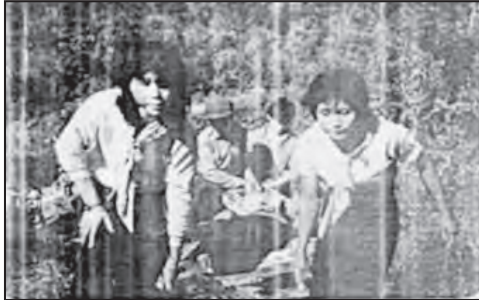
တိုက်ပွဲများအကြား ဒဏ်ရာရလူနာများကို စွန့်စွန့်စားစားသယ်ဆောင်နေသည့် မူဆယ်မြို့နယ် ကြက်ခြေနီလူငယ်မောင်မယ်များ။