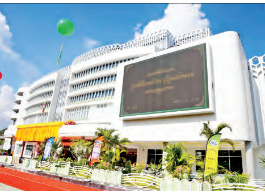
မြဝတီမီဒီယာစင်တာကို တွေ့ရစဉ်။

❖ သတင်းမီဒီယာလုပ်ငန်းအနေဖြင့် ဖွံ့ဖြိုးပြီးနိုင်ငံများက ၎င်းတို့၏ အကျိုးစီးပွားအတွက် ခေတ်မီဘက်စုံမီဒီယာများကို တွင်တွင်ကျယ်ကျယ်အသုံးပြုပြီး ၎င်းတို့လိုလားသည့် အယူအဆ၊ လူနေမှုစနစ်၊ ယဉ်ကျေးမှုစလေ့စရိုက်များကို သွတ်သွင်းခြင်းနှင့် နိုင်ငံရေး၊ စီးပွားရေး၊ လူမှုရေးကဏ္ဍစုံမှ ထိုးနှက်မှုများကို ခိုင်ခိုင်မာမာ ကာကွယ်နိုင်ရန် လိုအပ်။