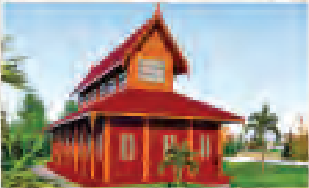
ဆင်းတုဆက်ပွားခန်းရုံ၊ ညောင်တော်၊ ဘေရန်၊ ဘီရူး