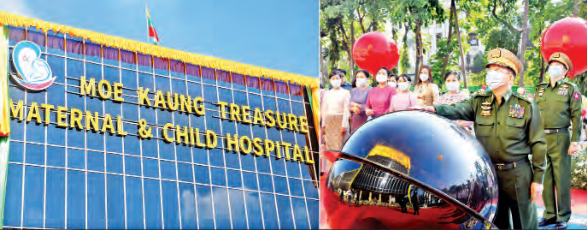
နိုင်ငံတော်စီမံအုပ်ချုပ်ရေးကောင်စီဥက္ကဋ္ဌ တပ်မတော်ကာကွယ်ရေးဦးစီးချုပ် ဗိုလ်ချုပ်မှူးကြီး မင်းအောင်လှိုင် မိုးကောင်းရတနာ မိခင်နှင့် ကလေးဆေးရုံကို စက်ခလုတ်နှိပ်ဖွင့်လှစ်ပေးစဉ်။

နေပြည်တော် မေ ၂ ရန်ကုန်တိုင်းဒေသကြီး ရန်ကင်းမြို့နယ် မိုးကောင်းလမ်းရှိ မိုးကောင်းရတနာ မိခင်နှင့် ကလေးဆေးရုံနှင့် မြဝတီမီဒီယာစင်တာ ဖွင့်ပွဲအခမ်းအနားများကို ယနေ့ နံနက်ပိုင်းတွင် ကျင်းပပြုလုပ်ရာ နိုင်ငံတော်စီမံအုပ်ချုပ်ရေးကောင်စီဥက္ကဋ္ဌ တပ်မတော်ကာကွယ်ရေးဦးစီးချုပ် ဗိုလ်ချုပ်မှူးကြီးမင်းအောင်လှိုင် တက်ရောက်ဖွင့်လှစ်ပေးသည်။