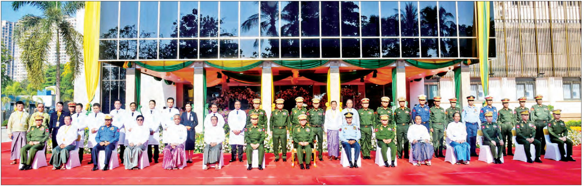
နိုင်ငံတော်စီမံအုပ်ချုပ်ရေးကောင်စီဥက္ကဋ္ဌ တပ်မတော်ကာကွယ်ရေးဦးစီးချုပ် ဗိုလ်ချုပ်မှူးကြီး မင်းအောင်လှိုင်နှင့် မိုးကောင်းရတနာ မိခင်နှင့် ကလေးဆေးရုံဖွင့်ပွဲအခမ်းအနားသို့ တက်ရောက်လာကြသူများ စုပေါင်းမှတ်တမ်းတင်ဓာတ်ပုံရိုက်ကြစဉ်။

စာမျက်နှာ ၃ မှ ယင်းနောက် Mini Theatre အတွင်း၌ နိုင်ငံတော် စီမံအုပ်ချုပ်ရေးကောင်စီဥက္ကဋ္ဌ တပ်မတော် ကာကွယ်ရေးဦးစီးချုပ် ဗိုလ်ချုပ်မှူးကြီးမင်းအောင် လှိုင်က မိုးကောင်းရတနာ မိခင်နှင့်ကလေးဆေးရုံနှင့် မြဝတီမီဒီယာစင်တာတို့ ဖွင့်လှစ်ခြင်းနှင့် ပတ်သက်၍ အမှာစကားပြောကြားရာတွင် ယခု ပေါ်ထွန်းလာခဲ့သည့် မိုးကောင်းရတနာမိခင်နှင့် ကလေးဆေးရုံကြီး အောင်မြင်စွာဖြစ်ပေါ်လာစေရေး အတွက် နိုင်ငံတကာမှ အတွေ့အကြုံရှိသည့် ကျွမ်းကျင် ပညာရှင်ကြီးများ၊ အဖွဲ့အစည်းများနှင့် အကြိမ်ကြိမ် အခါခါ တိုင်ပင်ညှိနှိုင်းဆွေးနွေးပြီး အကောင်အထည် ဖော်ဆောင်ရွက်ခဲ့ခြင်းဖြစ်ကြောင်း၊ ကျန်းမာရေး အချက်အလက်များအရ မြန်မာနိုင်ငံသည် ဒေသတွင်း နိုင်ငံများအနက် ပဉ္စမမြောက် လူဦးရေအများဆုံး နိုင်ငံဖြစ်ကြောင်း၊ ကျန်းမာရေးအသုံးစရိတ် (Healthcare Expenditure) များကိုလည်း တစ်နှစ်ထက် တစ်နှစ် တိုးမြှင့်သုံးစွဲလျက်ရှိကြောင်း၊ မြန်မာနိုင်ငံမှ ပြည်ပအိမ်နီးချင်းနိုင်ငံများသို့ ဆေးကုသမှု၊ ကျန်းမာရေးစစ်ဆေးမှုများအတွက် COVID-19 မဖြစ်ပွားမီ ယခင်နှစ်များက သွားရောက်ကုသသူ လူဦးရေ နေ့စဉ် ၅၀၀ ခန့်ရှိကြောင်း၊ ထိုသို့ပြည်ပသို့ သွားရောက်ဆေးကုသသူဦးရေ တစ်နှစ်ထက်တစ်နှစ် များပြားလျက်ရှိပြီး ၂၀၁၇ ခုနှစ်တွင် ပြည်ပသို့ သွားရောက်ဆေးကုသသူ လူဦးရေစုစုပေါင်း ၂၀၇၉၅၁ ဦးရှိကြောင်း၊ ပြည်ပသို့ ဆေးကုသမှုအတွက် သွားရောက်မှုအများဆုံးနိုင်ငံမှာ ထိုင်းနိုင်ငံ ၅၆ ရာခိုင်နှုန်း၊ ဒုတိယအများဆုံးနိုင်ငံမှာ အိန္ဒိယနိုင်ငံ ၁၉ ရာခိုင်နှုန်းနှင့် တတိယအများဆုံးနိုင်ငံမှာ စင်္ကာပူ နိုင်ငံ ၁၁ ရာခိုင်နှုန်းရှိသည်ကို လေ့လာသိရှိရကြောင်း။