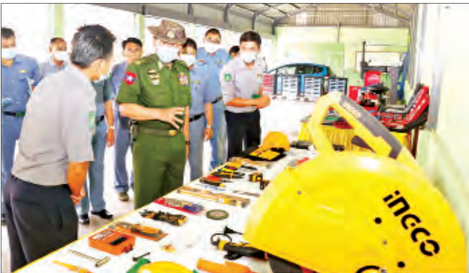
ပြည်ထောင်စုဝန်ကြီး ဒုတိယဗိုလ်ချုပ်ကြီး ထွန်းထွန်းနောင် စက်မှုလက်မှုသင်တန်းကျောင်း (ထားဝယ်) ၌ ကြည့်ရှုစစ်ဆေးစဉ်။

စံချိန်စံညွှန်းပြည့်မီစေရေး ယင်းနောက် ပြည်ထောင်စုဝန်ကြီးသည် ကမ်းရိုးတန်းဒေသ တိုင်းစစ်ဌာနချုပ်တိုင်းမှူး ဗိုလ်ချုပ်စောသန်းလှိုင်၊ တိုင်းဒေသကြီး စီမံအုပ်ချုပ်ရေးကောင်စီအဖွဲ့ဝင်(၁) ဗိုလ်မှူးကြီးကျော်ဇေယျနှင့် တာဝန်ရှိသူများနှင့်အတူ ထားဝယ်ခရိုင် ရေဖြူမြို့နယ် ကင်းပွန်းချောင်း - ပေါက်ပင်ကွင်း - မလှတောင်ကျေးရွာချင်းဆက်လမ်းပေါ်ရှိ အတက်အဆင်းကြမ်းသည့်နေရာများ၌ ၁/၂ ဒဿမ ၄ မိုင် ကွန်ကရစ်ခင်းခြင်းလုပ်ငန်း၊ ပေ ၃၀ တံတားတည်ဆောက်ခြင်းလုပ်ငန်း၊ ပေ ၁၂၀ တံတားတစ်စင်းတည်ဆောက်ခြင်းလုပ်ငန်း၊ ၁၀ ပေ တံတားတစ်စင်းတည်ဆောက်ခြင်းလုပ်ငန်းဆောင်ရွက်နေမှုအခြေအနေနှင့် ရာဖူး-စိန်ဘုံလမ်း ၅/၁ မိုင် ပေါ်တွင် ၁၂ ပေ တံတားတစ်စင်းတည်ဆောက်ခြင်းလုပ်ငန်း ဆောင်ရွက်နေမှု အခြေအနေများကို သွားရောက်ကြည့်ရှုစစ်ဆေးရာ သက်ဆိုင်ရာ တင်ဒါအောင်ကုမ္ပဏီ တာဝန်ခံအင်ဂျင်နီယာများက ဆောင်ရွက်ပြီးစီးမှု အခြေအနေများကို ရှင်းလင်းတင်ပြပြီး ပြည်ထောင်စုဝန်ကြီးက ဘဏ္ဍာနှစ်အတွင်း လုပ်ငန်းများ အချိန်မီပြီးစီးရေး၊ သတ်မှတ်ပုံစံအတိုင်း ဆောင်ရွက်ရေး၊ လုပ်ငန်းအရည်အသွေး စံချိန်စံညွှန်းပြည့်မီစေရေး ဆောင်ရွက်သွားရန် မှာကြားသည်။ နယ်စပ်ရေးရာဝန်ကြီးဌာနအနေဖြင့် တနင်္သာရီတိုင်းဒေသကြီး ထားဝယ်ခရိုင် ရေဖြူမြို့နယ်အတွင်း ကျေးရွာချင်းဆက်လမ်းများ ဆက်သွယ်ရေး