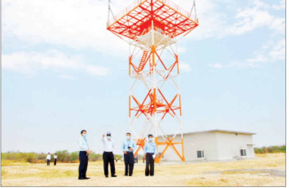
ရေးကို အဓိကဦးစားပေးဆောင်ရွက်ရန်နှင့် လိုအပ်သည့်များရှိပါက အချိန်နှင့်တစ်ပြေးညီ သတင်းပို့ဆောင်ရွက်သွားကြရန်မှာကြားခဲ့ကြောင်း သိရသည်။ သတင်းစဉ်

ယင်းနောက် ဒုတိယဝန်ကြီးသည် လေကြောင်းထိန်းချုပ်စင်သို့သွားရောက်၍ လေကြောင်းထိန်းသိမ်းရေးလုပ်ငန်းများ ဆောင်ရွက်နေမှုကို တာဝန်ခံများက ရှင်းလင်းတင်ပြရာ ဒုတိယဝန်ကြီးက လေယာဉ်များ ဘေးအန္တရာယ်ကင်းရှင်းစွာ ဆင်းသက်ပျံသန်းနိုင်