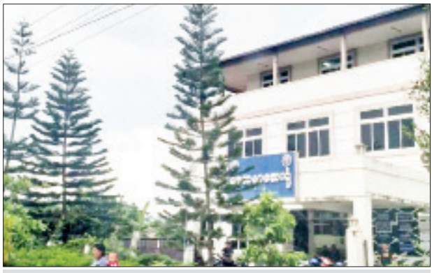
ဒေါက်တာ သိန်းသိန်းအေး (လ/ထ ဆရာဝန်၊ ကျိုင်းတုံပြည်သူ့ဆေးရုံ) ကို ဆေးကုသခွင့်ပေးထားသည့် “စေတနာ” ဆေးရုံအား တွေ့ရစဉ်။