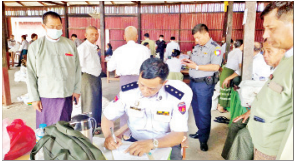
ကျွန်းလှမြို့နယ် ဆန္ဒမဲလက်မှတ် မြေပြင်စစ်ဆေးမှု မှတ်တမ်းဓာတ်ပုံ။

၁၂။ ကျွန်းလှမြို့နယ် ပြည်သူ့လွှတ်တော်ဆန္ဒမဲလက်မှတ်များ ရပ်ကွက်/ကျေးရွာအုပ်စုအလိုက်