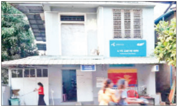
ဒေါက်တာ ရဲဇာနည်ဝင်းနှင့် ဒေါက်တာ စုစန္ဒာဝင်း (လ/ထ ဆရာဝန်၊ ကော့ဘိန်းတိုက်နယ် ဆေးရုံ)တို့ ဆေးကုသနေသည့် အမည်မရှိဆေးခန်းအား တွေ့ရစဉ်။