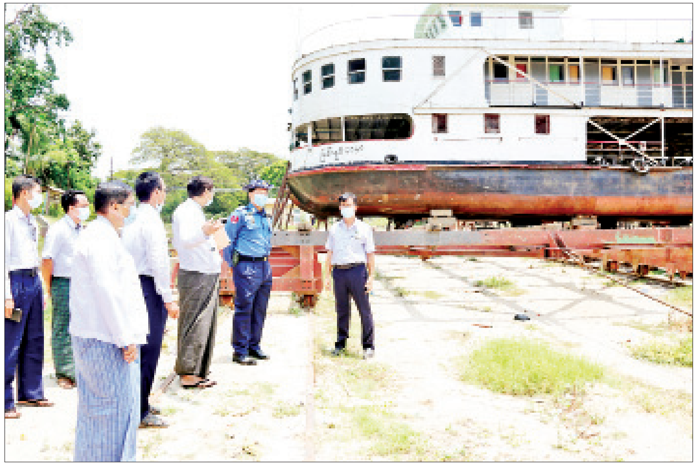
ပြည်ထောင်စုဝန်ကြီး ဗိုလ်ချုပ်ကြီးတင်အောင်စန်း ရတနာပုံ သင်္ဘောကျင်း၌ ကြည့်ရှုစစ်ဆေးစဉ်။

မိုးပွင့်သစ္စာနှင့် မွေးရနံ့သင်းထုံ သည့် ပန်းခင်း စာမျက်နှာ ၁၆