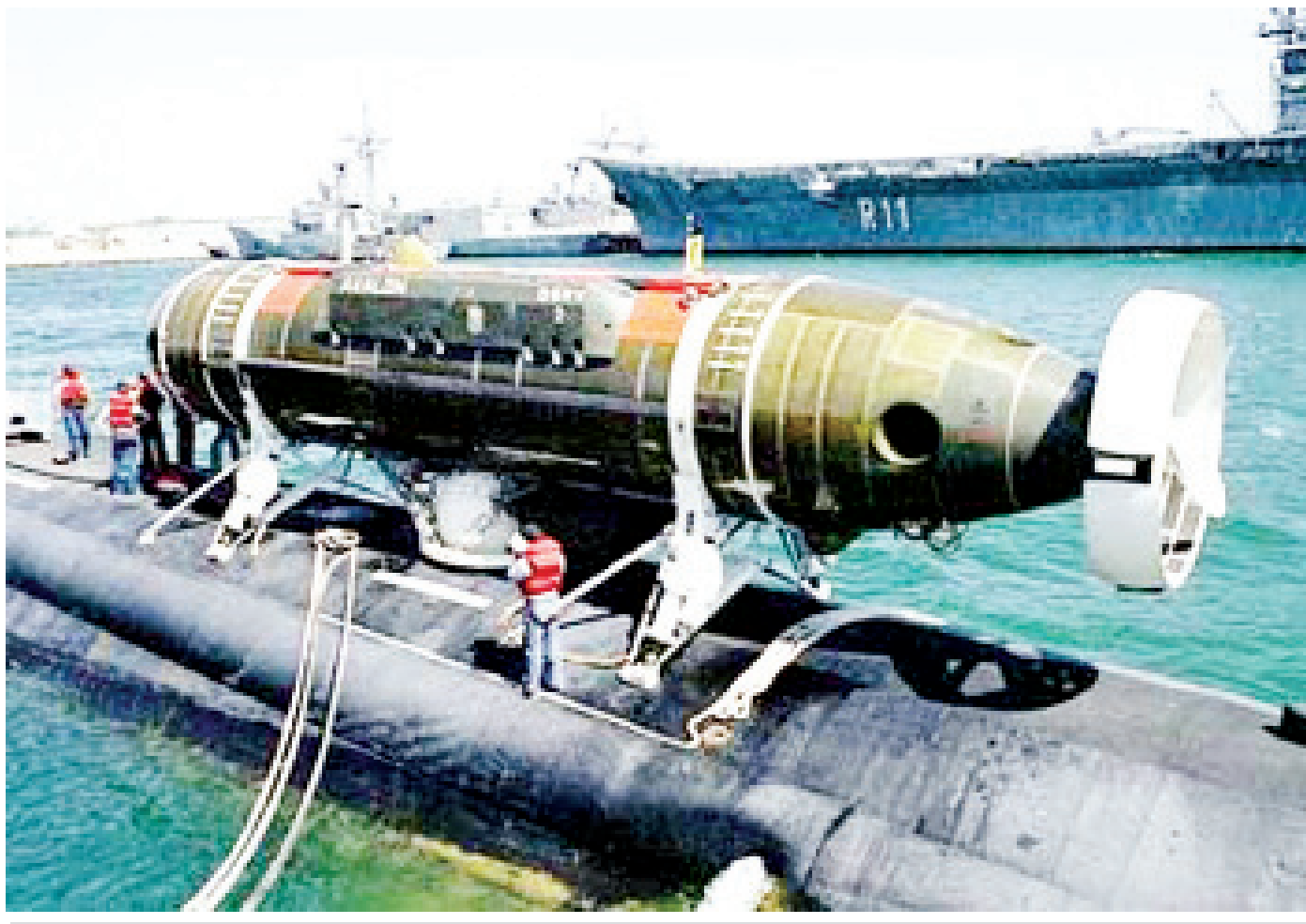
မိခင် ရေငုပ်သင်္ဘောပေါ်ရှိ DSRV တည်ရှိပုံ။

မရှိတာနဲ့ သမုဒ္ဒရာအရှိန်ကြောင့် အပူချိန် တစ်ရှိန်ထိုးကျဆင်းခြင်းတို့ ပေါင်းလိုက်တဲ့အခါ ခပ်မြန်မြန်ပဲ အခန်းပြင်ပ ရေအပူချိန်နဲ့ တစ်ညီတည်း ဖြစ်လာပါတယ်။ ဒါ့အပြင် အခန်းတွင်း ဖိအားမြင့်လာတဲ့အတွက် နောက်ဆက်တွဲ ပြဿနာတွေ ပါလာပါလေရော။ အခန်းတွင်းရှိ ကာဗွန်ဒိုင်အောက်ဆိုက်ပမာဏကို တုံ့ပြန်တဲ့ လူ့ခန္ဓာကိုယ်ဇီဝဖြစ်စဉ်တွေက ပိုပြီး ဖိအားမြင့်လာစေပါတယ်။