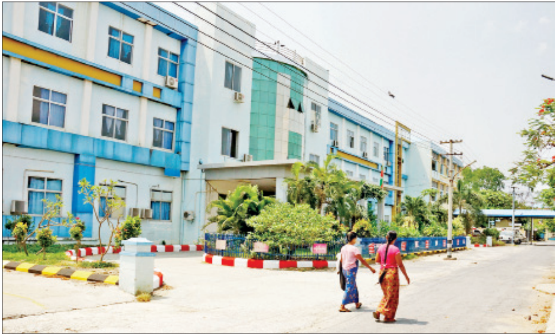
များလာပြီဆိုတော့ မေ ၁ ရက်ကစပြီးတော့ သက်ဆိုင်ရာဗဟိုအမျိုးသမီးဆေးရုံကြီးရဲ့ ပြင်ပလူနာဌာနမှာ လူနာတွေကို ကြည့်

“ဆေးရုံကို ပထမဆုံး ပြန်ဖွင့်တဲ့ အချိန်တုန်းက ပြင်ပလူနာကြည့်ရှုတာ ကိုပဲ လက်ခံနိုင်ခဲ့ပါတယ်။ တဖြည်းဖြည်း နဲ့ မွေးခန်းမှာ မွေးနိုင်ဖို့ ပိုးသန့်စင်ပြီး သမားရိုးကျမွေးဖွားမှုကို ဆောင်ရွက်ပေး ပါတယ်။ အဲဒါပြီးတော့ နောက်တစ်ဆင့် တက်ပြီး ခွဲစိတ်ခန်းတွေကို ပိုးသတ်ပြီး ခွဲစိတ်ခန်းတွေ ဖွင့်နိုင်အောင် လုပ်ပါ တယ်။ ဧပြီလ ဒုတိယပတ်မှာ ပြင်ပလူနာ လည်း ကြည့်ရှုပေးနိုင်သလို အတွင်းလူနာ လည်း ရှိနေပါပြီ။ ဆေးရုံမှာ ရိုးရိုးလည်း မွေးဖွားနိုင်သလို ခွဲစိတ်ခန်းတွေမှာ အရေးပေါ်လူနာတွေကို မွေးဖွားနိုင်အောင် ဆောင်ရွက်ပေးပြီးဖြစ်ပါတယ်။ အခုဆိုရင် လာရောက်ပြသတဲ့ လူနာတွေလည်း