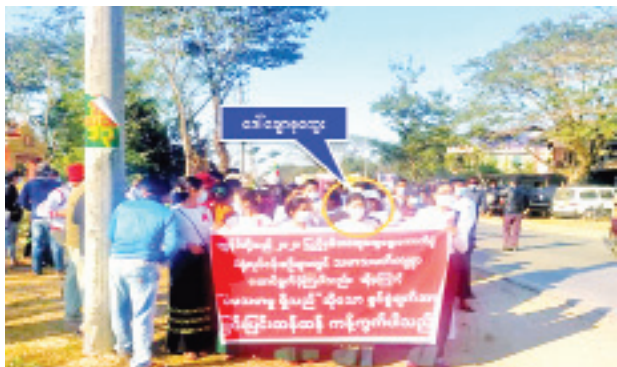
ဒေါ်ချောစုထွေး(ဗိုလ်ကောင်းမြို့နယ်ပညာရေးမှူးရုံး)မှ ဦးဆောင်၍ ဆန္ဒဖော်ထုတ်နေစဉ်။