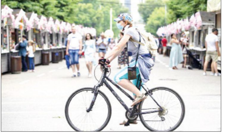
ကြောင်း သိရသည်။ မြို့တော်မော်စကိုသည် ရုရှားနိုင်ငံ၏ ကိုဗစ်-၁၉ ရောဂါကူးစက်မှုနှုန်းမြင့်မားမှုတွင် အများဆုံးဒေသဖြစ်ပြီး လွန်ခဲ့သည့် တစ်ရက်တာကာလအတွင်း ကိုဗစ်-၁၉ ရောဂါကူးစက်ခံရသူ ၃၂၀၈ ဦးရှိခဲ့ကာ မြို့တော်တစ်ဝန်းတွင် ကိုဗစ်-၁၉ ရောဂါ ကူးစက်ခံရသူစုစုပေါင်း ၁၀၉၆၀၃၉ ဦး အထိ ရှိလာကြောင်း သိရသည်။ ရုရှားနိုင်ငံသည် လက်ရှိတွင် နိုင်ငံ အတွင်းရှိပြည်သူ ၁၂၉ ဒသမ ၅ သန်း ကျော်အား ကိုဗစ်-၁၉ ရောဂါကူးစက်ခံရမှု ရှိ၊ မရှိစစ်ဆေးမှုများ ဆောင်ရွက်ထားပြီး ဖြစ်ကြောင်း သိရသည်။ ကိုးကား- ဆင်ဟွာ ဘာသာပြန်- အလင်းသစ်

မော်စကို မေ ၁ ရုရှားနိုင်ငံ၌ လွန်ခဲ့သည့် တစ်ရက်တာ ကာလအတွင်း ကိုဗစ်-၁၉ ရောဂါ ကူးစက် ခံရသူ ၉၂၇၀ ရှိခဲ့ခြင်းကြောင့် နိုင်ငံ တစ်ဝန်းတွင် ကိုဗစ်-၁၉ ရောဂါ ကူးစက် ခံရသူစုစုပေါင်း ၄၈၁၄၅၅၈ ဦးအထိ ရှိလာ ခဲ့ကြောင်း ရုရှားနိုင်ငံ၏ ကိုဗစ်-၁၉ ရောဂါ စောင့်ကြည့်ရေးနှင့် တုံ့ပြန်ရေးစင်တာက မေ ၁ ရက်တွင် ပြောကြားခဲ့သည်။ ထို့ပြင် ရုရှားနိုင်ငံ၌ လွန်ခဲ့သည့် တစ်ရက်တာကာလအတွင်း ကိုဗစ်-၁၉ ရောဂါကြောင့် သေဆုံးသူ ၃၉၂ ဦးရှိခဲ့ ခြင်းကြောင့် နိုင်ငံတစ်ဝန်းတွင် ကိုဗစ်-၁၉ ရောဂါကြောင့် သေဆုံးသူစုစုပေါင်း ၁၁၀၅၂၀ ရှိလာကြောင်းနှင့် လွန်ခဲ့သည့် တစ်ရက်တာကာလအတွင်း ကိုဗစ်-၁၉ ရောဂါမှ ပြန်လည်ကျန်းမာလာသဖြင့် ဆေးရုံများမှ ဆင်းခွင့်ရရှိသူ ၈၆၃၇ ဦးရှိခဲ့ ခြင်းကြောင့် ပြန်လည်ကျန်းမာလာသူ စုစုပေါင်း ၄၄၃၆၅၈၃ ဦးအထိ ရှိလာခဲ့