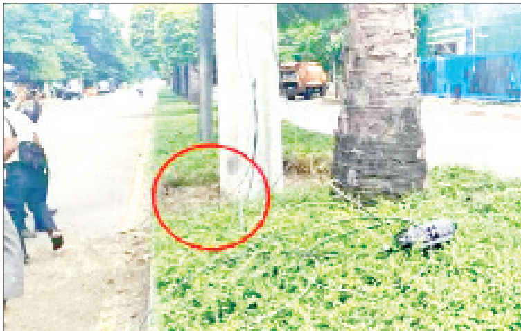
ရန်ကင်း မြို့နယ်၌ လက်လုပ် ဗုံး ပေါက်ကွဲမှု မှတ်တမ်း ဓာတ်ပုံ။