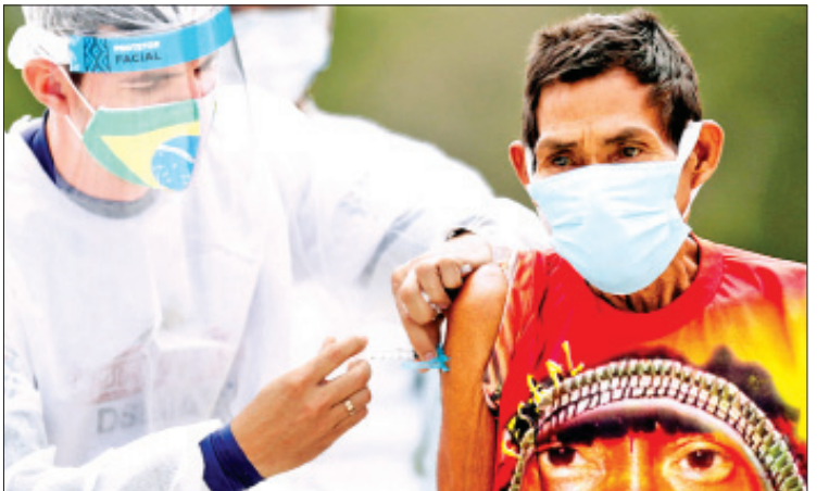
လက်ရှိအချိန်အထိ ကိုဗစ်-၁၉ ရောဂါ သေဆုံးခဲ့ကြောင်း သိရသည်။ ကူးစက်ခံရသူ ၁၄ ဒသမ ၅၉ သန်းရှိပြီး ကိုးကား- ဆင်ဟွာ အဆိုပါရောဂါကြောင့် လေးသိန်းကျော် ဘာသာပြန်- အောင်ကျော်ကျော်

ရရှိမည်ဖြစ်ပါကြောင်း ၎င်းက ဆက်လက် ပြောကြားခဲ့သည်။ သို့သော် လက်ရှိအချိန်တွင် ပြည်တွင်း ကူးစက်မှု မြင့်တက်လျက်ရှိသည့်အတွက် ကာကွယ်ဆေးထိုးနှံမှု လုပ်ငန်းစဉ်များကို အရှိန်အဟုန်မြှင့် ဆောင်ရွက်ရန် လိုအပ် ပါကြောင်း ဝန်ကြီး မာဆီလိုကွာရီဂါက ဆိုသည်။ နိုင်ငံတစ်ဝန်းရှိ ကာကွယ်ဆေးထိုးနှံ ရေးစင်တာများသို့ ကာကွယ်ဆေးအလုံးရေ ၅၇ ဒသမ ၉ သန်း ဖြန့်ဖြူးထားပြီး ဖြစ်ကြောင်းနှင့် ၎င်းတို့အနက် ကာကွယ် ဆေးအလုံးရေ ၄၂ ဒသမ ၁ သန်းကို ပြည်သူများအား ထိုးနှံပေးပြီးဖြစ်ကြောင်း သိရသည်။