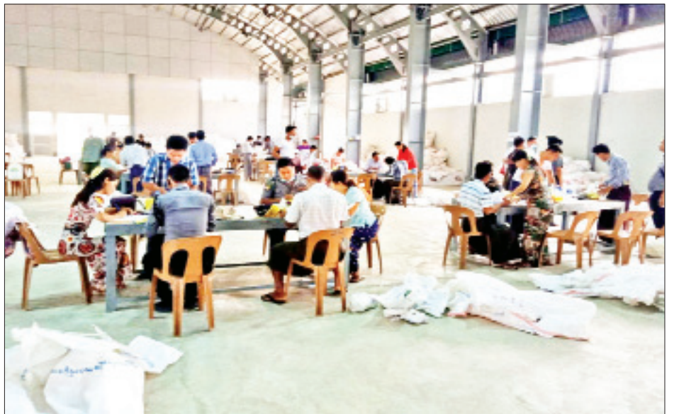
တန့်ဆည်မြို့နယ် ဆန္ဒမဲလက်မှတ် မြေပြင်စစ်ဆေးမှု မှတ်တမ်းဓာတ်ပုံ။

၇။ မြေပြင်စစ်ဆေးခဲ့ရာတွင် ထူးခြားမှုများအနေဖြင့် ရေဦးကုန်းကျေးရွာအုပ်စု မဲရုံအမှတ် (၂) တွင် အသုံးပြုထားသည့် ကြိုတင်ဆန္ဒမဲလက်မှတ် လက်ခံဖြတ်ပိုင်း၌ ဆန္ဒမဲပေးသူ၏ အမည်၊ မဲစာရင်း အမှတ်စဉ်၊ မဲရုံအမှတ်၊ ရပ်ကွက်/ကျေးရွာအုပ်စု၊ အမည် စသည်ဖြင့် ဖြည့်သွင်းရေးသားရမည့်ဖြစ်သော်လည်း မဲရုံတွင် ထိုသို့ ဖြည့်သွင်းရေးသားထားမှုမရှိသည့် အသုံးပြုပြီး လက်ခံဖြတ်ပိုင်း ၄၀ စောင်ကို စစ်ဆေးတွေ့ရှိရပါသည်။