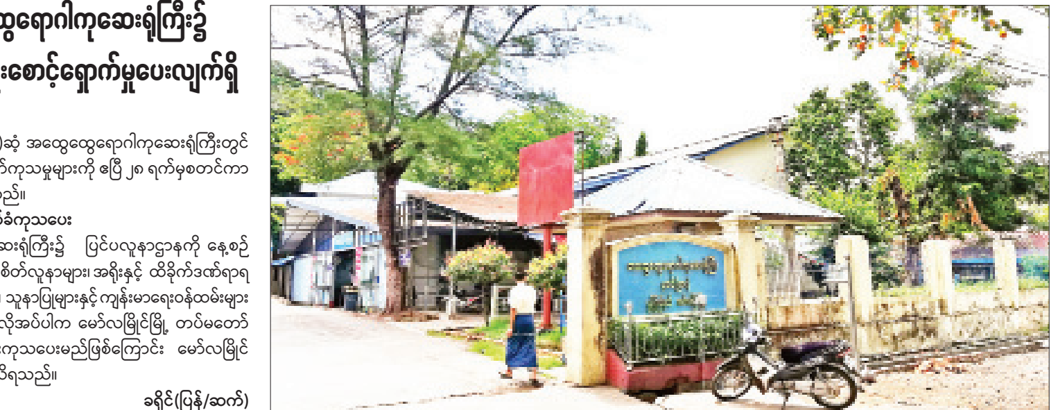
ခရိုင်(ပြန်/ဆက်)

၂၄ နာရီ လက်ခံကုသပေး မော်လမြိုင်မြို့ ခုတင်(၅၀၀)ဆံ့ ဆေးရုံကြီး၌ ပြင်ပလူနာဌာနကို နေ့စဉ် နေ့/ည မရွေး ဖွင့်လှစ်ထားရာ အရေးပေါ်ခွဲစိတ်လူနာများ၊ အရိုးနှင့် ထိခိုက်ဒဏ်ရာရ လူနာများ၊ ဖျားနာလူနာများကို ဆရာဝန်များ၊ သူနာပြုများနှင့် ကျန်းမာရေးဝန်ထမ်းများ က ၂၄ နာရီ လက်ခံကုသပေးလျက်ရှိပြီး လိုအပ်ပါက မော်လမြိုင်မြို့ တပ်မတော် ခုတင် (၃၀၀)ဆံ့ စစ်ဆေးရုံသို့ လွှဲပြောင်းကုသပေးမည်ဖြစ်ကြောင်း မော်လမြိုင် အထွေထွေရောဂါကုဆေးရုံအုပ်ကြီးထံမှ သိရသည်။