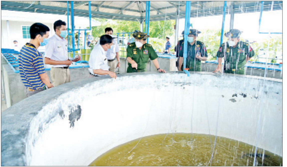
နိုင်ငံတော်စီမံအုပ်ချုပ်ရေးကောင်စီဥက္ကဋ္ဌ တပ်မတော်ကာကွယ်ရေးဦးစီးချုပ် ဗိုလ်ချုပ်မှူးကြီးမင်းအောင်လှိုင် မွေးမြူရေးဇုန်အတွင်းရှိ ငါးသားဖောက်လုပ်ငန်းဆောင်ရွက်နေမှုကို ကြည့်ရှုစစ်ဆေးစဉ်။