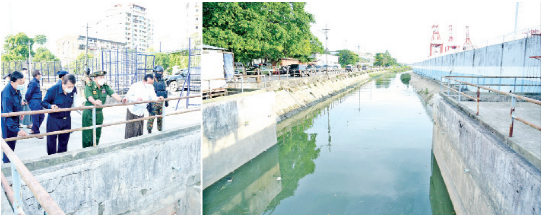
နိုင်ငံတော်စီမံအုပ်ချုပ်ရေးကောင်စီဥက္ကဋ္ဌ တပ်မတော်ကာကွယ်ရေးဦးစီးချုပ် ဗိုလ်ချုပ်မှူးကြီး မင်းအောင်လှိုင် လမ်းမတော်မြို့နယ်ရှိ ရွာသစ်ချောင်း မြစ်ထွက်ပေါက်ကို ကြည့်ရှုစစ်ဆေးစဉ်။