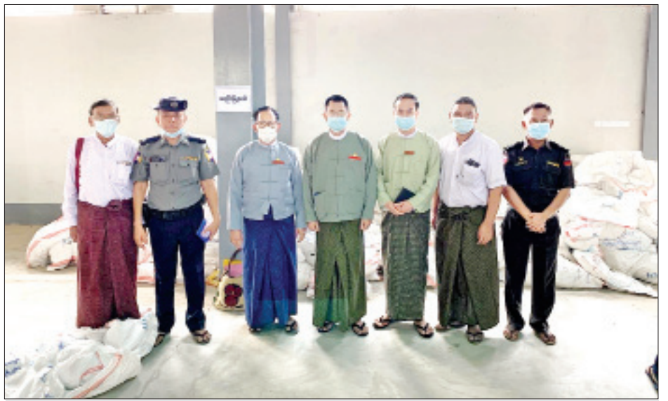
ရှေးမြို့နယ် ဆန္ဒမဲလက်မှတ် မြေပြင်စစ်ဆေးမှု မှတ်တမ်းဓာတ်ပုံ။