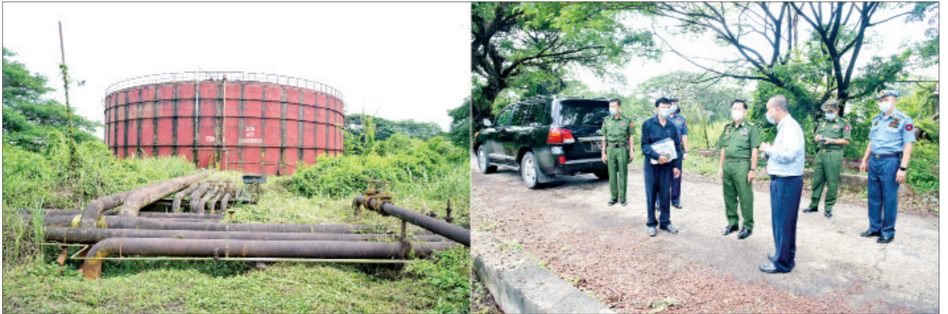
နိုင်ငံတော်စီမံအုပ်ချုပ်ရေးကောင်စီဥက္ကဋ္ဌ တပ်မတော်ကာကွယ်ရေးဦးစီးချုပ် ဗိုလ်ချုပ်မှူးကြီး မင်းအောင်လှိုင် အမှတ်(၁)ရေနံချက်စက်ရုံ(သန်လျင်)ရှိ ဆီသိုလှောင်ကန်ကို ကြည့်ရှုစစ်ဆေးစဉ်။