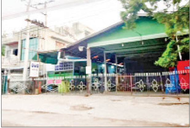
ဒေါက်တာ မေသန့်ဇင်(လ/ထ ဆရာဝန်၊ ရွှေဘိုပြည်သူ့ဆေးရုံ)ကို ဆေးကုသခွင့်ပေးထားသည့် “မေ”ဆေးရုံအား တွေ့ရစဉ်။