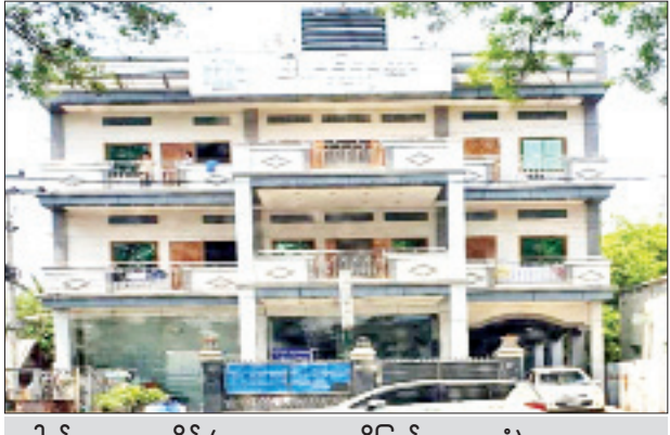
ဒေါက်တာ ယုယုခိုင် (အထူးကု၊ ရွှေဘိုပြည်သူ့ဆေးရုံ) ဆေးကုသနေသည့် “ဖြူစင်မေတ္တာ” ဆေးရုံ(မုံရွာမြို့)အား တွေ့ရစဉ်။