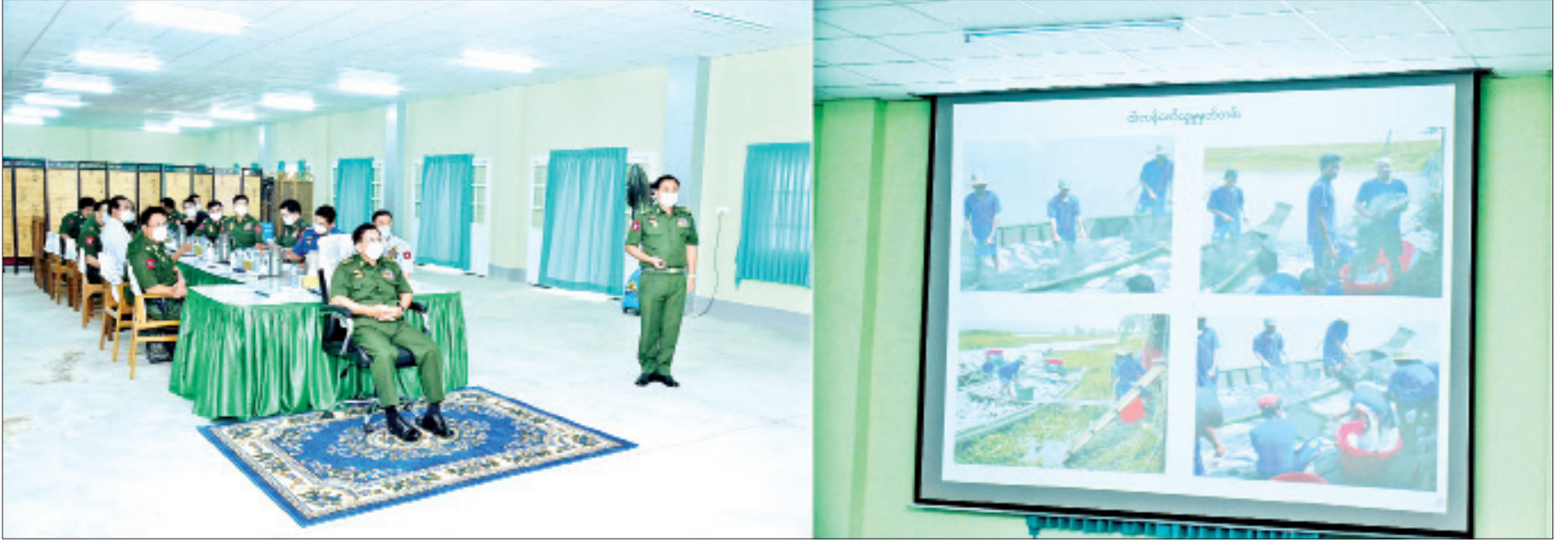
နိုင်ငံတော်စီမံအုပ်ချုပ်ရေးကောင်စီဥက္ကဋ္ဌ တပ်မတော်ကာကွယ်ရေးဦးစီးချုပ် ဗိုလ်ချုပ်မှူးကြီးမင်းအောင်လှိုင်အား သီလဝါဘက်စုံစိုက်ပျိုးမွေးမြူရေးဇုန် အကောင်အထည်ဖော်ဆောင်ရွက်ခဲ့မှုနှင့် ဆောင်ရွက်ပြီးစီးပြီး လုပ်ငန်းလည်ပတ်နေမှုအခြေအနေများနှင့်ပတ်သက်၍ ရှင်းလင်းတင်ပြစဉ်။

နေပြည်တော် ဧပြီ ၃၀ နိုင်ငံတော်စီမံအုပ်ချုပ်ရေးကောင်စီဥက္ကဋ္ဌ တပ်မတော်ကာကွယ်ရေးဦးစီးချုပ် ဗိုလ်ချုပ်မှူးကြီးမင်းအောင်လှိုင်သည် ယနေ့နံနက်ပိုင်းတွင် နိုင်ငံတော်စီမံအုပ်ချုပ်ရေးကောင်စီဝင်များ ဖြစ်ကြသည့် ဗိုလ်ချုပ်ကြီးမောင်မောင်ကျော်၊ ဒုတိယဗိုလ်ချုပ်ကြီးမိုးမြင့်ထွန်း၊ ကောင်စီတွဲဖက်အတွင်းရေးမှူး ဒုတိယဗိုလ်ချုပ်ကြီးရဲဝင်းဦး၊ ရန်ကုန်တိုင်းဒေသကြီးစီမံအုပ်ချုပ်ရေးကောင်စီဥက္ကဋ္ဌ ဦးလှစိုး၊ ကာကွယ်ရေးဦးစီးချုပ်(ရေ) ဗိုလ်ချုပ်ကြီးမိုးအောင်၊ ကာကွယ်ရေးဦးစီးချုပ်ရုံးမှ တပ်မတော်အရာရှိကြီးများ၊ ရန်ကုန်တိုင်းစစ်ဌာနချုပ် တိုင်းမှူး ဗိုလ်ချုပ်ညွန့်ဝင်းဆွေနှင့် တာဝန်ရှိသူများနှင့်အတူ ရန်ကုန်တိုင်းဒေသကြီးကျောက်တန်းမြို့နယ်၊ ရန်ကုန်မြစ်နှင့် မှော်ဝန်းချောင်းအကြားနေရာရှိ သီလဝါဘက်စုံစိုက်ပျိုးမွေးမြူရေးဇုန် အကောင်အထည်ဖော် ဆောင်ရွက်နေမှုအခြေအနေ