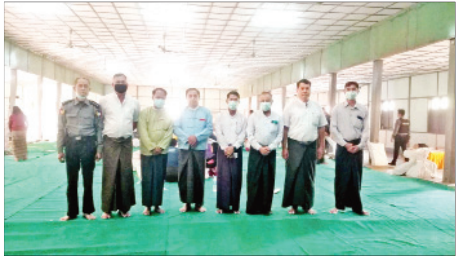
မြောင်မြို့နယ် ဆန္ဒမဲလက်မှတ် မြေပြင်စစ်ဆေးမှု မှတ်တမ်းဓာတ်ပုံ။