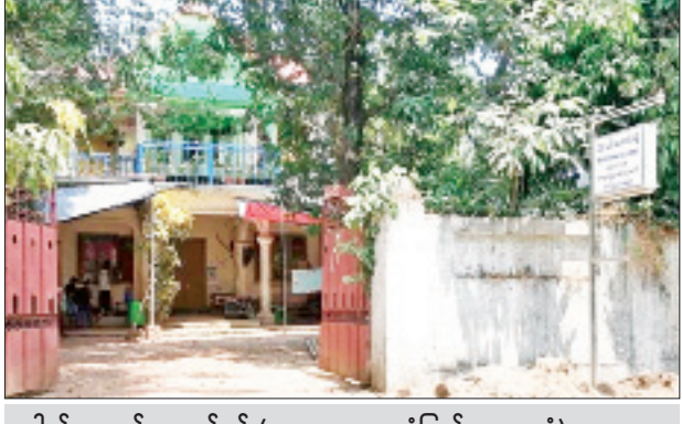
ဒေါက်တာ မင်းအောင်ခန့် (အထူးကု၊ သထုံပြည်သူ့ဆေးရုံ) ဆေးကုသနေသည့် အမည်မရှိဆေးခန်းအား တွေ့ရစဉ်။