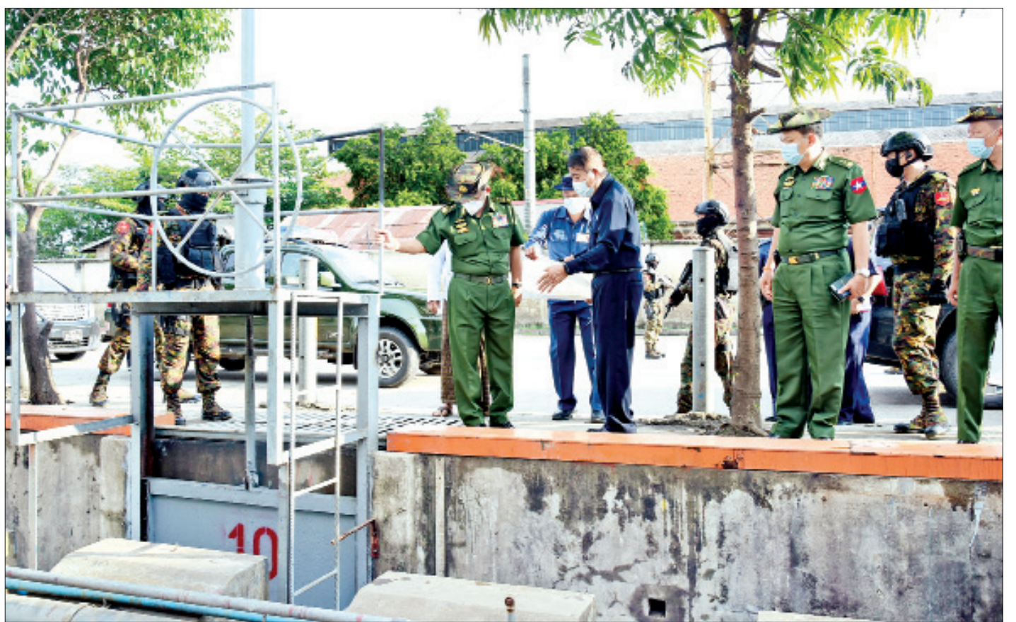
နိုင်ငံတော်စီမံအုပ်ချုပ်ရေးကောင်စီဥက္ကဋ္ဌ တပ်မတော်ကာကွယ်ရေးဦးစီးချုပ် ဗိုလ်ချုပ်မှူးကြီးမင်းအောင်လှိုင် ကျောက်တံတားမြို့နယ် ဆူးလေဘုရားလမ်းနှင့် တမ်းနားလမ်းထောင့်ရှိ အမှတ် ၁၀ ရေတံခါးကို ကြည့်ရှုစစ်ဆေးစဉ်။

ယင်းနောက် နိုင်ငံတော်စီမံအုပ်ချုပ်ရေး ကောင်စီဥက္ကဋ္ဌ တပ်မတော်ကာကွယ်ရေးဦးစီးချုပ် နှင့် အဖွဲ့ဝင်များသည် စက်ရုံဝင်းအတွင်းရှိ ဆီသိုလှောင်ကန်များ၊ စာမျက်နှာ ၆ သို့ >>>