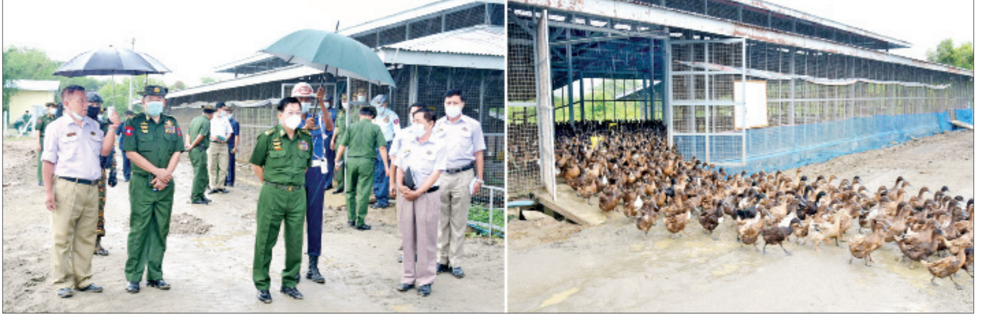
နိုင်ငံတော်စီမံအုပ်ချုပ်ရေးကောင်စီဥက္ကဋ္ဌ တပ်မတော်ကာကွယ်ရေးဦးစီးချုပ် ဗိုလ်ချုပ်မှူးကြီးမင်းအောင်လှိုင် မွေးမြူရေးဇုန်အတွင်း ဘဲများမွေးမြူထားမှုကို ကြည့်ရှုစစ်ဆေးစဉ်။

»» စာမျက်နှာ ၅ မှ ဆိပ်ခံတံတား၊ စက်ဆီရောစပ် စည်သွပ်စက်ရုံနှင့် ရေနံချက်စက်ရုံများအား လိုက်လံကြည့်ရှုစစ်ဆေးပြီး တာဝန်ရှိသူများ၏ တင်ပြချက်များအပေါ် နိုင်ငံတော်စီမံအုပ်ချုပ်ရေးကောင်စီဥက္ကဋ္ဌက အချို့စက်ရုံများအား ပြန်လည်လည်ပတ်နိုင်ရေး ကြိုးပမ်းဆောင်ရွက်၍ ပြည်တွင်းစက်သုံးဆီ လိုအပ်ချက်အား တစ်ဖက်တစ်လမ်းမှ ဖြည့်ဆည်းပေးနိုင်ရန် မှာကြားပြီး လိုအပ်သည်များ ဖြည့်ဆည်းဆောင်ရွက်ပေးခဲ့သည်။