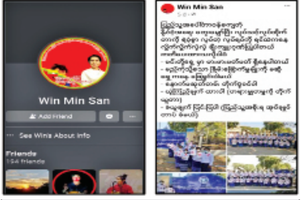
ဦးဝင်းမင်းဆန်း(ကျောင်းအုပ်ကြီး၊ အစိုးရနည်းပညာအထက်တန်းကျောင်း)၏ Profile နှင့် Post တင်ထားမှုအား တွေ့ရစဉ်။