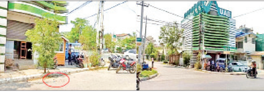
ပြည်ကြီးတံခွန်မြို့နယ် UAB ဘဏ်ရှေ့၌ လက်လုပ်ပိုင်းတစ်လုံးပေါက်ကွဲမှု မှတ်တမ်းဓာတ်ပုံကို တွေ့ရစဉ်။

နေပြည်တော် ဧပြီ ၃၀ နိုင်ငံတော်အတွင်း ဆူပူအကြမ်းဖက်သူလူအုပ်စု များအနေဖြင့် နိုင်ငံတော်ပိုင်အဆောက်အအုံများ၊ အေးချမ်းစွာနေထိုင်လိုသော ပြည်သူလူထုအချို့၏ နေအိမ်များ၊ အများပြည်သူသွားလာလှုပ်ရှားနေသော လမ်းမကြီးများပေါ်တွင် လက်လုပ်ပုံးများ ပစ်ဖောက် ခြင်း၊ ထောင်ထားခြင်းများ ပြုလုပ်နေကြသည်ကို တွေ့ရသည်။