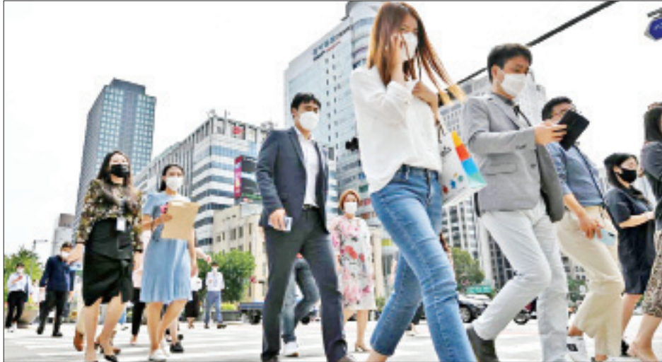
ကူးစက်ခံရသူ ၄၇၈၈၇၀၀ ရှိပြီး ဗိုင်းရပ်စ်ကူးစက်မှု စတုတ္ထနှင့် ပဉ္စမအများဆုံး နိုင်ငံများဖြစ်သည်။ အလားတူ ကမ္ဘာတစ်ဝန်း၌ ကိုဗစ်-၁၉ ရောဂါ

အမေရိကန်နိုင်ငံ၌ ကိုဗစ်-၁၉ ရောဂါကူးစက် ခံရသူ ၃၂၈၈၇၆၄ ဦးရှိပြီး ဗိုင်းရပ်စ်ကူးစက်ခံရသည့် ကမ္ဘာ့နိုင်ငံများအနက် ကူးစက်မှုအရေအတွက် အများဆုံးဖြစ်သည်။ အိန္ဒိယနိုင်ငံသည် ဗိုင်းရပ်စ် ကူးစက်ခံရသူ ၁၈၃၇၆၅၄ ဦးဖြင့် ဒုတိယအများဆုံး၊ ဘရာဇီးနိုင်ငံသည် ဗိုင်းရပ်စ်ကူးစက်ခံရသူ ၁၄၅၉၀၆၇၈ ဦးဖြင့် တတိယအများဆုံးဖြစ်သည်။ ထို့ပြင် ပြင်သစ်နိုင်ငံ၌ ဗိုင်းရပ်စ်ကူးစက်ခံရသူ ၅၆၅၃၅၃၃ ဦးနှင့် တူရကီနိုင်ငံတွင် ဗိုင်းရပ်စ်