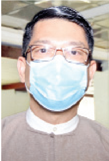
အမြဲတမ်းအတွင်းဝန် ဦးမင်းမင်း

ဖြေ။ ။ အဆိုပါ ကုန်စည်တွေကို နယ်စပ်ဒေသတစ်ခုတည်းကပဲ တင်သွင်းခွင့်ကို ယာယီရပ်ဆိုင်းခြင်းဖြစ်