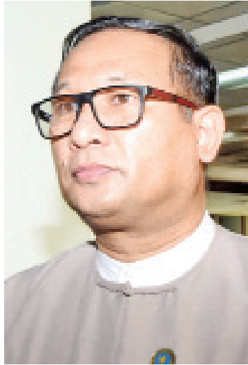
ညွှန်ကြားရေးမှူးချုပ် ဦးမြင့်သူရ