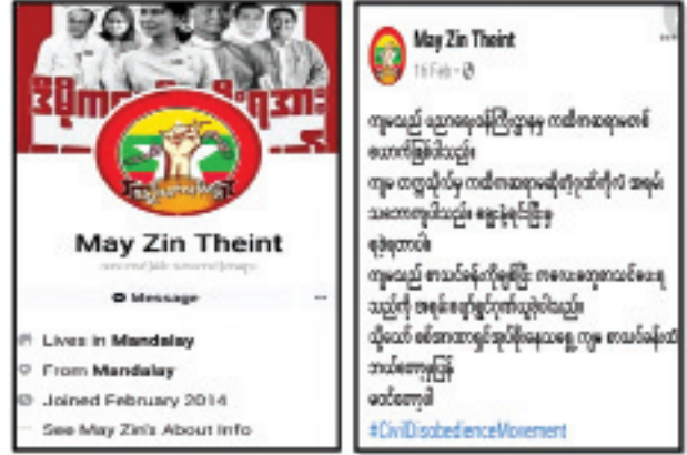
ဒေါ်မေဇင်သိမ့်(ကထိက၊ နည်းပညာတက္ကသိုလ်-မန္တလေး)မှ Profile နှင့် Post တင်ထားမှုအား တွေ့ရစဉ်။