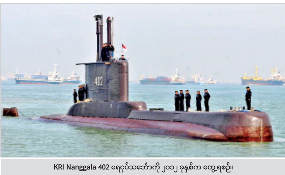
KRI Nanggala 402 ရေငုပ်သင်္ဘောကို ၂၀၁၂ ခုနှစ်က တွေ့ရစဉ်။

ဘက်ထရီများ (lead-acid battery) ဟာ ပုံမှန်အားဖြင့် အရည်စီးကြောင်း (trickle)/ ဘက်ထရီအားသွင်းတဲ့ ကိရိယာမှ (သို့မဟုတ်) ရေပေါ်မှာ အားသွင်းတဲ့လုပ်ငန်းစဉ်မှ ထွက်ပေါ်