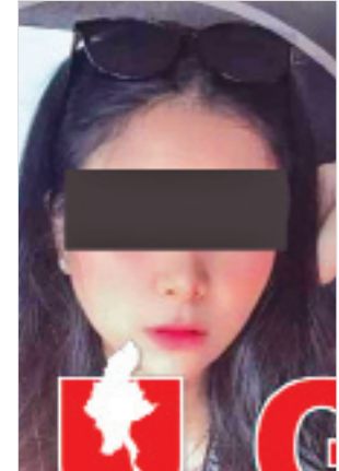
ယွန်းမီမီကျော်