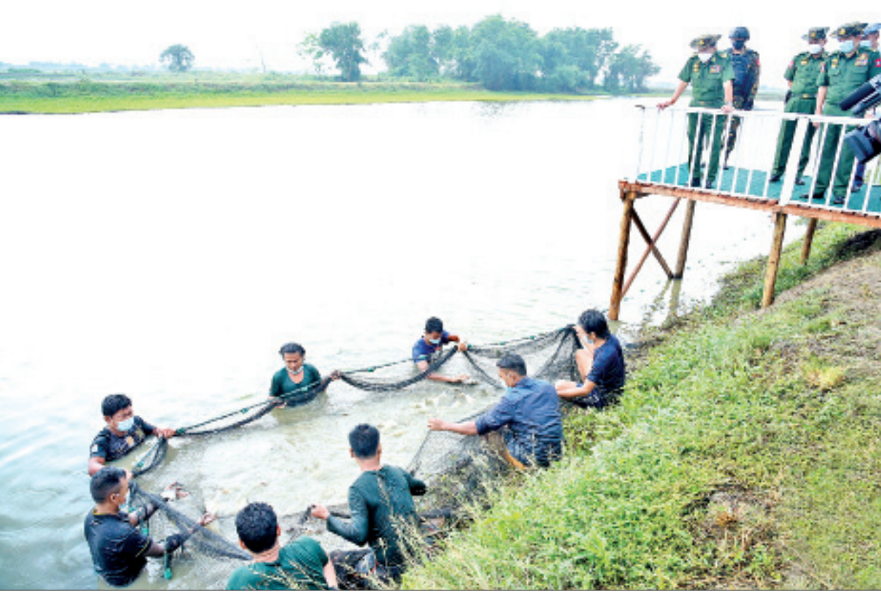
နိုင်ငံတော်စီမံအုပ်ချုပ်ရေးကောင်စီဥက္ကဋ္ဌ တပ်မတော်ကာကွယ်ရေးဦးစီးချုပ် ဗိုလ်ချုပ်မှူးကြီးမင်းအောင်လှိုင် သီလဝါဘက်စုံစိုက်ပျိုးမွေးမြူရေးဇုန်အတွင်းရှိ ငါးမွေးမြူထားရှိမှုကို ကြည့်ရှုစစ်ဆေးစဉ်။

အရည်အသွေးပြည့်မီသည့် အသား၊ ငါးများအား တိုးမြှင့်ထုတ်လုပ်နိုင်ခြင်းဖြင့် ဈေးနှုန်းသက်သာစွာ စားသောက်နိုင်ပြီး ပြည်သူများ အသားနှင့်ငါးစားသုံးမှုမြင့်မားလာကာ ကျန်းမာကြံ့ခိုင်မှုရှိလာမည်ဖြစ်ကြောင်း၊ ကျန်းမာကြံ့ခိုင်မှုရှိမှသာ ပညာရည်မြင့်မားရေးလုပ်ငန်းများ၊ စီးပွားရေးလုပ်ငန်းများကို ဖော်ဆောင်နိုင်မည်ဖြစ်သဖြင့် တိုင်းပြည်ဖွံ့ဖြိုးတိုးတက်လာမည်ဖြစ်ကြောင်း၊ အသား၊ ငါးများအား သက်သာသောဈေးနှုန်းများဖြင့် ဈေးကွက်အတွင်း ရောင်းချပေးနိုင်ရေး ဆောင်ရွက်ခြင်းဖြင့် အသား၊ ငါး ဈေးနှုန်းများကြီးမြင့်မှုကို လျော့ချနိုင်မည်ဖြစ်ကြောင်း၊ ထို့အပြင် အသား၊ ငါး ထွက်ကုန်များအား ပြည်ပသို့တင်ပို့နိုင်ရေးအတွက်လည်း ဆောင်ရွက်ရန် လိုကြောင်း၊ မွေးမြူရေးလုပ်ငန်းများသည် ရေရှည်ဆောင်ရွက်ရသည့် လုပ်ငန်းများဖြစ်သဖြင့် စာမျက်နှာ ၆ သို့ ❖