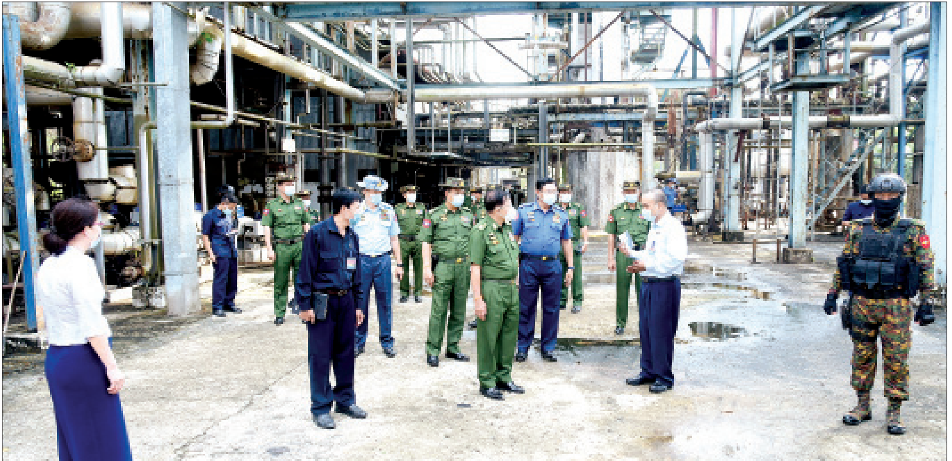
နိုင်ငံတော်စီမံအုပ်ချုပ်ရေးကောင်စီဥက္ကဋ္ဌ တပ်မတော်ကာကွယ်ရေးဦးစီးချုပ် ဗိုလ်ချုပ်မှူးကြီးမင်းအောင်လှိုင် အမှတ်(၁) ရေနံချက်စက်ရုံ(သန်လျင်)တွင် ကြည့်ရှုစစ်ဆေးစဉ်။

နေပြည်တော် ဧပြီ ၃၀ နိုင်ငံတော်စီမံအုပ်ချုပ်ရေးကောင်စီဥက္ကဋ္ဌ တပ်မတော်ကာကွယ်ရေးဦးစီးချုပ် ဗိုလ်ချုပ်မှူးကြီး မင်းအောင်လှိုင်သည် ယနေ့မွန်လွဲပိုင်းတွင် နိုင်ငံတော်စီမံအုပ်ချုပ်ရေးကောင်စီဝင်များဖြစ်ကြသည့် ဗိုလ်ချုပ်ကြီး မောင်မောင်ကျော်၊ ဒုတိယဗိုလ်ချုပ်ကြီး မိုးမြင့်ထွန်း၊ ကောင်စီတွဲဖက်အတွင်းရေးမှူး ဒုတိယဗိုလ်ချုပ်ကြီး ရဲဝင်းဦး၊