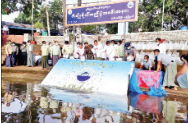
မျိုးများ၊ ကျေးရွာသူကျေးရွာသားများ တက်ရောက်ကြသည်။ အခမ်းအနား တွင် သထုံ ငါးသားပေါက်စခန်းမှထုတ်လုပ်သော နှစ်လက်မနှင့်အထက် အရွယ်အစားရှိ ငါးသားပေါက်ကောင်ရေ ၆၀၀၀၀ အား မုဒုံမြို့နယ် ဝင်းဖန့်ဆည်အတွင်းသို့ မျိုးစိုက်ထည့်ခဲ့ကြောင်း သိရသည်။ သတင်းစဉ်

မုဒုံ ဧပြီ ၂၉ မွန်ပြည်နယ် မုဒုံမြို့နယ် ကန်တော်ကြီး၌ ယမန်နေ့ နံနက်က ငါးမျိုးစိုက်ထည့်ပွဲကျင်းပရာ အခမ်းအနားသို့ မွန်ပြည်နယ် စီမံအုပ်ချုပ် ရေးကောင်စီဥက္ကဋ္ဌ ဦးဇော်လင်းထွန်းနှင့် ကောင်စီအဖွဲ့ဝင်များ၊ မွန်ပြည်နယ် ငါးလုပ်ငန်းဦးစီးဌာနမှ ဒုတိယပြည်နယ်ဦးစီးမှူး၊ မော်လမြိုင်ခရိုင်ငါးလုပ်ငန်းဦးစီးဌာနမှူးနှင့် ဝန်ထမ်းများ၊ ပြည်နယ်/ ခရိုင်/မြို့နယ်အဆင့်ဌာနဆိုင်ရာမှ တာဝန်ရှိသူများ၊ ရပ်မိရပ်ဖများ၊ ရပ်ကွက်အုပ်ချုပ်ရေးမှူးများ၊ ဖိတ်ကြားထားသူများ တက်ရောက်သည်။ အခမ်းအနားတွင် သထုံငါးသားပေါက်စခန်းမှ ထုတ်လုပ်သော နှစ်လက်မနှင့်အထက် အရွယ်အစားရှိ ငါးသားပေါက်ကောင်ရေ ၆၀၀၀၀ အား မုဒုံကန်တော်ကြီးအတွင်းသို့ မျိုးစိုက်ထည့်ခဲ့သည်။ ဆက်လက်၍ နံနက် ၈ နာရီခွဲတွင် မုဒုံမြို့နယ် ဝင်းဖန့်ဆည်အတွင်းသို့ ငါးမျိုး စိုက်ထည့်ပွဲကို ကျင်းပရာ မုဒုံမြို့နယ်အုပ်ချုပ်ရေးမှူးနှင့် ဌာန ဆိုင်ရာမှတာဝန်ရှိသူများ၊ မွန်ပြည်နယ် ငါးလုပ်ငန်းဦးစီးဌာနမှ ဒုတိယပြည်နယ်ဦးစီးမှူး၊ မော်လမြိုင်ခရိုင် ငါးလုပ်ငန်းဦးစီးဌာနမှူးနှင့် ဝန်ထမ်းများ၊ ဝင်းဖန့်ဆည်မှတာဝန်ရှိသူများ၊ ရပ်ကွက်အုပ်ချုပ်ရေး