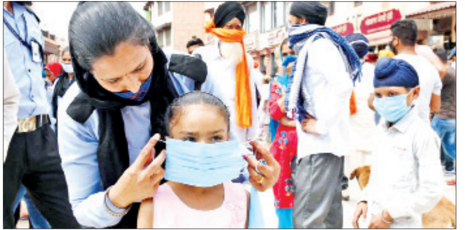
ဒေသတွင်းလည်း ကိုဗစ်-၁၉ ရောဂါဖြင့် သေဆုံးမှုနှုန်း သိသိသာသာ ကျဆင်းလာခဲ့ကြောင်း သိတင်းပတ်ခြောက်ပတ် ဆက်တိုက်မြင့်တက်လာခဲ့ပြီး ကျန်ကျဆုံးဒေသများတွင် ကိုဗစ်-၁၉ ရောဂါဖြင့် သေဆုံးမှုနှုန်း သိသိသာသာ ကျဆင်းလာခဲ့ကြောင်း ကမ္ဘာ့ကျန်းမာရေးအဖွဲ့က ပြောသည်။ ကိုးကား-ဆင်ပွာ၊ ဘာသာပြန်-ဂျေတီ

လွန်ခဲ့သည့်သီတင်းပတ်က အိန္ဒိယနိုင်ငံတွင် ကိုဗစ်-၁၉ ရောဂါနှင့်ဆက်စပ်သည့် ရောဂါများကြောင့် သေဆုံးမှု ၉၃ ရာခိုင်နှုန်းခန့် မြင့်တက်လာခဲ့သည်ဟု ဆိုသည်။ အိန္ဒိယနိုင်ငံတွင် လွန်ခဲ့သည့် သီတင်းပတ်က ကိုဗစ်-၁၉ ရောဂါဖြင့် ၁၅၁၆၁ ဦး အသက်ဆုံးရှုံးခဲ့ကြောင်း သိရသည်။ ထို့အပြင် အရှေ့တောင်အာရှနှင့် မြေထဲပင်လယ်