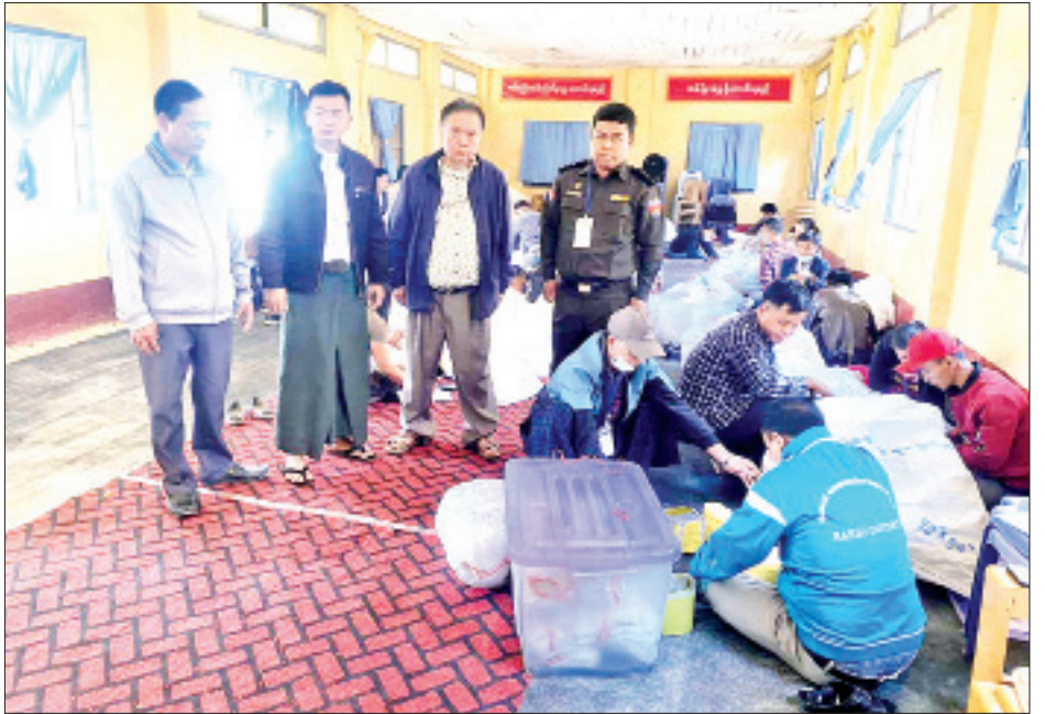
ထန်တလန်မြို့နယ် ဆန္ဒမဲလက်မှတ် မြေပြင်စစ်ဆေးမှု မှတ်တမ်းဓာတ်ပုံ။