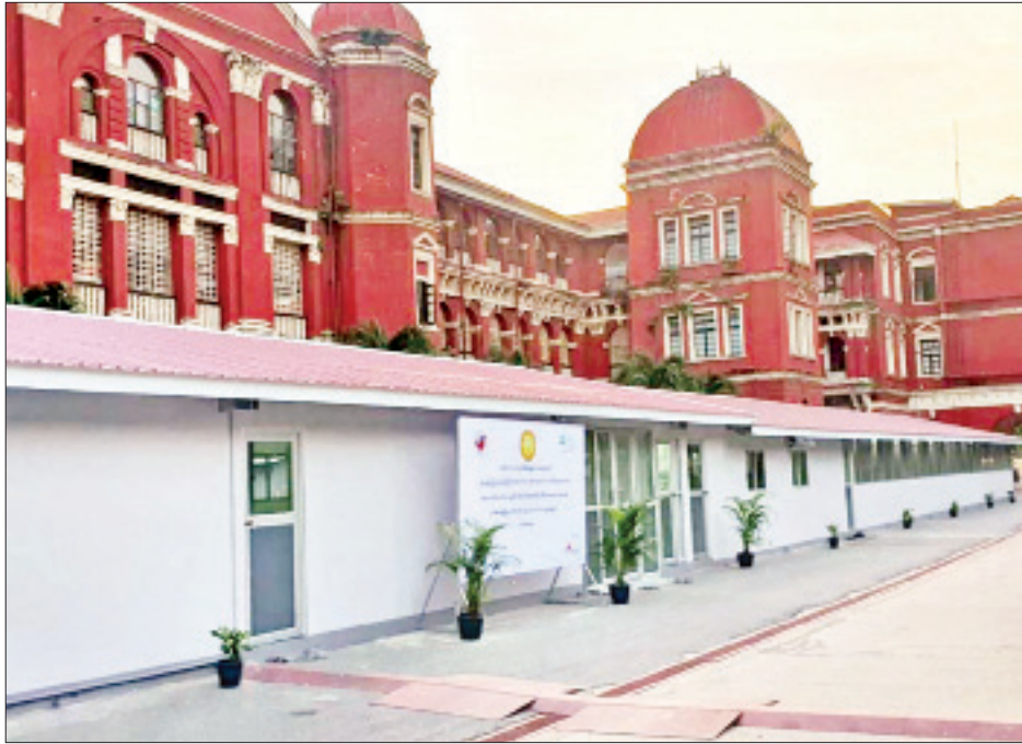
လက်ရှိ ဝန်ထမ်းအင်အားအရ နေ့ဘက်တွင် ရုံးချိန် ကုသမှုများကိုလည်း ဆောင်ရွက်ပေးလျက်ရှိကြောင်း အတိုင်း ပြန်လည်ဖွင့်လှစ်ထားပြီး အရေးပေါ်ခွဲစိတ် သိရသည်။

ကင်ဆာဝေဒနာရှင်များ၊ နှလုံးရောဂါ၊ ဦးနှောက် နှင့် အာရုံကြောဆိုင်ရာ ရောဂါ ဝေဒနာရှင်များ အနေဖြင့် အထူးကု ပြင်ပလူနာဌာနရှိ နှလုံးဆေးကု၊ နှလုံးနှင့် သွေးကြောခွဲစိတ်၊ ဦးနှောက်နှင့် အာရုံကြော ဆေးကု၊ ဦးနှောက်နှင့် အာရုံကြော ခွဲစိတ်ကု၊ ကင်ဆာ ဆေးပညာ၊ ဓာတ်ရောင်ခြည်ဆေးကုစသည့် ဌာန ခြောက်ခုတွင် မတ် ၂၂ ရက်မှစ၍ လိုအပ်သည့် ဆေးဝါးကုသမှုများ ပြုလုပ်နိုင်ပြီဖြစ်ကြောင်းနှင့် အရေးပေါ် အထွေထွေခွဲစိတ်ကုသခြင်းများနှင့် နှလုံးနှင့်ပတ်သက်၍ အရေးပေါ်ဆေးကုသမှု (ဥပမာ) နှလုံးခုန်စက်(Pacemaker) လဲလှယ်ပေးခြင်းများကို လည်း အဆိုပါ ရန်ကုန်ပြည်သူ့ဆေးရုံကြီးတွင် ပြန်လည်လုပ်ဆောင်ပေးလျက်ရှိကြောင်း သိရသည်။