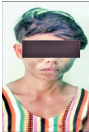
စိမ်းညို

လုံး၊ နှစ်ဖက်အသွားပါ အရိုး တစ်လက်မခွဲခန့်၊ အသွား ငါးလက်မခွဲခန့်ရှိ သံစားအိမ်အတွင်းထည့်ထားသော ဓားဦးချွန်တစ်ချောင်း၊ သီတာအာမခံ စိန်ရွှေရတနာ စာတန်းပါဘူးအတွင်းမှ အဖြူရောင်ပန်းပွင့်များပါ ပလတ်စတစ်အိတ်တစ်လုံး၊ Galaxy-SIII စာတန်းပါ ဖုန်းဘူးအတွင်းမှ အကြည်ရောင်ပလတ်စတစ်ဖြင့် ထုပ်ထားသည့် ၁ ဒသမ ၉ ဂရမ်ရှိ ဘီနိန်းဖြူ အထုပ်တစ်ထုပ်၊ အကြည်ရောင်ပလတ်စတစ်ကပ်ခွာအိတ်ဖြင့် ထုပ်ထားသည့် အရိုးအရွက်အသီး အခြောက် ၁ ဒသမ ၇ ဂရမ်ခန့်ရှိ ဆေးခြောက်အထုပ်တစ်ထုပ်၊ Disposable- Syringe စာတန်းပါ 3 ml/ cc ဆေးထိုးပြန်အသစ် ၁၁ ခုတို့ကို ရှာဖွေတွေ့ရှိခဲ့ခြင်းဖြင့် မူးယစ်ဆေးဝါး(သို့မဟုတ်)စိတ်ကိုပြောင်းလဲစေသော ဆေးဝါးများကို လက်ဝယ်ထားရှိခဲ့သည့်အတွက် စစ်အုပ်ချုပ်ရေး(Martial Law)စစ်ခုံရုံးဖွဲ့၍ စစ်ဆေးမှုများ ဆောင်ရွက်ခဲ့ရာ မူးယစ်ဆေးဝါးနှင့် စိတ်ကိုပြောင်းလဲစေသော ဆေးဝါးများဆိုင်ရာ ဥပဒေပုဒ်မ-၁၆(ဂ)နှင့် လက်နက်များ အက်ဥပဒေပုဒ်မ-၁၉(င) တို့အရ ဧပြီ ၂၈ ရက်တွင် “အလုပ်နှင့်ထောင်ဒဏ်(၁၀)နှစ်” အမိန့်ချမှတ်လိုက်ကြောင်း သိရှိရသည်။