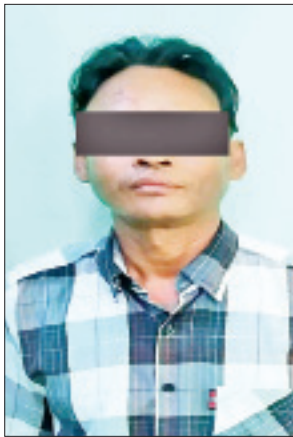
မြင့်ချို(ခ) မဲကြီး