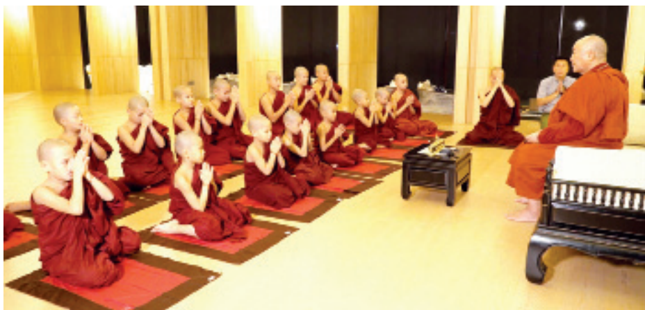
ပြည့်နှစ်တွင် မော်လမြိုင်မြို့ သုသမာစာရပရိယတ္တိစာမေးပွဲဟူ၍ အသီးသီးပေါ်ပေါက်လာခဲ့သည်။

မြန်မာ့ယဉ်ကျေးမှု၌ ရှင်ပြုမင်္ဂလာဟူရှိ၏။ ရှင်ပြုအံ့ဆဲလုလင်ကို ရှင်လောင်း/မောင်ရင်လောင်းဟုခေါ်၏။ ဆံရိတ်ဆံချခေါင်းတုံးတုံး၍ သင်္ကန်းတောင်းပြီး စည်းပေးလိုက်သောအခါ ကိုရင်/သာမဏေဖြစ်လာသည်။ ဆယ်ပါးသီလနှင့် ရှင်ကျင့်ဝတ် ၇၅ ပါးကို စောင့်ထိန်းရသည်။ ထေရဝါဒသာသနာတွင် အငယ်ဆုံး၊ အနိမ့်ဆုံးသာသနာဝန်ဆောင်ဖြစ်သည်။ ဗုဒ္ဓမြတ်စွာ သက်တော်ထင်ရှားရှိစဉ်က ရှင်သာရိပုတ္တရာမထေရ်မြတ်၏ သင်္ကန်းအနားမညီပုံကို ခုနစ်နှစ်သား ကိုရင်ငယ်လေးက ထောက်ပြလျှောက်ထားခဲ့ရာ “ခုနစ်နှစ်အရွယ်ဖြစ်ပါစေ၊ ငါ့ကိုဆုံးမတာကို ဦးထိပ်ပန်ဆင်ပြီး လေးစားစွာ နာခံပါသည်” ဟု မိန့်တော်မူ၍ သင်္ကန်းပြင်ရပြီးနောက် “ငါ့ရှင်လေး၊ ငါ့သင်္ကန်းညီပါပြီလော” ဟု ပြန်လည်လျှောက်ထား လိုက်နာကျင့်ဆောင်တော်မူခဲ့ပါသည်။