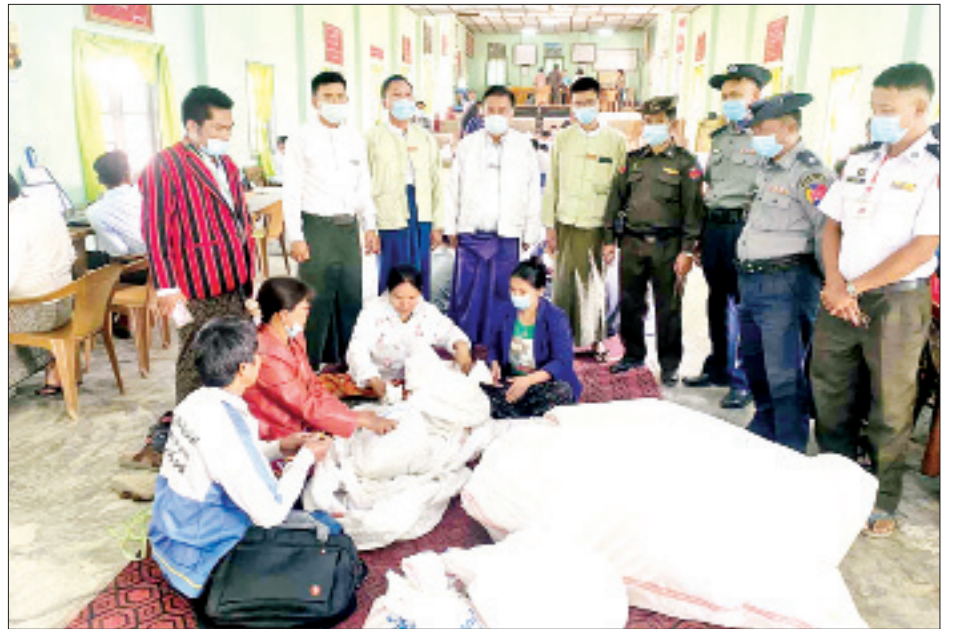
ကန်ပက်လက်မြို့နယ် ဆန္ဒမဲလက်မှတ် မြေပြင်စစ်ဆေးမှု မှတ်တမ်းဓာတ်ပုံ။

၇။ ကန်ပက်လက်မြို့နယ် ပြည်သူ့လွှတ်တော်ဆန္ဒမဲလက်မှတ်များ ရပ်ကွက်/ ကျေးရွာအုပ်စုအလိုက်