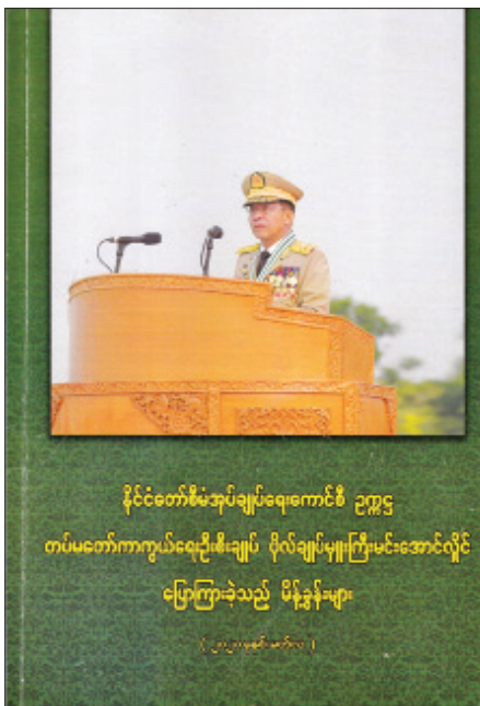
နိုင်ငံတော်စီမံအုပ်ချုပ်ရေးကောင်စီ ဥက္ကဋ္ဌ တပ်မတော်ကာကွယ်ရေးဦးစီးချုပ် ဗိုလ်ချုပ်မှူးကြီး မင်းအောင်လှိုင် ပြောကြားခဲ့သည့် မိန့်ခွန်းများ

အဆိုပါအချက်များနှင့်ဆက်စပ်သည့် ပြည်တွင်း စီးပွားရေးလုပ်ငန်း SME များကိုလည်း အားပေးကူညီ ဆောင်ရွက်ရမည်ဖြစ်ကြောင်း၊ ရောင်းကုန်ပစ္စည်း များ ပိုမိုထုတ်လုပ်ရရှိအောင် မျှော်မှန်းဆောင်ရွက် ရမည်ဖြစ်ကြောင်း၊ ပြည်သူလူထု၏ စီးပွားရေး ကောင်းမွန်လာပါက ဝယ်လိုအားများ ကောင်းမွန် လာပြီး ရောင်းလိုအားကောင်း၍ လူမှုစီးပွားဘဝ တိုးတက်ကောင်းမွန်လာမည်ဖြစ်ကြောင်း၊ စီးပွားရေး ဆိုင်ရာလုပ်ငန်းများ ရေတို/ရေရှည် ဆောင်ရွက်နိုင် ရန်အတွက် သက်ဆိုင်ရာဌာနများအလိုက် ဆောင်ရွက် သွားကြရန်နှင့် အခြားဌာနများအနေဖြင့်လည်း ပူးပေါင်းဆောင်ရွက်ခြင်း၊ အကြံဉာဏ်ပေးဆောင်ရွက် ခြင်းဖြင့် လုပ်ငန်းများ ပိုမိုတိုးတက်အောင်မြင်အောင် ဆောင်ရွက်ရမည်ဖြစ်ကြောင်း” ပြောကြားသည့် အမှာစကား၊ မတ်လ ၁၅ ရက်နေ့တွင် ကျင်းပခဲ့သည့် နိုင်ငံတော်စီမံအုပ်ချုပ်ရေးကောင်စီအစည်းအဝေး (၆/၂၀၂၁) တွင် “မဲစာရင်းများစိစစ်ရာတွင် မဲမသမာ မှုများ များစွာဖြစ်ပေါ်ခဲ့သည်ကို သတင်းစာရှင်းလင်း ပွဲတွင် ပြောကြားထားပြီးဖြစ်ကြောင်း၊ ထို့ကြောင့် လာမည့်ရွေးကောက်ပွဲသည် လွတ်လပ်၍ တရားမျှတ ပြီး စနစ်တကျရှိစေရေး မိမိတို့အနေဖြင့် ဆောင်ရွက် ရန်လိုကြောင်း၊ ရွေးကောက်ပွဲကော်မရှင်တွင် တာဝန်ရှိသူကဲ့သို့ သက်ဆိုင်ရာဝန်ကြီးဌာနများတွင် လည်း လူဦးရေစာရင်း မှန်ကန်ရေးအတွက် စနစ်