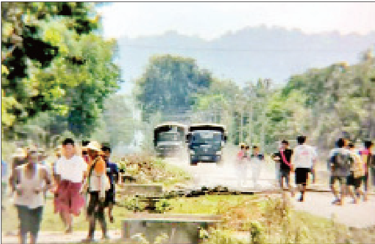
လွိုင်ကော်မြို့ နာနတ်တောရပ်ကွက်၌ ဆူပူအကြမ်းဖက်ဆန္ဒပြသူများအား လူစုခွဲရှင်းလင်းစဉ်။