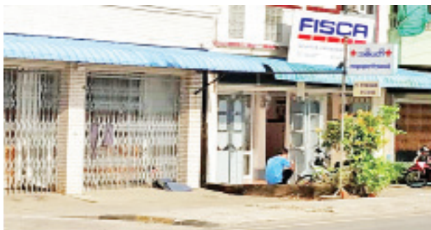
ဒေါက်တာသဲဝါလင်း(လက်ထောက်ဆရာဝန်၊ မော်လမြိုင် ပြည်သူ့ဆေးရုံ) ဆေးကုသနေသည့် “အစိပတ်” အထွေထွေရောဂါကုဆေးခန်းအား တွေ့ရစဉ်။