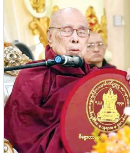
ထို့ကြောင့် နှစ်သစ်အခါသမယမှစ၍ ကုသိုလ်ကောင်းမှုများကို မမေ့မလျော့ဘဲ ကိုယ်စိတ်နှစ်ပါး ချမ်းသာစွာဖြင့် ကြိုးစားအားထုတ် ပြုလုပ်နိုင်ကြပါစေ။

ဤဒေသနာအရ ဗုဒ္ဓဘာသာတို့၏ ပန်းတိုင်ဖြစ်သော နိဗ္ဗာန်သို့ရောက်နိုင်ရန် ဒါန၊ သီလ စသော ကုသိုလ်ကောင်းမှုများကို မမေ့မလျော့ ကြိုးစားအားထုတ် ပြုလုပ်ရန် အလွန်လိုအပ်၏။ ကုသိုလ်ကောင်းမှုများကို မေ့လျော့ပြီး မပြုဘဲ နေက အသက်ပင်ရှင်နေသော်လည်း သေသူနှင့် မခြား တစ်သားတည်းဖြစ်ပေ၏။