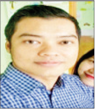
ဒေါက်တာမြို့မစင်