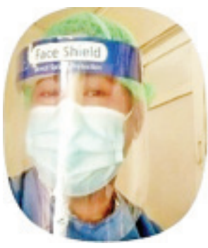
ဒေါက်တာကျော်သူရ