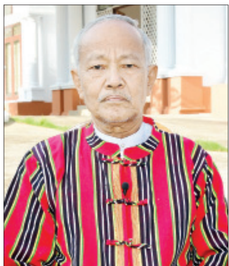
နားထောင်နေတဲ့ ပရိသတ်တွေအပေါ်မှာ လွှမ်းခြုံ တဲ့စေတနာနဲ့ မေတ္တာအရင်းနဲ့ ကျွန်တော်ဆုတောင်း တာပါ။ အားလုံး ကိုယ်စိတ်နှစ်ဖြာ ကျန်းမာလို့ ချမ်းသာကြပါစေ။

ပဋ္ဌာန်းကို ဌာန်ကရိုဏ်းကျကျ ဖတ်တတ်သွားတာပါ။ အခု အသက် ၆၉ နှစ်ပြည့်ကာမှ ကျွန်တော် ပဋ္ဌာန်းကို ပြန်စွဲလာတာဆိုတော့ လေးလလောက်တော့ရှိပြီပေါ့။ အဲဒီတုန်းက ဆုတောင်းတာတော့ ပဋ္ဌာန်းရွတ်ပြီးရင် မေတ္တာပို့ပါတယ်။ မေတ္တာပို့ပြီးရင် ဝေနေယျအားလုံး ကိုယ်စိတ်နှစ်ဖြာ ကျန်းမာချမ်းသာကြပါစေလို့ ဒီလိုပဲ ကျွန်တော် မေတ္တာပို့ပါတယ်။ အခုကျတော့ ဒီနေရာ မှာ ရောက်လာတဲ့အချိန်ကျတော့ ကျွန်တော် ဆုတောင်းတာ တစ်ခုတည်းပါ။ ပဋ္ဌာန်းကိုရွတ် တယ်။ နောက် မေတ္တာပို့တယ်။ နောက်ပြီး ကွယ်လွန် သွားတဲ့ အဖေ၊ အမေကအစ ကျန်တဲ့ သတ္တဝါတွေ အားလုံး မေတ္တာပို့တယ်။ မေတ္တာပို့ပြီးရင် ကျွန်တော် တစ်ခုထပ်တိုးတယ်။ အဲဒါက ဘာလဲဆိုတော့ ဘုရားတပည့်တော် တပည့်တော်မတို့သည် အေးချမ်း သာယာသော နိုင်ငံတော်၏ နိုင်ငံသူ နိုင်ငံသားများ ဖြစ်ကြရပါလိုအင် အရှင်ဘုရား ဆိုပြီးတော့ ဆုတောင်း တာ တစ်ခုတည်းပါ။ အဲဒါအကုန်လုံး အခု