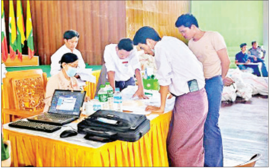
သပိတ်ကျင်းမြို့နယ် မဲစာရင်းများအား စစ်ဆေးခြင်း မှတ်တမ်းဓာတ်ပုံ

၆။ သပိတ်ကျင်းမြို့နယ် ရပ်ကွက် ၅ ရပ်ကွက်၊ ကျေးရွာအုပ်စု ၂ အုပ်စုမှ မဲရုံပေါင်း ၁၀၁ ရုံတွင် မဲလက်မှတ်အရေအတွက် ၇၆၇၈ ပျောက်ဆုံးနေပြီး မဲလက်မှတ် ၃၇၀ အပိုတွေ့ရှိရသည်။ မြို့နယ်ရွေးကောက်ပွဲ