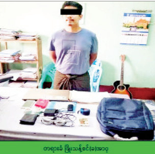
တရားခံ မြို့သန့်စင်(ခ)အာဝု