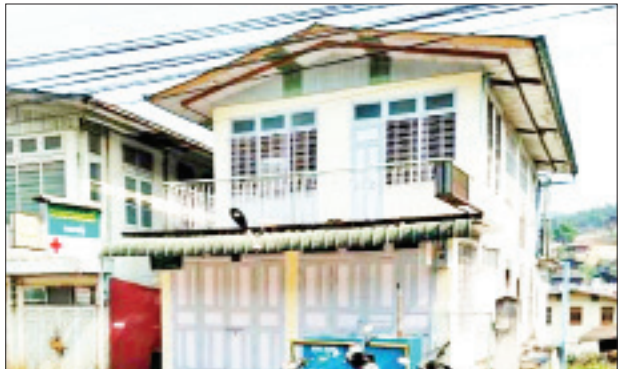
ဒေါက်တာအာကာသစ်ထွန်း (လက်ထောက်ဆရာဝန်၊ မိုးကုတ်ပြည်သူ့ဆေးရုံ) ဆေးကုသနေသည့် “သမားတော်” ဆေးခန်းအား တွေ့ရစဉ်။