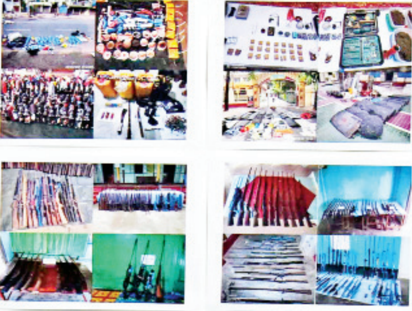
ဆန္ဒပြ ဆူပူအကြမ်းဖက်သူများအသုံးပြုသည့် လက်နက်နှင့် ဆက်စပ်ပစ္စည်းများကို တွေ့ရစဉ်။

လိုကြောင်း၊ ဖွဲ့စည်းပုံအခြေခံဥပဒေပုဒ်မ ၃၇၄ အရ လွတ်လပ်စွာ ဆန္ဒပြခွင့်ရှိကြောင်း၊ ငြိမ်းချမ်းစွာ ဆန္ဒပြသည့်အပိုင်းတွင် ၎င်းတို့ မှန်ကန်ခဲ့ပြီးဖြစ်ကြောင်း၊ ထို့နောက်ပိုင်း အကြမ်းဖက်မှုများ၊ လက်နက်ကိုင်ဆောင်မှုများ၊ မီးရှို့သည့်အပိုင်းများ ဖြစ်လာသည့်အခါ နိုင်ငံတော်မှ ရပ်ကွက်၊ ကျေးရွာအုပ်ချုပ်ရေးကို တိကျခိုင်မာစွာ ဆောင်ရွက်ပေးနိုင်မည့် အခြေအနေရှိ မရှိ သိလိုကြောင်း၊ မီဒီယာအနေဖြင့် မီဒီယာကြီးမှ မဟုတ်ကြောင်း၊ နယ်ဘက်ကျေးရွာများတွင် လက်ရှိဖြစ်နေသော အကြောင်းအရာများအား ဖော်ပြလိုခြင်းကြောင့် စိတ်စေတနာအပြည့်ဖြင့် ဆောင်ရွက်ပေးနေပါကြောင်း၊ အမှန်တရားအကြောင်းကို မီဒီယာကြီးတစ်ခုမှ မိမိအား မေးမြန်းဖူးပါကြောင်း၊ အမှန်တရားသည် အများပြည်သူ၏ ဆန္ဒအရ အများပတ်ဝန်းကျင်၏ လိုလားချက်အရ ဥပဒေနှင့်အညီ ဆောင်ရွက်ခြင်းသည်သာ အမှန်တရားဟု မိမိမှ ပြန်လည်ဖြေကြားခဲ့ကြောင်း၊ အဖြေမှန်သည်၊ မှားသည်ကို မသိပါကြောင်း၊ အမှန်တရားဆိုသည်မှာ တရားဥပဒေနှင့်ညီညွတ်ရမည်ဟု မိမိနားလည်ထားပါကြောင်း၊ မိမိနှင့်မိသားစုနီးစပ်ရာ ပတ်ဝန်းကျင်အားလုံးကို ဥပဒေ