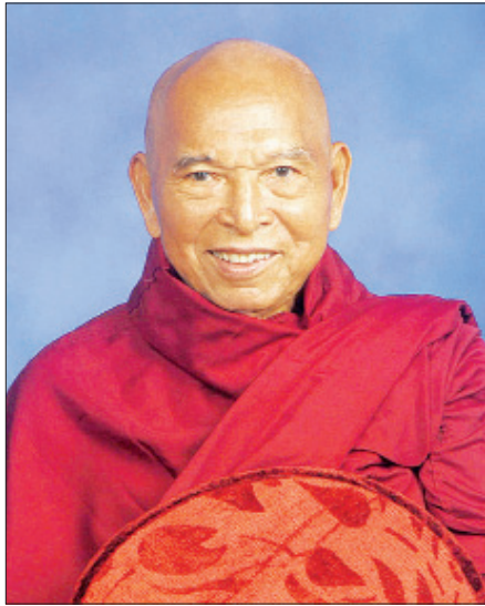
ကမ္ဘာသူ ကမ္ဘာသားအားလုံး ရောဂါဝေဒနာ အပေါင်းကင်းရှင်း၍ ကျန်းမာချမ်းသာကြပါစေ။ ဒုက္ခခပ်သိမ်း ကင်းငြိမ်းကြပါစေ။

ယခုအခါ တစ်ကမ္ဘာလုံး ကိုဗစ်-၁၉ ရောဂါ ကူးစက်ပြီး ရောဂါဝေဒနာ သန်းချီပြီး ရောဂါရပြီး သေကျေသူများလည်း သိန်းချီပြီး ရှိနေလေပြီ။ သေချာပေါက်ပျောက်စေနိုင်သည့်ဆေးစွမ်းကောင်းများ မတွေ့ရသေးချေ။