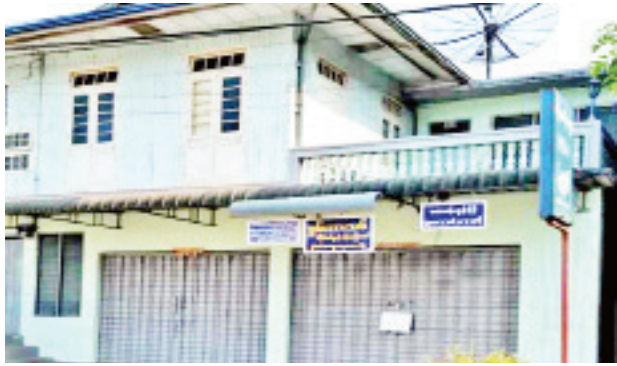
ဒေါက်တာယုမောင်(မိုးကုတ်ပြည်သူ့ဆေးရုံ) ဆေးကုသနေသည့် “စွမ်းအားသစ်” ဆေးခန်းအား တွေ့ရစဉ်။