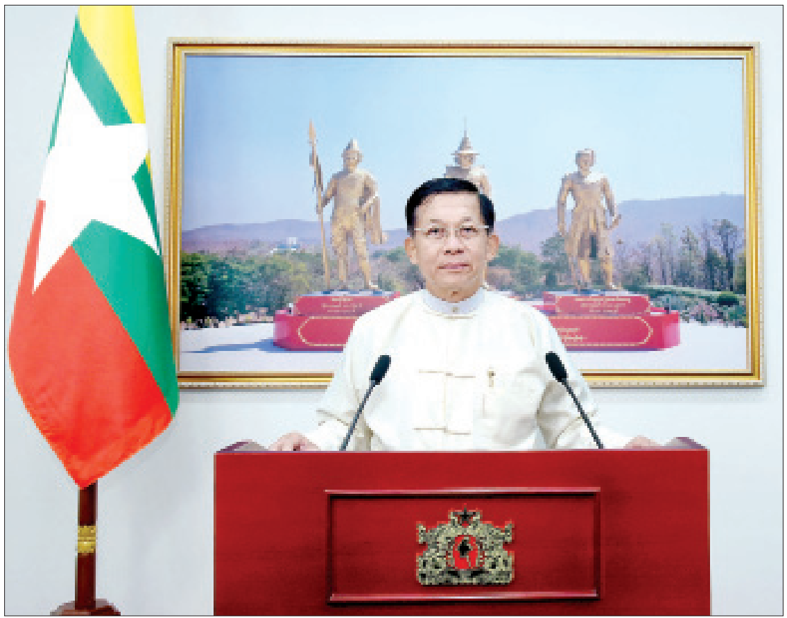
နိုင်ငံတော်စီမံအုပ်ချုပ်ရေးကောင်စီဥက္ကဋ္ဌ၊ တပ်မတော်ကာကွယ်ရေးဦးစီးချုပ် ဗိုလ်ချုပ်မှူးကြီးမင်းအောင်လှိုင် မြန်မာနှစ်သစ်ကူး နှုတ်ခွန်းဆက်မင်္ဂလာစကား ပြောကြားစဉ်။

နှစ်ဟောင်းမှ နှစ်သစ်ကိုကူးပြောင်းတဲ့ မြန်မာ့ရိုးရာအတာသင်္ကြန် ကာလဟာ မြန်မာနိုင်ငံသားတို့ရဲ့ ရိုးရာဓလေ့ ပွဲတော်များအနက် ထူးခြားလေးနက်မှု ရှိတဲ့ ပွဲတော်တစ်ရပ်ပဲဖြစ်ပါတယ်။ နှစ်ဟောင်းကနေ နှစ်သစ်ကိုကူးတဲ့ ဒီလိုအချိန်ခါမှာ ပြည်ထောင်စုအတွင်း မှာရှိတဲ့ တိုင်းရင်းသားပြည်သူ ညီအစ်ကိုမောင်နှမများအားလုံး ကိုယ်စိတ်နှစ်ဖြာ ကျန်းမာချမ်းသာပါစေ၊ မင်္ဂလာရှိတဲ့ နေ့ရက်များကို ပိုင်ဆိုင်နိုင်ကြပါစေ၊ ကောင်းကျိုးလိုအင်ဆန္ဒများ ပြည့်ဝကြပါစေ၊ COVID-19 ကပ်ရောဂါ ဘေးကြီးကလည်း ကျော်လွှားနိုင်ကြပါစေလို့ ဆုမွန်ကောင်းတောင်းအပ်ပါတယ်။ ဖြတ်သန်းခဲ့တဲ့ တစ်နှစ်တာကာလအတွင်း ပြန်ကြည့်မယ်ဆိုရင် COVID-19 ကပ်ရောဂါဖြစ်ပွားလာခဲ့တဲ့ စိန်ခေါ်မှုနဲ့ အခက်အခဲတွေ၊ ၂၀၂၀ ပြည့်နှစ် နိုဝင်ဘာလ ၈ ရက်နေ့မှာ ကျင်းပခဲ့တဲ့ ပါတီစုံဒီမိုကရေစီ အထွေထွေရွေးကောက်ပွဲမှာ ရည်ရွယ်ချက်ရှိရှိ ဆောင်ရွက်ခဲ့တဲ့ ကြီးမားတဲ့ မဲစာရင်းမှားယွင်းမှုများကြောင့် နိုင်ငံတော်ရဲ့ ဖွဲ့စည်းပုံအခြေခံဥပဒေ (၂၀၀၈ ခုနှစ်) အရ နိုင်ငံတော်အာဏာကို အရေးပေါ်ကာလဆိုင်ရာ ပြဋ္ဌာန်းချက်များနဲ့ အညီ တာဝန်ပေးအပ်လာတဲ့အတွက်