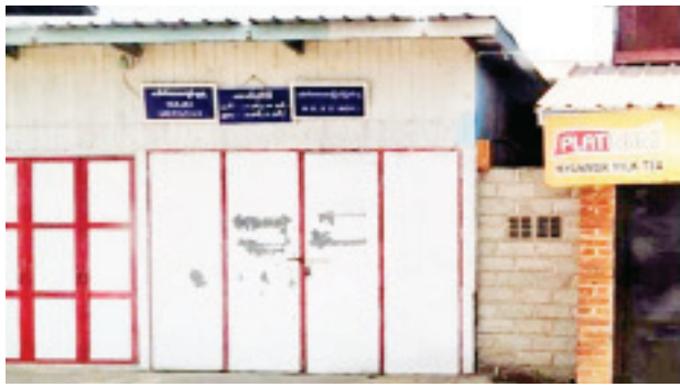
ဒေါက်တာကျော်သူရ(မိုးကုတ်ပြည်သူ့ဆေးရုံ) ဆေးကုသနေသည့် ဆေးခန်းအား တွေ့ရစဉ်။