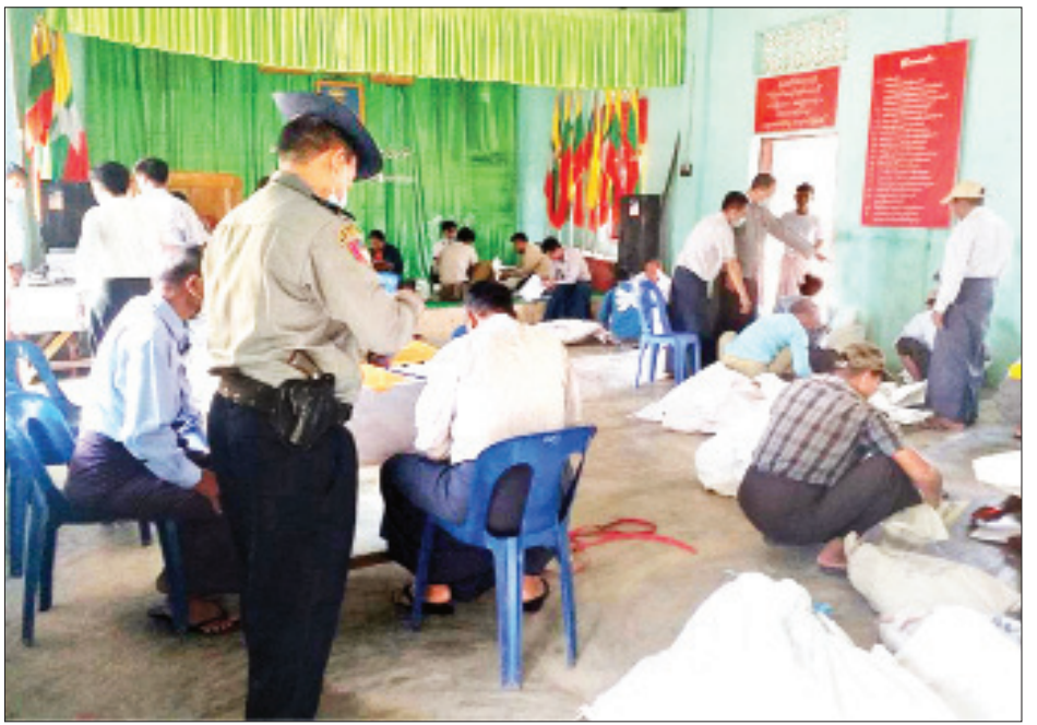
ငါန်းဇွန်မြို့နယ် ဆန္ဒမဲလက်မှတ်မြေပြင်စစ်ဆေးမှု မှတ်တမ်းဓာတ်ပုံ