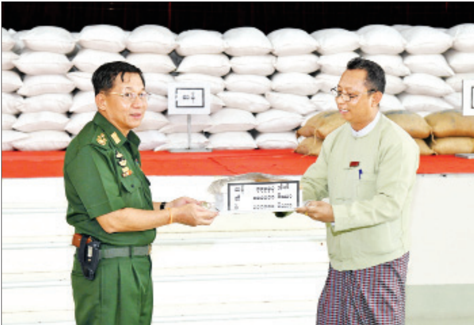
နိုင်ငံတော်စီမံအုပ်ချုပ်ရေးကောင်စီဥက္ကဋ္ဌ တပ်မတော်ကာကွယ်ရေးဦးစီးချုပ် ဗိုလ်ချုပ်မှူးကြီး မင်းအောင်လှိုင် လှိုင်သာယာမြို့နယ် ဒေသခံပြည်သူများအတွက် ဆန်၊ ဆီ၊ ပဲများ ပေးအပ်လှူဒါန်းရာ တာဝန်ရှိသူတစ်ဦးက လက်ခံရယူစဉ်။