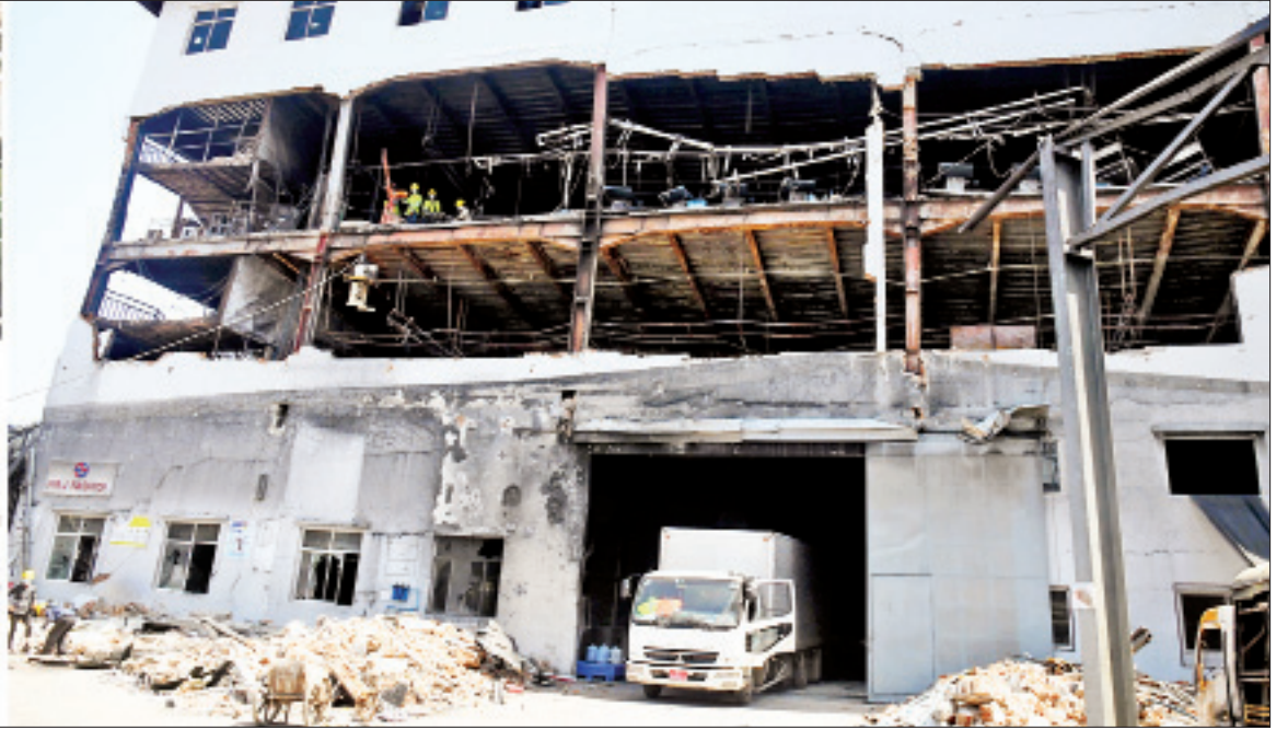
နိုင်ငံတော်စီမံအုပ်ချုပ်ရေးကောင်စီဥက္ကဋ္ဌ၊ တပ်မတော်ကာကွယ်ရေးဦးစီးချုပ် ဗိုလ်ချုပ်မှူးကြီး မင်းအောင်လှိုင် ရွှေလင်ပန်းစက်မှုဇုန်အတွင်း မီးလောင်မှုကြောင့် ပျက်စီးဆုံးရှုံးမှုဖြစ်ပေါ်ခဲ့သည့် စက်ရုံ၊ အလုပ်ရုံများကို လှည့်လည်ကြည့်ရှုစစ်ဆေး