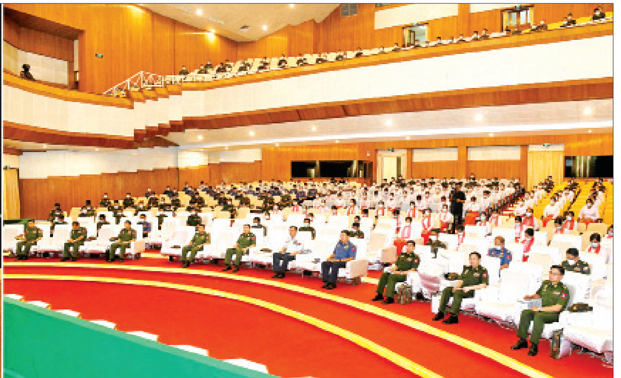
နိုင်ငံတော်စီမံအုပ်ချုပ်ရေးကောင်စီဥက္ကဋ္ဌ၊ တပ်မတော်ကာကွယ်ရေးဦးစီးချုပ် ဗိုလ်ချုပ်မှူးကြီးမင်းအောင်လှိုင် ရန်ကုန်တပ်နယ်မှ အရာရှိ၊ စစ်သည်၊ မိသားစုများအား တွေ့ဆုံအမှာစကားပြောကြားစဉ်။