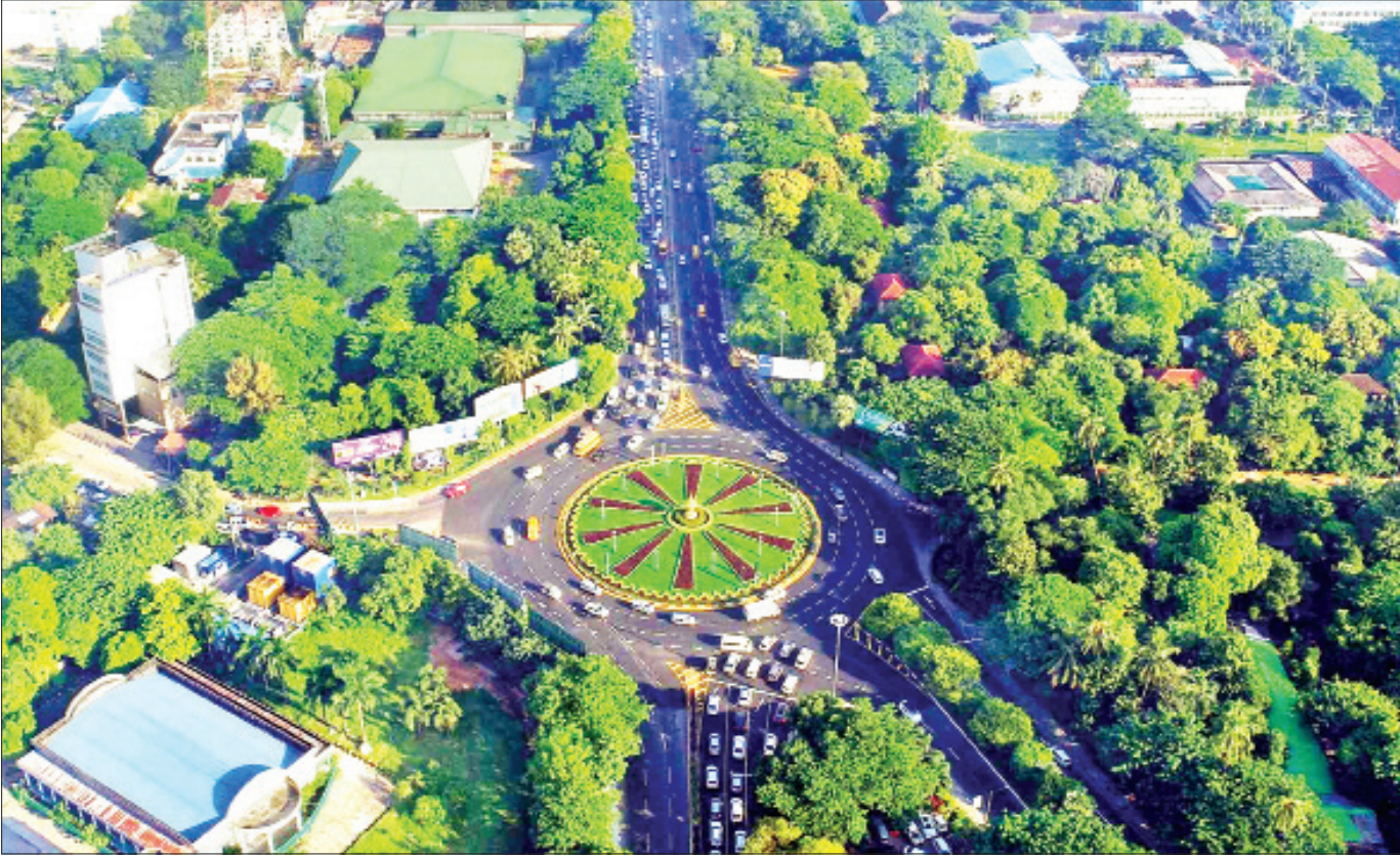
ရန်ကုန်မြို့၊ ဟံသာဝတီအဝိုင်း၌ မော်တော်ယာဉ်များ သွားလာနေမှုကို တွေ့ရစဉ်။