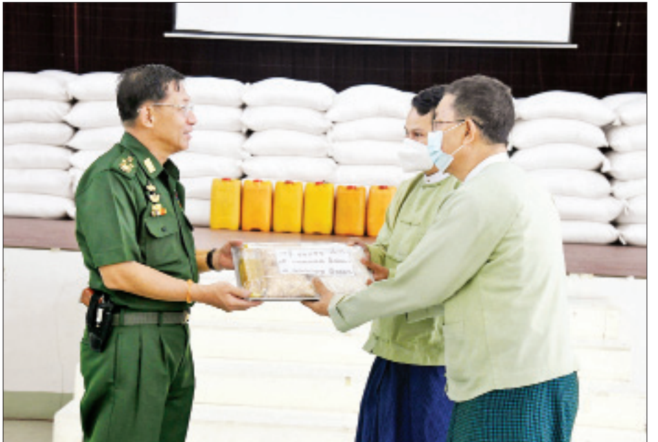
နိုင်ငံတော်စီမံအုပ်ချုပ်ရေးကောင်စီဥက္ကဋ္ဌ တပ်မတော်ကာကွယ်ရေးဦးစီးချုပ် ဗိုလ်ချုပ်မှူးကြီး မင်းအောင်လှိုင် ရွှေပြည်သာမြို့နယ် ဒေသခံပြည်သူများအတွက် ဆန်၊ ဆီ၊ ပဲများ ပေးအပ်လှူဒါန်းရာ တာဝန်ရှိသူများက လက်ခံရယူစဉ်။