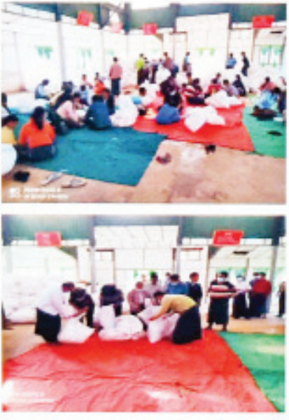
မြို့နယ်များတွင် မဲလက်မှတ်များ မြေပြင်စစ်ဆေးမှု မှတ်တမ်းဓာတ်ပုံများကို တွေ့ရစဉ်။