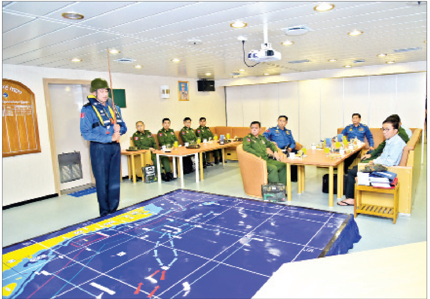
နိုင်ငံတော်စီမံအုပ်ချုပ်ရေးကောင်စီဥက္ကဋ္ဌ၊ တပ်မတော်ကာကွယ်ရေးဦးစီးချုပ် ဗိုလ်ချုပ်မှူးကြီးမင်းအောင်လှိုင်နှင့်အဖွဲ့အား စစ်မျက်နှာသုံးဖက်မှ စစ်ဆင်ခြင်း Three-Dimensional Operation လေ့ကျင့်ခဲ့မှုအခြေအနေကို ရှင်းလင်းတင်ပြစဉ်။

ယင်းနောက် လေ့ကျင့်ခန်းတွင်ပါဝင်သည့် ရေငုပ်သင်္ဘောစစ်ရေယာဉ် (မင်းရဲသိင်္ခီသူ)၊ စစ်ရေယာဉ်များနှင့် တပ်မတော်(လေ)မှ ရဟတ်ယာဉ်များက