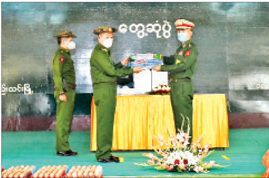
နိုင်ငံတော်စီမံအုပ်ချုပ်ရေးကောင်စီဒုတိယဥက္ကဋ္ဌ ဒုတိယတပ်မတော်ကာကွယ်ရေးဦးစီးချုပ် ကာကွယ်ရေးဦးစီးချုပ်(ကြည်း)ဒုတိယဗိုလ်ချုပ်မှူးကြီးစိုးဝင်းက အရာရှိ၊ စစ်သည်၊ မိသားစုများအတွက် စားသောက်ဖွယ်ရာများနှင့် ချီးမြှင့်ငွေများပေးအပ်ရာ တာဝန်ရှိသူတစ်ဦးက လက်ခံရယူစဉ်။

ကာကွယ်ရေးဦးစီးချုပ်(ကြည်း) ဒုတိယဗိုလ်ချုပ်မှူးကြီး စိုးဝင်းသည် နယ်မြေခံသင်တန်းကျောင်းမှ အရာရှိ၊ စစ်သည်၊ မိသားစုများအား တွေ့ဆုံ၍ ယခုဖြစ်ပေါ်လျက်ရှိသော ဆူပူအကြမ်းဖက်မှုဖြစ်စဉ်များကို အမှန်အတိုင်း သိရှိစေရန်အတွက် ဖြစ်စဉ်ဖြစ်ရပ်များအပေါ် နှစ်ဖက်မျှမျှတတ ရေးသားဖော်ပြနိုင်ရေး ပြည်ပသတင်းဌာနတစ်ခုဖြစ်သော CNN သတင်းဌာနအား သတင်းရယူခွင့်ပြုပေးခဲ့သည့် အခြေအနေများ၊ အကြမ်းဖက်ဖျက်ဆီးမှုများကို ရေးသားဖော်ပြခြင်းမရှိဘဲ ဆန့်ကျင်ဘက်အဖွဲ့များအပေါ် အသားပေးရေးသားဖော်ပြမှုအခြေအနေများ၊ ထို့ကြောင့် အရာရှိ၊ စစ်သည်များအနေဖြင့် သတင်းမှားများကို သတိထားဆင်ခြင်နိုင်ရန် လိုအပ်မှုအခြေအနေများ၊ လုံခြုံရေးတပ်ဖွဲ့ဝင်များအနေဖြင့် ဖေဖော်ဝါရီ ၄ ရက်မှ ၂၂ ရက်အတွင်း ငြိမ်းချမ်းစွာ ဆန္ဒထုတ်ဖော်သူများကို လွတ်လပ်စွာပြောဆိုပြောဆိုပေးခဲ့သည့် အခြေအနေများ၊ ဖေဖော်ဝါရီ ၂၂ ရက်နေ့ကပိုင်း ဆန္ဒပြမှုမှတစ်ဆင့် ခြိမ်းခြောက်အကျပ်ကိုင်မှု၊ ရဲစခန်း၊ တရားရုံး၊ ရပ်ကွက်အုပ်ချုပ်ရေးရုံးများအပေါ်အဝင် စက်ရုံအလုပ်ရုံများအား မီးရှို့ဖျက်ဆီးခြင်း၊ နိုင်ငံ့ဝန်ထမ်းများနှင့် အရပ်သားများအား ရက်ရက်စက်စက် ဖမ်းဆီးသတ်ဖြတ်ခြင်း၊ လုံခြုံရေးတပ်ဖွဲ့ဝင်များအား အသက်အန္တရာယ်ထိခိုက်စေနိုင်သည့်အထိ သေစေနိုင်သော လက်နက်များ စွဲကိုင်ထိပ်တိုက်ရင်ဆိုင် ပစ်ခတ်လာခြင်း၊ ဆူပူအကြမ်းဖက်သူများကို ပြည်ပမှ တရားမဝင်ရယူထားသော ငွေကြေးများဖြင့် ထောက်ပံ့ပေးကာ အကြမ်းဖက်မှုများ ဖြစ်ပေါ်လာအောင်စေခိုင်းခြင်း တို့နှင့်ပတ်သက်၍လည်းကောင်း၊ နိုင်ငံ့ရင်းနှီးမြှုပ်နှံမှုနှင့် နိုင်ငံတကာဆက်ဆံရေးပျက်ယွင်းစေရန် စက်ရုံအလုပ်ရုံများ မီးရှို့ဖျက်ဆီးလာမှုကြောင့် မြို့နယ်ခြောက်မြို့နယ်အား စစ်အုပ်ချုပ်ရေးအမိန့် (Martial Law)မဖြစ်မနေ ထုတ်ပြန်ခဲ့ရမှုအခြေအနေများနှင့်