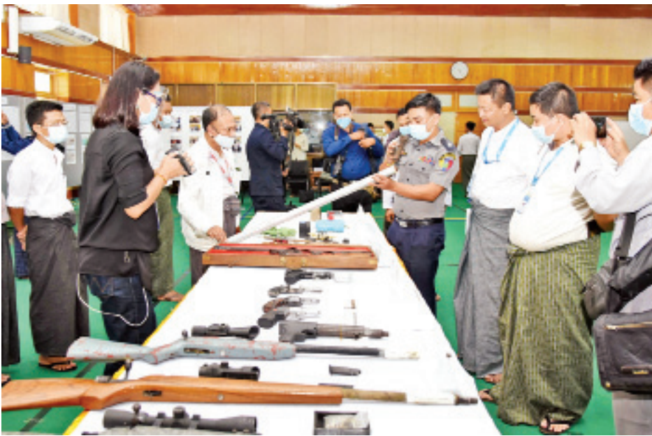
သတင်းစာရှင်းလင်းပွဲသို့ တက်ရောက်လာကြသူများက ဆူပူအကြမ်းဖက်မှုများတွင် အသုံးပြုလာသော ဒေသန္တရလုပ် လက်နက်၊ ကိရိယာပစ္စည်းများကို ကြည့်ရှုလေ့လာကြစဉ်။

ဧပြီလ ၆ ရက်နေ့ တွေ့ဆုံပွဲတွင် ပြောကြားခဲ့သည့် Video ဖိုင်အား ပြသသွားမည်ဖြစ်ကြောင်း၊ ဒါကိုကြည့်လျှင် CDM ဆိုတာ ပြည်သူ့လူထု၏ဘဝကို ဖျက်ဆီးနေသည့် နိုင်ငံကိုဖျက်ဆီးနေသည့် နိုင်ငံဖျက်၊ ပြည်သူ့ဘဝကို ဖျက်ဆီးနေသည့်လှုပ်ရှားမှု Country Destructive Movement ဟု ပြောချင်ကြောင်း၊ ၎င်းကိုဦးဆောင်နေသည့် အဖွဲ့နှစ်ခုရှိကြောင်း၊ ပြည်ပနှင့် ပြည်တွင်းပဲဖြစ်ကြောင်း၊ ပြည်ပတွင်လည်း ပြည်ပရောက် မြန်မာနိုင်ငံသားများပါကြောင်း၊ ပြည်ပအထောက်အပံ့များကို မျှော်လင့်ပြီး လုပ်ဆောင်နေတာရှိကြောင်း၊ မြန်မာ့ပြည်တွင်းရေးကို အစဉ်တစိုက် နှောင့်ယှက်နေသည့် ပြည်ပအဖွဲ့အစည်းများ ပါကြောင်း၊ ပြည်တွင်းတွင်လည်း NLD အမာခံများ၊ အစွန်းရောက်များပါကြောင်း၊ CRPH ဆိုသည့် Committee Representing Pyi- Pyay Hluttaw လိုဟာမျိုးတွေပါကြောင်း၊ ပြည်ပြေးလွတ်တော်ဟု ပြောလိုကြောင်း၊ CDM ကို စတင်လှုံ့ဆော်ခဲ့သူ၊ ဦးဆောင်ခဲ့သူ မည်သူဆိုတာ သိပြီးဖြစ်ကြောင်း၊ ပြင်းပြင်းထန်ထန်ဥပဒေအရ အရေးယူမည်ဖြစ်ကြောင်း ရှင်းလင်းပြောကြားသည်။