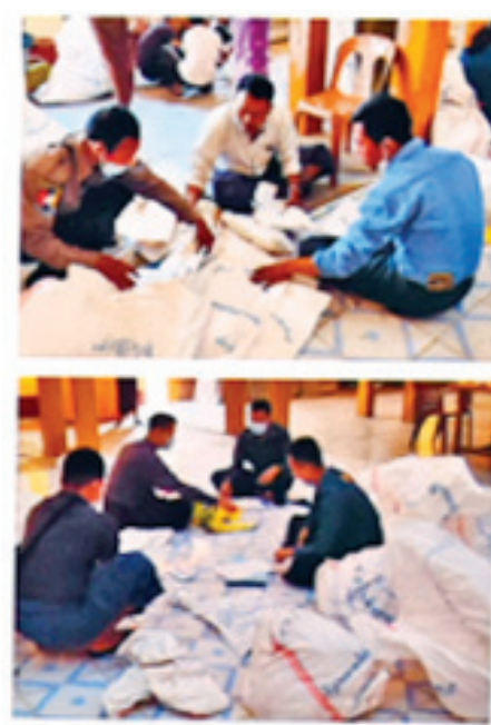
မြို့နယ်များတွင် မဲလက်မှတ်များ မြေပြင်စစ်ဆေးမှု မှတ်တမ်းဓာတ်ပုံများကို တွေ့ရစဉ်။