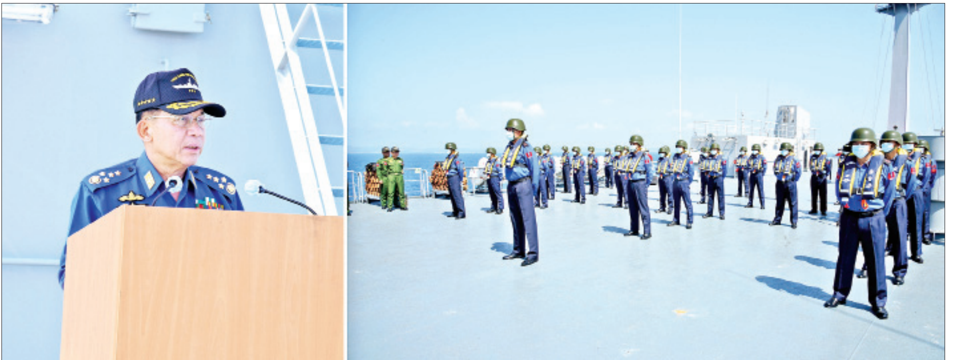
နိုင်ငံတော်စီမံအုပ်ချုပ်ရေးကောင်စီဥက္ကဋ္ဌ၊ တပ်မတော်ကာကွယ်ရေးဦးစီးချုပ် ဗိုလ်ချုပ်မှူးကြီးမင်းအောင်လှိုင် လေ့ကျင့်ခန်းတွင်ပါဝင်သည့် တာဝန်ရေတပ်မမှူးနှင့် အရာရှိစစ်သည်များကို အမှာစကား ပြောကြားစဉ်။

နေပြည်တော် ဧပြီ ၁၀ တပ်မတော်အနေဖြင့် နိုင်ငံတော်၏ အချုပ်အခြာအာဏာနှင့် ပိုင်နက်နယ်မြေကို လုံခြုံစွာ ကာကွယ်စောင့်ရှောက်နိုင်ရန်နှင့် ကာကွယ်ရေးစွမ်းရည် ထက်မြက်မြင့်မားစေရန် တပ်မတော်(ကြည်း၊ ရေ၊ လေ) လေ့ကျင့်ခန်းများကို အမြဲမပြတ် လေ့ကျင့်ဆောင်ရွက် လျက်ရှိရာ ယခုနှစ်တွင်လည်း ဧပြီ ၂ ရက်မှစ၍ မြန်မာ့ရေပြင်ပိုင်နက် ဘင်္ဂလား ပင်လယ်အော်အတွင်း တပ်မတော်(ရေ)မှ ရေငုပ်သင်္ဘော စစ်ရေယာဉ် (မင်းရဲသိင်္ခီသူ) အပါအဝင် စစ်ရေယာဉ်များဖြင့် စစ်နည်းဗျူဟာအဆင့် ဝေဟင်၊ ရေပြင်၊ ရေအောက် စစ်ဆင်မှုနှင့် ပစ်ခတ်မှုလေ့ကျင့်ခန်း (Three-Dimensional Naval Exercise-Sea Shield 2020) လေ့ကျင့်ဆောင်ရွက်လျက်ရှိသည်။ ထိုသို့ လေ့ကျင့်ဆောင်ရွက်နေမှုများအား ယနေ့တွင် နိုင်ငံတော်စီမံအုပ်ချုပ်ရေး ကောင်စီဥက္ကဋ္ဌ တပ်မတော်ကာကွယ်ရေးဦးစီးချုပ် ဗိုလ်ချုပ်မှူးကြီးမင်းအောင်လှိုင် သည် ကောင်စီအဖွဲ့ဝင်များဖြစ်ကြသည့် ဗိုလ်ချုပ်ကြီးမောင်မောင်ကျော်၊ ဒုတိယ ဗိုလ်ချုပ်ကြီး မိုးမြင့်ထွန်း၊ ကောင်စီတွဲဖက်အတွင်းရေးမှူး ဒုတိယဗိုလ်ချုပ်ကြီး ရဲဝင်းဦး၊ စီမံကိန်း၊ ဘဏ္ဍာရေးနှင့် စက်မှုဝန်ကြီးဌာန ပြည်ထောင်စုဝန်ကြီး ဦးဝင်းရှိန်၊ ကာကွယ်ရေးဦးစီးချုပ်(ရေ) ဗိုလ်ချုပ်ကြီး မိုးအောင်၊ ကာကွယ်ရေးဦးစီးချုပ်ရုံး(ကြည်း၊ ရေ၊ လေ)မှ တပ်မတော်အရာရှိကြီးများ၊ အနောက်တောင်တိုင်းစစ်ဌာနချုပ် တိုင်းမှူး ဗိုလ်ချုပ်အောင်အောင်နှင့် တာဝန်ရှိသူများလိုက်ပါ၍ သွားရောက်ကြည့်ရှုစစ်ဆေး သည်။ စာမျက်နှာ ၃ ကော်လံ ၁ သို့ ☆