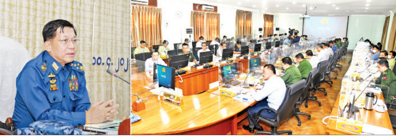
နိုင်ငံတော်စီမံအုပ်ချုပ်ရေးကောင်စီဥက္ကဋ္ဌ တပ်မတော်ကာကွယ်ရေးဦးစီးချုပ် ဗိုလ်ချုပ်မှူးကြီးမင်းအောင်လှိုင် ဧရာဝတီတိုင်းဒေသကြီး စီမံအုပ်ချုပ်ရေးကောင်စီအဖွဲ့ဝင်များနှင့် ဌာနဆိုင်ရာဝန်ထမ်းများအား တွေ့ဆုံအမှာစကားပြောကြားစဉ်။

နေပြည်တော် ဧပြီ ၁၀ နိုင်ငံတော် စီမံအုပ်ချုပ်ရေးကောင်စီ ဥက္ကဋ္ဌ တပ်မတော်ကာကွယ်ရေးဦးစီးချုပ် ဗိုလ်ချုပ်မှူးကြီးမင်းအောင်လှိုင်သည် ယနေ့မနက်လွှဲပိုင်းတွင် ဧရာဝတီတိုင်းဒေသကြီး စီမံအုပ်ချုပ်ရေးကောင်စီ အဖွဲ့ဝင်များနှင့် ဌာနဆိုင်ရာဝန်ထမ်းများအား ဧရာဝတီတိုင်းဒေသကြီး စီမံအုပ်ချုပ်ရေးကောင်စီရုံး၌ တွေ့ဆုံအမှာစကားပြောကြားသည်။