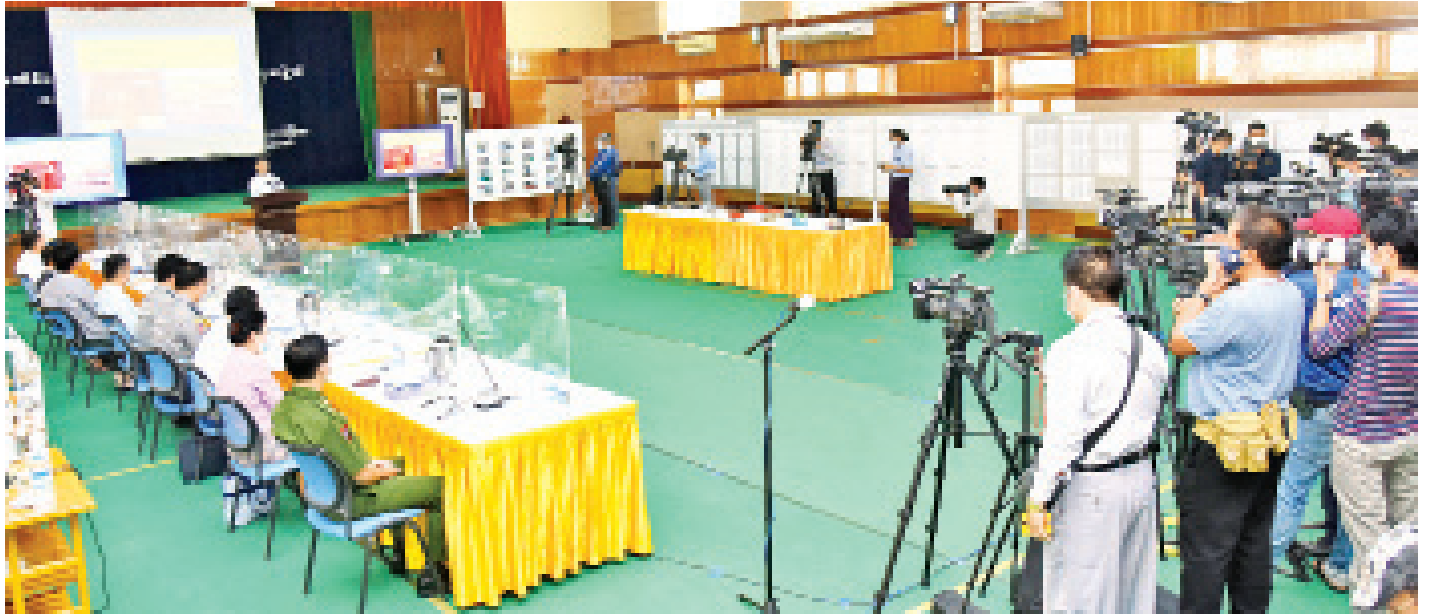
နိုင်ငံတော်စီမံအုပ်ချုပ်ရေးကောင်စီ၊ သတင်းထုတ်ပြန်ရေးအဖွဲ့က သတင်းမီဒီယာများနှင့်တွေ့ဆုံ၍ ၄/၂၀၂၁ ကြိမ်မြောက် သတင်းစာရှင်းလင်းပွဲပြုလုပ်စဉ်။

၃။ ဦးစွာ ဗိုလ်ချုပ်ဇော်မင်းထွန်းက နိုင်ငံတော်စီမံအုပ်ချုပ်ရေးကောင်စီအနေဖြင့် နိုင်ငံတော်အစိုးရရဲ့ မူဝါဒများ၊ ရှေ့ဆက်လုပ်မယ့်လုပ်ငန်းစဉ်များနှင့် ပတ်သက်ပြီး ကောင်စီအစည်းအဝေး၊ စီမံခန့်ခွဲရေးကော်မတီအစည်းအဝေးများ ပြုလုပ်သုံးသပ်ဆောင်ရွက်လျက်ရှိကြောင်း၊ ဒီမိုကရေစီကျင့်စဉ်များအတိုင်း၊ စုပေါင်းဆွေးနွေးညှိနှိုင်းအဖြေရှာခြင်းနည်းလမ်းများအတိုင်း ဆောင်ရွက်လျက်ရှိကြောင်း၊ မတ်လနှင့် ဧပြီလပထမပတ်အတွင်း ကောင်စီအစည်းအဝေး ၅ ကြိမ်၊ စီမံခန့်ခွဲရေးကော်မတီအစည်းအဝေး ၂ ကြိမ်ပြုလုပ်ခဲ့ပြီး မူဝါဒများနှင့် ရှေ့ဆက်ဆောင်ရွက်မည့် လုပ်ငန်းများအနေဖြင့်