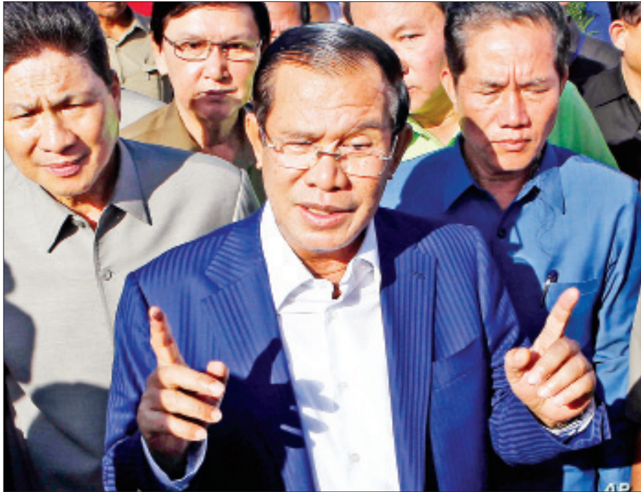
ထို့အပြင် မြို့တော်ဖနောင်ပင်တွင် နှာခေါင်းစည်း များကို မဖြစ်မနေဝတ်ဆင်ရမည်ဖြစ်ပြီး နှာခေါင်းစည်း ဝတ်ဆင်ရန် စည်းမျဉ်းစည်းကမ်း ချိုးဖောက်သူများ သည် အမေရိကန်ဒေါ်လာ ၂၅၀ ဒဏ်ငွေရိုက်ခံရ မည်ဖြစ်ကြောင်း သိရ သည်။ “ကိုဗစ်-၁၉ ရောဂါ ထိန်းချုပ်ရေးအစီအမံတွေ

သို့ဖြစ်ရာ အာဏာပိုင်များက ပြည်နယ်တစ်ခုနှင့် ပြည်နယ်တစ်ခုအကြား ခရီးသွားလာမှုပိတ်ပင် တားမြစ်ခြင်း၊ မြို့တော်ဖနောင်ပင်တွင် ညမထွက်ရ အမိန့်ချမှတ်ခြင်းနှင့် နာမည်ကြီးအန်ကောဝပ် ရှေးဟောင်း သုတေသနဆိုင်ရာ ဥယျာဉ်အပါအဝင် အထင်ကရခရီးသွားနေရာများအား ပိတ်ခြင်းများကို ယခု သတင်းပတ်အတွင်း ပြုလုပ်ခဲ့သည်။