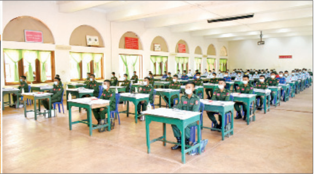
နိုင်ငံတော်စီမံအုပ်ချုပ်ရေးကောင်စီဒုတိယဥက္ကဋ္ဌ ဒုတိယတပ်မတော်ကာကွယ်ရေးဦးစီးချုပ် ကာကွယ်ရေးဦးစီးချုပ်(ကြည်း)ဒုတိယဗိုလ်ချုပ်မှူးကြီးစိုးဝင်း ခြေလျင် တပ်စုမှူးသင်တန်းသားများနှင့် တွေ့ဆုံဆွေးနွေးစဉ်။

မွေးမြူရေးစုန်သို့ သွားရောက်၍ ရာသီ သီးနှံများကို Green House စနစ်၊ မြေအစားထိုး ပေါင်တင်စနစ်၊ ရေအစက်ချ စနစ်များဖြင့် စိုက်ပျိုးထားရှိမှု၊ ကျောက်စိမ်း ဖီးကြမ်းတစ်ရှူးငှက်ပျော စိုက်ပျိုးထားရှိမှု၊ ဥစားကြက်များအား မြေစိုက်ရေကန် အမျိုးအစားနှင့် လေလုံအအေးပေးစနစ် တို့ဖြင့် မွေးမြူထားမှု၊ အသားတိုးနှုန်းနှင့် နို့စားနှုန်း မွေးမြူထားမှု၊ DYL ဝက်များ မွေးမြူထားရှိမှု အခြေအနေများအား လှည့်လည်ကြည့်ရှုစစ်ဆေးပြီး ဆောင်ရွက် ရမည့်အချက်များကို ရှင်းလင်းမှာကြား သည်။ အဆိုပါ စံပြုစိုက်ပျိုး၊ မွေးမြူရေးစုန် အတွင်း ရာသီသီးနှံများကို အထွက်နှုန်းတိုး စေရန် ခေတ်မီနည်းပညာများဖြင့် စိုက်ပျိုး ထားရှိပြီး ဥစားကြက်၊ အသားတိုးကြက်၊ အသားတိုးနှုန်း၊ နို့စားနှုန်း၊ အသားတိုးဝက် နှင့် ဆိတ်တို့အား မွေးမြူထားရှိကာ တိရစ္ဆာန်များအား လွတ်ကျောင်းစနစ်ဖြင့် ထိန်းကျောင်းနိုင်စေရေး စားကျက်မြေ ၂၁ ဧကအား စိုက်ပျိုးထားရှိပြီး ယင်းစားကျက်