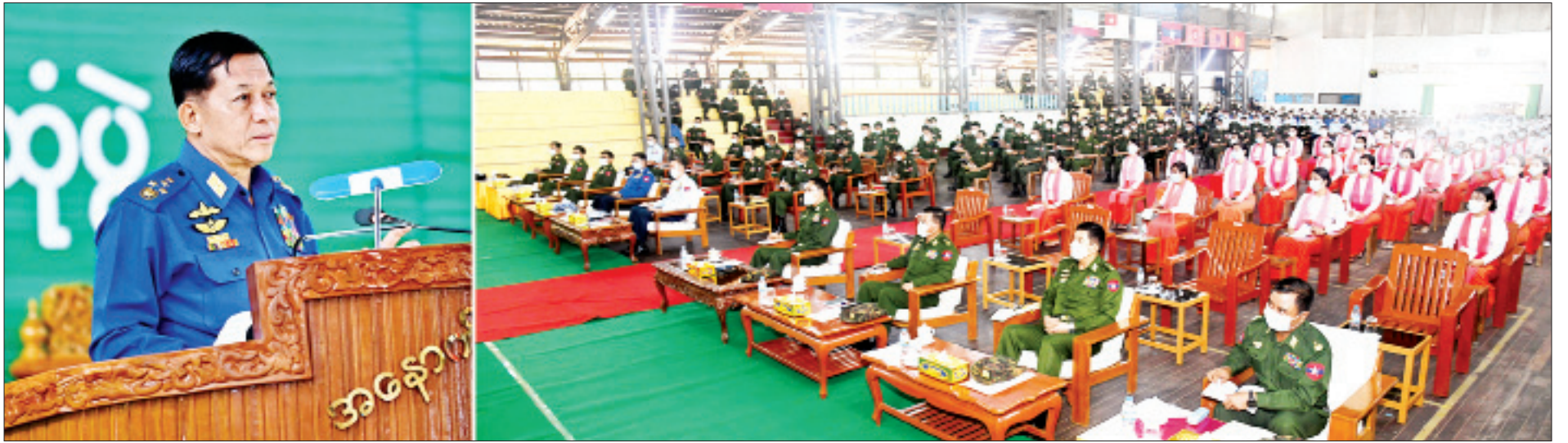
နိုင်ငံတော်စီမံအုပ်ချုပ်ရေးကောင်စီဥက္ကဋ္ဌ၊ တပ်မတော်ကာကွယ်ရေးဦးစီးချုပ် ဗိုလ်ချုပ်မှူးကြီးမင်းအောင်လှိုင် ပုသိမ်တပ်နယ်မှ အရာရှိ၊ စစ်သည်၊ မိသားစုများအား တွေ့ဆုံအမှာစကားပြောကြားစဉ်။