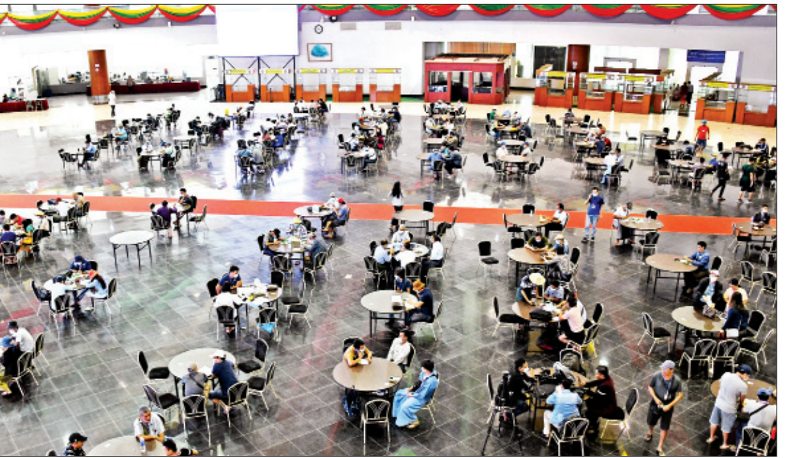
၂၀၂၁ ခုနှစ် ဧပြီလ ပုလဲအတွဲများနှင့် ကျောက်မျက်ရတနာများ မြန်မာကျပ်ငွေဖြင့် ရောင်းချပွဲ ဒသမနေ့သို့ လာရောက်ကြည့် ရတနာကုန်သည်များကို တွေ့ရစဉ်။

နေပြည်တော် ဧပြီ ၁၀ ပုလဲအတွဲများနှင့် ကျောက်မျက်ရတနာများ မြန်မာကျပ်ငွေဖြင့် ရောင်းချပွဲအား ဧပြီ ၁ ရက်မှ စတင်ကျင်းပခဲ့ရာ ယနေ့တွင် အောင်မြင်စွာကျင်းပပြီးစီးခဲ့ပြီး ပုလဲအတွဲ ၃၁၇ တွဲကို ငွေကျပ် ၁၄၂၇ ဒသမ ၂၆ သန်းဖြင့်လည်းကောင်း၊ ကျောက်စိမ်းအတွဲ ၁၉၅၅ တွဲကို ငွေကျပ် ၃၁၅၉၅ ဒသမ ၇၉ သန်းဖြင့်လည်းကောင်း၊ ကျောက်မျက် အတွဲ ၅၂ တွဲကို ငွေကျပ် ၄၂၅ ဒသမ ၈ သန်းဖြင့်လည်းကောင်း ရောင်းချခဲ့ရသည်။ ၂၀၂၁ ခုနှစ် ဧပြီလ ပုလဲအတွဲများနှင့် ကျောက်မျက်ရတနာများ မြန်မာကျပ်ငွေ ဖြင့် ရောင်းချပွဲ ဒသမနေ့ကို ယနေ့တွင် နေပြည်တော်ရှိ မဏိရတနာကျောက်စိမ်း ခန်းမ၌ ဆက်လက်ကျင်းပရာ ကျောက်စိမ်းအတွဲအမှတ် ၁၈၀၁ မှ အတွဲအမှတ် ၂၁၄၈ အထိ ကျောက်စိမ်းအတွဲ ၃၄၈ တွဲတွင် ကျောက်စိမ်းအတွဲ ၃၄၇ တွဲကို ငွေကျပ် ၇၃၁၀၇၆၀၄၄ ဖြင့် ရောင်းချခဲ့ရသည်။ “အခုလို ကိုဗစ်ကာလမှာ ကျောက်မျက်ရတနာလုပ်ငန်းရှင်တွေ ငွေကြေး လည်ပတ်မှုရှိစေဖို့နဲ့ ကျောက်စိမ်းကိုအမှီပြုလုပ်ကိုင်ရတဲ့ ကျောက်မျက်ရတနာ အချောထည်လုပ်ငန်းတွေအတွက် စာမျက်နှာ ၂၉ ကော်လံ ၁ သို့ ✕