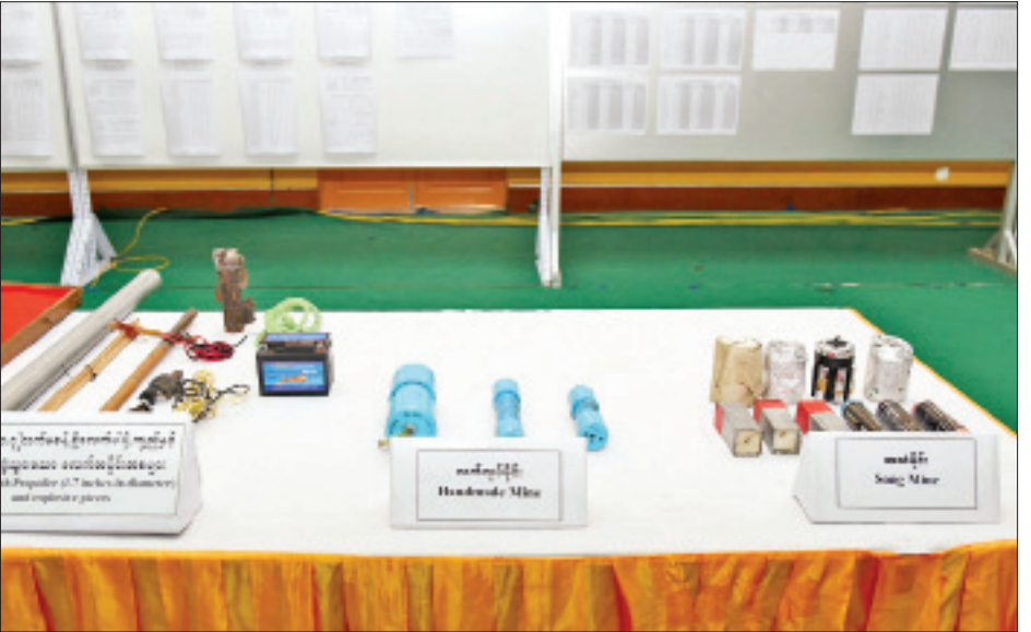
ဆူပူအကြမ်းဖက်မှုများတွင် အသုံးပြုလာသော ဒေသန္တရလုပ် လက်နက်၊ ကိရိယာပစ္စည်းများကို တွေ့ရစဉ်။