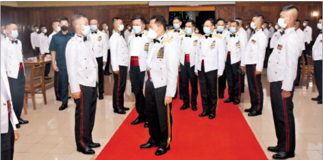
နိုင်ငံတော်စီမံအုပ်ချုပ်ရေးကောင်စီ ဒုတိယဥက္ကဋ္ဌ ဒုတိယတပ်မတော်ကာကွယ်ရေးဦးစီးချုပ် ကာကွယ်ရေးဦးစီးချုပ် (ကြည်း) ဒုတိယ ဗိုလ်ချုပ်မှူးကြီး စိုးဝင်းက သင်တန်းဆင်းအရာရှိများကို ရင်းရင်းနှီးနှီးလိုက်လံနှုတ်ဆက်စဉ်။

ထို့နောက် နိုင်ငံတော်စီမံအုပ်ချုပ်ရေးကောင်စီ ဒုတိယဥက္ကဋ္ဌ ဒုတိယတပ်မတော် ကာကွယ်ရေးဦးစီးချုပ် ကာကွယ်ရေးဦးစီးချုပ် (ကြည်း) ဒုတိယဗိုလ်ချုပ်မှူးကြီး စိုးဝင်းသည် ဂုဏ်ပြုညစာစားပွဲသို့ တက်ရောက်လာကြသူများနှင့်အတူ ညစာအတူတကွ သုံးဆောင်ကြ