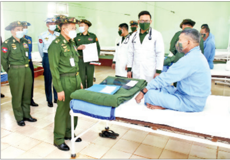
နိုင်ငံတော်စီမံအုပ်ချုပ်ရေးကောင်စီ ဒုတိယဥက္ကဋ္ဌ ဒုတိယတပ်မတော်ကာကွယ်ရေးဦးစီးချုပ် ကာကွယ်ရေးဦးစီးချုပ်(ကြည်း) ဒုတိယဗိုလ်ချုပ်မှူးကြီးစိုးဝင်း ဗထူးတပ်မြို့ရှိ တပ်မတော်ဆေးရုံ၌ တက်ရောက်ဆေးကုသမှုခံယူနေသူတစ်ဦးအား ရင်းရင်းနှီးနှီးအားပေးစကားပြောကြားစဉ်။

နေပြည်တော် ဧပြီ ၉ နိုင်ငံတော်စီမံအုပ်ချုပ်ရေးကောင်စီ ဒုတိယဥက္ကဋ္ဌ ဒုတိယတပ်မတော်ကာကွယ်ရေးဦးစီးချုပ်ကာကွယ်ရေးဦးစီးချုပ်(ကြည်း) ဒုတိယဗိုလ်ချုပ်မှူးကြီး စိုးဝင်းသည် ကာကွယ်ရေးဦးစီးချုပ်ရုံး(ကြည်း၊ ရေလေ)မှ တပ်မတော်အရာရှိကြီးများနှင့် အရှေ့ပိုင်းတိုင်းစစ်ဌာနချုပ်တိုင်းမှူးတို့လိုက်ပါလျက် ယနေ့နံနက်ပိုင်းတွင် ဗထူးတပ်မြို့ရှိ တပ်မတော်ဆေးရုံသို့ သွားရောက်၍ ဆေးရုံတက်ရောက်ကုသလျက်ရှိသော အရာရှိ၊ စစ်သည်မိသားစုများနှင့် ဒေသခံပြည်သူများအား တစ်ဦးချင်း ရင်းရင်းနှီးနှီး လိုက်လံအားပေးစကားပြောကြားသည်။