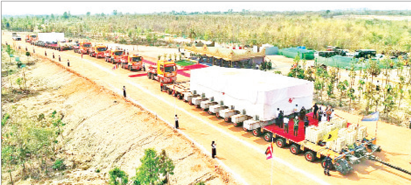
မတ် ၁၄ ရက်က ဘူမိဗေဒသမ္မတပြည်ထောင်စုက ကျောက်ဆစ်ဗုဒ္ဓရုပ်ပွားတော်မြတ်ကြီး၏ ပလ္လင်တော် အပိုင်း ၂ နှင့် အပိုင်း (၁/၂) အရန်တို့ကို ကြိုဆိုပင့်ဆောင်ခြင်း မဟာမင်္ဂလာအခမ်းအနား ကျင်းပစဉ်။