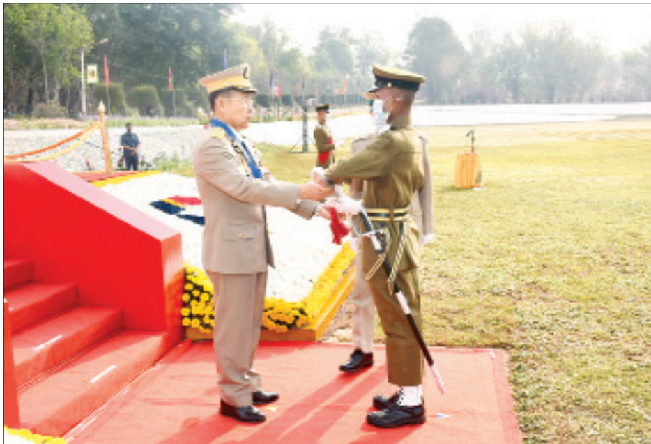
နိုင်ငံတော်စီမံအုပ်ချုပ်ရေးကောင်စီ ဒုတိယဥက္ကဋ္ဌ ဒုတိယတပ်မတော်ကာကွယ်ရေးဦးစီးချုပ် ကာကွယ်ရေးဦးစီးချုပ်(ကြည်း) ဒုတိယဗိုလ်ချုပ်မှူးကြီး သရေစည်သူစိုးဝင်းက အကောင်းဆုံး ဗိုလ်လောင်းဆုရရှိသူ ဗိုလ်လောင်းအမှတ် ၇၇ ဗိုလ်လောင်း ဟန်ဇော်ဝင်းအား ငွေစားဆုပေးအပ်ချီးမြှင့်စဉ်။

သွားကြရန် မှာကြားလိုကြောင်း။ သင်တန်းကာလ ကိုးလတာအတွင်း သင်ကြားပေးလိုက်သည့် စစ်ပညာ၊ ခေါင်းဆောင်မှုပညာနှင့် အုပ်ချုပ်မှုပညာရပ်များသည် အခြေခံမျှသာဖြစ်ကြောင်း၊ လက်တွေ့နယ်ပယ်တွင် တာဝန်ထမ်းဆောင်ကြသည့်အခါ ကြုံတွေ့ရမည့် စစ်မြေပြင်အခြေအနေနှင့် ရင်ဆိုင်ရမည့် အခက်အခဲများကို အောင်မြင်စွာ ကျော်လွှားနိုင်ရန်အတွက် သီအိုရီ၊ လက်တွေ့နှင့် အတွေ့အကြုံ ဗဟုသုတများ ပေါင်းစပ်ပြီး ဆောင်ရွက်ကြရမည်ဖြစ်ကြောင်း၊ မိမိနှင့် မိမိဦးဆောင်ရမည့် တပ်ဖွဲ့ကို အရည်အသွေးတိုးတက်လာအောင် ခေတ်နှင့်အညီ ပြောင်းလဲတိုးတက်နေသည့် စစ်နည်းဗျူဟာ