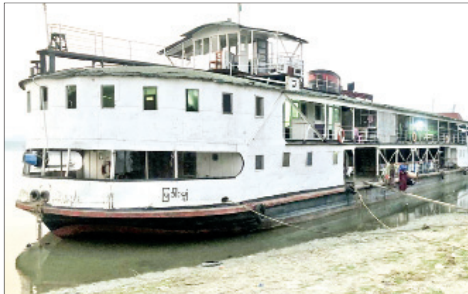
မန္တလေး-ဗန်းမော်သင်္ဘောခရီးစဉ် ပြေးဆွဲပေးနေသည့် ပြဒါးပျံသင်္ဘောကို တွေ့ရစဉ်။