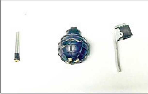
လားရှိုးမြို့နယ်တွင် ဆူပူအကြမ်းဖက်သူများ အသုံးပြုသည့် လက်ပစ်ဗုံးကို တွေ့ရစဉ်။

ထို့ပြင် ရှမ်းပြည်နယ်(မြောက်ပိုင်း) လားရှိုးမြို့ ရပ်ကွက်(၁)