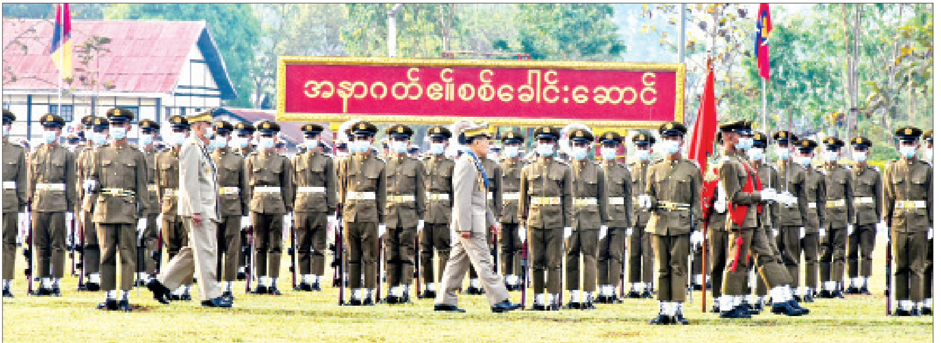
နိုင်ငံတော်စီမံအုပ်ချုပ်ရေးကောင်စီ ဒုတိယဥက္ကဋ္ဌ ဒုတိယတပ်မတော်ကာကွယ်ရေးဦးစီးချုပ် ကာကွယ်ရေးဦးစီးချုပ်(ကြည်း) ဒုတိယဗိုလ်ချုပ်မှူးကြီး သရေစည်သူစိုးဝင်း ကျောင်းဆင်းဗိုလ်လောင်းတပ်ခွဲများကို စစ်ဆေးစဉ်။