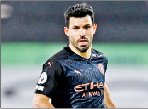
လက်ရှိအသင်းရဲ့ နံပါတ်တစ်တိုက်စစ်မှူး ပက်ထရစ်ဘမ်းဖို့ဒ်ကို ရောင်းချမယ်လို့ သတင်းတွေထွက်နေပေမယ့် အခုနှစ်နေရာသီ အပြောင်းအရွှေ့ ဈေးကွက်အတွင်းမှာ ရောင်းချသွားမှာမဟုတ်ဘူးလို့ ဆိုပါတယ်။

လိဒ်ယူနိုက်တက်အသင်းဟာ တိုက်စစ်မှူး အဂူရိုကို ခေါ်ယူပြီး