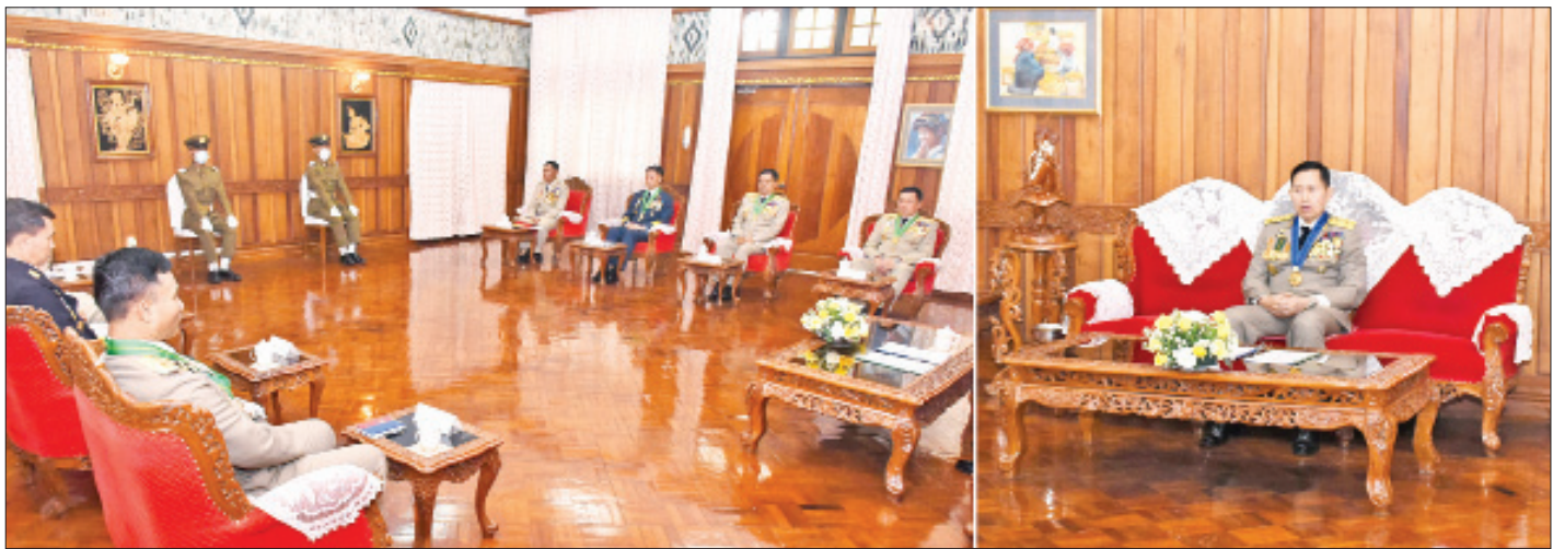
နိုင်ငံတော်စီမံအုပ်ချုပ်ရေးကောင်စီ ဒုတိယဥက္ကဋ္ဌ ဒုတိယတပ်မတော်ကာကွယ်ရေးဦးစီးချုပ် ကာကွယ်ရေးဦးစီးချုပ်(ကြည်း) ဒုတိယဗိုလ်ချုပ်မှူးကြီး သရေစည်သူစိုးဝင်း ဆုရဗိုလ်လောင်းများအား ဂုဏ်ပြုအမှာစကားပြောကြားစဉ်။

တပ်မတော်၏ အဓိကလုပ်ငန်းတာဝန်ကြီး (၃)ရပ်ဖြစ်သည့် နိုင်ငံတော်ကာကွယ်ရေး တာဝန်၊ လေ့ကျင့်ရေးတာဝန်နှင့် ပြည်သူ့အကျိုးပြုလုပ်ငန်း တာဝန်ဟူသည့်အချက်များကို ကျေပွန်စွာ ထမ်းဆောင် နိုင်ရန်အတွက် ရုပ်ပိုင်းဆိုင်ရာနှင့် စိတ်ပိုင်းဆိုင်ရာ တွင် ကျန်းမာကြံ့ခိုင်နေရန် အထူးလိုအပ်ကြောင်း၊ ရုပ်ပိုင်းဆိုင်ရာ ကြံ့ခိုင်ရေးကောင်းရန် တစ်ဦးချင်း ဆောင်ရွက်ရသည့် ကိုယ်လက်ကြံ့ခိုင်ရေးကစပြီး အဖွဲ့လိုက်ဆောင်ရွက်ရသော လေ့ကျင့်ခန်းများ ကိုလည်း သတ်မှတ်ထားသည့် ရည်မှန်းချက်အတိုင်း လေ့ကျင့်ဆောင်ရွက်နေရန် လိုအပ်ကြောင်း၊ ထို့ပြင် ကျန်းမာရေးကို ထိခိုက်စေမည့် အပြုအမူ၊ အနေ အထိုင်ကအစ ဆေးလိပ်၊ ကွမ်း၊ အရက်သေစာနှင့် မူးယစ်ဆေးဝါးများသုံးစွဲခြင်း လုံးဝ(လုံးဝ)မပြုလုပ်ရန် အလေးအနက်ထား မှာကြားလိုကြောင်း၊ ခေါင်းဆောင် ငယ်များဖြစ်သည့် ရဲဘော်တို့ကိုယ်တိုင် ကျန်းမာ ကြံ့ခိုင်သကဲ့သို့ လက်အောက်မှစစ်သည်များကိုလည်း ကျန်းမာသန်စွမ်းပြီး စိတ်ဓာတ်ခိုင်မာအောင် အစဉ် လေ့ကျင့်ပေးနေရန် လိုအပ်ကြောင်း၊ စိတ်ပိုင်းဆိုင်ရာ ကြံ့ခိုင်မှုဖြစ်စေသည့် သုတ၊ ရသ စာပေများအပြင် မိမိတို့နိုင်ငံ၏ ထင်ရှားသည့် သမိုင်းဝင်တိုက်ပွဲများနှင့် မြန်မာနှင့်ကမ္ဘာ့ထင်ရှားသော စစ်ခေါင်းဆောင် များ အကြောင်းများပါသည့် စာအုပ်၊ စာပေများကို ရှာဖွေဖတ်ရှုရန် လိုအပ်မည်ဖြစ်ကြောင်း၊ ၎င်းမှ အားကျ စရာများ၊ အတုယူစရာများ ဖြစ်ပေါ်လာမှာ ဖြစ်ကြောင်း၊ စာဖတ်ခြင်းသည် အတွေးအခေါ်နှင့်