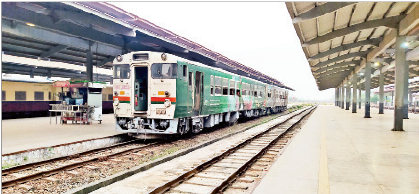
မတ် ၂၄ ရက်တွင် မြန်မာ့စီးရထားမှ RBE (၂)တွဲပါ လူစီးရထားတွဲဆိုင်းဖြင့် နေပြည်တော်-သာစည်-မန္တလေးခရီးစဉ်ကို ခရီးသွားပြည်သူများ အဆင်ပြေ စွာ သွားလာနိုင်ရန် စီစဉ်ပြေးဆွဲပေးစဉ်။

☆ ကိုဗစ်ကပ်ရောဂါကြောင့် ပြည်သူများ စိတ်နှလုံးမွန်းကျပ်မှုကို ပြေလျော့စေနိုင်ရေးအတွက် ခရီးသွားလာ အပန်းဖြေနိုင်ရေး ရည်ရွယ်၍ ကိုဗစ်-၁၉ စည်းမျဉ်းစည်းကမ်းများနှင့်အညီ ခရီးသွား လာနိုင်ရေး ဖော်တော်ယာဉ်လိုင်းများ ပြန်လည်ဖွင့်လှစ်ခြင်း၊ ခရီးသွားကန်သတ်ချက်များ ပြေလျော့ပေးခြင်းကိုလည်း ဆောင်ရွက် ပေးလျက်ရှိသည်ကို မြင်တွေ့ရ