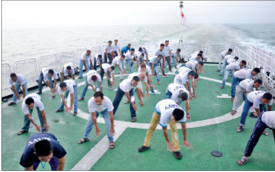
အိန္ဒိယနိုင်ငံတွင် ရောက်ရှိနေသော မြန်မာနိုင်ငံသား ရေလုပ်သားများအား တပ်မတော်မှ စစ်ရေယာဉ် (တပင်ရွှေထီး)ဖြင့် မြန်မာနိုင်ငံသို့ ပြန်လည်ခေါ်ဆောင်ခဲ့ရာ စစ်ရေယာဉ်(တပင်ရွှေထီး)ပေါ်တွင် နံနက်ပိုင်း ကျန်းမာရေးအတွက် ကာယလေ့ကျင့်ခန်းဆောင်ရွက်ပေးနေသည်ကို တွေ့ရစဉ်။

များ ဆောင်ရွက်နေကြသည့်အခြေအနေ၊ နိုင်ငံတော်စီမံအုပ်ချုပ်ရေးကောင်စီ ရှေ့လုပ်ငန်းစဉ်များ၊ ဦးတည်ချက်များနှင့် လက်ရှိကိုင်တွယ်ဖြေရှင်းနေခြင်းတို့အပေါ် နိုင်ငံတကာမှသိရှိစေရန် ရည်ရွယ်ကာ အကျယ်တဝင့် ရှင်းလင်းပြောကြားနိုင်ခဲ့သည်ကိုလည်း မြင်တွေ့ရပါသည်။