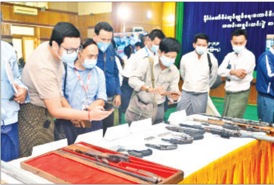
သတင်းစာရှင်းလင်းပွဲသို့ တက်ရောက်လာကြသူများက ဆူပူအကြမ်းဖက်မှုများတွင် အသုံးပြု လာသော ဒေသန္တရလုပ် လက်နက်၊ ကိရိယာပစ္စည်းများကို ကြည့်ရှုလေ့လာကြစဉ်။

နိုင်ငံတော်စီမံအုပ်ချုပ်ရေးကောင်စီဥက္ကဋ္ဌ၊ တပ်မတော်ကာကွယ်ရေးဦးစီးချုပ် ဗိုလ်ချုပ်မှူးကြီး မင်းအောင်လှိုင်အနေဖြင့် ယခုလ ၆ ရက်တွင် ပြည်ထောင်စုအဆင့်ပုဂ္ဂိုလ်များ၊ တိုင်းဒေသကြီး ပြည်နယ်ဥက္ကဋ္ဌများ၊ ဝန်ကြီး၊ ဒုတိယဝန်ကြီးများ၊