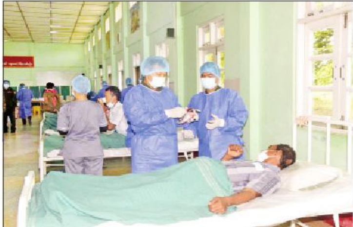
များကို အလယ်ပိုင်းတိုင်းစစ်ဌာနချုပ်မှ တာဝန်ရှိသူ စားသောက်ဖွယ်ရာများ ပေးအပ်ခဲ့ကြောင်း သတင်း သတင်းစဉ် ရရှိသည်။

စုပေါင်းသွေးလျှော့ခြင်း ထို့ပြင် မန္တလေးတိုင်းဒေသကြီး ပြင်ဦးလွင်မြို့ရှိ နယ်မြေခံတပ်မတော်ဆေးရုံတွင် တက်ရောက်ကုသ နေသော ဒေသခံပြည်သူများ သွေးလိုအပ်မှုမရှိရေး အတွက် ယနေ့နံနက်ပိုင်းတွင် မန္တလေးမြို့ ရွှေမန်း တံခွန်ပရဟိတလူမှုကူညီရေးအသင်းမှ စေတနာရှင် သွေးလျှော့စုစုပေါင်း ၅၄ ဦးတို့က စုပေါင်း သွေးလျှော့ခြင်းကြားသည်။ အဆိုပါသွေးလျှော့ခြင်းနေ့မှ