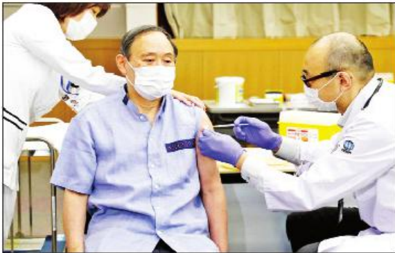
ဂျပန်ဝန်ကြီးချုပ် ဆူဂါ မတ် ၁၆ ရက်က ပထမအကြိမ် ကိုဗစ်-၁၉ ရောဂါကာကွယ်ဆေးထိုးနှံမှု ခံယူစဉ်။

တိုကျို ဧပြီ ၆ ဂျပန်နိုင်ငံဝန်ကြီးချုပ် ဆူဂါသည် အမေရိကန်နိုင်ငံသို့ မသွားရောက်မီ ယနေ့တွင် ကိုဗစ်-၁၉ ရောဂါကာကွယ်ဆေး ဒုတိယအကြိမ်ထိုးနှံမှုခံယူခဲ့ကြောင်း ယနေ့သတင်းများအရ သိရသည်။