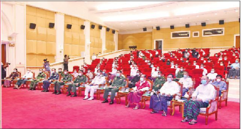
နိုင်ငံတော်စီမံအုပ်ချုပ်ရေးကောင်စီဥက္ကဋ္ဌ တပ်မတော်ကာကွယ်ရေးဦးစီးချုပ် ဗိုလ်ချုပ်မှူးကြီးမင်းအောင်လှိုင် ပြည်ထောင်စုအဆင့်ပုဂ္ဂိုလ်များ၊ ပြည်ထောင်စုဝန်ကြီးများ၊ နေပြည်တော်ကောင်စီဥက္ကဋ္ဌ တိုင်းဒေသကြီးနှင့် ပြည်နယ်စီမံအုပ်ချုပ်ရေးကောင်စီဥက္ကဋ္ဌများနှင့် ကိုယ်ပိုင်အုပ်ချုပ်ခွင့်ရတိုင်းနှင့် ဒေသစီမံအုပ်ချုပ်ရေးအဖွဲ့ဥက္ကဋ္ဌများအား တွေ့ဆုံအမှာစကား ပြောကြားစဉ်။

နေပြည်တော် ဧပြီ ၆ နိုင်ငံတော်စီမံအုပ်ချုပ်ရေးကောင်စီဥက္ကဋ္ဌ တပ်မတော်ကာကွယ်ရေးဦးစီးချုပ် ဗိုလ်ချုပ်မှူးကြီးမင်းအောင်လှိုင်သည် ယနေ့နံနက် ၁၀ နာရီတွင် နေပြည်တော်ရှိ နိုင်ငံတော်စီမံအုပ်ချုပ်ရေးကောင်စီရုံး သဘင်ဆောင်၌ ပြည်ထောင်စုအဆင့်ပုဂ္ဂိုလ်များ၊ ပြည်ထောင်စုဝန်ကြီးများ၊ နေပြည်တော်ကောင်စီဥက္ကဋ္ဌ၊ တိုင်းဒေသကြီးနှင့် ပြည်နယ် စီမံအုပ်ချုပ်ရေးကောင်စီဥက္ကဋ္ဌများ၊ ကိုယ်ပိုင်အုပ်ချုပ်ခွင့်ရတိုင်းနှင့် ဒေသစီမံအုပ်ချုပ်ရေးအဖွဲ့ဥက္ကဋ္ဌများအား တွေ့ဆုံအမှာစကား ပြောကြားသည်။