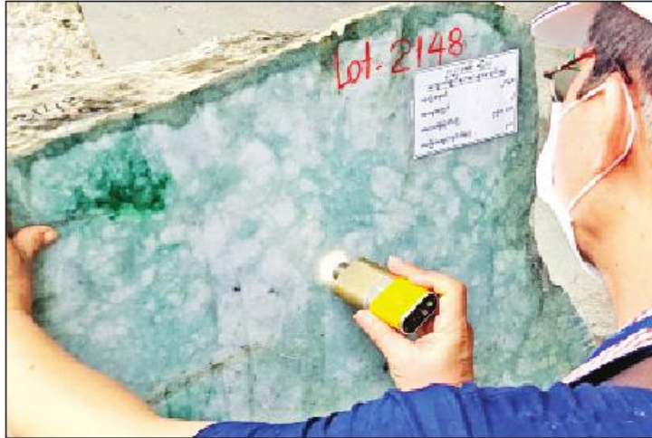
ထည့်သွင်းကြသည်။ ထို့နောက် ကျောက်စိမ်းအတွဲအမှတ်(၄၅၁)မှ အတွဲအမှတ်(၉၀၀)အထိ တင်သွင်းထားသည့် ဈေးနှုန်းတင်သွင်းလွှာများကို တာဝန်ရှိသူများက နံနက် ၁၁ နာရီတွင် ပိတ်သိမ်းပြီး ဖွင့်ဖောက်စစ်ဆေးကာ ဧပြီ ၇ ရက် နံနက် ၈ နာရီတွင် ရောင်းချရသည်။

ယခုရောင်းချပွဲ ဆဋ္ဌမနေ့တွင် ကျောက်စိမ်းအတွဲအမှတ်(၄၅၁) မှ အတွဲအမှတ် (၉၀၀) အထိကို အိတ်ဖွင့်တင်ဒါစနစ်ဖြင့် ရောင်းချပေးခဲ့ရာ ရတနာကုန်သည်များက မဏိရတနာ ကျောက်စိမ်းခန်းမအတွင်း သတ်မှတ်နယ်မြေအလိုက် ခင်းကျင်းပြသထားသည့် ကျောက်စိမ်းအတွဲများကို ကြည့်ရှုစစ်ဆေးကြပြီး ဈေးနှုန်းတင်သွင်းလွှာများကို တင်ဒါပုံစံများအတွင်းသို့ နံနက် ၁၁ နာရီ နောက်ဆုံးထား၍