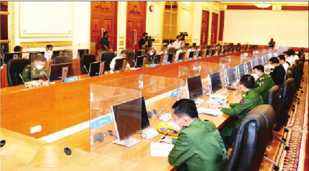
နိုင်ငံတော်စီမံအုပ်ချုပ်ရေးကောင်စီဥက္ကဋ္ဌ တပ်မတော်ကာကွယ်ရေးဦးစီးချုပ် ဗိုလ်ချုပ်မှူးကြီး မင်းအောင်လှိုင် တိုင်းဒေသကြီးနှင့် ပြည်နယ်စီမံအုပ်ချုပ်ရေးကောင်စီဥက္ကဋ္ဌများ၊ ကိုယ်ပိုင်အုပ်ချုပ်ခွင့်ရ တိုင်းနှင့် ဒေသစီမံအုပ်ချုပ်ရေးအဖွဲ့ ဥက္ကဋ္ဌများအား တွေ့ဆုံအမှာစကား ပြောကြားစဉ်။

နေပြည်တော် ဧပြီ ၆ နိုင်ငံတော်စီမံအုပ်ချုပ်ရေးကောင်စီဥက္ကဋ္ဌ တပ်မတော်ကာကွယ်ရေးဦးစီးချုပ် ဗိုလ်ချုပ်မှူးကြီး မင်းအောင်လှိုင်သည် ယနေ့မုန်းလွဲပိုင်းတွင် တိုင်းဒေသကြီးနှင့်ပြည်နယ် စီမံအုပ်ချုပ်ရေးကောင်စီဥက္ကဋ္ဌများ၊ ကိုယ်ပိုင်အုပ်ချုပ်ခွင့်ရတိုင်းနှင့် ဒေသစီမံအုပ်ချုပ်ရေးအဖွဲ့ဥက္ကဋ္ဌများအား နေပြည်တော်ရှိ နိုင်ငံတော်စီမံအုပ်ချုပ်ရေးကောင်စီဥက္ကဋ္ဌရုံးအစည်းအဝေးခန်းမ၌ တွေ့ဆုံ၍ တိုင်းဒေသကြီးနှင့် ပြည်နယ်၊ ဒေသဖွံ့ဖြိုးတိုးတက်ရေးဆိုင်ရာကိစ္စရပ်များနှင့်စပ်လျဉ်း၍ ဆွေးနွေးသည်။ တွေ့ဆုံပွဲသို့ နိုင်ငံတော်စီမံအုပ်ချုပ်ရေးကောင်စီဒုတိယဥက္ကဋ္ဌ ဒုတိယတပ်မတော်ကာကွယ်ရေးဦးစီးချုပ် ကာကွယ်ရေးဦးစီးချုပ် (ကြည်း) ဒုတိယဗိုလ်ချုပ်မှူးကြီး စိုးဝင်း၊ ကောင်စီဝင် ဒုတိယဗိုလ်ချုပ်ကြီး စိုးထွန်း၊ စာမျက်နှာ ၃ ကော်လံ ၁ သို့ ၁*