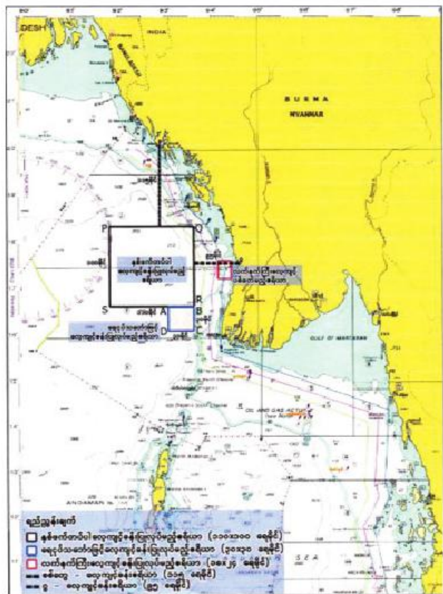
စစ်နည်းဗျူဟာအဆင့် ဝေဟင်၊ ရေပြင်၊ ရေအောက်စစ်ဆင်မှုနှင့် ပစ်ခတ်မှုလေ့ကျင့်ခန်း (နှစ်ဖက်တပ်ပါ) လေ့ကျင့်ခန်း- ဆင်ဖြူရှင်(၁/၂၀၂၁) လေ့ကျင့်ခန်းဧရိယာပြပုံ

ပါရဂူဘွဲ့သင်တန်းနှင့် ပါရဂူဘွဲ့ကြိုသင်တန်း လျှောက်လွှာများ ၁၂-၄-၂၀၂၁ ရက်နေ့အထိ လျှောက်ထားနိုင် နေပြည်တော် ဧပြီ ၆ ပညာရေးဝန်ကြီးဌာနရှိ ပါရဂူဘွဲ့သင်တန်းနှင့်လွှဲသော ဝိဇ္ဇာသိပ္ပံ တက္ကသိုလ်များ၊ စီးပွားရေးတက္ကသိုလ်များ၊ ပညာရေးတက္ကသိုလ်များ၊ နည်းပညာတက္ကသိုလ်များနှင့် ကွန်ပျူတာတက္ကသိုလ်များ၏ ပါရဂူ ဘွဲ့ကြို (Ph.D Prelim) သင်တန်းတက်ရောက် ရန်အတွက် သက်ဆိုင်ရာ တက္ကသိုလ်၊ ကျောင်းသားရေးရာဌာနကွပ်ကဲ သတ်မှတ်ပုံစံ ဖြင့် ၆-၄-၂၀၂၁ ရက် (အင်္ဂါနေ့) နောက်ဆုံးထား၍ လျှောက်ထားရမည်ဖြစ်ကြောင်း သတင်းစာများတွင် ကြော်ငြာခေါ်ယူထားပြီး ဖြစ်သော်လည်း အဆိုပါ နောက်ဆုံး လျှောက်ထားရမည့် ၆-၄-၂၀၂၁ ရက်အစား ရက်တိုးမြှင့်၍ ၁၂-၄-၂၀၂၁ ရက် (တနင်္လာနေ့)အထိ လျှောက်ထားနိုင်ကြောင်း ပညာရေးဝန်ကြီးဌာနက ထပ်မံ ကြေညာ ထားကြောင်း သိရှိရသည်။ သတင်းစဉ်