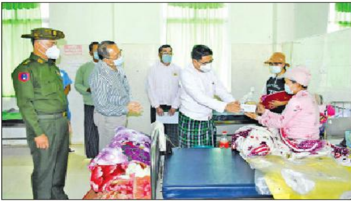
ပွဲပြီးတိုးတက်မှုမြန်ဆန်အားကောင်းလာစေရန် ဝိုင်းဝန်းကြိုးပမ်းဆောင်ရွက်

ကချင်ပြည်နယ် စီမံအုပ်ချုပ်ရေးကောင်စီဥက္ကဋ္ဌ ဦးခက်ထိန်နီသည် ကောင်စီအဖွဲ့ဝင်များ၊ ဌာနဆိုင်ရာတာဝန်ရှိသူများနှင့်အတူ ဧပြီ ၃ ရက် နံနက်ပိုင်းက မြစ်ကြီးနားခရိုင် ဝိုင်းမော်မြို့တွင် မြို့နယ် အထွေထွေအုပ်ချုပ်ရေးဦးစီးဌာနရုံးဝင်း အတွင်းရှိ ဆေးခန်းမ၌ မြို့နယ်စီမံအုပ်ချုပ်ရေး အဖွဲ့ဝင်များ၊ ဌာနဆိုင်ရာများ၊ မြို့မိမြို့ဖများ၊ ဘာသာရေးအသင်းအဖွဲ့ခေါင်းဆောင်များ၊ ရပ်/ကျေး တာဝန်ရှိသူများနှင့် တွေ့ဆုံသည်။