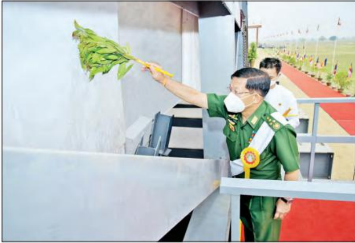
နိုင်ငံတော်စီမံအုပ်ချုပ်ရေးကောင်စီဥက္ကဋ္ဌ တပ်မတော်ကာကွယ်ရေးဦးစီးချုပ် ဗိုလ်ချုပ်မှူးကြီး မင်းအောင်လှိုင် ဘူမိဗေဒဗဟိုဌာန ထိုင်တော်မူ ကျောက်ဆစ်ဗုဒ္ဓရုပ်ပွားတော်မြတ်ကြီး၏ ဆင်းတုတော် အပိုင်း(၁)အား ပရိတ်နံ့သာရည်ဖြင့် ပက်ဖျန်းပူဇော်စဉ်။

တက်ရောက်ကြည့်ညို့ အခမ်းအနားသို့ မန္တလေးတိုင်းဒေသကြီး ချမ်းမြသာစည်မြို့နယ် ဓမ္မိကာရာမကျောင်းတိုက် ရတနာပုံကျောင်းဆရာတော် အဂ္ဂမဟာပဏ္ဍိတ ဘဒ္ဒန္တ သီဟနာဒနှင့် ငါနိုးစွန်မြို့နယ် သံဃနယက ဥက္ကဋ္ဌ ဘဒ္ဒန္တ မာဏိတတို့ အမှုပြုသည့် ဆရာတော်၊ သံဃာတော်များ ကြွရောက်ချီးမြှင့်တော်မူကြပြီး နိုင်ငံတော်စီမံအုပ်ချုပ်ရေးကောင်စီဥက္ကဋ္ဌ တပ်မတော် ကာကွယ်ရေးဦးစီးချုပ် ဗိုလ်ချုပ်မှူးကြီးမင်းအောင်လှိုင်၊ ကောင်စီဝင်များဖြစ်ကြသည့် ဗိုလ်ချုပ်ကြီး မောင်မောင်ကျော်၊ ဒုတိယဗိုလ်ချုပ်ကြီးမိုးမြင့်ထွန်း၊ ကောင်စီတွဲဖက်အတွင်းရေးမှူး ဒုတိယဗိုလ်ချုပ်ကြီး ရဲဝင်းဦး၊ သာသနာရေးနှင့် ယဉ်ကျေးမှုဝန်ကြီးဌာန ပြည်ထောင်စုဝန်ကြီးဦးကိုကို၊ ပညာရေးဝန်ကြီးဌာန ပြည်ထောင်စုဝန်ကြီး ဦးညွန့်ဖေ၊ ကျန်းမာရေးနှင့် အားကစားဝန်ကြီးဌာန ပြည်ထောင်စုဝန်ကြီး ကော်တာသက်နိုင်ဝင်း၊ မန္တလေးတိုင်းဒေသကြီး