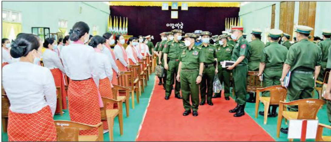
စစ်ဆေးတွေ့ရှိရသဖြင့် ဆက်လက်စစ်ဆေး ဆောင်ရွက်လျက်ရှိကြောင်း။

နိုင်ငံတော်စီမံအုပ်ချုပ်ရေးကောင်စီအနေဖြင့် ရွှေ့လုပ်ငန်းစဉ် (၅) ရပ်နှင့် နိုင်ငံရေး၊ စီးပွားရေး၊ လူမှုရေး ဘက်စုံတိုးတက်ရေးအတွက် ဦးတည်ချက် (၉) ရပ် ချမှတ်ကာ လုပ်ဆောင်လျက်ရှိကြောင်း တပ်မတော်၏ အဓိက လုပ်ငန်းတာဝန်သည် နိုင်ငံတော်ကာကွယ်ရေးတာဝန်ဖြစ်ပြီး စွမ်းရည် စွမ်းအားနှင့် ပြည့်စုံသည့် တပ်မတော်ဖြစ်အောင် ကြိုးပမ်းဆောင်ရွက်ရမည်ဖြစ်ကြောင်း။