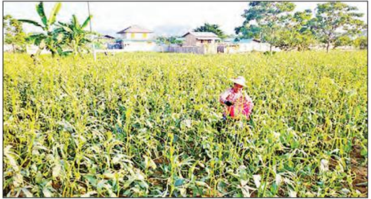
ကျောက်ဆည်မြို့၌ ရုံးပတ်စိုက်ပျိုးရောင်းချခြင်းဖြင့် မိသားစုများနေ့စဉ်ဝင်ငွေရရှိ

ကျောက်ဆည် ဧပြီ ၄ မန္တလေးတိုင်းဒေသကြီးကျောက်ဆည်မြို့တိုင်းလည် ရပ်ကွက်တွင် ရုံးပတ်ပင်များ တစ်ပိုင်တစ်နိုင် စိုက်ပျိုး ရောင်းချခြင်းဖြင့် မိသားစုများနေ့စဉ်အပိုဝင်ငွေရရှိ ကာ စားဝတ်နေရေး အဆင်ပြေလျက်ရှိကြောင်း သိရ သည်။ "မြေကတော့ လေးစကရှိပါတယ် ဇော်ဂျီမြစ်ဘေး သဲနုနုမြေတွေဆိုတော့ စပါးစိုက်လို့မရတော့ မစိုက် သုံးပေါ့နော်ပြီး မိသားစုကလည်း မြောက်ယောက် ရှိတော့ မိသားစုအနေနဲ့ တစ်ပိုင်တစ်နိုင်လည်းဖြစ် နေ့စဉ်ဝင်ငွေရမယ် ရုံးပတ်၊ ခွေးတောက်၊ ခရမ်းသီး၊ ချဉ်ပေါင်း၊ မုန့်လာဥ၊ ဆူးပန်း စတဲ့ရာသီပေါ် နေ့စဉ် ဝင်ငွေရ အသီးအနှံတွေကို နှစ်ပတ်လည်စိုက်ပျိုး ရောင်းချကြောင်းရုံးပတ်ကိုတော့ တစ်စကစိုက်ပျိုး တားပါတယ်။ မိသားစုတွေ ဝိုင်းလုပ်တာဆိုတော့ ကုန်ကျငွေက ကျပ် ၁၀၀၀၀၀ ကျော်ခန့် ကုန်ကျ ပါတယ်။ စိုက်ပျိုးပြီးရက်ပေါင်း ၆၀ ကျော်မှာ စတင်ခူးဆွတ်ရောင်းချရပါတယ်။ စတင်ခူးဆွတ်ချိန် မှာ အချိန် ၁၂ ပိဿာခန့်သာရရှိပြီး အသီးလှိုင်ချိန်