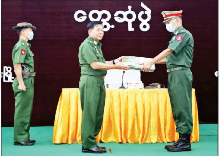
နိုင်ငံတော်စီမံအုပ်ချုပ်ရေးကောင်စီဥက္ကဋ္ဌ၊ တပ်မတော်ကာကွယ်ရေးဦးစီးချုပ် ဗိုလ်ချုပ်မှူးကြီး မင်းအောင်လှိုင် စားသောက်ဖွယ်ရာပစ္စည်းများကို ပေးအပ်ရာ တာဝန်ရှိသူတစ်ဦးက လက်ခံရယူစဉ်။

ထို့ကြောင့် ပြည်သူများအနေဖြင့် ဆန္ဒမေးရခြင်း ကို စိတ်ပျက်လာကြပြီး မဲမပေးကြရေး လှုံ့ဆော်မှု များကို လုပ်ဆောင်လာခဲ့ကြကြောင်း၊ ဒီမိုကရေစီ စနစ်တွင် မဲမပေးပါက မိမိတို့တစ်ဦးတစ်ယောက် ချင်းစီ၏ အခွင့်အရေးများ နှစ်နာမည်ဖြစ်သဖြင့် မိမိအနေဖြင့် ရောက်သည့်နေရာတိုင်းတွင် အားလုံး ဆန္ဒမေးပေးကြစေရေးနှင့် မိမိဒေသနှင့် တိုင်းပြည်ကို အကျိုးပြုနိုင်မည့်သူ၊ ဥပဒေကို နားလည်မည့်သူ၊ စေတနာထား၍ အုပ်ချုပ်နိုင်မည့်သူကို ရွေးချယ် မဲပေးကြစေရေး အမြဲတိုးတက်ဖွံ့ဖြိုးမှုအမြင်ဖြစ်ကြောင်း။