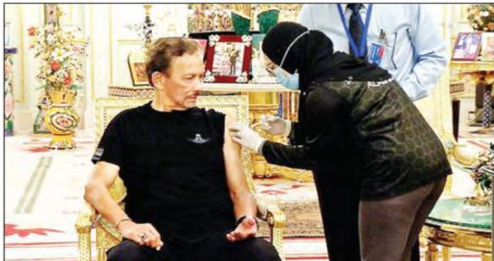
ကာကွယ်ဆေးနှင့် AstraZeneca ကိုဗစ်-၁၉ ရောဂါ ကာကွယ်ဆေးနှစ်မျိုးကို နိုင်ငံတစ်ဝန်းသို့ ဖြန့်ဖြူးပေးခဲ့ပြီးဖြစ်ကြောင်း ၎င်းက ဆက်လက်ပြောကြားခဲ့သည်။ အသက် ၁၈ နှစ်နှင့်အထက် ပြည်သူအားလုံး ကိုဗစ်-၁၉ ရောဂါကာကွယ်ဆေးများကို အခမဲ့ထိုးနှံမှုခံယူရမည်ဖြစ်သည်။ ကာကွယ်ဆေးထိုးနှံမှုအစီအစဉ်၏ ဦးစားပေးစာရင်းတွင် ကျန်းမာရေးလုပ်သားများနှင့် ဘရူနိုင်းဘုရင်တပ်မတော်မှ တပ်ဖွဲ့ဝင်များအပါအဝင် သီးခြား

ဘန်ဒါဆရီဘီဂါဝန် ဧပြီ ၄ ဘရူနိုင်းနိုင်ငံ၌ ကိုဗစ်-၁၉ ရောဂါ ကာကွယ်ဆေး ထိုးနှံမှုအစီအစဉ်ကို ယမန်နေ့တွင် စတင်ခဲ့ကြောင်း ယနေ့သတင်းများအရ သိရသည်။ ပြည်သူ ၇၅၄ ဦးက နိုင်ငံတစ်ဝန်းရှိ ကာကွယ်ဆေးထိုးနှံပေးရေးစင်တာများ၌ ကာကွယ်ဆေးပထမအကြိမ် ထိုးနှံမှုခံယူခဲ့ကြောင်း ဘရူနိုင်းကျန်းမာရေးဝန်ကြီးဌာန၏ ထုတ်ပြန်ချက်တွင် ဖော်ပြထားသည်။ ယင်းတို့အနက် ကျန်းမာရေးဝန်ကြီး ဟာဂျီ အာဝန် မိုဟာမက်အစ္စဟာမ်လည်း ပါဝင်ခဲ့ကြောင်း သိရသည်။ ဝန်ကြီး ဟာဂျီ အာဝန် မိုဟာမက်အစ္စဟာမ်က Raja Isteri Pengiran Anak Saleha ဆေးရုံ၌ ကာကွယ်ဆေးပထမအကြိမ် ထိုးနှံမှုခံယူခဲ့သည်။ နိုင်ငံနှင့် လူမျိုးစုံအမျိုးစုံများကို ကာကွယ်ရန် အရွယ်ရောက်ပြီးသော နိုင်ငံသားများအနေဖြင့် ကိုဗစ်-၁၉ ရောဂါကာကွယ်ဆေး ထိုးနှံရန်လိုအပ်ကြောင်း ကျန်းမာရေးဝန်ကြီး ဟာဂျီ အာဝန် မိုဟာမက်အစ္စဟာမ်က ပြောကြားခဲ့သည်။ ထို့ပြင် တရုတ်နိုင်ငံထုတ် Sinopharm ကိုဗစ်-၁၉ ရောဂါ