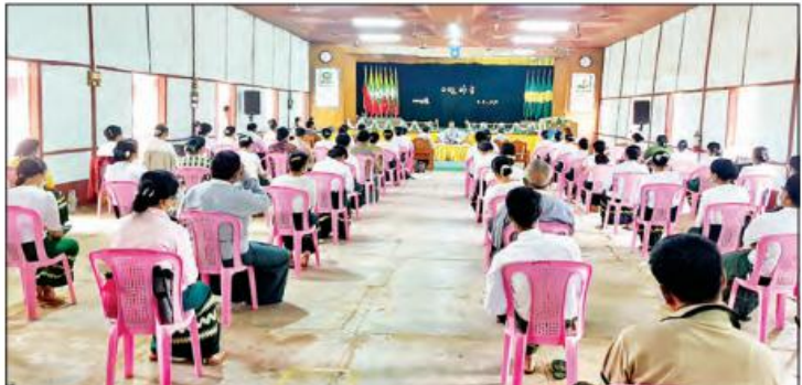
ပညာရေးဝန်ကြီးဌာန ပြည်ထောင်စုဝန်ကြီး ဦးညွန့်ဖေ မကွေးမြို့ အမှတ်(၁)အခြေခံပညာအထက်တန်း ကျောင်းမှ ပညာရေးဝန်ထမ်းများနှင့် တွေ့ဆုံစဉ်။

ပြောကြား ထို့ပြင် ဒေသထွက်ကုန်များကို ခေတ်မီသော ထုပ်ပိုးမှုပုံစံများဖြင့် ကောင်းမွန်အောင်လုပ်ဆောင်၍ One Village One Product စနစ်ဖြင့် ဒေသမှ စံပြု ထုတ်ကုန်တစ်မျိုးချင်းကို ဈေးကွက်ဝင်ရန် ကြိုးစား ခြင်းဖြင့် တစ်ဖက်မှလည်း ခရီးသွားလုပ်ငန်းများ ဖွံ့ဖြိုးလာမည်ဖြစ်ပြီး ပြည်တွင်း၊ ပြည်ပမှ လာရောက် ကြည့်ရှုလေ့လာသူများ ရရှိလာမည်ဖြစ်ကြောင်း၊ ခရီးသွားလုပ်ငန်းများမှတစ်ဆင့် ဒေသတွင်း ရောင်းဝယ်ရေးလုပ်ငန်းများဖွံ့ဖြိုးလာပြီး ဒေသတွင်း ဝင်ငွေကို ကြွယ်ဝစေနိုင်ကာ ဒေသခံပြည်သူလူထု၏ လူနေမှုစနစ်ကို မြှင့်တင်လာစေမည်ဖြစ်ကြောင်း၊ ဒေသတွင်းအုပ်ချုပ်ရေးအဖွဲ့အစည်းများအနေဖြင့် မိမိဒေသကို မိမိတိုင်းပြည်ကို တိုးတက်ကောင်းမွန်စေ လိုသည့်စိတ်ထား၍ နိုင်ငံဝန်ထမ်းကောင်းပီသစွာ ဖြင့် လုပ်ကိုင်ဆောင်ရွက်သွားကြစေလိုကြောင်း ပြောကြားသည်။ တွေ့ဆုံပွဲအပြီးတွင် နိုင်ငံတော်စီမံအုပ်ချုပ်ရေး ကောင်စီဥက္ကဋ္ဌ၊ တပ်မတော်ကာကွယ်ရေးဦးစီးချုပ် နှင့် အဖွဲ့ဝင်များသည် တက်ရောက်လာကြသည့် မကွေးတိုင်းဒေသကြီး စီမံအုပ်ချုပ်ရေးကောင်စီ အဖွဲ့ဝင်များနှင့် ဌာနဆိုင်ရာဝန်ထမ်းများအား ရင်းရင်းနှီးနှီး နှုတ်ဆက်ခဲ့ကြကြောင်း သတင်းရရှိ သည်။ သတင်းစဉ်