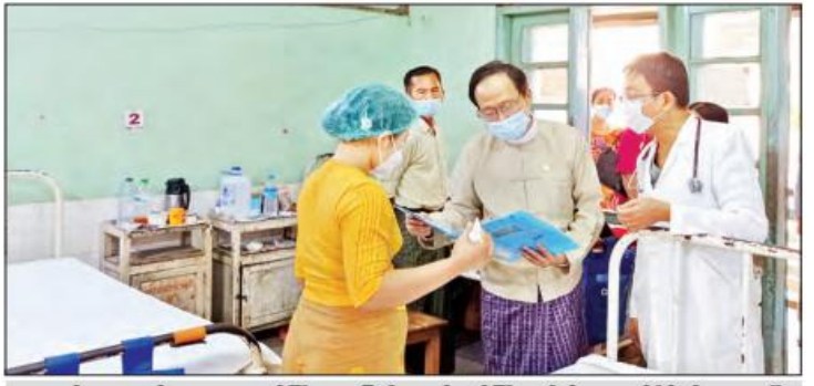
ကျန်းမာရေးနှင့် အားကစားဝန်ကြီးဌာန ပြည်ထောင်စုဝန်ကြီး ဒေါက်တာသက်ခိုင်ဝင်း မကွေးမြို့ ပြည်သူ့ဆေးရုံ၌ တက်ရောက်ကုသမှုခံယူလျက်ရှိသည့် ဒေသခံပြည်သူများ၏ ကျန်းမာရေးတိုးတက်မှု အခြေအနေများကို ကြည့်ရှုစဉ်။

»» စာမျက်နှာ ၃ မှ နိုင်ငံတော်စီမံအုပ်ချုပ်ရေးကောင်စီကို ဖွဲ့စည်းကာ ဘက်စုံဖွံ့ဖြိုးတိုးတက်အောင် ဆောင်ရွက်လျက်ရှိ သည့် အခြေအနေများနှင့် ဆက်လက်ဆောင်ရွက် လျက်ရှိသည့် အခြေအနေများကို အကျယ်တဝင့် ရှင်းလင်းမှာကြားသည်။ ထို့နောက် နိုင်ငံတော်စီမံအုပ်ချုပ်ရေးကောင်စီဝင် ဗိုလ်ချုပ်ကြီး မောင်မောင်ကျော်က စားသောက် ဖွယ်ရာများကိုပေးအပ်ရာ လေတပ်စခန်းဌာနချုပ်မှူး က လက်ခံရယူခဲ့ကြသည်။ နိုင်ငံတော်စီမံအုပ်ချုပ်ရေးကောင်စီ ဥက္ကဋ္ဌ၊ တပ်မတော်ကာကွယ်ရေးဦးစီးချုပ်နှင့်အတူ လိုက်ပါ