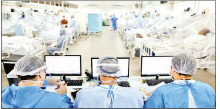
အကြိမ် ထိုးနှံမှုမဟုတ်ဘဲ ပြုလုပ်ခြင်းဖြစ်သည်။ လူဦးရေ ၅ ဒသမ ၂ သန်း (၂ ဒသမ ၄၉ ရာခိုင်နှုန်း) သည် ကာကွယ် ဆေးနှစ်ကြိမ်လုံး ထိုးနှံမှုမဟုတ်ဘဲ ပြုလုပ်ခြင်း သိရသည်။ ကိုးကား- ဆင်ယွာ ဘာသာပြန်- အောင်ကျော်ကျော်

လက်ရှိအချိန်အထိ ပြည်သူ ၂၄ သန်းကျော်အား ကိုဗစ်-၁၉ ရောဂါကာကွယ်ဆေးများ ထိုးနှံပေးပြီး ဖြစ်ကြောင်းနှင့် ယင်းတို့အနက် ၁၈ ဒသမ ၈ သန်း (၈ ဒသမ ၉ ရာခိုင်နှုန်း) သည် ကာကွယ်ဆေး ပထမ