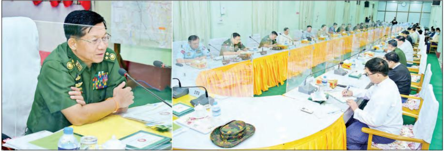
နိုင်ငံတော်စီမံအုပ်ချုပ်ရေးကောင်စီဥက္ကဋ္ဌ၊ တပ်မတော်ကာကွယ်ရေးဦးစီးချုပ် ဗိုလ်ချုပ်မှူးကြီးမင်းအောင်လှိုင် မကွေးတိုင်းဒေသကြီး စီမံအုပ်ချုပ်ရေးကောင်စီအဖွဲ့ဝင်များနှင့် ဌာနဆိုင်ရာဝန်ထမ်းများအား တွေ့ဆုံအမှာစကားပြောကြားစဉ်။

နေပြည်တော် ဧပြီ ၄ နိုင်ငံတော်စီမံအုပ်ချုပ်ရေးကောင်စီ ဥက္ကဋ္ဌ၊ တပ်မတော်ကာကွယ်ရေးဦးစီးချုပ် ဗိုလ်ချုပ်မှူးကြီး မင်းအောင်လှိုင်သည် ယနေ့မနက်ပိုင်းတွင် မကွေးတိုင်းဒေသကြီး စီမံအုပ်ချုပ်ရေးကောင်စီအဖွဲ့ဝင်များနှင့် ဌာနဆိုင်ရာဝန်ထမ်းများအား မကွေးတိုင်းဒေသကြီး စီမံအုပ်ချုပ်ရေးကောင်စီရုံး၌ တွေ့ဆုံအမှာစကားပြောကြားသည်။