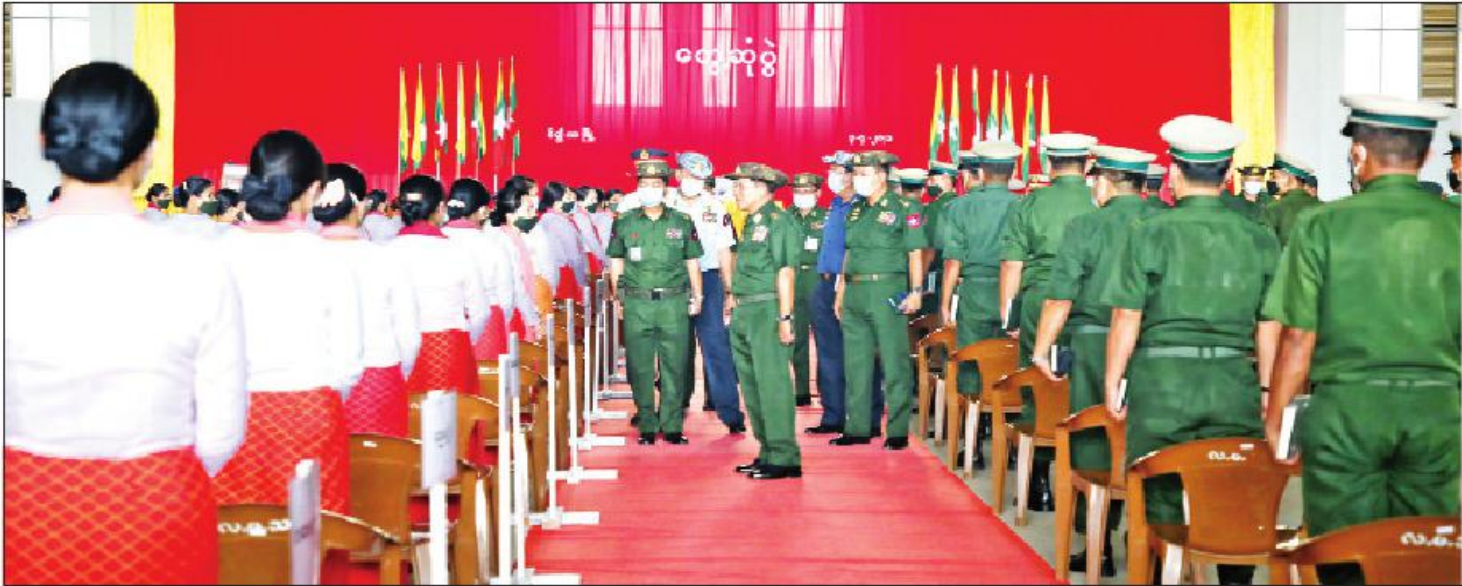
နိုင်ငံတော်စီမံအုပ်ချုပ်ရေးကောင်စီဥက္ကဋ္ဌ၊ တပ်မတော်ကာကွယ်ရေးဦးစီးချုပ် ဗိုလ်ချုပ်မှူးကြီးမင်းအောင်လှိုင် မိတ္ထီလာတပ်နယ်မှ အရာရှိ၊ စစ်သည်၊ မိသားစုများအား ရင်းရင်းနှီးနှီး လိုက်လံနှုတ်ဆက်စဉ်။

နေပြည်တော် ဧပြီ ၃ နိုင်ငံတော်စီမံအုပ်ချုပ်ရေးကောင်စီဥက္ကဋ္ဌ၊ တပ်မတော်ကာကွယ်ရေး ဦးစီးချုပ် ဗိုလ်ချုပ်မှူးကြီးမင်းအောင်လှိုင်သည် ယနေ့မနက် ၈ နာရီခွဲတွင် မိတ္ထီလာတပ်နယ်မှ အရာရှိ၊ စစ်သည်၊ မိသားစုများအား သီးခြားစီတွေ့ဆုံ၍ အမှာစကား ပြောကြားသည်။