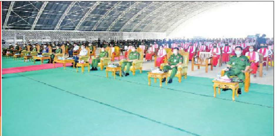
နိုင်ငံတော်စီမံအုပ်ချုပ်ရေးကောင်စီဥက္ကဋ္ဌ၊ တပ်မတော်ကာကွယ်ရေးဦးစီးချုပ် ဗိုလ်ချုပ်မှူးကြီးမင်းအောင်လှိုင် မိတ္တီလာတပ်နယ်မှ အရာရှိ၊ စစ်သည်၊ မိသားစုများအား တွေ့ဆုံအမှာစကားပြောကြားစဉ်။

* ရှေ့ပိုးမှ နိုင်ငံတော်ကို နိုင်ငံရေးအရ အရေးပေါ်အခြေအနေ အဖြစ် ကြေညာကာ ယာယီသမ္မတ၏ တာဝန်လွှဲအပ်ချက်အရ နိုင်ငံတော်၏တာဝန်ကို တပ်မတော်က ခေတ္တတာဝန်ယူ ထိန်းသိမ်းဆောင်ရွက်နေခြင်း ဖြစ်ကြောင်း။