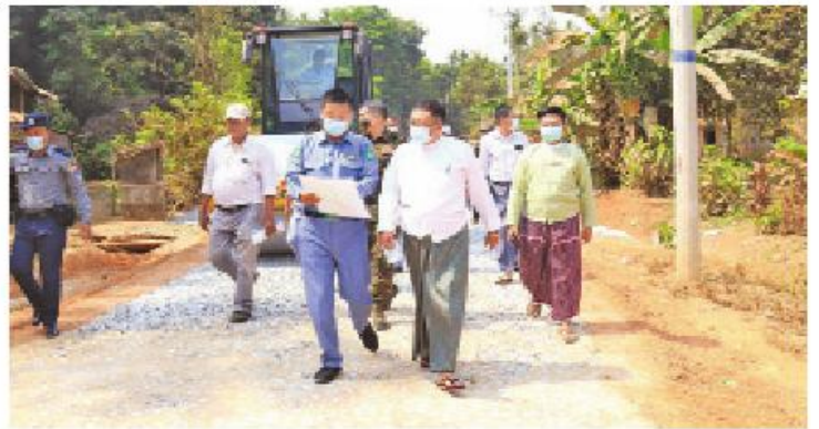
မွန်ပြည်နယ်စီမံအုပ်ချုပ်ရေးကောင်စီဥက္ကဋ္ဌ သထုံခရိုင်အတွင်း ဒေသဖွံ့ဖြိုးရေးလုပ်ငန်းများ ကွင်းဆင်းကြည့်ရှု