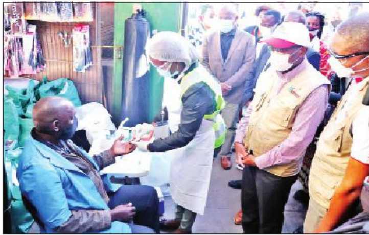
နောက်တွင် အီဂျစ်နိုင်ငံက ကိုဗစ်-၁၉ ရောဂါကြောင့် သေဆုံးသူ ၁၂၀၈၄ ဦး၊ မော်ရိုကိုနိုင်ငံက ကိုဗစ်-၁၉ ရောဂါကြောင့် သေဆုံးသူ ၈၈၃၅ ဦး အသီးသီးရှိကြောင်း အာဖရိကရောဂါထိန်းချုပ်ရေးနှင့် ကာကွယ်

အာဖရိကတိုက်ရှိ နိုင်ငံအများအနက် ကိုဗစ်-၁၉ ရောဂါကြောင့် သေဆုံးသူအများဆုံးနိုင်ငံမှာ တောင်အာဖရိကနိုင်ငံဖြစ်ပြီး တောင်အာဖရိက၌ ကိုဗစ်-၁၉ ရောဂါကြောင့် သေဆုံးသူစုစုပေါင်း ၅၂၉၆၄ ဦးရှိကြောင်းနှင့် တောင်အာဖရိကနိုင်ငံ