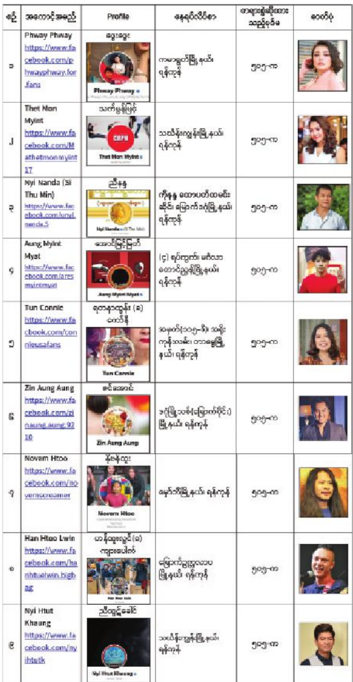
ဥပဒေပုဒ်မ ၅၀၅-က ဖြင့် အရေးယူထားရှိသူများစာရင်း

နိုင်ငံတော်၏ အုပ်ချုပ်မှုယန္တရားပျက်ပြားစေရန်ရည်ရွယ်ချက်ဖြင့် နိုင်ငံ့ဝန်ထမ်းများအား CDM လှုပ်ရှားမှုတွင် ပါဝင်စေရန်လှုံ့ဆော်ခြင်း၊ CRPH မတရားအသင်းအား ထောက်ခံသည့် အကြောင်းအရာများ၊ မမှန်သတင်းများအား ဖြန့်ဝေခြင်း၊ နိုင်ငံတော်တည်ငြိမ်အေးချမ်းမှုကို ပျက်ပြားစေပြီး ဆူပူအုံကြွမှုဖြစ်ပေါ်စေရန်နှင့် အများပြည်သူအထိတ်တလန့်ဖြစ်စေရန်အတွက် သွေးထိုးလှုံ့ဆော်မှုများပြုလုပ်ခြင်းများကို လူမှုကွန်ရက်စာမျက်နှာများတွင် ရည်ရွယ်ချက်ရှိရှိဖြင့် ဖော်ပြခြင်းနှင့် ဖြန့်ဝေခြင်းများ ဆောင်ရွက်လျက်ရှိသည့် အောက်ဖော်ပြပါ အနုပညာရှင်အချို့နှင့် အခြားပါဝင်ပတ်သက်သူများအား ရာဇသတ်ကြီးပုဒ်မ ၅၀၅-က ဖြင့် အမှုဖွင့်အရေးယူဆောင်ရွက်လျက်ရှိသည်။ သတင်းစဉ်