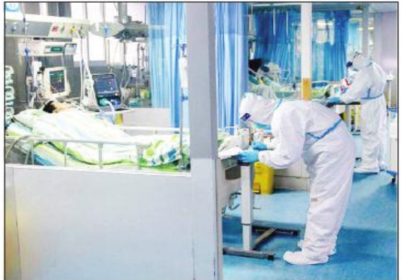
မိုးနီးယားပြည်နယ်၌ စတင်တွေ့ရှိသည့် ပီဇပြောင်းဗိုင်းရပ်စ် နှစ်မျိုးဖြစ်သော B.1.427 နှင့် B.1.429 တို့အား အမေရိကန် ရောဂါကာကွယ်ထိန်းချုပ်ရေးစင်တာက အနီးကပ်စောင့်ကြည့်လျက်ရှိကြောင်း သိရသည်။ ကိုးကား - ဆင်ယွာဘာသာပြန် - အောင်ကျော်ကျော်

အလားတူ တောင်အာဖရိကနိုင်ငံ၌ စတင်တွေ့ရှိသည့် ပီဇပြောင်းဗိုင်းရပ်စ် ကူးစက်ခံရသူ ၃၂၃ ဦးနှင့် ဘရာဇီးနိုင်ငံ၌ စတင်တွေ့ရှိခဲ့သည့် ပီဇပြောင်းဗိုင်းရပ်စ်ကူးစက်ခံရသူ ၂၂၄ ဦးရှိကြောင်း သိရသည်။ ထို့ပြင် အမေရိကန်နိုင်ငံ ကယ်လီ