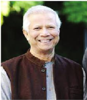
ဂရားမင်းဘဏ်တည်ထောင်သူ မိုဟာမက်ယူနွတ်

ဘင်္ဂလားဒေ့ရှ်နိုင်ငံကို ပြန်ခဲ့ပြီး စစ်တကောင်း တက္ကသိုလ်စီးပွားရေးပညာဌာနမှာ ပါမောက္ခအဖြစ် တာဝန်ထမ်းပါတယ်။ ၁၉၇၄ ခုနှစ်မှာ ဆင်းရဲမှုလျှော့ချရေး အစီအစဉ်တွေမှာ ပါဝင်ခဲ့ပြီး ကျေးလက်ဒေသစီးပွားရေးဖွံ့ဖြိုးမှု အစီအစဉ်တစ်ခုကို သုတေသနပြု ဆောင်ရွက်ခဲ့ပါတယ်။ ဂရားမင်းဘဏ်တည်ထောင်ခဲ့တဲ့ တစ်နေ့တော့ တက္ကသိုလ်က အပြန်လမ်းမှာ ဆင်းရဲနွမ်းပါးတဲ့သူတွေကို တွေ့ရတဲ့အခါ တက္ကသိုလ်မှာ ဆင်းရဲမှုတွေ လျှော့ချနိုင်အောင် သုတေသနတွေ လုပ်၊ စာတမ်းတွေ ရေး၊ စာတွေသင်နေပြီး လက်တွေ့မှာတော့ ဆင်းရဲသားတွေကို မကူညီနိုင်တာကို ယူနွတ်က သတိထားမိလိုက်ပါတယ်။ ဖျတ်ခနဲ အသိဝင်သွားပါတယ်။ တစ်ခုခု လက်တွေ့လုပ်ဖို့ လိုတယ်လို့ အသိတရားရသွားတာပါ။ အသိတရားရတာနဲ့ စစ်တကောင်းတက္ကသိုလ်နားက ဂျီဘရာ