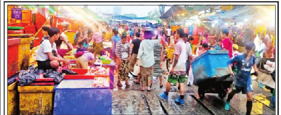
ရန်ကုန်မြို့တွင် ပြန်လည်တည်ငြိမ်အေးချမ်းလာပြီဖြစ်၍ စည်ပင်သာယာရေးများ၊ ကိုယ်ပိုင်ဈေး၊ Shopping Mall Plaza များ၊ အိမ်ဆိုင်များမှာ ဈေးရောင်း၊ ဈေးဝယ်သူများဖြင့် ပြန်လည်စည်ကားလျက်ရှိရာ လှိုင်သာယာမြို့နယ် ဝင်လုံဈေးတွင် ပြည်သူများ စိတ်အေးချမ်းသာစွာ ဈေးရောင်း၊ ဈေးဝယ်လျက်ရှိသည်ကို ဧပြီ ၃ ရက်က တွေ့မြင်ရစဉ်။

နေပြည်တော် ဧပြီ ၃ ရှမ်းပြည်နယ်(မြောက်ပိုင်း) ကုန်းကြမ်းမြို့နယ်အတွင်း လုံခြုံရေး ဆောင်ရွက်လျက်ရှိသော ပူးပေါင်းအဖွဲ့သည် ယနေ့နံနက်ပိုင်းတွင် ညံ့ခွမ်းကျေးရွာ၏ အနောက်တောင်ဘက် စီတာ ၄၀၀၀ ခန့်အကွာသို့ အရောက်၌ မိုးစီးကျေးရွာဘက်မှ ညံ့ခွမ်းကျေးရွာဘက်သို့ မောင်းနှင် လာသည့် ဆိုင်ကယ်တစ်စီးအား စစ်ဆေးရန် ရပ်တန့်ခိုင်းစဉ် ရပ်တန့်ခြင်းမရှိဘဲ မောင်းနှင်ထွက်ပြေးသွားခဲ့ပြီး ၎င်းဆိုင်ကယ်ပေါ်မှ အထုပ်တစ်ထုပ်ပြုတ်ကျခဲ့သဖြင့် ဖွင့်ဖောက်စစ်ဆေးရာ ဘိန်းဖြူမှုန့် များထည့်ထားသည့် ဆပ်ပြာခွက် ၁၁ ခွက် ၁၁၀ ဂရမ်ခန့် (ခန့်)၊ မှန်း တန်ဖိုးငွေကျပ် ၁၆ သိန်းကျော်)အား တွေ့ရှိသိမ်းဆည်းရမိခဲ့သည်။ အဆိုပါ သိမ်းဆည်းရမိမူးယစ်ဆေးဝါးများအား လောက်ကိုင် မူးယစ်တပ်ဖွဲ့စုသို့ စနစ်တကျလွှဲပြောင်းအပ်နှံသွားမည်ဖြစ်ကြောင်း သတင်းရရှိသည်။