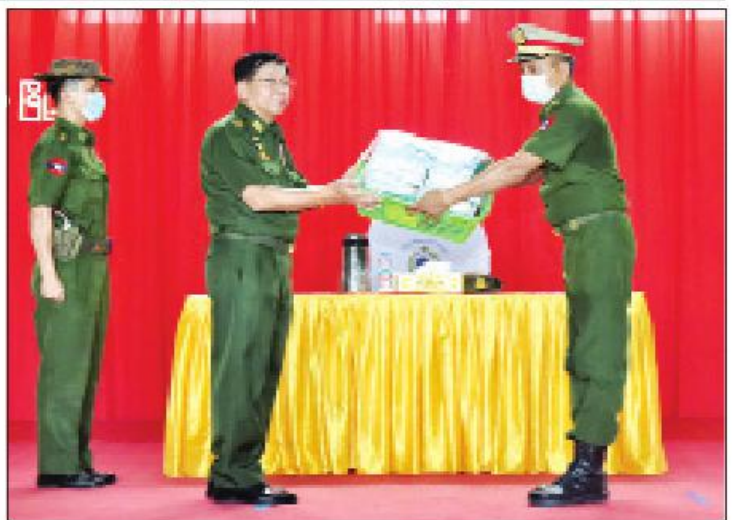
နိုင်ငံတော်စီမံအုပ်ချုပ်ရေးကောင်စီဥက္ကဋ္ဌ၊ တပ်မတော်ကာကွယ်ရေးဦးစီးချုပ် ဗိုလ်ချုပ်မှူးကြီးမင်းအောင်လှိုင် စားသောက်ဖွယ်ရာပစ္စည်းများနှင့် တပ်မတော်စက်ရုံထုတ် လူသုံးကုန်ပစ္စည်းများကို ပေးအပ်ရာ တာဝန်ရှိသူတစ်ဦးက လက်ခံရယူစဉ်။

ပါဝင်၍ ဆန္ဒမူများပေးခဲ့ကြသည်ကို တွေ့ရှိရကြောင်း။ ဒီမိုကရေစီစနစ်တွင် ရွေးကောက်ပွဲသည် အနှစ်သာရတစ်ခုဖြစ်ပြီး မိမိတို့နိုင်ငံ၌ ၂၀၁၀ ပြည့်နှစ် ရွေးကောက်ပွဲတွင် မဲပေးခွင့်ရှိသူ၏ ၇၇ ရာခိုင်နှုန်း မဲပေးခဲ့ကြကြောင်း၊ ၂၀၁၅ ခုနှစ် ရွေးကောက်ပွဲတွင် ၇၀ ရာခိုင်နှုန်းနီးပါး မဲပေးခဲ့ကြသည်ကို တွေ့ရကြောင်း၊ ၂၀၁၀ ပြည့်နှစ်တွင် တက်လာသည့်အစိုးရသည် အတိုင်းအတာတစ်ခုထိ အောင်မြင်အောင်လုပ်ဆောင်နိုင်ခဲ့သော်လည်း အခက်အခဲမျိုးစုံဖြင့် ရင်ဆိုင်ခဲ့ရကြောင်း၊ ၂၀၁၅ ခုနှစ် ရွေးကောက်ပွဲတွင် အစိုးရသည် တစ်ရပ်တက်လာခဲ့ပြီး ငါးနှစ်တာ သက်တမ်းအုပ်ချုပ်ခဲ့ရာတွင် အစိုးရ၏လုပ်ဆောင်ချက်များအပေါ်တွင် ဝေဖန်ပြောဆိုမှုများ၊ ဝေဖန်ထောက်ပြမှုများ များစွာ ဖြစ်ပေါ်ခဲ့ပြီး တိုင်းပြည်၏ နိုင်ငံရေး၊ စီးပွားရေး၊ လူမှုရေး ဘက်ပေါင်းစုံတွင် လိုအပ်ချက်များ ဖြစ်ပေါ်ခဲ့သည်ကို ဝေဖန်မှုများရှိခဲ့ကြောင်း၊ ထို့ပြင် ဥပဒေနှင့် မလျော်ညီသည့် လုပ်ဆောင်ချက်များကို တွေ့ရှိလာကြောင်း၊ ထို့ကြောင့် ပြည်သူ့လူထုအနေဖြင့် အစိုးရ၏ လုပ်ဆောင်ချက်များအပေါ်တွင် အားမလိုအားမရ ဖြစ်လာသည့်အတွက် ရွေးကောက်ပွဲလုပ်ရန်ရှိလာသည့်အခါ ရွေးကောက်ပွဲအပေါ် စိတ်ပျက်ပြီး မဲမပေးချင်သောစိတ်များဖြစ်လာကြသည်ကို တွေ့ရပြီး No Vote လှုံ့ဆော်မှုများဖြစ်လာသည်ကို တွေ့ရှိကြရမည်ဖြစ်ကြောင်း၊ ၂၀၁၉ ခုနှစ် ရန်ကုန်မြို့တော် စည်းပုံသတ်မှတ်ရေးကော်မတီရွေးကောက်ပွဲလုပ်သည့်အခါတွင် ဆန္ဒမဲမပေးသူ ၁၄ ရာခိုင်နှုန်းခန့်သာရှိသည်ကို သိရှိရကြောင်း။ သို့ရာတွင် ၂၀၂၀ ပြည့်နှစ် ရွေးကောက်ပွဲကျင်းပ