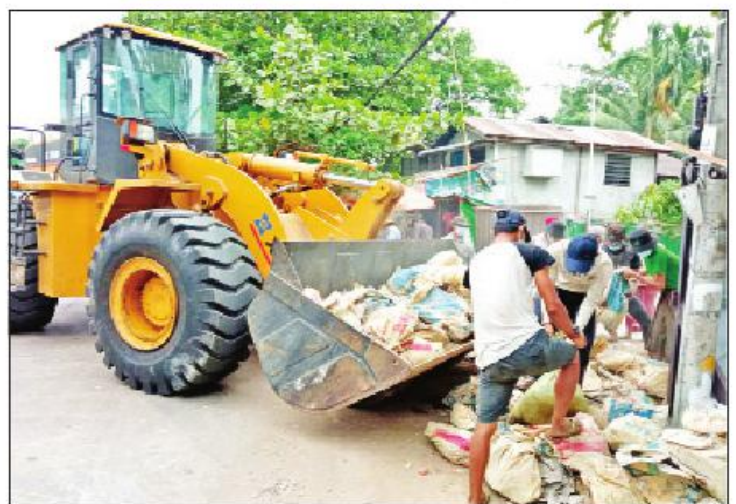
မြို့နယ် ပင်လုံလမ်း၊ ဒဂုံမြို့သစ် (အရှေ့ပိုင်း)မြို့နယ် ကိုလည်း ရှင်းလင်းခဲ့ကြောင်း သိရသည်။ မြို့နယ်လက်ကျန်မဲလက်မှတ် ကျန်စစ်သားလမ်းတို့မှ သံ၊ ခဲနှင့် အမှိုက်များ

လမ်းထိပ်၊ ရာကျော်လမ်း၊ ပုလဲလမ်း၊ အောက်မင်္ဂလာဒုံ လမ်းတို့မှ စီးရီးအမှိုက်ပုံ၊ အုတ်ခဲအုတ်၊ အုတ်ခဲကျိုး၊ တာယာအဟောင်းများကို လည်းကောင်း၊ မြောက်ဥက္ကလာပမြို့နယ် သူဇမာလမ်းတစ်လျှောက်မှ တာယာအဟောင်းများကို လည်းကောင်း၊ သာကေတ မြို့နယ် (၇/အရှေ့)ရပ်ကွက် အောင်သပြေလမ်းနှင့် ဓမ္မာရုံလမ်း၊ ရှုခင်းသာမြို့ပတ်လမ်း၊ အောင်သစ္စာ(၃) လမ်းထိပ်တို့မှ တာယာအဟောင်းများကို လည်းကောင်း၊ ကြည့်မြင်တိုင်မြို့နယ် သရက်တော (တောင်)ရပ်ကွက်၊ ကမ်းနားလမ်း (သရက်တော ၂ လမ်းမှ ၅ လမ်းအထိ) အမှိုက်များ၊ ပုလင်းကွဲများ၊ ကမ်းနားလမ်း၊ အထက်ကြည့်မြင်တိုင်လမ်း၊ အောက်ကြည့်မြင်တိုင်လမ်းတစ်လျှောက် တာယာ အဟောင်းများ၊ အင်းစိန်လမ်း၊ ကွမ်းရွဲတန်းလမ်း၊ ပန်းပင်ကြီးလမ်း၊ နတ်စင်လမ်း၊ ဦးကြွယ်ဟိုးလမ်း၊ ကျောင်းကြီးလမ်းတို့မှ ကျောက်ပြားများ၊ တာယာ စီးရီးအမှိုက်များကို လည်းကောင်း၊ ယန္တရားများ၊ မြေသယ်ယာဉ်များ အသုံးပြု၍ သိမ်းဆည်း၊ ဖယ်ရှား ရှင်းလင်းခဲ့ကြောင်းနှင့် မြောက်ဥက္ကလာပ မြို့နယ် ဓမ္မာရုံလမ်း၊ ဒဂုံမြို့သစ်(မြောက်ပိုင်း) ကျောက်ပြားများ သံ၊ ခဲနှင့် အမှိုက်များ