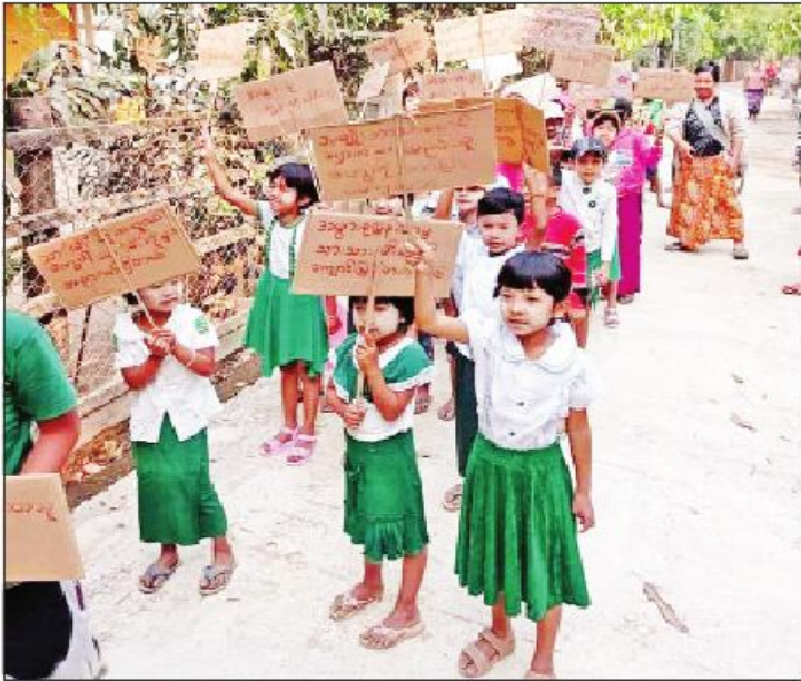
ကို စိတ်မကောင်းစရာအဖြစ် ဝမ်းနည်းကြေကွဲဖွယ်ရာ တွေ့ရှိရသည်။ ထို့ကြောင့် ကလေးသူငယ်များ

နေပြည်တော် ဧပြီ ၂ NLD ပါတီဝင်များနှင့် NLD ဝန်ထုပ်အစွန့်ရောက်သူများအနေဖြင့် ပြည်သူများ လမ်းပေါ်သို့ရောက်ရှိလာစေရန်ရည်ရွယ်၍ နည်းမျိုးစုံဖြင့် လှုံ့ဆော်သွားထိုးလျက်ရှိပြီး နိုင်ငံရေးအပေါ်သိတတ်နားလည်မှုမရှိနိုင်သေးသည့် နေရာမရှိသော အပြစ်ကင်းစင်သည့် အရွယ်မရောက်သေးသူ ကလေးသူငယ်များကိုပါ ဆူပူဆန္ဒပြမှုဖြစ်စဉ်များတွင် ရှေ့တန်းတင် အသုံးချလာကြသည်ကို တွေ့ရှိရနေသည်။ ၎င်းအပြစ် ကလေးသူငယ်များအား လူ့အများထိခိုက်ဒဏ်ရာ ရရှိစေနိုင်သည့် လက်နက်များကို ကိုင်ဆောင်၍ အကြမ်းဖက်မှုတွင် ပါဝင်စေခြင်း၊ အားပေးအားမြှောက် ပြုလုပ်ကာ ငွေကြေးပေးခြင်း၊ ဆုချီးမြှင့်ခြင်းများဖြင့် မက်လုံးပေးစည်းရုံးခြင်း၊ ကော်ရှုစေခြင်း၊ စိတ်ကြံ့မားယစ်ဆေးဝါးတစ်မျိုးမျိုးကို သုံးစွဲစေခြင်းဖြင့် ကြောက်လန့်ရွက်လှမ်းမိစေကာ ဆူပူမှုများတွင် ရှေ့တန်းတင်ပါဝင်စေခြင်း စသည်ဖြင့် အသုံးချလျက်ရှိသည်