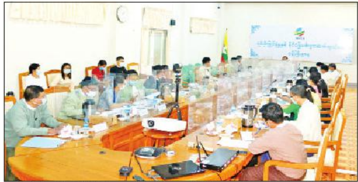
ရင်းနှီးမြှုပ်နှံမှုနှင့် နိုင်ငံခြားစီးပွားဆက်သွယ်ရေး ဝန်ကြီးဌာန ဒုတိယဝန်ကြီး ဦးသန်းအောင်ကျော်က အကြောင်းအမျိုးမျိုးကြောင့် တွေ့ကြုံနေရသည့်

အစည်းအဝေးတွင် အီးယူ၏ ငွေကြေးနှင့် နည်းပညာအကူအညီအထောက်အပံ့ဖြင့် အကောင်အထည်ဖော်ဆောင်ရွက်လျက်ရှိသော စီမံချက်များအလိုက် လက်ရှိဆောင်ရွက်နေမှုနှင့် တိုးတက်မှုအခြေအနေများ၊ ဝေကြံရသည့် အခက်အခဲများအပေါ် အီးယူဘက်သို့ အသိပေးညှိနှိုင်းဆောင်ရွက်ထားရှိမှု အခြေအနေများနှင့် ညှိနှိုင်းပေါင်းစပ်ပေးရန် လိုအပ်ချက်များကို သက်ဆိုင်ရာဝန်ကြီးဌာနများမှ ကိုယ်စားလှယ်များက တင်ပြဆွေးနွေးခဲ့ကြရာ