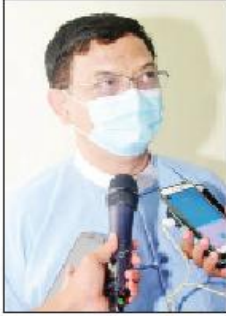
ဒုတိယဝန်ကြီး ဦးညွန့်အောင်

ဒီနေ့ဆွေးနွေးသွားတဲ့ ကိစ္စတွေက တင်သွင်း၊ တင်ပို့မှုအပိုင်းမှာတော့ တချို့အပိုင်းတွေက ထောက်ခံမှုတွေလိုတယ်။ ထောက်ခံချက်လိုတဲ့အပိုင်းတွေ ဆွေးနွေးတယ်။ နောက်ပြီး ဆိပ်ကမ်းကိစ္စတွေ ဆွေးနွေးတယ်။ လုံခြုံရေးကိစ္စတွေ ဆွေးနွေးပါတယ်။ နောက်ပြီး ဘဏ်ပိုင်းဆိုင်ရာ အကြောင်းဆိုင်ရာကိစ္စတွေ ဆွေးနွေးတယ်။ ဒါတွေကိုတော့ သူ့ဌာနဆိုင်ရာအလိုက် တာဝန်ရှိသူတွေက ပြောကြားပေးတယ်။ အဓိကပုံမှန်လုပ်နေတဲ့ ပို့ကုန် သွင်းကုန်လုပ်ငန်းစဉ်တွေမှာ ဆောင်ရွက်တဲ့ အပိုင်းကတော့ တော်တော်လေး ဆောင်ရွက်နိုင်ပါတယ်။ ဆွေးနွေးပွဲ