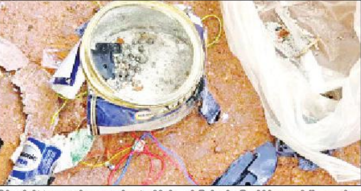
ဖြင့် ပေါက်ခွဲခဲ့ရာ လူနှင့် အဆောက်အအုံ ထိခိုက်ပျက်စီးမှုမရှိကြောင်း သိရသည်။

နေပြည်တော် ၈ ဇူလိုင် - ရှမ်းပြည်နယ်(အရှေ့ပိုင်း) တာချီလိတ်မြို့နယ် တာချီလိတ်ခရိုင် ရဲတပ်ဖွဲ့မှူးရုံးအား ဧပြီ ၁ ရက် ညနေ ၆ နာရီ ၅ မိနစ်ခန့်တွင် ဆူပူအကြမ်းဖက်မှု လေးဦးက ဆိုင်ကယ်နှစ်စီးဖြင့် ရောက်ရှိလာပြီး ငှားယာဉ်အသင့်ပါလာသည့် လက်လုပ်မိုင်း လေးလုံးဖြင့် ပစ်ခတ်ထွက်ပြေးသွားခဲ့ရာ ရဲတပ်ဖွဲ့မှူးရုံးအတွင်း ကျရောက်မှုမရှိဘဲ ခြံစည်းရိုးအုတ်တံတိုင်းကို ထိမှန်၍ ပေါက်ကွဲမှုဖြစ်ပွားခဲ့ပြီး လူထိခိုက်မှုမရှိကြောင်း သိရသည်။