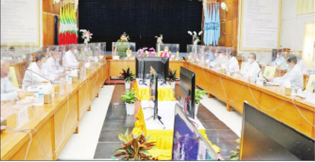
ပြည်တွင်းနေရပ်စွန့်ခွာသူများ ပြန်လည်နေရာချထားရေးနှင့် ယာယီခိုလှုံရာစခန်းများ ပိတ်သိမ်းရေးဆိုင်ရာ အမျိုးသားအဆင့်ကော်မတီဥက္ကဋ္ဌ၊ နယ်စပ် ရေးရာဝန်ကြီးဌာန ပြည်ထောင်စုဝန်ကြီး ဒုတိယဗိုလ်ချုပ်ကြီး ထွန်းထွန်းနောင် ပြည်တွင်းနေရပ်စွန့်ခွာသူများ ပြန်လည်နေရာချထားရေးနှင့် ယာယီခိုလှုံရာစခန်း များ ပိတ်သိမ်းရေးဆိုင်ရာ အမျိုးသားအဆင့်ကော်မတီ ညှိနှိုင်းအစည်းအဝေး (၁/၂၀၂၁)တွင် အမှာစကားပြောကြားစဉ်။