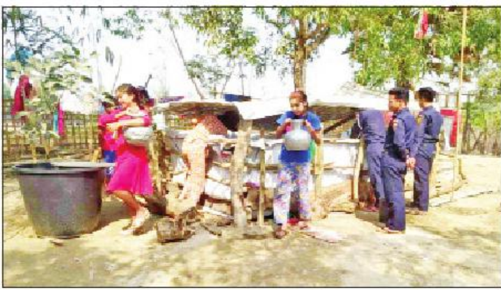
ရေသယ်ယာဉ်တစ်စီးဖြင့် လည်းကောင်း၊ ရခိုင်ပြည်နယ် စစ်တွေမြို့နယ် စီးသတ်စခန်းမှ တပ်ဖွဲ့ဝင်များသည် စစ်တွေမြို့ စက်ရုံစု ရပ်ကွက် အောင်သီရိ တုန်းတော်ကြီးကျောင်း(တိုက်ပွဲရှောင်စခန်း) သို့ သောက်သုံးရေးဂါလန် ၃၂၀၀ ခန့်အား စီးသတ်ရေသယ်ယာဉ် တစ်စီးဖြင့် နှစ်ကြိမ် သွားရောက်၍ လည်းကောင်း၊ သောက်သုံးရေးများ ပေးဝေလျှော့ချခန်းခဲ့ကြောင်း သိရသည်။

နေပြည်တော် ဧပြီ ၂ မွန်ပြည်နယ်နှင့် ရခိုင်ပြည်နယ် အတွင်းရှိ မြို့နယ်များတွင် သောက်သုံးရေး လိုအပ်လျက်ရှိသော သာသနိကကျောင်းများ၊ ရပ်ကွက်/ကျေးရွာများနှင့် တိုက်ပွဲရှောင်စခန်းများအတွက် သက်ဆိုင်ရာ မြို့နယ်စီးသတ်စခန်းများမှ မီးသတ်ယာဉ်များဖြင့် သောက်သုံးရေးများအား နေ့စဉ်ဖြန့်ဝေလျှော့ချခန်းလျက်ရှိသည်။ ထိုသို့ ဖြန့်ဝေလျှော့ချခန်းရာတွင် ဧပြီ ၁ ရက်တွင် မွန်ပြည်နယ် ချောင်းဆုံမြို့နယ် စီးသတ်စခန်းမှ တပ်ဖွဲ့ဝင်များသည် ချောင်းဆုံမြို့နယ် နတ်မှော်ကျေးရွာရှိ "ဘုရားကျောင်း" ဘုန်းတော်ကြီးကျောင်းတိုက်သို့ သောက်သုံးရေးဂါလန် ၁၆၀၀ ခန့်အား စီးသတ်