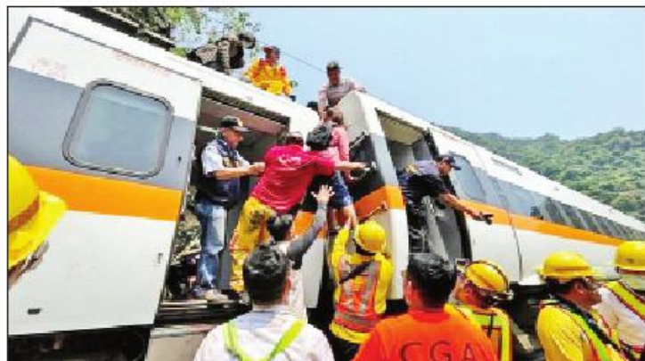
အတွင်း ပျက်စီးသွားသောရထားတွဲဆိုင်းများ၌ ပိတ်မိ ကယ်ဆယ်လျက်ရှိသည်။ လျက်ရှိသည့် ခရီးသည်များအား လိုက်လံရှာဖွေ ယခုဖြစ်ပွားသည့်မီးရထားပြေးလမ်းချော်မှုသည်

တိုင်ပေ ဧပြီ ၂ တရုတ် (တိုင်ပေ)ရှိ ဥမင်လိုဏ်ခေါင်းတစ်ခု၌ ရထားတစ်စင်း ပြေးလမ်းချော်မှုဖြစ်ပွားခဲ့ရာ ခရီးသည် ၄၈ ဦးသေဆုံးပြီး အများအပြားထိခိုက်ဒဏ်ရာရရှိခဲ့ကြောင်း ယနေ့သတင်းများအရ သိရသည်။ အခင်းဖြစ်ပွားပုံမှာ တရုတ်(တိုင်ပေ)မှ တိုင်တန်မြို့သို့ ခုတ်မောင်းပြေးဆွဲလျက်ရှိသည့် ခရီးသည် ၅၀၀နီးပါးသယ်ဆောင်လာသော တွဲဆိုင်း ရှစ်ဆိုင်းပါသည့် မီးရထားတစ်စင်းသည် ဥမင်လိုဏ်ခေါင်းအတွင်း ဖြတ်သန်းမောင်းနှင်လာစဉ် ဥမင်လိုဏ်ခေါင်းအဝင်အဝဠံ ရထားလမ်းပေါ်တွင် လမ်းချော်ကာ ပိတ်ဆို့ရပ်တန့်လျက်ရှိသည့် ဆောက်လုပ်ရေးလုပ်ငန်းသုံး မော်တော်ယာဉ်တစ်စီးနှင့် တိုက်မိခဲ့ကြောင်း သိရသည်။ အဆိုပါ မတော်တဆမှုဖြစ်ပွားခဲ့ပြီးနောက် ကယ်ဆယ်ရေးသမားများက ဥမင်လိုဏ်ခေါင်း