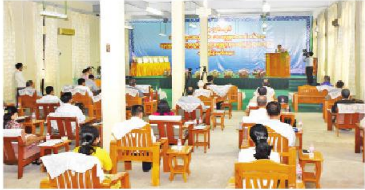
၂၀၁၉ ခုနှစ်အတွက် ပခုက္ကူဦးအုံးဖေတည်ထောင်သော ပခုက္ကူစာပေဆု၊ ပညာရည်ချွန်ဆုနှင့် ပခုက္ကူဦးအုံးဖေစာကြည့်တိုက်စာအုပ်ဆု ဆုချီးမြှင့်ပွဲအခမ်းအနား ကျင်းပစဉ်။

မြန်မာနိုင်ငံရှိ စာဖတ်ပရိသတ်ပြည်သူများအတွက် အကျိုးပြုစာပေများ ရှင်သန်ထွန်းကားရေးနှင့် မြန်မာစာပေပုံနှိပ်ရေးလှုပ်ရှားရေးအဖွဲ့များ ပြည်ဆည်းဆောင်ရွက်ရန် ရည်ရွယ်ကာ ၁၉၉၂ ခုနှစ်တွင် ပခုက္ကူဦးအုံးဖေက ရင်း၏ အသက် ၇၆ နှစ် အထိမ်း