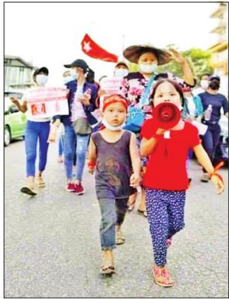
နှင့် မိဘပြည်သူများအနေဖြင့်လည်း မိမိတို့၏ ကလေးသူငယ်များကို နိုင်ငံရေးအသုံးချ ကိုယ်ကျိုးရှာသူများ၏ အသုံးချခံဖြစ်စေရေး