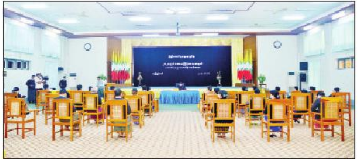
မိမိတို့ ဦးစီးဌာနများရှိ အရာထမ်း၊ အမှုထမ်းများအား ထပ်ဆင့်ထုတ်ပေးနိုင်ရန် ထောက်ပံ့ငွေများ ပေးအပ်ချီးမြှင့်သည်။ အဆိုပါအခမ်းအနားသို့ ဦးစီးဌာနများမှ

ဆက်လက်၍ ပြည်ထောင်စုရှေ့နေချုပ် ဒေါက်တာသီတာဦး၊ ဒုတိယရှေ့နေချုပ် ဦးစန်းလွင် တို့က ဦးစီးဌာနများမှ ညွှန်ကြားရေးမှူးချုပ်များကို