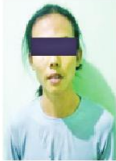
တာရာစိုး