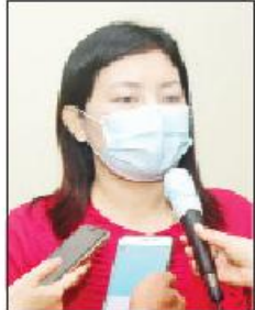
မထိုက်ထိုက်ထွန်း