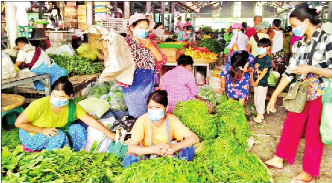
သီရိမင်္ဂလာဈေး၌ ဈေးရောင်း၊ ဈေးဝယ်သူများဖြင့် စည်းကားလျက်ရှိသည်ကို တွေ့ရစဉ်။