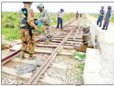
ပဲခူးမြို့နယ် ပဲခူးဘူတာနှင့် ရွှေလှေဘူတာကြား မီးရထားသံလမ်းတွင် မိုင်းထောင်ထားမှုကို စစ်မြေပြင်အင်ဂျင်နီယာတပ်ဖွဲ့ဝင်များက ဖယ်ရှားရှင်းလင်းစဉ်။

မှုဦးစီးဌာနရုံးခြံစည်းရိုးဘေးတွင် မသင်္ကာဖွယ်ရာ အထုပ်နှစ်ထုပ်တွေ့ရှိကြောင်း သတင်းအရ လုံခြုံရေးတပ်ဖွဲ့ဝင်များပါဝင်သော ပူးပေါင်းအဖွဲ့က သွားရောက်စစ်ဆေးရာ ခြံစည်းရိုးဘေးတွင်တွေ့ရှိသော အထုပ်နှစ်ထုပ်အတွင်း၌ လက်လုပ်မိုင်းကို ချိန်ကိုက်မိုင်းသဖွယ် ပြုလုပ်ထားသည်ကို တွေ့ရှိရသဖြင့် လုံခြုံရေးတပ်ဖွဲ့ဝင်များက ရှင်းလင်းခဲ့ရာ နံနက် ၁၀ နာရီ ၁၅ မိနစ်တွင် ရှင်းလင်းပြီးစီးခဲ့ကြောင်း။ အလားတူ နံနက် ၁၀ နာရီ မိနစ် ၄၀ တွင် လယ်ဝေးမြို့ အမှတ်(၅) ရပ်ကွက်ရှိ ဗိုလ်ချုပ်ကြေးရုပ်အနီး လုံခြုံရေးဆောင်ရွက်နေသော တပ်ဖွဲ့ဝင်များအသုံးပြုသည့် မော်တော်ယာဉ်ကို အမျိုးသားနှစ်ဦး (စီစစ်ဆဲ) က ဆိုင်ကယ်တစ်စီးဖြင့် ရောက်ရှိလာပြီး လက်လုပ်မိုင်းတစ်လုံးဖြင့် ပစ်ခတ်ထွက်ပြေးခဲ့ရာ အဆိုပါမိုင်းမှာ ယာဉ်၏အမိုးကိုးကို ထိမှန်ပြီး ယာဉ်အနောက်ဘက် ကတ္တရာလမ်းမပေါ်သို့ ကျရောက်ခဲ့သည်ကို လုံခြုံ