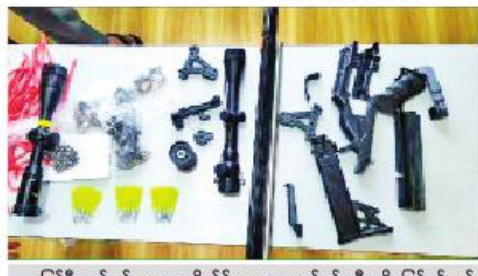
ပြင်ဦးလွင် စစ်ဆေးရေးကိတ်၌ လေသေနတ်ဖမ်းဆီးရမိမှုဖြစ်စဉ်တွင် သိမ်းဆည်းရမိသည့် သက်သေခံပစ္စည်းများ။

အလားတူ ယင်းနေ့ နံနက် ၈ နာရီ ၄၅ မိနစ်တွင် ပြင်ဦးလွင်မြို့နယ် ရေငယ်ကျေးရွာအနီး မန္တလေး-လားရှိုးကားလမ်းပေါ်ရှိ စစ်ဆေးရေး