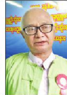
ဆရာမျှဝေ(ဥက္ကဋ္ဌ)