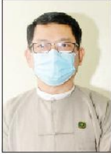
အမြဲတမ်းအတွင်းဝန် ဦးမင်းမင်း