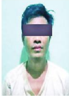
ဇော်ဇော်