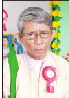
ဆရာသူရဇော်