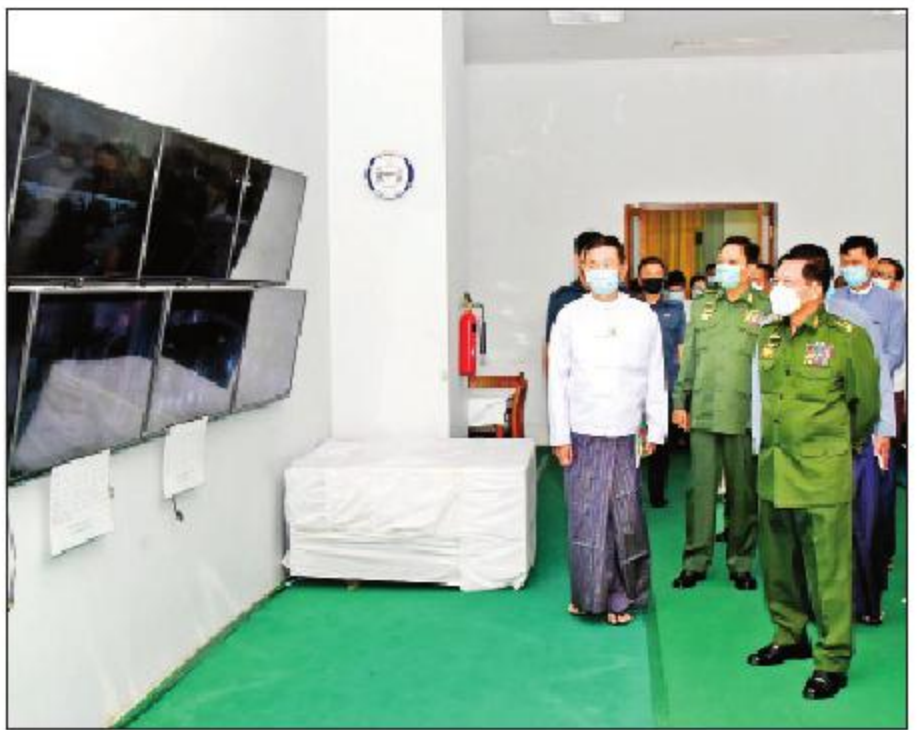
နိုင်ငံတော်စီမံအုပ်ချုပ်ရေးကောင်စီဥက္ကဋ္ဌ၊ တပ်မတော်ကာကွယ်ရေးဦးစီးချုပ် ဗိုလ်ချုပ်မှူးကြီးမင်းအောင်လှိုင် မဏိရတနာကျောက်စိမ်းခန်းမ ပထမထပ်ရှိ CCTV Control Room ကို ကြည့်ရှုစဉ်။