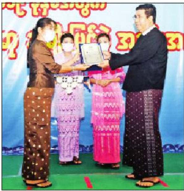
ရန်ကုန်တိုင်းဒေသကြီးဥပဒေချုပ်ဦးဌေးအောင် ဆရာမောင်အောင် ကိုယ်စား သမီးဖြစ်သူ မရည်မွန်အောင်အား ဆုပေးအပ်ချီးမြှင့်စဉ်။