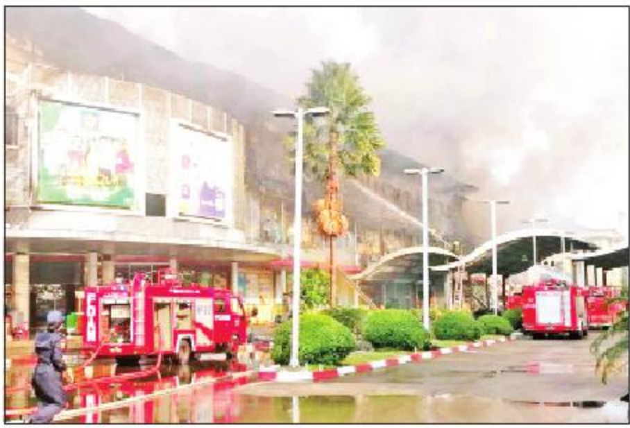
မရမ်းကုန်းမြို့နယ် ဂန္ဓမာတိုးဆေးကုန်တိုက် မီးလောင်မှုဖြစ်ပွားစဉ်။