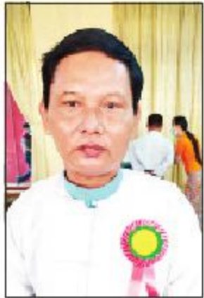
မင်းဗေဒါ(ပွင့်ဖြူ)