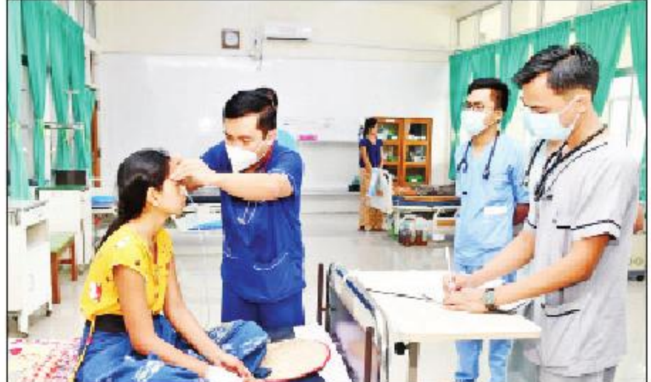
သက်ရှိကမ္ဘာ ရှင်သန်ဖို့ အိုဇုန်းလွှာကို ထိန်းသိမ်းစို့