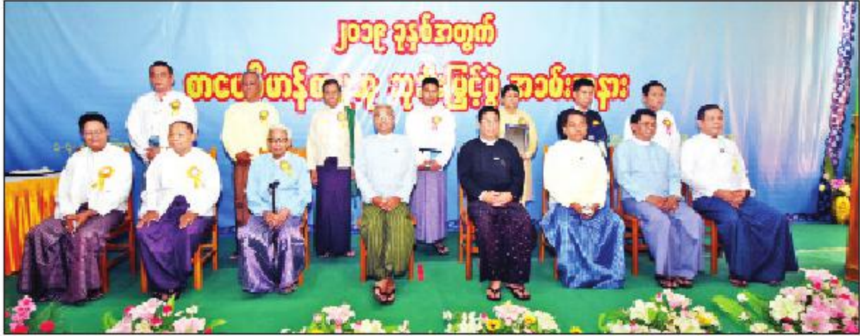
ဒုတိယဝန်ကြီး ဦးရဲတင့်၊ စာပေဗိမာန် စာမူဆုချီးမြှင့်ပွဲ တက်ရောက်လာကြသူများနှင့် ဆုရရှိသူများ စုပေါင်းမှတ်တမ်းတင်ဓာတ်ပုံရိုက်စဉ်။

ပြန်ကြားရေးဝန်ကြီးဌာနသည် မြန်မာစာပေလောကတွင် စာကောင်းပေမွန်များ ထွက်ပေါ်လာစေရေးအတွက် ပုံနှိပ်ထုတ်ဝေရန် အခက်အခဲရှိနေသော စာပေကလောင်ရှင်များ၏ စာမူများကို သီးခြား ပြိုင်ပွဲဖိတ်ခေါ်ကာ စာပေဗိမာန်စာမူဆုအဖြစ် ၁၉၆၉ ခုနှစ်မှ စတင်၍