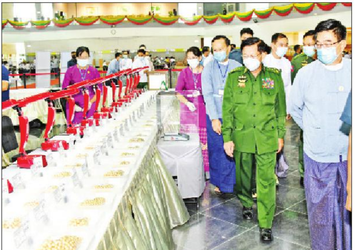
နိုင်ငံတော်စီမံအုပ်ချုပ်ရေးကောင်စီဥက္ကဋ္ဌ၊ တပ်မတော်ကာကွယ်ရေးဦးစီးချုပ် ဗိုလ်ချုပ်မှူးကြီးမင်းအောင်လှိုင် ပုလဲအတွဲများ ခင်းကျင်းပြသထားရှိမှုကို လှည့်လည်ကြည့်ရှုစဉ်။

၂၀၂၁ ခုနှစ် ဧပြီလ ပုလဲအတွဲများနှင့် ကျောက်မျက်ရတနာများ မြန်မာကျပ်ငွေဖြင့် ရောင်းချပွဲကို မဏိရတနာကျောက်စိမ်းခန်းမ၌ ဧပြီ ၁ ရက်မှ ၁၀ ရက်အထိ ကျင်းပသွားမည်ဖြစ်ပြီး ပုလဲအတွဲ ၃၁၇ တွဲ၊ ကျောက်စိမ်းအတွဲ ၂၄၄၈ တွဲ၊ ကျောက်မျက်အတွဲ ၁၉၉ တွဲတို့ကို အိတ်ဖွင့်တင်ဒါစနစ်ဖြင့် ပြည်တွင်းရတနာကုန်သည်များအား ရောင်းချပေးသွားမည်ဖြစ်ကြောင်း သိရသည်။ သတင်းစဉ်