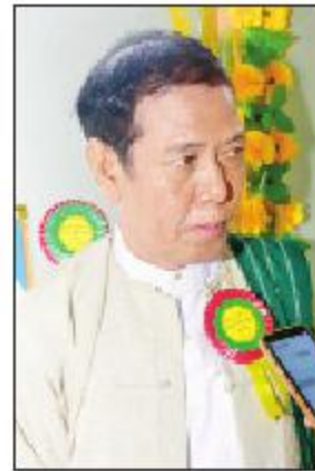
ရန်ကုန်ဌေးဇော်