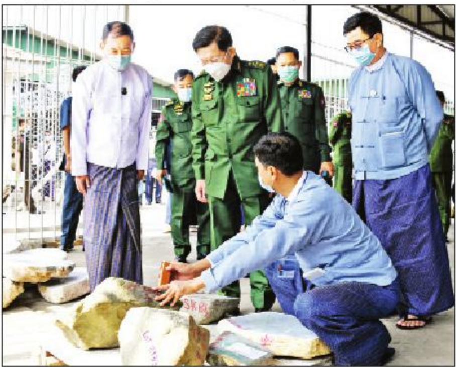
နိုင်ငံတော်စီမံအုပ်ချုပ်ရေးကောင်စီဥက္ကဋ္ဌ၊ တပ်မတော်ကာကွယ်ရေးဦးစီးချုပ် ဗိုလ်ချုပ်မှူးကြီးမင်းအောင်လှိုင် ကျောက်စိမ်းအတွဲများ ခင်းကျင်းပြသထားရှိမှုကို ကြည့်ရှုစဉ်။