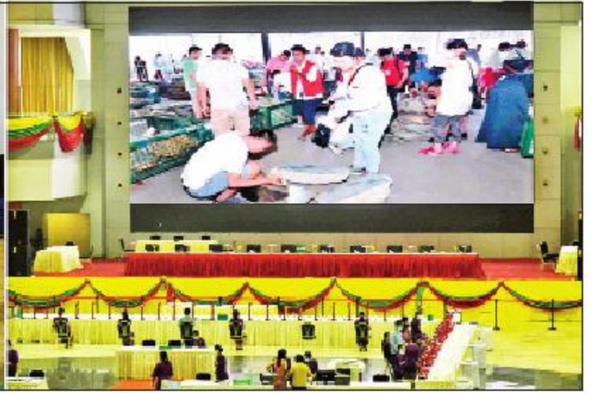
နိုင်ငံတော်စီမံအုပ်ချုပ်ရေးကောင်စီဥက္ကဋ္ဌ၊ တပ်မတော်ကာကွယ်ရေးဦးစီးချုပ် ဗိုလ်ချုပ်မှူးကြီးမင်းအောင်လှိုင် ၂၀၂၁ ခုနှစ် ဧပြီလ ပုလဲအတွဲများနှင့် ကျောက်မျက်ရတနာများ မြန်မာကျပ်ငွေဖြင့် ရောင်းချပွဲ အောင်မြင်စွာ ကျင်းပနိုင်ရေးအတွက် ကြိုတင်ပြင်ဆင်ဆောင်ရွက်ခဲ့မှု ဝီဒီယိုမှတ်တမ်းအား ကြည့်ရှုစဉ်။