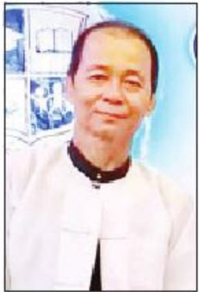
ကန့်ဘလူ ခင်မောင်ဆွေ