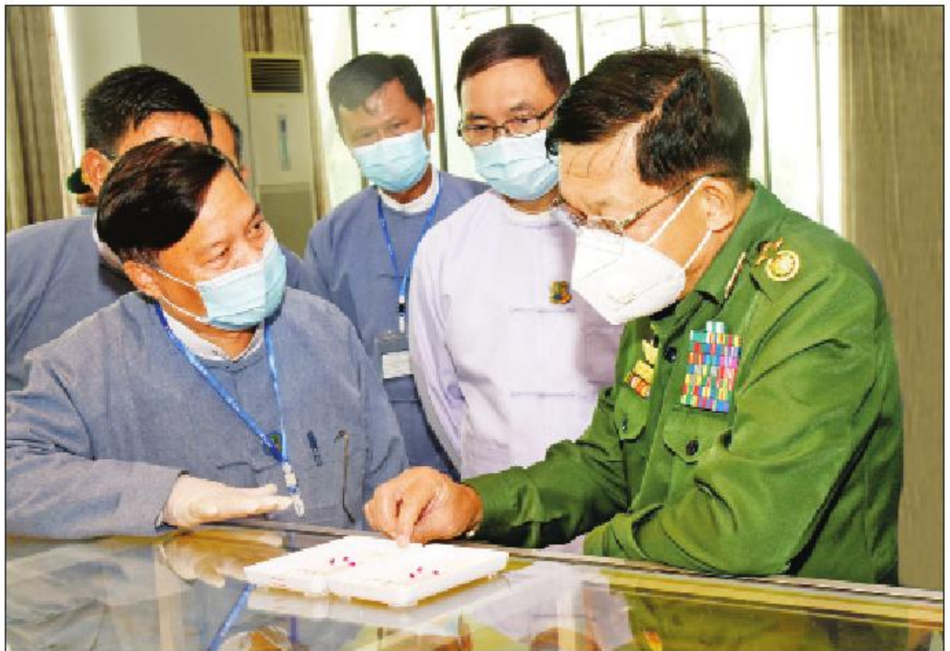
နိုင်ငံတော်စီမံအုပ်ချုပ်ရေးကောင်စီဥက္ကဋ္ဌ၊ တပ်မတော်ကာကွယ်ရေးဦးစီးချုပ် ဗိုလ်ချုပ်မှူးကြီးမင်းအောင်လှိုင် ကျောက်မျက်ရတနာအချောထည်များ ခင်းကျင်းပြသထားရှိမှုကို ကြည့်ရှုစဉ်။