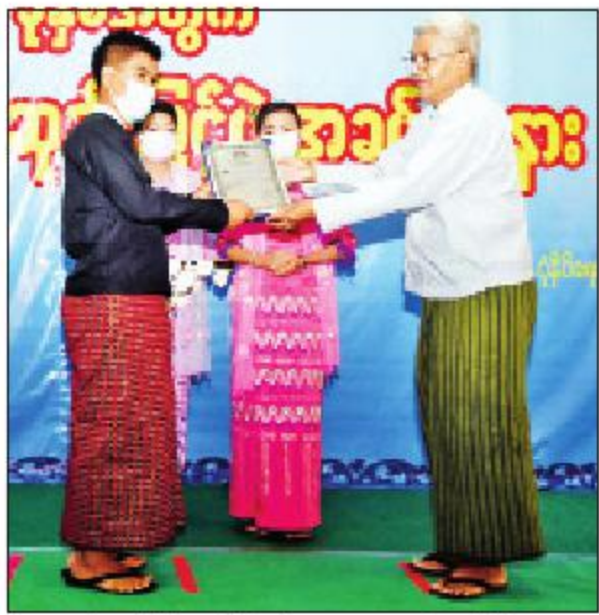
ဒုတိယဝန်ကြီး ဦးရဲတင့် ဆရာဇွေကွဲကော်(မြို့လှ)အား ဆုပေးအပ်ချီးမြှင့်စဉ်။