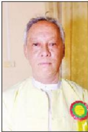
လွင်မြန်မာ(မန်းတက္ကသိုလ်)

ကျွန်တော်က ၁၉၈၂ ခုနှစ် ပုံနှိပ်စာလုံး ဖော်ပြခံရတဲ့အချိန်က စပြီး တော်တော်များများ လူငယ်နဲ့ ကလေးသူငယ်တွေအကြောင်း ရေးတာများတယ်။ ကိုယ်တိုင်လည်း ကလေး၊ လူငယ်ဘဝက ဖြတ်သန်းလာရတဲ့အခါကျတော့ လူကြီးတွေဆီကနေ တာဝန်တွေ လွှဲပြောင်းယူခဲ့ရတာပေါ့။ ဒီလိုပဲ ကလေးလူငယ်တွေလည်း တာဝန်တွေကိုယ်စီ