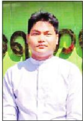
ရဲမင်းထက်(မြန်မာစာ)