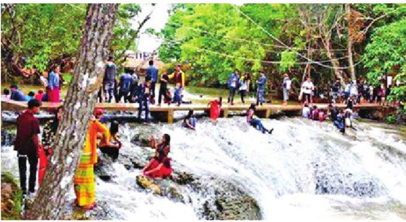
ကယားပြည်နယ် လွိုင်ကော်မြို့ရှိ ထီးစခန်းရေတံခွန်။

မြန်မာနိုင်ငံတွင် သမိုင်းဝင်အထင်ကရ သွားလာ လည်ပတ်စရာဒေသများ၊ မြတ်ဗုဒ္ဓသာသနာ၏ အရိပ်လက္ခဏာ တန်ခိုးကြီးဘုရားများဖြင့် ပြည့်စုံနေပေသည်။ ပြည်တွင်း၊ ပြည်ပ ခရီးသွား များ ရန်ကုန်မှ စတင်အခြေပြုလေ့လာလိုလျှင် ရွှေတိဂုံဘုရားကို မြင်ကြပေလိမ့်မည်။ ထိုမှတစ်ဆင့် ရွှေတိဂုံစေတီတော်မြတ်ကြီးကို ရှုထောင့်မျိုးစုံမှ ဓာတ်ပုံရိုက်ယူခြင်း၊ မြန်မာ့ရေးအကျဆုံး အနု သုခုမလက်ရာများကို အသေးစိတ်လေ့လာနိုင် သည်။ ကမ္ဘာကျော် လေးဆူဓာတ်ပုံ ရွှေတိဂုံစေတီ တော်ကြီး၏ သမိုင်းကြောင်းအချို့ကို လက်လှမ်းမီ သမျှ စူးစမ်းခွင့်၊ ဗဟုသုတရှာဖွေခွင့်များ ရရှိနိုင် သည်။ ကယားပြည်နယ်တစ်ခွင် လှည့်လည်လို လျှင်လည်း လွိုင်ကော်မြို့တွင် ထီးစခန်းရေတံခွန်၊ ကြွတ်ဂူ၊ ဒီးမော့ဆိုမြို့တွင် ငွေတောင် ဆည်၊ ထီးပွင့် ကန်၊ ကန်ခနစ်ဆင့်၊ ပန်ပတ်ရွာ၊ ရေပြာအိုင် (နန်းမယ်ခုံ) စသည်ဖြင့် ထင်ရှားသည့်နေရာများစွာ ရှိသည်။ ထို့အတူ မြန်မာတို့၏နွဲ့လုံးသား စုဆုံရာ ပုဂံဒေသရှိ စေတီပုထိုးများစွာနှင့် ရှေးခေတ်အသုံး အဆောင်၊ ယဉ်ကျေးမှုအနုပညာရသများစွာကို လည်း ကြည့်ရှုနိုင်လေ့ရှိပါသည်။