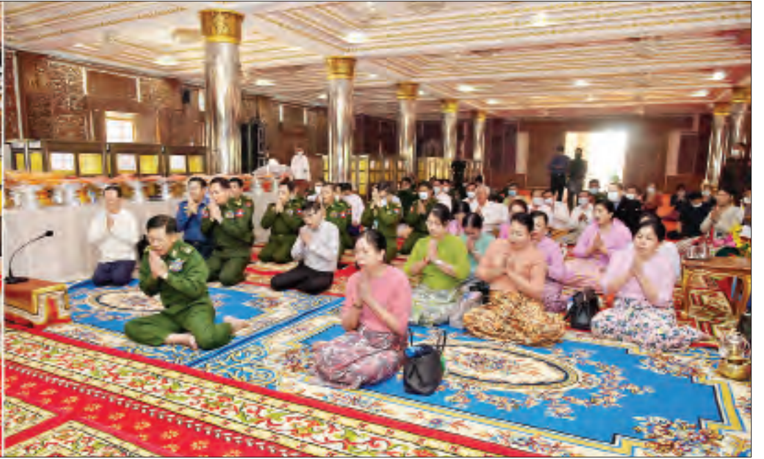
နိုင်ငံတော်စီမံအုပ်ချုပ်ရေးကောင်စီဥက္ကဋ္ဌ၊ တပ်မတော်ကာကွယ်ရေးဦးစီးချုပ် ဗိုလ်ချုပ်မှူးကြီးမင်းအောင်လှိုင်နှင့် ဇနီး ဒေါ်ကြူကြူလှနှင့် ဧည့်ပရိသတ်တို့က ရှမ်းပြည်နယ်(အရှေ့ပိုင်း) တာချီလိတ်မြို့ နဂါးနှစ်ကောင်ကျောင်းတိုက် ပဓာနနာယက နိုင်ငံတော်ဩဝါဒါစရိယ အဘိဓမ္မ အဂ္ဂမဟာသဒ္ဓမ္မဇောတိက အဂ္ဂမဟာပဏ္ဍိတ ဒေါက်တာ ဘဒ္ဒန္တ ဓမ္မသီရိထံမှ ငါးပါးသီလ ခံယူဆောင်တည်ကြစဉ်။