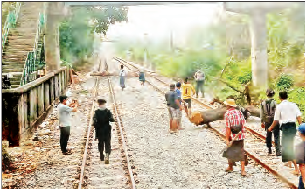
မသမာသူအကြမ်းဖက်သမားများက ရထားသံလမ်းပေါ်တွင် သစ်တုံးများဖြင့် ပိတ်ဆို့ထားမှုအား ဒေသခံတာဝန်သိပြည်သူများနှင့် တာဝန်ရှိသူများက ရှင်းလင်းဆောင်ရွက်စဉ်။