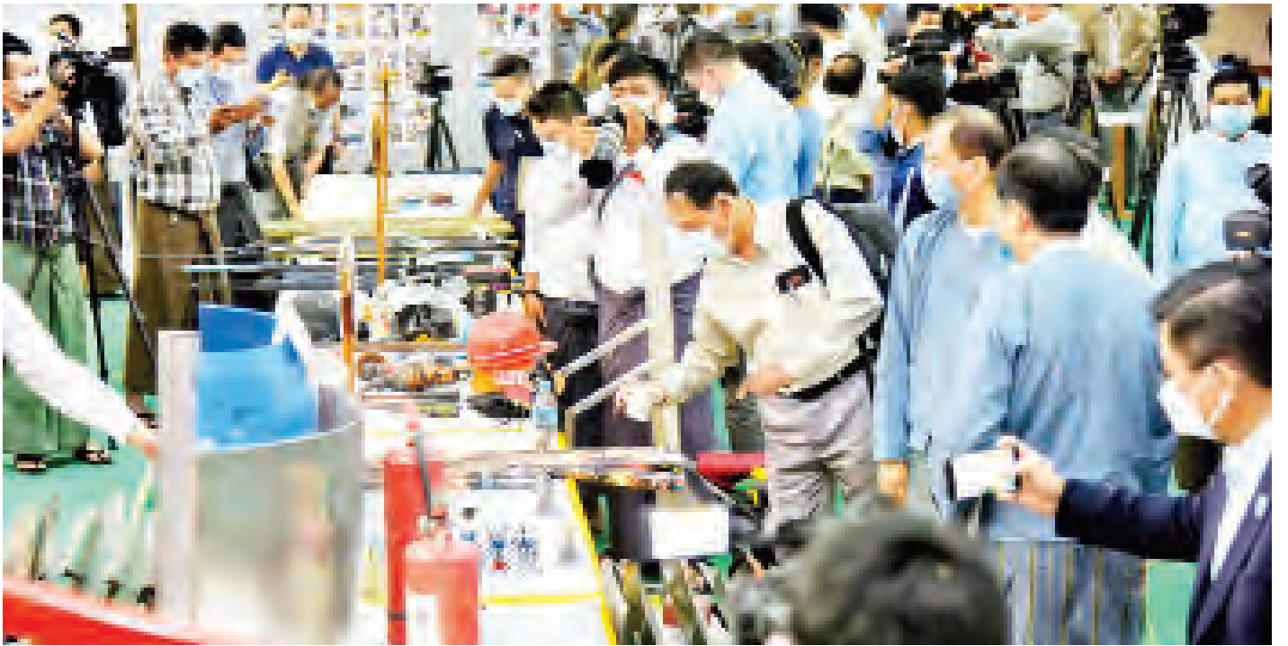
သတင်းစာရှင်းလင်းပွဲသို့ တက်ရောက်လာသူများက ဆူပူအကြမ်းဖက်မှုများတွင် အသုံးပြုသည့် လက်နက်ကိရိယာများကို ကြည့်ရှုလေ့လာကြစဉ်။

လွတ်လပ်စွာပြောခွင့်ဆိုခွင့်ကို Internet မည်သို့ပိတ်ပိတ် နည်းပညာများ ထွန်းကားကြောင်း၊ VPN ဖြင့် ကျော်သွားပါက ရရှိကြောင်း၊ သတင်း လွတ်လပ်ခွင့်ဆိုသည်မှာ သတင်းက မူလကတည်းက လွတ်လပ်ခွင့်ရှိပြီးဖြစ်ကြောင်း၊ မိမိရေးသားသည့် အပေါ်တွင်သာ မူတည်ကြောင်း၊ မိမိတို့သည် ရခိုင်ကို လည်းသွားခဲ့ကြောင်း၊ ရခိုင်ဆို၍ ဝမ်းသာစကား ပြောလိုကြောင်း၊ ယခု AA က NCA လက်မှတ်ထိုးတော့ မည်ဖြစ်ကြောင်း၊ ထိုကဲ့သို့ ရခိုင်ကိစ္စတွင် AA က တပ်မတော်နှင့် ပူးပေါင်းဆောင်ရွက်မှုဆိုသည်မှာ အင်မတန် ကောင်းမွန်ကြောင်း၊ ဒါက နံပါတ်တစ် ဖြစ်ကြောင်း၊ နံပါတ်နှစ်မှာ ဘင်္ဂလားဒေ့ရှ်ကလည်း မြန်မာကိုထောက်ခံကြောင်း၊ နံပါတ်သုံး အာဆီယံ နိုင်ငံများကလည်း မြန်မာပြည်တွင်းရေးကို မစွက်