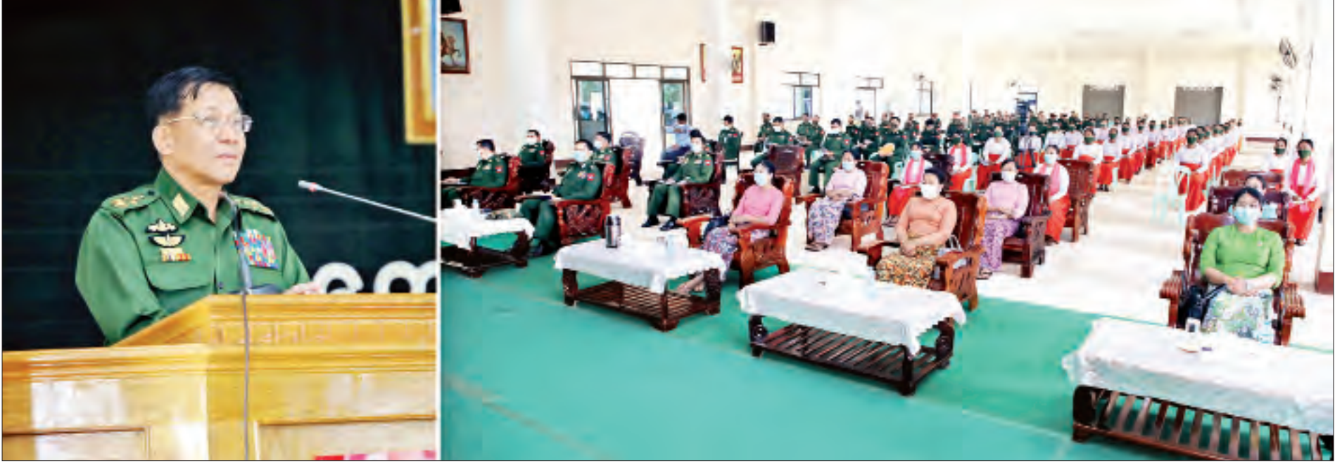
နိုင်ငံတော်စီမံအုပ်ချုပ်ရေးကောင်စီဥက္ကဋ္ဌ၊ တပ်မတော်ကာကွယ်ရေးဦးစီးချုပ် ဗိုလ်ချုပ်မှူးကြီးမင်းအောင်လှိုင် တာချီလိတ်တပ်နယ်မှ အရာရှိ၊ စစ်သည်၊ မိသားစုများအား တွေ့ဆုံအမှာစကားပြောကြားစဉ်။

နေပြည်တော် မတ် ၂၈ နိုင်ငံတော်စီမံအုပ်ချုပ်ရေးကောင်စီဥက္ကဋ္ဌ၊ တပ်မတော်ကာကွယ်ရေး ဦးစီးချုပ် ဗိုလ်ချုပ်မှူးကြီးမင်းအောင်လှိုင်သည် ယနေ့မွန်လွဲပိုင်းတွင် တာချီလိတ်တပ်နယ်မှ အရာရှိ၊ စစ်သည်၊ မိသားစုများအား သွားရောက် တွေ့ဆုံအမှာစကားပြောကြားသည်။ တွေ့ဆုံပွဲသို့ နိုင်ငံတော်စီမံအုပ်ချုပ်ရေးကောင်စီဥက္ကဋ္ဌ၊ တပ်မတော် ကာကွယ်ရေးဦးစီးချုပ်နှင့်အတူ ဇနီး ဒေါ်ကြူကြူလှ၊ နိုင်ငံတော်စီမံ အုပ်ချုပ်ရေးကောင်စီဝင် ဒုတိယဗိုလ်ချုပ်ကြီး မိုးမြင့်ထွန်း၊ ကောင်စီ