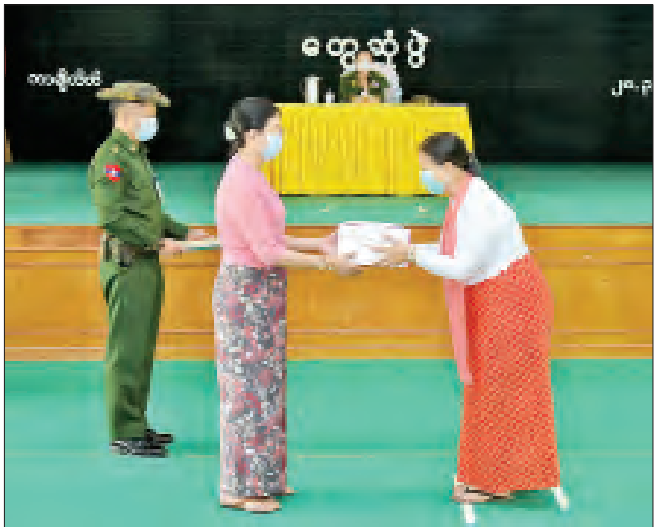
နိုင်ငံတော်စီမံအုပ်ချုပ်ရေးကောင်စီဥက္ကဋ္ဌ၊ တပ်မတော်ကာကွယ်ရေးဦးစီးချုပ် ဗိုလ်ချုပ်မှူးကြီး မင်းအောင်လှိုင်၏ ဇနီး ဒေါ်ကြူကြူလှက မိခင်နှင့်ကလေးထောက်ပံ့ငွေများ ပေးအပ်ရာ တာချီလိတ် တပ်နယ်မှူး၏ ဇနီးက လက်ခံယူစဉ်။

○ ရှေးဦးမှ တပ်မတော်အနေဖြင့် မိမိတို့နိုင်ငံကို ဒီမိုကရေစီ မကူးပြောင်းမီကာလများတွင် နိုင်ငံတကာတွင် ကျင့်သုံးလျက်ရှိသည့် ဒီမိုကရေစီကျင့်သုံးပုံများကို လေ့လာပြီး ဒီမိုကရေစီပြုပြင်ပြောင်းလဲမှုအဆင့်ဆင့်ကို ပုံဖော်ခဲ့ရကြောင်း၊ ထို့နောက် ပြည်သူတို့လိုလားတောင့်တသည့် ဒီမိုကရေစီလမ်းကြောင်းပေါ်သို့ ရောက်ရှိအောင် လုပ်ဆောင်ပေးခဲ့ပြီး ၂၀၁၀ ပြည့်နှစ် ပါတီစုံဒီမိုကရေစီ အထွေထွေရွေးကောက်ပွဲကြီးကို ဒီမိုကရေစီနည်းလမ်းကျစွာဖြင့် အောင်မြင်စွာ လုပ်ဆောင်ပေးနိုင်ခဲ့ကြောင်း။