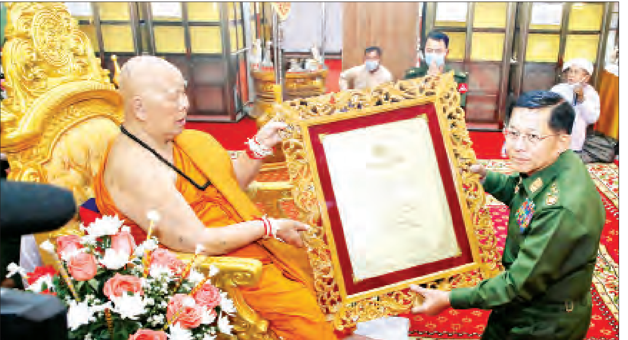
နိုင်ငံတော်စီမံအုပ်ချုပ်ရေးကောင်စီဥက္ကဋ္ဌ၊ တပ်မတော်ကာကွယ်ရေးဦးစီးချုပ် ဗိုလ်ချုပ်မှူးကြီးမင်းအောင်လှိုင် ရှမ်းပြည်နယ်(အရှေ့ပိုင်း) တာချီလိတ်မြို့ နဂါးနှစ်ကောင်ကျောင်းတိုက် ပဓာနနာယက နိုင်ငံတော်ဩဝါဒါစရိယ အဘိဓမ္မ အဂ္ဂမဟာသဒ္ဓမ္မဇောတိက အဂ္ဂမဟာပဏ္ဍိတ ဒေါက်တာ ဘဒ္ဒန္တ ဓမ္မသီရိအား အဘိဓမ္မဟာရဋ္ဌဂုရု ဘွဲ့တံဆိပ်တော် ဆက်ကပ်စဉ်။

ထို့နောက် နိုင်ငံတော်စီမံအုပ်ချုပ်ရေးကောင်စီဥက္ကဋ္ဌ၊ တပ်မတော်ကာကွယ်ရေးဦးစီးချုပ် ဗိုလ်ချုပ်မှူးကြီးမင်းအောင်လှိုင်က နဂါးနှစ်ကောင်ကျောင်းတိုက် ဆရာတော်ကြီး ဒေါက်တာ ဘဒ္ဒန္တဓမ္မသီရိထံ အဘိဓမ္မဟာရဋ္ဌဂုရု ဘွဲ့တံဆိပ်တော်နှင့် အဆောင်အယောင်များ