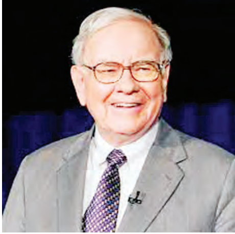
ဘီလျ်နာ ဝါရင်ဘတ်ဖက်

တူလုပ်ငန်း (Buffet Partnership) လို့ခေါ်တဲ့ ဘတ်ဖက်ရင်းနှီးမြှုပ်နှံမှု ကုမ္ပဏီကိုထောင်ပြီး ပါတနာတွေကို ဖိတ်ခေါ်ပါတယ်။ ၁၉၆၀ ပြည့်နှစ် မှာတော့ ဘတ်ဖက်ရင်းနှီးမြှုပ်နှံမှုကုမ္ပဏီက အကျိုးတူ ရင်းနှီးမြှုပ်နှံမှု ခုနစ်ခု လုပ်ကိုင်လာနိုင်ပါတယ်။ ၁၉၆၂ ခုနှစ်မှာ ဝါရင်ဘတ်ဖက်က မီလျ်နာ ဖြစ်လာပါတယ်။ ၁၉၆၅ ခုနှစ် ဇန်နဝါရီလမှာ ဘတ်ဖက်ရင်းနှီးမြှုပ်နှံမှုကုမ္ပဏီရဲ့ ပိုင်ဆိုင်မှုက အမေရိကန်ဒေါ်လာ ခုနစ်သန်းကျော်ရှိပြီး ဝါရင် ဘတ်ဖက်ရဲ့ ပိုင်ဆိုင်မှုက တစ်သန်းကျော် ပါပါတယ်။