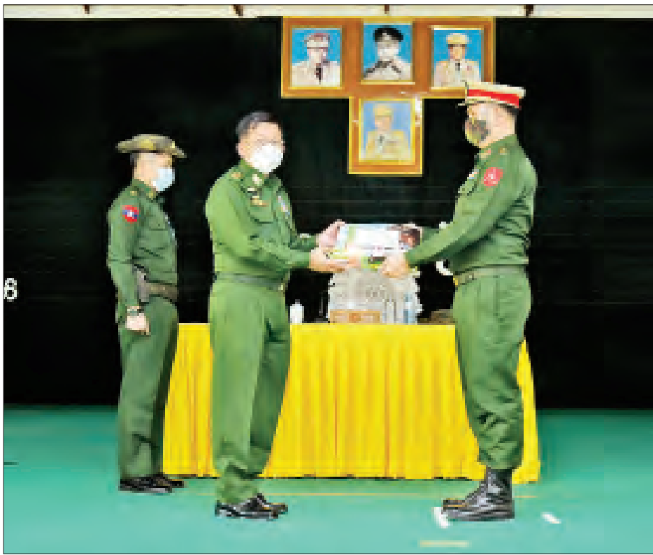
နိုင်ငံတော်စီမံအုပ်ချုပ်ရေးကောင်စီဥက္ကဋ္ဌ၊ တပ်မတော်ကာကွယ်ရေးဦးစီးချုပ် ဗိုလ်ချုပ်မှူးကြီး မင်းအောင်လှိုင်က စားသောက်ဖွယ်ရာပစ္စည်းများ ပေးအပ်ရာ တာချီလိတ်တပ်နယ်မှူးက လက်ခံယူစဉ်။