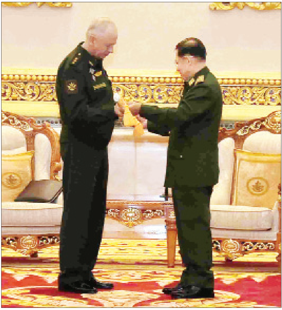
နိုင်ငံတော်စီမံအုပ်ချုပ်ရေးကောင်စီဥက္ကဋ္ဌ တပ်မတော်ကာကွယ်ရေးဦးစီးချုပ် ဗိုလ်ချုပ်မှူးကြီးမင်းအောင်လှိုင်က ရုရှားဖက်ဒရေးရှင်းနိုင်ငံ ဒုတိယကာကွယ်ရေးဝန်ကြီး Colonel General Alexander Vasilyevich Fominအား ဂုဏ်ထူးဆောင်စား ဂုဏ်ပြုပေးအပ်စဉ်။

ရင်းရင်းနှီးနှီးနှုတ်ဆက် ယင်းနောက် နိုင်ငံတော်စီမံအုပ်ချုပ်ရေးကောင်စီဥက္ကဋ္ဌ တပ်မတော်ကာကွယ်ရေးဦးစီးချုပ်နှင့် အဖွဲ့ဝင်များသည် တက်ရောက်လာကြသူများအား ရင်းရင်းနှီးနှီး လိုက်လံနှုတ်ဆက်ကြသည်။ ယင်းနောက် လက်ရှိမြန်မာနိုင်ငံ၌ဖြစ်ပေါ်နေသည့် ဆူပူအကြမ်းဖက်မှုဖြစ်စဉ်များတွင် သိမ်းဆည်းရမိခဲ့သည့် ဆူပူအကြမ်းဖက်လှုပ်ရှားမှုများတွင် အသုံးပြုလာသော ဒေသန္တရလုပ်လက်နက်၊ ကိရိယာပစ္စည်းများ စသည်တို့ကို ခင်းကျင်းပြသထားရှိရာ