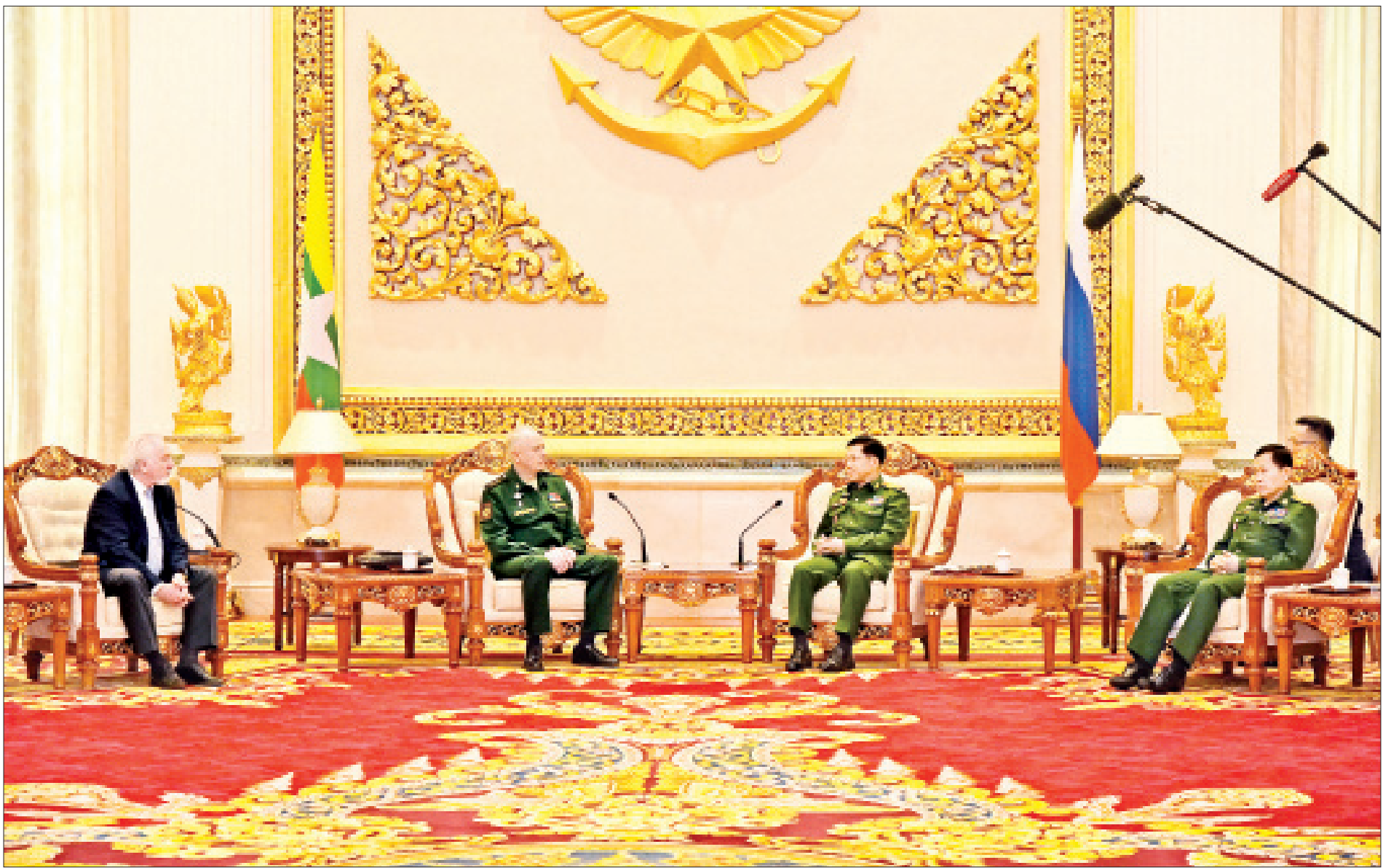
နိုင်ငံတော်စီမံအုပ်ချုပ်ရေးကောင်စီဥက္ကဋ္ဌ တပ်မတော်ကာကွယ်ရေးဦးစီးချုပ် ဗိုလ်ချုပ်မှူးကြီး မင်းအောင်လှိုင် မြန်မာ့တပ်မတော်၏ (၇၆)နှစ်မြောက်တပ်မတော်နေ့အခမ်းအနားသို့ ပါဝင်တက်ရောက်မည့် ရုရှားဖက်ဒရေးရှင်းနိုင်ငံ ဒုတိယကာကွယ်ရေးဝန်ကြီး Colonel General Alexander Vasilyevich Fomin ဦးဆောင်သော ကိုယ်စားလှယ်အဖွဲ့အား လက်ခံတွေ့ဆုံသည်။

နေပြည်တော် မတ် ၂၆ နိုင်ငံတော်စီမံအုပ်ချုပ်ရေးကောင်စီဥက္ကဋ္ဌ တပ်မတော်ကာကွယ်ရေး ဦးစီးချုပ် ဗိုလ်ချုပ်မှူးကြီး မင်းအောင်လှိုင်သည် မြန်မာ့တပ်မတော်၏ (၇၆)နှစ်မြောက်တပ်မတော်နေ့အခမ်းအနားသို့ ပါဝင်တက်ရောက်မည့် ရုရှားဖက်ဒရေးရှင်းနိုင်ငံ ဒုတိယကာကွယ်ရေးဝန်ကြီး Colonel General Alexander Vasilyevich Fomin ဦးဆောင်သော ကိုယ်စားလှယ်အဖွဲ့အား ယနေ့နံနက်ပိုင်းတွင် နေပြည်တော်ရှိ ဇေယျာသီရိဗိမာန် ဧည့်ခန်းမ ဆောင်၌ လက်ခံတွေ့ဆုံသည်။