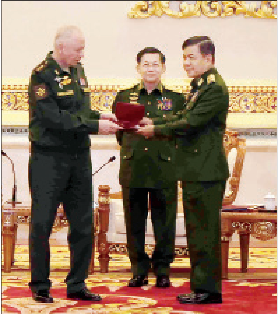
ရုရှားဖက်ဒရေးရှင်းနိုင်ငံ ဒုတိယကာကွယ်ရေးဝန်ကြီး Colonel General Alexander Vasilyevich Fomin က နိုင်ငံတော်စီမံအုပ်ချုပ်ရေးကောင်စီဝင် ညှိနှိုင်းကွပ်ကဲရေးမှူး(ကြည်း၊ ရေ လေ)ဗိုလ်ချုပ်ကြီး မောင်မောင်အေးအား “တိုက်ပွဲဝင် သွေးသောက်စိတ်မြှင့်တင်မှု” (For Strengthening of Combat Companionship-in-Arms)ဆုတံဆိပ် ပေးအပ်ချီးမြှင့်စဉ်။