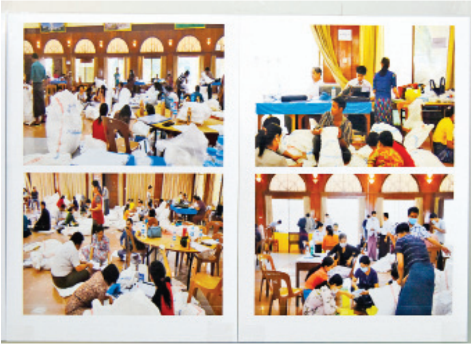
ရန်ကုန်တိုင်းဒေသကြီး မြို့နယ်များတွင် မဲလက်မှတ်များ မြေပြင်စစ်ဆေးမှုမှတ်တမ်း ဓာတ်ပုံများ

နောက်တစ်ချက်အနေဖြင့် နိုင်ငံရေးပါတီများက နိုင်ငံတော်တွင် တရားဥပဒေစိုးမိုးရေးနှင့် လုံခြုံစိတ်ချစွာ နေထိုင်ရေးအတွက် တောင်းဆိုချက်ကို နိုင်ငံတော်စီမံအုပ်ချုပ်ရေးကောင်စီသို့ တင်ပြရန်ဖြစ်ပါကြောင်း၊ ဤအချက်သည်လည်း ထိုအချိန်၌