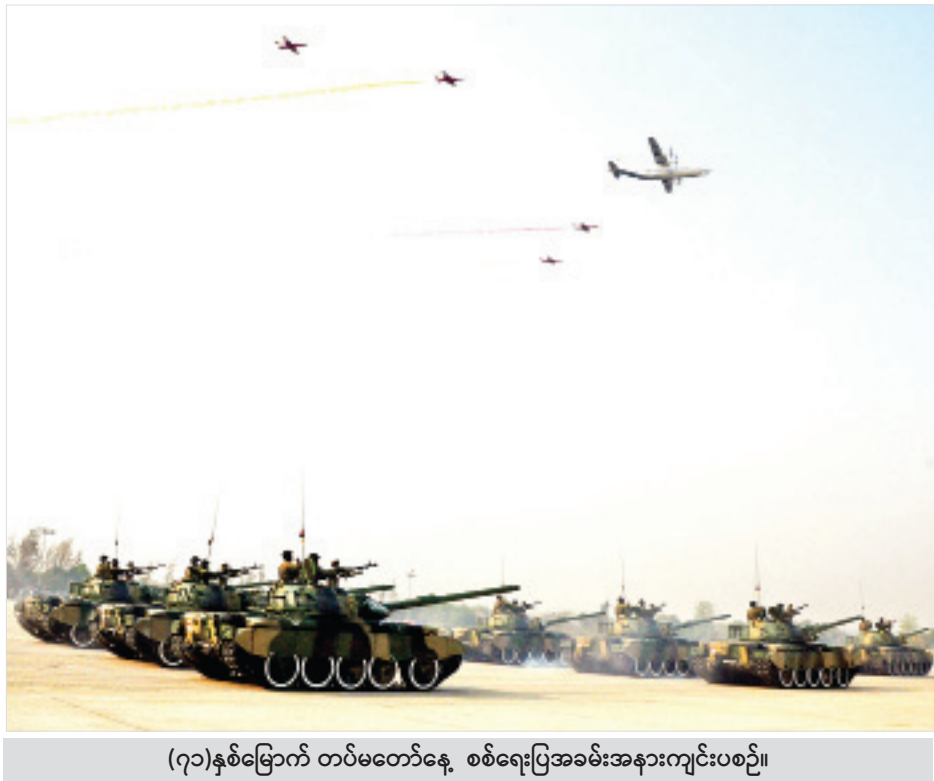
(၇၁)နှစ်မြောက် တပ်မတော်နေ့ စစ်ရေးပြအခမ်းအနားကျင်းပစဉ်။

မျိုးချစ်ဗမာ့တပ်မတော် ခေါင်းဆောင်များနှင့် တိုင်းမှူးများသည် လွတ်လပ်ရေးအတွက် တပ်မတော်ကို ဆက်လက်ရှင်သန်ဖွံ့ဖြိုးစေရန် လိုအပ်မည်ဖြစ်သောကြောင့် ၁၉၄၅ ခုနှစ် ဩဂုတ်လ ၁၀ ရက်နေ့နှင့် ၁၁ ရက်နေ့တို့တွင် ပဲခူးမြို့၌