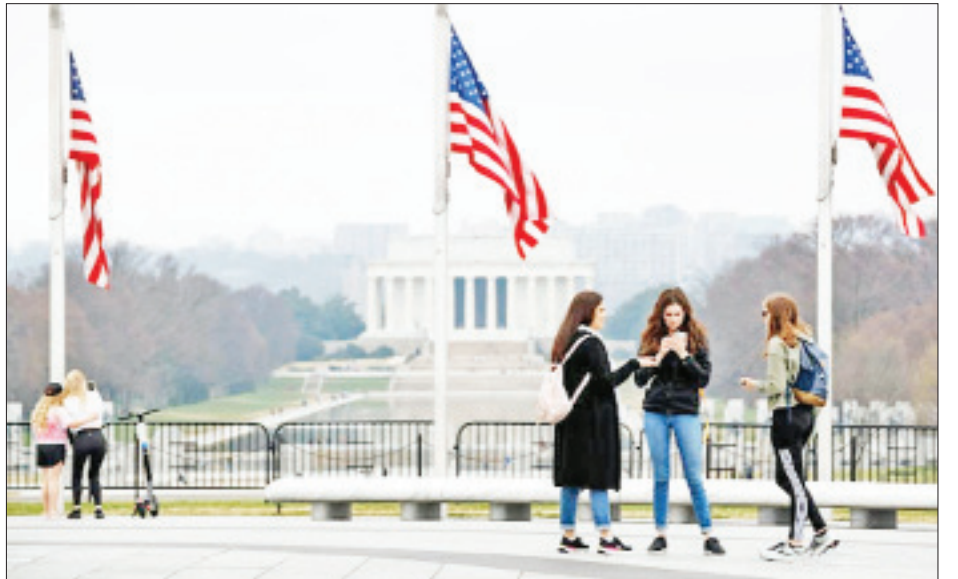
ဆေး၊ အမေရိကန်ဆေးဝါးကုမ္ပဏီ Moderna မှ ထုတ်လုပ်သည့် ကိုဗစ်-၁၉ ရောဂါကာကွယ်ဆေးနှင့် Johnson & Johnson ကိုဗစ်-၁၉ ရောဂါကာကွယ် ဆေးတို့ဖြစ်သည်။ တစ်ကြိမ်သာထိုးနှံရသည့် ကာကွယ် ဆေးအမျိုးအစားဖြစ်သည့် Johnson & Johnson ကိုဗစ်-၁၉ ရောဂါကာကွယ်ဆေးကို ဖေဖော်ဝါရီ ၂၇ ရက်တွင် နိုင်ငံအတွင်း သုံးစွဲခွင့်ပြုခဲ့သည်။ ကိုးကား- ဆင်ဟွာ၊ ဘာသာပြန်- အောင်ကျော်ကျော်

ယုံကြည်ပါတယ်ဟု သမ္မတ ဂျိုးဘိုင်ဒင်က ပြောကြား ခဲ့သည်။ လက်ရှိအချိန်အထိ အမေရိကန်နိုင်ငံ၌ ကိုဗစ်- ၁၉ ရောဂါကာကွယ်ဆေးထိုးနှံမှုခံယူပြီးသူ ၁၃၃ သန်းရှိပြီဖြစ်ကြောင်းနှင့် ကာကွယ်ဆေးအလုံးရေ ၁၇၃ သန်းကျော်အား နိုင်ငံတစ်ဝန်းသို့ ဖြန့်ဖြူးထား ပြီးဖြစ်ကြောင်း အမေရိကန်ရောဂါကာကွယ်ထိန်းချုပ် ရေးစင်တာက ပြောကြားခဲ့သည်။ ကာကွယ်ဆေး နှစ်ကြိမ်စလုံးထိုးနှံမှုခံယူပြီးသူ ၄၇ သန်း (နိုင်ငံလူဦးရေ ၁၄ ဒသမ ၃ ရာခိုင်နှုန်း) ရှိပြီး ယင်းတို့အနက် ၂၄ ဒသမ ၅ သန်းသည် အသက် ၆၅ နှစ်နှင့်အထက်ပြည်သူများဖြစ်သည်။ အမေရိကန်နိုင်ငံ၏ ကာကွယ်ဆေးထိုးနှံမှု အစီအစဉ်ကို ဒီဇင်ဘာလတွင် စတင်ခဲ့ပြီး လက်ရှိ အချိန်တွင် တစ်ရက်လျှင် ကာကွယ်ဆေးအလုံးရေ နှစ်သန်းထိုးနှံပေးလျက်ရှိသည်။ နိုင်ငံအတွင်း အသုံးပြုလျက်ရှိသည့် ကာကွယ် ဆေးသုံးမျိုးမှာ အမေရိကန်ဆေးဝါးကုမ္ပဏီ Pfizer နှင့် ဂျာမနီဆေးဝါးကုမ္ပဏီ BioNTech တို့ပူးပေါင်း ထုတ်လုပ်သည့် Pfizer ကိုဗစ်-၁၉ ရောဂါကာကွယ်