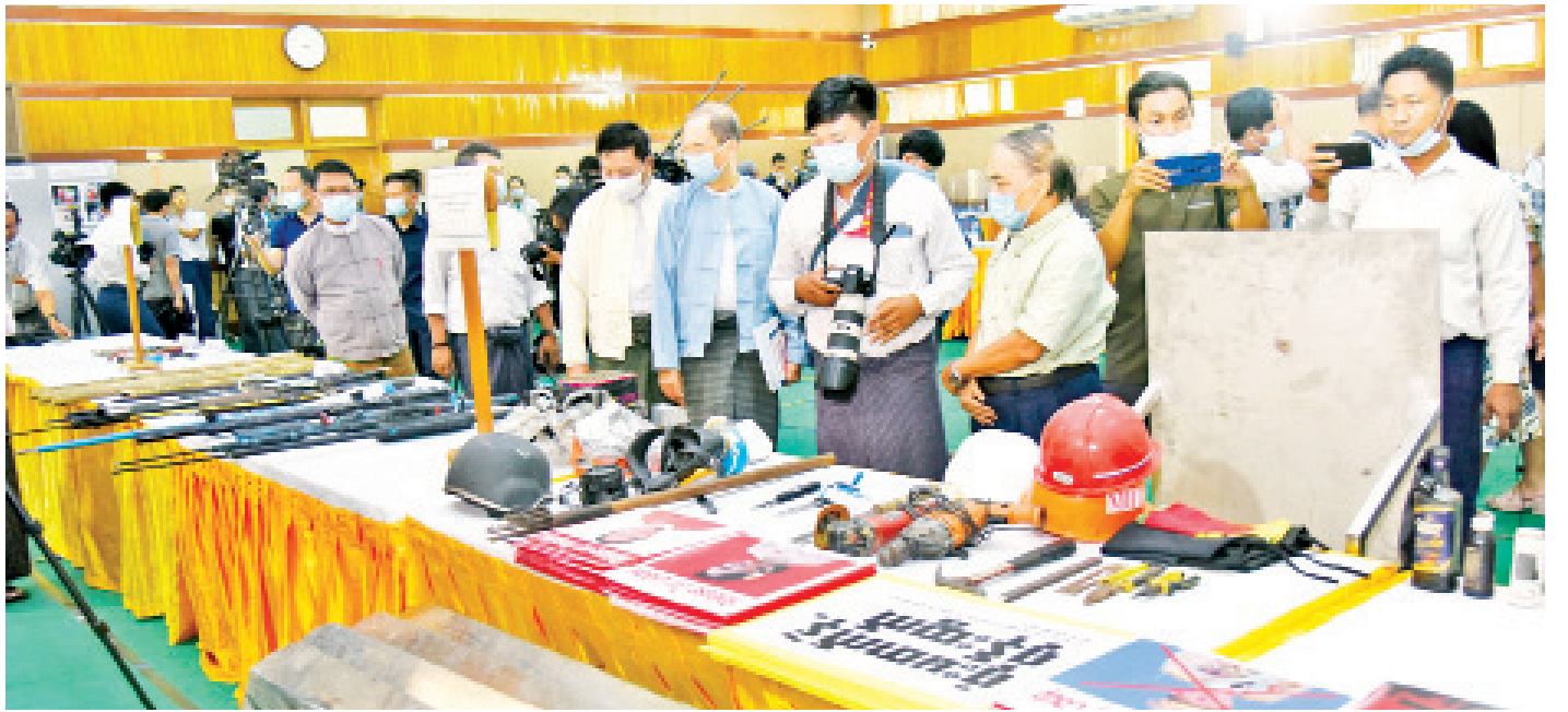
သတင်းစာရှင်းလင်းပွဲသို့ တက်ရောက်လာသူများက ဆူပူအကြမ်းဖက်မှုများတွင် အသုံးပြုသည့် လက်နက်ကိရိယာများကို ကြည့်ရှုလေ့လာကြစဉ်။