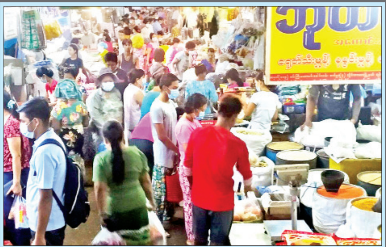
ရန်ကုန်မြို့တော် စည်ပင်သာယာနယ်နိမိတ်အတွင်း ဈေးပေါင်း ၁၈၄ ဈေးရှိရာ မြို့နယ်အသီးသီးရှိဈေးများတွင် ကုန်စည် အဝင်နှင့် အထွက်များ ပုံမှန်ဝင်ရောက်လျက်ရှိပြီး မတ် ၂၆ ရက်က လမ်းမတော်မြို့နယ် ညောင်ပင်လေးဈေးတွင် ဈေးရောင်း ဈေးဝယ်များဖြင့် စည်ကားလျက်ရှိသည်ကို တွေ့ရစဉ်။ သတင်းစဉ်