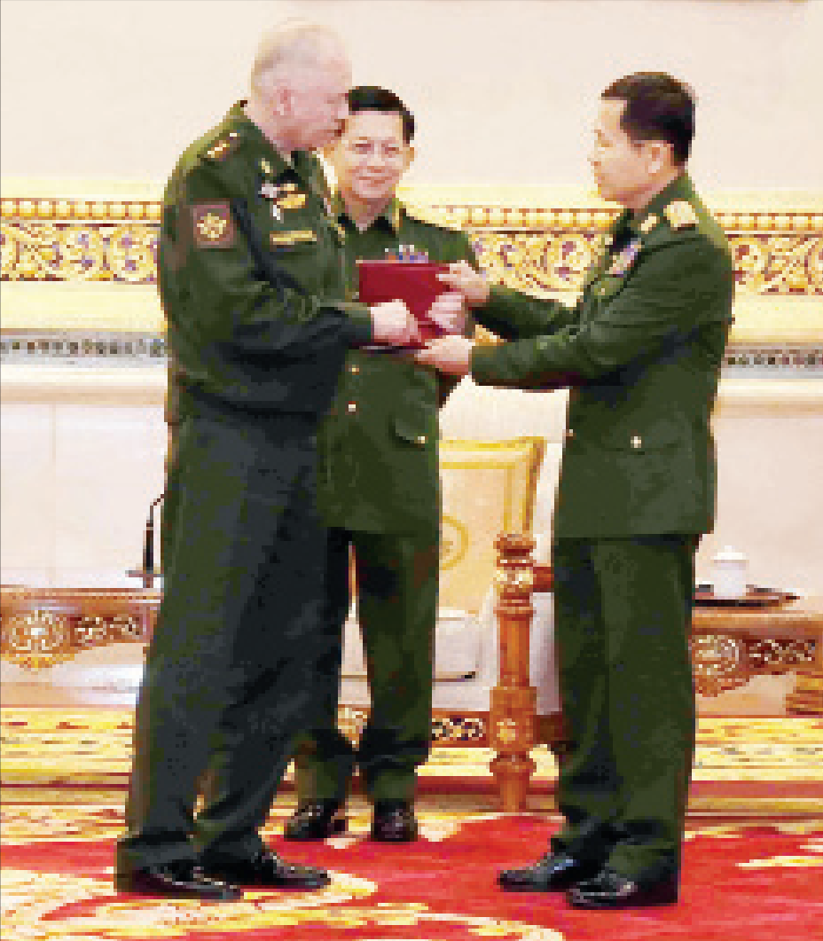
ရုရှားဖက်ဒရေးရှင်းနိုင်ငံ ဒုတိယကာကွယ်ရေးဝန်ကြီး Colonel General Alexander Vasilyevich Fomin က နိုင်ငံတော်စီမံအုပ်ချုပ်ရေးကောင်စီ ဒုတိယဥက္ကဋ္ဌ ဒုတိယတပ်မတော်ကာကွယ်ရေးဦးစီးချုပ် ကာကွယ်ရေးဦးစီးချုပ်(ကြည်း) ဒုတိယဗိုလ်ချုပ်မှူးကြီး စိုးဝင်းအား “တိုက်ပွဲဝင် သွေးသောက်စိတ်မြှင့်တင်မှု” (For Strengthening of Combat Companionship-in-Arms) ဆုတံဆိပ် ပေးအပ်ချီးမြှင့်စဉ်။

ရုရှားဖက်ဒရေးရှင်းနိုင်ငံ ဒုတိယကာကွယ်ရေးဝန်ကြီး ဥက္ကဋ္ဌ တပ်မတော်ကာကွယ်ရေးဦးစီးချုပ်က လိုက်လံနှင့် အဖွဲ့ဝင်များ၊ ရုရှားသတင်းမီဒီယာများက လေ့လာရှင်းလင်းပြသခဲ့ကြောင်း သတင်းရရှိသည်။ ကြည့်ရှုခဲ့ကြပြီး နိုင်ငံတော်စီမံအုပ်ချုပ်ရေးကောင်စီ သတင်းစဉ်