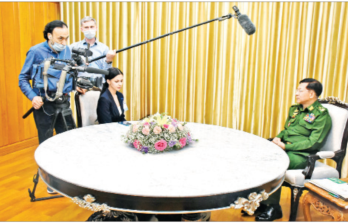
နိုင်ငံတော်စီမံအုပ်ချုပ်ရေးကောင်စီဥက္ကဋ္ဌ တပ်မတော်ကာကွယ်ရေးဦးစီးချုပ် ဗိုလ်ချုပ်မှူးကြီးမင်းအောင်လှိုင် ရုရှားနိုင်ငံမှ သတင်းဌာနများ၏ သိရှိလိုသည့် မေးမြန်းချက်များကို ဖြေကြားစဉ်။

နေပြည်တော် မတ် ၂၆ နိုင်ငံတော်စီမံအုပ်ချုပ်ရေးကောင်စီဥက္ကဋ္ဌ တပ်မတော် ကာကွယ်ရေးဦးစီးချုပ် ဗိုလ်ချုပ်မှူးကြီး မင်းအောင်လှိုင် သည် ရုရှားဖက်ဒရေးရှင်းနိုင်ငံ ပြည်သူ့ကောင်စီဥက္ကဋ္ဌ နှင့် သမ္မတ၏ သတင်းပြန်ကြားရေးဆိုင်ရာ အကြံပေး ပုဂ္ဂိုလ်ဖြစ်သူ Mr.Pavel GUSEV နှင့် ရုရှားနိုင်ငံမှ သတင်းဌာနများအား နေပြည်တော်ရှိ ဆင်ဖြူတော် ဧည့်ရိပ်သာ၌ သီးခြားစီလက်ခံတွေ့ဆုံ၍ သိရှိ လိုသည့် မေးမြန်းချက်များကို ဖြေကြားခဲ့သည်။ ရှင်းလင်းဖြေကြား ထိုသို့ တွေ့ဆုံမေးမြန်းရာတွင် မြန်မာနိုင်ငံ၏ နိုင်ငံရေးဖြစ်ပေါ်ပြောင်းလဲမှုအခြေအနေများ၊ ၂၀၂၀ ပြည့်နှစ် ရွေးကောက်ပွဲတွင် မဲမသမာမှုများ ဖြစ်ပေါ် ခဲ့သည့် အခြေအနေများ၊ တပ်မတော်၏ ငြိမ်းချမ်းရေး လုပ်ငန်းဆောင်ရွက်နေမှုနှင့် ဆက်လက်ဆောင်ရွက် သွားမည့်အခြေအနေများ၊ ရုရှား-မြန်မာ စီးပွားရေး ပူးပေါင်းဆောင်ရွက်မှုများကို ဆက်လက်မြှင့်တင် ဆောင်ရွက်နိုင်မည့်အခြေအနေများ၊ COVID-19 ရောဂါ ကာကွယ်တားဆီးကုသရေးနှင့် ပတ်သက်၍ ဆက်လက်လုပ်ဆောင်သွားမည့် အခြေအနေများနှင့် အခြားသိရှိလိုသည့် မေးမြန်းမှုများကို နိုင်ငံတော်စီမံ အုပ်ချုပ်ရေးကောင်စီဥက္ကဋ္ဌ တပ်မတော်ကာကွယ်ရေး ဦးစီးချုပ် ဗိုလ်ချုပ်မှူးကြီး မင်းအောင်လှိုင်က ပြည့်ပြည့်စုံစုံ ရှင်းလင်းဖြေကြားခဲ့ကြောင်း သတင်း ရရှိသည်။