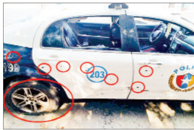
အလားတူ မွန်းလွဲ ၁ နာရီ ၁၅ မိနစ်တွင် အောင်မြေသာစံမြို့နယ် ဥပုပတော်ရပ်ကွက် (၇၆)လမ်း၊ ၄ လမ်းနှင့် ၅ လမ်းကြားရှိ ရဲစခန်းအား အမျိုးသားနှစ်ဦး(စိစစ်ဆဲ)က Click ဆိုင်ကယ်ဖြင့် ရောက်ရှိလာပြီး

အလားတူ မွန်းလွဲ ၁၂ နာရီ မိနစ် ၅၀ တွင် မြစ်မြို့ရဲစခန်းဝင်း အတွင်းရှိ မိသားစုနေအိမ် လိုင်းခန်းအား ဆိုင်ကယ်တစ်စီးဖြင့် ရောက်ရှိလာသည့် အမျိုးသားနှစ်ဦး(စိစစ်ဆဲ)က ဓာတ်ဆီပုလင်းအား မီးရှို့၍ အကြောင်းမဲ့ရန်ပြုပစ်ခတ်ခဲ့သဖြင့် ရဲစခန်းဝင်းအတွင်းသို့ ကျရောက်ပေါက်ကွဲခဲ့ရာ မြက်ခြောက်များ မီးလောင်ကျွမ်းခဲ့ပြီး မွန်းလွဲ ၁ နာရီတွင် မီးငြိမ်းသွားခဲ့ကာ လူနှင့် အဆောက်အအုံများ ထိခိုက်ပျက်စီးဆုံးရှုံးမှု မရှိကြောင်း။