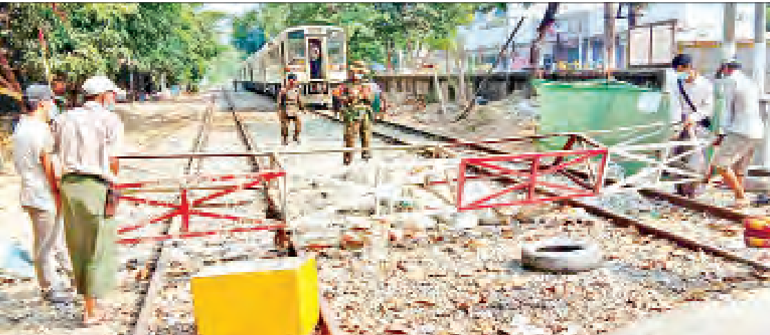
ရန်ကုန်မြို့ပတ်ရထားလမ်းပေါ်ရှိ ပိတ်ဆို့ထားသည့် အတားအဆီးများကို လုံခြုံရေးတပ်ဖွဲ့ဝင်များ၊ မြန်မာ့မီးရထားမှ တာဝန်ရှိသူများနှင့် ဒေသခံပြည်သူများက ဝိုင်းဝန်းဖယ်ရှားရှင်းလင်းစဉ်။

နေပြည်တော် မတ် ၂၄ မြန်မာ့မီးရထားတွင် ပြေးဆွဲလျက်ရှိသော ရန်ကုန်မြို့ရှိ မြို့ပတ် နှင့် ဆင်ခြေဖုံးရထားများ ပြေးဆွဲခြင်းလုပ်ငန်းကို အကြောင်း အမျိုးမျိုးကြောင့် ရပ်တန့်ထားခဲ့ရာမှ ယနေ့နံနက်ပိုင်းတွင် အင်းစိန် ဘူတာမှ လူစီးတဲ့ ငါးတွဲပါ RBE ရထားတွဲဆိုင်ကို လက်ဝဲရစ်