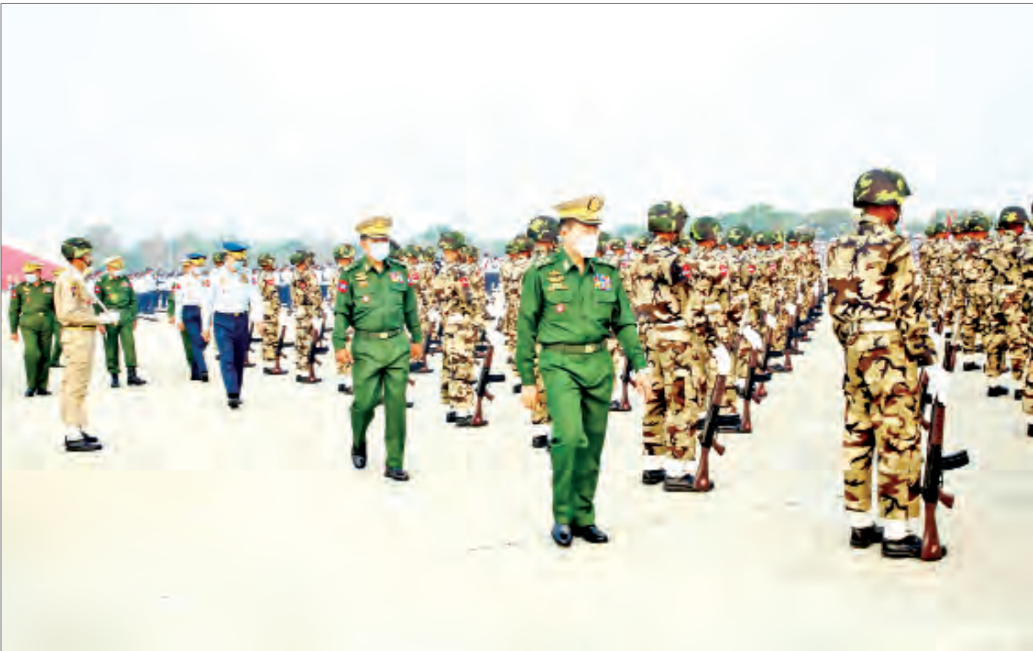
နိုင်ငံတော်စီမံအုပ်ချုပ်ရေးကောင်စီ ဒုတိယဥက္ကဋ္ဌ ဒုတိယတပ်မတော်ကာကွယ်ရေးဦးစီးချုပ် ကာကွယ်ရေးဦးစီးချုပ် (ကြည်း) ဒုတိယဗိုလ်ချုပ်မှူးကြီး စိုးဝင်း (၇၆)နှစ်မြောက် တပ်မတော်နေ့စစ်ရေးပြအခမ်းအနား၌ ပါဝင်ချီတက်စစ်ရေးပြကြမည့် စစ်ရေးပြစစ်ကြောင်းကြီးများ ဝတ်စုံပြည့်စစ်ရေးပြလေ့ကျင့်နေမှုကို ကြည့်ရှုစစ်ဆေးစဉ်။

နေပြည်တော် မတ် ၂၄ မတ်လ ၂၇ ရက်နေ့တွင် ကျရောက်သော (၇၆)နှစ်မြောက် တပ်မတော်နေ့ စစ်ရေးပြအခမ်းအနား၌ ပါဝင်ချီတက်စစ်ရေးပြကြမည့် စစ်ရေးပြစစ်ကြောင်းကြီးများသည် ယနေ့နံနက်ပိုင်းတွင် နေပြည်တော် စစ်ရေးပြကွင်း၌ ဝတ်စုံပြည့်စစ်ရေးပြလေ့ကျင့်မှုများကို ဆောင်ရွက်ကြသည်။