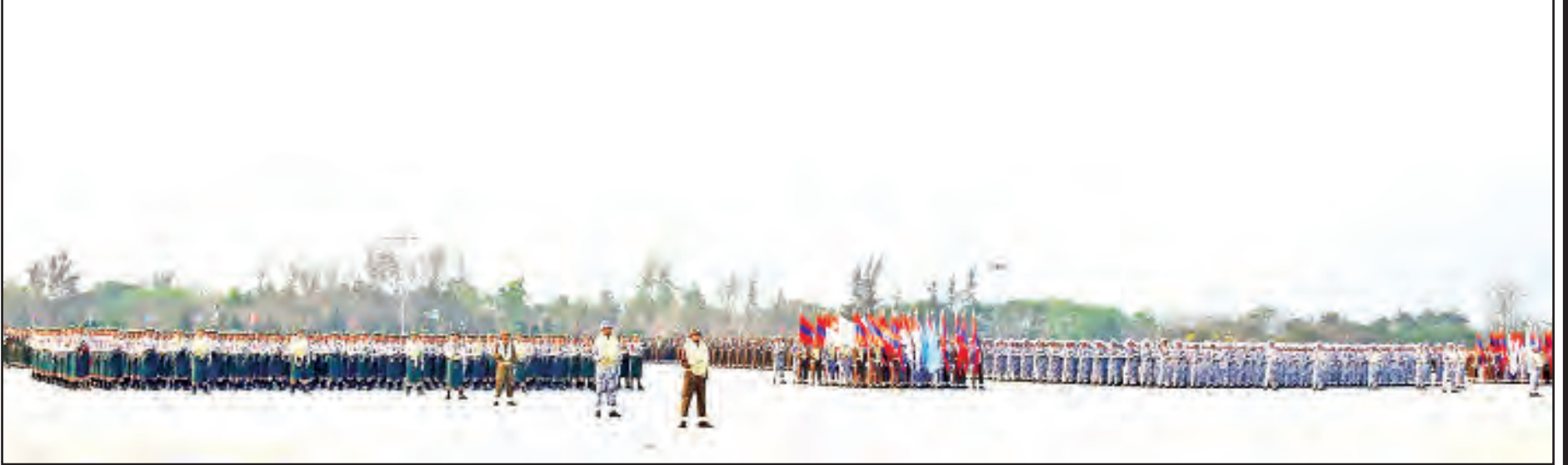
(၇၃)နှစ်မြောက် တပ်မတော်နေ့ စစ်ရေးပြအခမ်းအနားကျင်းပစဉ်။

(ယမန်နေ့မှအဆက်) ဗမာ့ကာကွယ်ရေးတပ်မတော် (ဘီဒီအေ) တနင်္သာရီတိုင်းကို သိမ်းပိုက်ပြီးသောအခါ မြန်မာနိုင်ငံကို လွတ်လပ်ရေးကြေညာပေးရန်ဟု မိနာမီအဖွဲ့၏ လုပ်ငန်းတာဝန်တွင် ပါရှိသည်။ မော်လမြိုင်ကို သိမ်းပိုက်ပြီးသောအခါ မြန်မာ့ လွတ်လပ်ရေးကိုကြေညာပြီး ယာယီအစိုးရဖွဲ့ပေး ရန် မိနာမီအဖွဲ့က အလိုရှိခဲ့သော်လည်း ဂျပန် အမှတ် - ၁၅ တပ်တော်က စစ်အုပ်ချုပ်ရေး ကြေညာခဲ့သည်။ ထိုအချိန်မှစတင်၍ မြန်မာနိုင်ငံကို လွတ်လပ်ရေး ချက်ချင်းပေးလိုသော မိနာမီအဖွဲ့နှင့် အမှတ်- ၁၅ တပ်တော်ကြားတွင် သဘောထား စတင်ကွဲလာသည်။