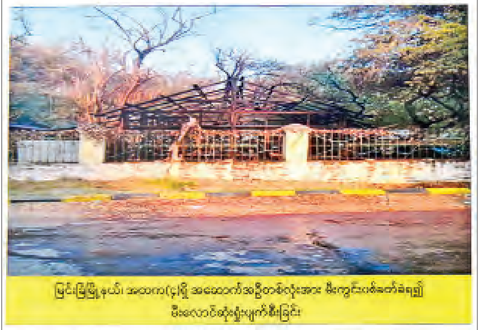
မြင်းခြံမြို့နယ်၊ အထက(၄)ရှိ အဆောက်အဦတစ်ခုလုံးအား မီးကျွတ်ခတ်ခံရ၍ မီးလောင်ဆုံးရှုံးပျက်စီးခြင်း

ရှင်းလင်း ယခုနောက်ပိုင်း အကြမ်းဖက်ရာတွင် အသုံးပြုသော လူကိုသေစေနိုင်ပြီး ပြင်းထန်စွာ ဒဏ်ရာရရှိစေနိုင်သည့် လက်နက်များ၊ အကြမ်းဖက်သုံးပစ္စည်းများကို နေရာအနှံ့မှ ရှာဖွေဖော်ထုတ် တွေ့ရှိနေရကြောင်း ပြောကြားပြီး အကြမ်းဖက်ဆန္ဒပြရာတွင် အသုံးပြုနေသည့် လက်နက်များကို Video Clip ၂ ခု ပြသ၍ ရှင်းလင်းသည်။ အဆိုပါ အကြမ်းဖက်မှုများကို နှိမ်နင်းရာတွင် သေဆုံးမှုများရှိပါကြောင်း၊ လုံခြုံရေးတပ်ဖွဲ့ဝင်များကို ပစ်ခတ်ခြင်း၊ ရဲစခန်းများကို ပိုင်းဝန်းအကြမ်းဖက် တိုက်ခိုက်ခြင်း၊ သက်သေခံပစ္စည်းများ ဖျောက်ဖျက်ရန်အတွက် လုပ်ဆောင်ခြင်းများကို ရည်ရွယ်ချက်ရှိရှိ လုပ်ဆောင်လျက်ရှိပါကြောင်း။ လုံခြုံရေးတပ်ဖွဲ့ဝင်များက အကြမ်းဖက်ဆူပူသူများကို ဖြိုခွင်းမှုကြောင့် သေဆုံးမှု ဒဏ်ရာရမှုများကို ပြောဆိုနေခြင်းများလည်း တွေ့ရကြောင်း၊ သေဆုံးသူ ၁၆၄ ဦးရှိပြီး အကြမ်းဖက် ဆူပူသူများ သေဆုံးခြင်းသည် မိမိနိုင်ငံသားများဖြစ်စေ မဟုတ်စေ ၂၁ သို့ ၃၁