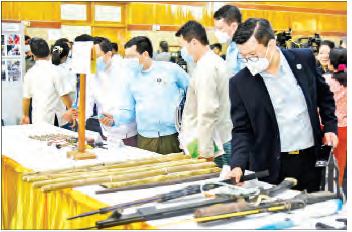
သတင်းစာရှင်းလင်းပွဲသို့ တက်ရောက်လာသူများက ဆူပူအကြမ်းဖက်မှုများတွင် အသုံးပြုသည့် လက်နက်ကိရိယာများကို ကြည့်ရှုလေ့လာကြစဉ်။

ကွန်ရက်မှ ဦးဇော်မြတ်လင်း သေဆုံးမှု သည် လုံခြုံရေးတပ်ဖွဲ့ဝင်များက ရှာဖွေ စဉ် အိမ်ပေါ်ကခုန်ချရာမှ ခြစ်ဦးပေါ် ကျပြီး သေဆုံးခဲ့ခြင်းဖြစ်ကြောင်း၊ အဆိုပါ ဖြစ်စဉ်တွင် လုံခြုံရေးတပ်ဖွဲ့ဝင်များက ညှဉ်းပန်းနှိပ်စက်၍ ပါးစပ်ထဲ ရေဇွေးပူ လောင်းထည့်ခြင်းဟု လုပ်ကြံဖန်တီးပြီး သတင်းပြုလုပ်ခဲ့ခြင်းကိုလည်း တွေ့ရ ကြောင်း၊ အချို့လူမှုကွန်ရက်စာမျက်နှာ တွင် လုပ်ကြံဖန်တီးပြီးတင်သည့် ဓာတ်ပုံ များကိုမီဒီယာများက ယူသုံးထားခြင်းများ တွေ့ရကြောင်း၊ မီဒီယာများအနေဖြင့် အကြမ်းဖက်ဆူပူဆန္ဒပြသူများ၏ မီးရှို့ ပျက်ဆီးမှုများ၊ ဒလန်ဟုစွပ်စွဲပြီး ကားတာယာကွင်းပတ် မီးရှို့သတ်သည့် ဖြစ်စဉ်များ၊ မျက်လုံးဖောက်သတ်သည့် ဖြစ်စဉ်များ၊ လှိုင်သာယာမြို့နယ်တွင် ရိုးသားစွာ အသက်မွေးဝမ်းကျောင်းပြု လုပ်ကိုင်နေသည့် ဆိုင်ပိုင်ရှင်အမျိုးသမီး တစ်ဦးကို ၂ ကြိမ်တိုင်တိုင် ညှဉ်းပန်း နှိပ်စက် သတ်ဖြတ်ခဲ့သည့် ဖြစ်စဉ်များကို သတင်းအမှောင်ချပြီး တစ်ဖက်သတ် ရေးသားနေခြင်းများ တွေ့ရကြောင်း၊ ဒီပဲယင်းမြို့နယ်တွင် အမှုတွဲသွားပေး သည့် ရဲတပ်ဖွဲ့ဝင် ၄ ဦးကို အကြမ်းဖက် ဆူပူဆန္ဒပြသူများက တားဆီးဖမ်းဆီး သတ်ဖြတ်သည့်ဖြစ်စဉ်ကို ရဲတပ်ဖွဲ့က စတင်ရန်ပြုသလို သတင်းကိုပြောင်းပြန် လုပ်ရေးသားခဲ့ခြင်းများ တွေ့ရကြောင်း၊