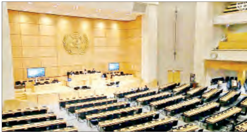
နိုင်ငံ၏ အချုပ်အခြာအာဏာကို တိုက်ရိုက်ခြိမ်းခြောက်ရာရောက်စေသည့် ဖော်ပြချက်များအပေါ် ထောက်ပြပြောကြားသည်။

နေပြည်တော် မတ် ၂၄ လူ့အခွင့်အရေးကောင်စီ၏ (၄၆)ကြိမ်မြောက် ပုံမှန်အစည်းအဝေးကာလအတွင်း ဥရောပသမဂ္ဂ (အီးယူ) မှ တင်သွင်းသည့် “မြန်မာနိုင်ငံလူ့အခွင့်အရေးအခြေအနေ” ဆိုင်ရာ ဆုံးဖြတ်ချက်အဆို (Resolution) အပေါ် ဆွေးနွေးခြင်းကို ယနေ့တွင် ဂျီနီဗာမြို့၌ ကျင်းပရာ နိုင်ငံခြားရေးဝန်ကြီးဌာန ဒုတိယဝန်ကြီး ဦးကျော်မျိုးထွဋ်က ကြိုတင်ရိုက်ကူးထားသော ဗီဒီယိုမှတ်တမ်းနှင့် မိန့်ခွန်းပြောကြားသည်။ အဆိုမှုကြမ်းတင်သွင်းစဉ် ဒုတိယဝန်ကြီးက အဆိုမှုကြမ်းပါ အကြောင်းအရာနှင့် အချက်အလက်လွှဲပြောင်းရေးဆိုင်ရာများ၊ မြန်မာနိုင်ငံဆိုင်ရာ အချက်အလက်ရှာဖွေရေးအဖွဲ့၏ သက်သေအထောက်အထားခိုင်လုံမှုမရှိသည့် အစီရင်ခံစာများအပေါ် ကိုးကားချက်များနှင့်တည့်ရှိပြီး ပြည်တွင်းတရားစီရင်ရေးယန္တရားများကို သွေဖည်စေပြီး မြန်မာ