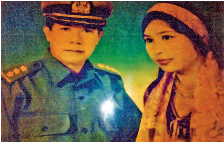
ဗိုလ်ချုပ်သန်းတင်နှင့် ဇနီးငယ်စဉ်က....

တပ်မတော်သားများနှင့်ပြည်သူများ အတူတကွ ပျော်ရွှင်ရယ်မောကြပုံများက နွေအပူရှိန်ကြားက အေးမြသည့် အိုအေစစ်ကလေးပမာဟု တွေးမိရင်း ဂုဏ်ယူစိတ်တို့ပေါ်ပေါက်လာမိပါတယ်။ လမ်းတွေဖောက်ခဲ့တာအပြင် ရေကာတာတွေ အဆင့်မြှင့်တင်၊ ချောင်းကော၊ မြောင်းကောတွေကို တပ်မတော်သားတွေရဲ့ လုပ်အားဒါနအကူအညီ တောင်းပေးနိုင်ခဲ့တာတွေ၊ စာသင်ကျောင်းမရှိတဲ့ ကျေးရွာတွေအတွက် စာသင်ကျောင်းဆောက်လုပ် ပေးခဲ့တာတွေမှာ တပ်နဲ့ပြည်သူပူးပေါင်းဆောင်ရွက် ခဲ့ကြတာတွေ၊ တပ်မတော်သားတွေနဲ့ပြည်သူ အတူတကွရေစက်ချလှူဒါန်းခွင့်ရခဲ့တဲ့ ဓမ္မာရုံတွေ၊ ကျောင်းဆောင်ကြီးတွေဟာ ဗိုလ်ချုပ်သန်းတင်ရဲ့ ကမကထပြုမှု၊ တပ်မတော်သားတွေရဲ့ ပူးပေါင်း ဆောင်ရွက်မှုတွေကြောင့် ရုပ်လုံးပေါ်ခဲ့တာတွေ မြင်တွေ့ရပါတယ်။