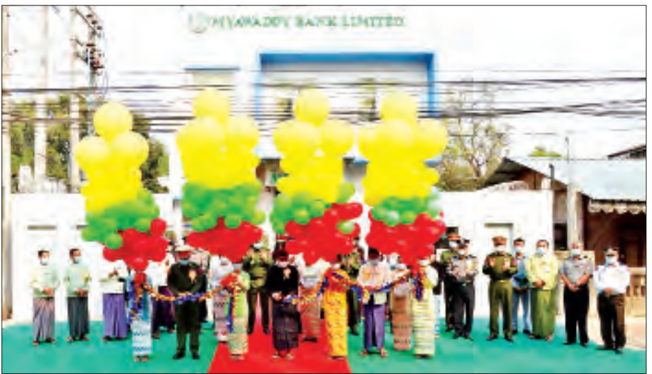
ဘဏ်နှင့် ပုဂ္ဂလိကဘဏ်များသို့ အပြန်အလှန် Internet Banking ဆိုင်ရာဘဏ်လုပ်ငန်းဝန်ဆောင်မှု ငွေလွှဲပေးပို့နိုင်ခြင်းများ အပါအဝင် Modern များကို ဆောင်ရွက်ပေးသွားမည်ဖြစ်ကြောင်း Banking အနေဖြင့်လည်း Mobile Banking နှင့် သတင်းရရှိသည်။ သတင်းစဉ်

ဖွင့်လှစ်ပေးသည်။ ထို့နောက်တာဝန်ရှိသူများနှင့်အတူ ဘဏ်ခွဲကမ္ဘာ့မော်ကွန်းအား အမွှေးနံ့သာရည်များ ပက်ဖျန်းပေးကြပြီး ဘဏ်အတွင်း လှည့်လည်ကြည့်ရှု ကြသည်။ အဆိုပါ မြဝတီဘဏ်(မြစ်ကြီးနား) ဘဏ်ခွဲကို ကချင်ပြည်နယ် မြစ်ကြီးနားမြို့၏ စီးပွားရေးဖွံ့ဖြိုး တိုးတက်မှုကို ဘဏ်ဝန်ဆောင်မှုလုပ်ငန်းများဖြင့် တစ်ဖက်တစ်လမ်းမှ ကူညီဖြည့်ဆည်းဆောင်ရွက်ပေး နိုင်ရန် ရည်ရွယ်၍ ဖွင့်လှစ်ခြင်းဖြစ်သည်။ စာရင်းရှင် အပ်ငွေများ၊ ငွေစုဘဏ်အပ်ငွေများ၊ စာရင်းသေ အပ်ငွေများ၊ ခေါ်ယူအပ်ငွေများ၊ တက္ကသိုလ်ပညာသင် ဆု ဝန်ဆောင်မှုအပ်ငွေများ၊ ATM ကတ်စာရင်းအပ်ငွေ များ လက်ခံခြင်းနှင့် စီးပွားရေးလုပ်ငန်းရှင်များ၏ လိုအပ်သော ရင်းနှီးငွေများအတွက် မရွှေ့မပြောင်း နိုင်သော မြေနှင့်အဆောက်အအုံများကို အာမခံအဖြစ် ရယူ၍ ချေးငွေများထုတ်ချေးခြင်း၊ မြဝတီဘဏ်ခွဲ အသီးသီးနှင့် ချိတ်ဆက်ထားသည့် မြန်မာ့စီးပွားရေး