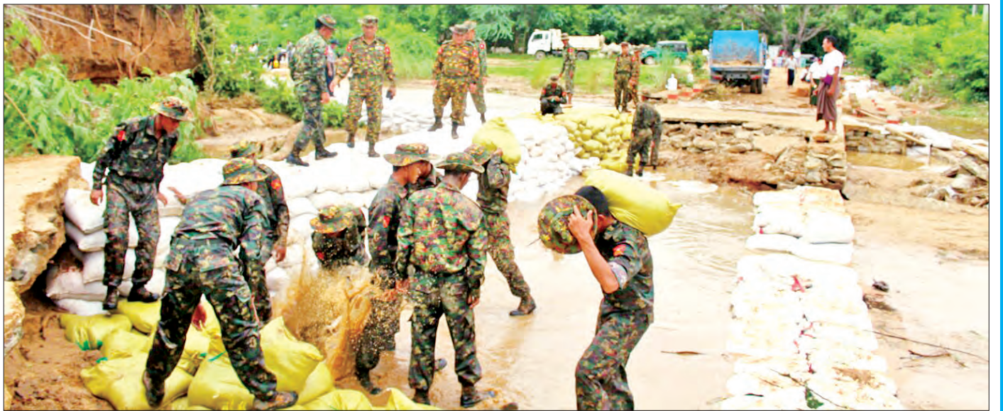
၂၀၁၉ ခုနှစ် မေလက စစ်ကိုင်းတိုင်းဒေသကြီး အရာတော်မြို့နယ်ရှိ မန်ကျည်းဇောက်ချောင်း ကွန်ကရစ်ရေကျော်တံတား ရေတိုက်စားပျက်စီးမှုအား နယ်မြေခံ တပ်မတော်သားများက သဲအိတ်များချထားခြင်း၊ ပိတ်ဆို့နေသောအမှိုက်များရှင်းလင်းခြင်းလုပ်ငန်းများ ဆောင်ရွက်စဉ်။