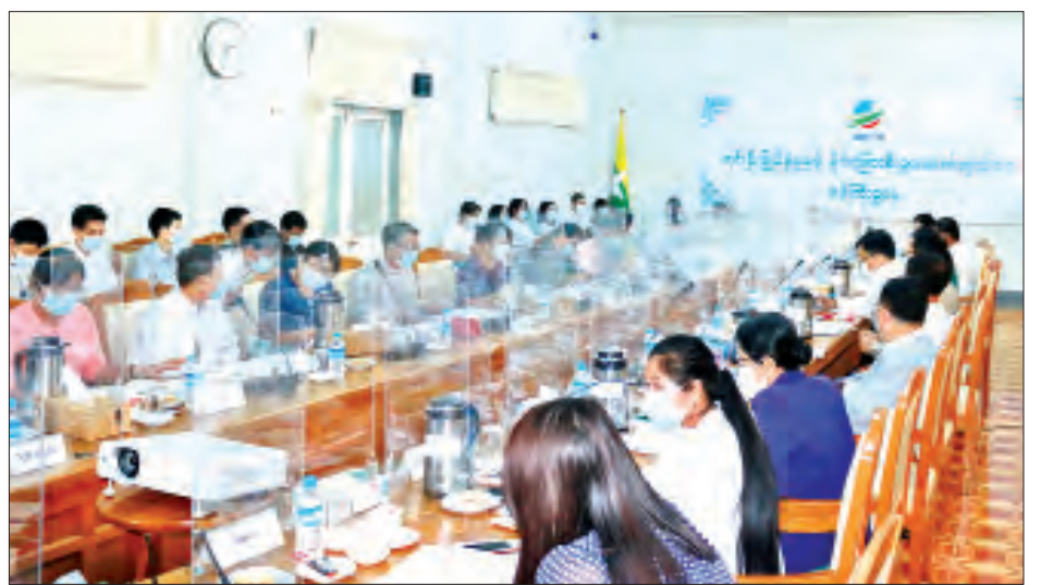
ပြည်သူ့အင်အားဝန်ကြီးဌာန၊ စီးပွားရေးနှင့် ကူးသန်းရောင်းဝယ်ရေးဝန်ကြီးဌာန၊ ပညာရေးဝန်ကြီးဌာန၊ ကျန်းမာရေးနှင့် အားကစားဝန်ကြီးဌာန၊ ဆောက်လုပ်

နိုင်ငံခြားစီးပွားဆက်သွယ်ရေးဝန်ကြီးဌာန အနေဖြင့် ပေါင်းစပ်ညှိနှိုင်းပေးမည့်ကိစ္စရပ်များကို စဉ်ဆက်မပြတ် ညှိနှိုင်းဆောင်ရွက်ပေးနေပါကြောင်း၊ စီမံကိန်းများနှင့်စပ်လျဉ်း၍ အကြောင်းအမျိုးမျိုးကြောင့် ကြန့်ကြာနေရသည့်ကိစ္စရပ်များကို သတ်မှတ်ပုံစံဖြင့် ဖြည့်စွက်၍ အမြန်ဆုံးပေးပို့ရန် လိုအပ်ပါကြောင်းနှင့် စီမံကိန်းအကောင်အထည်ဖော် ဆောင်ရွက်လျက်ရှိသည့် ဝန်ကြီးဌာန/ အဖွဲ့အစည်းများက ကြိုတင်ပြင်ဆင်ဆောင်ရွက်ထားရမည့် ကိစ္စရပ်များကို ဆွေးနွေးမှာကြားသည်။ အဆိုပါ အစည်းအဝေးသို့ စီမံကိန်း၊ ဘဏ္ဍာရေးနှင့် စက်မှုဝန်ကြီးဌာန၊ သာသနာရေးနှင့် ယဉ်ကျေးမှုဝန်ကြီးဌာန၊ စိုက်ပျိုးရေး၊ မွေးမြူရေးနှင့် ဆည်မြောင်းဝန်ကြီးဌာန၊ ပို့ဆောင်ရေးနှင့် ဆက်သွယ်ရေးဝန်ကြီးဌာန၊ သယ်ယူပို့ဆောင်ရေးနှင့် သဘာဝပတ်ဝန်းကျင်ထိန်းသိမ်းရေးဝန်ကြီးဌာန၊ လျှပ်စစ်နှင့် စွမ်းအင်ဝန်ကြီးဌာန၊ အလုပ်သမား၊ လူဝင်မှုကြီးကြပ်ရေးနှင့်