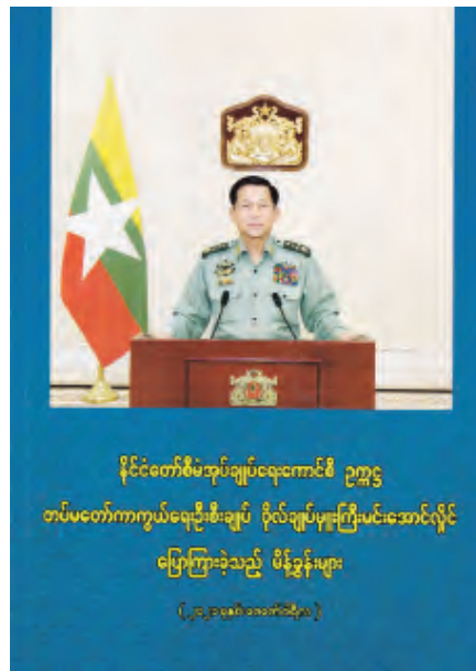
နိုင်ငံတော်စီမံအုပ်ချုပ်ရေးကောင်စီ ဥက္ကဋ္ဌ တပ်မတော်ကာကွယ်ရေးဦးစီးချုပ် ဗိုလ်ချုပ်မှူးကြီးမင်းအောင်လှိုင် ပြောကြားခဲ့သည့် မိန့်ခွန်းများ (၂၀၂၁ ခုနှစ်၊ မတ်လ ၂၄ ရက်)

အနေဖြင့် ကော်မတီ ၅ ခုဖွဲ့စည်းထားကြောင်း၊ လုံခြုံရေး၊ တည်ငြိမ်အေးချမ်းရေးနှင့် တရားဥပဒေ စိုးမိုးရေးကော်မတီမှာ လုံခြုံရေး၊ တည်ငြိမ်ရေး၊ တရား ဥပဒေစိုးမိုးရေးအတွက်ဆိုသော်လည်း စီမံခန့်ခွဲမှု အပိုင်းများ ပိုများသည်ကို တွေ့ရှိရကြောင်း၊ ဥပဒေ များ ပြဋ္ဌာန်းရာတွင် ခေတ်ကာလနှင့်လျော်ညီသည့် အသုံးအနှုန်းများ နိုင်ငံတော်၏ပတ်ဝန်းကျင်အခြေအနေ နှင့် ကိုက်ညီသည့်အခြေအနေများ၊ နိုင်ငံတကာ ဆက်ဆံရေးမူဝါဒအပေါ်ရပ်တည်မှု ရှိ/မရှိ သေချာ စိစစ်ပြီး ဆောင်ရွက်ရမည်ဖြစ်ကြောင်း၊ ဥပဒေသည် ရှင်းလင်းလွယ်ကူပြီး ပြည်သူများနားလည်ရန် လိုအပ်ပါကြောင်း၊ ဥပဒေ၊ နည်းဥပဒေနှင့် အမိန့် ကြေညာချက်များထုတ်ပြန်ရာတွင် ပြည်ထောင်စု ဝန်ကြီးဌာနအချင်းချင်း တိုင်ပင်ဆွေးနွေးပြီး ပြည်ထောင်စုရှေ့နေချုပ်ရုံးသို့ တင်ပြဆွေးနွေးရန် လိုကြောင်း၊ မြို့ရွာများ တိုးချဲ့ပြင်ဆင်ဆောင်ရွက် ရာတွင် ဒေသပြည်သူများ၏ သဘောထားအမှန်ကို အနီးစပ်ဆုံးသိရှိရန် ဆောင်ရွက်ပြီး လုပ်ထုံးလုပ်နည်း နှင့်အညီ ဆောင်ရွက်ရမည်ဖြစ်ကြောင်း” စသည့် အကြောင်းအရာများအပါအဝင် နိုင်ငံတော်စီမံ အုပ်ချုပ်ရေးကောင်စီဥက္ကဋ္ဌ တပ်မတော်ကာကွယ်ရေး ဦးစီးချုပ်၏ ပြောကြားခဲ့သည့် အမှာစကား၊ မိန့်ခွန်း များကို စုစည်းထုတ်နုတ်ထားသည်။