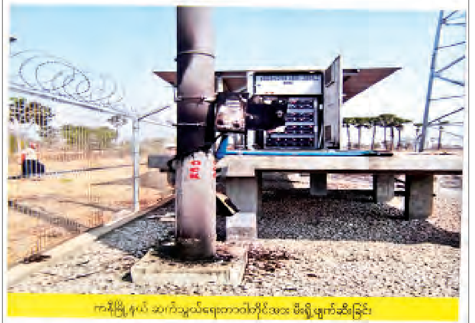
ကချင်ပြည်နယ်၊ ဆင်ကြဲသွယ်ရေးတာဝါတိုင်အား မီးရှို့ဖျက်ဆီးခြင်း