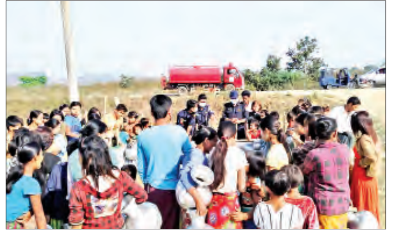
ရေဂါလန် ၃၂၀၀ အား မီးသတ် သောက်သုံးရေဂါလန် ၃၂၀၀ ခန့်အား ရေသယ်ယာဉ်တစ်စီးဖြင့် လည်းကောင်း၊ မီးသတ်ရေသယ်ယာဉ်တစ်စီးဖြင့် လည်း ကောင်း သောက်သုံးရေများ ပေးဝေ ပုဏ္ဏားကျွန်းမြို့နယ် မီးသတ်စခန်းမှ ကောင်း သောက်သုံးရေများ ပေးဝေ ရေဖြူကန် (တိုက်ပွဲရှောင်စခန်း)သို့ လှူဒါန်းခဲ့ကြောင်း သိရသည်။

နေပြည်တော် မတ် ၂၄ ရခိုင်ပြည်နယ် စစ်တွေနှင့် ပုဏ္ဏားကျွန်း မြို့နယ်များရှိ သောက်သုံးရေလိုအပ်လျက် ရှိသော ကျေးရွာများ၊ စစ်ဘေးရှောင်စခန်း များအတွက် သက်ဆိုင်ရာမြို့နယ်မီးသတ် စခန်းများမှ မီးသတ်ယာဉ်များဖြင့် သောက်သုံးရေများကို နေ့စဉ်ဖြန့်ဝေ လှူဒါန်းလျက်ရှိသည်။