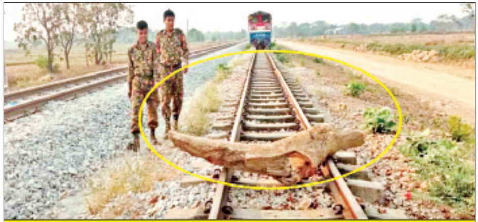
မသမာသူအကြမ်းဖက်လူအုပ်စုများက မီးရထားတိုင်းမှောက်စေရန် နည်းအမျိုးမျိုးဖြင့် တားဆီးပိတ်ပင်ခြင်း

နိုင်ငံတော်စီမံအုပ်ချုပ်ရေးကောင်စီ ဥက္ကဋ္ဌ၊ တပ်မတော်ကာကွယ်ရေးဦးစီးချုပ် ဗိုလ်ချုပ်မှူးကြီး မင်းအောင်လှိုင်အနေဖြင့် ပြီးခဲ့သည့် ရက်သတ္တပတ်ကာလအတွင်း တနင်္သာရီတိုင်းဒေသကြီး မြိတ်မြို့၊ ကျွန်းစုမြို့နှင့် ရန်ကုန်တိုင်းဒေသကြီး ကိုကိုးကျွန်းမြို့တို့သို့ သွားရောက်၍ နယ်မြေခံတပ်များမှ အရာရှိ၊ စစ်သည်၊ မိသားစုများနှင့် ရင်းရင်းနှီးနှီး တွေ့ဆုံကာ တပ်မတော်၏ နိုင်ငံတော်တာဝန်များကို ဥပဒေနှင့်အညီ ထမ်းဆောင်နေမှုအခြေအနေများ၊ “ဒီမိုကရေစီဆိုသည်မှာ အများ၏ ဆန္ဒနှင့်ဆောင်ရွက်ခြင်းဖြစ်ပြီး အများ၏ဆန္ဒနှင့် ဆောင်ရွက်သည် ဆိုသော်လည်း အများ၏ဆန္ဒသည် စစ်မှန်ပြီး ရိုးသားသည့် နိုင်ငံရေး ဖြစ်ရန်လိုသည့်အခြေအနေများ၊ အများ၏ဆန္ဒသည် ရိုးသားမှုမရှိပါက ယင်းနိုင်ငံရေးသည် ဒီမိုကရေစီဟု ပြောနိုင်ရန် ခဲယဉ်းသည်”ဟု ပြောကြားခဲ့သည့် အခြေအနေများ၊ စာမျက်နှာ ၉ သို့ ❁