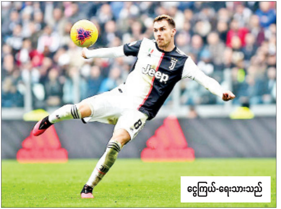
ငွေကြယ်-ရေးသားသည်

ချိတ်ဆက်မှုတွေ ပြုလုပ်ခဲ့တယ်လို့ သိရပါတယ်။ ဒါပေမယ့် အာဆင်နယ်အသင်း ဆီက အာရွန်ရမ်ဆေးနဲ့ ပတ်သက် ပြီး တစ်စုံတစ်ရာပြောကြားခြင်း မရှိခဲ့တာကြောင့် လီဗာပူးအသင်း နဲ့ ဝက်စ်ဟမ်းအသင်းတို့က ခေါ်ယူဖို့ အပြိုင်ကြိုးပမ်းနေတယ် လို့ သိရပါတယ်။ လီဗာပူးအသင်း ကတော့ ကွင်းလယ်ကစားသမား ဝစ်ဂျီနယ်ဒန် ဘာစီလိုနာအသင်း ဆီ ပြောင်းရွှေ့ကစားမှာဖြစ်တဲ့ အတွက် အာရွန်ရမ်ဆေးကို အစား ထိုးခေါ်ယူဖို့ ပြင်ဆင်နေတာဖြစ်ပါ တယ်။