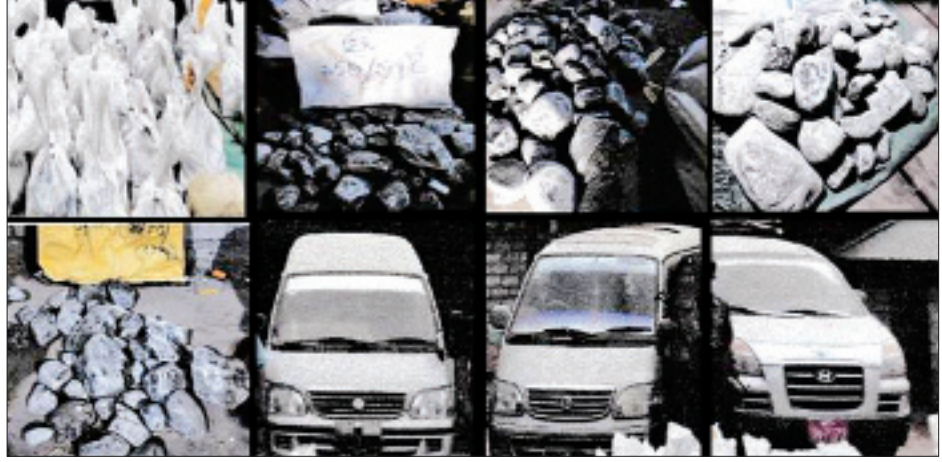
အထောက်အထားမဲ့ ကျောက်စိမ်းဟုယူဆရသည့် ကျောက်တုံးများဆိုင်ခုံနှင့် ပစ္စည်းတင်ဆောင်လာသော ယာဉ်သုံးစီးအား တွေ့ရစဉ်။