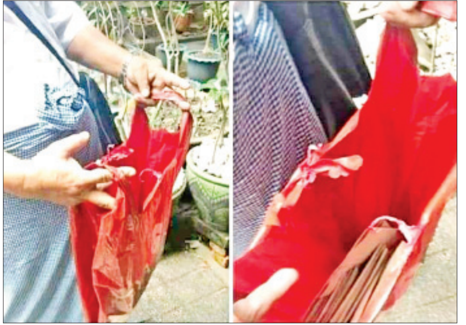
ဥပဒေနှင့်အညီ ဆောင်ရွက်ခြင်းမရှိသည့် ကြိုတင်ဆန္ဒမဲများ ကောက်ယူနေသည်ကို တွေ့ရစဉ်။

၆။ ရေတာရှည်မြို့နယ်၊ ရပ်ကွက် ၁၇ ရပ်ကွက်၊ ကျေးရွာအုပ်စု ၄၈ အုပ်စုရှိ မဲရုံ ၁၆၉ ရုံတို့တွင် မဲလက်မှတ် အရေအတွက် ၅၅၅၆ ပျောက်ဆုံးနေပြီး ၄၀၀ ပိုနေသည်ကို စိစစ်တွေ့ရှိရပါသည်။ မြို့နယ်ရွေးကောက်ပွဲ ကော်မရှင်အဖွဲ့ခွဲတွင် ကျန်ရှိရမည့် လက်ကျန်အရေအတွက် ၈၂၈၈ ဖြစ်သော်လည်း မြေပြင်တွင် ၁၀၀၅၀ ကျန်ရှိသဖြင့် မဲလက်မှတ် ၁၇၆၂ ပိုနေသည်ကို စိစစ်တွေ့ရှိရပါသည်။