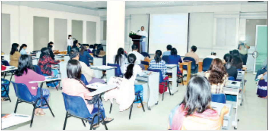
ဆရာ ဆရာမများက တစ်ပတ်လျှင်နှစ်ရက် ၂၀၂၁ ခုနှစ် မေ ၁၂ ရက်အထိ ပို့ချမည်ဖြစ်ပြီး မြန်မာ့အသံနှင့် ရုပ်မြင်သံကြားမှ ဝန်ထမ်း ၃၀ တက်ရောက်လျက်ရှိကြောင်း သိရသည်။ သတင်းစဉ်

ယခုသင်တန်းကို ပြန်ကြားရေးဝန်ကြီးဌာန၏ ညှိနှိုင်းပေးမှုဖြင့် ပညာရေးဝန်ကြီးဌာန နည်းပညာ၊ သက်မွေးပညာနှင့်လေ့ကျင့်ရေးဦးစီးဌာန၏ စီစဉ်မှုဖြင့် Basic English for Ministry Staff အစီအစဉ်၏ Elementary-1 Course အဖြစ် အင်္ဂလိပ်ဘာသာစကားကျမ်းကျင်မှုသင်တန်းကျောင်း (နေပြည်တော်) မှ