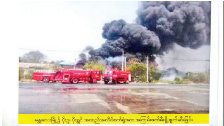
မန္တလေးမြို့၌ ပိုးညှို့၊ ပိုးရွှင် အထည်အလိပ်စက်ရုံအား အကြမ်းဖက်မီးရှို့ဖျက်ဆီးခြင်း