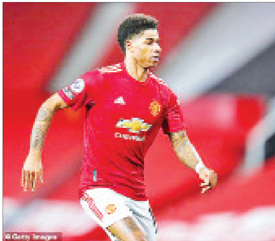
မန်ယူအသင်းတိုက်စစ်မှူး ရက်ရှ်ဖို့ဒ်

လီဗာပူးအသင်း ညာနောက်ခံကစားသမား အလက်ဇန်းဒါး အာနီး၊ စပါးတိုက်စစ်မှူး ဟယ်ရီကီနီး၊ ချယ်လ်ဆီး တိုက်စစ်မှူး တီမိုဝါနာ၊ ဘိုင်ယန် မြူးနစ် ဘယ်နောက်ခံ ကစားသမား အယ်လ်ဖရက်ဆိုဒေးဗီးလ်၊ ဘာစီလိုနာကစားသမား ဖရန်ကို ဒီဂျော့င်၊ ဂျူဗင်တပ်အသင်း နောက်ခံလူ ဒီလစ်နဲ့ အင်တာ မီလန်အသင်း တိုက်စစ်မှူး မာတီနက်ဇီတို့ကတော့ ပေါင် ၇၇ သန်းနဲ့ ပေါင် ၁၀၃ သန်းကြား တန်ဖိုးရှိတယ်လို့ ဖော်ပြထားတာ ဖြစ်ပါတယ်။