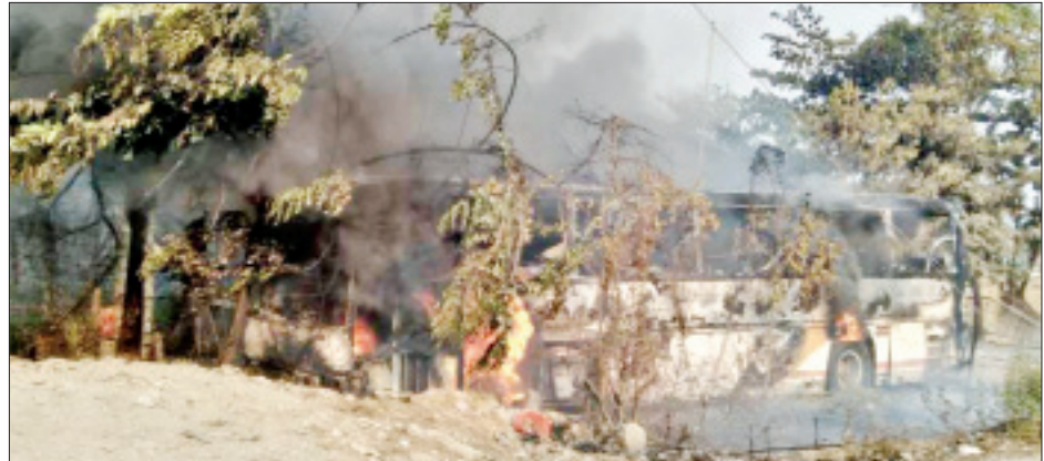
ချမ်းအေးသာစံမြို့နယ်၊ ချမ်းမြသာစည်မြို့နယ်နှင့် လှိုင်သာယာမြို့နယ်ရဲစခန်းများအား အကြမ်းဖက်မီးရှို့ဖျက်ဆီးခြင်း