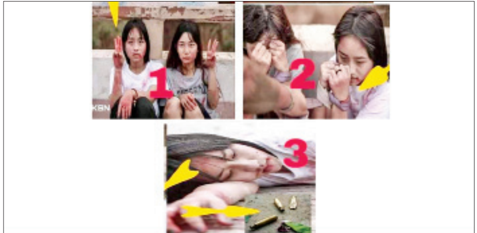
မဟုတ်မမှန်လုပ်ကြံဖန်တီးပြီး ဓာတ်ပုံရိုက်ကူး၍ လူမှုကွန်ရက်တွင် ဖြန့်ဝေလျက်ရှိ