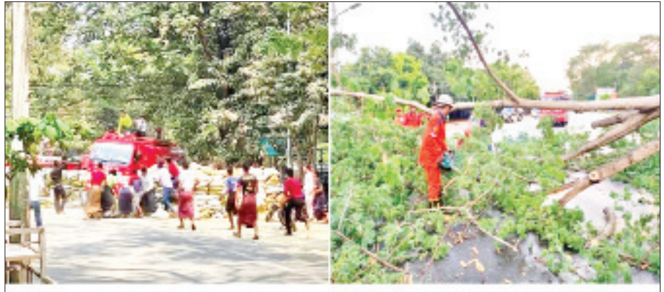
မီးသတ်ကားများအား ဆန္ဒပြအကြမ်းဖက်သူများမှ ပိတ်ဆို့တားဆီးထားခြင်း