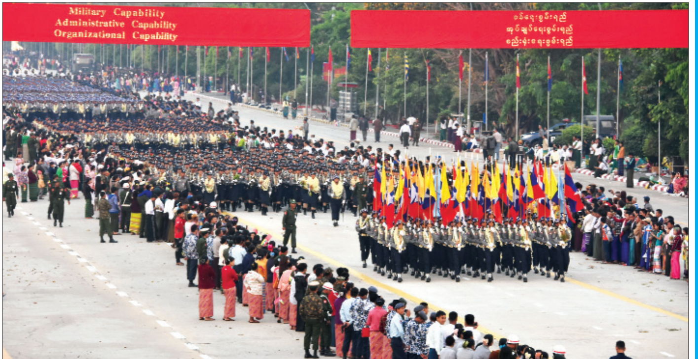
(၇၃)နှစ်မြောက် တပ်မတော်နေ့ စစ်ရေးပြအခမ်းအနားကျင်းပစဉ်။

စစ်မထွက်မီ ပြင်ဆင်မှုအနေဖြင့် စစ်ကြောင်း များ သတ်မှတ်ခဲ့သည်။ မော်လမြိုင်စစ်ကြောင်း၊ ထားဝယ်စစ်ကြောင်း၊ ရေကြောင်းချီတပ်ဖွဲ့ (မြိတ်စစ်ကြောင်း)တို့ ဖြစ်သည်။ အတွင်းသူပုန် တပ်ဖွဲ့ဟူ၍လည်း ဖွဲ့စည်းခဲ့သည်။ စစ်ကြောင်း အလိုက် ရဲဘော်သုံးကျိပ်ဝင်များကို တာဝန်ခွဲဝေ ပေးခဲ့သည်။ ဗမာ့လွတ်လပ်ရေးတပ်မတော်စစ်ဌာန ချုပ်နှင့် မော်လမြိုင်စစ်ကြောင်းတွင် ဗိုလ်တေဇ၊ ဗိုလ်ရန်အောင်၊ သခင်ထွန်းအုပ်၊ ဗိုလ်ရဲထွဋ်၊ ဗိုလ်စောအောင်၊ ဗိုလ်မိုး၊ ဗိုလ်ဇေယျတို့ ပါဝင်သည်။ လက်နက်ခဲယမ်းမီးကျောက်နှင့်