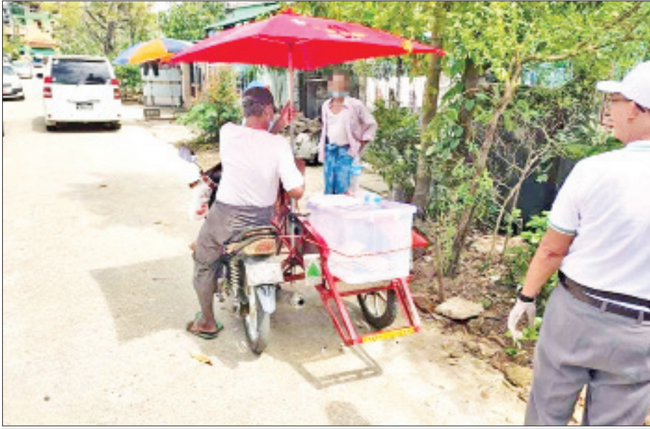
ဥပဒေနှင့်အညီ ဆောင်ရွက်ခြင်းမရှိသည့် ကြိုတင်ဆန္ဒမဲများ ကောက်ယူနေသည်ကို တွေ့ရစဉ်။