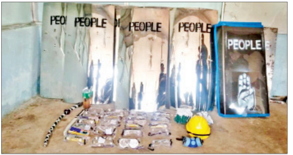
မင်္ဂလာဒုံမြို့နယ်၌ ဆူပူမှုတွင် အသုံးပြုမည့်ဆက်စပ်ပစ္စည်းများကို တွေ့ရစဉ်။

ထို့အတူ မတ် ၂၁ ရက် မွန်းလွဲ ၂ နာရီခန့်တွင် မန္တလေးတိုင်းဒေသကြီး ကျောက်ဆည်မြို့ ပန်ကျေး