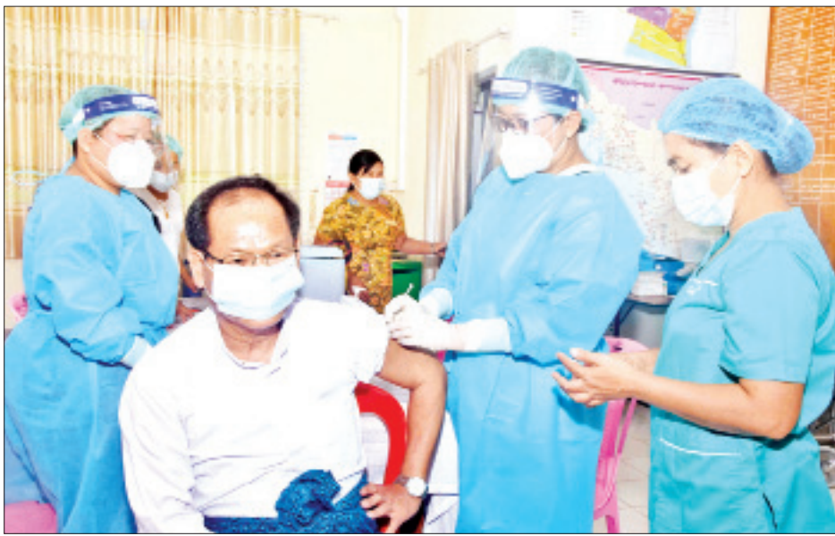
အောင်ကျော်မင်းနှင့် အဖွဲ့ဝင်များသည် စစ်တွေမြို့ ခုတင် ၅၀၀ ဆံ့ပြည်သူ့ဆေးရုံကြီး လေးထပ်ဆောင်၌ ဆေးရုံတက်ရောက် ဆေးကုသမှုခံယူနေသော စစ်တွေမြို့ ဘောင်းဒွတ်သားစုရပ်ကွက် မဟာအောင်မြေဘုံကျော် ကျောင်းတိုက်ဆရာတော် သာသနဓဇဓမ္မာစရိယ ဘဒ္ဒန္တဣန္ဒာဝံသအား ဖူးမြော်ကာ လှူဖွယ်ဝတ္ထုများ ဆက်ကပ်လှူဒါန်းခဲ့ကြောင်း သိရသည်။ တင်ထွန်း(ပြန်/ဆက်)

ကိုဗစ်-၁၉ ရောဂါကာကွယ်ဆေးကို ပြည်နယ်စီမံအုပ်ချုပ်ရေးကောင်စီဥက္ကဋ္ဌ ဒေါက်တာအောင်ကျော်မင်း၊ ပြည်နယ်စီမံအုပ်ချုပ်ရေးကောင်စီအဖွဲ့ဝင်များ၊ အတွင်းရေးမှူးနှင့် ပြည်နယ်စီမံအုပ်ချုပ်ရေးကောင်စီရုံးမှ ညွှန်ကြားရေးမှူးများ၊ ပြည်နယ်အဆင့်ဌာနဆိုင်ရာများအား စစ်တွေမြို့ ခုတင် ၅၀၀ ဆံ့ပြည်သူ့ဆေးရုံကြီးမှ ဆရာဝန်များက ကာကွယ်ဆေးထိုးနှံပေးကြသည်။ ပြည်နယ်စီမံအုပ်ချုပ်ရေး ကောင်စီဥက္ကဋ္ဌနှင့် အဖွဲ့ဝင်များ၊ ပြည်နယ်အဆင့်ဌာနဆိုင်ရာများသည် ပထမအကြိမ် ကိုဗစ်-၁၉ ရောဂါကာကွယ်ဆေးကို ဖေဖော်ဝါရီ ၂၃ ရက်က စတင်ထိုးနှံခဲ့ပြီး ယနေ့တွင် ဒုတိယအကြိမ် ထိုးနှံကြခြင်းဖြစ်သည်။ ထို့နောက် ပြည်နယ်စီမံအုပ်ချုပ်ရေးကောင်စီဥက္ကဋ္ဌ ဒေါက်တာ