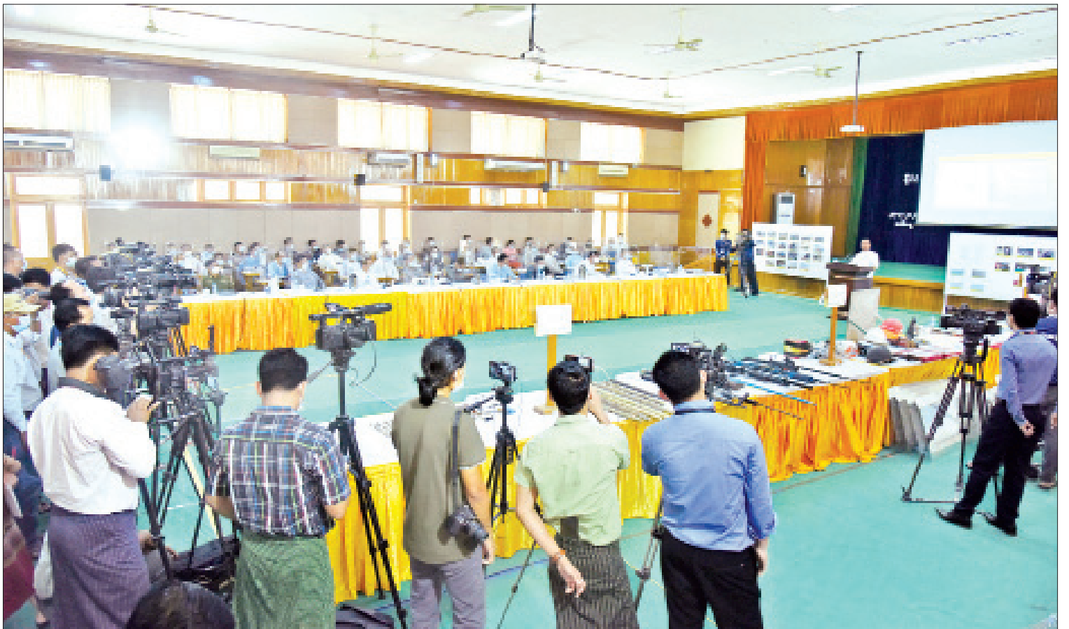
နိုင်ငံတော်စီမံအုပ်ချုပ်ရေးကောင်စီ၊ သတင်းထုတ်ပြန်ရေးအဖွဲ့က သတင်းမီဒီယာများနှင့်တွေ့ဆုံ၍ ၃/၂၀၂၁ ကြိမ်မြောက် သတင်းစာရှင်းလင်းပွဲပြုလုပ်စဉ်။

နေပြည်တော် မတ် ၂၃ နိုင်ငံတော်စီမံအုပ်ချုပ်ရေးကောင်စီ၊ သတင်းထုတ်ပြန်ရေးအဖွဲ့၏ ၃/၂၀၂၁ ကြိမ်မြောက် သတင်းစာရှင်းလင်းပွဲကို ယနေ့မွန်လွဲပိုင်းတွင် ပြန်ကြားရေး ဝန်ကြီးဌာန၌ ကျင်းပပြုလုပ်ပြီး နိုင်ငံ တော်စီမံအုပ်ချုပ်ရေးကောင်စီ၊ သတင်း ထုတ်ပြန်ရေးအဖွဲ့ ခေါင်းဆောင် ဗိုလ်မှူးချုပ်ဇော်မင်းထွန်း၊ ပြည်ထောင်စု ရွေးကောက်ပွဲကော်မရှင် အဖွဲ့ဝင် ဦးခင်မောင်ဦးနှင့် ဌာနဆိုင်ရာသတင်း ထုတ်ပြန်ရေးအဖွဲ့ ကိုယ်စားလှယ်များက သတင်းမီဒီယာများ၏ သိရှိလိုသည့် မေးမြန်းမှုများကို ပြန်လည်ဖြေကြား သည်။