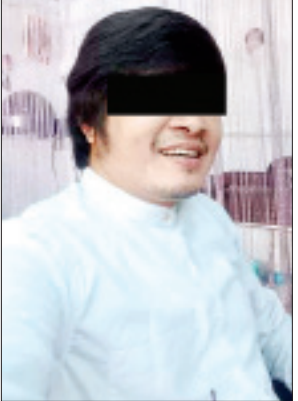
(ဝဲမှယာ)ပြစ်မှုကျူးလွန်သူ မင်းခန့်၊ ကတုံး(ခ)သူရ။