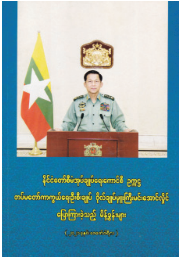
နိုင်ငံတော်စီမံအုပ်ချုပ်ရေးကောင်စီ ဥက္ကဋ္ဌ တပ်မတော်ကာကွယ်ရေးဦးစီးချုပ် ဗိုလ်ချုပ်မှူးကြီးမင်းအောင်လှိုင် ပြောကြားခဲ့သည့် မိန့်ခွန်းများ (၂၀၂၁ခုနှစ်၊ မတ်လ ၁၅ ရက်နေ့)

နေပြည်တော် မတ် ၂၃ နိုင်ငံတော်စီမံအုပ်ချုပ်ရေးကောင်စီဥက္ကဋ္ဌ တပ်မတော်ကာကွယ်ရေးဦးစီးချုပ်၏ မိန့်ခွန်းစာအုပ်ကို ပြန်ကြားရေးနှင့် ပြည်သူ့ဆက်ဆံရေးဦးစီးဌာနက စီစဉ်ထုတ်ဝေဖြန့်ချိခဲ့သည်။ အဆိုပါမိန့်ခွန်းစာအုပ်တွင် ၂၀၂၁ ခုနှစ် ဖေဖော်ဝါရီလအတွင်း နိုင်ငံတော်စီမံအုပ်ချုပ်ရေးကောင်စီဥက္ကဋ္ဌ တပ်မတော်ကာကွယ်ရေးဦးစီးချုပ် ဗိုလ်ချုပ်မှူးကြီးမင်းအောင်လှိုင် ပြောကြားခဲ့သည့် မိန့်ခွန်းနှင့်အမှာစကားများ၊ အထိမ်းအမှတ်အခမ်းအနားများသို့ ပေးပို့သည့် သဝဏ်လွှာများ စုစုပေါင်း (၂၁)ပုဒ်ကို စုစည်းဖော်ပြပေးထားသည်။ ဖေဖော်ဝါရီလ ၈ ရက်နေ့တွင် ကျင်းပခဲ့သည့် စီမံခန့်ခွဲရေးအစည်းအဝေးတွင် “လက်ရှိဖြစ်ပေါ်နေသည့်အခြေအနေအထား ရွေးကောက်ပွဲအဆင်မပြေမှုကြောင့် ဖြစ်ပေါ်လာခြင်းဖြစ်ပါကြောင်း၊ အဆင်မပြေမှုသည် အကြောင်းအရင်းများမှာ မဲစာရင်းမှားယွင်းခြင်း၊ ရွေးကောက်ပွဲမတိုင်မီကာလ၊ ရွေးကောက်ပွဲအတွင်းကာလနှင့် ရွေးကောက်ပွဲအလွန်ကာလတို့တွင် အားနည်းချက်များစွာရှိခဲ့သည်ကို တွေ့ရှိရကြောင်း၊ ယင်းအချက်များကြောင့် လက်ရှိအခြေအနေအထိ ဖြစ်ပေါ်လာခြင်းဖြစ်ကြောင်း၊ သို့ဖြစ်၍ မိမိတို့သည် ပြည်သူများလက်ခံယုံကြည်မှုရှိလာအောင် ဆောင်ရွက်ရမည်ဖြစ်ကြောင်း၊ မိမိတို့သည် ကြားကာလတာဝန်ယူသည့်အဖွဲ့ဖြစ်ကြောင်း၊ ယင်းကာလတွင် ယိုင်နေသည့်စီးပွားရေးကို ပြန်လည်တည်မတ်ရန်အတွက် လတ်တလောဖြေရှင်းဆောင်ရွက်ပေးရမည့်ကိစ္စများကို ချက်ချင်းဆောင်ရွက်ပေးမည်ဖြစ်ကြောင်း၊ ရေရှည်ဆောင်ရွက်ရမည့်ကိစ္စများကို လမ်းကြောင်းမှန်ပေါ်ရောက်အောင် ဆောင်ရွက်ပေးသွားမည်”ဖြစ်ပါကြောင်း ပြောကြားသည့် အမှာစကား၊ ဖေဖော်ဝါရီလ ၁၂ ရက်နေ့တွင် နိုင်ငံတော်၏အခြေအနေအရပ်ရပ်အား