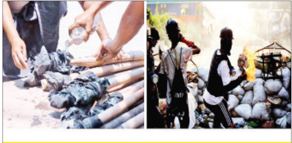
အကြမ်းဖက်ဆူပူဆန္ဒပြသူများမှ မီးရှို့ရန် ပြုလုပ်နေခြင်း