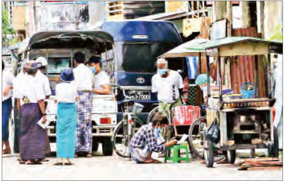
ဥပဒေနှင့်အညီ ဆောင်ရွက်ခြင်းမရှိသည့် ကြိုတင်ဆန္ဒမဲများ ကောက်ယူနေသည်ကို တွေ့ရစဉ်။