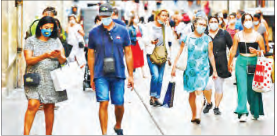
ရောဂါကူးစက်ခံရသူ ၃၀၆၅၅၄၅၇ ဦးနှင့် သေဆုံးသူ ၅၆၃၇၅၅ ဦးတို့ ဖြစ်သည်။ အာရှတိုက်တွင် ရောဂါကူးစက်သူဦးရေ ၁၆၉၀၈၈၅ ဦးနှင့် သေဆုံးသူ ၂၆၅၃၆၈ ဦး၊ အရှေ့

ဥရောပတိုက်တစ်တိုက်လုံး၌ ရောဂါကူးစက် ဖြစ်ပွားသူ ၄၁၀၁၆၃၁ ဦးရှိပြီး သေဆုံးသူ ၉၁၄၆၅၅ ဦး၊ လက်တင်အမေရိကနှင့် ကာရစ်ဘီယံဒေသရှိ ရောဂါဖြစ်ပွားသူ ၂၃၉၃၇၇၅ ဦးနှင့် သေဆုံးသူ ၇၃၇၈၆၁ ဦးနှင့် အမေရိကန်နှင့် ကနေဒါနိုင်ငံတို့တွင်