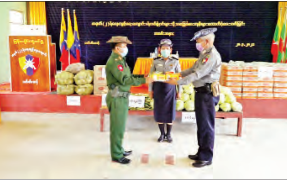
ထိုသို့ ပေးအပ်လျက်ရှိရာ ယနေ့တွင် ဧရာဝတီ တိုင်းဒေသကြီးအတွင်းရှိ မြန်မာနိုင်ငံ ရဲတပ်ဖွဲ့ဝင် များနှင့် မိသားစုဝင်များအတွက် အနောက်တောင် တိုင်းစစ်ဌာနချုပ် တိုင်းမှူး ဗိုလ်ချုပ်အောင်အောင် သတင်းစဉ်

နေပြည်တော် မတ် ၂၁ နိုင်ငံတော်နှင့် တပ်မတော်အတွက် အသက်ပေးလှူ ခဲ့ရသည့် အရာရှိ စစ်သည်များ၏ မိသားစုဝင်များ၊ စစ်မှုထမ်းဟောင်းအဖွဲ့ဝင်များနှင့် မိသားစုဝင်များ၊ ရဲမှုထမ်းဟောင်းအဖွဲ့ဝင်များ၊ ပြည်သူ့စစ်(ဌာန) တပ်ဖွဲ့ဝင်များနှင့် မီးသတ်တပ်ဖွဲ့ဝင်များ စားရေး အခက်အခဲမရှိစေရန် ဆန်၊ ဆီ၊ ဆား၊ ပဲ အမည် လေးမျိုးနှင့် ကိုစစ်-၁၉ ရောဂါကာကွယ်ရေး အထောက် အကူပြုပစ္စည်းများကို လည်းကောင်း၊ နိုင်ငံတော် ကာကွယ်ရေးနှင့် လုံခြုံရေးတာဝန်ထမ်းဆောင်လျက် ရှိသော တပ်မတော်သားများနှင့် မြန်မာနိုင်ငံ ရဲတပ်ဖွဲ့ဝင်များအတွက် ဆေးဝါးများ၊ စားသောက် ဖွယ်ရာများနှင့် ချီးမြှင့်ငွေများကိုလည်းကောင်း သက်ဆိုင်ရာ တိုင်းစစ်ဌာနချုပ်များ၊ စစ်မှုထမ်း ဟောင်းရုံး၊ အိမ်ရာများ၊ တပ်နယ်ခန်းမများ၊ ရဲတပ်ဖွဲ့မှူးရုံးများနှင့် သက်ဆိုင်ရာ ရဲစခန်းများ၌ ပေးအပ်လျက်ရှိသည်။