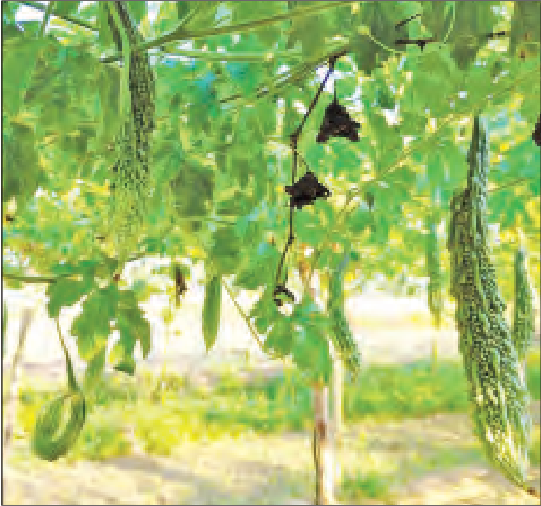
ကျောက်ဆည် မတ် ၂၁

မန္တလေးတိုင်းဒေသကြီး ကျောက်ဆည် မြို့နယ်သည် ဆည်မြောင်းချောင်းကန်ပေါများပြီး တောင်သူအများစုသည် ဆည်ရေ သောက်စနစ်ဖြင့် ဆန်စပါးကို အဓိကထား