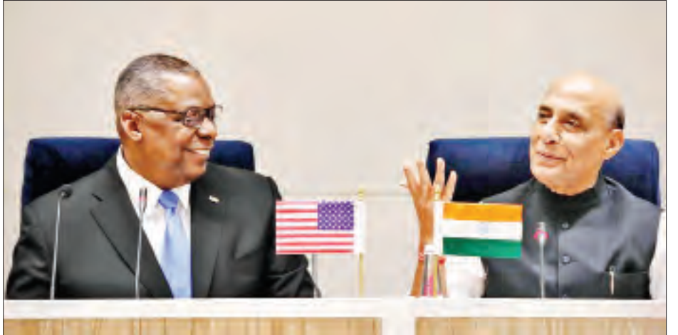
အမေရိကန်နိုင်ငံကာကွယ်ရေးဝန်ကြီး အယ်လျိုက် အော်စတင်

ကိုးကား-အင်န်အိတ်ချ်ကော ဘာသာပြန်-အလင်းသစ်