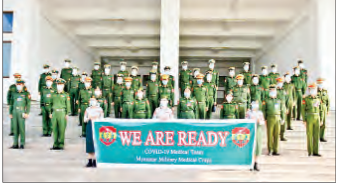
ကိုဗစ်-၁၉ ရောဂါ ကာကွယ်ဖို့ စနစ်တကျ လက်ဆေးစို့

ဝန်ထမ်းတပ်ဖွဲ့ဝင်များကိုယ်စား အဖွဲ့ဝင်တစ်ဦးက သွားရောက်သည့် ရည်ရွယ်ချက်နှင့် ဆောင်ရွက်ရမည့် လုပ်ငန်းအခြေအနေများကို ရှင်းလင်းတင်ပြသည်။ ထို့နောက် တိုင်းမှူးက ဆေးဝန်ထမ်းအဖွဲ့အား စာသေတမ်းဖွယ်ရာများ ပေးအပ်သည်။ လှည်းကူးမြို့နယ် ကိုဗစ်-၁၉ ရောဂါကုသရေးဌာန(ဖောင်ကြီး)တွင် တာဝန်ထမ်းဆောင်ကြမည့် ဆေးဝန်ထမ်းတပ်ဖွဲ့ဝင်များတွင် မေဆေးပါရဂူ ငါးဦး၊ ရောဂါဗေဒပါရဂူ တစ်ဦး၊ ခွဲစိတ်ပါရဂူ တစ်ဦး၊ ဓာတ်မှန်ပါရဂူ နှစ်ဦး၊ ဆေးမှူးဆရာဝန် သုံးဦးနှင့် သူနာပြုအရာရှိ ၂၆ ဦး စုစုပေါင်း ၃၈ ဦးတို့ ပါဝင်ပြီး ၎င်းတို့သည် အများပြည်သူများ အခက်အခဲကြုံတွေ့ပြီး စိုးရိမ်စိတ်များ မြင့်တက်နေချိန်တွင် ရောဂါဝေဒနာခံစားနေရသော ပြည်သူများကို ကာကွယ်၊ ကုသနိုင်ရန် ကိုယ်တိုင်ဆန္ဒပြုခဲ့ကြခြင်းဖြစ်ပြီး ယနေ့နံနက်ပိုင်းတွင် တပ်မတော်ဆေးတက္ကသိုလ်မှ ကိုဗစ်-၁၉ ရောဂါကုသရေးဌာန(ဖောင်ကြီး)သို့ ထွက်ခွာသွားကြောင်း သတင်းရရှိသည်။ သတင်းစဉ်