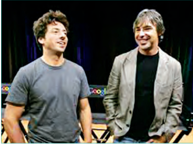
ဂူဂယ်လ်ကို မွေးဖွားပေးခဲ့သည့် လာရီပေချ်နှင့် ဆာဂျီဘရင်။

အင်တာနက် သုံးစွဲသူတိုင်းလိုလို အသုံးပြုရတဲ့ ဆာချ်အင်ဂျင် (Search Engine) ဖြစ်တဲ့ (Google) ဂူဂယ်ကို စတင်တီထွင်ခဲ့သူ နှစ်ဦးကတော့ လာရီပေချ် (Larry Page) နဲ့ ဆာဂျီဘရင် (Sergey Brin) ဖြစ်ပါတယ်။ အင်တာနက်မှာ ဝက်ဘ်ဆိုက် (Website) ပေါင်း မြောက်မြားစွာ ရှိပါတယ်။ အင်တာနက်ပေါ်မှာ ကိုယ်လိုချင်တဲ့ ဝက်ဘ်ဆိုက် ခေါ် အကြောင်းအရာအချက်အလက် တွေကို အချိန်တိုတိုအတွင်း ရှာဖွေနိုင်ဖို့ ဆော့ဖ်ဝဲလ်တစ်ခု လိုအပ်ပါတယ်။ ဆာချ်အင်ဂျင် ဆိုတာကတော့ အင်တာနက်မှာ ကိုယ်လိုချင်တဲ့ အချက်အလက်ကို ရှာဖွေပေးနိုင်တဲ့ ဆော့ဖ်ဝဲလ် ဖြစ်ပါတယ်။ ဆာချ်အင်ဂျင်တွေ အများကြီး ရှိပါတယ်။ ဥပမာ ရာဟူး (Yahoo)၊ ဘင်း (Bing)၊ အာတာစစ်စတာ (Altavista)၊ ဂလက်ဆီ (Galaxy) တို့ဖြစ်ပါတယ်။ အကောင်းဆုံးနဲ့ လူသုံးအများဆုံး ကတော့ ဂူဂယ်လ် ဖြစ်ပါတယ်။