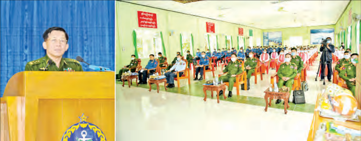
နိုင်ငံတော်စီမံအုပ်ချုပ်ရေးကောင်စီဥက္ကဋ္ဌ၊ တပ်မတော်ကာကွယ်ရေးဦးစီးချုပ် ဗိုလ်ချုပ်မှူးကြီးမင်းအောင်လှိုင် ကျွန်းစုတပ်နယ်မှ အရာရှိ၊ စစ်သည် မိသားစုများအား တွေ့ဆုံအမှာစကား ပြောကြားစဉ်။

နေပြည်တော် မတ် ၂၀ တပ်မတော်အနေဖြင့် ဖွဲ့စည်းပုံအခြေခံဥပဒေ(၂၀၀၈ ခုနှစ်)ပါ ပြဋ္ဌာန်းချက်များနှင့်အညီ ၂၀၂၁ ခုနှစ်၊ ဖေဖော်ဝါရီ ၁ ရက်မှစ၍ နိုင်ငံတော်၏တာဝန်များအား ပုဒ်မ ၄၁၇ နှင့် ၄၁၈ တို့အရ ဆောင်ရွက်ခဲ့ပြီး ပုဒ်မ ၄၁၉ အရ နိုင်ငံတော်စီမံအုပ်ချုပ်ရေးကောင်စီကို ဖွဲ့စည်းကာ နိုင်ငံရေး၊ လူမှုရေး၊ စီးပွားရေးအဘက်ဘက်မှ ဖွဲ့ဖြိုးတိုးတက်အောင် ဆောင်ရွက်လျက်ရှိကြောင်း၊ စစ်မှန်သည့် ဒီမိုကရေစီဖြစ်စေရေး၊ စည်းကမ်းရှိပြီး ခိုင်မာသည့် ဒီမိုကရေစီဖြစ်စေရေး ခေတ္တတာဝန်ယူ ထိန်းသိမ်းဆောင်ရွက်နေခြင်းသာဖြစ်ကြောင်းနှင့် တပ်မတော်သားများအနေဖြင့် စာမျက်နှာ ၃ ကော်လံ ၁ သို့ ၁၃