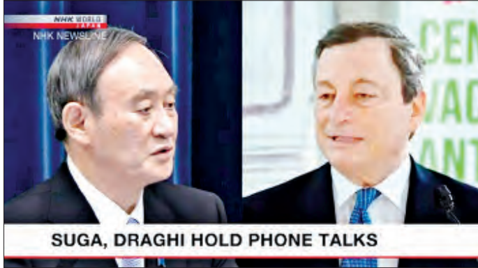
SUGA, DRAGHI HOLD PHONE TALKS

တို့ကျီ မတ် ၂၀ ဂျပန်ဝန်ကြီးချုပ် ဆူဂါနှင့် အီတလီဝန်ကြီးချုပ် မာရီယိုဒရာဂီတို့သည် ကိုဗစ်-၁၉ ကပ်ရောဂါနှင့် ရာသီဥတုပြောင်းလဲမှုအပါအဝင် ကမ္ဘာလုံးဆိုင်ရာ ပြဿနာရပ်များကို ဖြေရှင်းရာတွင် နီးကပ်စွာပူးပေါင်း ဆောင်ရွက်ရန် သဘောတူညီခဲ့ကြောင်း ယနေ့ သတင်းများအရ သိရသည်။ ဝန်ကြီးချုပ်နှစ်ဦးတို့သည် ဂျပန်နိုင်ငံ၏ တောင်းဆိုမှုအရ မတ် ၁၉ ရက်တွင် ဖုန်းဖြင့် ဆက်သွယ်ဆွေးနွေးခဲ့ခြင်းဖြစ်ပြီး ပြီးခဲ့သည့် လအတွင်းက ဝန်ကြီးချုပ်ဖြစ်လာသည့် မာရီယိုဒရာဂီ အား ဂုဏ်ယူပါကြောင်း ဂျပန်ဝန်ကြီးချုပ် ဆူဂါက ပြောကြားခဲ့သည်။ ဆူဂါနှင့် မာရီယိုဒရာဂီတို့သည် အပြန်အလှန်