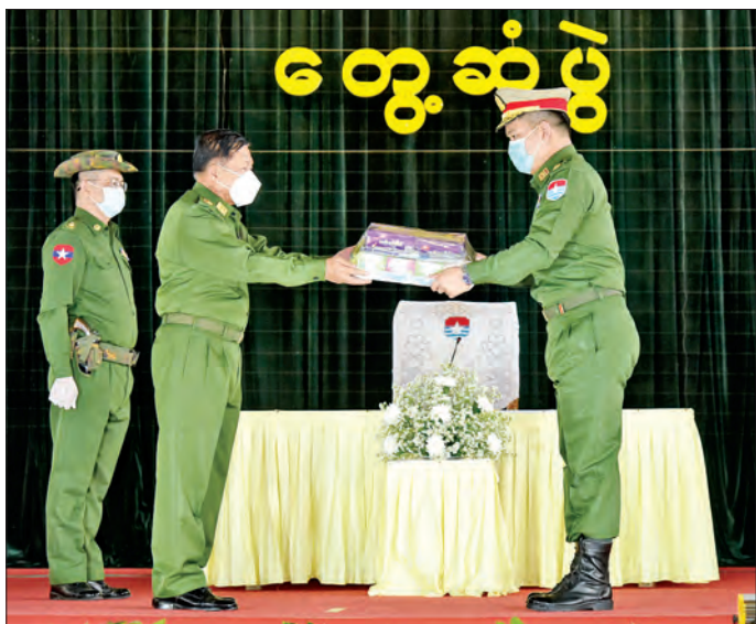
နိုင်ငံတော်စီမံအုပ်ချုပ်ရေးကောင်စီဥက္ကဋ္ဌ၊ တပ်မတော်ကာကွယ်ရေးဦးစီးချုပ် ဗိုလ်ချုပ်မှူးကြီး မင်းအောင်လှိုင် ဗြိတိန်တပ်နယ်အတွက် စားသောက်ဖွယ်ရာပစ္စည်းများ ပေးအပ်စဉ်။

နိုင်ငံတော် စီမံအုပ်ချုပ်ရေးကောင်စီဥက္ကဋ္ဌ၊ တပ်မတော်ကာကွယ်ရေးဦးစီးချုပ်က အမှာစကား ပြောကြားရာတွင် တပ်မတော်အနေဖြင့် ၂၀၂၀ ပြည့်နှစ် ပါတီစုံဒီမိုကရေစီ အထွေထွေရွေးကောက်ပွဲ ဆိုင်ရာ မဲစာရင်းများမှားယွင်းသည့် ကိစ္စရပ်များကို ဒီမိုကရေစီရန်ပုံငွေလမ်းနှင့်အညီ ဥပဒေကြောင်းအရ ဖြေရှင်းနိုင်ရန် အကြိမ်ကြိမ် ကြိုးပမ်းခဲ့ကြောင်း၊ မဲစာရင်းများတွင် ကြီးမားသည့် လွှဲမှားမှုများဖြစ်ခဲ့ပြီး သာမန်လွှဲမှားမှုများ မဟုတ်ခဲ့ကြောင်း၊ မိမိတို့အနေ ဖြင့် မဲစာရင်းမှားယွင်းမှုများကို ဒီမိုကရေစီရန်ပုံငွေလမ်း များနှင့်အညီ အတတ်နိုင်ဆုံးဆောင်ရွက်ရန် ကြိုးစား ခဲ့သော်လည်း မည်သို့မျှ ဆွေးနွေးညှိနှိုင်းဖြေရှင်းမရ သည့်အတွက် ယခုအဆင့်ထိ ရောက်ရှိလာခြင်းဖြစ် ကြောင်း၊ ရွေးကောက်ပွဲနှင့်ပတ်သက်၍ မိမိတို့နိုင်ငံ သည် အတွေ့အကြုံအားနည်းပြီး ၁၉၉၀ ပြည့်နှစ်မှ စ၍ ရွေးကောက်ပွဲ အတွေ့အကြုံရှိခဲ့ခြင်းဖြစ်ကာ ထိုစဉ်ကတည်းကပင် ရွေးကောက်ပွဲတစ်ခုသည် ဖိအားများရှိနေပါက ရိုးသားသော ရွေးကောက်ပွဲနှင့်