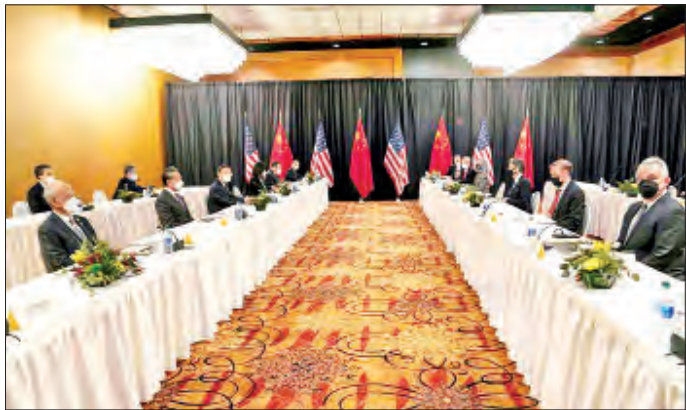
ရိုးမု ညွှန်ကြားရေးမှူး ယန်ဂျီချီနှင့် နိုင်ငံတော် ကောင်စီဝင် ဝမ်ယီတို့နှင့်အတူ နှစ်ဖက်အကြား အဆင့်မြင့်ဆွေးနွေးပွဲတိုးမြှင့်ရန် အလက်စကာ

အကြား အဆင့်မြင့်မဟာဗျူဟာ ဆွေးနွေးပွဲများကို ဆက်လက်ပြုလုပ်ရန် သဘောတူခဲ့ကြသလို ကုန်သွယ်ရေးနှင့် စီးပွားရေးကိစ္စများ၊ ကျန်းမာရေး စောင့်ရှောက်မှု၊ ဆိုက်ဘာလုံခြုံရေး၊ ရာသီဥတု ပြောင်းလဲမှုနှင့် အတူ ဒေသတွင်းကိစ္စရပ်များကိုလည်း အလေးထားဆွေးနွေးခဲ့ကြကာ ယင်းကိစ္စရပ်များနှင့် ပတ်သက်၍ နှစ်ဖက်အကြား ညှိနှိုင်းဆောင်ရွက်မှုနှင့် ဆက်သွယ်မှုများကို ဆက်လက်တိုးမြှင့်ရန် သဘော တူခဲ့ကြကြောင်း သိရသည်။ ဆွေးနွေးစဉ် အထူးသဖြင့် ကိုဗစ်-၁၉ ရောဂါ တိုက်ဖျက်ရေးနှင့် ကမ္ဘာ့စီးပွားရေးပြန်လည် ထူထောင်ရေးနယ်ပယ်များတွင် အမေရိကန်နှင့် တရုတ်အနေဖြင့် ပူးပေါင်းဆောင်ရွက်သင့်သည်ဟု တရုတ်ဘက်က အလေးထားပြောကြားခဲ့ကြောင်း သိရသည်။ အမေရိကန်နိုင်ငံခြားရေးဝန်ကြီး အန်တိုနီ ဘလင်ကန်နှင့် အမျိုးသားလုံခြုံရေးအကြံပေး ဂျိုက်ဆူ လီဗန်တို့သည် တရုတ်ပြည်ပရေးရာ ဗဟိုကော်မရှင်