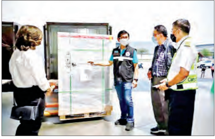
မည်ဖြစ်ကြောင်းလည်း ရေးသားဖော်ပြထားသည်။ ထိုင်းနိုင်ငံသည် တရုတ်နိုင်ငံထုတ် Sinovac ကိုဗစ်-၁၉ ရောဂါကာကွယ်ဆေးပထမအသုတ်ကို

ဗန်ကောက် မတ် ၂၀ ထိုင်းနိုင်ငံသည် တရုတ်နိုင်ငံထံမှ ဝယ်ယူထားသည့် Sinovac ကိုဗစ်-၁၉ ရောဂါကာကွယ်ဆေး ဒုတိယ အသုတ်ကို မတ် ၂၀ ရက်တွင် လက်ခံရရှိခဲ့ကြောင်း ယနေ့သတင်းများအရ သိရသည်။ ထိုင်းနိုင်ငံ၏ ကိုဗစ်-၁၉ ရောဂါတိုက်ဖျက်ရေး အတွက် အထောက်အကူဖြစ်စေရန် တရုတ်နိုင်ငံထုတ် ကိုဗစ်-၁၉ ရောဂါကာကွယ်ဆေးနောက်ဆုံးအသုတ် ကိုလည်း ဆက်လက်ပေးပို့သွားမည်ဟု မျှော်လင့် ကြောင်းနှင့် ကိုဗစ်-၁၉ ကာကွယ်ရောဂါ ဖြစ်ပွားရေး ဖွံ့ဖြိုးတိုးတက်မှု ကဲ့သို့သော နယ်ပယ်များတွင် နှစ်နိုင်ငံအပြန်အလှန် ပူးပေါင်းဆောင်ရွက်ရန် အတွက်လည်း တရုတ်နိုင်ငံက အသင့်ရှိပါကြောင်း ထိုင်းနိုင်ငံဆိုင်ရာတရုတ်သံရုံးက သုံးရုံး၏ ဖေဖော်ဝါရီ ၁၈ ရက်နေ့တွင် ရေးသားဖော်ပြထားသည်။ ထိုင်းနိုင်ငံနှင့် တရုတ်နိုင်ငံတို့အကြား ပြီးပြည့်စုံ သော မဟာဗျူဟာမြောက် မိတ်ဖက်ဖြစ်ရေးကို နက်နက်ရှိုင်းရှိုင်းဆောင်ရွက်ရန်အတွက် တရုတ်နိုင်ငံ အနေဖြင့် ထိုင်းနိုင်ငံနှင့် ပူးပေါင်းဆောင်ရွက်သွား