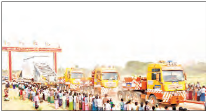
တန်ချိန် ၅၆၃ တန်ရှိ ရုပ်ပွားတော်အပိုင်း(၁/၂) အရန်စုစုပေါင်း နှစ်တုံး တင်ဆောင်ထားသည့် Modular Trailer များသည် မင်္ဂလာအချိန်တွင် စတင် ပင့်ဆောင်ထွက်ခွာတော်မူကြရာ ဝန်ကြီးဌာန၊ သံဃာ့နာယကဥက္ကဋ္ဌ ဆရာတော်ကြီး၊ တိုင်းမှူးနှင့် တက်ရောက်လာကြသည့် ဧည့်ပရိသတ်အပေါင်းတို့က လက်ဆယ်ဖြာဦးထိပ်ထား၍ ကြည့်ညိုခဲ့ကြကြောင်း သိရသည်။ သတင်းစဉ်

ဆရာတော်ကြီး အမှူးပြုသော သံဃာတော်များ ရွတ်ပွားသရဇ္ဈာယ်တော်မူကြသည့် ပရိတ်တရားတော်များကို တက်ရောက်လာကြသူများက နာယူကြည့်ညိုကြသည်။ ဆက်လက်၍ ဘူမိဗေဒဗဟိုပြုထိုင်တော်မူ ကျောက်ဆစ်ဗုဒ္ဓရုပ်ပွားတော်မြတ်ကြီး၏ ဆင်းတုတော်နှင့် ပလ္လင်တော် အစိတ်အပိုင်းများအား ဆရာတော်ကြီးများ၊ တိုင်းမှူးနှင့် တာဝန်ရှိသူများက အမွှေးနံ့သာရည်များဖြင့် ပက်ဖျန်းပူဇော်ကြသည်။ ထို့နောက် ဘူမိဗေဒဗဟိုပြုထိုင်တော်မူ ကျောက်ဆစ်ဗုဒ္ဓရုပ်ပွားတော်မြတ်ကြီး၏ ဆင်းတုတော်နှင့် ပလ္လင်တော်အစိတ်အပိုင်းများအား ပင့်ဆောင်ရန် အတွက် လုံခြုံရေးအဖွဲ့ဝင်များနှင့် ယာဉ်မောင်းများ နေရာယူခြင်း၊ ဥပါသကာများနှင့် ဝတ်အသင်းများ နေရာယူခြင်းတို့ကို အစီအစဉ်အတိုင်း ဆက်လက်ဆောင်ရွက်ကြပြီး ဘူမိဗေဒဗဟိုပြုထိုင်တော်မူ ကျောက်ဆစ်ဗုဒ္ဓရုပ်ပွားတော် ပိတ်မကျောက်တော်ကြီးမှ တန်ချိန် ၈၀၀ ရှိ ရုပ်ပွားတော် အပိုင်း(၄)