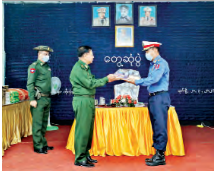
နိုင်ငံတော်စီမံအုပ်ချုပ်ရေးကောင်စီဥက္ကဋ္ဌ၊ တပ်မတော်ကာကွယ်ရေးဦးစီးချုပ် ဗိုလ်ချုပ်မှူးကြီး မင်းအောင်လှိုင် ကိုကိုးကျွန်းတပ်နယ်အတွက် စားသောက်ဖွယ်ရာပစ္စည်းများ ပေးအပ်စဉ်။

စတင်တာဝန်ယူသည့် ပထမရက်သတ္တပတ်အတွင်း တည်ငြိမ်အေးချမ်းခဲ့သော်လည်း ဒုတိယအပတ်မှစတင်၍ ဆူပူမှု ဆန္ဒပြမှုများဖြစ်ပေါ်ခဲ့ကြောင်း။ ထိုသို့ဆန္ဒပြမှုများမှာ ကိုဗစ်ကာလအကျပ်အတည်း ထိန်းချုပ်မှု အခြားတစ်ဖက်ကလည်း ရွေးကောက်ပွဲ မဲမသမာမှုအပေါ် ယခုလိုဆောင်ရွက်ခြင်းကြောင့် မခံမရပ်နိုင်သူများကြောင့် ဖြစ်ပွားနေခြင်းဖြစ်ကြောင်း။ ဆူပူဆန္ဒပြမှုဖြစ်စဉ်များ အားလုံးကို မြန်မာနိုင်ငံရဲတပ်ဖွဲ့ ဝင်များဖြင့် အင်အားအနည်းဆုံးနှင့် အသက်သာဆုံးဖြစ်အောင် ထိန်းသိမ်းဆောင်ရွက်နေကြောင်း။ ယခုအခါဆူပူဆန္ဒပြသည့်အဆင့်မှ မင်းမဲ့စရိုက်ဆန်သည့် ဥပဒေချိုးဖောက်မှုအဆင့်များမှတစ်ဆင့် ပြိုင်