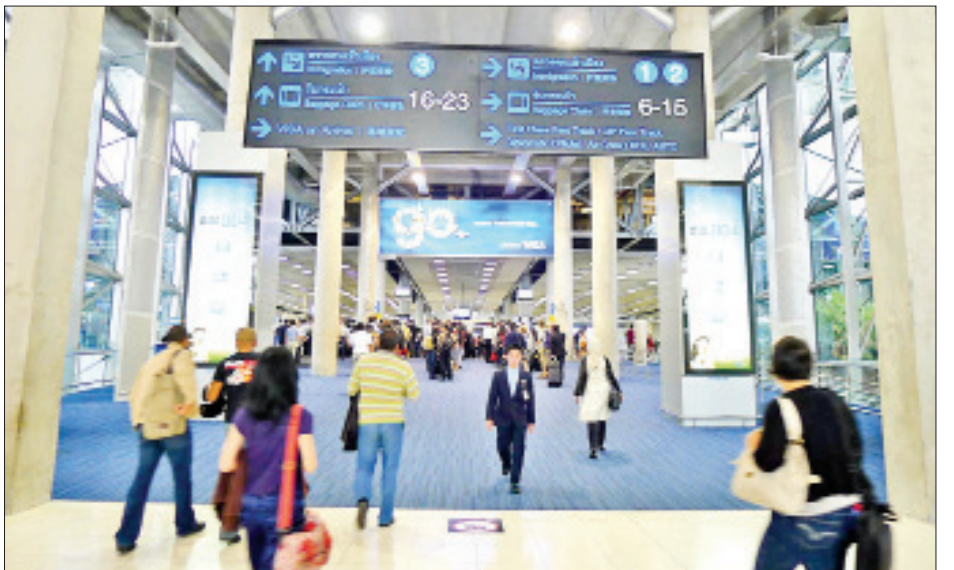
လာရေးအတွက် သော့ချက်တစ်ခုပင်ဖြစ်သည်။

ထိုင်းနိုင်ငံ၏ ခရီးသွားကဏ္ဍမှ ရရှိသည့်ဝင်ငွေ သည် နိုင်ငံစီးပွားရေး၏ ၁၅ ရာခိုင်နှုန်းကျော်ရှိပြီး ယခုကဲ့သို့ ကိုဗစ်-၁၉ ရောဂါ စောင့်ကြည့်မှုခံယူ ချိန်ကာလ လျှော့ချခြင်းအားဖြင့် နိုင်ငံအတွင်းသို့ ဝင်ရောက်လည်ပတ်သော ခရီးသည်များကို ပိုမို ဆွဲဆောင်လိမ့်မည်ဟု မျှော်လင့်ရသည်။ ခရီးသွား ကဏ္ဍသည် ထိုင်းနိုင်ငံ၏ စီးပွားရေး ပြန်လည်ဦးမော့