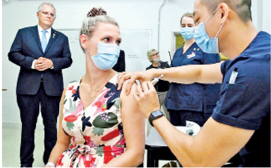
ဩစတြေးလျနိုင်ငံသားတစ်ဦး ကိုဗစ်-၁၉ ရောဂါကာကွယ်ဆေး ထိုးနှံမှုခံယူနေသည်ကို ဖေဖော်ဝါရီ ၂၁ ရက်က ဝန်ကြီးချုပ် စကော့မော်ရီဆင် ကြည့်ရှုစစ်ဆေးနေစဉ်။

ဝန်ထမ်း ၂၈၀၀၀ ခန့် အပါအဝင် ပြည်သူ ၄၉၀၀၀ ကျော်ကို ကိုဗစ်- ၁၉ ရောဂါ ကာကွယ်ဆေးထိုးနှံမှု ခံယူခဲ့ကြောင်း သိရသည်။ ကိုးကား - ဆင်ဟွာ ဘာသာပြန် - ဂျေတီ