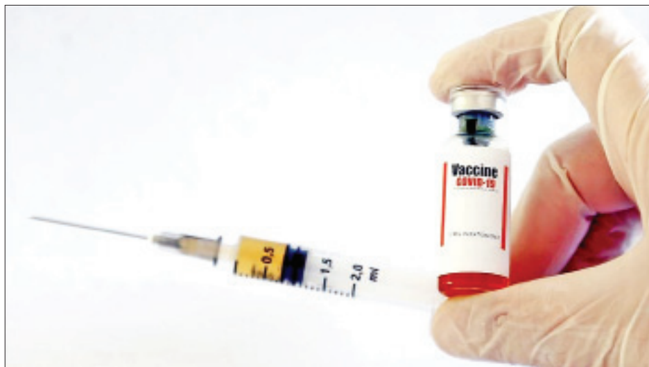
ဖြစ်ကြောင်း သိရသည်။

အင်ဒိုနီးရှားနိုင်ငံသည် AstraZeneca ကိုဗစ်-၁၉ ရောဂါကာကွယ်ဆေးကို မတ် ၃ ရက်တွင် အလုံးစုံ ၁ ဒသမ ၁ သန်း လက်ခံရရှိခဲ့ပြီး ဧပြီလ နောက်ပိုင်းတွင် AstraZeneca ကိုဗစ်-၁၉ ရောဂါ ကာကွယ်ဆေးအလုံးစုံ ၁၀ သန်း လက်ခံရရှိမည်