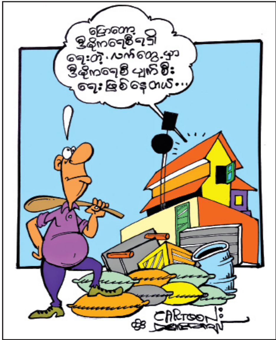
ပြည်ထောင်စုရွေးကောက်ပွဲကော်မရှင်