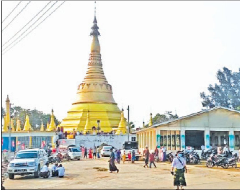
ပုသိမ် မတ် ၁၉

ဧရာဝတီတိုင်းဒေသကြီးအပါအဝင် မြန်မာ တစ်နိုင်ငံလုံးတွင် ကိုဗစ်-၁၉ ရောဂါဖြစ်ပွား