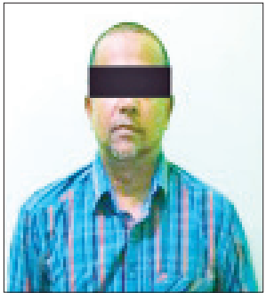
ဦးတင်မိုး

များကို ပြုလုပ်ခဲ့ကြောင်း၊ ၎င်းတို့သည် ရန်ကုန်မြို့ရှိ ဆူးလေဘုရား၊ ငါးထပ်ကြီးဘုရား၊ တရုတ်သံရုံး၊ အမေရိကန်သံရုံး၊ အင်ဒိုနီးရှားသံရုံး၊ ရှာပေးသံရုံး၊ ထိုင်းသံရုံး၊ သာဓကတမြို့နယ်၊ တာမွေမြို့နယ်၊ သင်္ဃန်းကျွန်း မြို့နယ်နှင့် မြေနီကုန်းတံတားအောက်တို့တွင် လှည့်လည်ဆန္ဒပြလှုပ်ရှား ခဲ့ကြကြောင်း။