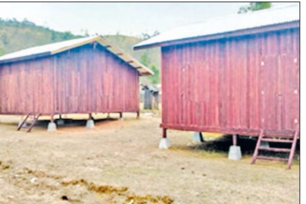
ဇေယျာထက် (မင်းဘူး)