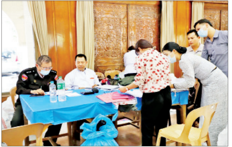
မဲလက်မှတ်များ မြေပြင်စစ်ဆေးစဉ်။

၅။ မြေပြင်စစ်ဆေးချက်များအရ ရန်ကုန်တိုင်းဒေသကြီး၊ ပန်းဘဲတန်းမြို့နယ်တွင် ရပ်ကွက် ၁၁ ရပ်ကွက်၊ မဲရုံပေါင်း ၂၆ ရုံ၊ ထုတ်ယူရရှိခဲ့သော ဆန္ဒမဲလက်မှတ်အရေအတွက်မှာ ၂၅၄၀၈ ဖြစ်ပြီး၊ မဲပေးအသုံးပြုခဲ့သော လက်မှတ်ဖြတ်ပိုင်းများမှာ ၃၁၄၄၉၊ ကျန်ရှိရမည့် အရေအတွက်မှာ ၁၈၉၇၄၈ ဖြစ်သော်လည်း မြေပြင်လက်ကျန် ၁၇၃၃၇၄ ဖြစ်ကြောင်း စိစစ်တွေ့ရှိရသည်။ မဲရုံများအလိုက် မဲလက်မှတ်အပိုများနှင့် ပျောက်ဆုံးနေမှုများ တွေ့ရှိရပြီး စိစစ်တွေ့ရှိချက်များမှာ အောက်ပါအတိုင်းဖြစ်သည် -