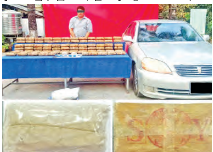
မော်ဖြိုး(ခ)ကိုဖြိုးအား သိမ်းဆည်းရမိသည့် စိတ်ကြွရူးသွပ်ဆေးပြားများနှင့်အတူ တွေ့ရစဉ်။

နေပြည်တော် မတ် ၁၇ တာချီလိတ်မြို့နယ်တွင် ငွေကျပ်သိန်း ၂၅၀၀ တန်ဖိုးရှိ စိတ်ကြွရူးသွပ်ဆေးပြား ပူးပေါင်းအဖွဲ့သည် မူးယစ်ဆေးဝါးပမာဏ များ သိမ်းဆည်းရမိကြောင်း သိရသည်။ အများအပြား သယ်ဆောင်ရောင်းဝယ်