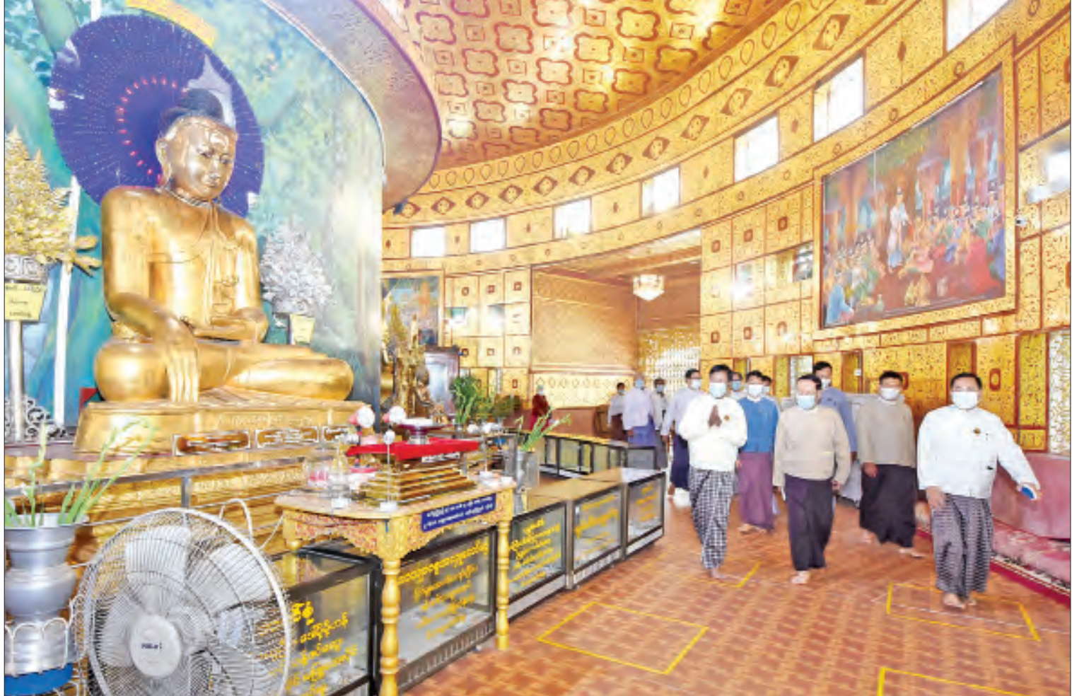
သာသနာရေးနှင့် ယဉ်ကျေးမှုဝန်ကြီးဌာန ပြည်ထောင်စုဝန်ကြီး ဦးကိုကို သီရိမင်္ဂလာ ကမ္ဘာအေးစေတီတော်ကြီးအား ဖူးမြော်ကြည်ညိုစဉ်။

ရန်ကုန် မတ် ၁၇ သာသနာရေးနှင့် ယဉ်ကျေးမှုဝန်ကြီးဌာန ပြည်ထောင်စုဝန်ကြီး ဦးကိုကိုသည် ယနေ့ နံနက် ၁၀ နာရီတွင် တာဝန်ရှိသူများ နှင့်အတူ ရန်ကုန်အနောက်ပိုင်းခရိုင် မရမ်းကုန်းမြို့နယ် ကမ္ဘာအေးစေတီတော်ကြီး သီရိမင်္ဂလာ ကမ္ဘာအေးစေတီတော်ကြီး အား ဖူးမြော်ကြည်ညို ပန်း၊ ရေချမ်း၊ ရွှေသင်္ကန်းများ ဆက်ကပ်လှူဒါန်းသည်။ ထို့နောက် စေတီတော်ဂေါပက အဖွဲ့ရုံးခန်း၌ ဂေါပကအဖွဲ့ဝင် ဦးလှထွန်း က စေတီတော်မြတ်ကြီး၏ တည်ထား ကိုးကွယ်မှုဆိုင်ရာ သမိုင်းကြောင်းများနှင့် ဘက်စုံပြုပြင် မွမ်းမံပြီးစီးမှုများကို ရှင်းလင်းတင်ပြရာ ပြည်ထောင်စု ဝန်ကြီးက စေတီတော်မြတ်ကြီးအား ရဟန်းရှင်လူ ပြည်သူများ စိတ်ချမ်းမြေ့စွာ ဖူးမြော်ကြည်ညိုနိုင်ရန်၊ ကျန်းမာရေးနှင့် အားကစားဝန်ကြီးဌာန၏ ကိုဗစ်-၁၉ ရောဂါထိန်းချုပ်မှု၊ တားဆီး၊ ကာကွယ် ရေးဆိုင်ရာ ညွှန်ကြားချက်များနှင့်အညီ ဆောင်ရွက်သွားရန်နှင့် စေတီတော်နှင့် ပတ်သက်၍ တိုးတက်စည်ပင်အောင် ဆောင်ရွက်စေလိုကြောင်း၊ စေတီတော် ကြီး ဘက်စုံပြုပြင်မွမ်းမံခြင်းနှင့်သာသနာ ရေးလုပ်ငန်းများကို ဆောင်ရွက်ရာတွင် စေတီတော်ဂေါပကအဖွဲ့၏ ဩဝါဒါစရိယ စာမျက်နှာ ၃ ကော်လံ ၁ သို့ □