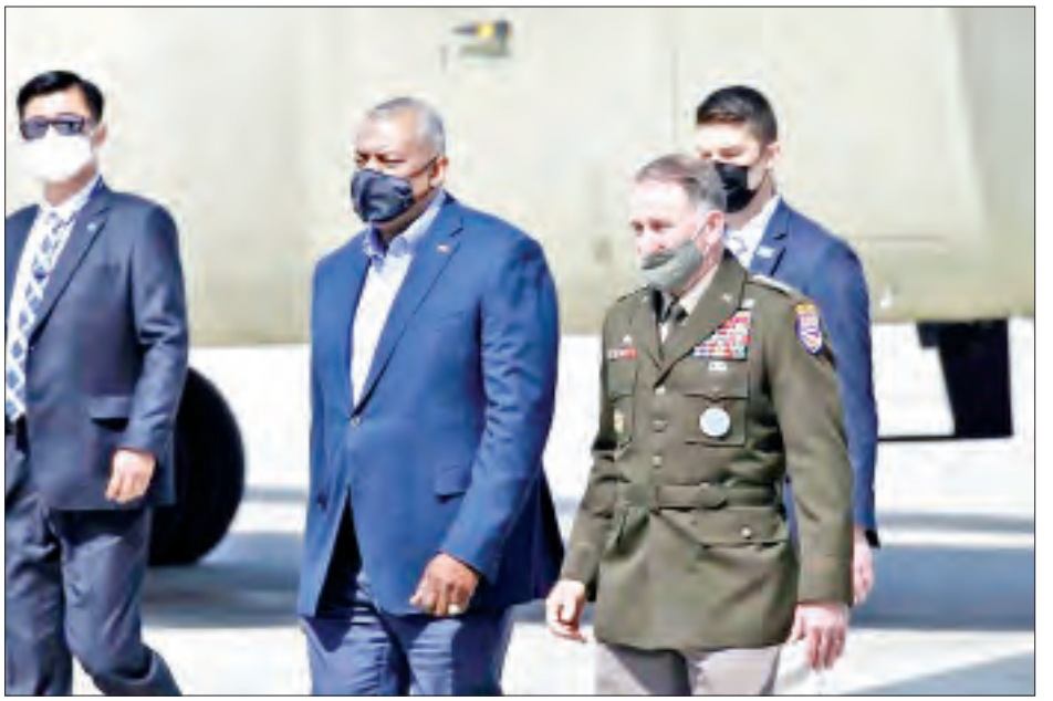
ဘလင်ကင်၊ ဩစတင်၊ တောင်ကိုရီးယားနိုင်ငံ ခြားရေးဝန်ကြီး ချိုအီယူယောင်နှင့် ကာကွယ်ရေး ဝန်ကြီး ဆုဂုခံတို့သည် ၂+၂ အစည်းအဝေးမတိုင်မီ တစ်ဦးချင်းစီ တွေ့ဆုံဆွေးနွေးကြရန်လည်း စီစဉ် ထားကြောင်း သိရသည်။ ကိုးကား-ကျိုဒိုနယူးစ်၊ ဘာသာပြန်-ဂျေတီ

တိုက်တွန်းခဲ့ အမေရိကန်တာဝန်ရှိသူများသည် တောင်ကိုရီး ယားသို့ မသွားမီ ဂျပန်နိုင်ငံသို့ သုံးရက်ကြာခရီးဖြင့် သွားရောက်လည်ပတ်ခဲ့ပြီး ဂျပန်တာဝန်ရှိသူများနှင့် အတူ ကိုရီးယားကျွန်းဆွယ် နျူကလီးယားကင်းစင် ရေးဆိုင်ရာ ၎င်းတို့၏ ကတိကဝတ်များကို ထပ်လောင်း အတည်ပြုခဲ့ကြသလို မြောက်ကိုရီးယားအား ကုလသမဂ္ဂလုံခြုံရေးကောင်စီ၏ ဆုံးဖြတ်ချက်အရ ၎င်း၏တာဝန်ဝတ္တရားများကို လိုက်နာရန် တိုက်တွန်း ခဲ့ကြကြောင်း သိရသည်။