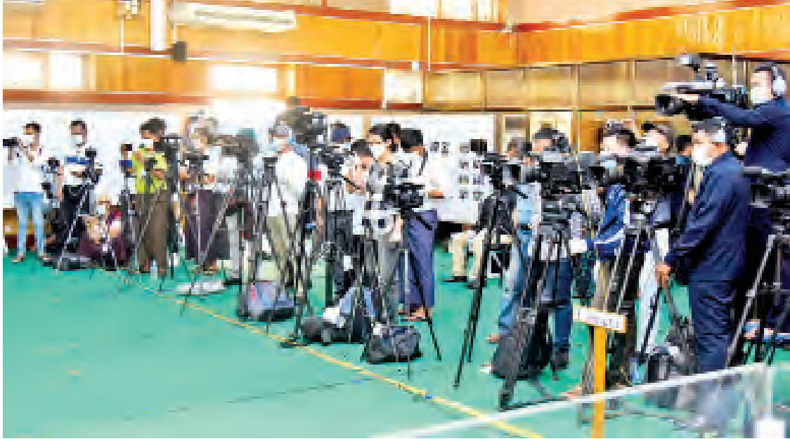
၁၁-၃-၂၀၂၁ ရက်နေ့ နိုင်ငံတော်စီမံအုပ်ချုပ်ရေးကောင်စီ၏ သတင်းထုတ်ပြန်ရေးအဖွဲ့နှင့် သတင်းမီဒီယာများပြုလုပ်သည့် သတင်းစာရှင်းလင်းပွဲသို့ တက်ရောက်လာသည့် သတင်းထောက်များကို တွေ့ရစဉ်။

မြေပြင်သတင်းတချို့ တွေ့ရှိ သေနင်္ဂမဟာဗျူဟာ လေ့လာရေး