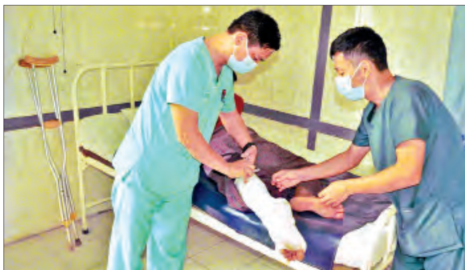
ထိုသို့ လာရောက်ကုသမှုခံယူလျက်ရှိသည့် လူနာများအနက် အကြီးစားခွဲစိတ်ကုသရန် လိုအပ်သူ ၃၄၂၆ ဦး၊ အသေးစားခွဲစိတ်ကုသရန် လိုအပ်သူ ၁၈၂၅ ဦး စုစုပေါင်း ၅၂၅၁ ဦးတို့ကို

နေပြည်တော် မတ် ၁၇ တိုင်းဒေသကြီးနှင့် ပြည်နယ်များရှိ တိုင်းရင်းသား ပြည်သူများ၏ ကျန်းမာရေးဆိုင်ရာအခက်အခဲများကို တစ်ထောင့်တစ်နေရာမှ အထောက်အကူပြုစေရန်အတွက် မြို့နယ်အသီးသီးရှိ တပ်မတော်ဆေးရုံများနှင့် ယာယီကုသရေးဆေးရုံများတွင် ကျန်းမာရေးစောင့်ရှောက်မှုများကို ဆောင်ရွက်ပေးလျက်ရှိရာ ဖေဖော်ဝါရီ ၅ ရက်မှ ယနေ့အထိ ပြင်ပလူနာ ၇၅၅၈၈ ဦး၊ အတွင်းလူနာ ၄၀၆၉ ဦးကို တပ်မတော်မှ ပါရဂူများ၊ ဆေးမှူးများ၊ သူနာပြုများဖြင့် ကျန်းမာရေးစစ်ဆေးပေးခြင်း၊ ခွဲစိတ်ရန်လိုအပ်သည့်လူနာများအား ခွဲစိတ်ပေးခြင်း၊ ဆေးရုံတက်ရောက်ကုသရန်လိုအပ်သော လူနာများကို ဆေးရုံတင်ကာ ကျန်းမာရေးစောင့်ရှောက်ပေးခြင်းများ ဆောင်ရွက်ပေးသည့်အပြင် ဆေးရုံတက်လူနာများနှင့် လူနာစောင့်ရှောက်ရေးအဖွဲ့များအား အဆင်ပြေစေရန်အတွက် ကိုယ်စီဆောင်ရွက်ပေးသည်။