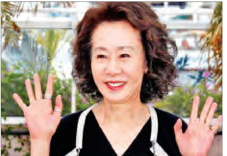
ဆုအတွက် ဆန်ခါတင်စာရင်းဝင်ခဲ့ပါ သွင့်ရတဲ့ ပထမဆုံးသော အာရှ-အမေရိကန် တယ်။ စတီဗင်ယန်ဟာလည်း အော်စကာ ဆုလျာထားစာရင်းမှာ အကောင်းဆုံး အမျိုးသားဇာတ်ဆောင်ဆုအတွက် ပါဝင်

အဆိုပါရုပ်ရှင်မှာ ယွန်ယူဂျန်နဲ့အတူ တွဲဖက်ပါဝင်ထားတဲ့ သရုပ်ဆောင်တစ်ဦး ဖြစ်သူ စတီဗင်ယန်ကလည်း ယခုနှစ် အော်စကာဆန်ခါတင်စာရင်းမှာ အဆိုပါရုပ်ရှင်နှင့် ပင်အကောင်းဆုံးအမျိုးသားဇာတ်ဆောင်