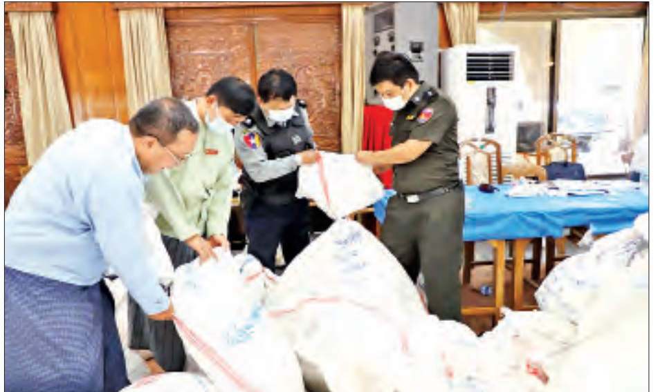
မဲဆန္ဒရှင်စာရင်းများနှင့် ဆန္ဒမဲလက်မှတ်များ ထုတ်ယူ/ ရရှိ/ သုံးစွဲ/ လက်ကျန် မြေပြင်အခြေအနေ များကို စစ်ဆေးစဉ်။