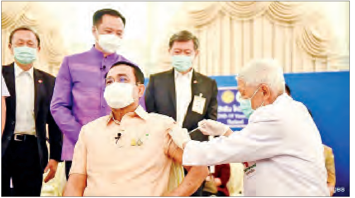
ထိုင်းနိုင်ငံဝန်ကြီးချုပ် ပရာယုဒ်နှင့် အစိုးရအဖွဲ့သည် ယခုလအစောပိုင်းတွင် ထိုင်းနိုင်ငံက အရေးပေါ်အသုံးပြုရန် လက်ခံရရှိထားသည့် ပြည်ပမှ တင်သွင်း လာသည့် AstraZeneca ကိုဗစ်-၁၉ ရောဂါ ကာကွယ်ဆေးအလုံးရေ ၁၁၇၃၀၀ ဖြင့်

ထိုင်းနိုင်ငံသည် နိုင်ငံတစ်ဝန်း ကိုဗစ်-၁၉ ရောဂါကာကွယ်ဆေးအစုလိုက် အပြုလိုက်ထိုးနှံမှုကို ဇွန်လတွင် စတင်ရန် စီစဉ်ထားသော်လည်း ထိုင်းနိုင်ငံထုတ် AstraZeneca ကိုဗစ်-၁၉ ရောဂါကာကွယ် ဆေးသည် ဇွန်လမတိုင်မီ ရရှိနိုင်မည် မဟုတ်ကြောင်း သိရသည်။