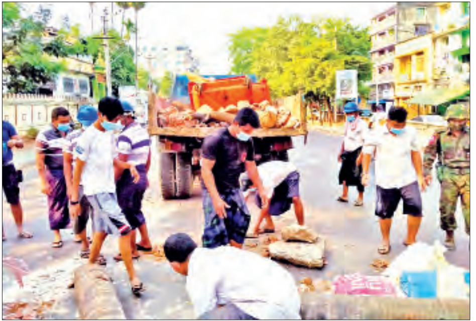
ကြောင်းနှင့် ပြည်သူများအနေဖြင့် တပ်မတော်သား သည်ကို လူမှုမီဒီယာများ၊ သတင်းစာများတွင်ပါ များ၊ မြန်မာနိုင်ငံ ရဲတပ်ဖွဲ့ဝင်များ၊ နိုင်ငံ့ဝန်ထမ်းများ ဖော်ပြနေကြောင်း သိရသည်။ က ယခုကဲ့သို့ ပူးပေါင်းရှင်းလင်းမှုကို လိုလားနေကြ သတင်းစဉ်

ဝါးကပ်များ၊ သစ်တုံးများ၊ ဓာတ်တိုင်များ၊ တာယာ ဟောင်းများ၊ ကျောက်တုံးများ၊ အုတ်ခဲများကို ဖယ်ရှားရှင်းလင်းခဲ့သည်။ ယခုအခါ နှောင့်ယှက်လိုသူများက အများ ပြည်သူသွားလာလျက်ရှိသော လမ်းသွယ်နှင့် လမ်းမ များကို လမ်းဘေးမှ အလွယ်တကူရနိုင်သော ပစ္စည်း များဖြစ်သည့် သဲအိတ်၊ သစ်တုံး၊ တာယာဟောင်းများ ဖြင့် လည်းကောင်း၊ ဓာတ်တိုင်၊ အမှိုက်ပုံး စသည့် နိုင်ငံပိုင်ပစ္စည်းများဖြင့် လည်းကောင်း ပိတ်ဆို့ကာ အတားအဆီးများ ပြုလုပ်ခြင်းကြောင့် ရပ်ကွက်နေ ပြည်သူများ ပုံမှန်အလုပ်ခွင် သွားရောက်သူများနှင့် မော်တော်ယာဉ်များ၊ လူနာတင်ယာဉ်၊ မီးသတ် ယာဉ်များ ဖြတ်သန်းသွားနိုင်ခြင်းမရှိသည်ကို ပူပန် နေရခြင်း၊ အတားအဆီးများကို ဖယ်ရှားလိုသော် လည်း တားဆီးပိတ်ဆို့သူ နှောင့်ယှက်လိုသူတို့၏ ရန်အားကြောက်လန့်နေရခြင်းတို့ ဖြစ်ပေါ်နေရ