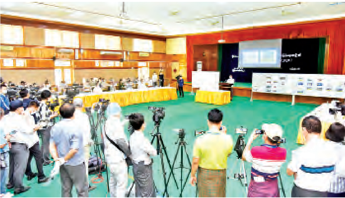
နိုင်ငံတော်စီမံအုပ်ချုပ်ရေးကောင်စီ သတင်းထုတ်ပြန်ရေးအဖွဲ့ သတင်းစာရှင်းလင်းပွဲကျင်းပစဉ်။

○ စာမျက်နှာ ၂၀ မှ ဆက်လက်ပြီး လုပ်ဆောင်သွားမည့် လမ်းကြောင်းသည် ပဋိပက္ခတွေ့ရှိခြင်းများ သွားစေဖို့ အမြန်ဆုံးပြင်ဆင်ရေးစီစဉ် ဖြစ်ကြောင်း၊ ဒါကြောင့် သတင်းစာ ရှင်းလင်းပွဲများ လုပ်ရခြင်းဖြစ်ကြောင်း၊ မဲစာရင်း မှားယွင်းမှု၊ မဲမသမာမှု၊ မဲလိမ်မှု များကို ဖြေရှင်းခဲ့ဖူးပြောသည်ကို မဖြေရှင်း ခဲ့ရာ ဖွဲ့စည်းပုံအခြေခံဥပဒေ(၂၀၀၈ ခုနှစ်) အရ နိုင်ငံတော်တာဝန်ကို ရယူခဲ့ခြင်း ဖြစ်ကြောင်း၊ ပထမဦးဆုံး မဲစာရင်း၊ မဲမသမာမှုများကို ဖော်ထုတ်ပြမည်ဖြစ်ပြီး UEC တာဝန်ရှိသူများကလည်း ရှင်းပြမည် ဖြစ်ပါကြောင်း၊ ယခုမဲစာရင်းတွေကိုလည်း လာကြည့်ရှုရပါကြောင်း၊ မြေပြင်တွင် မိသည့် မဲလက်မှတ်များ၌ မည်သည့် ပါတီကို တံဆိပ်တုံးနှိပ်ထားသည် ဆိုတာကိုကြည့်ရင် ပေါ်လိမ့်မည် ဖြစ်ပါ ကြောင်း၊ သက်သေပြရသည့် အကြောင်း