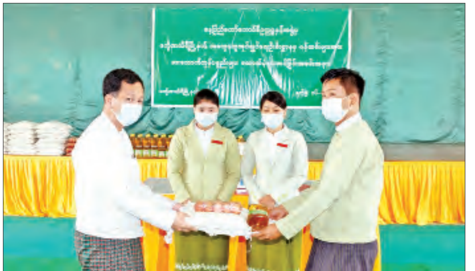
စားသောက်ကုန်ပစ္စည်းများ ထောက်ပံ့ပေးအပ်သည်။ ဆက်လက်၍ နေပြည်တော်ကောင်စီဥက္ကဋ္ဌ နှင့်အဖွဲ့ဝင်များသည် လယ်ဝေးမြို့နယ် အထွေထွေ အုပ်ချုပ်ရေးဦးစီးဌာနရုံးသို့ သွားရောက်၍ ဝန်ထမ်း များနှင့်တွေ့ဆုံမှာကြားပြီး စားသောက်ကုန်ပစ္စည်း များ ထောက်ပံ့ပေးအပ်သည်။ ယနေ့ စားသောက်ကုန်ပစ္စည်းများ ထောက်ပံ့

ယင်းနောက် နေပြည်တော်ကောင်စီဥက္ကဋ္ဌ ဒေါက်တာမောင်မောင်နိုင်က ဒက္ခိဏသီရိမြို့နယ် အထွေထွေအုပ်ချုပ်ရေးဦးစီးဌာန ဝန်ထမ်းများကို