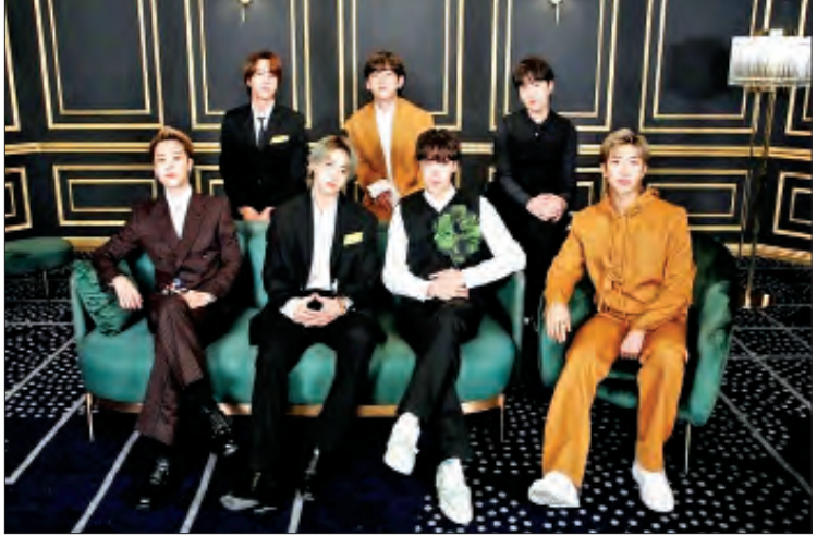
BTS ဟာ ယခုနှစ်ဆုပေးပွဲမှာ အကောင်းဆုံး ပေါ့ပေးသံရှင်ဆု အတွက် လျာထားစာရင်းဝင်ခဲ့ပြီး ယင်းဆု ကို လေဒီဂါဂါနဲ့ အရီရန်နာဂရန်းဒ်တို့က ဆွတ်ခူးသွားခဲ့တာ ဖြစ်ပါတယ်။ အဆိုပါ

တောင်ကိုရီးယားရဲ့ ကျော်ကြားတဲ့ အမျိုးသားတေးဂီတအဖွဲ့တစ်ဖွဲ့ဖြစ်တဲ့ BTS ဟာ လတ်တလောမှာ ပြုလုပ်ခဲ့တဲ့ နိုင်ငံတကာ တေးဂီတထူးချွန်ဆုပေးပွဲ တစ်ခုဖြစ်တဲ့ ဂရမ်မီဆုပေးပွဲမှာ ဆန်ခါတင် စာရင်းဝင်ခဲ့ပေမယ့် ဆုပေးပွဲညမှာတော့ ထူးချွန်ဆုနဲ့ လွဲချော်ခဲ့ရတာ ဖြစ်ပါတယ်။ တေးဂီတ ထူးချွန်ဆုပေးပွဲတွေအနက် ကမ္ဘာ့အကြီးကျယ်ဆုံးသော ဆုပေးပွဲ တစ်ခုဖြစ်တဲ့ ဂရမ်မီဆုပေးပွဲရဲ့ ယခုနှစ် ဆုပေးပွဲမှာ အာရှတေးဂီတအဖွဲ့တစ်ဖွဲ့ဖြစ် တဲ့ BTS ထူးချွန်ဆုနဲ့ လွဲခဲ့ရသလို အခြား သော လူမည်းတေးသံရှင်အချို့လည်း ဆုစာရင်းမှာ မပါဝင်တာကြောင့် ပရိသတ် တွေကတော့ ယခုနှစ်ဆုပေးပွဲဟာ မျှတမှု မရှိကြောင်း ပြောဆိုတာတွေလည်းရှိနေ ကြောင်း အေးရှားဝမ်းဒေါ့ကွန်းရဲ့ ရေးသား ဖော်ပြချက်တွေအရ သိရပါတယ်။