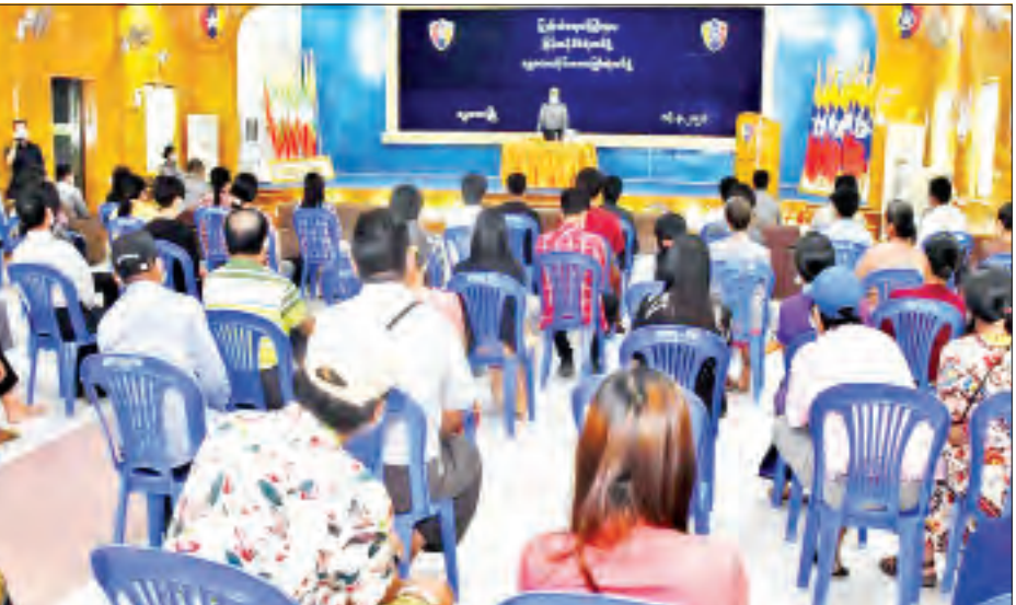
CDM လှုပ်ရှားမှုတွင် ပါဝင်ခဲ့မှုကြောင့် ယာယီထိန်းသိမ်းထားသည့် ကျောင်းသား ကျောင်းသူများကို မိဘအုပ်ထိန်းသူများထံသို့ ပြန်လည်လွှဲပြောင်းပေးအပ်

စေတီတော်မှ ရွှေဟောင်း(မိုက်ထုတ်)လုပ်ငန်းနှင့် အထွေထွေပြုပြင်ရေးကို နိုဝင်ဘာ ၁ ရက်မှ ၃၀ ရက်အထိလည်းကောင်း၊ ရွှေသင်္ကန်းနှင့် ရွှေစင်ရွှေသား ကပ်လှူရေးလုပ်ငန်းကို ၂၀၂၀ ပြည့်နှစ် ဒီဇင်ဘာ ၁ ရက်မှ ၂၀၂၁ ခုနှစ် ဇန်နဝါရီ ၃၁ ရက်အထိလည်းကောင်း၊ အရန်ကာလ အဖြစ် ဖေဖော်ဝါရီ ၁ ရက်မှ ၂၈ ရက်အထိလည်းကောင်း၊ ငြိမ်းဖျက်သိမ်းခြင်းလုပ်ငန်းကို မတ် ၁ ရက် မှ ၂၅ ရက်အထိလည်းကောင်း လျာထားသတ်မှတ်ထားရှိကြောင်း သိရသည်။ ဆုတောင်းပြည့် ရွှေမော်စောစေတီတော်မြတ်ကြီးအား လုံးတော်ပြည့်ရွှေသင်္ကန်းကပ်လှူပူဇော်ရာတွင် နှစ်လက်မပတ်လည်ရွှေဆိုင်းကြီး ၂၇၉၄၇ ဆိုင်းခန့် ကုန်ကျမည်ဖြစ်ပြီး ထီးတော်ဘုံငါးဆင့်တွင် ရွှေဆိုင်းကြီး ၁၀၀ ခန့်၊ ငှက်ပျောဖူးတော်တွင် ၁၃၈၄ ဆိုင်းခန့်၊ ကြာမောက်၊ ကြာလှန်၊ ရွဲနှင့် ဖောင်းတို့တွင် ၆၈၆၃ ဆိုင်းခန့်၊ ပန်းဆွဲ(သပိတ်မောက်)တွင် ၆၂၁၂ ဆိုင်းခန့်၊ ခါးတော်ပတ်တွင် ၁၆၃၇ ဆိုင်းခန့်၊ ခေါင်းလောင်းတော်တွင် ၆၃၅၈ ဆိုင်းခန့်၊ ဂျေတွင် ၁၄၀၉ ဆိုင်းခန့်၊ ကြေးဝန်းငါးဝန်းတွင် ၃၉၅၇ ဆိုင်းခန့်၊ ငြိမ်းပေါက်ဖာ ၂၇ ဆိုင်း စုစုပေါင်း ရွှေဆိုင်းကြီး ၂၇၉၄၇ ဆိုင်းခန့် ဆက်ကပ်လှူဒါန်းပူဇော်သွားမည်ဖြစ်သည့်အပြင် အရံစေတီတော် ၁၂၁ ဆူကိုလည်း ရွှေဆေးသင်္ကန်းဆက်ကပ်လှူဒါန်းပူဇော်သွားမည်ဖြစ်ကြောင်း သိရသည်။