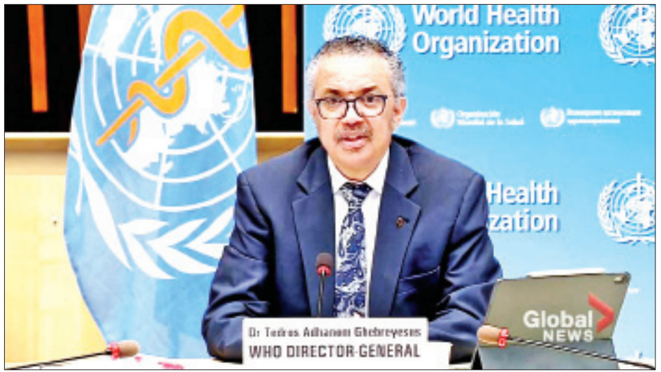
ရောဂါကာကွယ်ဆေးထိုးနှံပြီးသူ ၃၃၅ သန်းကျော် ဂါဘရီယီဆက်စ်က ပြောကြားခဲ့သည်။ ရှိပြီး ကာကွယ်ဆေးထိုးနှံမှုကြောင့် အသက်ဆုံးရှုံး ခဲ့သည့်ဖြစ်ရပ်မျိုး ဖြစ်ပေါ်လာခြင်းမရှိသေးကြောင်း ကိုးကား- အင်န်အိတ်ချ်ကေ ဘာသာပြန်- အောင်ကျော်ကျော်