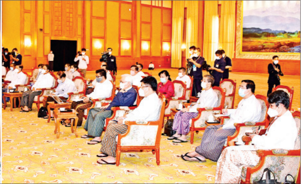
နိုင်ငံတော်စီမံအုပ်ချုပ်ရေးကောင်စီဥက္ကဋ္ဌ တပ်မတော်ကာကွယ်ရေးဦးစီးချုပ် ဗိုလ်ချုပ်မှူးကြီး မင်းအောင်လှိုင် ဖေဖော်ဝါရီ ၄ ရက်က မြန်မာနိုင်ငံဘဏ်များအသင်း နာယက၊ ဥက္ကဋ္ဌနှင့် တာဝန်ရှိသူများ၊ ပုဂ္ဂလိကဘဏ်များမှ ဥက္ကဋ္ဌများ၊ ဒုတိယဥက္ကဋ္ဌများ၊ တာဝန်ရှိသူများနှင့် တွေ့ဆုံဆွေးနွေးစဉ်။

တွေ့ရှိချက်များအရ ကနဦးဆန္ဒမဲလက်မှတ်ပေါင်း ၁၃၈၄၆၅၇၀ ရိုက်နှိပ်ခဲ့ပြီး လိုအပ်ချက်အရ ထပ်မံရိုက်နှိပ်ရိုက်နှိပ်ခဲ့ကြောင်း၊ ရန်ကုန်တိုင်းဒေသကြီးရွေးကော်မရှင်ကော်မရှင်အဖွဲ့ခွဲအနေဖြင့် အထွေထွေရွေးကော်မရှင် ကျင်းပရန် တစ်ရက်အလို ၂၀၂၀ ပြည့်နှစ် နိုဝင်ဘာလ ၇ ရက်နေ့တွင် နှစ်ကြိမ်ထပ်မံ မှာကြားချက်အရ ဆန္ဒမဲလက်မှတ် ရိုက်နှိပ်ခဲ့ကြောင်း တွေ့ရှိရတယ်လို့ စာရင်းဇယားများနဲ့ ဖော်ပြထုတ်ပြန်ခဲ့ပါတယ်။