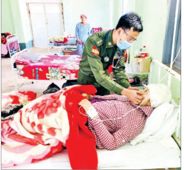
ရှမ်းပြည်နယ် (မြောက်ပိုင်း) မန်တိုပြည်သူ့ဆေးရုံတွင် တက်ရောက်ဆေးကုသလျက်ရှိသော ဒေသခံပြည်သူများအား တပ်မတော်ဆေးအဖွဲ့က ကျန်းမာရေးစောင့်ရှောက်မှုပေးစဉ်။

ဆောင်ရွက်ပေးနိုင်ခဲ့တာကို မြင်တွေ့ရပါတယ်။ ဖေဖော်ဝါရီလ ၁၃ ရက်နေ့စွဲဖြင့် ပို့ကုန်လုပ်ငန်းများမှ ကြိုတင်ကောက်ခံတဲ့ ဝင်ငွေခွန် ၂ ရာခိုင်နှုန်းကို ကိုဗစ်-၁၉ ကပ်ရောဂါကြောင့် လူမှုရေး၊ စီးပွားရေး