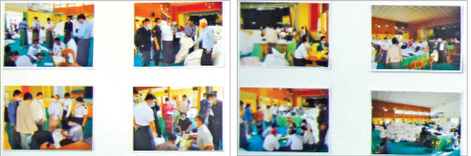
မန္တလေးတိုင်းဒေသကြီးမှ မဲလက်မှတ်များ မြေပြင်စစ်ဆေးမှု မှတ်တမ်းဓာတ်ပုံများ ပြသထားစဉ်။