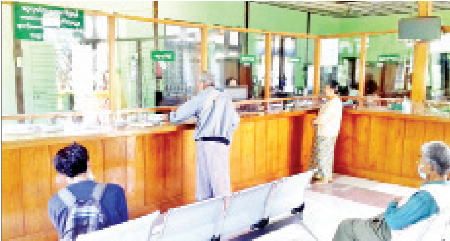
ပင်းတယမြို့နယ် မြန်မာ့စီးပွားရေးဘဏ်၌ အငြိမ်းစားဝန်ထမ်းများအား ဖေဖော်ဝါရီ ၂၂ ရက်က ပင်စင်လစာများထုတ်ပေးစဉ်။

ပျက်ကွက်နေကြတဲ့ နိုင်ငံဝန်ထမ်းများကိုလည်း လုပ်ငန်းခွင်များထဲ အမြန်ဆုံး ပြန်လည်ဝင်ရောက်ကြဖို့အတွက် အသိပေးကြေညာချက်များကို ဖေဖော်ဝါရီလဒုတိယပတ်မှစတင်ကာ ထုတ်ပြန်ခဲ့ပါတယ်။ ဝန်ထမ်းများ CDM လုပ်ရှားဆောင်ရွက်မှုနဲ့ပတ်သက်ပြီး စတင်ဆောင်ရွက်ရန် ပြောကြားဖြန့်ချိသူများကို ထိထိရောက်ရောက် အရေးယူဆောင်ရွက်သွားမည်ဖြစ်ကြောင်းနဲ့ CDM နှင့်ပတ်သက်ပြီး အွန်လိုင်းတွင် လှုံ့ဆော်နေတဲ့ အဖွဲ့များနဲ့ အဆိုပါအဖွဲ့များနောက်မှာ ပံ့ပိုးနေသူများ ရှိကြောင်း၊ ယင်းတို့နောက်မှာ ငွေကြေးစိုက်ထုတ်ပေးတဲ့ အဖွဲ့များရှိကြောင်း၊ မိမိတို့ကောင်စီအနေနဲ့ လုပ်ဆောင်ရန်ရှိသည်များကို ဥပဒေနဲ့အညီ ဆက်လက်ဆောင်ရွက်သွားမည်ဖြစ်ကြောင်း အပါအဝင် ရှေ့ဆက်ဆောင်ရွက်သွားမယ့် ကိစ္စရပ်များနဲ့ စပ်လျဉ်းပြီး နိုင်ငံတော်စီမံအုပ်ချုပ်ရေးကောင်စီဥက္ကဋ္ဌက လမ်းညွှန်စာမျက်နှာ ၉ သို့ ၁၃