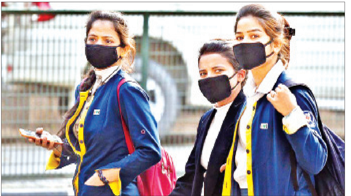
အိန္ဒိယနိုင်ငံအစိုးရ ကျန်းမာရေး ပန်ဂျပ်၊ ကာနာတာကာ၊ ဂျာဂရတ်နှင့် တစ်ရှိန်ထိုး တိုးတက်နေသည်ဟု ဖော်ပြ ဝန်ကြီးဌာန၏ မတ် ၁၂ ရက် ထုတ်ပြန် တစ်လီနာဒူးပြည်နယ်များ၌ ကိုဗစ်-၁၉ ကိုးကား - ဆင်ဟွာ ချက်အရ မဟာရက်စထရာ၊ ကောရာလာ၊ ရောဂါ နေ့စဉ် ကူးစက်မှုအသစ်များ ဘာသာပြန် - ဇော်ဝင်း

ကြောင်း ၎င်းက ပြောကြားသည်။ ထိုအပြင် ပြည်နယ်အတွင်းရှိ လူ့အဖွဲ့အစည်းနှင့် ပါတီရောသားများ၌ လည်း မတ် ၁၂ ရက်မှစ၍ ညမထွက်ရအမိန့်များ စတင် သက်ရောက်မည်ဖြစ်သည်။