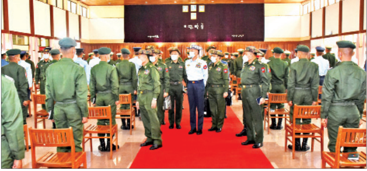
နိုင်ငံတော်စီမံအုပ်ချုပ်ရေးကောင်စီဒုတိယဥက္ကဋ္ဌ၊ ဒုတိယတပ်မတော်ကာကွယ်ရေးဦးစီးချုပ် ကာကွယ်ရေးဦးစီးချုပ်(ကြည်း) ဒုတိယဗိုလ်ချုပ်မှူးကြီး စိုးဝင်းနှင့် အဖွဲ့ဝင်များက ဗထူးတပ်နယ်ရှိ အရာရှိ၊ စစ်သည်၊ မိသားစုများ၊ သင်တန်းသား အရာရှိ၊ စစ်သည်၊ ဗိုလ်လောင်းများအား ရင်းရင်းနှီးနှီး လိုက်လံနှုတ်ဆက်စဉ်။

နိုင်ငံ့ဝန်ထမ်းများ CDM တွင် ပါဝင်လာစေရေး စည်းရုံးမှုမှစ၍ အကျပ်ကိုင်မှု၊ ခြိမ်းခြောက်မှု၊ ဖိအားပေးမှုအထိ ပြုလုပ်လာသည့်အတွက် ဆူပူအကြမ်းဖက်မှုများ မဖြစ်စေရေး ရာဇဝတ်ကျင့်ထုံး ဥပဒေပုဒ်မ ၁၄၄ ထုတ်ပြန်ခဲ့သည့်အခြေအနေများ၊ နိုင်ငံ့ဝန်ထမ်းများ နားယောင်မှု၊ ကြောက်ရွံ့မှုတို့ကြောင့် CDM တွင်ပါဝင်ခဲ့ခြင်းကြောင့် မိသားစုများအပါအဝင် လူမှုစီးပွားဘဝပျက်စီးဆုံးရှုံးမှုအခြေအနေများ၊ ငြိမ်းချမ်းစွာ ဆန္ဒဖော်ထုတ်မှုမှ အကြမ်းဖက်ဆူပူမှုအသွင်(Riot) ၎င်းမှ မင်းမဲ့စရိုက်ဆန်သော လူအုပ်စုဖြင့်အကြမ်းဖက်လာမှုသည် (Anarchy Mob) အသွင်ပြောင်းလဲလာမှုအခြေအနေများ၊ ဖွဲ့စည်းပုံအခြေခံဥပဒေပုဒ်မ ၃၆၊ ပုဒ်မ ၃၆၂ အရ ဘာသာ၊ သာသနာကိုးကွယ်မှုဆိုင်ရာများကို လွတ်လပ်စွာ ဆောင်ရွက်ခွင့်ပြုထားသော်လည်း မိမိတို့နိုင်ငံ ယဉ်ကျေးမှု၊