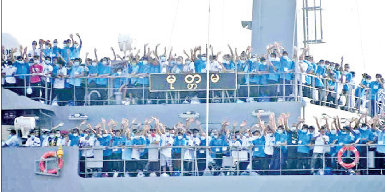
မလေးရှားနိုင်ငံတွင် ရောက်ရှိနေသော မြန်မာနိုင်ငံသားများအား ပြန်လည်ခေါ်ဆောင်လာသည့် တပ်မတော်မှစစ်ရေယာဉ်များ ရန်ကုန်မြို့ အမှတ် (၃) ရေတပ်ဆိပ်ကမ်းသို့ ဖေဖော်ဝါရီ ၂၇ ရက်က ပြန်လည်ရောက်ရှိစဉ်။

ရောဂါကာကွယ်ရေး စည်းကမ်းချက်များ နဲ့အညီ တပ်မတော်ကွာရန်တင်းစင်တာ များတွင် လက်ခံထားရှိပြီး နေရပ်အသီး သီးသို့ ပြန်လည်ရောက်ရှိစေဖို့နဲ့ အလုပ် အကိုင်အခွင့်အလမ်းများ ရရှိစေဖို့အတွက် ညှိနှိုင်းဆောင်ရွက်ပေးသွားမှာ ဖြစ်ပါတယ်။ နိုင်ငံတော်စီမံအုပ်ချုပ်ရေးကောင်စီ က လူမှုရေး ဦးတည်ချက်များကို အကောင်အထည်ဖော်ဆောင်ရွက်ရာမှာ လည်း နိုင်ငံတော်နှင့် တိုင်းရင်းသား ပြည်သူများအတွက် နေထူးနေထိုင်မှုများ ဖြစ်တဲ့ ဖေဖော်ဝါရီလ ၇ ရက်မှာ ကျရောက်တဲ့ (၇၄)နှစ်မြောက် ရှမ်းပြည် နယ်နေ့အခမ်းအနား၊ ဖေဖော်ဝါရီလ ၁၂ ရက်နေ့မှာ ကျရောက်တဲ့ (၇၄)နှစ် မြောက် ပြည်ထောင်စုနေ့အခမ်းအနား၊ ဖေဖော်ဝါရီလ ၂၀ ရက်နေ့မှာ ကျရောက်တဲ့ (၇၄)နှစ်မြောက် ချင်းအမျိုး သားနေ့အခမ်းအနားတွေကို သဝဏ်လွှာ များပေးပို့ခဲ့ပြီး တိုင်းရင်းသားပြည်သူ ညီအစ်ကိုမောင်နှမများအတွက် တစ်သား တည်းရှိနေကြောင်းကို ထုတ်ဖော်ပြသ ခဲ့ပါတယ်။