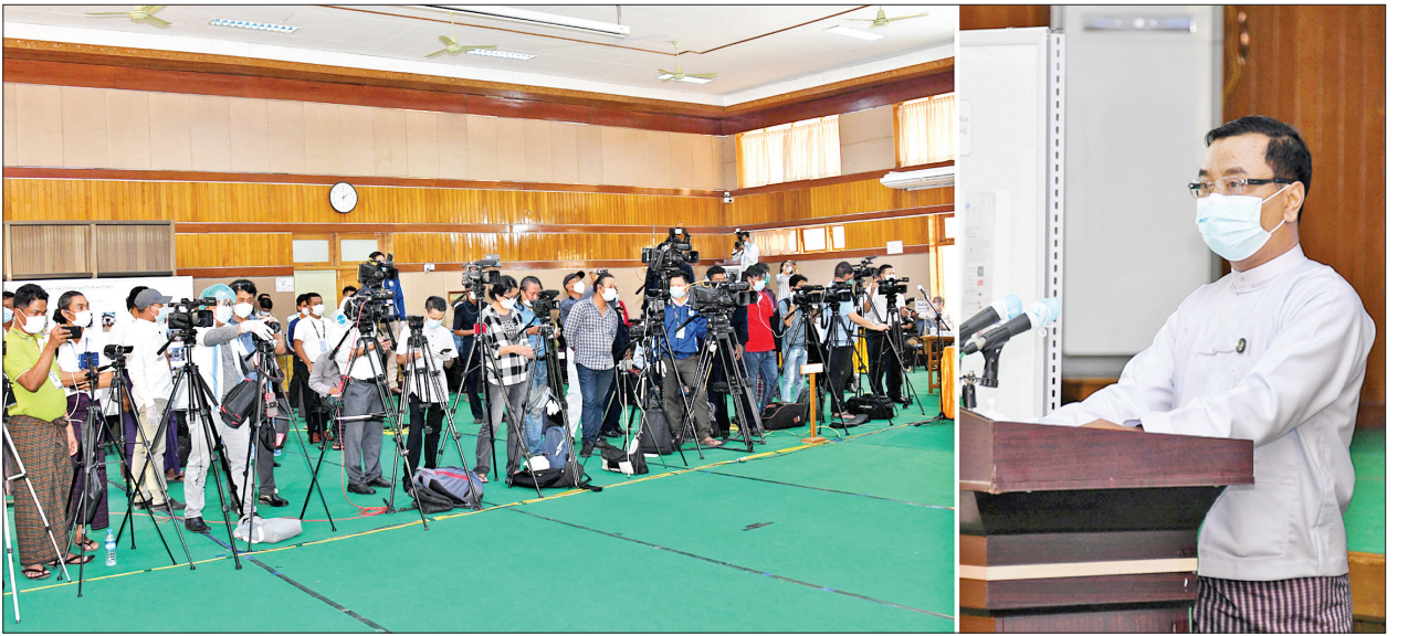
နိုင်ငံတော်စီမံအုပ်ချုပ်ရေးကောင်စီ၊ သတင်းထုတ်ပြန်ရေးအဖွဲ့ ခေါင်းဆောင် ဗိုလ်မှူးချုပ်ဇော်မင်းထွန်း သတင်းမီဒီယာများနှင့်တွေ့ဆုံ၍ သတင်းစာရှင်းလင်းပွဲပြုလုပ်စဉ်။