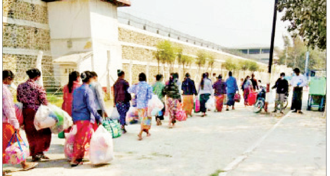
ဖေဖော်ဝါရီ ၁၂ ရက်က နိုင်ငံတော်စီမံအုပ်ချုပ်ရေးကောင်စီ၏ လွှတ်ငြိမ်းခွင့်အမိန့်ဖြင့် မန္တလေးမြို့ အောင်မြေသာစံမြို့နယ်ရှိ ဗဟိုအကျဉ်းထောင်(မန္တလေး)မှ လွတ်မြောက်သော အကျဉ်းသား အကျဉ်းသူများကို တွေ့ရစဉ်။

လူမှုရေးဦးတည်ချက်များအပေါ် အကောင်အထည်ဖော်ဆောင်ရွက်ပြည်သူများ လပေါင်းများစွာတောင့်တနေတဲ့ ဘုရားပုထိုးများ ဖူးမြော်ခွင့်ကို ပြန်လည်ခွင့်ပြုနိုင်ဖို့အတွက် ရွှေတိဂုံစေတီတော်မြတ်ကြီး၊ မဟာမုနိရုပ်ရှင်စာမျက်နှာ ၁၀ သို့ ★