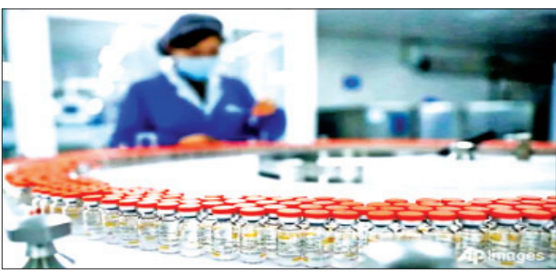
များက ပြောကြားခဲ့သည်။ နိုင်ငံအတွင်း လက်ရှိအသုံးပြု လျက်ရှိသည့် ကာကွယ်ဆေး လေးမျိုးမှာ နိုင်ငံပိုင်ဆေးဝါး ကုမ္ပဏီ Sinopharm မှ ထုတ်လုပ် သည့် ကိုဗစ်-၁၉ ရောဂါ ကာကွယ် ဆေးနှစ်မျိုးနှင့် Sinovac နှင့် CanSino ဆေးဝါးကုမ္ပဏီတို့မှ ထုတ်လုပ်သည့် ကိုဗစ်-၁၉ ရောဂါ

တရုတ်နိုင်ငံမှ နိုင်ငံရပ်ခြားသို့ လျှို့ဝှက်ပေးပို့သော ကာကွယ် ဆေးပမာဏသည် နိုင်ငံအတွင်း ကာကွယ်ဆေး ဖြန့်ဖြူးပေးမှု ပမာဏထက် ၁၀ ဆ နီးပါး ပိုမို များပြားသည်ကို တွေ့ရှိရကြောင်း ဆေးဘက်ကျွမ်းကျင် ပညာရှင်