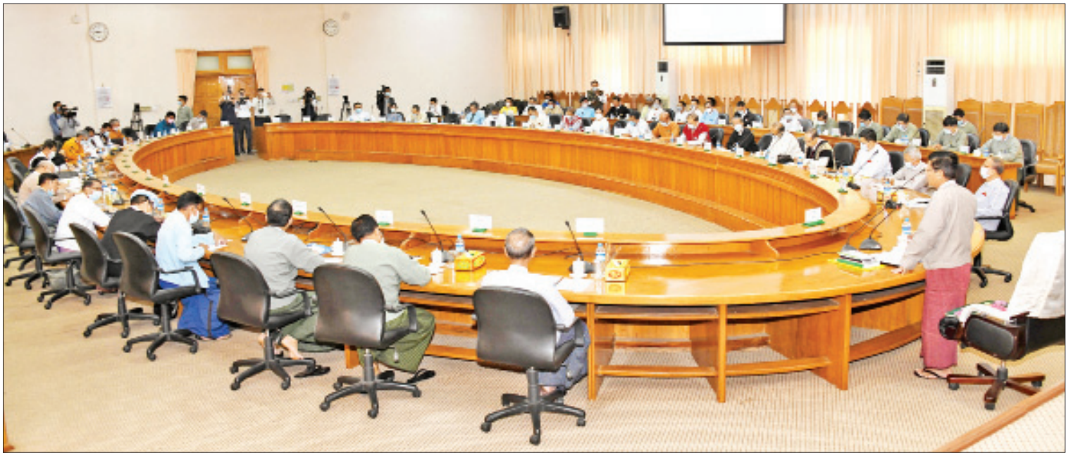
ပြည်ထောင်စုရေးကော်မတီကော်မရှင်ဥက္ကဋ္ဌ ဦးသိန်းစိုး ဖေဖော်ဝါရီ ၂၆ ရက်က ပြည်ထောင်စုရေးကော်မရှင်နှင့် နိုင်ငံရေးပါတီများ တွေ့ဆုံညှိနှိုင်းအစည်းအဝေးတွင် အမှာစကားပြောကြားစဉ်။

ပြည်သူများခရီးသွားလာမှုလွယ်ကူစေရေးမှာ ကိုဗစ်-၁၉ ရောဂါ ကူးစက်မှုကို ထိန်းချုပ်နိုင်စေမယ့် နည်းလမ်းများကို