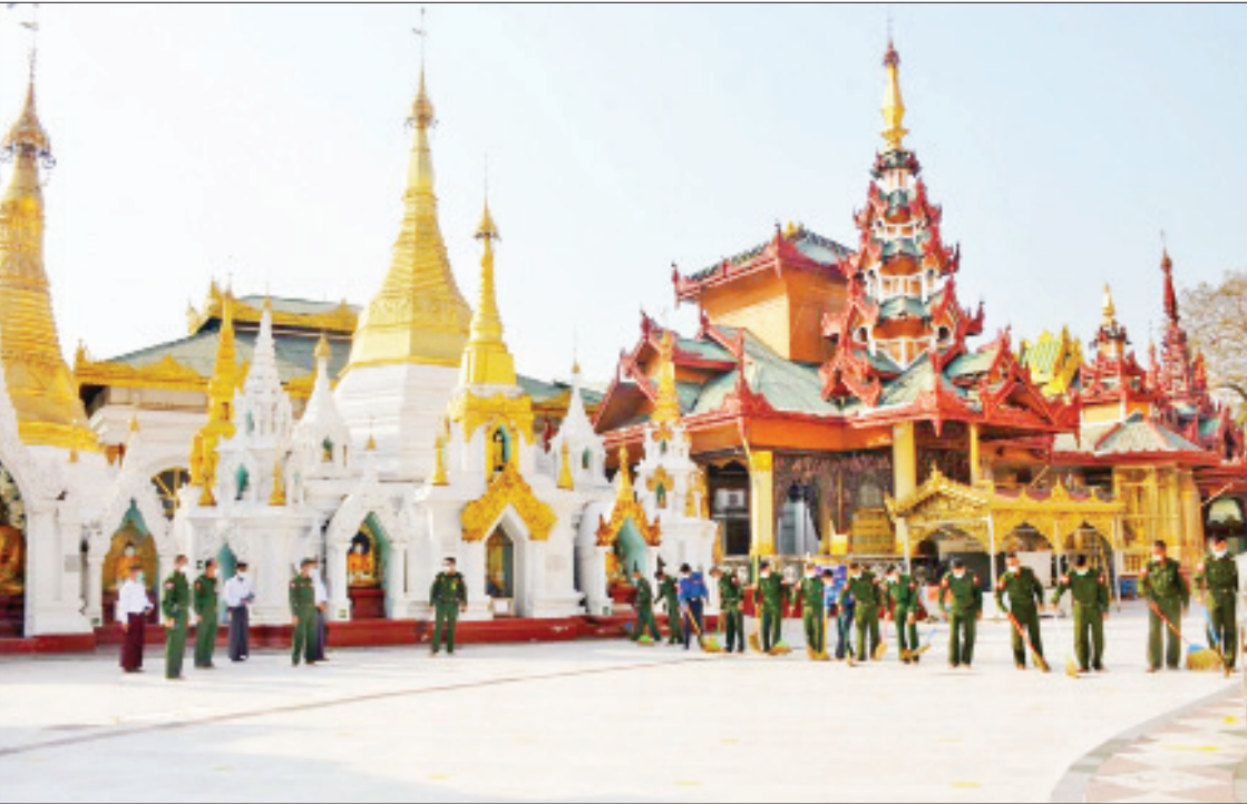
ရန်ကုန်တိုင်းဒေသကြီး ဒဂုံမြို့နယ်ရှိ ရွှေတိဂုံစေတီတော်မြတ်ကြီး၌ ရန်ကုန်တိုင်းစစ်ဌာနချုပ်ကွပ်ကဲမှုအောက် ရန်ကုန် တပ်နယ်မှ နယ်မြေခံတပ်မတော်သားများ စုပေါင်းသန့်ရှင်းရေးဆောင်ရွက်စဉ်။

တော်မြတ်ကြီး၊ ကျိုက်ထီးရိုးစေတီတော် မြတ်ကြီးနှင့် ပုဂံညောင်ဦး ရှေးဟောင်း ယဉ်ကျေးမှုနယ်မြေတို့ရှိ ဘုရားစေတီ၊ ပုထိုးများအပါအဝင် အနယ်နယ်အရပ်ရပ် မှာရှိတဲ့ ဘုရား၊ စေတီပုထိုးများကို ကိုဗစ်-၁၉ ရောဂါကာကွယ်ရေးစည်းကမ်း ချက်များနှင့်အညီ ပြန်လည်ဖွင့်လှစ်နိုင် ဖို့ ဒေသအသီးသီးမှာရှိတဲ့ နယ်မြေခံ တပ်ရင်းများမှ တပ်မတော်သားများက စုပေါင်းသန့်ရှင်းရေးများ ပြုလုပ်ပေးခဲ့ ကြပါတယ်။ ဖေဖော်ဝါရီလ ၈ ရက်နေ့ ကစပြီး ပြည်နယ်နှင့် တိုင်းဒေသကြီး အသီးသီးမှာရှိတဲ့ ဘုရား၊ စေတီပုထိုး များမှာ ရဟန်းရှင်လူပြည်သူများ သဒ္ဓါကြည်ညိုစွာ ဖူးမြော်ခွင့်ရရှိခဲ့ပြီဖြစ်ပါ တယ်။