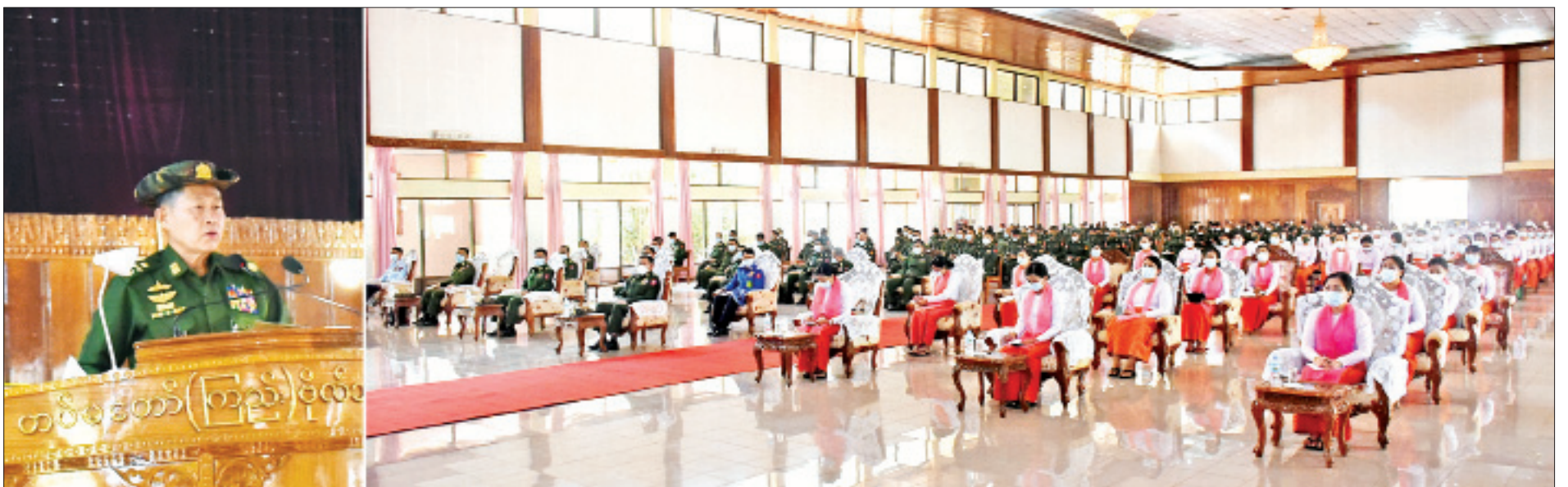
နိုင်ငံတော်စီမံအုပ်ချုပ်ရေးကောင်စီ ဒုတိယဥက္ကဋ္ဌ ဒုတိယတပ်မတော်ကာကွယ်ရေးဦးစီးချုပ် ကာကွယ်ရေးဦးစီးချုပ်(ကြည်း) ဒုတိယဗိုလ်ချုပ်မှူးကြီး စိုးဝင်း ဗထူးတပ်နယ်ရှိ အရာရှိ၊ စစ်သည်၊ မိသားစုများ၊ သင်တန်းသားအရာရှိ၊ စစ်သည်၊ ဗိုလ်လောင်းများအား တွေ့ဆုံ အမှာစကားပြောကြားစဉ်။

နေပြည်တော် မတ် ၁၃ နိုင်ငံတော်စီမံအုပ်ချုပ်ရေးကောင်စီ ဒုတိယဥက္ကဋ္ဌ ဒုတိယတပ်မတော် ကာကွယ်ရေးဦးစီးချုပ် ကာကွယ်ရေးဦးစီးချုပ်(ကြည်း) ဒုတိယဗိုလ်ချုပ် မှူးကြီး စိုးဝင်းသည် ယနေ့နံနက်ပိုင်းနှင့် မွန်းလွဲပိုင်းတို့တွင် ဗထူး တပ်နယ်နှင့် ပြင်ဦးလွင်တပ်နယ်တို့ရှိ သင်တန်းသား အရာရှိနှင့် ဗိုလ်လောင်းများ၊ သင်တန်းသားစစ်သည်များ၊ သန္ဓေစစ်သည်နှင့် မိသားစုများအား သီးခြားစီတွေ့ဆုံ အမှာစကားပြောကြား သည်။