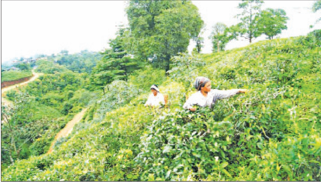
တီးတိန်မြို့နယ် ဆောင်းဒေါကျေးရွာရှိ လက်ဖက်စိုက်ခင်း

တီးတိန် မတ် ၁၀ ပင်လယ်ရေမျက်နှာပြင်အထက် ပေ ၄၀၀၀ အထက်တွင် စိုက်ပျိုးဖြစ်ထွန်းပြီး ချင်းတောင်လက်ဖက်ခြောက်ဟု ခေါ်သည့် တီးတိန်မြို့နယ် ဒေါလ်လွင်ကျေးရွာ အုပ်စုတွင်စိုက်ပျိုးသည့် လက်ဖက်ခင်းများမှ လက်ဖက်ခြောက်များ ယခုနှစ်ဆန်းပိုင်းမှစတင်၍ လှိုင်လှိုင်ထွက်ရှိပြီး ကလေး