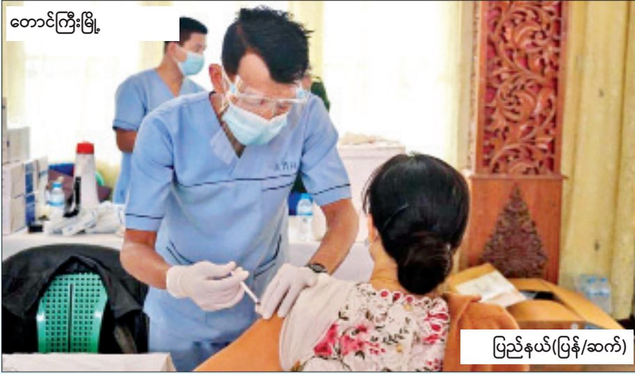
တောင်ကြီးမြို့