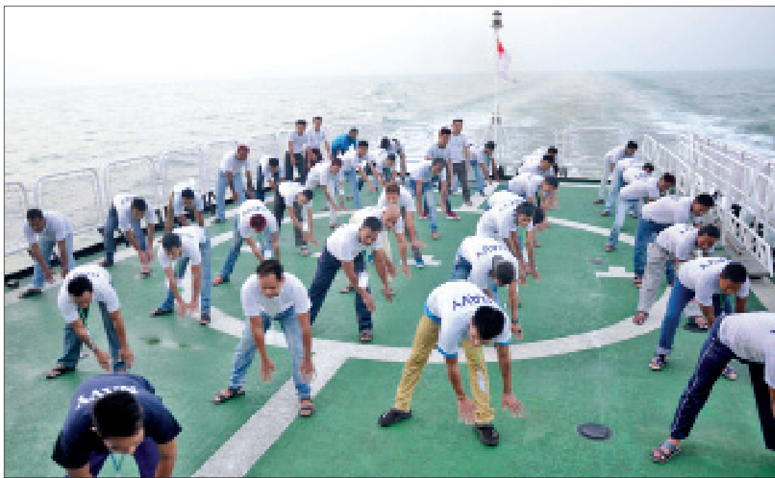
စစ်ရေယာဉ်(တပင်ရွှေထီး)ပေါ်တွင် နံနက်ပိုင်း ကျန်းမာရေးအတွက် ကာယလေ့ကျင့်ခန်းဆောင်ရွက်ပေးနေသည်ကို တွေ့ရစဉ်။

စစ်ရေယာဉ် (တပင်ရွှေထီး)ဖြင့် ခေါ်ဆောင်လာခဲ့သော မြန်မာနိုင်ငံသား များကို လမ်းခရီးတစ်လျှောက် လုံခြုံရေး ဆောင်ရွက်ပေးခြင်း၊ ကျန်းမာရေး အထောက်အကူပြုစေရန် ကိုယ်လက် လှေ့ကုန်ခန်းများ ဆောင်ရွက်ခြင်း၊ ရေယာဉ်ပေါ်တွင် လိုက်ပါတာဝန် ထမ်းဆောင်နေသည့် ဆရာဝန်နှင့် သူနာပြုများက ကျန်းမာရေးဆိုင်ရာ စောင့်ရှောက်မှုများ အနီးကပ်ဆောင်ရွက်