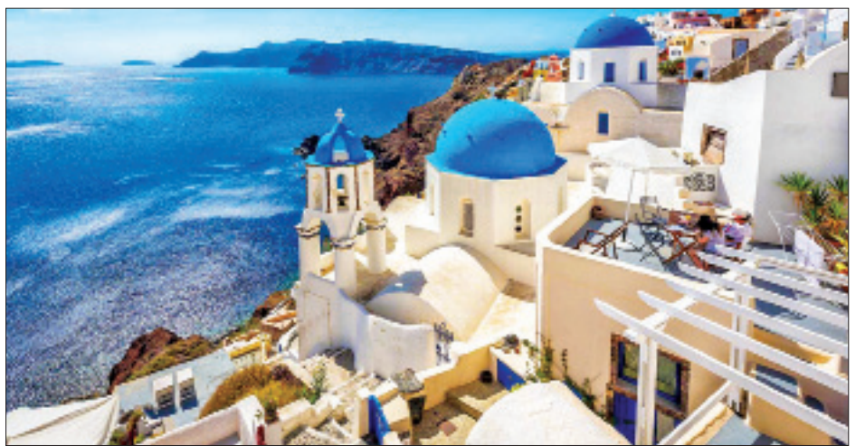
တိုးတက်ကောင်းမွန်မည်ဖြစ်သောကြောင့် ကမ္ဘာလှည့် ကြေညာခဲ့ခြင်းပင်ဖြစ်သည်ဟု နိုင်ငံရေးစောင့်ကြည့်ခရီးသွားများအား ပြည်ဝင်ခွင့်ပြုမည်ရက်ကို အခြား လေ့လာသူများကဆိုသည်။ ကိုးကား-အင်န်အိတ်ချ်ကေသော ဥရောပသမဂ္ဂနိုင်ငံများထက် ပိုမိုစောစီးစွာ ဘာသာပြန်-အောင်ကျော်ကျော်

စတင်ဝင်ရောက်ခွင့်ပြုသွားမည်ဖြစ်ကြောင်း ၎င်းက ဆက်လက်ပြောကြားခဲ့သည်။ ထို့ပြင် နိုင်ငံ၏ခရီးသွားလုပ်ငန်းတွင် လုပ်ကိုင်လျက်ရှိသော ဝန်ထမ်းများအား ကိုဗစ်-၁၉ ရောဂါကာကွယ်ဆေးကို ဦးစားပေးထိုးနှံပေးမည်ဖြစ်ကြောင်း ၎င်းက ဆိုသည်။ ဂရိပြည်သူများ မျှော်လင့်စောင့်စားလျက်ရှိသည့် နိုင်ငံ၏ခရီးသွားလုပ်ငန်း ပြန်လည်ကောင်းမွန်လာစေရန်ပင်ဖြစ်ကြောင်း ဝန်ကြီးဟာရီသီရီချာရစ်က ပြောကြားခဲ့သည်။ ဂရိနိုင်ငံသည် ဥရောပသမဂ္ဂအဖွဲ့ဝင်နိုင်ငံများအနက် ခရီးသွားများအား စတင်ဝင်ရောက်ခွင့်ပြုမည့် ရက်ကို ကြေညာခဲ့သည့် ပထမဆုံးနိုင်ငံပင်ဖြစ်သည်။ ဂရိနိုင်ငံသည် ခရီးသွားလုပ်ငန်းအပေါ် မှီခိုနေရသည့် နိုင်ငံဖြစ်သည့်အတွက် ခရီးသွားလုပ်ငန်းပြန်လည်ကောင်းမွန်မှုသာလျှင် နိုင်ငံ၏စီးပွားရေးအခြေအနေ