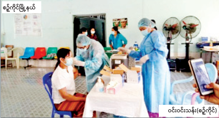
စဉ့်ကိုင်မြို့နယ်