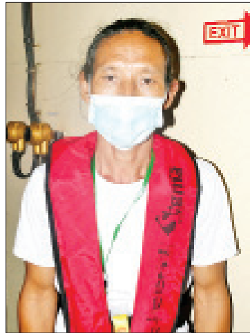
စောအယ်စိုး

နိုင်ငံတော်စီမံအုပ်ချုပ်ရေးကောင်စီ ဥက္ကဋ္ဌ၊ တပ်မတော်ကာကွယ်ရေး ဦးစီးချုပ် ဗိုလ်ချုပ်မှူးကြီး မင်းအောင်လှိုင်၏ လမ်းညွှန်မှာကြားချက်နှင့်အညီ မြန်မာနိုင်ငံသို့ ပြန်လာရန် အခက်အခဲကြုံတွေ့နေရသည့် နိုင်ငံသားများအား တပ်မတော် (ရေ) စစ်ရေယာဉ် တပ်စွဲထီးဖြင့် အိန္ဒိယနိုင်ငံ အန်ဒမန်ကျွန်းမှ သွားရောက် ခေါ်ဆောင်ခဲ့ရာ မတ်လ ၁၀ ရက် မွန်းလွဲပိုင်းတွင် ရန်ကုန်တိုင်းဒေသကြီး သန်လျင် မြို့နယ် အမှတ်(၃) ရေတပ်ဆိပ်ခံတံတား (သီလဝါ)သို့ ရောက်ရှိသည်။