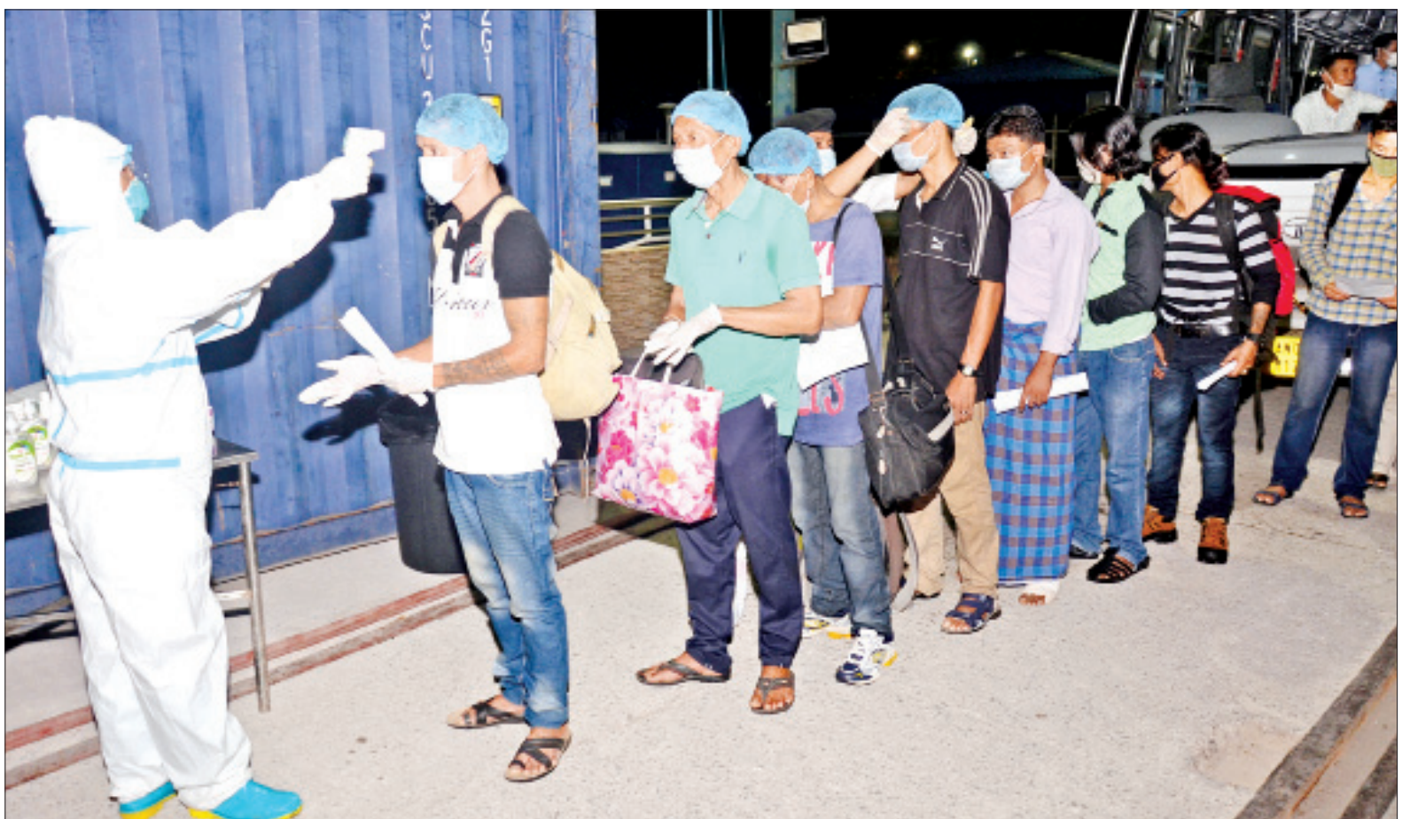
အိန္ဒိယနိုင်ငံတွင် ရောက်ရှိနေသော မြန်မာနိုင်ငံသား ရေလုပ်သားများအား စစ်ရေယာဉ်(တပင်ရွှေထီး)ပေါ်မတက်မီ ကိုယ်အပူချိန်တိုင်းတာခြင်း ဆောင်ရွက်နေစဉ်။

စစ်ရေယာဉ် (တပင်ရွှေထီး) သည် အိန္ဒိယနိုင်ငံ အန်ဒမန်ကျွန်းရှိ ပို့ဘလဲယား (Port Blair) ဆိပ်ကမ်းသို့ မတ် ၇ ရက် မွန်းလွဲပိုင်းတွင် ရောက်ရှိခဲ့ပြီး မတ် ၈ ရက်တွင် မြန်မာနိုင်ငံသား စာမျက်နှာ ၇ ကော်လံ ၁ သို့ ☐