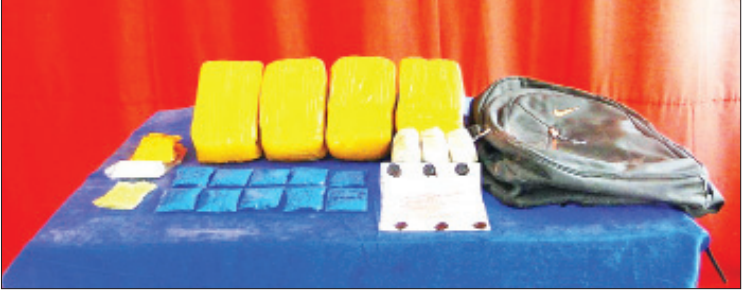
သိမ်းဆည်းရမိသည့် စိတ်ကြွရှူးသွပ်ဆေးပြားများကို တွေ့ရစဉ်။