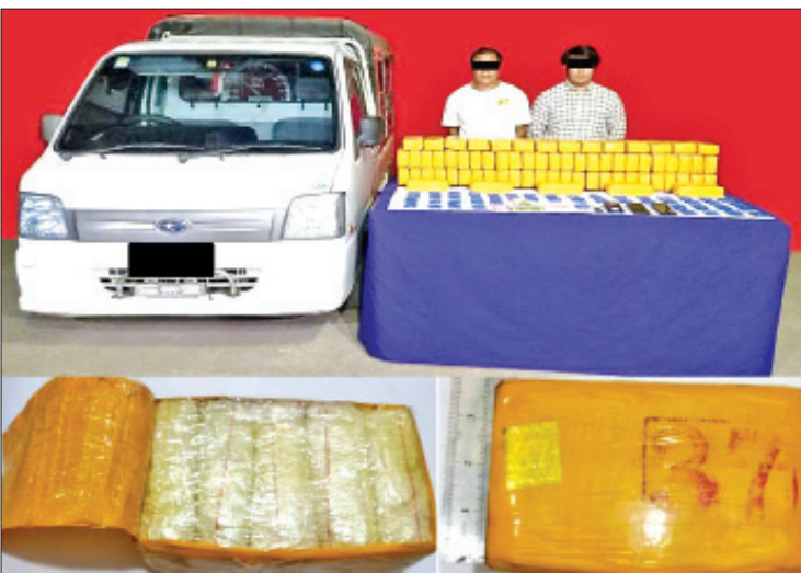
ပြစ်မှုကျူးလွန်သူများအား သိမ်းဆည်းရမိသည့် စိတ်ကြွရှူးသွပ်ဆေးပြားများ နှင့်အတူ တွေ့ရစဉ်။