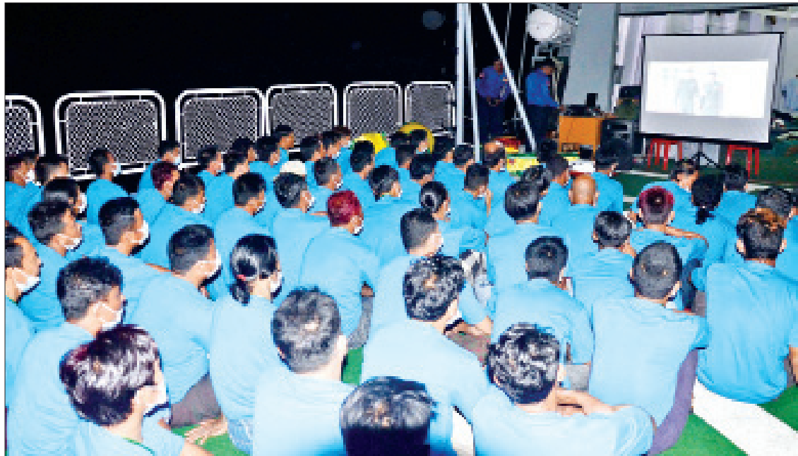
စစ်ရေယာဉ်(တပင်ရွှေထီး)ပေါ်တွင် ဖျော်ဖြေရေးများဖြင့် ဧည့်ခံဖျော်ဖြေနေသည်ကိုတွေ့ရစဉ်။

တွေ့ဆုံမေးမြန်း လင်းလတ်