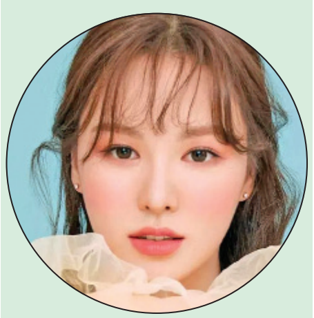
အေးပြည့် ရေးသားသည်

ဝင်ဒီဟာ ၂၀၁၉ ခုနှစ်အတွင်း ဖျော်ဖြေရင်း ထိခိုက်ဒဏ်ရာရခဲ့ပြီးနောက်ပိုင်း တေးဂီတ လှုပ်ရှားမှုတွေ ရပ်နားထားတာ ဖြစ်ပါတယ်။ လတ်တလောမှာမှ တစ်ကိုယ်တော်တေးသံရှင် တစ်ဦးအဖြစ် ပြန်လည်လှုပ်ရှားဖို့ စီစဉ်ခဲ့တာဖြစ်ပြီး သူဟာ Red Velvet အဖွဲ့ဝင်တွေအနက် တစ်ကိုယ် တော် တေးအယ်လ်ဘမ်ထုတ်လွှင့်တဲ့ ပထမဆုံး သော အဖွဲ့ဝင်ဖြစ်လာမှာလည်း ဖြစ်ပါတယ်။