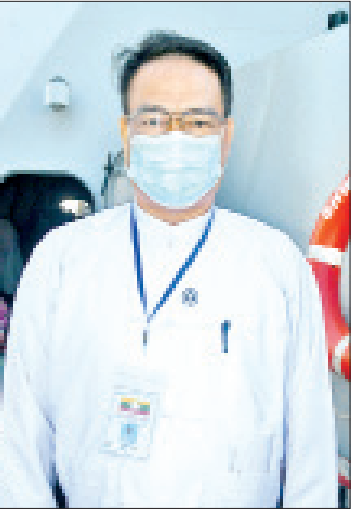
ဦးမျိုးနိုင်

ဒုတိယဗိုလ်မှူးကြီးဟန်စိုး (စစ်ရေယာဉ်မှူး၊ စစ်ရေယာဉ်တပင်ရွှေထီး) အိန္ဒိယနိုင်ငံမှာ ရောက်ရှိနေတဲ့ မြန်မာနိုင်ငံသားများကို ပြန်လည်ခေါ်ဆောင်ဖို့အတွက် တပ်မတော်(ရေ) အနေနဲ့ စီစဉ်တဲ့အခါမှာ စစ်ရေယာဉ်နဲ့ စက်မကြီးများဆိုင်ရာအပြင် ပြန်လည်ခေါ်ဆောင်ရေးကိစ္စရပ်များကိုပါ တစ်ပါတည်း စီစဉ်ဆောင်ရွက်ခဲ့ပါတယ်။ ရေယာဉ် သန်ရှင်းသပ်ရပ်မှုရှိစေရေး၊ စက်မကြီးများနဲ့ မီးစက်ကြီးများကောင်းမွန်မှုရှိစေရေးတို့ကို ပြင်ဆင်ခဲ့ပါတယ်။ ဒါ့အပြင် နေရပ်ပြန်များ ထားရှိရေးအတွက် အခန်းများ ပြင်ဆင်ဖို့ စည်းခြင်း၊ အိပ်ရာနေရာ ထိုင်ခင်းများ ခင်းကျင်းပြင်ဆင်ခြင်း၊ စားသောက်ရေးအတွက် ပြင်ဆင်ခြင်းလုပ်ငန်းများကို ဆောင်ရွက်ခဲ့ပါတယ်။ ကျန်းမာရေးစောင့်ရှောက်မှုအနေနဲ့ ဆေးတပ်ဖွဲ့များ စနစ်တကျ ဖွဲ့စည်းခြင်း၊ လုံခြုံရေးတပ်ဖွဲ့များ စနစ်တကျ ဖွဲ့စည်းခြင်းတို့ကိုလည်း ဆောင်ရွက်ခဲ့ပါတယ်။ စားသောက်ရေးအတွက်ကိုလည်း နံနက်စာ၊ နေ့လယ်စာ၊ ညစာများကို အချိန်မှန်စားသုံးနိုင်ရေး၊ သန့်ရှင်းလတ်ဆတ်စွာ စားသုံးနိုင်ရေးအတွက် စနစ်တကျ စီစဉ်ဆောင်ရွက်ပေးထားပါတယ်။ နေရပ်ပြန်တွေက ဧရာဝတီတိုင်းဒေသကြီးက ၄၉ ဦး၊ ရန်ကုန်တိုင်းဒေသကြီးက တစ်ဦး၊ တနင်္သာရီတိုင်းဒေသကြီးက တစ်ဦး၊ ရခိုင်ပြည်နယ်က ၁၅ ဦး၊ မွန်ပြည်နယ်က ၄ ဦး စုစုပေါင်း ၇၀ ဖြစ်ပါတယ်။ တပ်မတော်(ရေ)မှာ လူသားချင်းစာနာ ကူညီပေးရေးလုပ်ငန်းကို ဆောင်ရွက်ရတဲ့ တာဝန်ရှိပါတယ်။ လူသားချင်းစာနာ အကူအညီပေးရေးဆိုတဲ့ နေရာမှာ သဘာဝဘေးအန္တရာယ်ဖြစ်တဲ့ လေပြင်းမုန်တိုင်းတိုက်ခတ်ခြင်း၊ ရေကြီးခြင်း၊ ဆူနာမီဖြစ်ပေါ်ခြင်း စတဲ့ သဘာဝ