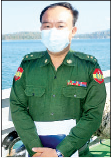
ဗိုလ်ကြီးဇေယျာမင်း