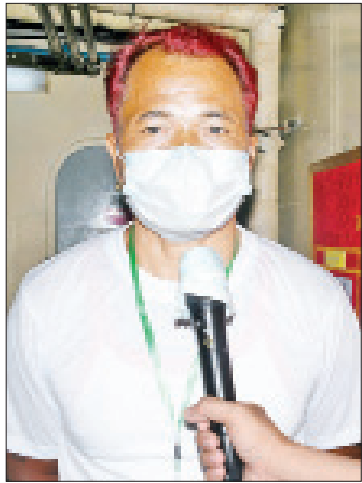
ဦးစိုးလွင်