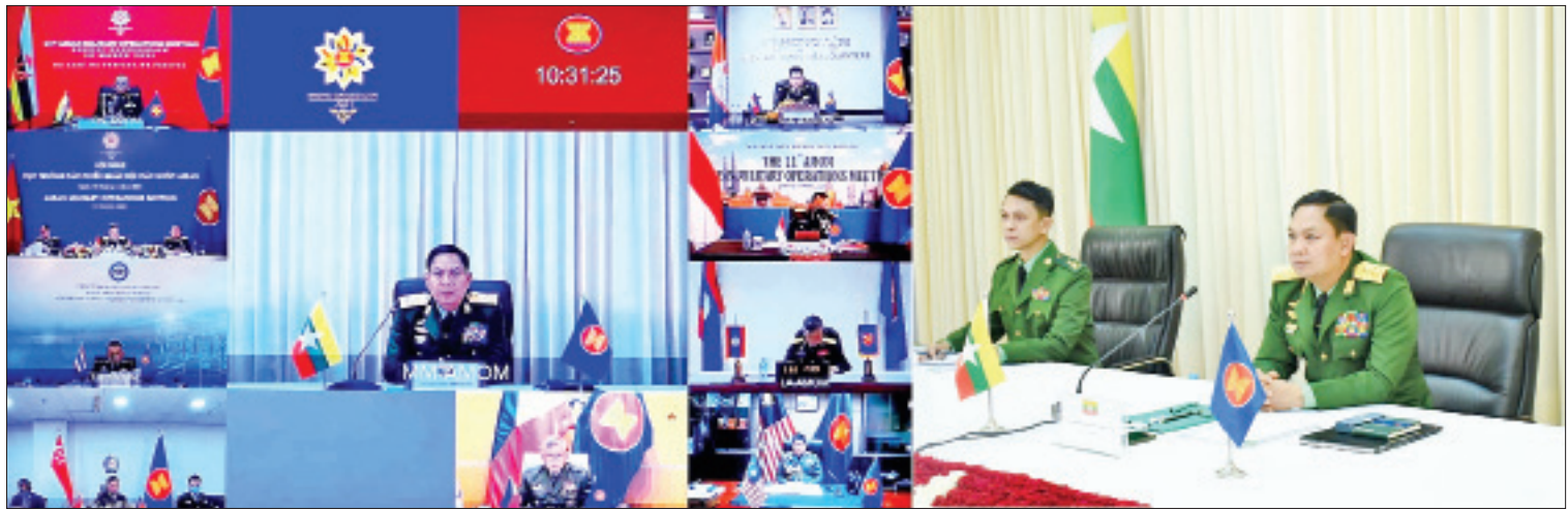
(၁၁)ကြိမ်မြောက် အာဆီယံတပ်မတော် စစ်ဆင်ရေးမှူးချုပ်များ အစည်းအဝေး 11 th ASEAN Military Operation Meeting (11 th AMOM) ကျင်းပစဉ်။

ရေဖုံးမှ ထို့နောက် “စစ်ဘက်ဆိုင်ရာ စုစည်း ပူးပေါင်းဆောင်ရွက်ရေးအတွက် ဂရုပြု ပြင်ဆင်၊ အောင်ပွဲဝင် (We Care, We Prepare, We Prosper towards an Integrated ASEAN Military Cooperation)” အပေါ် အမြင်များအား နိုင်ငံအလိုက် အလှည့်ကျဆွေးနွေးကြ သည်။ ဆက်လက်၍ အာဆီယံတပ်မတော် များ၏ နှစ်နှစ်လုပ်ငန်း စီမံချက်အား ဆွေးနွေးအတည်ပြုခြင်း အပါအဝင် အခြားကိစ္စရပ်များအား ဆွေးနွေးကြ သည်။