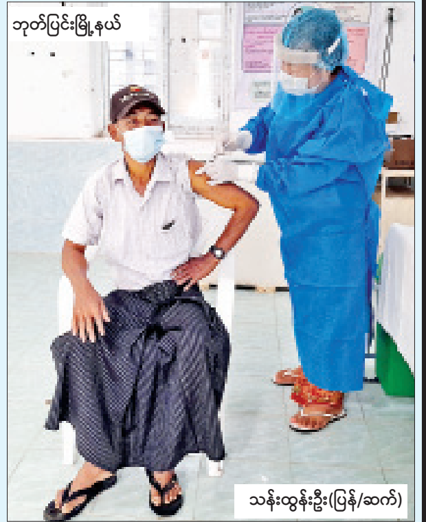
ဘုတ်ပြင်းမြို့နယ်