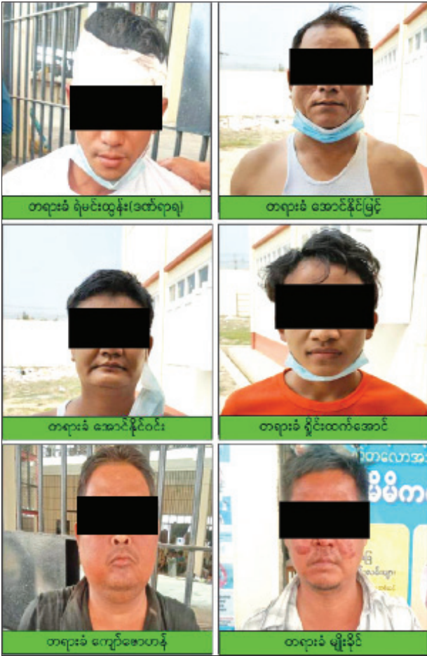
ချမ်းမြသာစည်မြို့နယ်၌ လူစုလူဝေးဖြစ်ပွားမှုအား ရှင်းလင်းစဉ် ဖမ်းဆီးရမိသည့် တရားခံများ၏ မှတ်တမ်းဓာတ်ပုံ။ များ၊ အလံများ၊ ခိုင်းများ၊ အခြားပစ္စည်းများနှင့်အတူ တွေ့ရှိခဲ့ရသည်။ ဖြစ်စဉ်တွင် ပါဝင်ပတ်သက်သူများအား ဖော်ထုတ်ဖမ်းဆီးနိုင်ရေးနှင့် သေဆုံးသူအား သေမှုသေခင်း ဖွင့်လှစ်ဆောင်ရွက်လျက်ရှိကြောင်း သတင်းရရှိသည်။

ထို့နောက် ၎င်းတို့ တားဆီးပိတ်ဆို့ထားသည့် အတားအဆီးများအား လုံခြုံရေးတပ်ဖွဲ့ဝင်များက ဆက်လက်ရှင်းလင်းလျက်ရှိစဉ် Hilux အမျိုးအစား အဖြူရောင် မော်တော်ယာဉ်ပေါ်မှ ဆူပူအုံကြွမိဖက်သူများက လေးဂွများ၊ ဂျင်ကလိများ၊ လေသေနတ်များဖြင့် ပစ်ခတ်၍ အရှိန်ပြင်းစွာ မောင်းနှင်ထွက်ပြေးသွားခဲ့သည်။ ယင်းသို့ ပစ်ခတ်ထွက်ပြေးသွားခဲ့သောကြောင့် လုံခြုံရေးတပ်ဖွဲ့ဝင်များက လိုက်လံပိတ်ဆို့ဖမ်းဆီးခဲ့ရာ ချမ်းမြသာစည်မြို့နယ် ၁၀၇ လမ်းအနီးရှိ ချုံပုတ်အနီးတွင် အဆိုပါမော်တော်ယာဉ်အား တွေ့ရှိရပြီး မော်တော်ယာဉ်အနီး၌ ထိုးသွင်းဒဏ်ရာဖြင့်သေဆုံးပြီဟု ယူဆရသည့်စစ်ဆေးမှုအမျိုးသားအလောင်းတစ်လောင်းကို လေးဂွတစ်လက်၊ ကုန်းသီးများ၊ ဖန်ဂေါလီ