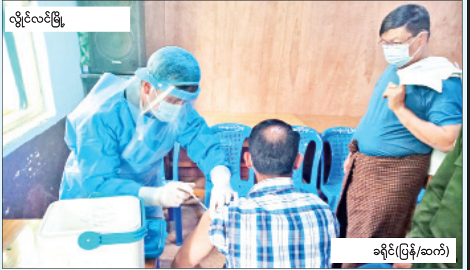
လွိုင်လင်မြို့