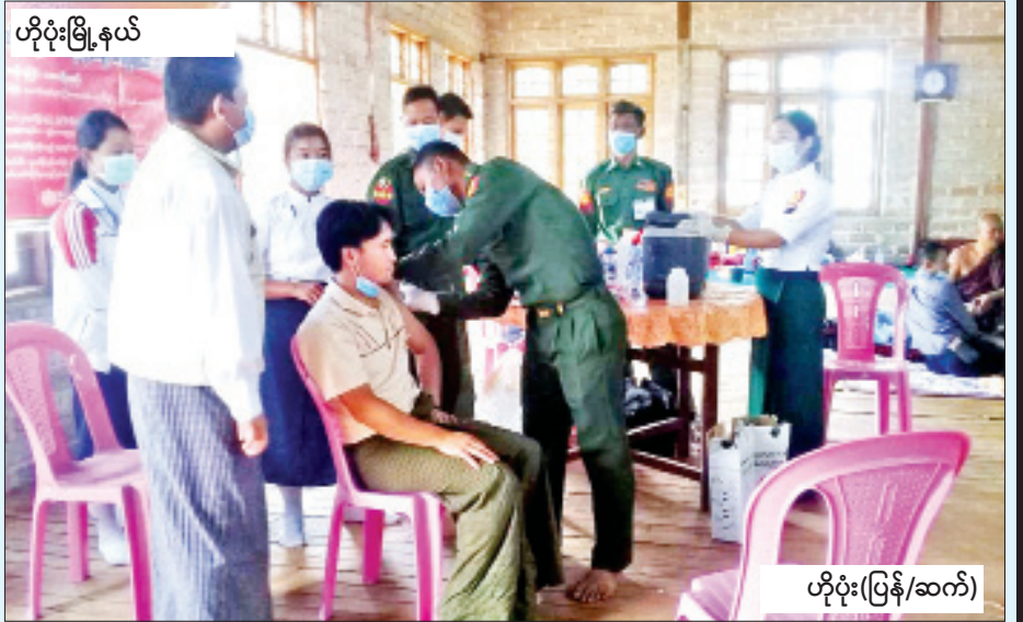
ဟိုပုံးမြို့နယ်