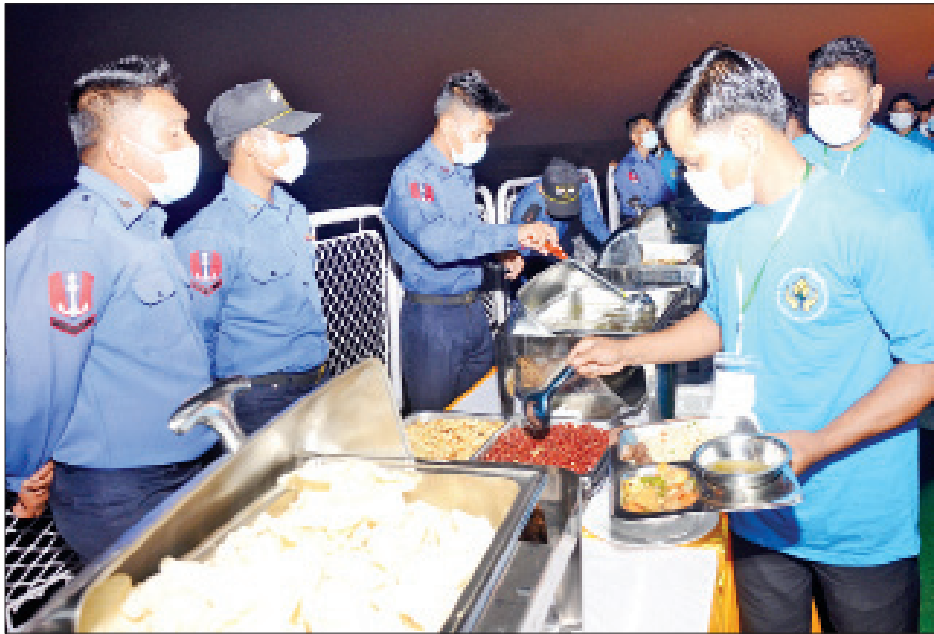
စစ်ရေယာဉ်(တပင်ရွှေထီး)ပေါ်တွင် မြန်မာ့အစားအစာများဖြင့် ကျွေးမွေးဧည့်ခံနေသည်ကို တွေ့ရစဉ်။