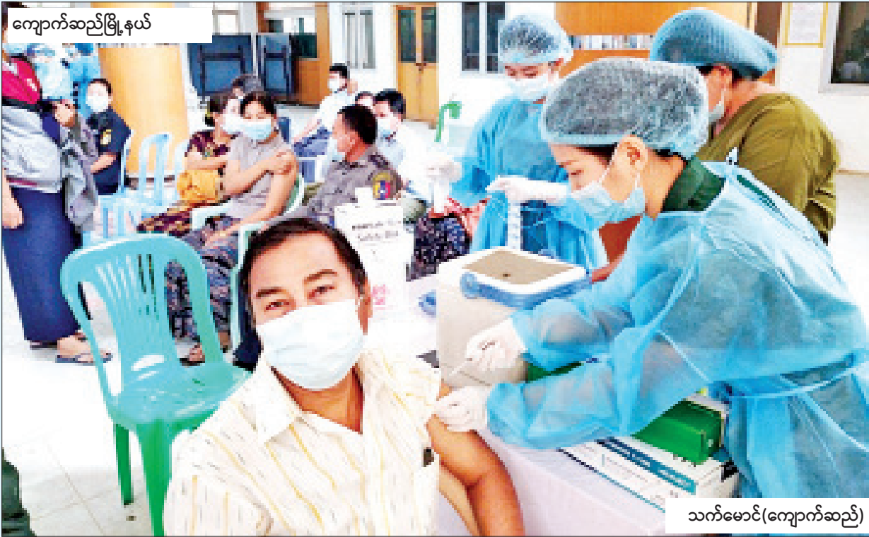
ကျောက်ဆည်မြို့နယ်