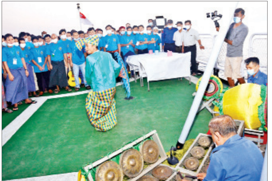
စစ်ရေယာဉ်(တပင်ရွှေထီး)ပေါ်တွင် ဖျော်ဖြေရေးများဖြင့် ဧည့်ခံဖျော်ဖြေနေသည်ကို တွေ့ရစဉ်။