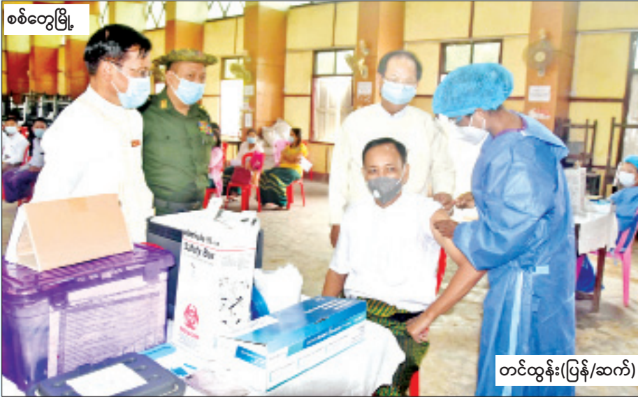
စစ်တွေမြို့