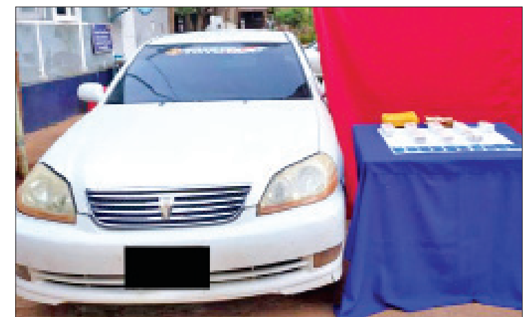
သိမ်းဆည်းရမိသည့် စိတ်ကြွေးသွပ်ဆေးပြားများအား တွေ့ရစဉ်။

လမ်း၌ စစ်ဆေးရေးဆောင်ရွက်နေစဉ် MARK-II အမျိုးအစား ယာဉ်တစ်စီးသည် ကိုက် ၁၅၀ ခန့်အကွာမှ နောက်ပြန်လှည့်၍ မောင်းနှင်ထွက်ပြေးသွားသဖြင့် လိုက်လံဖမ်းဆီးရာ လွယ်ပွတ်ကျေးရွာအနီးအရောက်တွင် အဆိုပါယာဉ်ပေါ်မှ အမျိုးသားနှစ်ဦး (စိစစ်ဆဲ)သည် ယာဉ်အားရပ်တန့်၍ လမ်းဘေးတောအုပ်စုအတွင်းသို့ ထွက်ပြေးသွားသောကြောင့် ပူးပေါင်းအဖွဲ့က ယာဉ်အား စစ်ဆေးရှာဖွေရာ ယာဉ်ပေါ်မှ စိတ်ကြွေးသွပ်ဆေးပြား ၁၈၀၀၀ သိမ်းဆည်းရမိခဲ့သဖြင့် ၎င်းတို့အား မူးယစ်ဆေးဝါးနှင့်စိတ်ကို ပြောင်းလဲစေသော ဆေးဝါးများဆိုင်ရာဥပဒေအရ အရေးယူထားကြောင်း သိရသည်။