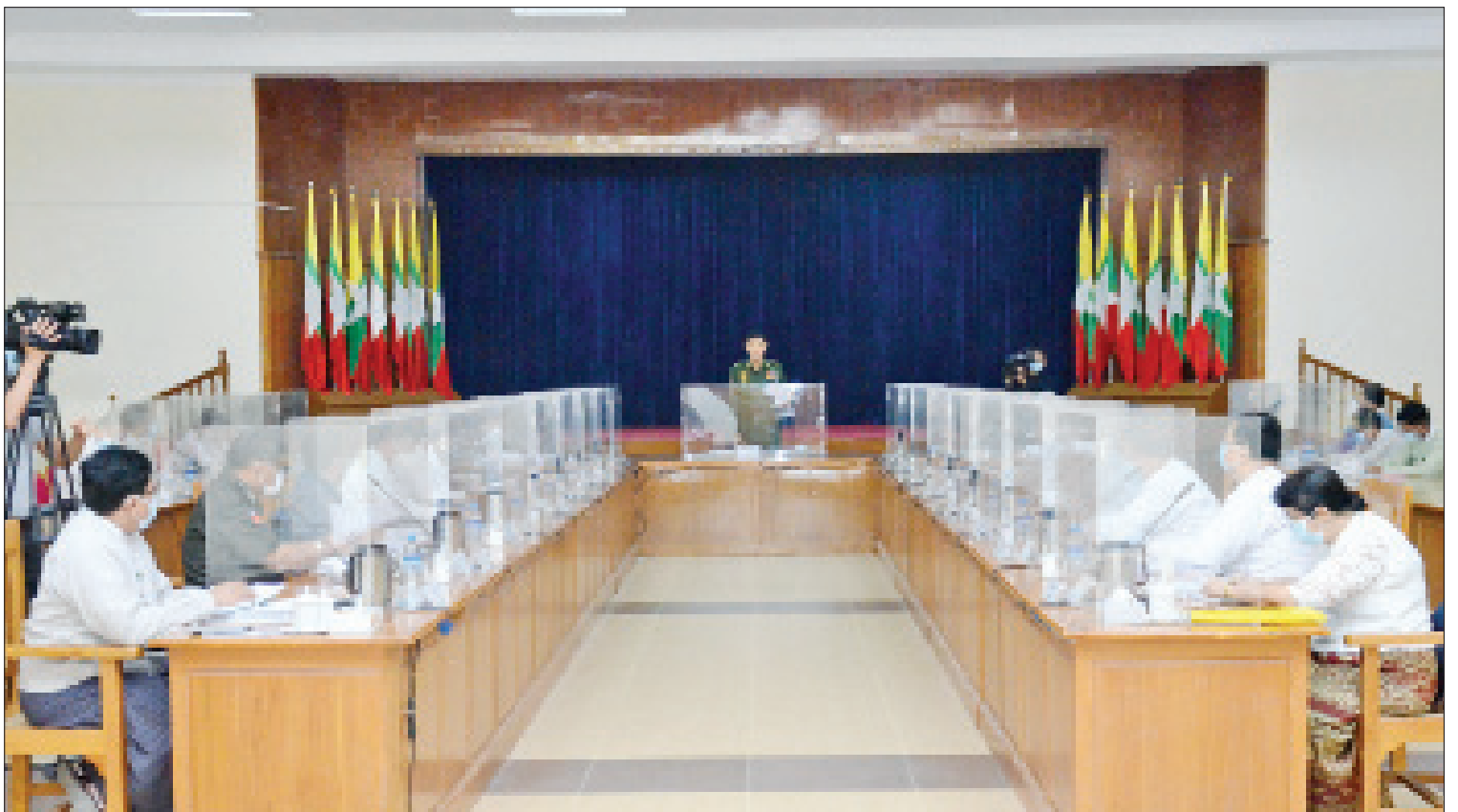
နိုင်ငံတော်စီမံအုပ်ချုပ်ရေးကောင်စီအဖွဲ့ဝင်၊ ကာကွယ်ရေးဝန်ကြီးဌာန ပြည်ထောင်စုဝန်ကြီး ဗိုလ်ချုပ်ကြီး မြထွန်းဦး တိုင်းရင်းသားရေးရာ၊ ပြည်သူ့ရေးရာစီမံခန့်ခွဲမှုနှင့် ဝန်ဆောင်မှုရေးရာကော်မတီ လုပ်ငန်းညှိနှိုင်းအစည်းအဝေး (၂/၂၀၂၁)တွင် အမှာစကားပြောကြားစဉ်။

အစည်းအဝေးတွင် တိုင်းရင်းသား ရေးရာ၊ ပြည်သူ့ရေးရာစီမံခန့်ခွဲမှုနှင့် ဝန်ဆောင်မှုရေးရာ ကော်မတီဥက္ကဋ္ဌ၊ ပြည်ထောင်စုဝန်ကြီး ဗိုလ်ချုပ်ကြီး မြထွန်းဦးက နိုင်ငံတော်စီမံအုပ်ချုပ်ရေး ကောင်စီအနေဖြင့် နိုင်ငံတော်ဖွံ့ဖြိုး တိုးတက်ရေးအတွက် ဦးတည်ချက် ၉ ရပ် ချမှတ်ဆောင်ရွက်လျက် ရှိကြောင်း၊ အဆိုပါ ဦးတည်ချက်များအနက် စစ်မှန်၍ စာမျက်နှာ ၃ ကော်လံ ၁ သို့ ၁၆