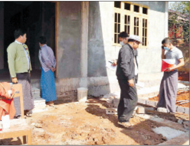
မွေးမြူရေးနှင့်ကုသရေးဦးစီးဌာနရုံး အဆောက်အအုံသစ်ဆောက်လုပ်မှု ၇၅ ရာခိုင်နှုန်းပြီးစီး