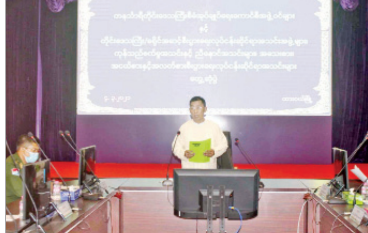
တာဝန်ရှိသူများ၊ တိုင်းဒေသကြီး/ခရိုင် အဖွဲ့များ တက်ရောက်ခဲ့ကြောင်း သိရ စီးပွားရေးလုပ်ငန်းရှင်များနှင့် အသင်း သည်။ တိုင်းဒေသကြီး(ပြန်/ဆက်)

တွင် တွေ့ကြုံရသော အခက်အခဲများကို တင်ပြပေးစေလိုကြောင်း ပြောကြားသည်။ ထို့နောက် တက်ရောက်လာသော စီးပွားရေးလုပ်ငန်းရှင်အသင်းအဖွဲ့များ က လက်ရှိဆောင်ရွက်နေသော စီးပွားရေး လုပ်ငန်းအခြေအနေများနှင့် တွေ့ကြုံရ သော အခက်အခဲများကို ရှင်းလင်းတင်ပြ ရာ တာဝန်ရှိသူများက လိုအပ်သည်များကို ဖြည့်စွက်ဆွေးနွေးပြီး တနင်္သာရီတိုင်း ဒေသကြီး စီမံအုပ်ချုပ်ရေးကောင်စီဥက္ကဋ္ဌ ဦးတင်အောင်က ပေါင်းစပ်ညှိနှိုင်း ဆောင်ရွက်ပေးခဲ့သည်။ အခမ်းအနားသို့ တနင်္သာရီတိုင်း ဒေသကြီးစီမံအုပ်ချုပ်ရေးကောင်စီဥက္ကဋ္ဌ ဦးတင်အောင်နှင့်အဖွဲ့ဝင်များ၊ ဌာနဆိုင်ရာ