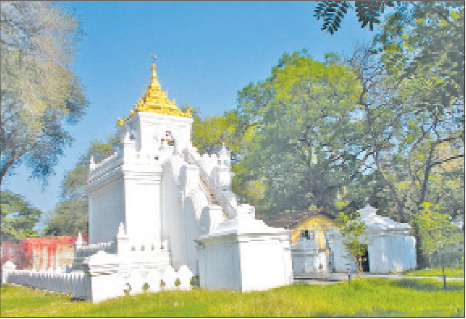
ကြောင်း သိရသည်။ ရတနာပုံခေတ်လက်ရာ မျက်နှာပြုကာ မုခ်ဦးလှေကားတို့ဖြင့် တင့်တယ်စွာ တည်ရှိသည်။ ရွေးတော်ယူတံခါးတောင်ဘက်တွင် အနောက် အဆောက်အအုံ စွယ်တော်စင်ကို နန်းမြို့အတွင်း တည်ရှိသည်။ နေ့နီ(မြစ်ငယ်)

စွယ်တော်စင်မှာ ဆန်းသစ်သောရတနာပုံခေတ် လက်ရာအဆောက်အအုံဖြစ်ပြီး အထွတ်အမြတ် ထားရာနေရာအဖြစ်သိရသည်။ ရှေးအခါကဘုရားရှင် ၏စွယ်တော်နှင့်တကွ မွေတော်အပေါင်းကိန်းအောင်း ရာဖြစ်သဖြင့် စွယ်တော်စင်ဟု ခေါ်ဝေါ်ကြောင်း သိရ သည်။ ဘုရားရှင်၏စွယ်တော်ကိန်းဝပ်ခြင်းမရှိတော့ သည့်နောက်ပိုင်းတွင် အခြားဓာတ်တော်၊ မွေတော် များနှင့်အတူ တန်ခိုးကြီးနန်းစဉ်ဘုရားဆင်းတုတော် များ ကိန်းဝပ်စံပယ်ရာနေရာဖြစ်ခဲ့သည်။ စွယ်တော် စင် တည်ဆောက်ရခြင်း ရည်ရွယ်ချက်တွင် သီဟိုဠ် ကျွန်းမှ မင်းကောင်းမင်းမြတ်များ၏ကောင်းမွန်သော အပြုအမူကို အတုယူထားခြင်းဖြစ်သည်။ သီဟိုဠ် ကျွန်းမှ ကိတ္တိစိရိမေဃဝဏ္ဏမင်း အစရှိသော မင်း များသည် ဘုရားရှင်စွယ်တော်မြတ်ကိန်းဝပ်စံပယ် ကာ ကိုးကွယ်ခဲ့ကြသည်။ ထိုနည်းကိုမင်းတုန်းမင်း တရားကြီးက အတုယူတည်ဆောက်ကိုးကွယ်ခဲ့