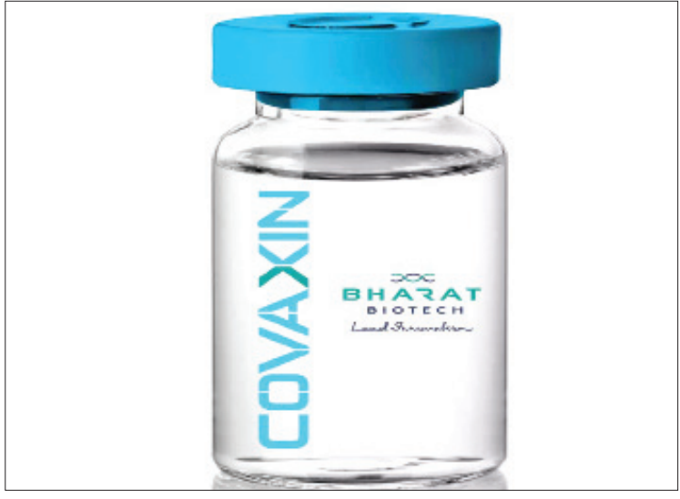
ရောဂါ ကာကွယ်ဆေးစမ်းသပ်မှုနဲ့ ပတ်သက်လို့ အချက်အလက်တွေ ထပ်ပြီး ရရှိရင် စမ်းသပ်မှုရလဒ် အသေးစိတ်ကို ဆက်လက်မျှဝေပေးမှာပါ” ဟု ကုမ္ပဏီက ဆိုသည်။ Covaxin ကိုဗစ်-၁၉ ရောဂါ ကာကွယ်

ထို့အပြင် အဆိုပါ ကာကွယ်ဆေး သည် ဗြိတိန်နိုင်ငံတွင် ပထမဆုံးတွေ့ရှိခဲ့ သည့် ဗီဇပြောင်း ကိုရိုနာဗိုင်းရပ်စ်နှင့် အခြားမျိုးကွဲ ဗိုင်းရပ်စ်များကိုလည်း ပျက်ပြယ်စေနိုင်ကြောင်း အမျိုးသား ရောဂါပိုးမွှားဗေဒဆေးရုံမှ ဆန်းစစ် လေ့လာချက်က ညွှန်ပြထားကြောင်း ကုမ္ပဏီက ပြောကြားသည်။ “ကိုဗစ်-၁၉