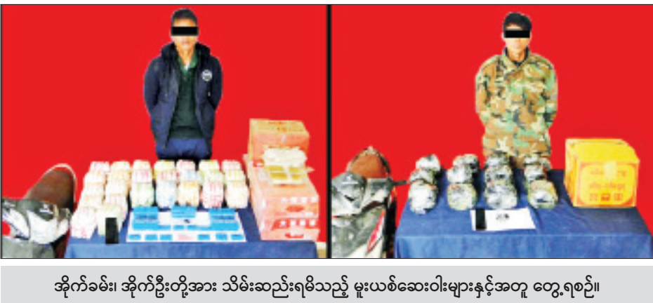
အိုက်ခမ်း၊ အိုက်ဦးတို့အား သိမ်းဆည်းရမိသည့် မူးယစ်ဆေးဝါးများနှင့်အတူ တွေ့ရစဉ်။