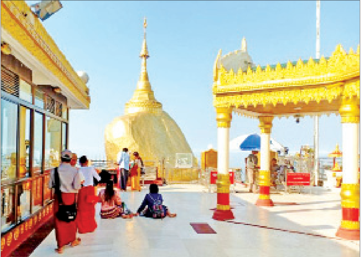
ကျိုက်တိုမြို့ရှိ သမိုင်းဝင် ဆံတော်ရှင်ကျိုက်ထီးရိုးစေတီတော်မြတ်ကြီးအား လာရောက်ဖူးမြော်ကြသူများကို တွေ့ရစဉ်။

ထို့ပြင် နိုင်ငံတစ်ဝန်းရှိ အစွလာမ်ဘာသာရေးကျောင်းများ၊ ခရစ်ယာန်ဘာသာရေးကျောင်းများနှင့် ဟိန္ဒူဘာသာရေးကျောင်းများကိုလည်း သက်ဆိုင်ရာဘာသာများအလိုက် အများပြည်သူဝတ်ပြုကြည်ညိုနိုင်ရေးအတွက် ကိုဗစ်-၁၉ စည်းမျဉ်း၊ စည်းကမ်းများနှင့်အညီ ဖွင့်လှစ်ထားရှိရာ သက်ဆိုင်ရာဘာသာဝင်များက စည်းမျဉ်းစည်းကမ်းများနှင့်အညီ စိတ်အေးချမ်းသာစွာ လာရောက်ဝတ်ပြုလျက်ရှိကြောင်း သတင်းရရှိသည်။ သတင်းစဉ်