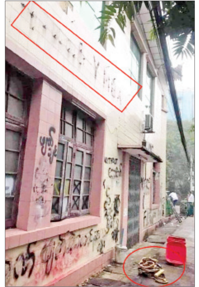
နိုင်ငံရေး ပုဇွန်တောင်မြို့မရဲစခန်း၌ အမှုဖွင့်ထားကြောင်း သတင်းရရှိသည်။ သတင်းစဉ်

ထို့ပြင် ဖေဖော်ဝါရီ ၂၈ ရက် ညပိုင်းတွင်လည်း ဆူပူဆန္ဒပြသူအချို့သည် အဆောက်အအုံရှေ့တွင် အကြောင်းမဲ့လာရောက်အော်ဟစ်ဆဲဆိုခြင်းများ ပြုလုပ်ခဲ့ကြောင်း သိရသည်။ ထိုသို့ ဖြစ်စဉ်ဖြစ်ပွားမှုသည် မြန်မာပြည်လွတ်လပ်ရေးကြိုးပမ်းမှုသမိုင်းတွင် လွတ်လပ်ရေးနှင့် အမျိုးသားနိုင်ငံရေးကို ဦးဆောင်ခဲ့သည့် YMBA အသင်းကြီးအား ပျက်စီးစေလိုသောစိတ်ဖြင့် အကြမ်းဖက်ပြုမူခဲ့သည့် လုပ်ဆောင်မှုဖြစ်ပြီး မြန်မာ့သမိုင်း၊ နိုင်ငံတော်နှင့် ဗုဒ္ဓဘာသာအား မတီမဲ့မြင်ပြုမူတစ်ခုဖြစ်ကြောင်းကိုလည်း YMBA အသင်းကြီးမှ သတင်းထုတ်ပြန်ထားရှိသည်။ ဖြစ်စဉ်တွင် ပါဝင်ပတ်သက်သူများအား ဥပဒေနှင့်အညီ အရေးယူ