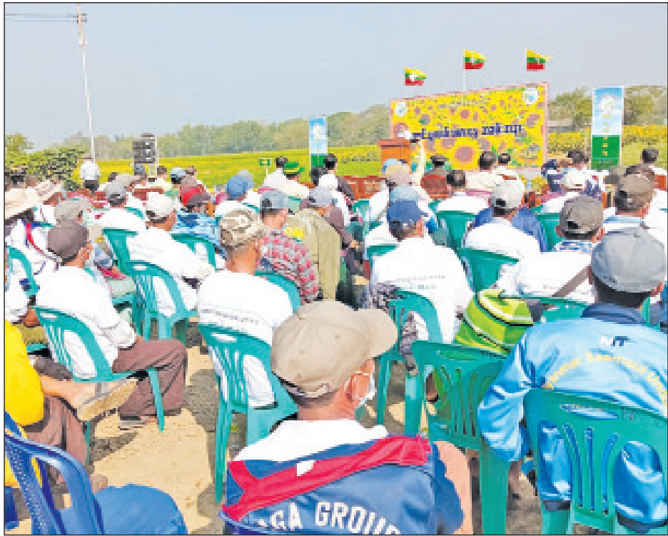
၄ ရက်အထိ ပြသထားမည်ဖြစ်ပြီး ကိုဗစ်-၁၉ ညွှန်ကြားချက်များနှင့်အညီ မတ် ၂ ရက်တွင် ပုသိမ်ခရိုင်နှင့် မြောင်းမြခရိုင်အတွင်းရှိ မြို့နယ်များမှ တစ်ဆင့် တစ်မြို့နယ်လျှင် တောင်သူဦးရေ ၃၀ စီဖြင့် ၂၀၀၊ မတ် ၃ ရက်တွင် ဖျာပုံခရိုင်နှင့် မအူပင်ခရိုင်အတွင်းရှိ မြို့နယ်များမှ တစ်မြို့နယ်လျှင် ၃၀ စီဖြင့် ၂၄၀၊ မတ် ၄ ရက်က ဟင်္သာတခရိုင်နှင့် လပွတ္တာခရိုင်အတွင်းရှိ မြို့နယ်များမှ တစ်မြို့နယ်လျှင် ၃၀ စီဖြင့် ၂၄၀ တို့က စိုက်ခင်းများကို အလှည့်ကျလေ့လာကြမည်ဖြစ်ကြောင်း သိရသည်။ မောင်မောင်မြင့် (ပြန်/ဆက်)

တောင်သူလယ်သမားနေ့ အထိမ်းအမှတ် တောင်သူပညာပေးစံပြုစိုက်ခင်းများကို မတ် ၂ ရက်မှ