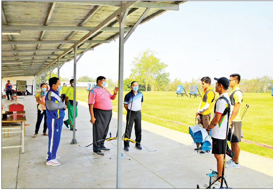
များအား နိုင်ငံတော်ကို အားကစားဖြင့် ဂုဏ်သိက္ခာ တိုးတက်မြှင့်တင်ပေးရန် အစွမ်းကုန် ကြိုးစားကြစေလိုကြောင်းနှင့် ဆုတံဆိပ်ရရှိနိုင်ရေး ကြိုးစားလေ့ကျင့်စေလိုကြောင်း၊ မိမိတို့ လုပ်ငန်းတာဝန်ဖြစ်သော အားကစားလေ့ကျင့်မှုကို ဂရုတစိုက် စဉ်ဆက်မပြတ် အောင်မြင်မှုရရှိရမည်ဟူသော စိတ်အာရုံထားရှိကာ ကြိုးစားလေ့ကျင့်စေလိုကြောင်း၊ လေ့ကျင့်မှုကာလတွင် အားကစားသမား တစ်ဦးချင်းစီ၏ လိုအပ်ချက်

နေပြည်တော် မတ် ၂ ကျန်းမာရေးနှင့် အားကစားဝန်ကြီးဌာန ဒုတိယဝန်ကြီး ဦးမျိုးလှိုင်သည် ယနေ့နံနက် ၉ နာရီတွင် နေပြည်တော် အားကစားလေ့ကျင့်ရေးစခန်း၌ ကိုဗစ်-၁၉ ရောဂါစည်းကမ်းနှင့်အညီ လေ့ကျင့်လျက် ရှိသော ၂၀၂၁ ခုနှစ် (၃၁) ကြိမ်မြောက် အရှေ့တောင်အာရှအားကစားပြိုင်ပွဲတွင် ပါဝင်ယှဉ်ပြိုင်ကြမည့် မြန်မာ့လက်ရွေးစင်အားကစားသမားများ၏ လေ့ကျင့်နေမှုများကို သွားရောက်ကြည့်ရှုစစ်ဆေးသည်။