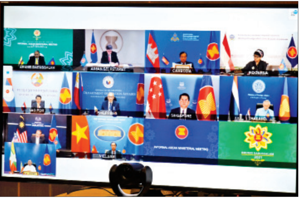
ပြည်ထောင်စုဝန်ကြီး ဦးဝဏ္ဏမောင်လွင် အာဆီယံနိုင်ငံခြားရေးဝန်ကြီးများ အလွတ်သဘောအစည်းအဝေး တက်ရောက်စဉ်။

တက်ရောက် ယင်းနောက် ပြည်ထောင်စု ဝန်ကြီးက မြန်မာနိုင်ငံ၏ လတ်တလောဖြစ်ပေါ်တိုးတက်မှု အခြေအနေနှင့် စပ်လျဉ်း၍ ၂၀၂၀ ပြည့်နှစ်၊ နိုဝင်ဘာ ၈ ရက်တွင် မြန်မာနိုင်ငံ၌ ကျင်းပခဲ့သည့် အထွေထွေ ရွေးကောက်ပွဲတွင် မဲမသမာမှု ဖြစ်ပွားခဲ့သည့်အခြေ အနေ၊ နိုင်ငံတော်စီမံအုပ်ချုပ်ရေး