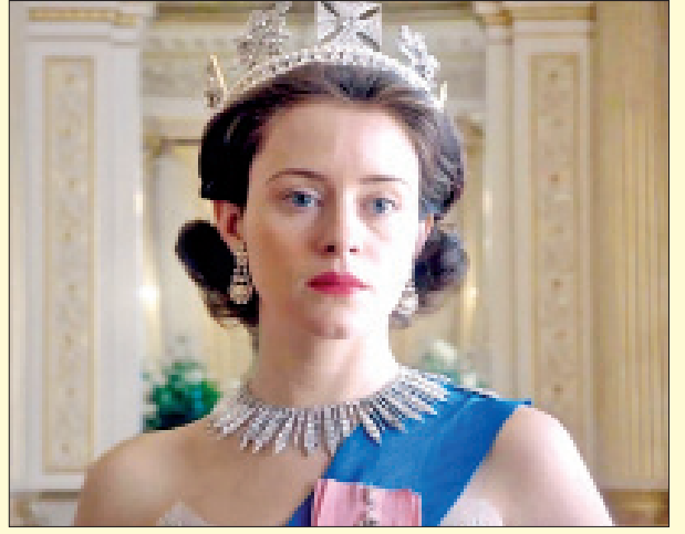
အဆိုပါဇာတ်လမ်းတွဲနဲ့ အကောင်းဆုံး အမျိုးသမီးဇာတ်ပို့ဆုကို ရွေးချယ်ချီးမြှင့်ခံခဲ့ရကြောင်း သိရပါတယ်။

ယင်းဆုပေးပွဲမှာ ရုပ်သံဇာတ်လမ်းတွဲရုပ်ရှင်တစ်ခုဖြစ်တဲ့ The Crown က အကောင်းဆုံးရုပ်သံဇာတ်လမ်းတွဲ(ဒရမ်မာ)ဆုကို ဆွတ်ခူးခဲ့ပါတယ်။ ဒါ့အပြင် အဆိုပါဇာတ်လမ်းတွဲရဲ့ အဓိကဇာတ်ဆောင်မင်းသမီး အမ်မာကောလင်းကလည်း အကောင်းဆုံးအမျိုးသမီးသရုပ်ဆောင်ဆုကို ဆွတ်ခူးခဲ့ကာ ဇာတ်ဆောင်မင်းသားဂျော့ရှ်အိုကော်နာကလည်း အကောင်းဆုံးအမျိုးသားဇာတ်ဆောင်ဆုကို လက်ခံရရှိခဲ့ပါတယ်။ မင်းသမီး ဂေလီယမ်အန်ဒါဆန်ကလည်း