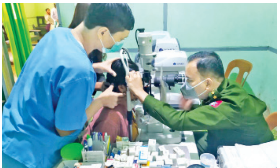
ခံယူနေသောလူနာများအတွက် စားသောက်ဖွယ်ရာ များ ပေးအပ်ခဲ့ကြကြောင်း သတင်းရရှိပါသည်။ များနှင့် ကျန်းမာရေးဝန်ထမ်းများအတွက် ချီးမြှင့်ငွေ သတင်းစဉ်

ထိုသို့ လာရောက်ကုသမှုခံယူလျက်ရှိသည့် လူနာများအနက် အကြီးစားခွဲစိတ်ကုသရန် လိုအပ်သူ ၁၈၅၀၊ အသေးစားခွဲစိတ်ကုသရန် လိုအပ်သူ ၉၉၉ ဦး စုစုပေါင်း ၂၈၄၉ ဦးတို့ကို ခွဲစိတ်ကုသပေးနိုင်ခဲ့ပြီး စိုးရိမ်ဖွယ်ရာရှိသည့် လူနာများကိုလည်း ပါရဂူများ၊ ဆေးမှူးများဖြင့် အထူးကြပ်မတ်ကုသပေးလျက်ရှိ သည်။ ထို့ပြင် ကလေးမီးဖွားရန် အခက်အခဲဖြစ် နေသည့် မွေးလူနာများကို တပ်မတော်ဆေးရုံအသီး သီးတွင် တက်ရောက်စေလျက်ရှိပြီး ၎င်းတို့အနက် ၁၀၆၇ ဦးကို ခွဲစိတ်မွေးဖွားပေးနိုင်ခဲ့ကာ ၁၈၅၃ ဦးကို သာမန် မွေးဖွားပေးနိုင်ခဲ့ခြင်းကြောင့် ယနေ့အထိ ကလေးငယ် ၂၆၅၀ ကို အောင်မြင်စွာ မွေးဖွားပေး နိုင်ခဲ့သည်။ ယင်းသို့ ဒေသခံပြည်သူများအား ဆေးကုသပေး နေမှုအခြေအနေများကို သက်ဆိုင်ရာ တိုင်းစစ်ဌာန ချုပ်အသီးသီးမှ တာဝန်ရှိသူများက သွားရောက် ကြည့်ရှုအားပေးပြီး ဆေးရုံတက်ရောက်ကုသမှု