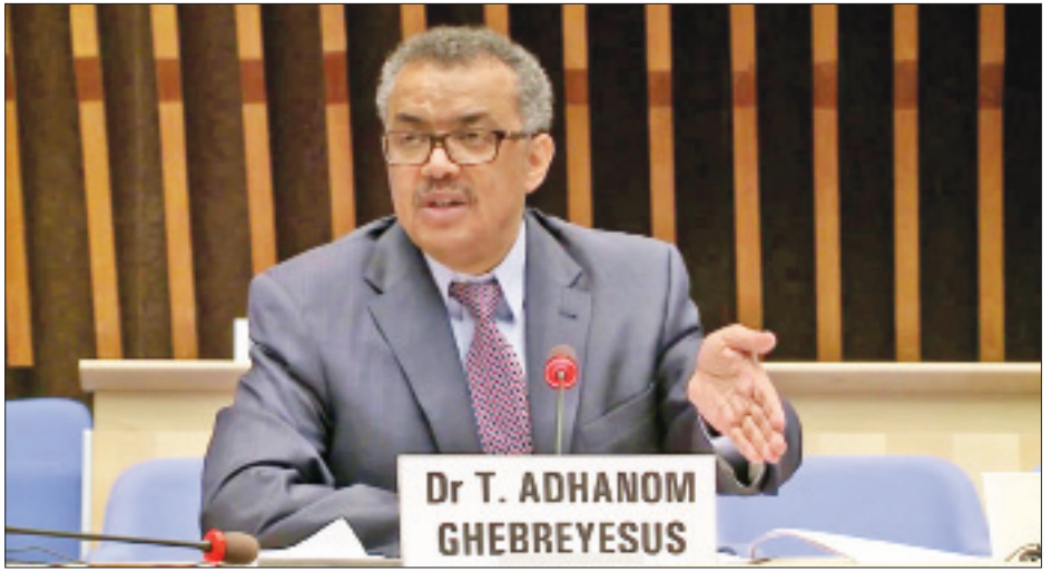
များနှင့် ဝင်ငွေအလယ်အလတ်ရှိသည့် နိုင်ငံများအတွက် ကိုဗစ်-၁၉ ရောဂါကာကွယ်ဆေးထောက်ပံ့ပေးမည်ဖြစ်ကြောင်း ကမ္ဘာ့ကျန်းမာရေးအဖွဲ့ ညွှန်ကြားရေးမှူးချုပ် ဂါဘရီယီးဆပ်က မှတ်ချက်ပြုပြောကြားခဲ့သည်။ ကိုးကား-စီအင်န်အေ၊ ဘာသာပြန်-အလင်းသစ်

ကမ္ဘာလုံးဆိုင်ရာ ကာကွယ်ဆေးအစီအစဉ် COVAX က ထောက်ပံ့သော ကိုဗစ်-၁၉ ရောဂါကာကွယ်ဆေးများဖြင့် ကာကွယ်ဆေးထိုးနှံရေး စတင်နိုင်ရန်အတွက် မတ် ၁ ရက်တွင် ဂါဘရီယီးဆပ်နှင့် အိုင်ဗရီကို့စ်နိုင်ငံတို့သို့ ကိုဗစ်-၁၉ ရောဂါကာကွယ်ဆေး ပထမဆုံးအကြိမ် ထောက်ပံ့ပေးခဲ့ပါကြောင်း နှင့် ယင်း COVAX အစီအစဉ်သည် ဆင်းရဲသောနိုင်ငံ