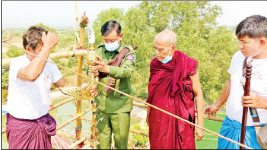
ထိုနေ့က တိုင်းမှူးက လောကဗျူအောင်မြင်မှုစေတီတော်မြတ်ကြီးတွင် တင်လှူပူဇော်မည့် ရတနာစိန်ဖူးတော်နှင့် လှူဖွယ်ပစ္စည်းများအား ကုမ္ပဏီသယကျောင်းတိုက်ဆရာတော်ထံသို့ ဆက်ကပ်လှူဒါန်းပြီး အနုမောဒနာတရားနာယူ၍ လှူဒါန်းမှုအစုစုတို့အတွက် ရေစက်သွန်းလောင်းအမျှပေးဝေကြသည်။ ဆက်လက်၍ ကုမ္ပဏီသယကျောင်းတိုက်ဆရာတော်၊ တိုင်းမှူးနှင့် တာဝန်ရှိသူများက ရတနာ