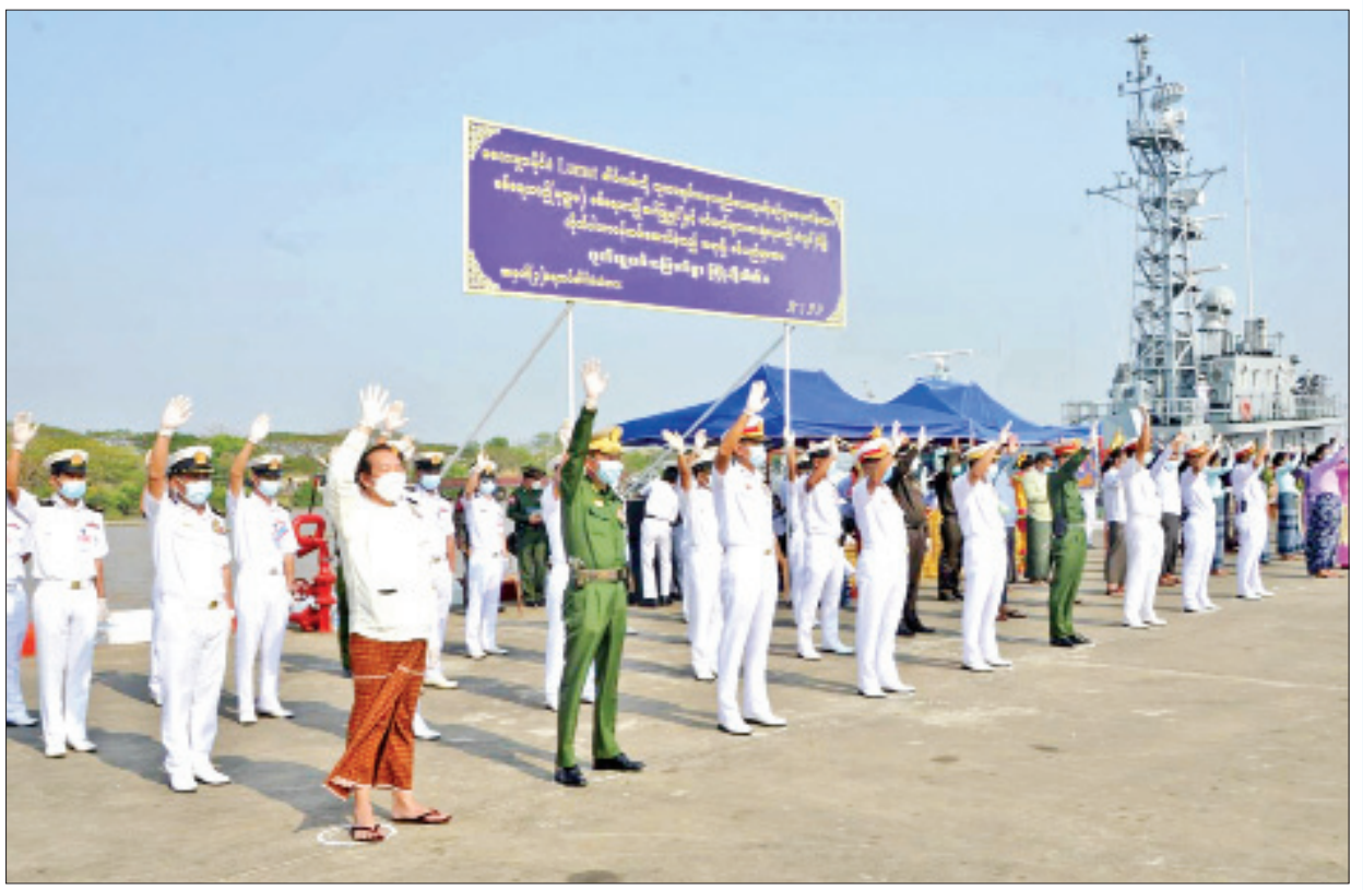
မလေးရှားနိုင်ငံမှ ပြန်လည်ရောက်ရှိလာသည့် မြန်မာနိုင်ငံသားများအား တာဝန်ရှိသူများက နွေးထွေးလှိုက်လှစွာ ကြိုဆိုကြစဉ်။

ယခုအစီအစဉ်သည် ယခင်က ဆောင်ရွက်ပေးခဲ့သည့် အစီအစဉ်များနှင့်မတူသည့် တပ်မတော်က ထူးထူးခြားခြားဆောင်ရွက်ပေးခဲ့သည့် ပထမဆုံးသော အစီအစဉ်ဖြစ်သည်။ ပထမဆုံးသော အောင်မြင်စွာဆောင်ရွက်ပေးခဲ့သည့် မြန်မာပြည်သူပြည်သားများ၏ ပြည်တော်ပြန်ခရီးစဉ်ဟု ဆိုရမည်ဖြစ်သည်။ ရာသီဥတု အထူးကောင်းမွန်နေသော အချိန်၌ ပြာလုံလုံငွေငွေရာောင် ပင်လယ်ပြင်ကြီးပေါ်တွင် တရိပ်ရိပ်ခိုဝှက်မောင်းနေသော မြန်မာ့တပ်မတော် စစ်ရေယာဉ်များပေါ်မှ မြန်မာနိုင်ငံသားများသည် ဒုက္ခဘုံမှ လွတ်မြောက်၍ အေးငြိမ်းချမ်းသာသည့် အိမ်ရင်ခွင်သို့ စိတ်နှလုံး