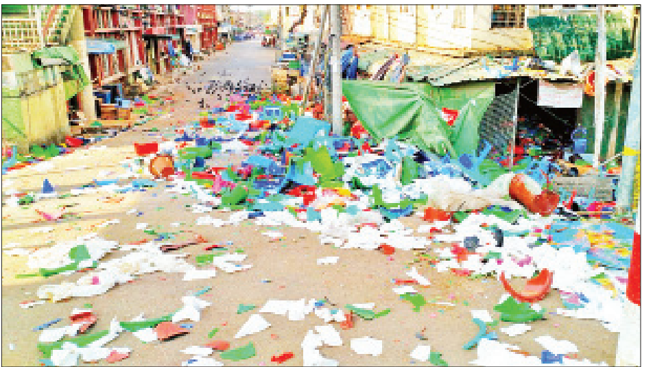
ပဲခူးမြို့၌ ဆူပူဆန္ဒပြသူများက အကြောင်းမဲ့ လူယက်ဖျက်ဆီးမှုများ လုပ်ဆောင်ခဲ့သည့် နေရာအား တွေ့ရစဉ်။