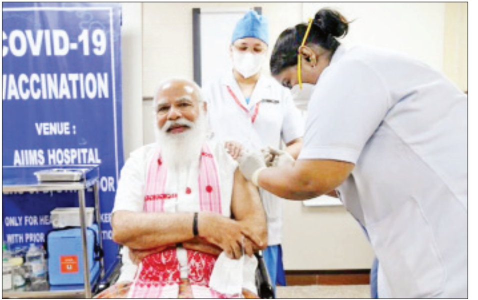
ကြောင်း အိန္ဒိယကျန်းမာရေးဝန်ကြီးဌာန၏ သိရသည်။ နောက်ဆုံးထုတ်ပြန်သည့် အချက်အလက်များအရ ကိုးကား-ဆင်ဟွာ၊ ဘာသာပြန်-အလင်းသစ်

အိန္ဒိယနိုင်ငံ၌ လက်ရှိတွင် ကိုဗစ်-၁၉ ရောဂါ ကူးစက်ခံရသူစုစုပေါင်း ၁၁၁၂၂၄၁ ဦးနှင့် ကိုဗစ်-၁၉ ရောဂါကြောင့် သေဆုံးသူ ၁၅၇၁၅၇ ဦးရှိသွားပြီဖြစ်