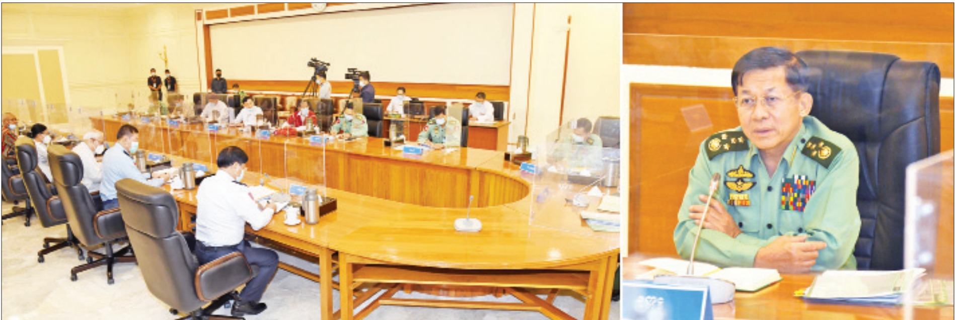
နိုင်ငံတော်စီမံအုပ်ချုပ်ရေးကောင်စီဥက္ကဋ္ဌ တပ်မတော်ကာကွယ်ရေးဦးစီးချုပ် ဗိုလ်ချုပ်မှူးကြီး မင်းအောင်လှိုင် နိုင်ငံတော်စီမံအုပ်ချုပ်ရေးကောင်စီအစည်းအဝေးတွင် အမှာစကားပြောကြားစဉ်။

မဲသမာမှုများနှင့်စပ်လျဉ်း၍လည်း အသစ်ဖွဲ့စည်းထားသည့် ပြည်ထောင်စုရွေးကောက်ပွဲကော်မရှင်က စစ်ဆေးဆောင်ရွက်နေ