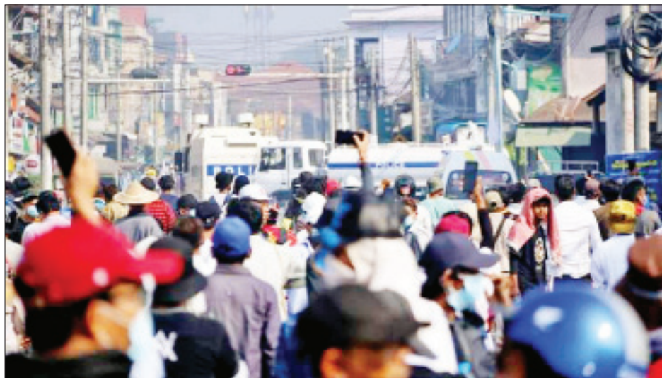
ထားဝယ်မြို့၌ ဆူပူဆန္ဒပြသူများအား လုံခြုံရေးရဲတပ်ဖွဲ့က လူစုကွဲစေရန် ကိုင်တွယ်ထိန်းသိမ်းမှုများ ဆောင်ရွက်စဉ်။