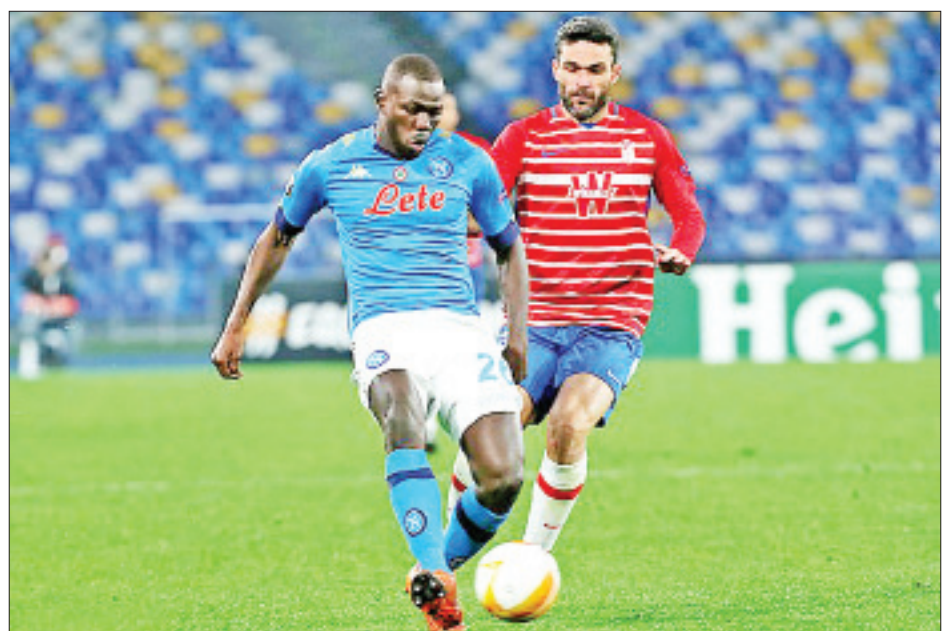
ကလိုက်စစ်နောက်တန်းကစားသမားအက်ပါမီကာနီ အား ပြောင်းရွှေ့ကြေးပေါင် ၃၈ ဒသမ ၅ သန်းနဲ့

ဘိုင်ယန်မြူးနစ်အသင်းဟာ ပြီးခဲ့တဲ့လအတွင်း