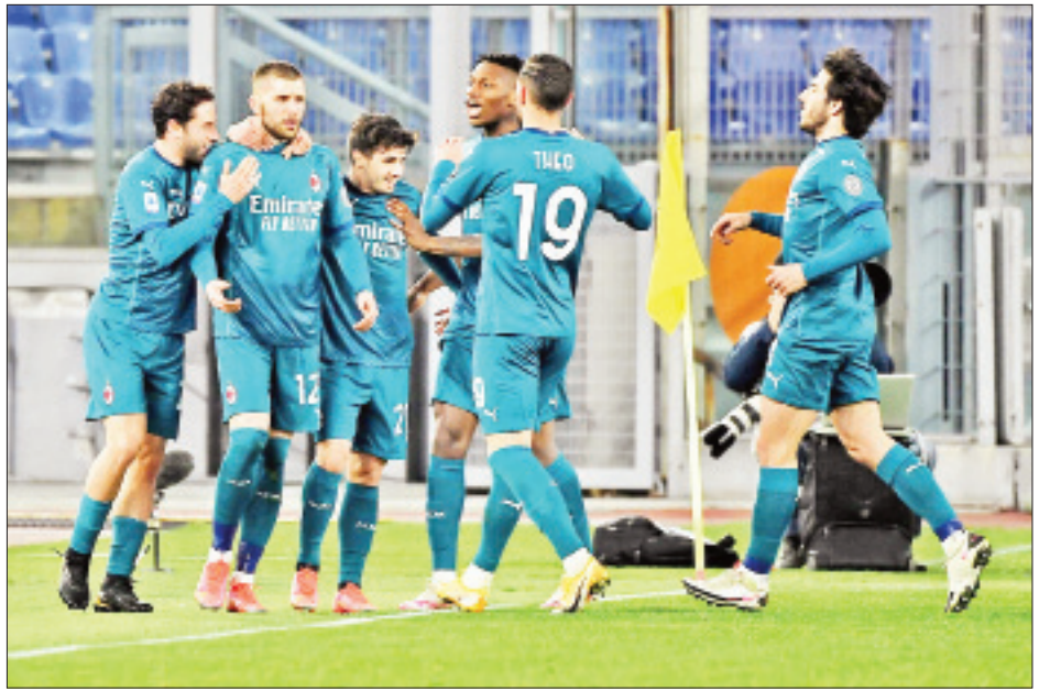
ပထမအကျော့နဲ့ ဒုတိယအကျော့တို့မှာတော့ အေစီမီလန်အသင်းနဲ့အတူ အီဘရာဟီမိုဗစ် ပြန်လည်ပါဝင်လာဖို့ရှိနေတာ ဖြစ်ပါတယ်။

မတ် ၁၁ ရက်နဲ့ ၁၈ ရက်တို့မှာ မန်ယူအသင်းနဲ့ ယှဉ်ပြိုင်ကစားရမယ့် ယူရိုပါလိဂ် ၁၆ သင်းအဆင့်