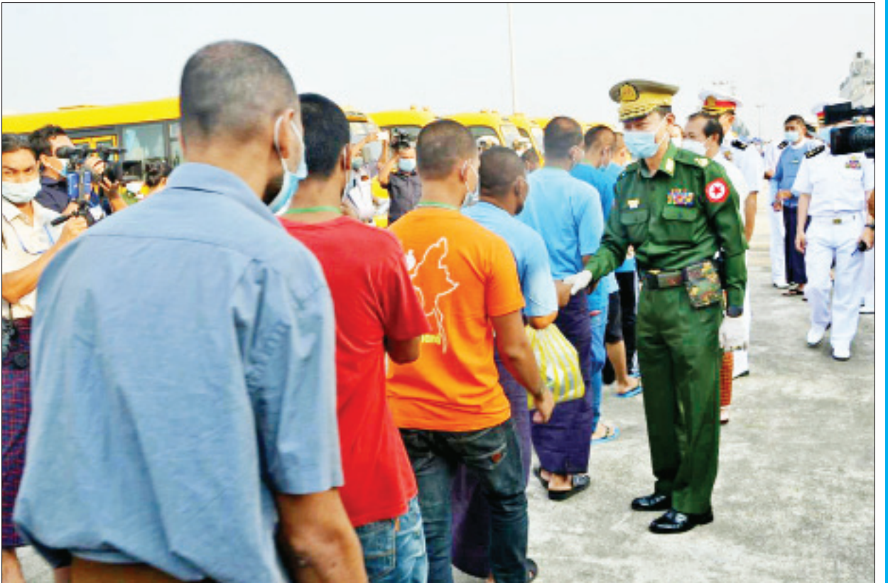
မလေးရှားနိုင်ငံမှ ပြန်လည်ရောက်ရှိလာသည့် မြန်မာနိုင်ငံသားများအား တာဝန်ရှိသူများက နွေးထွေးလှိုက်လှဲစွာ ကြိုဆိုကြစဉ်။

အမိမြေပေါ်သို့ပြန်လည်အခြေချလာနိုင်ခဲ့သည့် မြန်မာနိုင်ငံသား ၁၀၈၆ ဦးနှင့် ၎င်းတို့၏ မိသားစုဝင်များ ပြန်လည်ဆုံစည်းကြသည့် သတင်းသည် ကြည်နူးဝမ်းမြောက်စရာကောင်းသည့် မင်္ဂလာရီသော