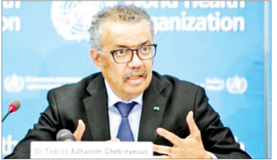
ကာကွယ်ဆေး သာတူညီမျှစွာရရှိရေးအတွက် အက်ဒနွမ် ဂါဘရီယီဆက်စ်က ပြောကြားခဲ့သည်။ ထောက်ခံအတည်ပြုမှုအပေါ် ကြိုဆိုပါကြောင်း ကိုးကား- ဆင်ဟွာ ကမ္ဘာ့ကျန်းမာရေးအဖွဲ့အကြီးအကဲ တီဒရော့စ် ဘာသာပြန်- အောင်ကျော်ကျော်

ပြည်သူများ၏ နေ့စဉ်ဘဝကို မူလအခြေအနေသို့ ပြန်လည်ရောက်ရှိရန် ကြိုးပမ်းရာတွင် အကောင်းဆုံး နည်းလမ်းတစ်ခုဖြစ်ကြောင်းနှင့် ကမ္ဘာ့နိုင်ငံအားလုံး ပူးပေါင်းဆောင်ရွက်ကြရန် လိုအပ်ကြောင်း ၎င်းက ဆက်လက်ပြောကြားခဲ့သည်။ ထို့ပြင် ကမ္ဘာ့ကျန်းမာရေးအဖွဲ့နှင့် ကုလသမဂ္ဂ အဖွဲ့၏ အေဂျင်စီများက ကာကွယ်ဆေးညီညွတ် မျှတစွာရရှိရန် မကြာခဏတိုက်တွန်းပြောကြားလျက် ရှိသော်လည်း ကမ္ဘာ့နိုင်ငံများအကြား ပူးပေါင်း ဆောင်ရွက်မှု အားနည်းလျက်ရှိသည်ကို တွေ့ရှိရ ကြောင်းနှင့် ကာကွယ်ဆေးများကို အချို့နိုင်ငံများက လက်ဝါးကြီးအုပ်ဝယ်ယူမှုများကိုလည်း တွေ့မြင်နေ ရကြောင်း ၎င်းကဆိုသည်။ အလားတူ ကုလသမဂ္ဂ လုံခြုံရေးကောင်စီက လည်း စစ်မက်ဖြစ်ပွားလျက်ရှိသည့်ဒေသများတွင် ကိုဗစ်-၁၉ ရောဂါကာကွယ်ဆေးများ ပိုမိုထိရောက်စွာ အသုံးပြုနိုင်ရေးအတွက် တောင်းဆိုသည့် ဆုံးဖြတ် ချက်တစ်ရပ်ကို ချမှတ်ခဲ့ကြောင်း သိရသည်။ ထို့ကြောင့် ကုလသမဂ္ဂလုံခြုံရေးကောင်စီတွင်