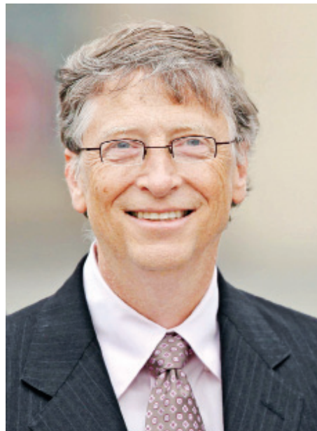
မိုက်ကရိုဆော့ဖ်တည်ထောင်သူ ဘီလ်ဂိတ်။

နွေရာသီ ကျောင်းပိတ်ရက်ရောက်တဲ့အခါ ဘီလ်ဂိတ်နဲ့ သူငယ်ချင်းသုံးယောက်က CCC သုံးနေတဲ့ ကွန်ပျူတာကို ပိုမြန်လာအောင် ပရိုဂရမ်မှာ လိုအပ် ချက်အမှားတွေကို ရှာပေးမယ်။ အပြန်အလှန်အနေနဲ့ CCC ရဲ့ ကွန်ပျူတာကို အခမဲ့သုံးစွဲခွင့် ပေးရမယ်ဆိုပြီး သဘောတူညီမှုယူခဲ့ပါတယ်။ CCC အတွက် အလုပ် လုပ်ပေးတဲ့အခါ ဘီလ်ဂိတ်ဟာ FORTRAN, LISP နဲ့ Machine Language အပါအဝင် ပရိုဂရမ် အမျိုးမျိုး အတွက် Source codeတွေကို လေ့လာခွင့်ရခဲ့ပါတယ်။ ဘီလ်ဂိတ်ရဲ့ ပရိုဂရမ်ရေးတဲ့စွမ်းရည်တွေကို သတိ ထားမိတဲ့ လိပ်ဆိုဒ်ကျောင်း အုပ်ချုပ်သူတွေက