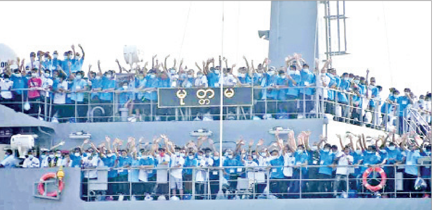
မလေးရှားနိုင်ငံတွင် ရောက်ရှိနေသော မြန်မာနိုင်ငံသားများအား ပြန်လည်ခေါ်ဆောင်လာသည့် တပ်မတော်မှစစ်ရေယာဉ်များ ရန်ကုန်မြို့ အမှတ်(၃) ရေတပ်ဆိပ်ကမ်းသို့ ပြန်လည်ရောက်ရှိစဉ်။

နေပြည်တော် ဖေဖော်ဝါရီ ၂၇ နိုင်ငံတော်စီမံအုပ်ချုပ်ရေးကောင်စီဥက္ကဋ္ဌ တပ်မတော်ကာကွယ်ရေးဦးစီးချုပ် ဗိုလ်ချုပ်မှူးကြီး မင်းအောင်လှိုင်က ကိုဗစ်-၁၉ ရောဂါဖြစ်ပွားနေသည့်ကာလအတွင်း နိုင်ငံရပ်ခြားတွင် ကာလရှည်ကြာစွာ ပိတ်မိဒုက္ခခံနေရသည့် မြန်မာနိုင်ငံသားများအနေဖြင့် မိမိတို့မြန်မာနိုင်ငံသို့ ပြန်လာသင့်ကြောင်း၊ အဆိုပါ ပြည်ပရောက်မြန်မာနိုင်ငံသားများအား အမြန်ဆုံးပြန်လည်ခေါ်ဆောင်နိုင်ရေး စီမံဆောင်ရွက်သွားရမည်ဖြစ်ကြောင်း ဖေဖော်ဝါရီ ၂ ရက်တွင် နိုင်ငံတော်သမ္မတအိမ်တော် အစည်းအဝေးခန်းမ၌ ကျင်းပပြုလုပ်ခဲ့သည့် ပြည်ထောင်စုအစိုးရအဖွဲ့အစည်းအဝေး၌ လမ်းညွှန်မှာကြားခဲ့သဖြင့် မလေးရှားနိုင်ငံတွင် ရောက်ရှိနေပြီး ယခင်ကာလကတည်းက အကြောင်းအမျိုးမျိုးကြောင့် မြန်မာနိုင်ငံသို့ပြန်လာရန် အခက်အခဲများကြုံတွေ့နေရသည့် မြန်မာနိုင်ငံသားများအားခေါ်ဆောင်ရန် တပ်မတော်မှ စစ်ရေယာဉ်(မှတ္တမ)၊ ပင်လယ်သွားဆေးရုံ