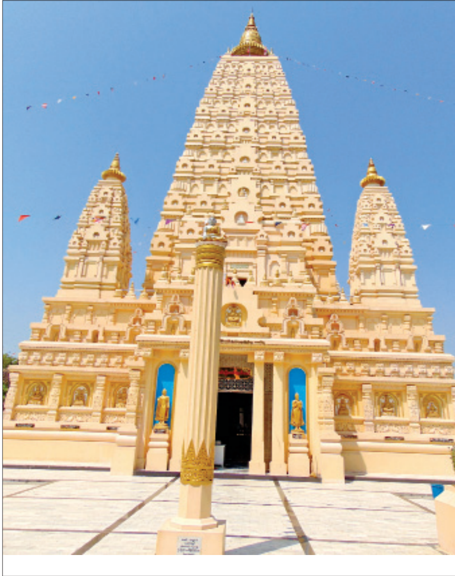
ရွှေဘိုမြို့မှ အောင်မြေဗောဓိစေတီတော်ကြီး။

အလောင်းမင်းတရားကြီး စစ်ထွက်တော်မူသည့်အခါ အောင်နိုင်ရေးအတွက် သစ္စာဆိုခဲ့သော ဗုဒ္ဓရုပ်ပွားတော်ကိန်းဝပ်ရာမြေကို စစ်ထွက်အောင်မြေအဖြစ် အသိအမှတ်ပြုထားသည်။ ယခုအခါ အောင်မြေဘုရားဝင်းအတွင်းမှာ အောင်မြေဗောဓိစေတီကြီးထားရှိပြီး ဘုရားဖူးများ လာရောက်ပါက လက်ယာရစ်သို့ ငါးပတ်၊ ခုနစ်ပတ် ပတ်ပြီး