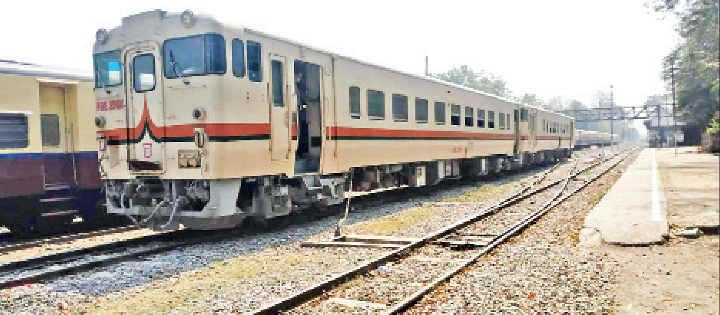
နေပြည်တော် ဖေဖော်ဝါရီ ၂၇ လက်ရှိကမ္ဘာ့ကပ်ရောဂါ ကိုဗစ်-၁၉ ဖြစ်ပွားချိန်မှစ၍ မြန်မာ့မီးရထား၏ ခရီးသည်ရထားခရီးစဉ်များနှင့် ကုန်ရထားခရီးစဉ်များကို လျှော့ချရပ်ဆိုင်းထားရသည်ဖြစ်ရာ အဆိုပါအခြေအနေမှ လုပ်ငန်းများပုံမှန်ပြန်လည်အကောင်အထည်ဖော်နိုင်ရေးအတွက် မြန်မာ့မီးရထားအနေဖြင့် လိုအပ်သည့် လုပ်ငန်းစဉ်များကို စဉ်ဆက်မပြတ်ဆောင်ရွက်လျက်ရှိသည်။ စာမျက်နှာ ၂၅ ကော်လံ ၁ သို့ *