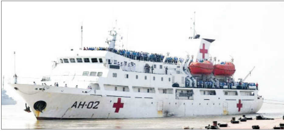
မလေးရှားနိုင်ငံတွင် ရောက်ရှိနေသော မြန်မာနိုင်ငံသားများအား ပြန်လည်ခေါ်ဆောင်လာသည့် တပ်မတော်စစ်ရေယာဉ်များ ရန်ကုန်မြို့ အမှတ်(၃) ရေတပ်ဆိပ်ကမ်းသို့ ပြန်လည်ရောက်ရှိစဉ်။

နေရာချထားရေးဝန်ကြီးဌာနမှ တာဝန်ရှိသူများထံသို့ လွှဲပြောင်းပေးသွားမည်ဖြစ်ပြီး နေရပ်ပြန်နိုင်ရေးအတွက် သက်ဆိုင်ရာ တိုင်းဒေသကြီး၊ ပြည်နယ်အစိုးရအဖွဲ့များနှင့် ဆက်သွယ်ဆောင်ရွက်ပေးသွားမည်ဖြစ်ကြောင်းနှင့် အလုပ်အကိုင်အခွင့်အလမ်း ရရှိရေးကိုလည်း သက်ဆိုင်ရာများနှင့် ညှိနှိုင်းဆောင်ရွက်ပေးသွားမည်ဖြစ်ကြောင်း သိရသည်။ သတင်းစဉ်