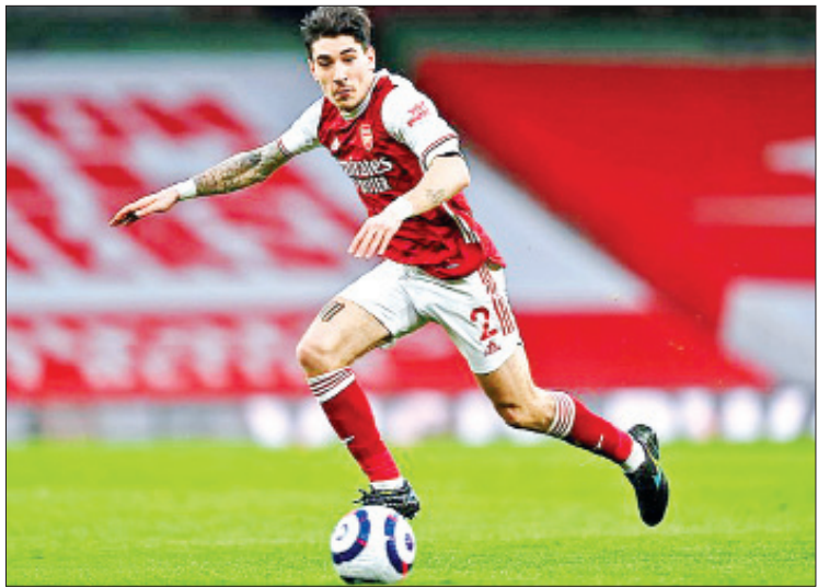
ဒါပေမယ့် မန်ယူအသင်းဟာ နောက်တန်းကစားသမား ဘယ်လာရင်ကို မခေါ်ယူနိုင်ခဲ့တာကြောင့် ဘစ်ဆာကာကို ပြောင်းရွှေ့ကြေးပေါင်သန်း ၅၀ နဲ့ ခေါ်ယူခဲ့တာ ဖြစ်ပါတယ်။ လက်ရှိမှာ အာဆင်နယ်အသင်းက ဘယ်လာရင်ကို ရောင်းချဖို့ ဆန္ဒရှိနေ တယ်လို့ သိရပါတယ်။

အာဆင်နယ်အသင်းရဲ့ စပိန်နောက်တန်းကစားသမား ဟက်တာဘယ်လာရင်ဟာ နွေရာသီအပြောင်းအရွှေ့ကာလအတွင်းမှာ အာဆင်နယ်အသင်းမှ ထွက်ခွာတော့မှာ ဖြစ်တယ်လို့ သိရပါတယ်။ အသက် ၂၅ နှစ်အရွယ်ရှိ နောက်တန်းကစားသမား ဘယ်လာရင်အနေနဲ့ ပြီးခဲ့တဲ့ ဘောလုံးရာသီကုန်ကတည်းက အာဆင်နယ်အသင်းကနေ ထွက်ခွာဖို့ ဆန္ဒရှိနေခဲ့တာ ဖြစ်ပြီး ပြင်သစ်ပထမတန်းကလပ် ပီအက်စ်ဂျီအသင်းနဲ့ စပိန်လာလီဂါကလပ် ဘာစီလိုနာအသင်းတို့ကလည်း ဘယ်လာရင်ကို ခေါ်ယူဖို့ ပစ်မှတ်ထားနေတယ်လို့ သိရပါတယ်။ အာဆင်နယ်အသင်းနည်းပြ အာတီတာက ဘယ်လာရင်အား နောက်ထပ် တစ်ရာသီထပ်မံကစားရန်အတွက်ပြီးခဲ့တဲ့ဘောလုံးရာသီကတောင်းဆိုမှုရှိခဲ့တာကြောင့် အသင်းကနေ ထွက်ခွာမယ့်အစီအစဉ် မအောင်မြင်ခဲ့တာဖြစ်ပြီး ယခုနှစ် နွေရာသီ ကာလအတွင်းမှာတော့ အာဆင်နယ်အသင်းကနေ ထွက်ခွာတော့မယ်ဆိုတဲ့ သတင်း တွေထွက်ပေါ်လာခဲ့တာ ဖြစ်ပါတယ်။ အာဆင်နယ်အသင်းဟာ နောက်တန်းကစားသမားဘယ်လာရင်ရဲ့ ပြောင်းရွှေ့ကြေးကို ပေါင်သန်း ၃၀ တောင်းဆိုထားတာ ဖြစ်ပါတယ်။ ပြီးခဲ့တဲ့ဘောလုံးရာသီက ဘယ်လာရင်ကို ခေါ်ယူဖို့ ပစ်မှတ်ထားနေတဲ့အသင်းတွေထဲမှာ ပီအက်စ်ဂျီအသင်းနဲ့ ဘာစီလိုနာအသင်းအပြင် မန်ယူအသင်းကလည်း နောက်တန်းခံစစ်ကြောင်းကို အားဖြည့်ဖို့ အိုးထရက်ဖွဲ့ဒ်အရောက်ခေါ်ယူသွားဖို့ စီစဉ်ခဲ့တယ်လို့ သိရပါတယ်။