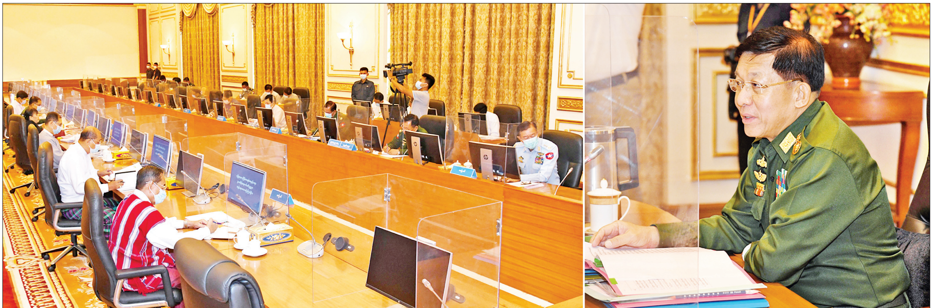
နိုင်ငံတော်စီမံအုပ်ချုပ်ရေးကောင်စီဥက္ကဋ္ဌ၊ တပ်မတော်ကာကွယ်ရေးဦးစီးချုပ် ဗိုလ်ချုပ်မှူးကြီးမင်းအောင်လှိုင် လုံခြုံရေး၊ တည်ငြိမ်အေးချမ်းရေးနှင့် တရားဥပဒေစိုးမိုးရေးကော်မတီ (၁/၂၀၂၁) အစည်းအဝေးတွင် အမှာစကားပြောကြားစဉ်။

နေပြည်တော် ဖေဖော်ဝါရီ ၂၆ လုံခြုံရေး၊ တည်ငြိမ်အေးချမ်းရေးနှင့် တရားဥပဒေစိုးမိုးရေးကော်မတီ (၁/၂၀၂၁) အစည်းအဝေးကို ယနေ့မုန်းလွဲပိုင်းတွင် နေပြည်တော်ရှိ နိုင်ငံတော်စီမံအုပ်ချုပ်ရေးကောင်စီဥက္ကဋ္ဌရုံး အစည်းအဝေးခန်းမ၌ ကျင်းပရာ လုံခြုံရေး၊ တည်ငြိမ်အေးချမ်းရေးနှင့် တရားဥပဒေစိုးမိုးရေး ကော်မတီဥက္ကဋ္ဌ၊ နိုင်ငံတော်စီမံအုပ်ချုပ်ရေးကောင်စီဥက္ကဋ္ဌ၊ တပ်မတော် ကာကွယ်ရေးဦးစီးချုပ် ဗိုလ်ချုပ်မှူးကြီးမင်းအောင်လှိုင် တက်ရောက် အမှာစကားပြောကြားသည်။