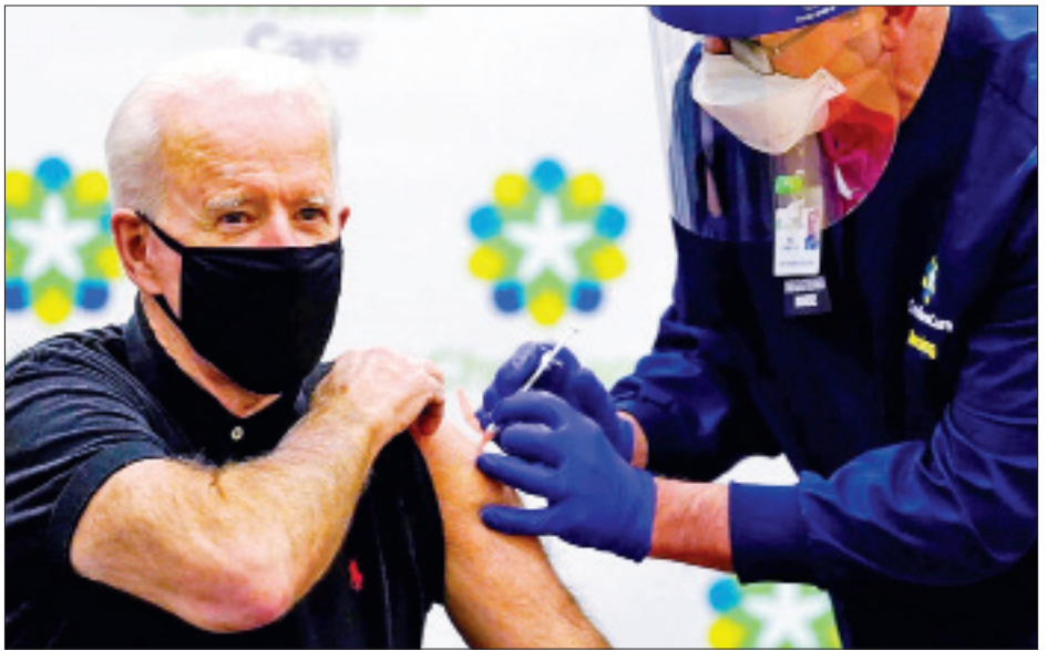
ဖေဖော်ဝါရီ ၂၅ ရက်အထိ အမေရိကန်လူဦးရေ၏ ၁၄ ရာခိုင်နှုန်းကို ကာကွယ်ဆေး အနည်းဆုံး တစ်ကြိမ်ထိုးနှံပေးပြီးဖြစ်ကြောင်း အမေရိကန် ရောဂါကာကွယ်ထိန်းချုပ်ရေးစင်တာက ပြောကြားခဲ့သည်။ ကိုးကား - အင်န်အိတ်ချီကေ ဘာသာပြန် - အောင်ကျော်ကျော်

ကာကွယ်ဆေးထိုးနှံခြင်း၏ ဘေးကင်းမှုနှင့် အကျိုးရှိပုံများအပေါ် အသိပညာပေးဟောပြောမှုများကိုလည်း နိုင်ငံအတွင်း ဆောင်ရွက်သွားမည်ဖြစ်ကြောင်း သမ္မတ ဂျိုးဘိုင်ဒင်က ဆိုသည်။