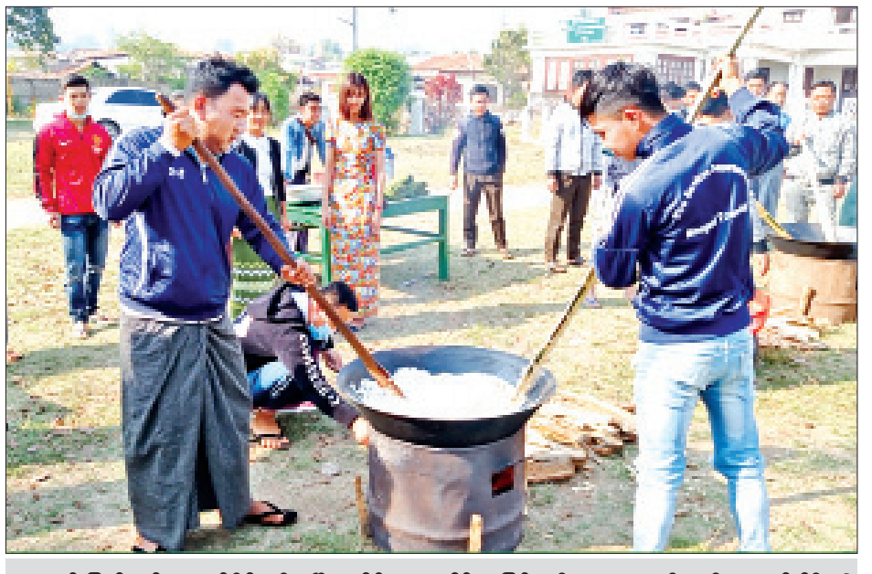
ဖေဖော်ဝါရီ ၂၆ ရက် ညနေပိုင်းက ပြုလုပ်သည့် မြန်မာ့ရိုးရာထမနဲထိုးပွဲကို ကြေးမုံသတင်းစာတိုက် (နေပြည်တော်)မှ ဝန်ထမ်းများ ပျော်ရွှင်စွာ စုပေါင်းဆင်နွှဲကြစဉ်။