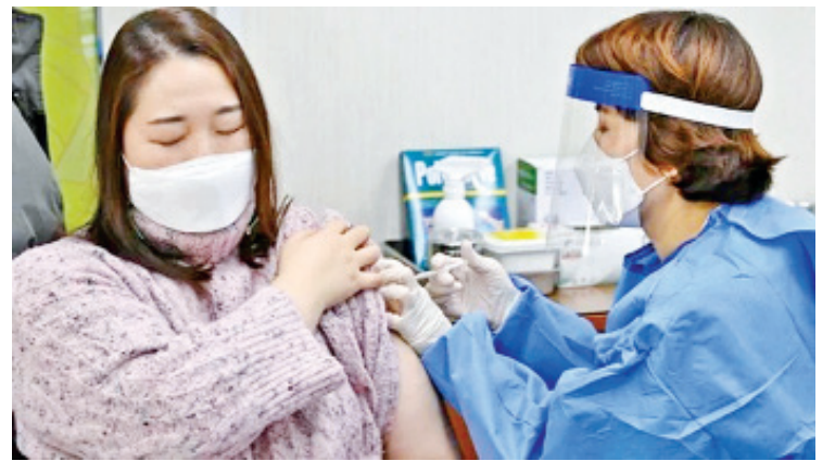
ကာကွယ်ဆေးထိုးနှံမှု၏ ကနဦးအစီအစဉ်၌ အသက် ၆၅ နှစ်အောက်ရှိ သည့် လူဦးရေ ၂၉၀၀၀၀ ဝန်းကျင်ကို ထိုးနှံပေးသွားမည်ဖြစ်ပြီး ၎င်းတို့မှာ ဆေးရုံတင်ထားရသူများ သို့မဟုတ် ကာလရှည် ကျန်းမာရေးစောင့်ရှောက်မှု ခံယူနေသူများနှင့် ကျန်းမာရေး စောင့်ရှောက်မှုပေးရသည့် ဝန်ထမ်းများလည်း ပါဝင်သည်။ တောင်ကိုရီးယားနိုင်ငံ၌ ယနေ့တွင် လူဦးရေ ၅၂၀၀ ကျော်တို့အား ပထမဆုံးအကြိမ် ကိုဗစ်-၁၉ ရောဂါကာကွယ်ဆေး ထိုးနှံမှုများ ပြုလုပ်နိုင်မည် ဖြစ်သည်။ ကိုးကား - အင်န်အိတ်ချီကေ ဘာသာပြန် - ဇော်ဝင်း

ဗြိတိန်နိုင်ငံမှ ဆေးဝါးထုတ်လုပ်ရေး ကုမ္ပဏီများဖြစ်သည့် အက်စထရာဇီနီကာ ဆေးဝါး ကုမ္ပဏီနှင့် အောက်စဖို့ဒ် တက္ကသိုလ်တို့ ပူးပေါင်းထုတ်လုပ်သည့် AstraZeneca ကိုဗစ်-၁၉ ရောဂါကာကွယ်ဆေးကို ယနေ့တွင် စတင် ထိုးနှံပေးခဲ့သည်။ ယင်းကာကွယ်ဆေး ပထမအသုတ်ကို တောင်ကိုရီးယားကုမ္ပဏီတစ်ခုမှ ထုတ်လုပ်ခြင်းဖြစ်သည်။