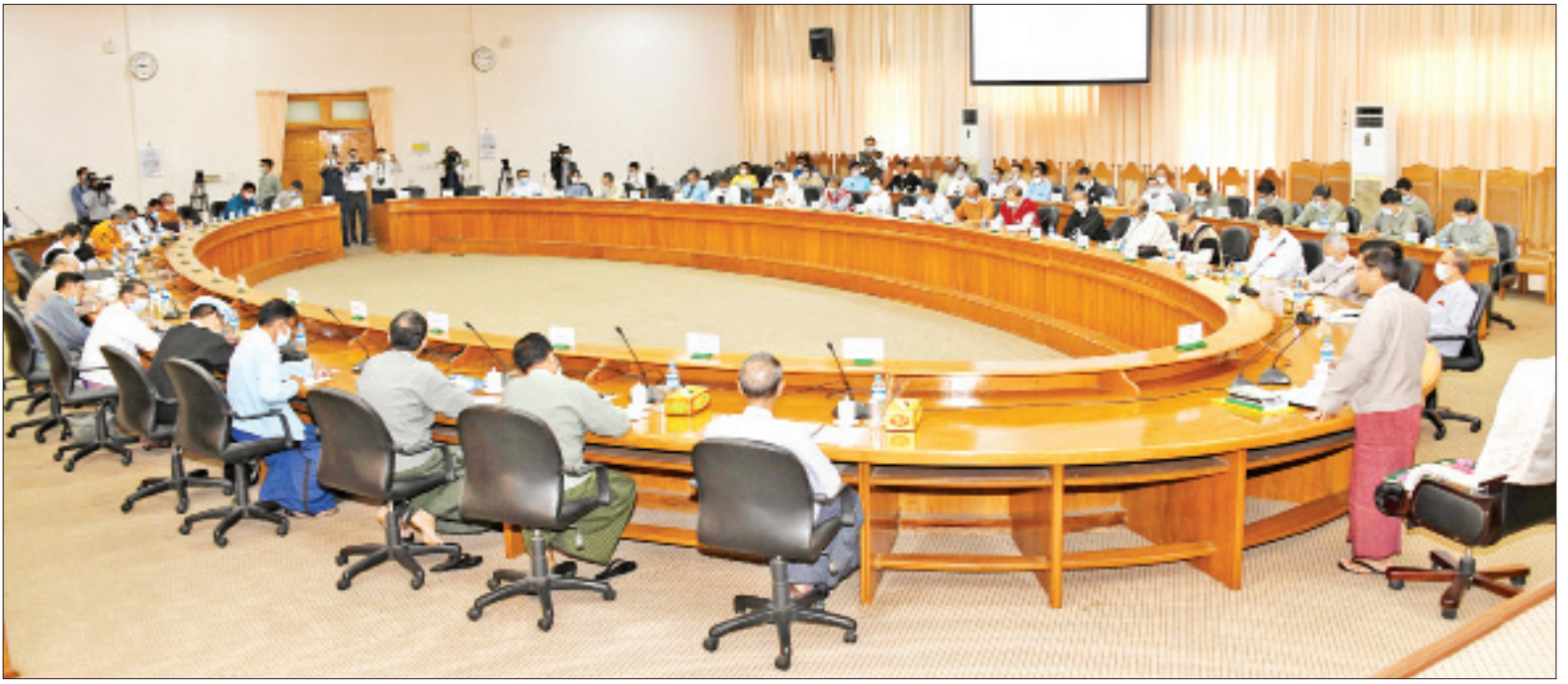
ပြည်ထောင်စုရွေးကောက်ပွဲကော်မရှင်ဥက္ကဋ္ဌ ဦးသိန်းစိုး၊ ပြည်ထောင်စုရွေးကောက်ပွဲကော်မရှင်နှင့် နိုင်ငံရေးပါတီများ တွေ့ဆုံညှိနှိုင်းအစည်းအဝေးတွင် အမှာစကား ပြောကြားစဉ်။

နေပြည်တော် ဖေဖော်ဝါရီ ၂၆ ပြည်ထောင်စုရွေးကောက်ပွဲကော်မရှင်နှင့် နိုင်ငံရေးပါတီများ တွေ့ဆုံညှိနှိုင်းအစည်းအဝေးကို ယနေ့ နံနက် ၉ နာရီတွင် နေပြည်တော်ရှိ ပြည်ထောင်စုရွေးကောက်ပွဲကော်မရှင်ရုံး အစည်းအဝေးခန်းမ၌ ကျင်းပသည်။