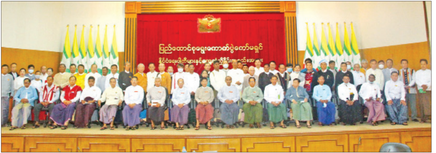
ပြည်ထောင်စုရွေးကောက်ပွဲကော်မရှင်ဥက္ကဋ္ဌ ဦးသိန်းစိုးနှင့် တာဝန်ရှိသူများ နိုင်ငံရေးပါတီ ၅၃ ပါတီမှ တာဝန်ရှိသူများနှင့်အတူ စုပေါင်းမှတ်တမ်းတင်ဓာတ်ပုံရိုက်စဉ်။

ပြည်ထောင်စုရွေးကောက်ပွဲကော်မရှင် အနေဖြင့် သက်ဆိုင်ရာ လွှတ်တော် အသီးသီးအတွက် ပြည်ထောင်စု ရွေးကောက်ပွဲကော်မရှင်က ထုတ်ပေး ထားသော လွှတ်တော်ကိုယ်စားလှယ် အဖြစ် အသိအမှတ်ပြုလွှာများသည် မဲမသမာမှုများအတွက် စုံစမ်းစစ်ဆေးမှု များ ပြုလုပ်နေစဉ်ကာလအတွင်း အကျိုး