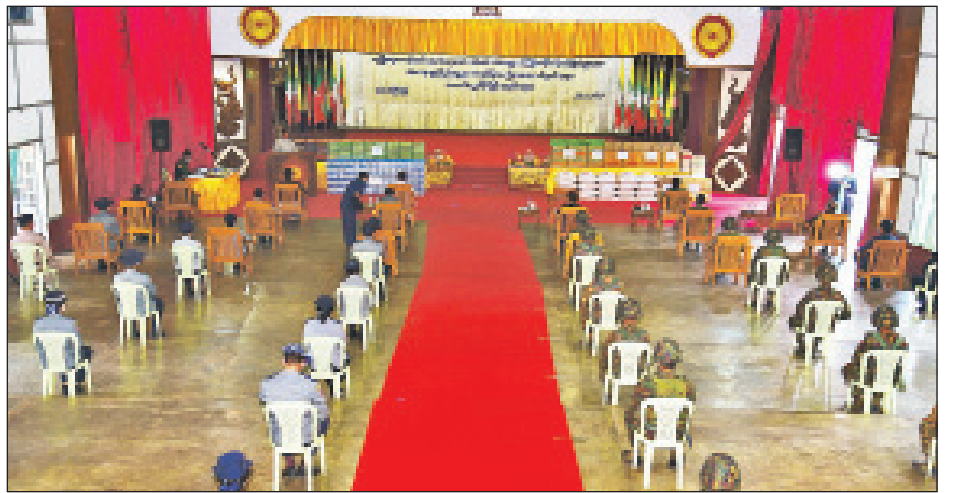
လှူဒါန်းပေးသောပစ္စည်းများမှာ ကြက်ဥ၊ ရေသန့်၊ ရည်၊ ဆီ၊ ကုလားပဲတို့ဖြစ်ကြောင်း သိရသည်။ ပဲပုပ်ကြော်၊ အသားတု၊ ကော်ဖီမစ်၊ ရွှေဖီဦး လက်ဖက်မောင်မောင်သန်း(တောင်ကြီး)

ဆက်လက်၍ ရှမ်းပြည်နယ် စီမံအုပ်ချုပ်ရေးကောင်စီဥက္ကဋ္ဌက စားသောက်ဖွယ်ရာများ ထောက်ပံ့ပေးအပ်လှူဒါန်းရာ အမှတ်(၉၄)ခြေလျင်တပ်ရင်း ဒုတိယတပ်ရင်းမှူး ဗိုလ်မှူးဇင်မင်းထွန်း၊ ပြည်နယ်ရဲတပ်ဖွဲ့ ရဲမှူးချုပ်တင်ကိုကို၊ မြန်မာနိုင်ငံ မီးသတ်တပ်ဖွဲ့မှ ပြည်နယ်ဦးစီးမှူးတို့က လက်ခံရယူပြီး အရှေ့ပိုင်းတိုင်း စစ်ဌာနချုပ်တိုင်းမှူး ဗိုလ်မှူးချုပ် နီလင်းအောင်က ကျေးဇူးတင်စကားပြန်လည်ပြောကြားသည်။ အဆိုပါ စေတနာရှင် အလှူရှင်များမှ ထောက်ပံ့