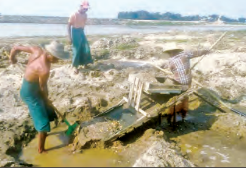
ရေစကြို ဖေဖော်ဝါရီ ၁၉

မကွေးတိုင်းဒေသကြီး ပခုက္ကူခရိုင် ရေစကြိုမြို့နယ် အောင်ပန်းကြောင်းကျေးရွာမှ ကျေးလက် တောင်သူများသည် မိသားစုစားဝတ်နေရေးအတွက် တစ်နိုင်တစ်ပိုင် ရွှေကျင်ခြင်းလုပ်ငန်းကို ဧရာဝတီမြစ်ကျိုးအင်းအစပ်များတွင် လုပ်ကိုင်လျက်ရှိရာ လုပ်သလောက် အကျိုးအမြတ်မရရှိသော်လည်း မိသားစုစားဝတ်နေရေးအတွက် လုပ်ကိုင်နေကြောင်း သိရသည်။ ယခုနှစ်တွင် မိုးကြက်သွန်စိုက်ပျိုးပြီး နတ်သိမ်း