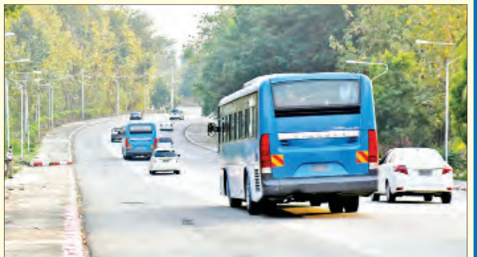
ဖေဖော်ဝါရီ ၁၉ ရက်က နေပြည်တော်ရှိ ဝန်ကြီးဌာနအသီးသီးမှ ရုံးဆင်းလာသည့် ဝန်ထမ်းများအား တင်ဆောင်လာသော ကြို/ပို့ယာဉ်များကို တွေ့ရစဉ်။