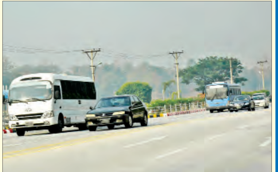
ဖေဖော်ဝါရီ ၁၉ ရက်က နေပြည်တော်ရှိ ဝန်ကြီးဌာနအသီးသီးသို့ ရုံးတက်လာသည့်ဝန်ထမ်းများအား တင်ဆောင်လာသော ကြို/ပို့ယာဉ်များကို တွေ့ရစဉ်။