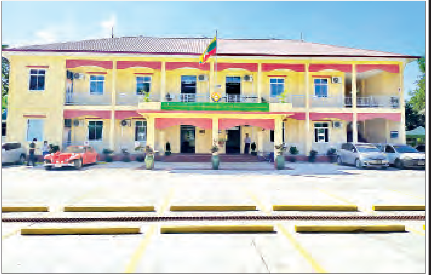
ရွာသာကြီး က.ည.န ရုံးသစ်ကြီးကို တွေ့ရစဉ်။

ထိုထောက်ကြန့် က.ည.နရုံးသည်လည်းကောင်း၊ ရွာသာကြီး က.ည.နရုံးသည်လည်းကောင်း ကိုဗစ်-၁၉ ကာလအတွေ့ရပ်နားထားပြီး ပြီးခဲ့သည့် ဒီဇင်ဘာ ၁ ရက်