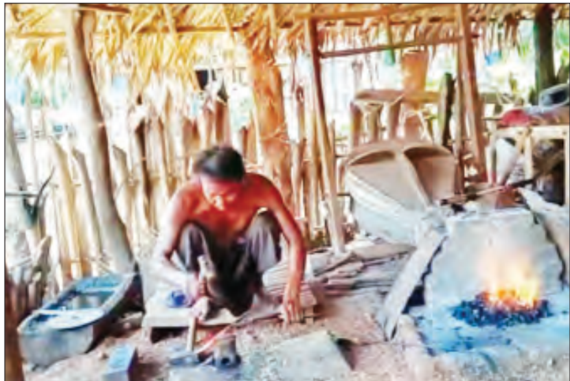
ရေနံချောင်း ဖေဖော်ဝါရီ ၁၉ မကွေးတိုင်းဒေသကြီး ရေနံချောင်းမြို့နယ်၌ မိရိုးဖလာ အိမ်တွင်းမူလုပ်ငန်းဖြစ်သည့် ပန်းပဲလုပ်ငန်းဖြင့်

မိသားစုဝင်ငွေရနေကြောင်း အဆိုပါလုပ်ငန်း လုပ်ကိုင်သူများထံမှ သိရသည်။ "လယ်ယာသုံးပစ္စည်း တံစဉ်လုပ်ကိုင်ပါတယ်။