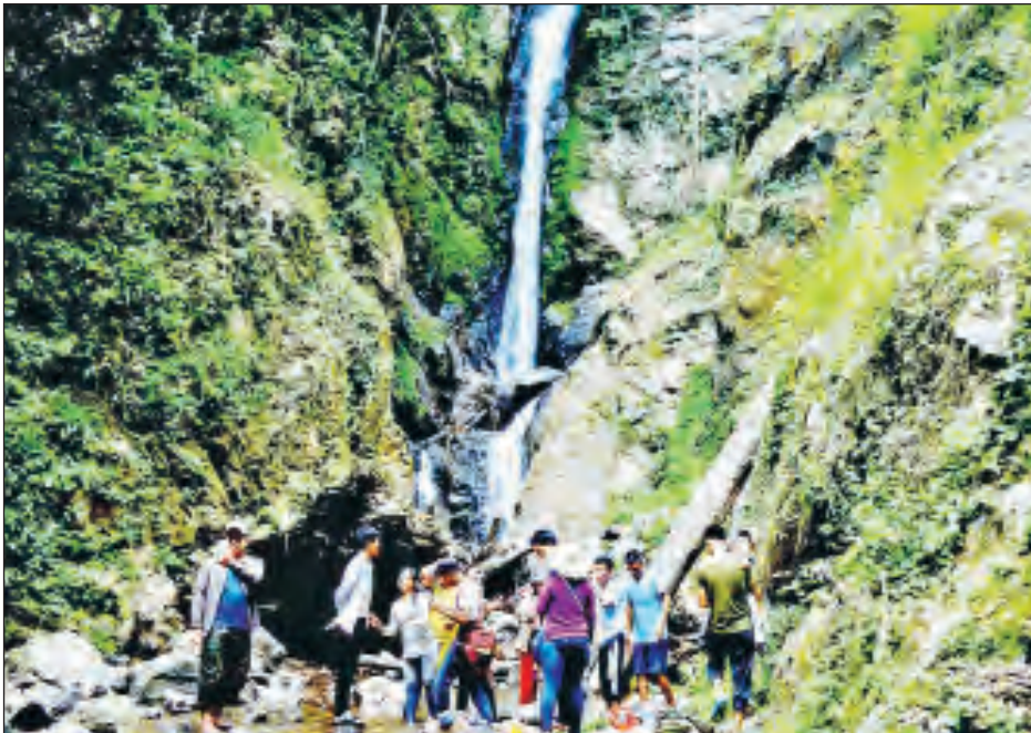
စတင်ပါတော့သည်။

ရှမ်းပြည်နယ်(အရှေ့ပိုင်း) တာချီလိတ်ခရိုင် နယ်စပ်ဒေသ မိုင်းယုမြို့သည် ရွှေဂဏန်း(ခ) ထပ်ပူခမ်းစေတီတော်နှင့် နယ်စပ်ဒေသသွင်းကုန်ပို့ကုန်များတင်ပို့ရာတွင် အဓိက ကျသည့် မိုင်းယု-ကျိန်းယန်းတံတားနှင့် ထင်ရှားသည့် နမ့်လွေချောင်းတို့ကို ယခင်က မိုင်းယုမြို့ခံပြည်သူနှင့် အနယ်နယ်အရပ်ရပ်မှ ဧည့်သည်များက သိနေကြသော် လည်း ယခု ၂၀၂၀ ပြည့်နှစ်နောက်ပိုင်း တစ်ဖက်ခြား အသစ်ထပ်မံ လူသိလာကြသည့် မိုင်းယုမြို့မိုင်းလွေ ကျေးရွာအုပ်စု မိုင်းလွေကျေးရွာ၏ အနောက်ဘက်မှ တစ်ဆင့် တောအနက် ငါးမိုင်းခန့်အကွာတွင်တည်ရှိပြီး သဘာဝအလှတရားများနှင့် ကျောက်ကမ်းပါးယံများ ကြားတွင် စိတ်ခြောက်ခြားစရာအသံတို့နှင့်အတူ ကောင်းကင် ယံမှ တစ်ဟုန်ထိုးထိုးဆင်းနေသည့်အလား လူသိနည်းပါး နေသေးသည့် မိုင်းလွေရေတံခွန်ကြီး ဖြစ်ပေသည်။