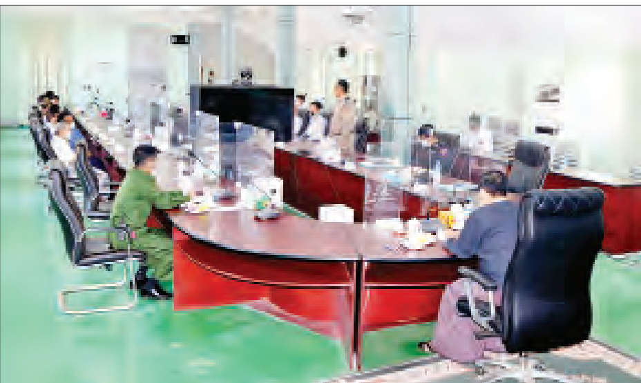
ဝင်းက လိုအပ်သည်များ ဖြည့်စွက် နှုတ်ဆက်ခဲ့ကြောင်း သိရသည်။ ပဲခူးမြို့ ဒေသခံလုပ်ငန်းရှင်များ လမ်းညွှန်မှာကြားပြီး တက်ရောက် အခမ်းအနားသို့ ပဲခူးတိုင်းဒေသကြီး တက်ရောက်ခဲ့ကြောင်း သိရသည်။ လာသည့် လုပ်ငန်းရှင်များအား စီမံအုပ်ချုပ်ရေးကောင်စီ ဥက္ကဋ္ဌ တစ်ဦးချင်း ရင်းရင်းနှီးနှီး လိုက်လံ ဦးမျိုးဆွေဝင်း၊ ကောင်စီဝင်များ၊

အတင်းအကြပ်ပြုခြင်း၊ နှောင့်ယှက် ခြင်း၊ ခြိမ်းခြောက်ခြင်း၊ တားဆီးခြင်း ကျူးလွန်မှုများ ပြုလုပ်နေသူများကို ဥပဒေနှင့်အညီ အရေးယူဆောင်ရွက် သွားနိုင်ရေးတိုင်ကြားရမည့် တယ်လီ ဖုန်းနံပါတ်နှင့် Email လိပ်စာများ ကိုလည်း အသိပေးထားပြီးဖြစ် ကြောင်းနှင့် ပြည်သူများ အလုပ်အကိုင် အခွင့်အလမ်းများ ရရှိနိုင်ရေး တစ်ပြိုင်တည်း ဖြည့်ဆည်းဆောင်ရွက် ပေးရန်ဖြစ်ကြောင်း အမှာစကား ပြောကြားခဲ့သည်။ ရှင်းလင်းတင်ပြ ထို့နောက် တက်ရောက်လာသည့် ပဲခူးမြို့ဒေသခံ စီးပွားရေးလုပ်ငန်းရှင် များက လက်ရှိလုပ်ငန်းဆောင်ရွက် နေမှု အခြေအနေအထား ရှင်းလင်း တင်ပြခဲ့ရာ ပဲခူးတိုင်းဒေသကြီး စီမံ အုပ်ချုပ်ရေးကောင်စီဥက္ကဋ္ဌ ဦးမျိုးဆွေ