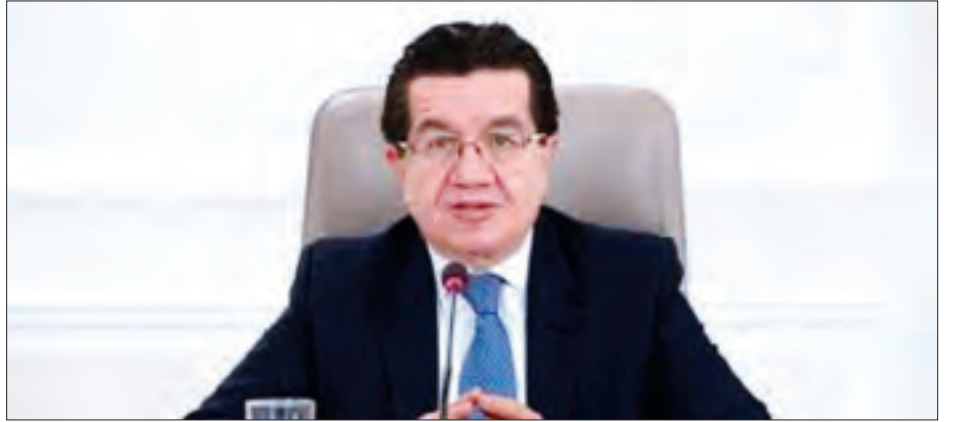
ကိုလံဘီယာ ကျန်းမာရေးနှင့် လူမှုစောင့်ရှောက်ရေးဝန်ကြီး ဖာနန်ဒိုရစ်။