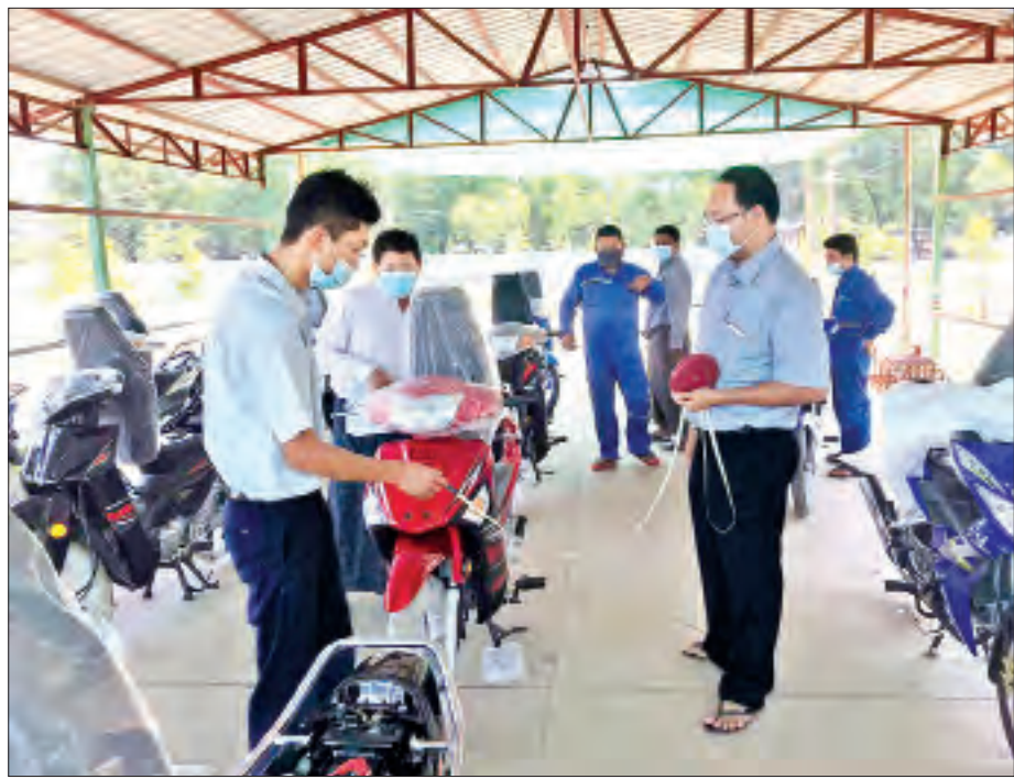
သန်လျင် က.ည.န ရုံး၌ ဆိုင်ကယ်သစ်များ ကနဦး မှတ်ပုံတင်ရန် စစ်ဆေးနေစဉ်။

သို့ဖြစ်၍ ကိုဗစ်-၁၉ ကာလ လွန်မြောက်လာသည်နှင့်အမျှ ရန်ကုန်မြို့၏ က.ည.နဝန်ဆောင်မှုလုပ်ငန်းများ ပြန်လည်ဆောင်ရွက်နိုင်တော့မည်ဖြစ်ပါသည်။ မော်တော်ယာဉ်သစ်များ ကနဦးမှတ်ပုံတင်ခြင်း၊ ဆိုင်ကယ်များ မှတ်ပုံတင်ခြင်း၊ လူလိုင်စင်သစ်များ လျှောက်ထားခြင်း၊ မော်တော်ယာဉ်များသက်တမ်းတိုးခြင်း စသော က.ည.န ဝန်ဆောင်မှုလုပ်ငန်းများကို အချိန်နှင့်တစ်ပြေးညီ လုပ်ကိုင်ဆောင်ရွက်နိုင်တော့မည်ဖြစ်ပါသည်။ ။