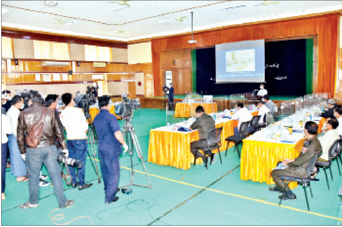
နိုင်ငံတော်စီမံအုပ်ချုပ်ရေးကောင်စီ သတင်းထုတ်ပြန်ရေးအဖွဲ့က သတင်းမီဒီယာများနှင့် တွေ့ဆုံ၍ သတင်းစာရှင်းလင်းပွဲပြုလုပ်စဉ်။

ဗိုလ်မှူးချုပ်ဇော်မင်းထွန်းက ဖြေကြား ရာတွင် အခြေခံဥပဒေနှင့်ပတ်သက်၍ လေ့လာသည့်အခါမှာ မိမိခဏာဏ