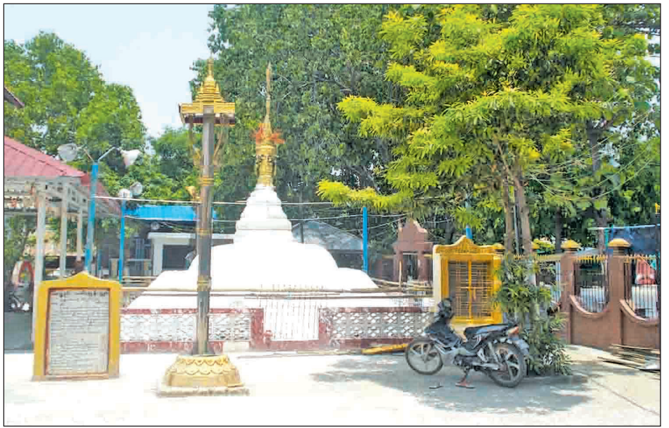
သမိုင်းဝင် မန္တလေးမြို့မှ မဟာဝါဠုက သံပုံစေတီဘုရားပွဲ နှစ်စဉ်ပြုလုပ်သော သံပုံစေတီသည် နောက်နှစ်သံပုံ စေတီပွဲအထိတည်ရှိပြီး တစ်နှစ်တစ်ခါ သံပုံစေတီအသစ် ပြုလုပ်ပူဇော်လေ့ရှိသည်။ ယခုအခါ မန္တလေးမြို့မှ သမိုင်း ဝင် သံပုံစေတီကို လေ့လာဖူးမြော်နိုင်သည်။ နေနဒီ(မြစ်ငယ်)

ပေါင်း လဲတိုက်တွင် သီတင်းသုံးခဲ့ရာ ၁၁၅၈ ခုနှစ်တွင် ဘဝနတ်ထံ ပျံလွန်တော်မူသွားခဲ့သည်ဟုလည်း သိရသည်။ ရွှေတချောင်းမြောင်းဘေးတွင် ယိုးဒယားတို့၏ ရှေးရိုးရာ မပျက် သံပုံစေတီ တည်ထားပူဇော်ကိုးကွယ်ခွင့်လျှောက် ထားတောင်းပန်ခဲ့သဖြင့် ၁၁၄၅ ခုနှစ်မှစကာ ဘိုးတော် ဗဒုံမင်းတရားကြီးက ခွင့်ပြုရာမှ စတင်ကျင်းပခဲ့သည်။ ထိုကာလမှ နောက်ပိုင်းအထိ ထိုင်း(ယိုးဒယား) အဆက် အနွယ် လူကြီးများက ဆက်လက်ဦးစီးထိန်းသိမ်း ကျင်းပ လာခြင်းမှသည် ယနေ့အထိ သံပုံစေတီပွဲကို ကျင်းပလေ့ရှိ ကြောင်း သိရသည်။ သံပုံစေတီအောက်ခြေမှ စိန်ဖူးတော်အထိ ညာဏ်တော် ၂၁ ပေရှိသည်။ လုံးပတ်မှာ ၄၃ ပေရှိသည်။ နှစ်စဉ်နှစ်တိုင်း သင်္ကြန်အကြတ်နေ့တွင် ရပ်ရွာထဲမှ ရပ်ကွက်သူရပ်ကွက် သားများက သဲများစုပုံကာ နေ့ချင်းပြီးအောင်တည်ကြ ရပြီး ထုံးသက်နံပါကပ်ကြရသည်။ သင်္ကြန်အတက်နေ့တွင် ထီးတော်နှင့် စိန်ဖူးတော်တင်ကြရသည်။ နှစ်ဆန်းတစ်ရက်နေ့ တွင် ပင့်သံဃာတော်များက သံပုံစေတီကို အနေကဇာ တင်ကြရသည်။