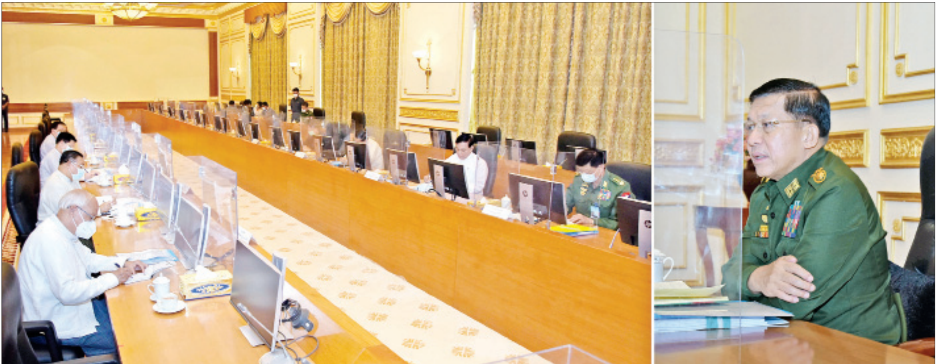
နိုင်ငံခြားရေးရာ မူဝါဒကော်မတီဥက္ကဋ္ဌ၊ နိုင်ငံတော်စီမံအုပ်ချုပ်ရေးကောင်စီဥက္ကဋ္ဌ ဗိုလ်ချုပ်မှူးကြီး မင်းအောင်လှိုင် နိုင်ငံခြားရေးရာမူဝါဒကော်မတီ၏ (၁/၂၀၂၁) ကြိမ်မြောက် အစည်းအဝေးတွင် အမှာစကားပြောကြားစဉ်။

နေပြည်တော် ဖေဖော်ဝါရီ ၁၈ နိုင်ငံခြားရေးရာမူဝါဒကော်မတီ၏ (၁/၂၀၂၁)ကြိမ်မြောက် အစည်းအဝေးကို ယနေ့မွန်းလွဲပိုင်းတွင် နေပြည်တော်ရှိ နိုင်ငံတော်စီမံအုပ်ချုပ်ရေးကောင်စီ ဥက္ကဋ္ဌ ရုံး အစည်းအဝေးခန်းမ၌ ကျင်းပရာ နိုင်ငံခြားရေးရာမူဝါဒကော်မတီဥက္ကဋ္ဌ၊ နိုင်ငံတော်စီမံအုပ်ချုပ်ရေးကောင်စီဥက္ကဋ္ဌ၊ တပ်မတော်ကာကွယ်ရေးဦးစီးချုပ် ဗိုလ်ချုပ်မှူးကြီး မင်းအောင်လှိုင် တက်ရောက်အမှာစကားပြောကြားသည်။