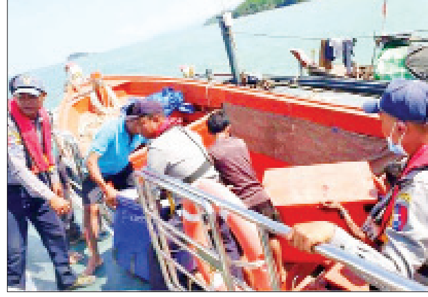
ကျော်စိုး(ကျေးသောင်း)

လှေနစ်မြုပ်မှုဖြစ်စဉ်နှင့်စပ်လျဉ်း၍ လှေပေါ်ပါ ပစ္စည်းတချို့ပျက်စီးဆုံးရှုံး ခဲ့ပြီး လှေလုပ်သားများအားလုံးကို အသက်အန္တရာယ်ဖြစ်ပေါ်မှုမရှိဘဲ ကူညီ ကယ်ဆယ်နိုင်ခဲ့ကြောင်း၊ ပျက်စီးခဲ့သည့်လှေအား လွန်းတင်ပြင်ဆင်ဆောင်ရွက် ပေးလျက်ရှိကြောင်း ကျေးသောင်းရေကြောင်းရဲတပ်ဖွဲ့၏ သတင်းပေးပို့ချက် အရ သိရသည်။