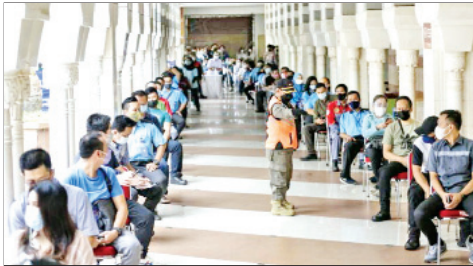
သည့်အရှေ့တောင်အာရှနိုင်ငံများအနက် ဗိုင်းရပ်စ်ကူးစက်မှု အများဆုံးဖြစ်သည်။ ကာကွယ်ဆေးထိုးနှံမှုအစီအစဉ်ကို လွန်ခဲ့သောလကစတင်ခဲ့ပြီး လာမည့် ၁၅ လအတွင်း လူဦးရေ သန်း၂၇၀ ရှိသည့်အနက် ပြည်သူ ၁၈၁ ဒသမ ၅

အင်ဒိုနီးရှားနိုင်ငံသည် ကိုဗစ်-၁၉ ရောဂါကူးစက်ခံရ