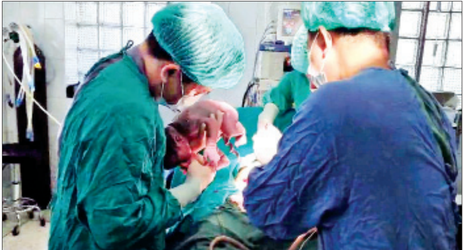
ယနေ့တွင် သက်ဆိုင်ရာမြို့နယ်များရှိ နယ်မြေခံ တပ်မတော်ဆေးရုံများသို့ ဆေးရုံလာရောက်ပြသသူများနှင့် ဆေးရုံတက်လူနာများအား သက်ဆိုင်ရာတိုင်းစစ်ဌာနချုပ်အသီးသီးမှ တိုင်းမှူးများနှင့် တာဝန်ရှိသူများက သွားရောက်ကြည့်ရှုအားပေးပြီး ဆေးရုံတက်ရောက်ကုသမှုခံယူနေသော လူနာများအတွက် စားသောက်ဖွယ်ရာများ ပေးအပ်ကြသည်။ ထို့အတူ ရန်ကုန်တိုင်းဒေသကြီး မင်္ဂလာဒုံမြို့နယ်ရှိ တပ်မတော်ဆေးရုံကြီး(ခုတင်-၁၀၀၀)နှင့် တပ်မတော်

နေထိုင်စားသောက်ရေး အဆင်ပြေစေရန်အတွက် စီမံဆောင်ရွက်ပေးလျက်ရှိသည်။ ထိုသို့ လာရောက်ကုသမှုခံယူလျက်ရှိသည့် လူနာများအနက် အကြီးစား ခွဲစိတ်ကုသရန် လိုအပ်သူ ၇၀၂ ဦး၊ အသေးစားခွဲစိတ်ကုသရန်လိုအပ်သူ ၃၃၄ ဦး စုစုပေါင်း ၁၀၃၆ ဦး တို့ကို ခွဲစိတ်ကုသပေးနိုင်ခဲ့ပြီး စိုးရိမ်ဖွယ်ရာရှိသည့် လူနာများကိုလည်း ပါရဂူများ၊ ဆေးမှူးများဖြင့် အထူးကြပ်မတ် ကုသပေးလျက်ရှိသည်။ ၎င်းအပြင် ကလေးမီးဖွားရန် အခက်အခဲဖြစ်နေသည့် မွေးလူနာများကို တပ်မတော်ဆေးရုံအသီးသီးတွင် တက်ရောက်စေလျက်ရှိပြီး ၎င်းတို့အနက် ၄၀၇ ဦးကို ခွဲစိတ်မွေးဖွားပေးနိုင်ခဲ့ကာ ၆၂၀ ကို သာမန် မွေးဖွားပေးနိုင်ခဲ့ခြင်းကြောင့် ယနေ့အထိ အနာဂတ်မျိုးဆက်သစ် ကလေးငယ် ၁၀၂၇ ဦးကို မွေးဖွားနိုင်ခဲ့သည်။