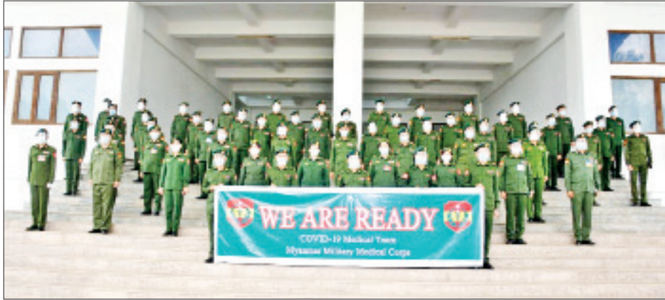
တာဝန်ထမ်းဆောင်မည့် ဆေးဝန်ထမ်းတပ်ဖွဲ့ဝင်များကိုယ်စား အဖွဲ့ဝင်တစ်ဦးက သွားရောက်သည့်ရည်ရွယ်ချက်နှင့် ဆောင်ရွက်ရမည့် လုပ်ငန်းအခြေအနေများကို ရှင်းလင်းတင်ပြသည်။ ထို့နောက် တိုင်းမှူးက ဆေးဝန်ထမ်းအဖွဲ့အား စားသောက်ဖွယ်ရာများ ပေးအပ်သည်။ လှည်းကူးမြို့နယ် ကိုဗစ်-၁၉ ရောဂါကုသရေးဌာန(ဖောင်ကြီး)တွင် တာဝန်ထမ်းဆောင်ကြမည့် ဆေးဝန်ထမ်းတပ်ဖွဲ့ဝင်များတွင် မေ့ဆေးပါရဂူ သုံးဦး၊ အဏုဇီဝပါရဂူ

နေပြည်တော် ဖေဖော်ဝါရီ ၁၈ ကိုဗစ်-၁၉ ရောဂါ ကာကွယ်၊ ထိန်းချုပ်၊ ကုသရေးလုပ်ငန်းများ အရှိန်အဟုန်မြှင့် ဆောင်ရွက်နိုင်ရန် ဖွင့်လှစ်ထားရှိသည့် ရန်ကုန်တိုင်းဒေသကြီး လှည်းကူးမြို့နယ် ကိုဗစ်-၁၉ ရောဂါ ကုသရေးဌာန(ဖောင်ကြီး)တွင် တပ်မတော်ဆေးဝန်ထမ်းတပ်ဖွဲ့ဝင် ပါရဂူများနှင့် ဆေးမှူးဆရာဝန်များ ပါဝင်သော ဆေးအဖွဲ့များက ပါဝင်ကူညီတာဝန်ထမ်းဆောင်လျက်ရှိသည်။