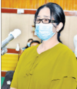
ရဲတပ်ဖွဲ့ဝင်အနေဖြင့် လောက်လေးခွ ကိုင်ဆောင်ခွင့်ရှိပါသလားဆိုတာသိချင်ပါ ကြောင်း မေးမြန်းသည်။