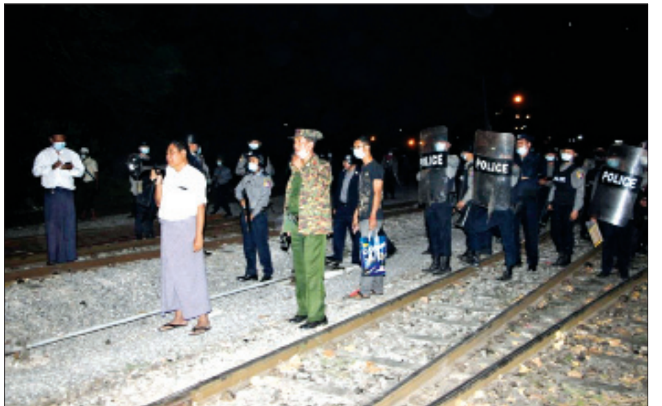
ထိုသို့ ဆောင်ရွက်ခဲ့ခြင်းကြောင့် ယနေ့နံနက်ပိုင်းတွင် မန္တလေး-သာစံ မီးရထားလမ်းပိုင်း ဘေးအန္တရာယ်ကင်းရှင်းမှုစစ်ဆေးနိုင်ရေးအတွက် စက်ခေါင်းတွဲတစ်တွဲ ရှေ့ပြေးထွက်ခွာပြေးဆွဲနိုင်ခဲ့ပြီးဖြစ်ကြောင်းနှင့် တပ်မတော်သားများနှင့် မြန်မာနိုင်ငံရဲတပ်ဖွဲ့ဝင်များအနေဖြင့် နိုင်ငံအတွင်း သတင်းစဉ်

ထိုသို့ ပြုလုပ်ခြင်းများကြောင့် မြန်မာ့မီးရထားမှ အထက်မြန်မာပြည်အထွေထွေမန်နေဂျာ၊ မြို့နယ်အုပ်ချုပ်ရေးမှူးနှင့် တာဝန်ရှိသူများက ဆူပူလှုံ့ဆော်ဆန္ဒပြသူများအား တွေ့ဆုံ၍ အများပြည်သူများ၏ ခရီးသွားလာမှု လွယ်ကူချောမွေ့စေရေး ဆောင်ရွက်နေသည်ကို နှောင့်ယှက်ခြင်းများ မပြုလုပ်ကြရန် မေတ္တာရပ်ခံခဲ့ပြီး လုံခြုံရေးတပ်ဖွဲ့ဝင်များက ၎င်းတို့ပိတ်ဆို့ထားသည့် အတားအဆီးများကို ဖယ်ရှားဆောင်ရွက်စဉ် ဆူပူလှုံ့ဆော်ဆန္ဒပြသူများက လုံခြုံရေးတပ်ဖွဲ့ဝင်များအား ရထားလမ်းပေါ် ယာမှ ကျောက်ခဲများဖြင့် ပစ်ခတ်ခြင်း၊ တုတ်၊ ဓားများဖြင့် ပစ်ခတ်ရန်ပြုလာသောကြောင့် မြန်မာနိုင်ငံရဲတပ်ဖွဲ့ဝင်များက သတိပေးပြီး အနည်းဆုံးအင်အား၊ အနိမ့်ဆုံးအဆင့်ဖြင့် ရော်ဘာကျည်များဖြင့် ပြန်လည်ခြောက်လှန့်ပစ်ခတ်ခဲ့ရာ ည ၉ နာရီခန့်မှသာ ဆူပူလှုံ့ဆော်ဆန္ဒပြသူများအား လူစုခွဲရှင်းလင်းနိုင်ခဲ့ပြီး ဆူပူလှုံ့ဆော်ဆန္ဒပြမှုတွင် ပါဝင်ပတ်သက်သူများအား လိုအပ်သလို ဖော်ထုတ်အရေးယူနိုင်ရေး ဆက်လက်ဆောင်ရွက်လျက်ရှိသည်။