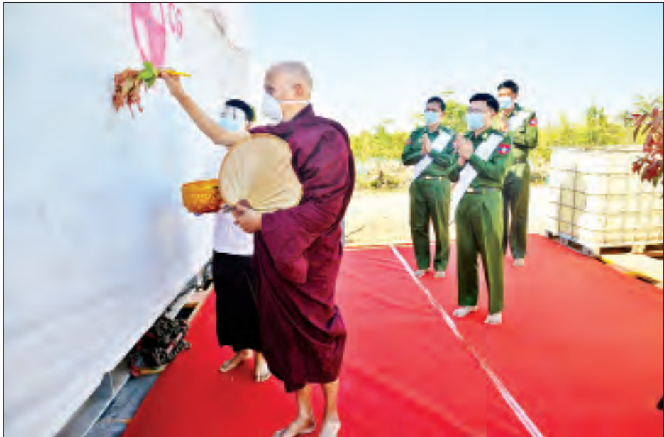
အပိုင်း ၄ မှာ အလေးချိန် တန် ၆၇၀ ရှိပြီး ဒုတိယအကြိမ်အဖြစ် ကြိုဆိုပင့်ဆောင်ခြင်းဖြစ်ကြောင်းနှင့် ကျန်ရှိသည့် ဗုဒ္ဓရုပ်ပွားတော်မြတ်ကြီး၏ ဆင်းတုတော်နှင့် ပလ္လင်တော် အစိတ်အပိုင်းများကို ဆက်လက် ပင့်ဆောင်ပူဇော်သွားမည် ဖြစ်ကြောင်း တပ်မတော်ကာကွယ်ရေးဦးစီးချုပ်ရုံး၏ သတင်းထုတ်ပြန်ချက်အရ သိရသည်။ သတင်းစဉ်

ဧည့်သည်တော်များ တက်ရောက်ကြသည်။ ရှေးဦးစွာ ဒက္ခိဏသီရိမြို့နယ် သံဃနာယကဥက္ကဋ္ဌ ဆရာတော်အမှူးပြုသော သံဃာတော်အရှင်သူမြတ်တို့က မေတ္တာပို့ဂါထာတော်များကို ရွတ်ဆိုပူဇော်၍ မေတ္တာပြုတော်မူသည်။ ထို့နောက် ဘုရားဒါယကာ၊ ဒါယိကာမများနှင့် ဧည့်ပရိသတ်အပေါင်းတို့က ရတနတ္ထယု ပူဇော်ကာ၊ ဘုရားဂုဏ်တော် ၉ ပါး၊ ပဋ္ဌာန်းပစ္စယုဒ္ဓေသပါဠိတော်နှင့် မေတ္တာပို့လင်္ကာများကို သံပြိုင်ညီညာစွာ ရွတ်ဆိုပူဇော်ကြသည်။ ဆက်လက်၍ ဘူမိဗဿမုဒြာထိုင်တော်မူကျောက်ဆစ်ဗုဒ္ဓရုပ်ပွားတော်မြတ်ကြီး၏ ပလ္လင်တော် အပိုင်း ၁ နှင့် အပိုင်း ၄ တို့ကို ဒက္ခိဏသီရိမြို့နယ် သံဃနာယကဥက္ကဋ္ဌ ဆရာတော်ဦးဆောင်၍ တက်ရောက်လာကြသည့် တပ်မတော်အရာရှိကြီးများ၊ ဘုရားဒါယကာများက အမွှေးနံ့သာရည်များ ပက်ဖျန်းပူဇော်ကြပြီး ဇယမင်္ဂလာအောင်ဂါထာတော်များကို ရွတ်ဆိုပူဇော်ကြသည်။ ထို့နောက် မင်္ဂလာအချိန်တွင် ဘူမိဗဿမုဒြာထိုင်တော်မူကျောက်ဆစ်ဗုဒ္ဓရုပ်ပွားတော်မြတ်ကြီး၏ ပလ္လင်တော်အပိုင်း ၁ နှင့် အပိုင်း ၄ တို့ကို အပူဇော်ခံမည့်နေရာသို့ ဆက်လက်ပင့်ဆောင်ကြသည်။