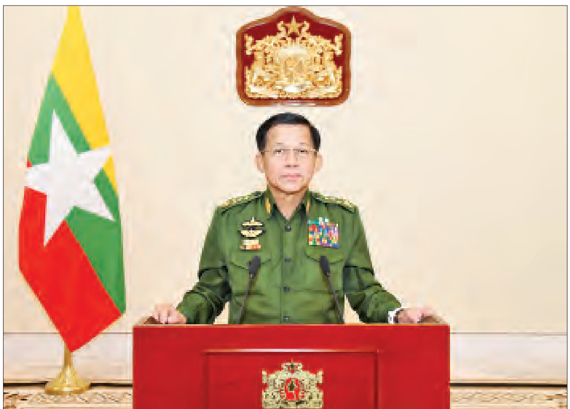
ပြည်ထောင်စုသမ္မတမြန်မာနိုင်ငံတော်၊ နိုင်ငံတော်စီမံအုပ်ချုပ်ရေးကောင်စီဥက္ကဋ္ဌ ဗိုလ်ချုပ်မှူးကြီးမင်းအောင်လှိုင် ပြည်သူလူထုသို့ မိန့်ခွန်းပြောကြားစဉ်။

ပြည်ထောင်စုဖွား တိုင်းရင်းသား မိဘပြည်သူ များခင်ဗျာ ယခုနှစ် ဖေဖော်ဝါရီလ ၁၂ ရက်နေ့မှာ ကျရောက်မယ့် (၇၄)နှစ်မြောက် ပြည်ထောင်စု နေ့အခါသမယမှာ ကျွန်တော်တို့ပြည်ထောင်စု မြန်မာနိုင်ငံတစ်ဝန်းလုံး အေးချမ်းသာယာပါ စေကြောင်းနဲ့ ပြည်ထောင်စုဖွား တိုင်းရင်းသား အားလုံးလည်း စည်းလုံးညီညွတ်စွာဖြင့် အမိနိုင်ငံတော်အကျိုးကို ဆက်လက်ဆောင် ရွက်နိုင်ပါစေကြောင်း ဦးစွာဆန္ဒပြုမေတ္တာ ပို့သအပ်ပါတယ်။ မရှိမဖြစ် အထူးလိုအပ် ကျွန်တော်တို့နိုင်ငံတော်စီမံအုပ်ချုပ်ရေး ကောင်စီအနေနဲ့ အရေးပေါ်ကာလ နိုင်ငံတော် ရဲ့တာဝန်တွေ ထမ်းဆောင်နေစဉ်ကာလ အတွင်းမှာ နိုင်ငံတော်ရဲ့တည်ငြိမ်အေးချမ်း ရေး၊ စည်းလုံးညီညွတ်ရေးနဲ့ တိုင်းရင်းသား ပြည်သူအားလုံးရဲ့ လူမှုစီးပွားဘဝဖွံ့ဖြိုး တိုးတက်ရေးတို့အတွက် အားသန်ခွန်စိုက် ကြိုးပမ်းဆောင်ရွက်လျက်ရှိပါတယ်။ ဒီလို ဆောင်ရွက်တဲ့နေရာမှာ တိုင်းရင်းသား ပြည်သူအားလုံးရဲ့ ပူးပေါင်းဆောင်ရွက်မှု ခွန်အားများ မရှိမဖြစ် အထူးလိုအပ်ပါတယ်။ တိုင်းပြည်ရဲ့အားဟာ ပြည်တွင်းမှာပဲ ရှိပါတယ်။ စာမျက်နှာ ၄ ကော်လံ ၁ သို့ ✨