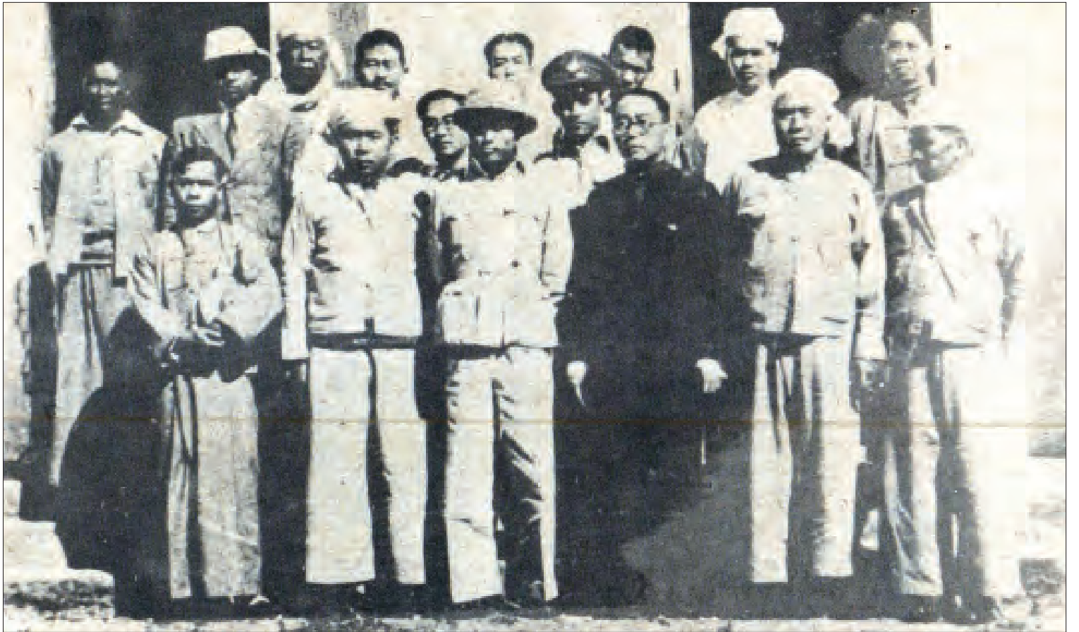
ဗိုလ်ချုပ်အောင်ဆန်း၏ ၁၉၄၆ ခုနှစ် ရှမ်းပြည်နယ်ခရီးစဉ်တွင် ညောင်ရွှေဟော်၌ စော်ဘွားများနှင့် တွေ့ဆုံစဉ်။

စည်းလုံးညီညွတ်ရေးသည် နိုင်ငံတော် တည်ဆောက်ရေး၌ အလွန်အရေးပါလှပေ သည်။ ပုဂံခေတ် အနော်ရထာမင်းကြီး၏ ဦးဆောင်ဦးရွက်ပြုမှု၊ ကျန်စစ်သားမင်းကြီး၏ စည်းလုံးညီညွတ်မှု စွမ်းရည်တို့ကြောင့် ပုဂံသူ၊ ပုဂံသားများအပါအဝင် ပုဂံပြည်၌ရှိနေကြသော မွန်လူမျိုး၊ ပျူလူမျိုးတို့၏ စည်းလုံးညီညွတ် မှုသက်သေ “ရှေးဟောင်းယဉ်ကျေးမှု နယ်မြေ