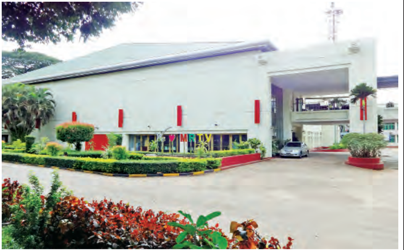
ရန်ကုန်မြို့ရှိ မြန်မာ့အသံနှင့် ရုပ်မြင်သံကြားကို တွေ့ရစဉ်။

မြန်မာနိုင်ငံမှာ ရုပ်မြင်သံကြား ထုတ်လွှင့်မှုနဲ့ ပတ်သက်ပြီး ၁၉၈၉ ခုနှစ် နိုင်ငံတော်ပိုင်စီးပွားရေးလုပ်ငန်းများဥပဒေ (The State - Owned Economic