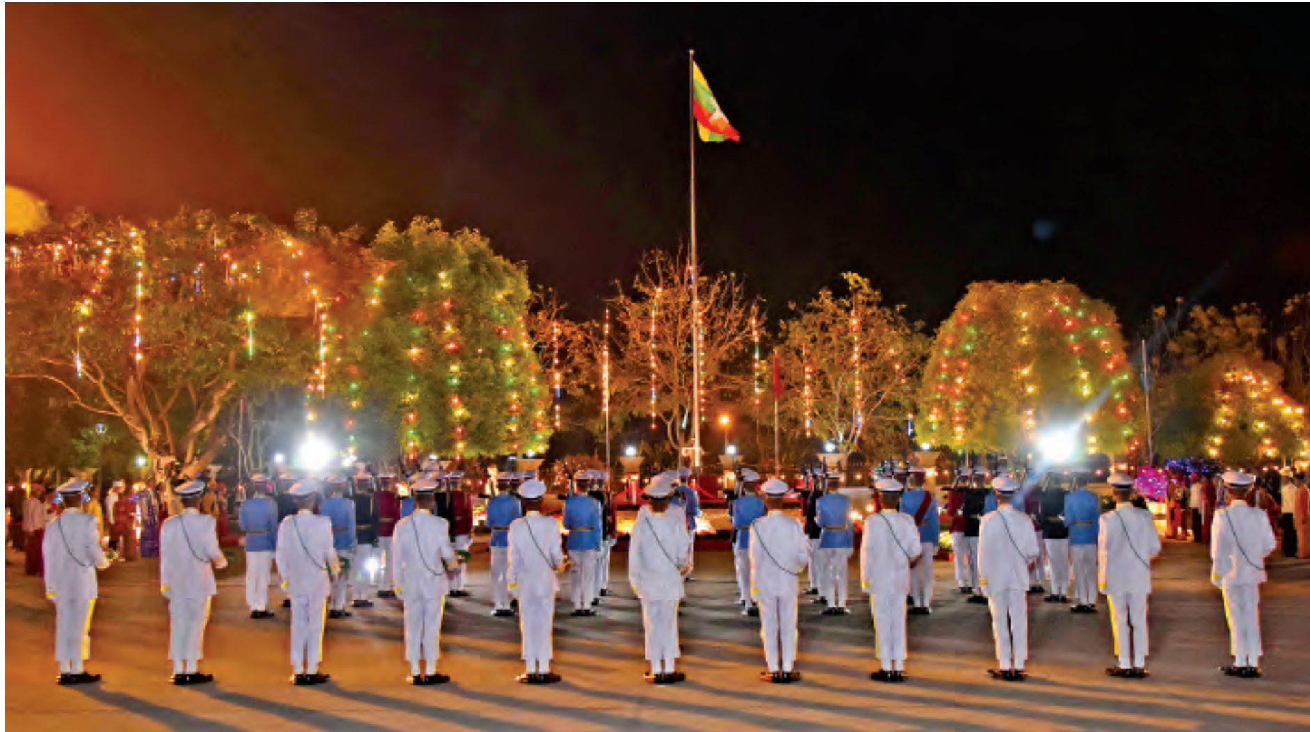
၂၀၂၀ ပြည့်နှစ် (၇၄)နှစ်မြောက် ပြည်ထောင်စုနေ့ နိုင်ငံတော်အလံတင်အခမ်းအနား ကျင်းပစဉ်။