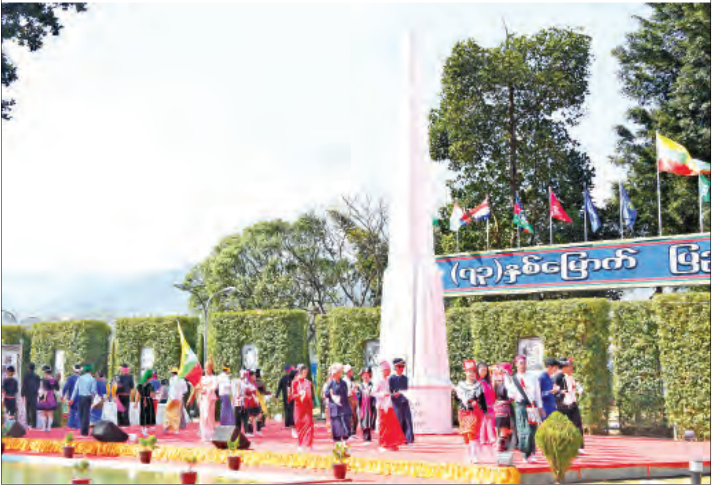
၂၀၂၀ ပြည့်နှစ် ဖေဖော်ဝါရီ ၁၂ ရက်က ရှမ်းပြည်နယ် ပင်လုံမြို့၊ ပြည်ထောင်စုကျောက်တိုင်ကွင်း၌ (၇၇)နှစ်မြောက် ပြည်ထောင်စုနေ့ အခမ်းအနား ကျင်းပစဉ်။

ကချင်၊ ကယား၊ ကရင်၊ ချင်း၊ ဗမာ၊ မွန်၊ ရခိုင်၊ ရှမ်း စသည့် တိုင်းရင်းသားများနှင့် တိုင်းရင်းသားမျိုးနွယ်စုဝင်များ သည် သမိုင်းအစ ရှေးပဝေ သဏီကပင် ပြည်ထောင်စုကြီး အနံ့ နေရာဒေသအသီးသီး၌ ရောနှောနေထိုင်လာခဲ့ကြပေ သည်။ တစ်မြေတည်းနေ တစ်ရေတည်း သောက်၍ အတူတကွ ပေါင်းစည်းနေထိုင် လာခဲ့ကြသည်မှာ ယနေ့ကာလ တိုင်ဖြစ်