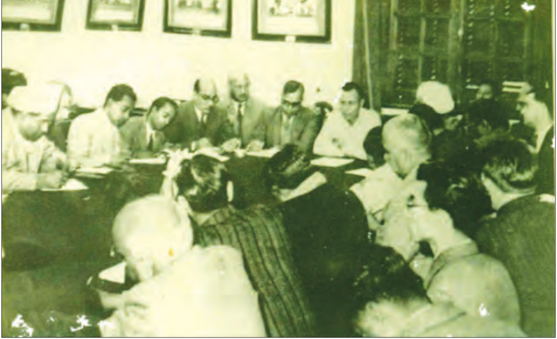
၁၉၄၇ ခုနှစ် ဇန်နဝါရီလက အင်္ဂလန်နိုင်ငံသို့ သွားရောက်ရန် အိန္ဒိယနိုင်ငံသို့ရောက်ရှိလာသော ဗိုလ်ချုပ်အောင်ဆန်းအား နယူးဒေလီမြို့ သတင်းစာရှင်းလင်းပွဲတွင် တွေ့ရစဉ်။

မိမိအတွက် အသက်အန္တရာယ်ရှိမှန်း သိကြသော်လည်း အများအကျိုး၊ တိုင်းပြည်အကျိုးအတွက် မိမိအသက်ကို မငဲ့ကွက်ဘဲ ကျန်းမာရေးဝန်ထမ်းများ၊ ဆရာဝန် ဆရာမများ၊ သူနာပြုများ၊ ပရဟိတလုပ်အားပေးများ၊ စေတနာရှင် အလှူရှင်များစွာတို့က စည်းလုံးညီညွတ်စွာ ဝိုင်းဝန်းကူညီဆောင်ရွက်ခဲ့ကြပါသည်။ ရဟန်းသံဃာတော်၊ ဆရာတော်ကြီးများကလည်း ပရိတ်တရားတော်များ ရွတ်ဖတ်ပေးခြင်း၊ ပရိတ်ရေများ ပက်ဖျန်းပေးခြင်း၊ မြေပြင်ပေါ်တင်သာမက ဝေဟင်ပေါ်မှလည်း လေယာဉ်ဖြင့် လှည့်လည်ရွတ်ဖတ်ပေးခြင်း၊ မေတ္တာပို့ခြင်းစသည့်အရံအတားများဖြင့် စောင့်ရှောက်ပေးကြပါသည်။ မိမိနိုင်ငံအတွက် ကမ္ဘာ့ကပ်ရောဂါဘေးဆိုးကြီးမှ လွတ်မြောက်အောင် အားလုံးဝိုင်းဝန်း ပူးပေါင်းဆောင်ရွက်ကြသဖြင့် ဆိုးရွားသည့်အခြေအနေသို့ မရောက်ခဲ့ပါချေ။ စေတနာ၊ မေတ္တာထားကာ စည်းလုံးညီညွတ်မှုဖြင့် ပူးပေါင်းဆောင်ရွက်ပါက အရာရာကို အောင်မြင်နိုင်ကြောင်း လက်တွေ့ပြသလိုက်ခြင်းပင် ဖြစ်ပါသည်။ ပြည်ထောင်စုကြီး တည်ရှိနေသရွေ့ တိုင်းရင်းသားစည်းလုံးညီညွတ်ရေး စိတ်ဓာတ်၊ ပြည်ထောင်စုစိတ်ဓာတ်မှာ ထာဝရခိုင်မြဲနေမည်ဖြစ်ပါသည်။ ။