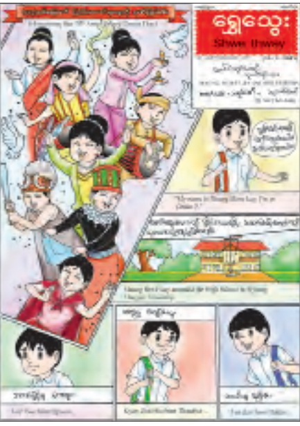
သတင်းစဉ်

နေပြည်တော် ဖေဖော်ဝါရီ ၁၁ ပြန်ကြားရေးဝန်ကြီးဌာန ပုံနှိပ်ရေးနှင့်ထုတ်ဝေရေးဦးစီးဌာန စာပေဗိမာန်ရုံးက အပတ်စဉ် စနေနေ့တိုင်း ရွှေသွေးဂျာနယ်ကို ထုတ်ဝေဖြန့်ချိလျက်ရှိသည်။ ဖေဖော်ဝါရီလ ၁၃ ရက် (စနေနေ့)တွင် ထုတ်ဝေမည့် ရွှေသွေးဂျာနယ်တွင် လူကောင်ထွားကျိုင်းပြီး သူငယ်ချင်းများကို အနိုင်ကျင့်တတ်သော သာဝေါကို မောင်ထွေးလေးနှင့် သူငယ်ချင်းများက သင်ခန်းစာ ပေးသည့်အကြောင်းကို တင်ဆက်ထားသည့် “မောင်ထွေးလေးနှင့် သူငယ်ချင်းများ” မျက်နှာဖုံးကာတွန်း၊ ရိုးရာပွဲတော်များနှင့်စည်ကားပြီး ရာသီအလှ၊ ဒါနကုသိုလ်များနှင့် ကျက်သရေရှိသည့် တပို့တွဲလ အကြောင်းကို ရေးသားတင်ဆက်ထားသည့် “တပို့တွဲလနှင့်ရာသီပွဲတော်များ” သုတဆောင်းပါး၊ ရွှေသွေး တို့အတွက် ပတ်ဝန်းကျင်ဆိုင်ရာ ဝေါဟာရများကို ရေးသားတင်ဆက်ထားသည့် “ရွှေသွေးဝေါဟာရ” ရုပ်ပြအဘိဓာန်ကဏ္ဍ၊ မြန်မာ့ရိုးရာ တူရိယာများထဲမှ လေမှုတ်တူရိယာဖြစ်သည့် ပလွေအကြောင်းကို တင်ဆက်ထားသည့် “ပလွေ” သုတဆောင်းပါး၊ ကလေးတို့ ဉာဏ်ရည်ထက်စေရန်အတွက် ရုပ်ပုံများထဲ တွင် မတူကွဲပြားသည့် အချက်များကို ထည့်သွင်းတင်ဆက်ထားသည့် “မတူကွဲပြား(၁၀)ချက်” ဉာဏ်စမ်း ကဏ္ဍ၊ ဂိမ်းအလွန်အကျွံ ကစားသောကြောင့် ကျောင်းမှန်မှန်မတက်နိုင်တော့သည့် သမီးလေး ဆွရွှန်းလဲ့ အကြောင်းကို ပညာပေးရေးဖွဲ့ထားသည့် “ကတိပေးပါတယ် ဖေဖေ” ကလေးဝတ္ထု၊ နာမ်ရှေ့တွဲသုံး စကားလုံးများ (determiner) အကြောင်းကို လေ့ကျင့်ခန်းများနှင့်တကွ ဆက်လက်တင်ဆက်ထားသည့် “ရွှေသွေးအင်္ဂလိပ်သဒ္ဒါ အင်္ဂလိပ်သင်ခန်းစာကဏ္ဍ၊ ကဗျာကဏ္ဍ စုံလင်စွာဖြင့် ဖတ်စရာမှတ်စရာများ ပါရှိကြောင်း သိရသည်။