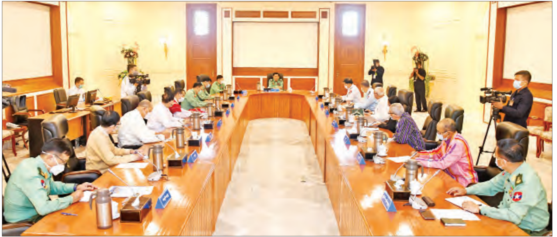
နိုင်ငံတော်စီမံအုပ်ချုပ်ရေးကောင်စီဥက္ကဋ္ဌ၊ တပ်မတော်ကာကွယ်ရေးဦးစီးချုပ် ဗိုလ်ချုပ်မှူးကြီးမင်းအောင်လှိုင် နိုင်ငံတော်စီမံအုပ်ချုပ်ရေးကောင်စီအဖွဲ့ဝင်များအားတွေ့ဆုံပြီး နိုင်ငံရေး၊ စီးပွားရေး၊ လူမှုရေး၊ အုပ်ချုပ်ရေး၊ ငြိမ်းချမ်းရေး၊ တရားဥပဒေစိုးမိုးရေးတို့နှင့်စပ်လျဉ်း၍ ရှင်းလင်းပြောကြားစဉ်။

နိုင်ငံရေး၊ စီးပွားရေး၊ လူမှုရေး၊ အုပ်ချုပ်ရေး၊ ငြိမ်းချမ်းရေး၊ တရားဥပဒေစိုးမိုးရေးတို့နှင့်စပ်လျဉ်း၍ ရှင်းလင်းပြောကြား