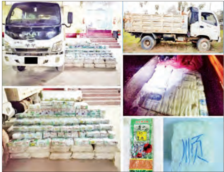
သိမ်းဆည်းရမိသည့် အိုက်စ်(မက်သ်အဖက်တမင်း)များကို တွေ့ရစဉ်။

ရပ်တန့်ထားကြောင်း သတင်းရရှိသဖြင့် သွားရောက်စစ်ဆေးရာ DUMP TRUCK အမျိုးအစား SKAT ယာဉ်ပေါ်မှ ငွေကျပ် ၂၁ ဒသမ ၅ ဘီလီယံ တန်ဖိုးရှိ အိုက်စ်(မက်သ်အဖက်တမင်း) ၁၀၇၅ ကီလို သိမ်းဆည်းရမိခဲ့သဖြင့် မူးယစ်ဆေးဝါးနှင့် စိတ်ကိုပြောင်းလဲစေသော ဆေးဝါးများဆိုင်ရာ ဥပဒေအရ အမှုဖွင့်အရေးယူထားရှိပြီး တရားခံများ ဖော်ထုတ်ဖမ်းဆီးရမိရေး ဆောင်ရွက်လျက်ရှိကြောင်း သိရသည်။ သတင်းစဉ်