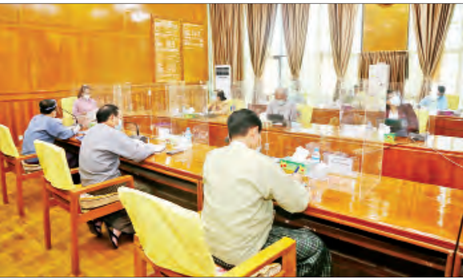
ဝန်ကြီးဌာနအချင်းချင်း အပြန်အလှန် ပူးပေါင်းညှိနှိုင်း ဆောင်ရွက်ကြရမည်ဖြစ်ပါကြောင်း၊ ဝန်ကြီးဌာနအနေဖြင့် ပြည်သူ့လူထုအတွက် လုပ်ငန်းများဆောင်ရွက်ရာတွင် လုပ်ငန်းများတွင် တွေ့ကြုံရသည့် အခက်အခဲ ပြဿနာများကို ဖြေရှင်းနိုင်ရန် အရေးကြီးပါကြောင်း၊

နေပြည်တော် ဖေဖော်ဝါရီ ၈ လူမှုဝန်ထမ်း၊ ကယ်ဆယ်ရေးနှင့် ပြန်လည်နေရာချထားရေး ဝန်ကြီးဌာန ပြည်ထောင်စုဝန်ကြီး ဒေါက်တာသက်သက်ခိုင် သည် ယနေ့မနန်းလွဲ ၂ နာရီတွင် အဆိုပါဝန်ကြီးဌာနရှိ အရာထမ်းများ၊ အမှုထမ်းများ၊ နေပြည်တော်ကောင်စီ နယ်မြေအပါအဝင် တိုင်းဒေသကြီး/ပြည်နယ် ဦးစီးမှူးရုံး များ၊ ဌာနများ၊ ဂေဟာများ၊ မူးယစ်ဆေးဖြတ်ပြီးသူများ ပြန်လည်ထူထောင်ရေးစခန်းများနှင့် သဘာဝဘေးအန္တရာယ် စီမံခန့်ခွဲမှုသင်တန်းကျောင်းတို့ရှိ အရာထမ်းများ၊ အမှုထမ်း များအား Zoom Meeting ဖြင့် တွေ့ဆုံသည်။