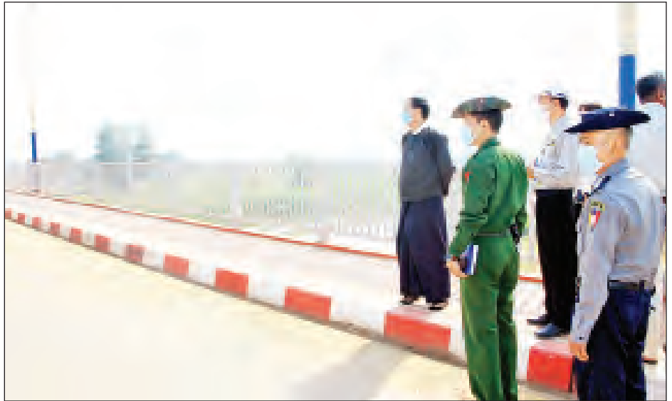
သည် အရှည်ပေ ၂၀၀၊ အကျယ် ၂၄ ပေရှိ ဘိုးပိုင်အုတ်မြစ် ရက်က စတင်တည်ဆောက်နေခြင်းဖြစ်ကာ ယခုအခါ ၃၀ ရာခိုင်နှုန်း ပြီးစီးနေပြီဖြစ်သည်။ တင်စိုး(ပဲခူး)

ပဲခူးမြစ်ကူးတံတား(မြို့ဦးကင်း)သည် ရာနန်းပြည့် ပြီးစီးသွားပြီဖြစ်ရာ မဂ္ဂတစ်လမ်းပေါ်ရှိ ကျုံးကူးတံတား