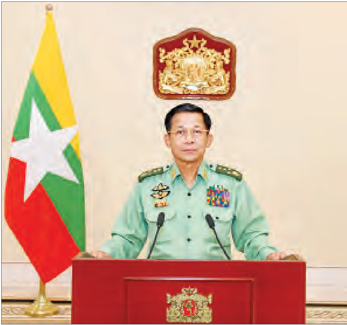
ပြည်ထောင်စုသမ္မတမြန်မာနိုင်ငံတော်၊ နိုင်ငံတော်စီမံအုပ်ချုပ်ရေးကောင်စီဥက္ကဋ္ဌ ဗိုလ်ချုပ်မှူးကြီးမင်းအောင်လှိုင် ပြည်သူလူထုသို့ မိန့်ခွန်းပြောကြားစဉ်။

ပါတီစုံဒီမိုကရေစီစနစ်မှာ တရား မျှတပြီး လွတ်လပ်တဲ့ရွေးကောက်ပွဲများဟာ ဒီမိုကရေစီစနစ် ရေရှည်တည်တံ့ခိုင်မာစေ ရေးအတွက် အဓိကလိုအပ်ချက်ပဲဖြစ်ပါ တယ်။ ဒါ့ကြောင့် ကျွန်တော်အနေနဲ့ တစ်တိုင်းပြည်လုံးသို့ ပြောကြားခဲ့တဲ့ ၂၀၂၀ ပြည့်နှစ် နှစ်သစ်ကူးမိန့်ခွန်းမှာ “၂၀၂၀ ပြည့်နှစ်ဟာ နိုင်ငံအတွက် အရေးကြီးတဲ့နှစ် ဖြစ်ကြောင်း၊ ရွေးကောက်ပွဲပြုလုပ်မယ့် နှစ်ဖြစ်လို့ ပါတီစုံဒီမိုကရေစီစနစ်ခိုင်မာစေ ဖို့အရေးကြီးကြောင်း” ထည့်သွင်းပြောကြား ခဲ့ပါတယ်။ လွတ်လပ်ပြီး တရားမျှတတဲ့ ရွေးကောက်ပွဲများဖြစ်စေရေး၊ နိုင်ငံရေး ဆောင်ရွက်ရာမှာ အမျိုးသားအကျိုးစီးပွားကို အလေးထားပြီး ရိုးသားစွာဆောင်ရွက်ကြစေ ရေးအတွက် ၂၀၁၈ ခုနှစ်၊ အောက်တိုဘာလ ၁၅ ရက်နေ့မှာ ပြုလုပ်ခဲ့တဲ့ တစ်နိုင်ငံလုံး ပစ်ခတ်တိုက်ခိုက်မှုရပ်စဲရေး သဘောတူ စာချုပ်(NCA)ချုပ်ဆိုခြင်း ၃ နှစ်ပြည့် အခမ်း အနားမှာ “တိုင်းရင်းသားအရေး၊ အမျိုးသား အကျိုးစီးပွားအရေးထက် ပိုအရေးကြီးတာ