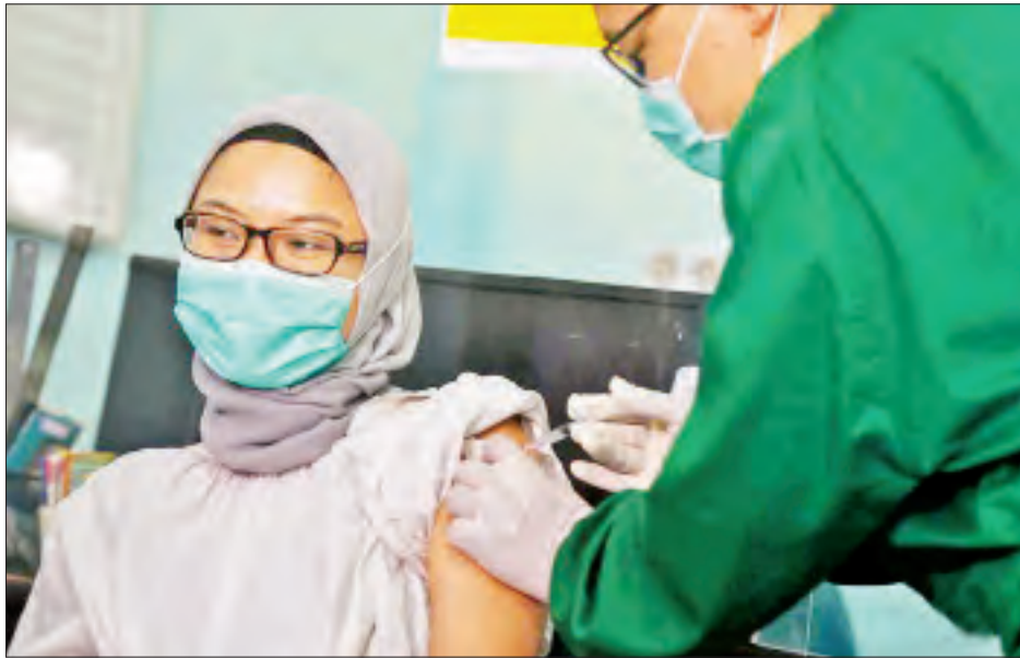
ရောဂါ ကာကွယ်ဆေးထိုးနှံပေးရန် စီစဉ်ထားသည်။ အင်ဒိုနီးရှားအစိုးရသည် ဇန်နဝါရီ ၁၄ ရက်မှစ၍ နိုင်ငံ အတွင်း ကိုဗစ်-၁၉ ရောဂါ ကာကွယ်ဆေးထိုးနှံမှု ဆောင်ရွက်ခဲ့ပြီး ကျန်းမာရေးဝန်ထမ်းများကို ပထမ

အင်ဒိုနီးရှားကျန်းမာရေးဝန်ကြီးဌာနသည် ယခုလ ကုန်မှစ၍ အခြားဦးစားပေးအုပ်စုမှ ပြည်သူများအား ကိုဗစ်-၁၉ ရောဂါ ကာကွယ်ဆေးထိုးနှံပေးရန် စီစဉ် ထားပြီး ယင်းအစီအစဉ်မတိုင်မီ နိုင်ငံအတွင်းရှိ ကျန်းမာရေးဝန်ထမ်း ၁ ဒသမ ၅ သန်းခန့်ကို ကိုဗစ်-၁၉