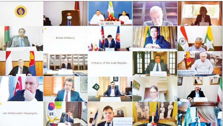
နိုင်ငံခြားရေးဝန်ကြီးဌာန ပြည်ထောင်စုဝန်ကြီး ဦးဝဏ္ဏမောင်လွင်နှင့် အပြည်ပြည်ဆိုင်ရာပူးပေါင်းဆောင်ရွက်ရေးဝန်ကြီးဌာန ပြည်ထောင်စုဝန်ကြီး ဦးကိုကိုလှိုင်တို့က မြန်မာနိုင်ငံ၌ လက်ရှိဖြစ်ပေါ်လျက်ရှိသော အခြေအနေများနှင့်ပတ်သက်၍ မြန်မာနိုင်ငံအခြေစိုက် ပြည်ပသံရုံးများမှ သံအမတ်ကြီးများ၊ သံတမန်များနှင့် ကုလသမဂ္ဂ လက်အောက်ခံအဖွဲ့အစည်းများမှ အကြီးအကဲများအား ဗီဒီယိုကွန်ဖရင့်စနစ်ဖြင့် ရှင်းလင်းပြောကြားစဉ်။