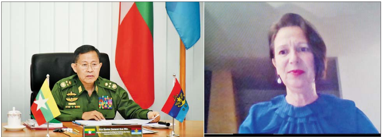
နိုင်ငံတော်စီမံအုပ်ချုပ်ရေးကောင်စီ ဒုတိယဥက္ကဋ္ဌ၊ ဒုတိယတပ်မတော်ကာကွယ်ရေးဦးစီးချုပ် ကာကွယ်ရေးဦးစီးချုပ်(ကြည်း)၊ ဒုတိယဗိုလ်ချုပ်မှူးကြီး စိုးဝင်း ကုလသမဂ္ဂအထွေထွေအတွင်းရေးမှူးချုပ်၏ မြန်မာနိုင်ငံဆိုင်ရာ အထူးကိုယ်စားလှယ် Ms.Christine Schraner Burgener အား Video Conferencing ဖြင့် တွေ့ဆုံဆွေးနွေးစဉ်။

နေပြည်တော် ဖေဖော်ဝါရီ ၅ နိုင်ငံတော်စီမံအုပ်ချုပ်ရေးကောင်စီ ဒုတိယဥက္ကဋ္ဌ၊ ဒုတိယတပ်မတော်ကာကွယ်ရေးဦးစီးချုပ် ကာကွယ်ရေးဦးစီးချုပ်(ကြည်း)၊ ဒုတိယဗိုလ်ချုပ်မှူးကြီး စိုးဝင်းသည် ကုလသမဂ္ဂအထွေထွေ အတွင်းရေးမှူးချုပ်၏ မြန်မာနိုင်ငံဆိုင်ရာ အထူးကိုယ်စားလှယ် Ms.Christine Schraner Burgener အား Video Conferencing ဖြင့် တွေ့ဆုံဆွေးနွေးသည်။