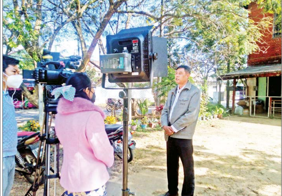
မြန်မာ့အသံနှင့် ရုပ်မြင်သံကြားမှ အသံလွှင့်ရုံနှင့်ပတ်သက်၍ စာရေးသူအား မေးမြန်းစဉ်။

ရန်ကုန်အသံလွှင့်ရုံကို မေမြို့သို့ ပြောင်းရွှေ့ဖွင့်လှစ်ထုတ်လွှင့်ရာ၌ အဓိကအကြောင်းရင်းများစွာ ရှိခဲ့လေရာ အင်္ဂလိပ်ဘုရင်ခံနှင့်တကွ အစိုးရအဖွဲ့တစ်ခုလုံး မေမြို့သို့ ရောက်ရှိ ရုံးစိုက်နေခြင်း၊ မေမြို့သည် စစ်ဘေးရန်မှ ကင်းလွတ်နေသေးခြင်းနှင့် အသံလွှင့်ရန်အတွက် အဆောက်အအုံအဖြစ် အရေးပေါ်အသံလွှင့်ရုံ တည်ဆောက် ပြီးစီးနေခြင်းတို့သည် အခြေခံအကျဆုံး အချက်များပင်ဖြစ်။