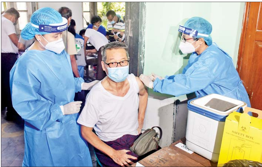
ရန်ကုန်တိုင်းဒေသကြီး၌ အသက် ၆၅ နှစ်အထက် သက်ကြီးအမျိုးသားတစ်ဦးအား ကာကွယ်ဆေးထိုးနှံပေးစဉ်။

နေပြည်တော်၌ ပြည်ထောင်စုအဆင့် အဖွဲ့အစည်းဝင်များနှင့် အရာထမ်းများအား ကာကွယ်ဆေး စတင်ထိုးနှံပေးစဉ်။