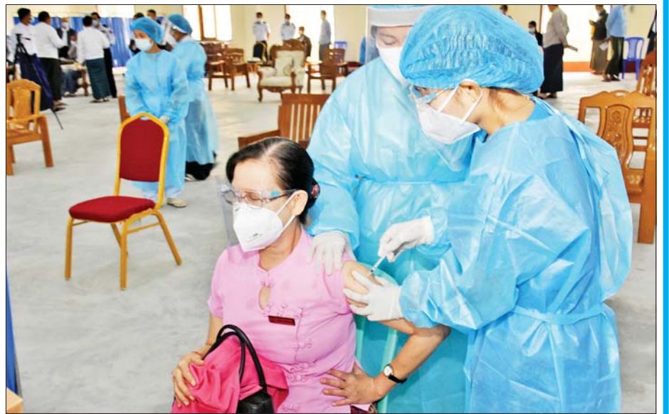
ရန်ကုန်တိုင်းဒေသကြီး၌ အသက် ၆၅ နှစ်အထက် သက်ကြီးအမျိုးသမီးတစ်ဦးအား ကာကွယ်ဆေးထိုးနှံပေးစဉ်။