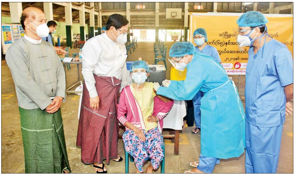
ဝန်ထမ်းများနှင့် ကိုဗစ်-၁၉ ရောဂါကုသရေးစင်တာများတွင် ၂၅၀၀၀ ခန့်ကို ကာကွယ်ဆေးထိုးနှံပေးခဲ့ကြောင်း သိရ တာဝန်ထမ်းဆောင်နေသည့် စေတနာ့ဝန်ထမ်း စုစုပေါင်း သည်။ သတင်း-မင်းသစ်(MNA)

ကနဦးအနေဖြင့် ဇန်နဝါရီ ၂၇ ရက်က ကိုဗစ်ကာကွယ်ဆေးကို ရန်ကုန်တိုင်းဒေသကြီးအတွင်း ကျန်းမာရေး