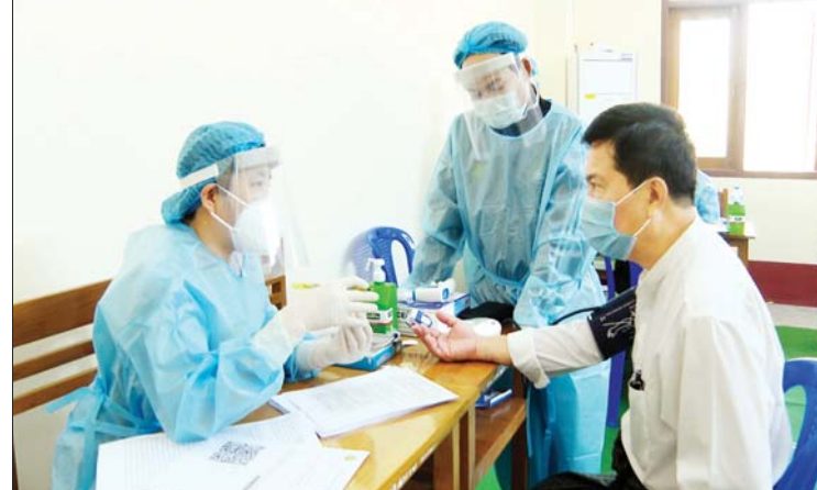
စီးပွားရေးနှင့် ကူးသန်းရောင်းဝယ်ရေးဝန်ကြီးဌာန ပြည်ထောင်စုဝန်ကြီး ဒေါက်တာ ပွင့်ဆန်း ကိုဗစ်-၁၉ ကာကွယ်ဆေးထိုးနှံမှုခံယူစဉ်။