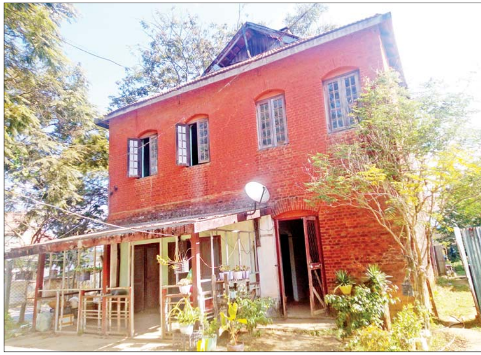
မေမြို့၌ အသံလွှင့်ခဲ့သည့် အသံလွှင့်ရုံအဆောက်အအုံ။

“ပြန်ကြားပေးရန်၊ ပညာပေးရန်၊ ဖျော်ဖြေပေးရန်”ဟူသော ဆောင်ပုဒ်များဖြင့် မြန်မာပြည်သူ့ ပြည်သားများအား အကျိုးပြုပေးနေသည့် မြန်မာ့အသံသည် ၂၀၂၁ ခုနှစ် ဖေဖော်ဝါရီလ ၁၅ ရက်နေ့တွင် (၇၅) နှစ်ပြည့်ပြီဖြစ်၍ စိန်ရတုပွဲတော်ကြီးကို ဆင်နွှဲကျင်းပတော့မည် ဖြစ်ပေသည်။ ဤကဲ့သို့ စိန်ရတုတိုင်သည်အထိ လျှောက်လှမ်းခဲ့ရသော မြန်မာ့အသံ၏ ခရီးလမ်းများသည် ဖြောင့်ဖြူးသာယာလှပသော ပန်းခင်းလမ်းများဖြင့်သာ ရင်ဆိုင်ကြုံတွေ့ခဲ့ရပြီး ချောမွေ့ခဲ့ရသည်မဟုတ်ဘဲ ဆူးခင်းလမ်းများကို လျှောက်လှမ်းရသကဲ့သို့ အဆင်မပြေမှုများ၊ အခက်အခဲများ၊ ဘေးအန္တရာယ်များကိုလည်း ဖြတ်သန်းကျော်လွှားခဲ့ရသေးသည်။ မည်သို့ပင်ဖြစ်စေ မလျှော့သော စွမ်းအား၊ စိန်ခွေမှုများဖြင့် မဆုတ်မနစ် အားတင်းဆောင်ရွက်လျှောက်လှမ်းခဲ့သည့် မြန်မာ့အသံကို ချီးကျူးဂုဏ်ပြုကြရမည် ဖြစ်ပေသည်။