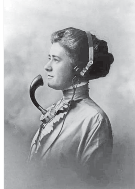
ရှေးက အသံလွှင့်နေသည့် အမျိုးသမီးဝန်ထမ်းတစ်ဦး။