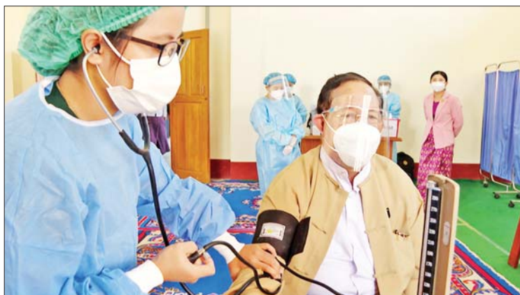
ပြည်ထောင်စုတရားသူကြီးချုပ် ဦးထွန်းထွန်းဦး ကိုဗစ်-၁၉ ကာကွယ်ဆေးထိုးနှံမှု ခံယူစဉ်။

ကာကွယ်ဆေးလာရောက်ထိုးနှံသူ လူမှု ဝန်ထမ်းဦးစီးဌာနမှ ဒုတိယညွှန်ကြားရေး