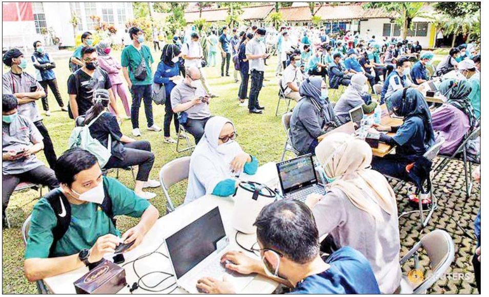
အင်ဒိုနီးရှားရှိ ကျန်းမာရေးဝန်ထမ်းများ Sinovac ကာကွယ်ဆေးမထိုးနှံမီ ကျန်းမာရေးစစ်ဆေးခြင်းနှင့် မှတ်ပုံတင်ခြင်း ဆောင်ရွက်မှုကို ဘန်ဒေါင်းဆေးရုံတွင် တွေ့ရစဉ်။

ရေးနှင့် ကိုဗစ်-၁၉ ရောဂါဆိုင်ရာ စည်းမျဉ်းများကို ထုတ်ပြန်ထားသော်လည်း ယင်းသို့ ကူးစက်မှုနှင့် သေဆုံးမှု နှုန်းများ မြင့်တက်မှုဖြစ်ပေါ်နေခြင်းသည် သတင်းအချက် အလက် ဖြန့်ချိရေးစနစ်နှင့် ပညာပေးလှုံ့ဆော်မှုအစီအစဉ် နှစ်ရပ်လုံး၏ အားနည်းချက်ကြောင့် ဖြစ်သည်ဟူသော စွပ်စွဲချက်များရှိနေသည်။