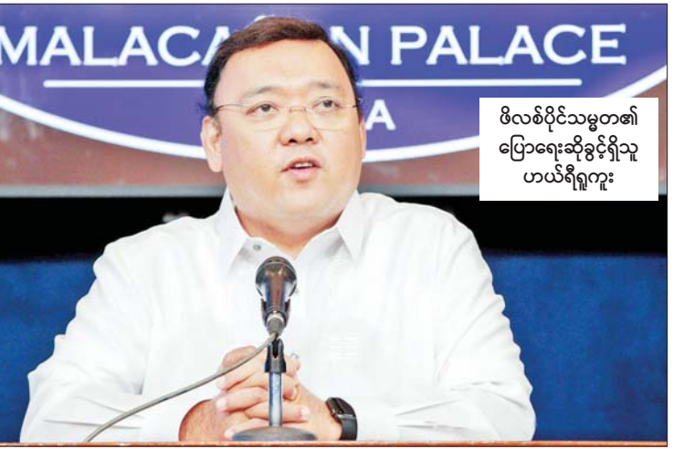
ဖိလစ်ပိုင်သမ္မတ၏ ပြောရေးဆိုခွင့်ရှိသူ ဟယ်ရီဂူကူး

စောင့်ကြည့်ရန် သတ်မှတ်ထားသော ဟိုတယ် များတွင် တည်းခိုရန် ကြိုတင်စာရင်းသွင်း ထားရမည်ဖြစ်ပြီး နိုင်ငံအတွင်း ရောက်ရှိသည့် နေ့မှစတင်ပြီး ခြောက်ရက်အတွင်း ကိုဗစ်-၁၉ ရောဂါရှိ မရှိ စစ်ဆေးခြင်းကို ခံယူရမည်ဖြစ် သည်။