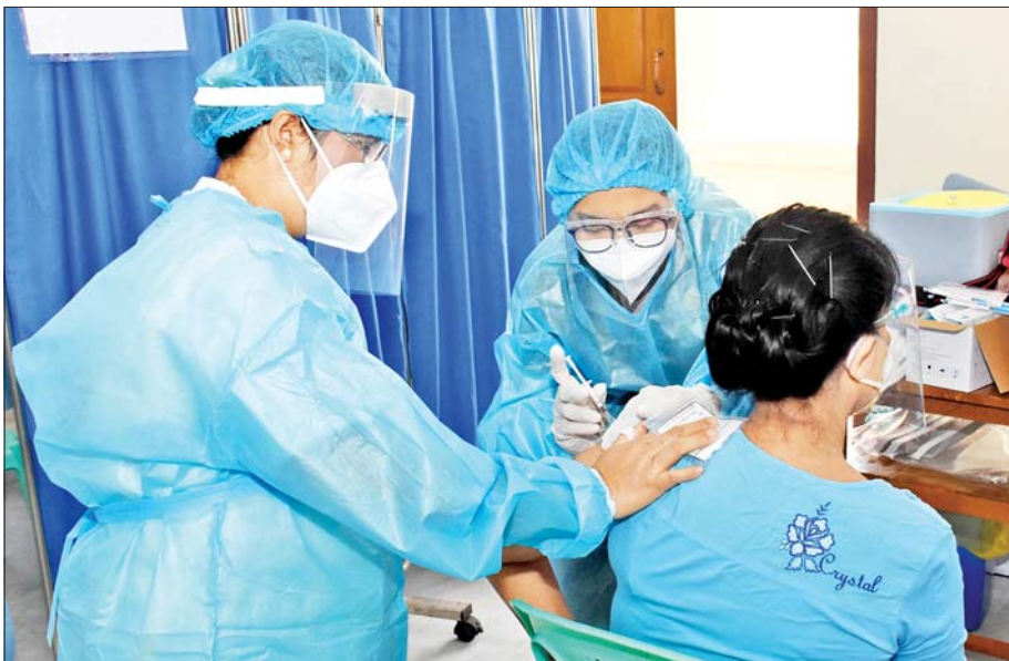
ရန်ကုန်တိုင်းဒေသကြီး၌ အသက် ၆၅ နှစ်အထက် သက်ကြီးအမျိုးသမီးတစ်ဦးအား ကာကွယ်ဆေးထိုးနှံပေးစဉ်။