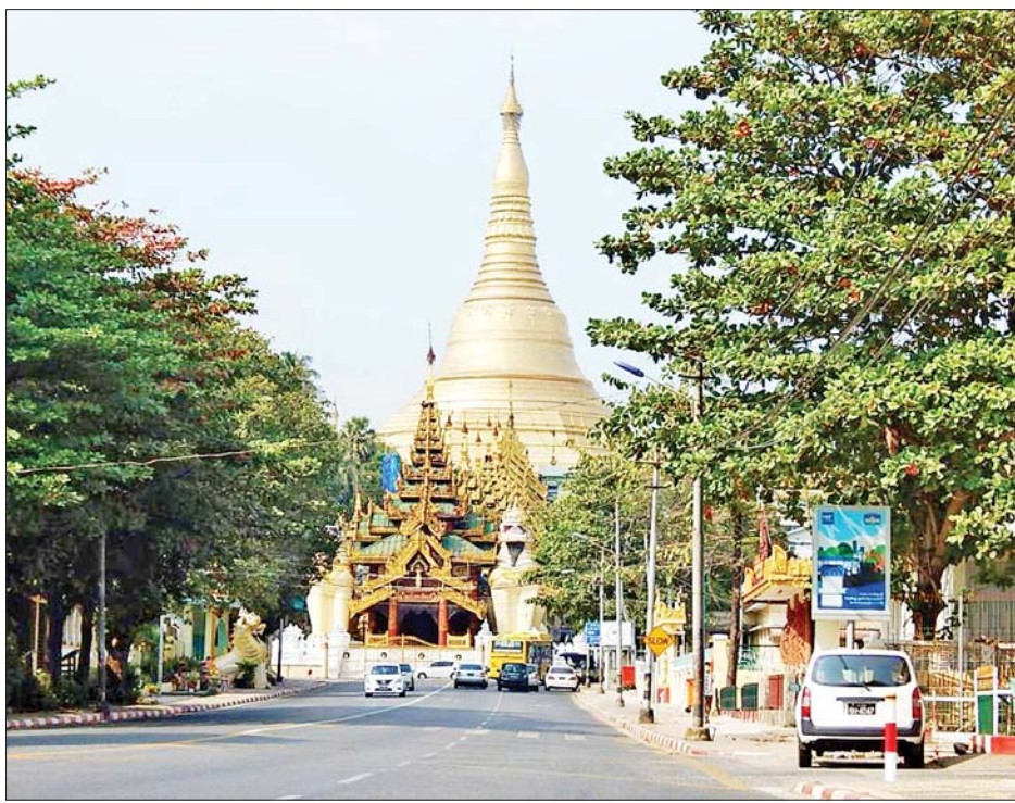
ရွှေတိဂုံစေတီတော်မြတ်ကြီးအား ဖူးတွေ့ရစဉ်။

ရန်ကုန် ဖေဖော်ဝါရီ ၅ တိုင်းဒေသကြီးနှင့် ပြည်နယ်အသီးသီးရှိ ဘုရား၊ ပုထိုး၊ စေတီများအား ကိုဗစ်-၁၉ စည်းမျဉ်း၊ စည်းကမ်းများနှင့်အညီ ဖေဖော်ဝါရီ ၈ ရက်မှစတင်၍ ဖွင့်လှစ်တော့မည်ဖြစ်ရာ ရွှေတိဂုံစေတီတော်မြတ်ကြီး၌ လာရောက်လည်ပတ်ဖူးမြော်ကြမည့် နိုင်ငံခြားသားခရီးသွားဧည့်သည်များအား ရဟန်းရှင်လူ ဘုရားဖူးပြည်သူများနည်းတူ ဖေဖော်ဝါရီ ၁၁ ရက် နံနက် ၆ နာရီမှစတင်၍ ဝင်ရောက်ဖူးမြော်ကြည်ညိုခွင့် ပြုသွားမည်ဖြစ်ကြောင်း သာသနာရေးဦးစီးဌာနမှ သိရသည်။