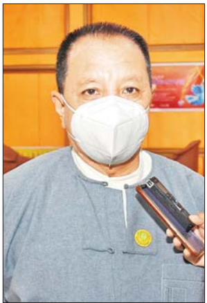
ဒုတိယညွှန်ကြားရေးမှူးချုပ် ဒေါက်တာ မြတ်ဝဏ္ဏစိုး

ယနေ့တွင် ပြည်ထောင်စုအဆင့်အဖွဲ့အစည်းဝင်များနှင့် ဝန်ကြီးဌာန ၁၁ ခုမှ အရာထမ်း စုစုပေါင်း ၄၉၁ ဦးအား ကာကွယ်ဆေးစတင်ထိုးနှံပေးခြင်း ဖြစ်ပြီး ကျန်ရှိသည့်ဝန်ကြီးဌာနများမှ ဝန်ထမ်းများကိုလည်း ဆက်လက်ထိုးနှံပေးသွားမည်ဖြစ်ကြောင်း သိရသည်။ သတင်း - ရဲမျိုး