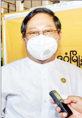
ဒေါက်တာထွန်းမြင့်

ဒေါက်တာထွန်းမြင့် ဒုတိယညွှန်ကြားရေးမှူးချုပ်၊ ရန်ကုန်တိုင်းဒေသကြီး ပြည်သူ့ကျန်းမာရေးနှင့် ကုသရေးဦးစီးဌာနမှူး ကိုဗစ်-၁၉ ကာကွယ်ဆေးထိုး လုပ်ငန်းတွေကို ပုံမှန်အစီအစဉ်အတိုင်း သွားနေပါတယ်။ သက်ကြီးရွယ်အိုတွေကို ကာကွယ်ဆေးထိုးပေးဖို့ ကနဦးက စိုးရိမ်မှုရှိခဲ့ပါတယ်။ ပထမဆုံး ကျန်းမာရေးဝန်ထမ်းတွေကို ကာကွယ်ဆေးထိုးတဲ့ အခြေအနေတွေကို စောင့်ကြည့်တဲ့အခါကျတော့ အသက်ကြီးလေးဒီကာကွယ်ဆေးက အန္တရာယ်ကင်းလေဖြစ်တာကို ပိုပြီးတွေ့ရတယ်။ ကာကွယ်ဆေးထိုးပြီး ငယ်ရွယ်တဲ့သူတွေက ပိုပြီးများကြတယ်။ တချို့လည်း အဆစ်ကိုက်တာ၊ နှာစေးသွားတာလေးတွေရှိတယ်။ ဒါပေမယ့် အသက်ကြီးတဲ့သူတွေမှာ မဖြစ်တာများတယ်။ တချို့ဆို ကာကွယ်ဆေးထိုးပြီး ဆေးရဲ့သက်ရောက်မှုက ဘာမှ မရှိတာကို တွေ့နေရတယ်။ အသက်ကြီးတဲ့သူတွေမှာ အလွန်အန္တရာယ်ကင်းတယ်ဆိုတာကို မျက်မြင်အခြေအနေတွေမှာ တွေ့ရတယ်။ အသက် ၆၅ နှစ် အထက်တွေအနေနဲ့လည်း ကာကွယ်ဆေး ထိုးနှံသင့်တယ်လို့ အကြံပြုပြောကြားလိုပါတယ်။