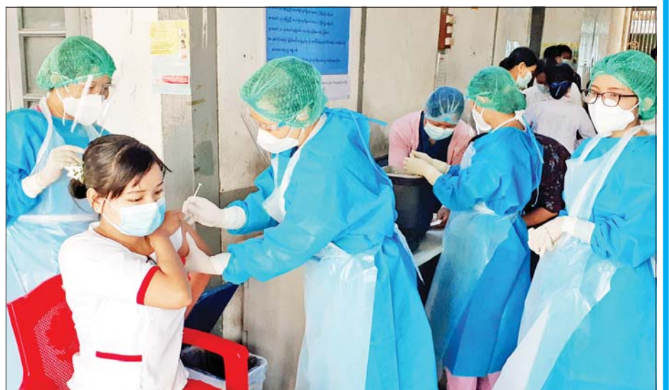
မြန်အောင်ပြည်သူ့ဆေးရုံ၌ ကျန်းမာရေးဝန်ထမ်းတစ်ဦးအား ကာကွယ်ဆေးထိုးနှံပေးစဉ်။