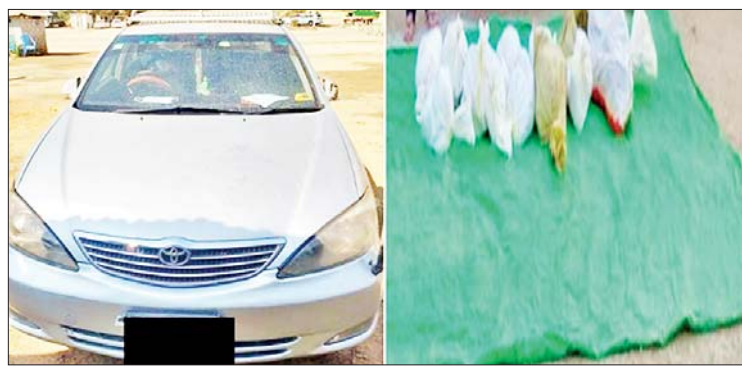
တရားဝင်စာရွက်စာတမ်း အထောက်အထား တစ်စုံတစ်ရာ တင်ပြနိုင်ခြင်းမရှိသော ကျောက်စိမ်းဟု ယူဆရသော ကျောက်တုံးများဆိုင်စုံနှင့် ပစ္စည်းသယ်ဆောင်လာသော ယာဉ်တစ်စီးအား တွေ့ရစဉ်။

နေပြည်တော် ဖေဖော်ဝါရီ ၅ တရားမဝင်ကုန်စည်များ တားဆီးထိန်းချုပ်ရေးအတွက် ရေပူနှင့် မရမ်းချောင် အမြဲတမ်း စစ်ဆေးရေးစခန်းတို့အား ဌာနဆိုင်ရာပူးပေါင်းအဖွဲ့များဖြင့် ၂၀၁၇ ခုနှစ် မတ် ၁ ရက်တွင် စတင် ဖွင့်လှစ်ဆောင်ရွက်ခဲ့ပြီး ၂၀၂၁ ခုနှစ် ဖေဖော်ဝါရီ ၄ ရက်တွင် မန္တလေး-မူဆယ် ပြည်ထောင်စု လမ်းမကြီးတစ်လျှောက် ကုန်သွယ်မှုယာဉ် ပို့ကုန် ၃၇၁ စီး၊ သွင်းကုန် ၄၈၉ စီး၊ ရန်ကုန်- မြဝတီလမ်းမကြီးတစ်လျှောက် ကုန်သွယ်မှုယာဉ် သွင်းကုန် ၂၂၆ စီး ကုန်စည်များ သယ်ယူ ပို့ဆောင်လျက်ရှိသည်။ အဆိုပါစစ်ဆေးရေးစခန်းများက တင်သွင်း၊ တင်ပို့သော ကုန်ပစ္စည်းများအား စစ်ဆေးမှု များပြုလုပ် ဆောင်ရွက်လျက်ရှိရာ ၂၀၂၁ ခုနှစ် ဖေဖော်ဝါရီ ၄ ရက်တွင် ရေပူအမြဲတမ်း စစ်ဆေးရေးစခန်းက တားဆီးမှု နှစ်ခု (ခန့်မှန်းတန်ဖိုး ကျပ်သန်း ၁၅ ဒသမ ၇၅၀)ရှိ တရားဝင် စာရွက်စာတမ်းအထောက်အထား တစ်စုံတစ်ရာ တင်ပြနိုင်ခြင်းမရှိသော ကျောက်စိမ်းဟု ယူဆရသော ကျောက်တုံးများဆိုင်စုံ ၂၂၅ ကီလိုဂရမ်နှင့် ပစ္စည်းသယ်ဆောင်လာသောယာဉ် တစ်စီး ဖမ်းဆီးရမိခဲ့ကြောင်း သိရသည်။ သတင်းစဉ်