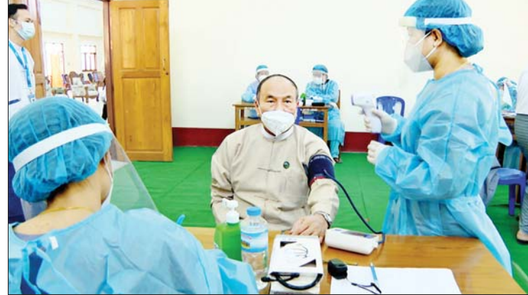
ပြန်ကြားရေးဝန်ကြီးဌာန ပြည်ထောင်စုဝန်ကြီး ဦးချစ်နိုင် ကိုဗစ်-၁၉ ကာကွယ်ဆေး ထိုးနှံမှုခံယူစဉ်။