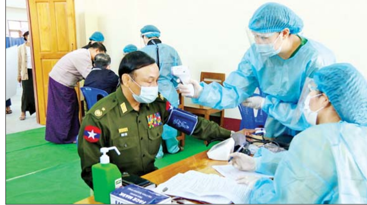
နိုင်ငံတော်စီမံအုပ်ချုပ်ရေးကောင်စီအုပ်ချုပ်မှုမှူး ဒုတိယဝန်ကြီး ဗိုလ်ချုပ်စိုးတင်နိုင် ကိုဗစ်-၁၉ ကာကွယ်ဆေးထိုးနှံမှုခံယူစဉ်။

အင်အားဝန်ကြီးဌာနမှ ညွှန်ကြားရေးမှူး ဦးသိန်းရွှေဝင်းက “ကာကွယ်ဆေးထိုးဖို့ ဒီကို ရောက်တော့ ကျန်းမာရေးဝန်ထမ်းတွေက သွေးပေါင်ချိန်တယ်။ သွေးတွင်း အောက်ဆီဂျင် တိုင်းတယ်။ ဆေးမထိုးခင် ဘာရောဂါဖြစ်ဖူးလဲ၊ ဓာတ်မတည့်တဲ့ ဆေးတွေရှိသလား၊ ဆီးချို သွေးချိုရှိသလား၊ ကျန်းမာရေးအရ နေ့စဉ် သောက်နေရတဲ့ ဆေးတွေရှိသလား စတာတွေ မေးမြန်းထားတဲ့စာရွက်ကို ဖြည့်စွက်ရတယ်။ စာမျက်နှာ ၉ သို့ ၀