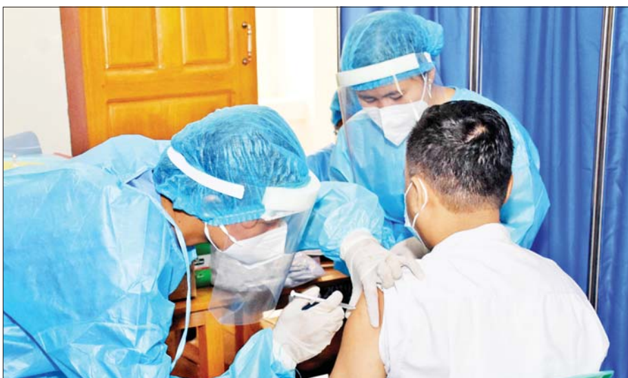
ရန်ကုန်တိုင်းဒေသကြီး၌ အသက် ၆၅ နှစ်အထက် သက်ကြီးအမျိုးသားတစ်ဦးအား ကာကွယ်ဆေးထိုးနှံပေးစဉ်။