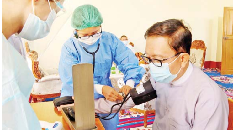
စီမံကိန်း၊ ဘဏ္ဍာရေးနှင့် စက်မှုဝန်ကြီးဌာန ပြည်ထောင်စုဝန်ကြီး ဦးဝင်းရှိန် ကိုဗစ်-၁၉ ကာကွယ်ဆေးထိုးနှံမှုခံယူစဉ်။