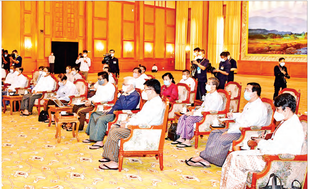
နိုင်ငံတော်စီမံအုပ်ချုပ်ရေးကောင်စီဥက္ကဋ္ဌ၊ တပ်မတော်ကာကွယ်ရေးဦးစီးချုပ် ဗိုလ်ချုပ်မှူးကြီး မင်းအောင်လှိုင် မြန်မာနိုင်ငံဘဏ်များအသင်း နာယက၊ ဥက္ကဋ္ဌနှင့် တာဝန်ရှိသူများ၊ ပုဂ္ဂလိကဘဏ်များမှ ဥက္ကဋ္ဌများ၊ ဒုတိယဥက္ကဋ္ဌများ၊ တာဝန်ရှိသူများနှင့် တွေ့ဆုံဆွေးနွေးစဉ်။

နေပြည်တော် ဖေဖော်ဝါရီ ၄ နိုင်ငံတော်စီမံအုပ်ချုပ်ရေးကောင်စီဥက္ကဋ္ဌ၊ တပ်မတော်ကာကွယ်ရေးဦးစီးချုပ် ဗိုလ်ချုပ်မှူးကြီး မင်းအောင်လှိုင်သည် ယနေ့နံနက်ပိုင်းတွင် နေပြည်တော်ရှိ နိုင်ငံတော်သမ္မတအိမ်တော် ငူရွှေဝါခန်းမ၌ မြန်မာနိုင်ငံဘဏ်များအသင်း နာယက၊ ဥက္ကဋ္ဌနှင့် တာဝန်ရှိသူများ၊ ပုဂ္ဂလိကဘဏ်များမှ ဥက္ကဋ္ဌများ၊ ဒုတိယ ဥက္ကဋ္ဌများ၊ တာဝန်ရှိသူများနှင့် တွေ့ဆုံသည်။ တက်ရောက် တွေ့ဆုံပွဲသို့ နိုင်ငံတော်စီမံအုပ်ချုပ်ရေးကောင်စီဥက္ကဋ္ဌ တပ်မတော် ကာကွယ်ရေးဦးစီးချုပ်နှင့်အတူ ဒုတိယဥက္ကဋ္ဌ ဒုတိယတပ်မတော်ကာကွယ်ရေး