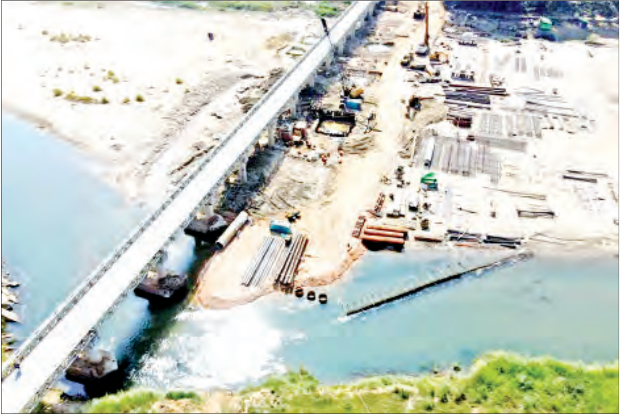
လမ်းမှတစ်ဆင့် သံတွဲမြို့အထိ သွားရောက်နိုင်မည်ဖြစ်ရာ ဒေသခံများအတွက် လူမှုစီးပွားဘဝဖွံ့ဖြိုးတိုးတက်လာမည်ဖြစ်ကြောင်း၊ တံတားသစ်တည်ဆောက်ရန် အတွက် ၂၀၂၀ ပြည့်နှစ် နိုဝင်ဘာ ၁ ရက်က စီမံကိန်းလုပ်ငန်းများ စတင်ခဲ့ခြင်း

သရက်မြို့မှ ယခုတံတားကိုဖြတ်၍ ရန်ကုန် - ပြည် - တောင်ကုတ်