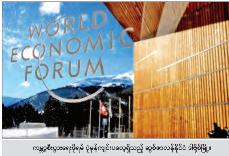
ကမ္ဘာ့စီးပွားရေးဖိုရမ် ပုံမှန်ကျင်းပလေ့ရှိသည့် ဆွစ်ဇာလန်နိုင်ငံ ဒါဗိုစ်မြို့။