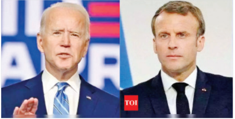
အမေရိကန်သမ္မတ ဂျိုးဘိုင်ဒင်နှင့် ပြင်သစ်သမ္မတ မက်ခရူန့်။

ကိုးကား- အင်န်အိတ်ချ်ကေ၊ ဘာသာပြန်-အလင်းသစ်