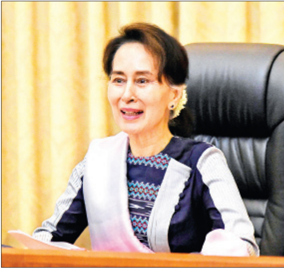
( Coronavirus Disease 2019 (COVID-19) ကာကွယ်၊ ထိန်းချုပ်၊ ကုသရေး အမျိုးသားအဆင့် ဗဟိုကော်မတီဥက္ကဋ္ဌ၊ နိုင်ငံတော်၏အတိုင်ပင်ခံပုဂ္ဂိုလ် ဒေါ်အောင်ဆန်းစုကြည် ၂၁-၁-၂၀၂၁ ရက်နေ့တွင် ကိုဗစ်-၁၉ ရောဂါဖြစ်ပွားမှု နောက်ဆုံးအခြေအနေနှင့် စပ်လျဉ်း၍ ပြည်သူများသို့ အစီရင်ခံတင်ပြသည့် မိန့်ခွန်းမှ ကောက်နုတ်ချက်)

ကျွန်မတို့ ဒီကာကွယ်ဆေးအတွက် ရန်ပုံငွေထူထောင်လိုက်တယ် ဆိုတာလည်း ကျွန်မတို့ ပြည်သူတွေ သိမှာပါပဲ။ ထုံးစံအတိုင်းပါပဲ။ ကျွန်မတို့ ပြည်သူတွေက တကယ်ပဲအရေးကြီးပြီဆိုရင် သွေးစည်းကြပါတယ်။ အားလုံးကနေပြီးတော့ ဝိုင်းဝန်းပြီးတော့ ထည့်ကြပါတယ်။ ပထမဦးဆုံးတော့ နိုင်ငံတော်ကနေပြီးတော့ ကျပ် ၁ ဘီလီယံပေါ့။ သန်းတစ်ထောင်ကို ထည့်လိုက်ပါတယ်။ မတည်လိုက်ပါတယ်။ ဒီရန်ပုံငွေကို အခုအလှူရှင်တွေက စေတနာရှင်တွေနဲ့ ဝိုင်းပြီးတော့ ထည့်တာဟာ ၁၈ ဒသမ ၇၈၁ ဘီလီယံ ဖြစ်ပါတယ်။ ကျွန်မတို့ပြည်သူတွေ ဘယ်လောက်ရက်ရောလဲဆိုတာ အဲဒါကို မြင်နိုင်ပါတယ်။ ဒါကတော့ ကျပ်ငွေပေါ့။ နောက်ပြီးတော့ အမေရိကန်ဒေါ်လာနဲ့ဆိုရင် ကျွန်မတို့ နိုင်ငံတော်ကနေပြီးတော့ သန်း ၂၅၀ ပုံပိုလိုက်ပါတယ်။ အဲဒါတော့ ဝိုင်းဝန်းပြီးတော့ ပြည်သူတွေက ထည့်တဲ့ဟာကလည်း ရှိပါသေးတယ်။ အဲဒါတော့ ကျွန်မတို့ အခြေအနေက ကောင်းတယ်လို့ ကျွန်မပြောနိုင်ပါတယ်။ ဝိုင်းဝန်းပြီးတော့ ပြည်သူတွေကထည့်တာ ကျွန်မထင်တာကတော့ ၂ ဒသမ ၉၇ သန်းကျော်ပါတယ်။ ဒါကတော့ အမေရိကန်ဒေါ်လာနဲ့ပေါ့။ ဒါကျွန်မတို့ အလှူရှင်တွေ ဝိုင်းဝန်းပြီးတော့ ထည့်တာပါ။ ဒီငွေတွေကို ကျွန်မတို့ကနေပြီးတော့ ထိုက်ထိုက်တန်တန်နဲ့ ပြည်သူလူထုရဲ့ ကျန်းမာရေးကာကွယ်ဖို့အတွက် ပြည်သူလူထုကို ကိုဗစ်-၁၉ ကာကွယ်ရေး ဆေးထိုးပေးနိုင်ဖို့အတွက် သုံးသွားမှာပါ။ ဘာမှလည်း အစိတ်အစင် မဖြစ်စေရပါဘူး။ ပြည်သူတွေအနေနဲ့လည်း ဒီလိုဝိုင်းဝန်းပြီးတော့ ကူညီမစတဲ့ အတွက် ကျွန်မတို့အင်မတန်မှ ကျေးဇူးတင်တယ်လို့လည်း ပြောချင်ပါတယ်။