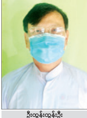
ဦးထွန်းထွန်းဦး