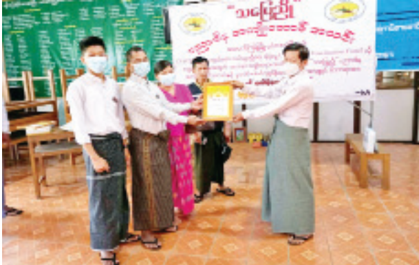
ကိုဗစ်-၁၉ ကာကွယ်ဆေးဝယ်ယူရန် နိုင်ငံတော်သို့ အလှူငွေများ လှူဒါန်း

ရန်ကင်း ဇန်နဝါရီ ၂၅ - နိုင်ငံတော်၏ ကိုဗစ်-၁၉ ရောဂါ ကာကွယ်ဆေး ဝယ်ယူရေးအတွက် အသုံးပြု နိုင်ရန် ရန်ကင်းမြောက်ပိုင်းခရိုင် မင်္ဂလာဒုံမြို့နယ် ထောက်ကြံ့မြို့၊ သပြေညို ပညာဒါနအကျိုးဆောင်အသင်းဥက္ကဋ္ဌ၊ အမှုဆောင်အဖွဲ့များက ငွေကျပ် သိန်း ၈၀၊ မင်္ဂလာဒုံမြို့နယ် ထောက်ကြံ့မြို့နေ စေတနာရှင် အလှူရှင် ပြည်သူများ စုပေါင်း၍ ပထမအကြိမ် ငွေကျပ် ၁၀၂ သိန်း စုစုပေါင်းငွေကျပ် ၁၅၂ သိန်းကို ပထမအကြိမ် လှူဒါန်းခြင်းနှင့် ထောက်ကြံ့မြို့နေ စေတနာရှင် အလှူရှင်ပြည်သူ များက စုပေါင်း၍ ဒုတိယအကြိမ် ငွေကျပ် ၂၈ သိန်း လှူဒါန်းပွဲ အခမ်းအနားကို ဇန်နဝါရီ ၂၄ ရက် နံနက် ၉ နာရီခွဲတွင် ထောက်ကြံ့မြို့ရှိ သပြေညိုပညာဒါန အကျိုးဆောင်အသင်းရုံးခန်းမ၌ ကျင်းပသည်။