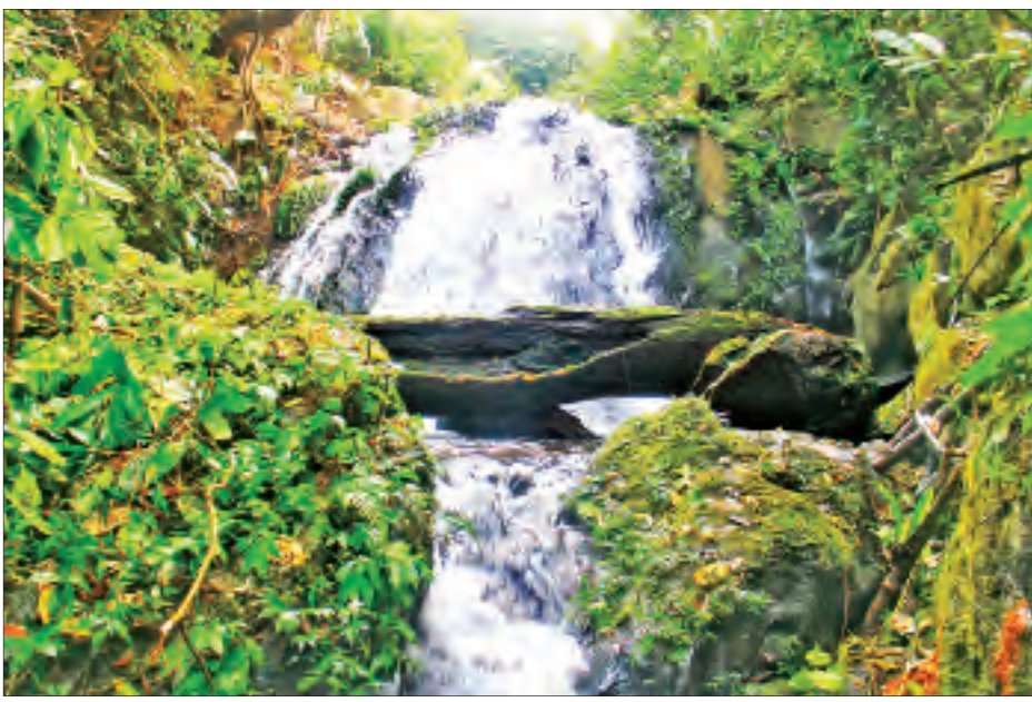
ပေါများပြီး ရေစီးအားကောင်းကာ တောင်ကျစမ်းချောင်းတစ်လျှောက် ပြတ်ရွေ့ကျောက်တုံးကြီးများနှင့် ဆွဲဆောင်မှုရှိပြီး ပထမတွေ့ရှိရမည့် ရေတံခွန်မှာ ရေပြင်ကျယ်ပြန့်၍ ပေးပေးနိုင်ရန် အနက် သုံးပေခန့်နှင့် အကျယ် ၁၀ ပေ ပတ်လည်ခန့် ရေအိုင်ရှိသည်။

ကချင်ပြည်နယ် မိုးကောင်းမြို့အား ခရီးစဉ်ဒေသသစ်အဖြစ် ဖော်ဆောင် လျက်ရှိရာ ခရီးသွားပြည်သူများ လာရောက်လည်ပတ်နိုင်ရန် ဇန်နဝါရီ ၂၀ ရက်က ထီးချိုင့်ကျေးရွာအနီးရှိ လွဲပုတ်ရွာဟောင်းရေတံခွန်အား ခုတ်ထွင်ရှင်းလင်း ဖော်ဆောင်ထား ကြောင်း သိရသည်။