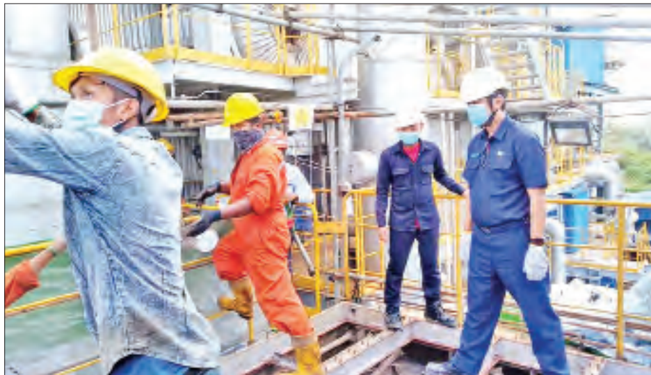
တစ်ရက်လျှင် လျှပ်စစ်ဓာတ်အား ၇၆၀ ကီလိုဝပ်ကို နေ့စဉ်ပုံမှန်ထုတ်လုပ်ပေးနေသည့် အမှိုက်မှစွမ်းအင်ထုတ်စက်ရုံ(ရန်ကုန်)-Yangon Waste to Energy Plant အား တွေ့ရစဉ်။

ရန်ကုန် ဇန်နဝါရီ ၂၁ မြန်မာနိုင်ငံ၌ ပထမဦးဆုံး အမှိုက်မှစွမ်းအင်ထုတ်စက်ရုံ (ရန်ကုန်) - Yangon Waste to Energy Plant ကို သဘာဝပတ်ဝန်းကျင် ထိခိုက်မှုအနည်းဆုံးပညာဖြင့် အကောင်အထည်ဖော်တည်ဆောက်ထားရာ အဆိုပါ စက်ရုံ၌ စွန့်ပစ်အမှိုက်များမှ လျှပ်စစ်ဓာတ်အား ၇၆၀ ကီလိုဝပ်ကို နေ့စဉ်ပုံမှန်ထုတ်လုပ်ပေးလျက်ရှိကြောင်း ရန်ကုန်မြို့တော်စည်ပင်သာယာရေးကော်မတီမှ သိရသည်။