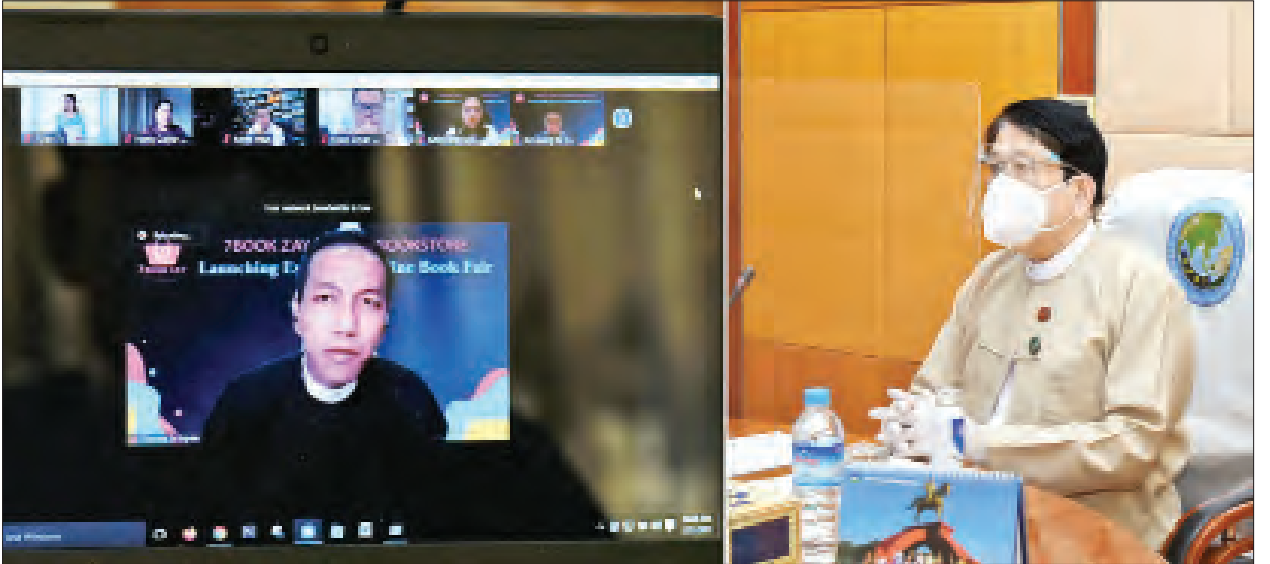
အစီအစဉ်တစ်ခုဖြစ်ပါကြောင်း။

ထို့အတူ စာပေဝေဖန်ရေးသမားများသည် စာပေတိုးတက်ရေးအတွက် များစွာ အထောက်အကူပြုပါကြောင်း၊ စာအုပ်စာပေနှင့်ပတ်သက်၍ မည်သည့် စာအုပ်က ကောင်းသည်၊ မည်သို့ဖြစ်သည်ကို ညွှန်းဆိုသည့် နှိုင်းယှဉ်သုံးသပ်ပြသည့် စာပေဝေဖန်ရေးသည်လည်း လိုအပ်ပါကြောင်း၊ အွန်လိုင်းစာအုပ်ရောင်းချရာတွင်လည်း ကျွမ်းကျင်သူတို့၏ ဝေဖန်သုံးသပ်ချက်များ၊ အညွှန်းများနှင့် ရောင်းချမှုများလည်း ရှိပါကြောင်း၊ စာပေ ဝေဖန်သုံးသပ်ချက်များ စုစည်းဖော်ပြပေးခြင်းသည် စာအုပ်ရောင်းချမှုအတွက် အထောက်အကူပြုသည်