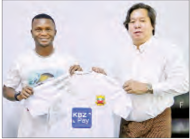
ရှမ်းယူနိုက်တက်အသင်း အသစ်ခေါ်ယူခဲ့သည့် နိုင်ငံတော်ရုံးယားတိုက်စစ်မှူး ဆာဆက်အား စာချုပ်ချုပ်ဆိုအပြီးတွေ့ရစဉ်။