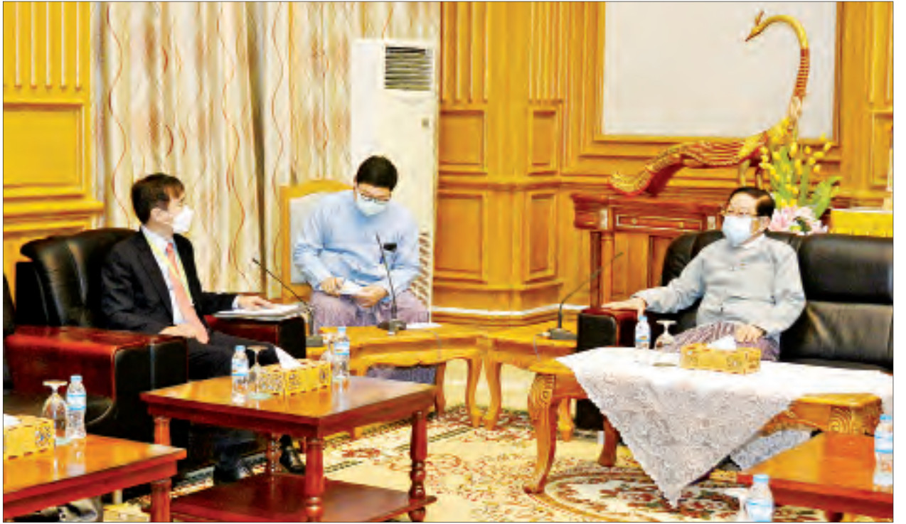
ပြည်သူ့လွှတ်တော်ဥက္ကဋ္ဌ ဦးတီခွန်မြတ် ကိုရီးယားသမ္မတနိုင်ငံ သံအမတ်ကြီး မစ္စတာ လီဆန်ဟွာအား လက်ခံတွေ့ဆုံစဉ်။