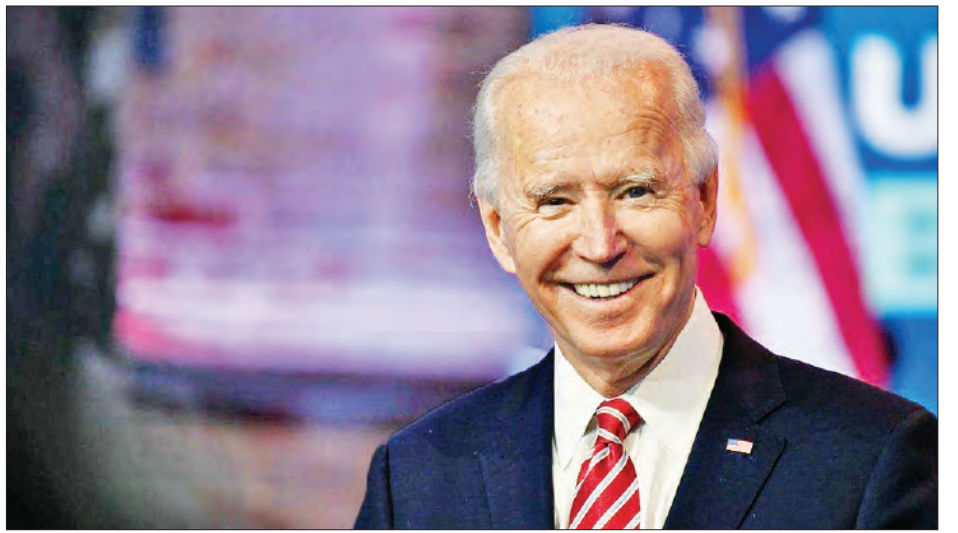
ထောက်ပံ့ပေးသည့် အစီအစဉ်တစ်ရပ် ဖြစ်လာမည် ဖြစ်သည်။ ဂျိုးဘိုင်ဒင်အဆိုပြုခဲ့သည့် ယခုငွေကြေးထောက်ပံ့ရေး အစီအစဉ်ကို ဥပဒေပြုလွှတ်တော်က အတည်ပြုမည်ဆိုပါက အမေရိကန်သမိုင်းတွင် ငွေကြေးပမာဏအများဆုံး ထောက်ပံ့ပေးသည့် အစီအစဉ်တစ်ရပ် ဖြစ်လာမည် ဖြစ်သည်။ ကိုးကား- အင်န်အိတ်ချ်ကော့ဘာသာပြန်- အောင်ကျော်ကျော်

နိုင်ငံအတွင်း ကူးစက်ပျံ့နှံ့လျက်ရှိသည့် ကိုဗစ်-၁၉ ရောဂါကို အမြစ်ပြတ်သုတ်သင်သွားမည်ဖြစ်ကြောင်း ဂျိုးဘိုင်ဒင်က ကတိပြုပြောကြားခဲ့သည်။ လက်ရှိအချိန် အထိ အဆိုပါရောဂါကြောင့် သေဆုံးသူ ၃၈၅၀၀၀ ကျော်ရှိပြီ ဖြစ်သည်။ ထို့ပြင် အဆိုပါအစီအစဉ်တွင် နိုင်ငံတစ်ဝန်း ကိုဗစ်-၁၉ ရောဂါ ရှိ မရှိ ရောဂါ စစ်ဆေးမှုများနှင့် ကာကွယ်ဆေး ထိုးနှံပေးရေးအစီအစဉ်များ တိုးမြှင့်လုပ်ဆောင်ခြင်းကို ပါဝင်မည်ဖြစ်သည်။ စာသင်ကျောင်းများ ပြန်လည် ဖွင့်လှစ်ရာတွင် ဗိုင်းရပ်စ်ကာကွယ်ရေး စည်းမျဉ်းများနှင့် ကိုက်ညီရန် ပြင်ဆင်မှုများ ဆောင်ရွက်ရမည်ဖြစ်သည့် အတွက် ပြန်လည်ပြင်ဆင်ရမည့် ကုန်ကျစရိတ်များ ကိုလည်း ပြည်နယ်နှင့် ဒေသန္တရအစိုးရအဖွဲ့များအား အဆိုပါ အစီအစဉ်အရ ထောက်ပံ့ပေးသွားမည် ဖြစ်သည်။ အမေရိကန်နိုင်ငံ၌ ဆောင်းရာသီကာလအတွင်း ဗိုင်းရပ်စ်ကူးစက်မှုများ မြင့်တက်လျက်ရှိစဉ် ဂျိုးဘိုင်ဒင်၏ ငွေကြေးထောက်ပံ့ရေးအစီအစဉ် ထွက်ပေါ်လာခဲ့ခြင်း ဖြစ်သည်။ နိုင်ငံအတွင်း၌ တစ်ရက်တာအတွင်း ဗိုင်းရပ်စ် ကူးစက်ခံရသူ ၂၀၀၀၀ ကျော်ရှိပြီး သေဆုံးသူ ၄၀၀၀ အထိ