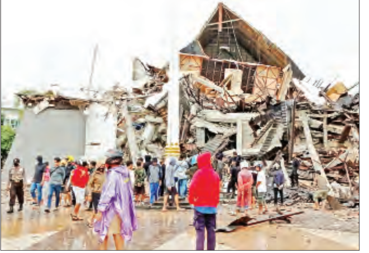
ကိုလိုမီတာကို ဗဟိုပြု၍ လှုပ်ခတ်ခဲ့ခြင်း ဖြစ်ကြောင်း သိရသည်။ အဆိုပါ အင်အားပြင်းထန်သော ငလျင်က ခုနစ်စက္ကန့်ခန့်ကြာအောင် လှုပ်ခတ်ခဲ့သော် လည်း ဆူလာဝေစီပေးချက် ထုတ်ပြန်ခဲ့ခြင်း မရှိပေ။ ကိုးကား- ဗီအင်န်အေ ဘာသာပြန်- ကျော်ထိုက်စိုး

ဂျကာတာ ဇန်နဝါရီ ၁၅ အင်ဒိုနီးရှားနိုင်ငံ ဆူလာဝေစီကျွန်း၌ ယနေ့ နံနက်အစောပိုင်းက အင်အားရစ်(ခွဲ)တာစကေး ၆ ဒသမ ၂ အဆင့်ရှိ အင်အားပြင်းထန်သော မြေငလျင်တစ်ခု လှုပ်ခတ်ခဲ့ရာ ၄၂ ဦး သေဆုံးခဲ့ပြီး ၆၀၀ ကျော် ဒဏ်ရာရရှိခဲ့သည်။ ငလျင်လှုပ်ခတ်မှုကြောင့် မာဂျီနီမြို့၌ လေးဦး သေဆုံးပြီး ၆၃၇ ဦး ဒဏ်ရာရရှိကာ အနီးအနားရှိ မာဂျီဂျီမြို့၌ သုံးဦး သေဆုံးပြီး ၂၄ ဦး ဒဏ်ရာရရှိခဲ့ကြောင်း အင်ဒိုနီးရှား ဘေးအန္တရာယ်လျှော့ချရေး အေဂျင်စီ၏ ကနဦးအချက်အလက်များအရ သိရသည်။ ယနေ့နံနက် တစ်နာရီခန့်က ငလျင် လှုပ်ခတ်ချိန်တွင် ထောင်နှင့်ချီသော ပြည်သူ များ နေအိမ်များမှ ထွက်ပြေးခဲ့ပြီး နေအိမ် အလုံး ၆၀ ထက်မနည်း ပျက်စီးခဲ့ကြောင်း အဆိုပါ အေဂျင်စီက ဆိုသည်။ ငလျင်က မာဂျီနီမြို့တော်၏ အရှေ့ မြောက်ဘက် မြောက်ကိုလိုမီတာ၌ အနက် ၁၀