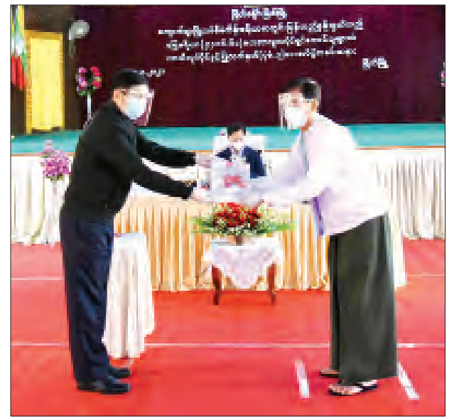
ဒုတိယဝန်ကြီး ဗိုလ်ချုပ်မြင့်နွယ် တောင်သူတစ်ဦးအား လယ်ယာမြေ ယာယီ လုပ်ပိုင်ခွင့်ပြုလက်မှတ်(ပုံစံ - ၃) ပေးအပ်စဉ်။

တန် ၃၀ အထိထွက်ရှိကြောင်း၊ ပစ္စန်းများကို ၇၂၀ နှစ်ခန့်နှင့် တရုတ်နိုင်ငံသို့ အဓိကထား တင်ပို့ရောင်းချကြောင်း၊ မွေးမြူရေးကန်တစ်ကန်လျှင် တစ်နှစ် ကာလအတွင်း (၃) ကြိမ်မွေးမြူ ထုတ်လုပ်နိုင်ကြောင်း သိရသည်။