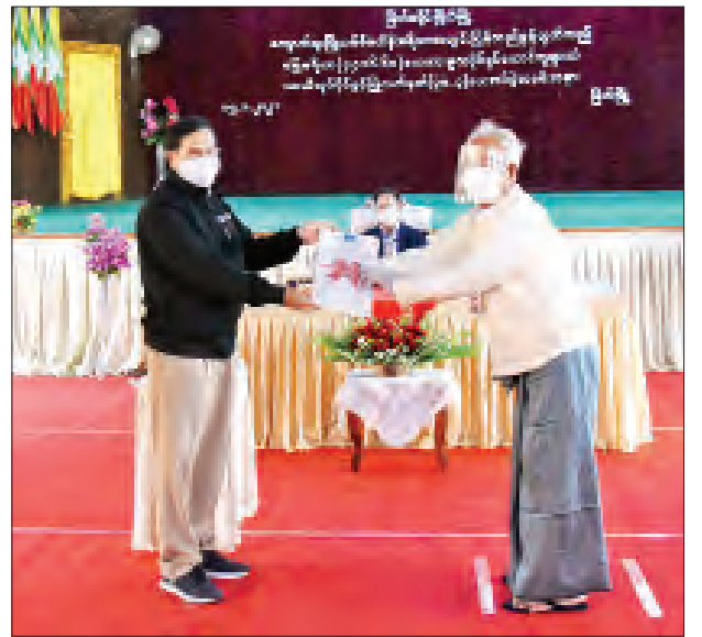
ဒုတိယဝန်ကြီး ဦးတင်မြင့် တောင်သူတစ်ဦးအား လယ်ယာမြေယာယီလုပ်ပိုင်ခွင့်ပြုလက်မှတ် (ပုံစံ-၃) ပေးအပ်စဉ်။

ဖြစ်သည့် လယ်ယာမြေများဖော်ထုတ်ရေးသည် အရေးပါသည့် အချက်တစ်ခုဖြစ်ပါကြောင်း၊ စီမံကိန်းအဖြစ်အသုံးပြုခြင်းမရှိသည့် လယ်ယာမြေများကို တောင်သူများလက်ဝယ်ပြန်လည်ပေးအပ်ခြင်းလုပ်ငန်းစဉ်အပြင် မြေလွတ်၊ မြေလပ်၊ မြေရိုင်းများကို ဖော်ထုတ်စေပြီး လုပ်ပိုင်ခွင့်လျှောက်ထားစေခြင်းဖြင့် သတ်မှတ်ကာလတွင် လယ်ယာမြေအဖြစ် ပိုင်ဆိုင်ခွင့်ရအောင်လည်း ဥပဒေနှင့်အညီ ဆောင်ရွက်ပေးလျက်ရှိပါကြောင်း။