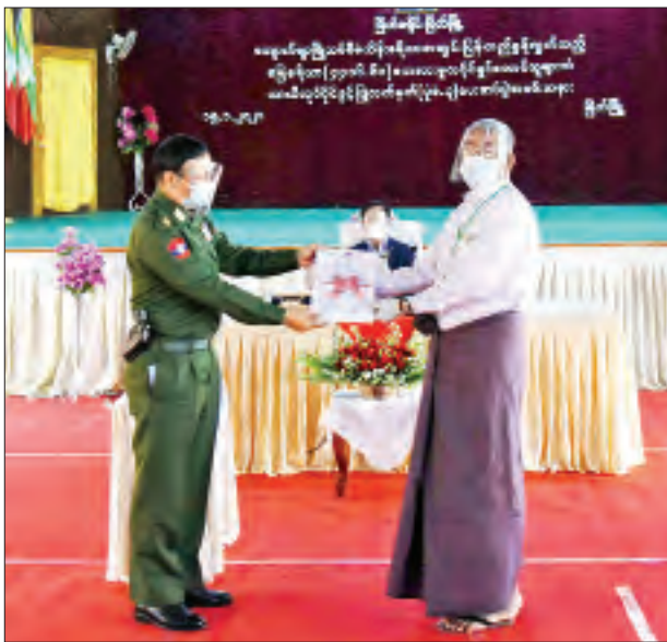
ဒုတိယဝန်ကြီး ဗိုလ်ချုပ်စိုးတင်နိုင် တောင်သူတစ်ဦးအား လယ်ယာမြေ ယာယီလုပ်ပိုင်ခွင့်ပြုလက်မှတ်(ပုံစံ - ၃) ပေးအပ်စဉ်။

အဆိုပါ စီမံကိန်းကို ၂၀၁၄ ခုနှစ် ဖေဖော်ဝါရီလတွင် စတင်ဆောင်ရွက်ခဲ့ ခြင်းဖြစ်ပြီး ၄၁၅ ဧက ကျယ်ဝန်းကာ လက်ရှိတွင်ပစ္စန်းမွေးမြူကန် ၆၁ ကန်ရှိပြီး ဖြစ်ကြောင်း၊ ရေငန်ပစ္စန်းမြို့ အမျိုးအစားကိုသာမွေးမြူပြီး မွေးမြူရေးကန် တစ်ကန်လျှင် ပစ္စန်းသားပေါက် ၁၂ သိန်းမှ ၁၅ သိန်းအထိ ထည့်သွင်းမွေးမြူ နိုင်ကြောင်း၊ မွေးမြူရေးကန်တစ်ကန်မှ တစ်ကြိမ်လျှင် ရေငန်ပစ္စန်း ၂၅ တန်မှ