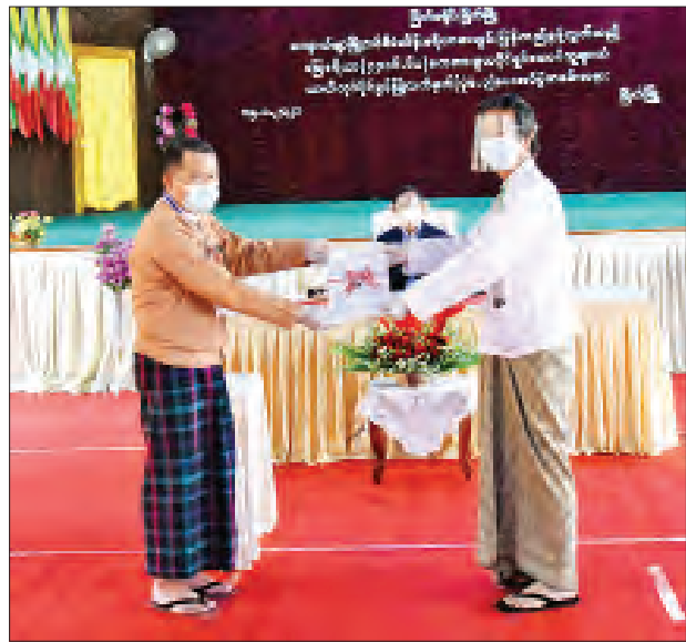
တနင်္သာရီတိုင်းဒေသကြီးဝန်ကြီးချုပ် ဦးမြင့်မောင် တောင်သူတစ်ဦးအား လယ်ယာမြေယာယီလုပ်ပိုင်ခွင့်ပြုလက်မှတ် (ပုံစံ-၃) ပေးအပ်စဉ်။