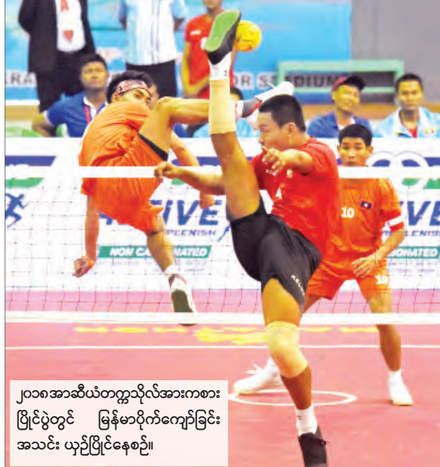
၂၀၁၈အာဆီယံတက္ကသိုလ်အားကစားပြိုင်ပွဲတွင် မြန်မာပိုက်ကျော်ခြင်းအသင်း ယှဉ်ပြိုင်နေစဉ်။

ရန်ကုန် ဇန်နဝါရီ ၁၅ ၂၀၂၁ ခုနှစ် ဇွန်လတွင် ထိုင်းနိုင်ငံက အိမ်ရှင်အဖြစ် လက်ခံကျင်းပမည့် အကြိမ်(၂၀)မြောက် အာဆီယံတက္ကသိုလ်အားကစားပြိုင်ပွဲ၌ မြန်မာအားကစားအဖွဲ့ ဝင်ရောက်ယှဉ်ပြိုင်မည်ဖြစ်သည်။