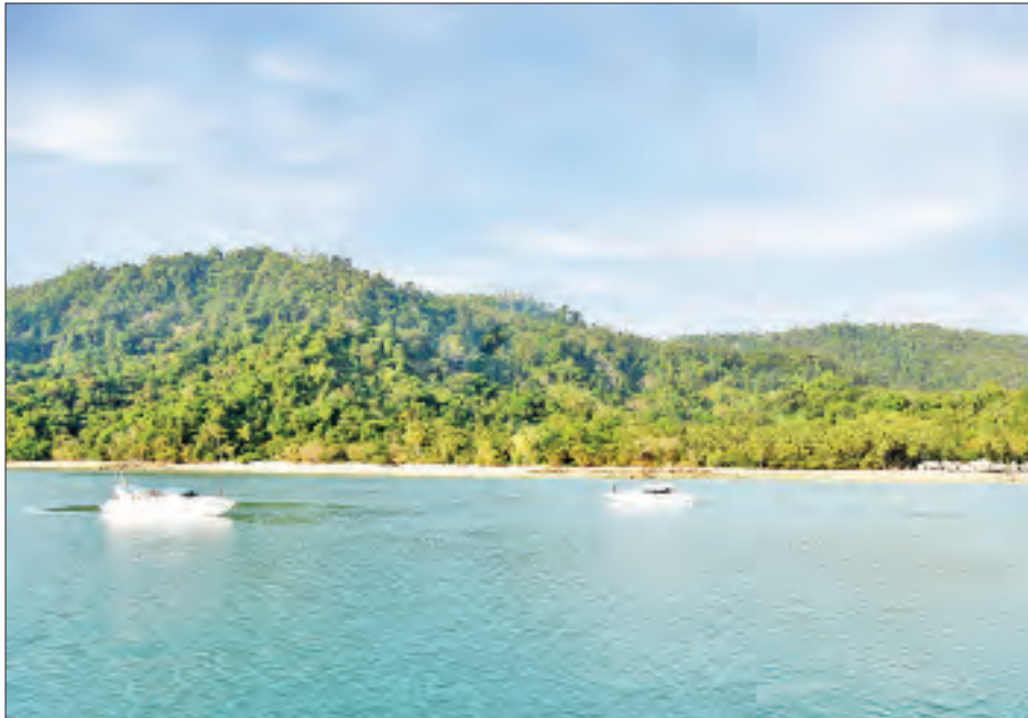
ဒုံးကျွန်းကို တွေ့ရစဉ်။