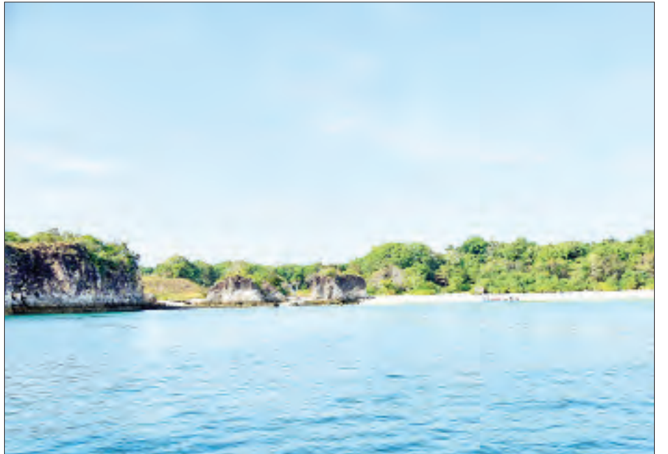
စမတ်ကျွန်းကို တွေ့ရစဉ်။