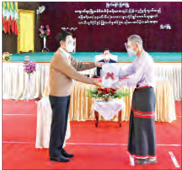
ပြည်ထောင်စုဝန်ကြီး ဒေါက်တာအောင်သူ တောင်သူတစ်ဦးအား လယ်ယာမြေယာယီလုပ်ပိုင်ခွင့်ပြုလက်မှတ် (ပုံစံ-၃) ပေးအပ်စဉ်။

ကြသည့် တနင်္သာရီတိုင်းဒေသကြီးအစိုးရအဖွဲ့နှင့် တာဝန်ရှိသူများကို ကျေးဇူးတင်အသိအမှတ်ပြုပါကြောင်း၊ လယ်ယာမြေများကို လက်ဝယ်ပြန်လည်ရရှိကြပြီဖြစ်ကြသည့် တောင်သူများအနေဖြင့်လည်း နိုင်ငံတော်၏ လုပ်ကိုင်ဆောင်ရွက်ပေးနေမှုများကို သိမြင်နားလည်ပြီး ယခင်ကထက် ပိုမိုကြိုးစားလုပ်ကိုင်ပေးကြရန်နှင့် တစ်ကိုယ်ရေ တစ်မိသားစု ဝမ်းဝပူလုံရေးမှတစ်ဆင့် နိုင်ငံစီးပွားတိုးတက်