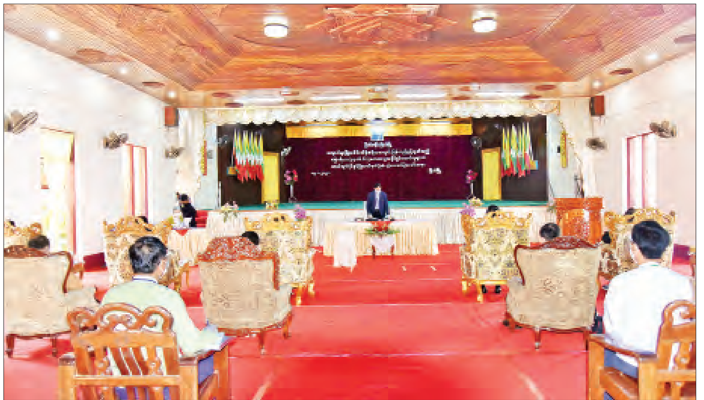
ဒုတိယသမ္မတ ဦးဟင်နရီဗန်ထီးယူ ခြိတ်မြို့နယ်အတွင်း ပြန်လည်စွန့်လွှတ်အပ်နှံသည့် လယ်ယာမြေများအား မူလတောင်သူများထံသို့ ယာယီလုပ်ပိုင်ခွင့်ပြုလက်မှတ် (ပုံစံ-၃) လှုံ့ပြောင်းပေးအပ်ခြင်းအခမ်းအနားတွင် အမှာစကားပြောကြားစဉ်။

ဆောင်ရွက်ပေးလျက်ရှိ မိမိတို့နိုင်ငံကို စက်မှုလယ်ယာအခြေခံသည့် နိုင်ငံတစ်ခုအဖြစ် တည်ဆောက်ရာတွင် အခြေခံအရင်းအမြစ်