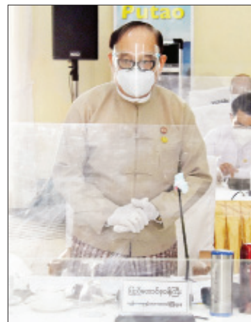
ပြည်ထောင်စုဝန်ကြီး ဒေါက်တာမြင့်ထွေးရှင်းလင်းတင်ပြစဉ်။

ကဲ့သို့ လူစည်ကားသော နေရာမဟုတ်သည့် နေရာများကို သွားလာရန်ပိုမိုလိုလား လာကြလိမ့်မည်ဟု ခန့်မှန်းထားသည့်အတွက် ဒေသဆိုင်ရာ ခရီးသွားလုပ်ငန်းကော်မတီများ၊ ခရီးစဉ်ဒေသ စီမံခန့်ခွဲမှုအဖွဲ့များအနေဖြင့် မြန်မာနိုင်ငံခရီးသွားလုပ်ငန်းကဏ္ဍ ပြန်လည်ထူထောင်ရေး မဟာဗျူဟာလမ်းပြမြေပုံနှင့်အညီ တိုင်းဒေသကြီးနှင့် ပြည်နယ်အလိုက် ဒေသဆိုင်ရာ ခရီးသွားလုပ်ငန်း မဟာဗျူဟာလမ်းပြမြေပုံများကို ပုဂ္ဂလိကခရီးသွားလုပ်ငန်းအဖွဲ့အစည်းများ ဒေသခံပြည်သူများနှင့် ပူးပေါင်း၍ မိမိတို့ဒေသအလိုက်၊ ဇုန်အလိုက် ရေးဆွဲတင်ပြသွားကြရန် လိုအပ်ပါကြောင်း။