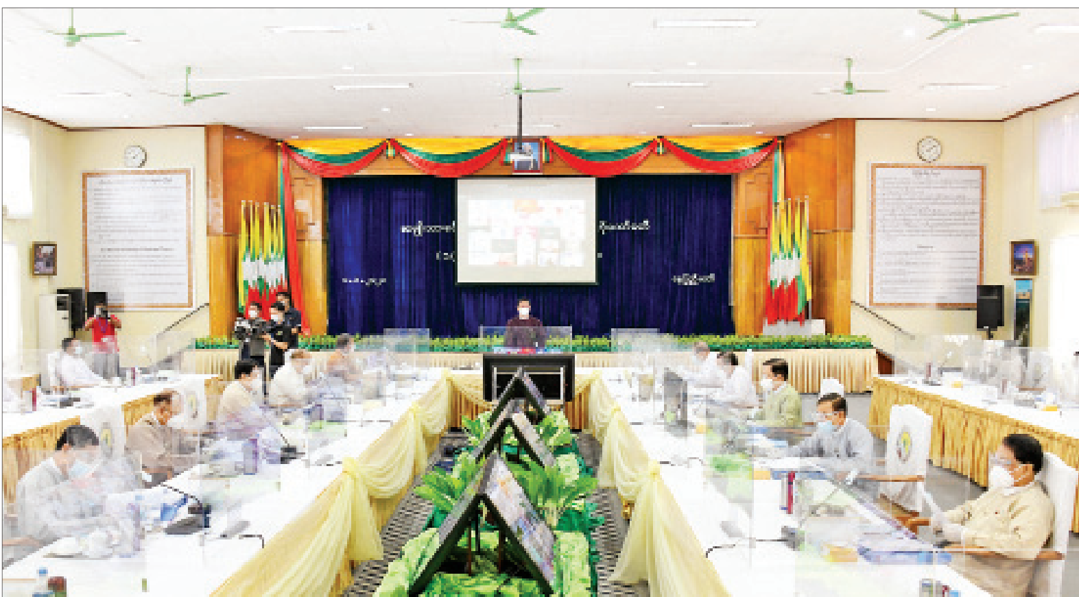
ဒုတိယသမ္မတ ဦးဟင်နရီဗန်ထီးယူ အမျိုးသားခရီးသွားလုပ်ငန်း ဖွံ့ဖြိုးတိုးတက်ရေးဗဟိုကော်မတီအစည်းအဝေး(၁/၂၀၂၁)တွင် အမှာစကားပြောကြားစဉ်။

နေပြည်တော် ဇန်နဝါရီ ၈ အမျိုးသားခရီးသွားလုပ်ငန်း ဖွံ့ဖြိုး တိုးတက်ရေးဗဟိုကော်မတီ(၁/၂၀၂၁) အစည်းအဝေးကို ယနေ့နံနက် ၉ နာရီ တွင် နေပြည်တော်ရှိ ဟိုတယ်နှင့် ခရီးသွားလာရေးဝန်ကြီးဌာန အစည်း အဝေးခန်းမ၌ ကျင်းပရာ အမျိုးသား ခရီးသွားလုပ်ငန်း ဖွံ့ဖြိုးတိုးတက်ရေး ဗဟိုကော်မတီဥက္ကဋ္ဌ ဒုတိယသမ္မတ ဦးဟင်နရီဗန်ထီးယူ တက်ရောက် အမှာစကားပြောကြားသည်။