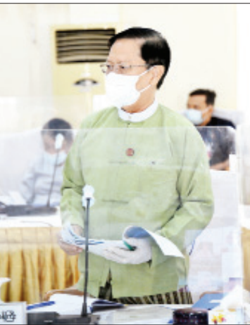
ပြည်ထောင်စုဝန်ကြီး သူရဦးအောင်ကို ရှင်းလင်းတင်ပြစဉ်။

ကိုဗစ်-၁၉ ကပ်ရောဂါကြောင့် ခရီးသွားများ၏ ရွေးချယ်မှုသည် ယခင်နှင့်မတူပြောင်းလဲသွားပြီး လူပြည်ကျပ်သော မြို့ပြဘဝခရီးသွားထက် Physical Distancing ဖြင့် နေထိုင်သွားလာခြင်းနှင့် Nature Tourism, Ethnic Tourism, Environmental Tourism