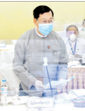
ပြည်ထောင်စုဝန်ကြီး ဦးသိန်းဆွေရှင်းလင်းတင်ပြစဉ်။