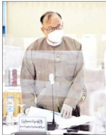
ပြည်ထောင်စုဝန်ကြီး ဦးသန့်စင်မောင်ရှင်းလင်းတင်ပြစဉ်။