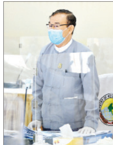
ပြည်ထောင်စုဝန်ကြီး ဦးအုန်းဝင်းရှင်းလင်းတင်ပြစဉ်။