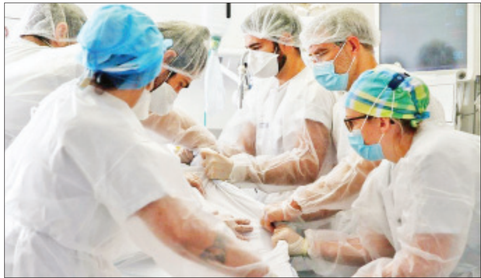
ပြင်သစ်နိုင်ငံတွင် ဇန်နဝါရီ ၇ ရက်က ကိုဗစ်-၁၉ ရောဂါကူးစက်ခံရသူတစ်ဦးကို အရေးပေါ်ကုသမှုဆောင်ရွက်ပေးနေစဉ်။

တို့သည် အသွားအလာလုံးဝထိန်းချုပ်မှုဖြင့် နေထိုင်ရလျက် ရှိသော်လည်း ယခုထက်ပိုမိုတင်းကျပ်သည့် အစီအမံများ ထပ်မံချမှတ်ရန် လိုအပ်ဆဲဖြစ်ကြောင်း ကလစ်က ဆိုသည်။