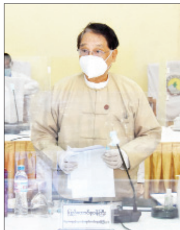
ပြည်ထောင်စုဝန်ကြီး ဒေါက်တာသန်းမြင့်ရှင်းလင်းတင်ပြစဉ်။