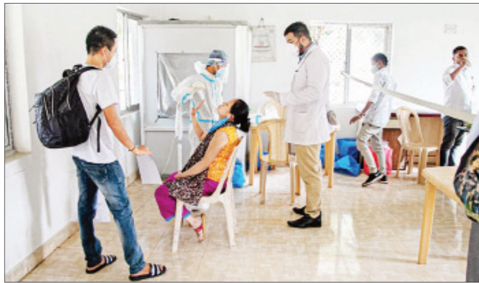
အိန္ဒိယနိုင်ငံတွင် ပြည်သူများအား ကိုဗစ်-၁၉ ရောဂါ ရှိ၊ မရှိ စမ်းသပ်စစ်ဆေးစဉ်။